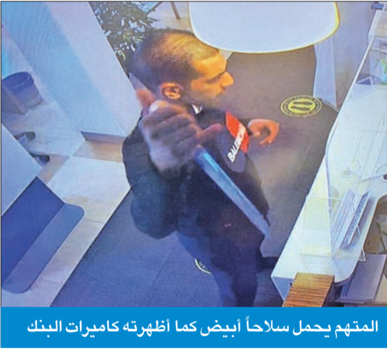
المتهم يحمل سلاحاً أبيض كما أظهرته كاميرات البنك

الإعتداء على موظف الأمن. وأضاف المصدر أن رجال المباحث تمكنوا من تحديد هوية اللص، وهو من غير محدد الجنسية، ومن أرباب السوابع في الأجرار وتعاطي المواد المخدرة، لافتاً إلى أن رجال المباحث تمكنوا من تحديد هوية صديق الجاني، الذي يعتقد أنه كان يتولى المراقبة الخارجية، وتم إلقاء القبض عليه داخل منزله، القريب جداً من فرع البنك، كما تم تعميم اسم وأوصاف الجاني لضبطه. وأفاد بأن رجال المباحث استمعوا لإفادة موظفي البنك الذين ذكروا أن الجاني دخل عليهم وهو يحمل سكيناً، وسدد طعنة على الفور إلى موظف الأمن، ومن ثم طلب من أحد الموظفين وضع ما بحوزته من مبالغ مالية في كيس، وبعد أن