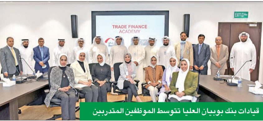
قيادات بنك بويان العليا تتوسط الموظفين المتدربين

لتعزيز مهارات كوادره بإدارة العمليات التجارية بالتعاون مع Euromoney