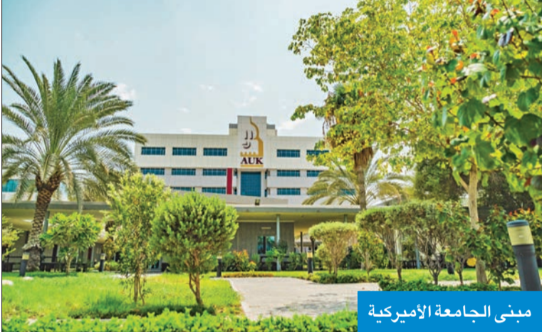
مبنى الجامعة الأميركية

الطلبة بالقائمة لإدارة الرابطة بعد النجاحات التي حققتها على مدار أعوام، مؤكداً أن رابطة الخليج أبوابها مفتوحة لجميع الطلبة لخدمتهم. وعقدت رابطة الخليج للعلوم والتكنولوجيا جميعتها