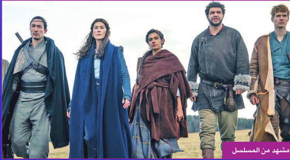
مشهد من المسلسل

الذي يمكنه استخدام السحر في العالم، ثم يسافر مع العديد من رفاقه الشباب الآخرين، إلى جانب Moiraine، في محاولة لإنقاذ البشرية. يذكر أن «The Wheel of Time» حصل بالفعل على الضوء الأخضر لموسم ثانٍ له، حتى قبل انطلاق الموسم الأول، كما ستحصل سلسلة الروايات هذه على ثلاثية أفلام يطلق عليها Age of Legends، والتي تجري أحداثها في حقبة مختلفة عن مسلسل Amazon، لكن من المخطط أن تكون «مكملة للقصص» التي يسردها المسلسل.