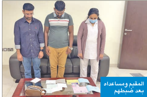
المقيم ومساعده بعد ضبطهم

موقعا وهماً للطبابة المنزلية. وأوضح أن رجال مباحث الإقامة عدوا كميناً عن طريق أحد المصادر السرية بعد استصدار إذن من النيابة العامة حيث تم الاتفاق مع الآسيوي لإرسال ممرضة لرعاية مواطنة كبيرة في السن، لافتاً إلى أنه عند حضور الممرضة والسائق الذي أوصلها تم ضبطهما من رجال المباحث. وذكر أن رجال المباحث بعد ضبط الممرضة تبين لهم أنها عاملة منزلية، وأن السائق يعمل بتوصيل الطلاب بمنطقة إشبيلية وأنه مطلوب