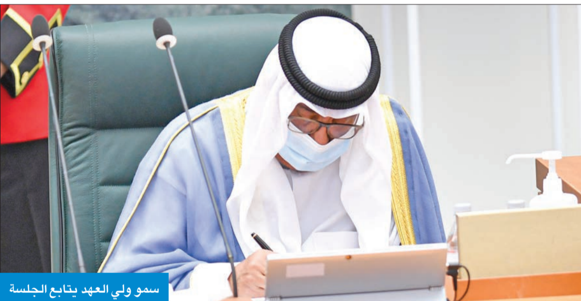
سمو ولي العهد يتابع الجلسة

والإسكان وقضايا المرأة والشباب والاستثمار في تنمية عقولهم وطاقتهم وخلق مسارات مهنية مستدامة لهم ودعم كل المقترحات التي من شأنها تحقيق الرخاء المجتمعي والتطوير المؤسسي وفق أطر القوانين المنظمة. وفي ختام الخطاب الأميري قال الخالد: "نشال الله سبحانه وتعالى أن يلهمنا السداد والرشاد، ويوفقنا جميعاً لما فيه خير الوطن ورفعته، في ظل قائد مسيرتنا حضرة صاحب السمو أمير البلاد وولي عهده الأمين، حفظهما الله ورعاهما".