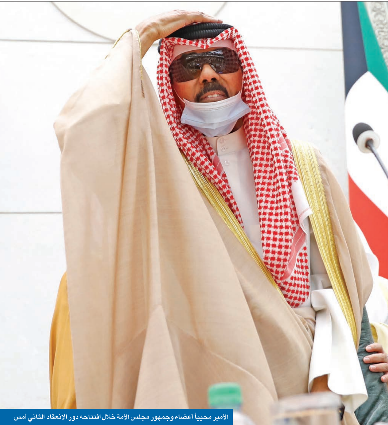
الأمير محيياً أعضاء وجمهور مجلس الأمة خلال افتتاحه دور الانعقاد الثاني أمس

الغانم: لا نكابّر... أخطأنا جميعاً من دون استثناء ● «الاستقرار السياسي لا يعني التحصين أو عدم المحاسبة بل الاستخدام الحصيف للأدوات الدستورية» ● «جربنا التصارع وأضعنا الوقت واستنزفنا الكثير من الطاقات فماذا جئنا؟!»