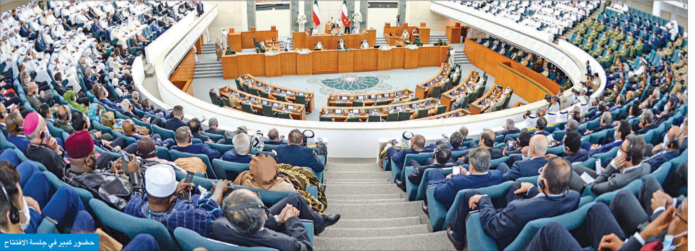
حضور كبير في جلسة الافتتاح

● الخالد: على السلطتين التعاون لتنفيذ الإصلاحات الاقتصادية فأعباء المسؤولية تقع عليهما