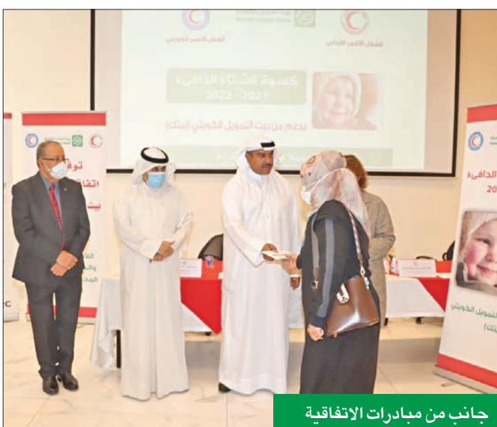
جانب من مبادرات الاتفاقية

الاتفاقية تستهدف برامج وأنشطة إغاثية وطبية للاجئين السوريين والفلسطينيين والأسر الأردنية المحتاجة البرجس