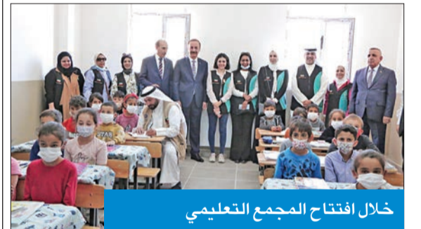
خلال افتتاح المجمع التعليمي