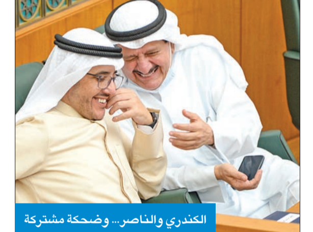
الكندري والناصر... وضحة مشتركة