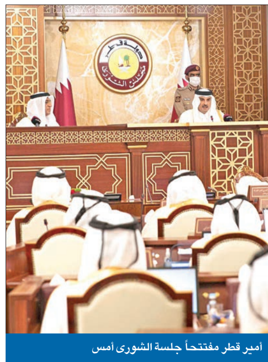
أمير قطر مفتتحاً جلسة الشورى أمس

افتتح أمير قطر الشيخ تميم بن حمد أول جلسة لمجلس الشورى المنتخب، أمس، واعتبرها لحظة تاريخية يشهدها البلد، لاستكمال بناء مؤسسات الدولة. وحذر تميم، في كلمته، من «الجانب السلبي للقبليّة»، معتبراً أن ظهور هذا الجانب عند أول انتخابات شهدتها البلاد «كان أمراً مفاجئاً». ودعا إلى «مكافحة تغليب العصبية على المصلحة العامة أو على الولاء للوطن»، مشدداً على أن «وحدتنا الوطنية مصدر قوتنا... ولن نسمح بتفكيكها مستقبلاً». وتعهد بتحقيق «المواطنة المتساوية»، كاشفاً أنه أصدر تعليمات لمجلس الوزراء لـ «العمل على إعداد التعديلات القانونية اللازمة، التي تضمن تحقيق هذه الغاية». واستعرض أمير قطر الأهداف والإنجازات التي حققتها بلاده، خصوصاً في مجالات الأمن الغذائي، وتخزين السلع