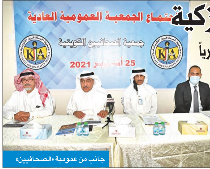
جانب من عمومية «الصحافيين»