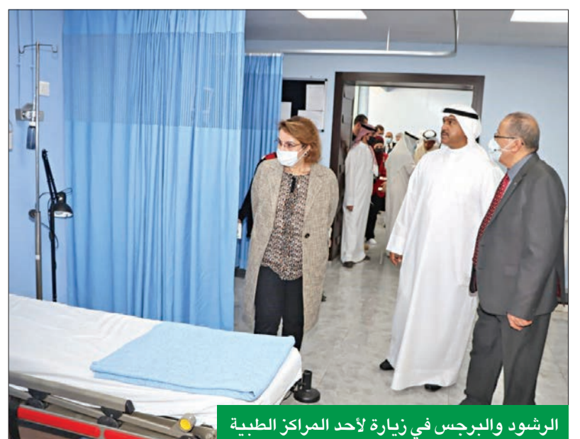
الرشود والبرجس في زيارة لأحد المراكز الطبية