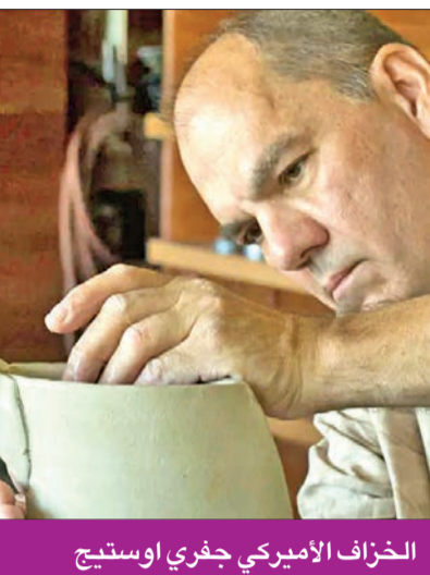
الخراف الأميري جفري اوستيج

ينطلق 25 الجاري بمشاركة خرافين محترفين من 15 دولة