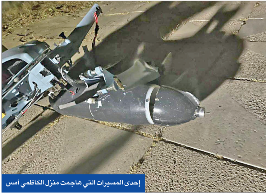
إحدى المسيرات التي هاجمت منزل الكاظمي أمس

● اتهامات لجماعات مسلحة بتجاوز الدولة... والفصائل تواصل التحدي وتشكك في الحادث ● إدانات دولية وعربية واسعة ودعوات لخفض التصعيد... وطهران تشير إلى «فتنة غربية»