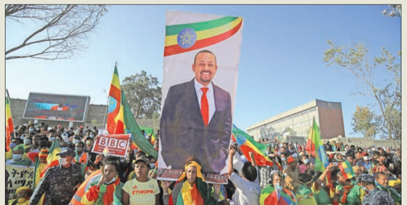
متظاهرون يحملون صورة لآبي أحمد أمس في أديس أبابا

أطراف الصراع في إثيوبيا إلى وقف التصعيد والدخول في مفاوضات من دون شروط مسبقة للتوصل إلى وقف دائم لإطلاق النار. وحثت تلك الدول، ومن بينها فرنسا وبريطانيا وألمانيا، على ضمان ما وصفتها بمسألة جادة للمسؤولين عن انتهاكات حقوق الإنسان في إثيوبيا. ودعا بيان مشترك لتلك الدول إريتريا، أيضاً، إلى سحب قواتها فوراً من الأراضي الإثيوبية، وضممان مسألة قواتها عن الانتهاكات والحجازوات التي ارتكبتها في إقليم تيغراي.