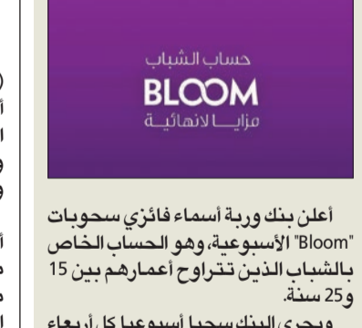
أعلن بنك وربة أسماء فائزي سحبوبات Bloom الأسبوعية، وهو الحساب الخاص بالطلاب الذين تتراوح أعمارهم بين 15 و25 سنة.