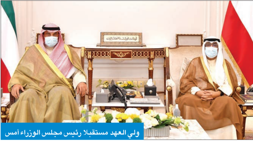
ولي العهد مستقبلاً رئيس مجلس الوزراء أمس

وزير الدولة لشؤون مجلس الوزراء، الشيخ د. أحمد الناصر، ووزير الداخلية الشيخ ثامر العلي. كما استقبل سموه، نائب رئيس مجلس الوزراء وزير العدل وزير الدولة لشؤون تعزيز النزاهة عبدالله الرومي.