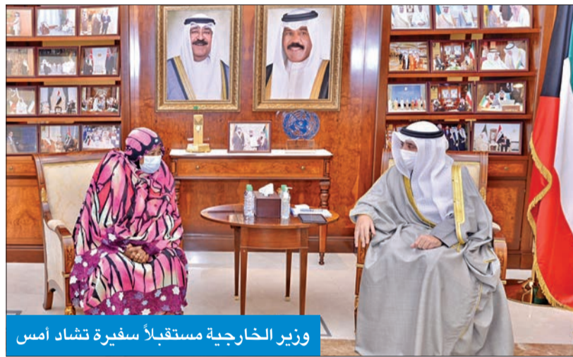
وزير الخارجية مستقبلاً سفيرة تشاد أمس

وتمنى الناصر للسفيرة الجديدة التوفيق في مهام عملها، وللعلاقات الثنائية الوثيقة التي تجمع البلدين الصديقين المزيد من التقدم والازدهار.