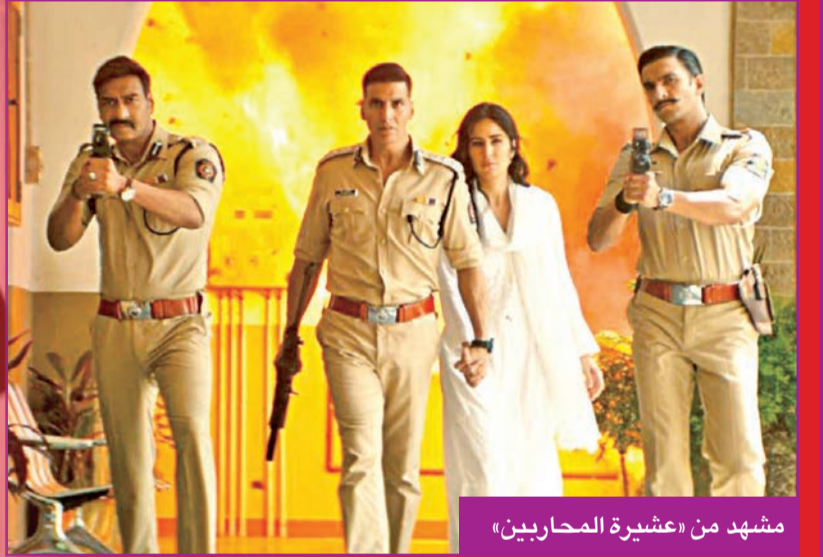
مشهد من «عشيرة المحاربين»

شيكات دور السينما في الهند، أن هذا الفيلم مهم جدا لصناعة السينما، معتبرا أن الصحة أيضا جيدة جدا. وتشمل الأفلام، التي تعرض هذا الأسبوع، «إبترلز» الذي يشكل الجزء الأحدث من سلسلة أفلام «مارفل» الهوليوودية، والفيلم الدرامي «انانية» (الشقيق الأكبر) من بطولة النجم الكوميدي راجينيكانت الذي يتمتع بشعبية كبيرة.