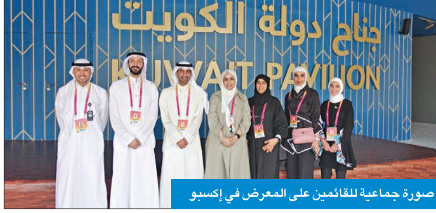
صورة جماعية للقائمين على المعرض في إكسبو

أعلن الأمين العام لجامعة الكويت بالإنيابة المتحدث الرسمي باسم الجامعة د. مرضي العياش توافد عدد كبير من زوار إكسبو دبي 2020 من مختلف دول العالم إلى جناح الجامعة المشارك في معرض أسبوع التنمية الحضريّة والريفية، للتعرف على مشاركة الجامعة من خلال الوفد الممثل من كلية الهندسة والبتترول والتي تبرز أهم المشاريع في مجال الهندسة المدنية والهندسة الكيميائية، ودورها في تحقيق أهداف التنمية المستدامة.