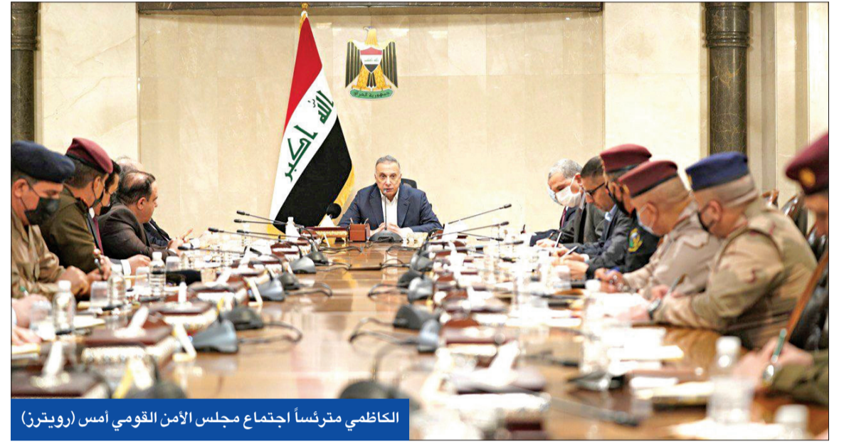
الكاظمي مترئساً اجتماع مجلس الأمن القومي أمس