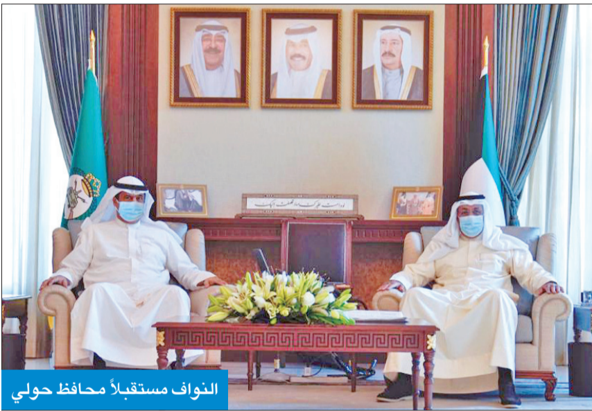
النواف مستقبلاً محافظ حولي

استقبل نائب رئيس الحرس الوطني الفريق أول متقاعد الشيخ أحمد النواف في ديوانه بالتراسات العامة للحرس الوطني، محافظ حولي علي الأصفر.