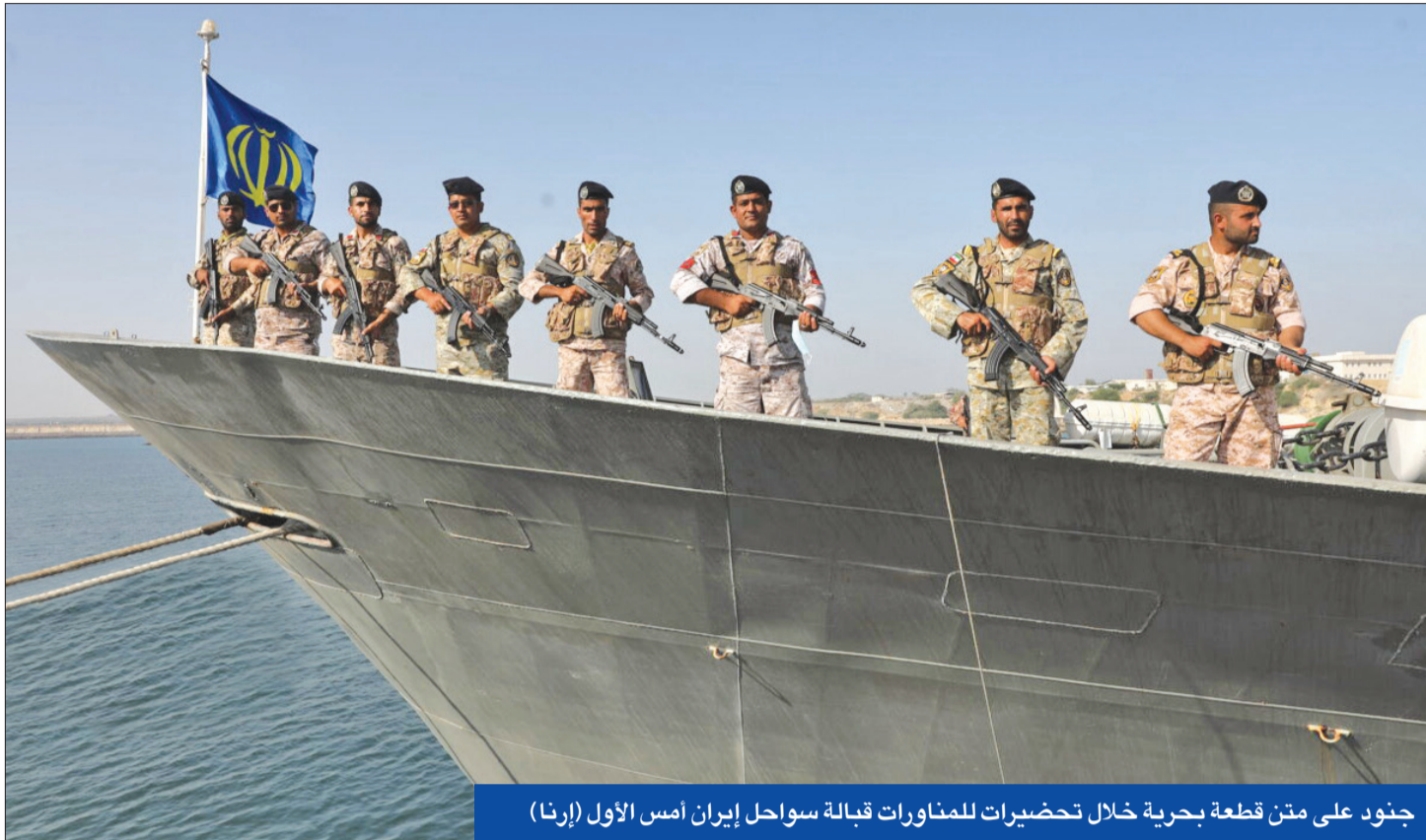
جنود على متن قطعة بحرية خلال تحضيرات للمناورات قبالة سواحل إيران أمس الأول

إسلام آباد تقترح على طهران مقيضة الأرز بالنفط ووزير إيراني يكشف معاناة الوزراء من «المشاكل المعيشية»