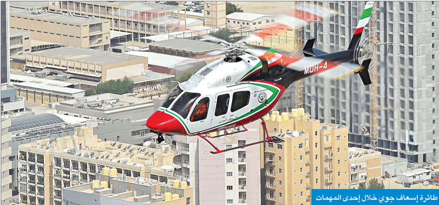
طائرة إسعاف جوي خلال إحدى المهمات

منها 4030 حالة تم نقلها بالإسعاف الجوي «الطيران العمودي» استغرقت 5322 ساعة و33 دقيقة، و535 حالة للإخلاء الطبي «الطائرة النفاثة» استغرقت 6569 ساعة و45 دقيقة.