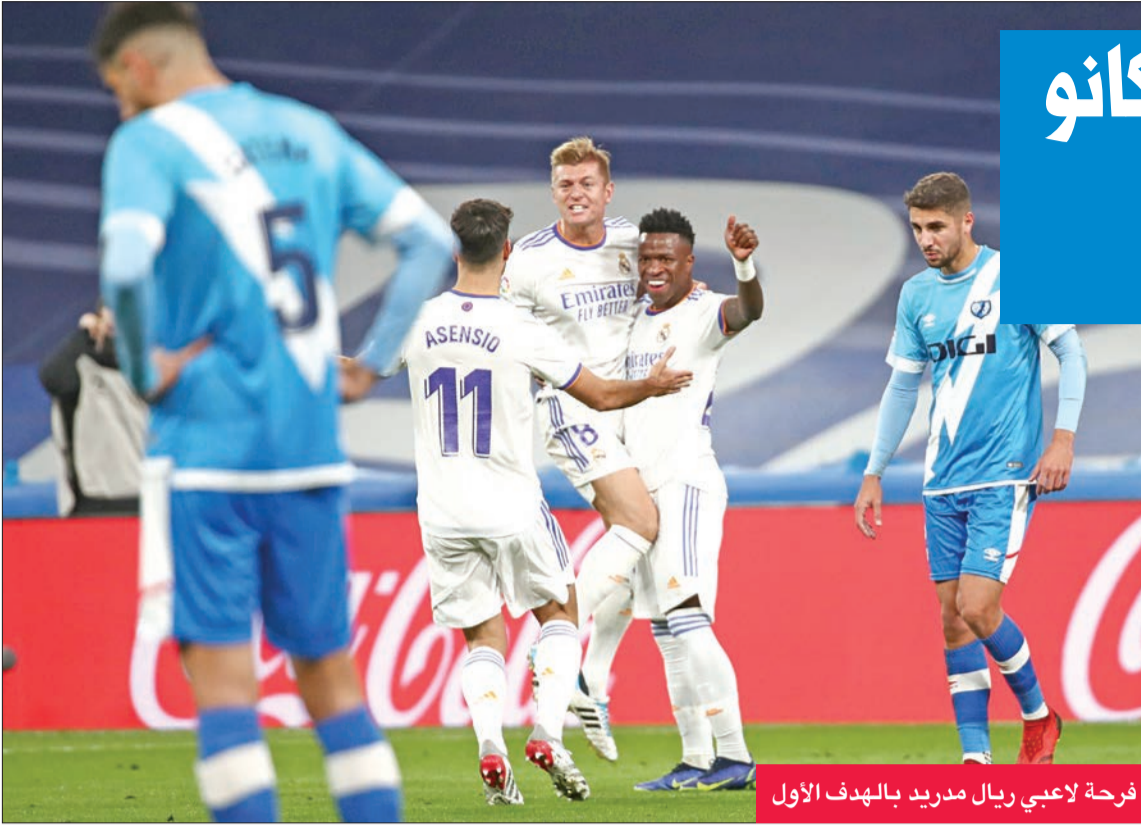
فرحة لاعبي ريال مدريد بالهدف الأول

واصل فيلادلفيا سفنتي سيكسرز انتفاضته، وحقق فوزه السادس تواليا عندما تغلب على مضيفة شيكاغو بولز 114-105 السبت في دوري كرة السلة الأمريكي للمحترفين. وحدد سيكسرز فوزه على بولز بعد ثلاثة أيام من تغلبه عليه 103-98 في فيلادلفيا، ورفع غلته من الانتصارات إلى ثمانية حتى الآن هذا الموسم مقابل خسارتين. وعزز سيكسرز صدارته للمنطقة الشرقية أمام ميامي هيت، الذي استعاد توازنه بفوز صعب على ضيفه يوتا جاز 118-115 مع تائق لافيت لوافه الجديد جمع تورونتو رابرتوز السابق كابل لوري صاحب «تربيل دابل»، بتسجيله 20 نقطة مع 12 متتابعة و10 تمريرات حاسمة.