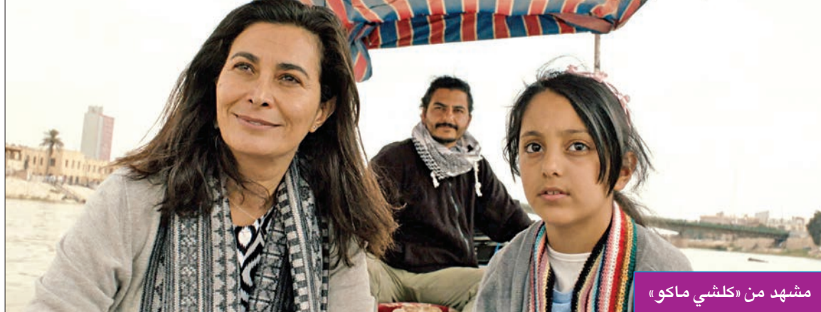
مشهد من «كلشي ماكو»

وتحلم المخرجة بلحظات تستطبع فيها السفر إلى من تحبهم، وكلمات جديتها تصفي معنى على مشاعر الغياب والحزن. ومن الفنانين العرب المشاركين في عضوية لجان التحكيم، نبيل كرم في عضوية لجنة تحكيم المسابقة الدولية للمهرجان، والموسيقي اللبناني خالد مزنر، في حين تضم لجنة تحكيم مسابقة أفلام السينما العربية كلاً من المخرج والمؤلف المصري تامر محسن، والمخرج اللبناني هادي زكاه، إضافة إلى الممثلة والمخرجة السعودية فاطمة البنيوي، وهي المسابقة التي تتنافس فيها 10 أفلام عربية متنوعة على 4 جوائز، فيما يعرض فيلم "بلوغ" لفاطمة البنيوي وسارة مسفر كفيلم الافتتاح للمسابقة خارج المسابقة الرسمية. وتضم لجنة تحكيم جائزة أفضل فيلم عربي التي تمنح جوائزها لأفضل فيلم عربي باي من مسابقات