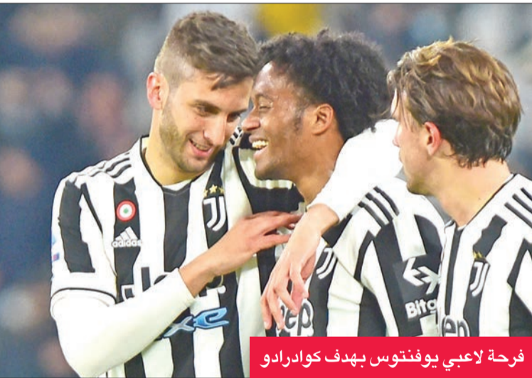
فرحة لاعبي يوفنتوس بهدف كوادرادو

تامى أبراهام التقدم في الدقيقة الثانية من الوقت بدل الضائع للشوط الأول. وضرب أصحاب الأرض بقوة في الشوط الثاني، فادركوا التعادل بواسطة ماتيا أرامو (65 من ركلة جزاء)، قبل أن يسجلوا هدف الفوز عبر النيجيري ديفيد أوكيكي (74).