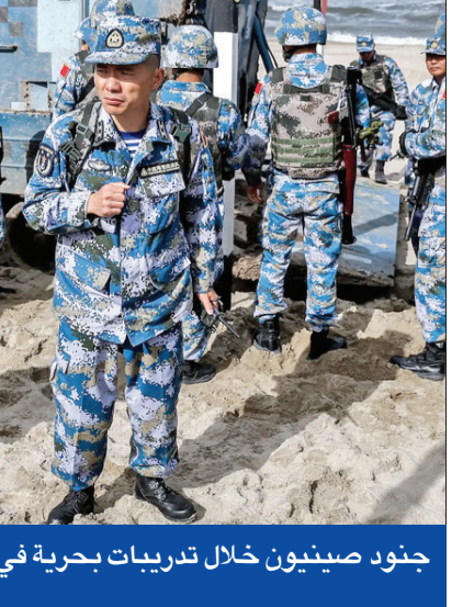
جنود صينيون خلال تدريبات بحرية في 2016

وذكرت مجلة ناشيونال إنترست الأميركية أن زيادة قوة الأسطول الصيني تساهم في دعم الأهداف السياسية الخارجية الصينية، خاصة في المناطق المتنازع عليها في بحر الصين الجنوبي وبحر الصين الشرقي والبحر الأصفر، مبيّنة أن قوة الصين البحرية لا تقتصر على الأسطول البحري التابع للجيش الصيني، وإنما تشمل أيضاً القوات البحرية التابعة لحرس السواحل، والقطع البحرية