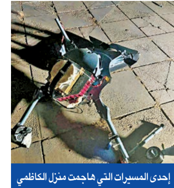
إحدى المسيرات التي هاجمت منزل الكاظمي

تلقي رئيس حكومة العراق مصطفى الكاظمي أقوى رسالة تحذير من خصومه، منذ وصوله إلى السلطة، وذلك بعد استهداف منزله بثلاث طائرات مسيرة، فجر أمس، تركزت أضراراً مادية وأصابت بعض أفراد الحماية، حسب بيان رسمي وصف ما جرى بأنه محاولة اغتيال للرئيس. جاء ذلك بعد يوم