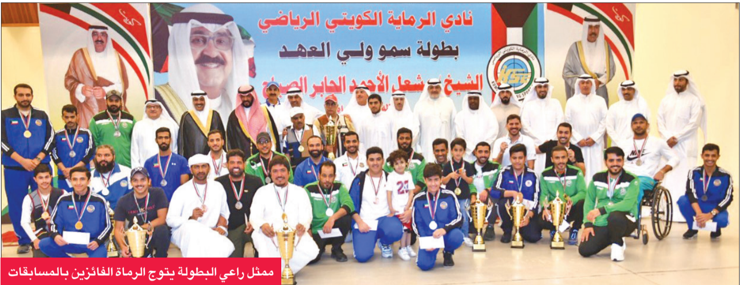
ممثل راعي البطولة يتوج الرماة الفائزين بالمسابقات