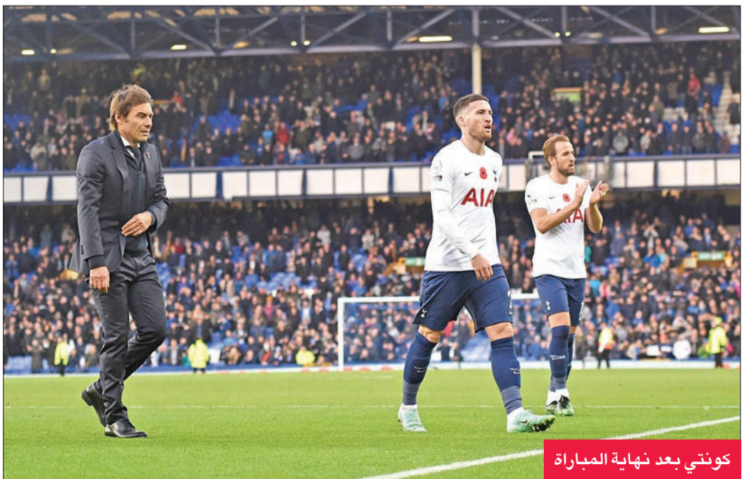
كونتي بعد نهاية المباراة

له الحظ في الدقيقة 56، بعد أن أهدر القائد الجابوتي بيير إيمريك أوباميانغ ركلة جزاء قبلها في الدقيقة 36، ومن قبله تقنية حكم الفيديو المساعد «VAR»، التي ألغت هدفاً لبوكايو ساكا بداعي التسلل. ورفع الفوز رصيد الفريق اللندني إلى 20 نقطة بقرن بها لمنطقة المقاعد الأوروبية، وتحديدًا المركز الخامس.