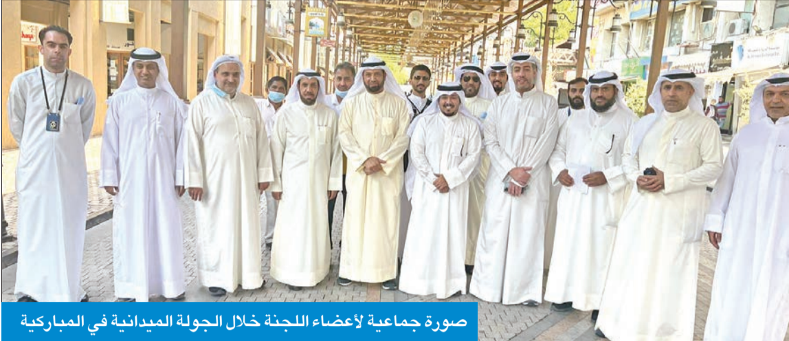
صورة جماعية لأعضاء اللجنة خلال الجولة الميدانية في المباركية

الموضوعة بشكل قريب لتحسين الجو، علماً بأن الرائحة التي تصدر منها قوية جداً ويمكن أن تؤثر على الجو العام للزوار.