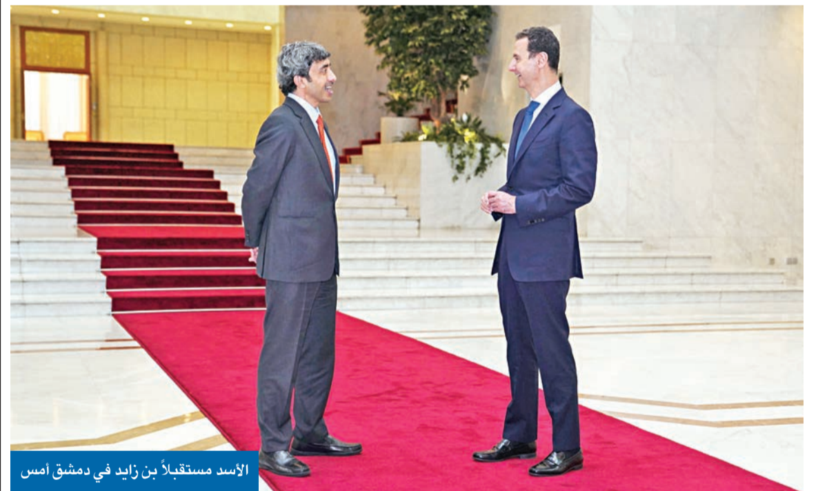
الأسد مستقبلاً بن زايد في دمشق أمس

مصر والأردن يدعوان إلى التكايف لحل أزمات المنطقة