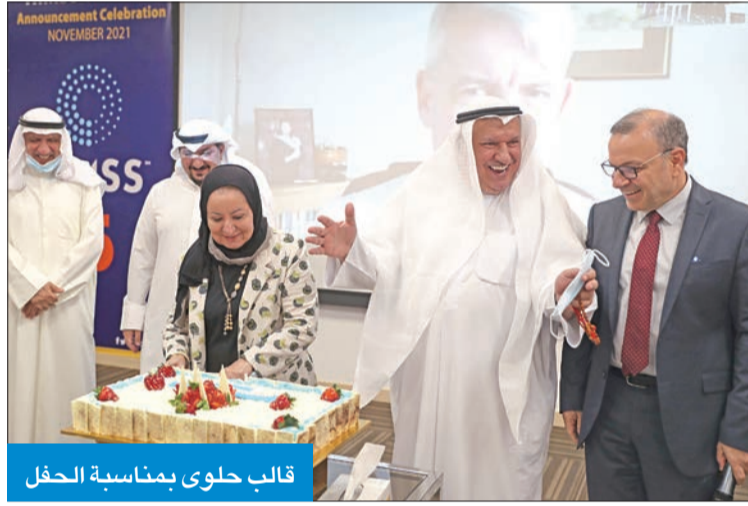
قالب حلوى بمناسبة الحفل