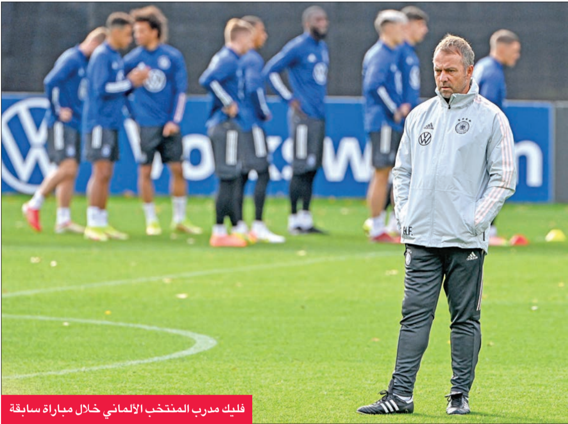
فليك مدرب المنتخب الألماني خلال مباراة سابقة

لأن "التطعيم هو السلاح الرئيسي في مكافحة الوباء". كما قرر منتخب ألمانيا إلغاء المرات الذي كان مقرراً