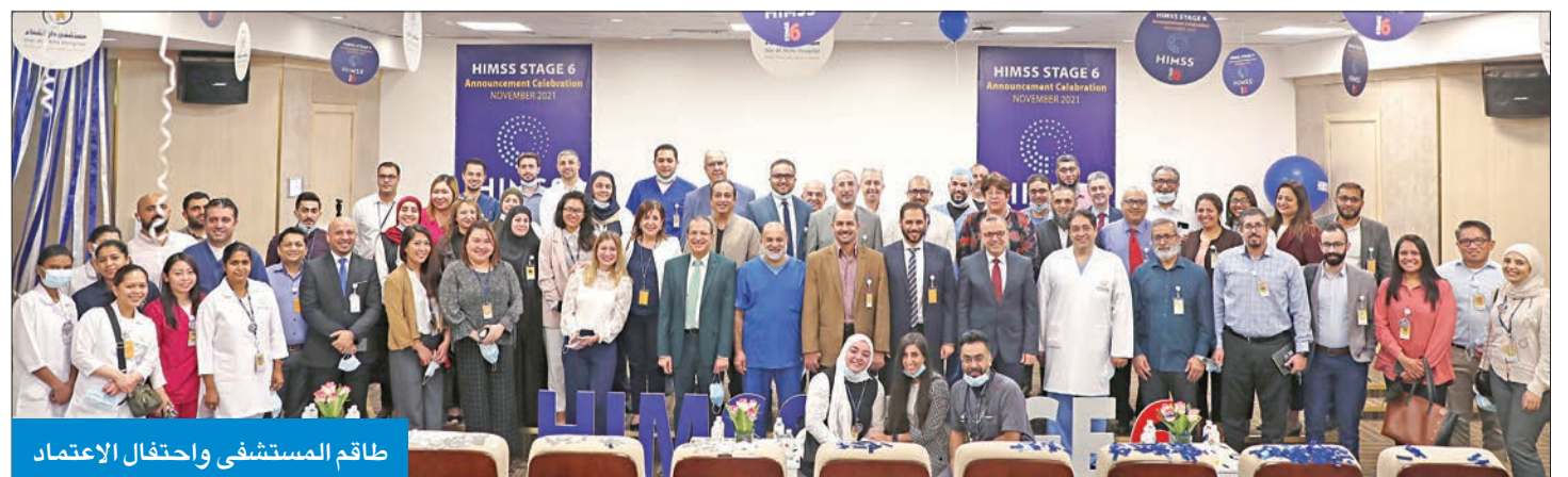
طاقم المستشفى واحتفال الاعتماد