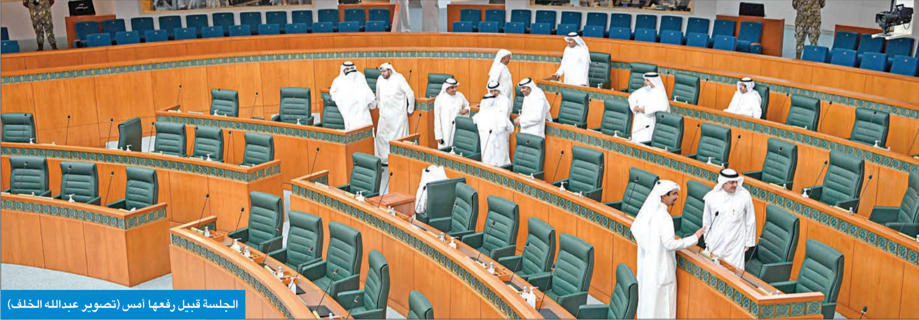
الجلسة قبيل رفعها أمس