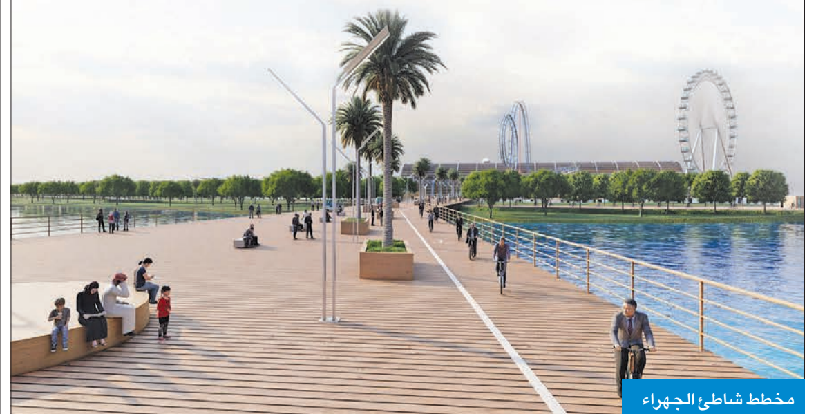
مخطط شاطئ الجهراء