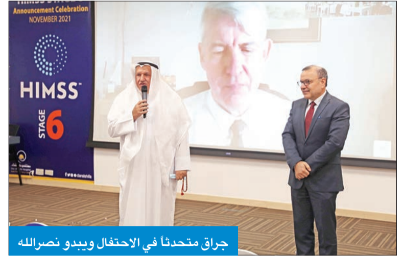
جراق متحدثاً في الاحتفال ويبدو نصرالله

منه لمرضاه في الداخل وفي العيادات الخارجية.