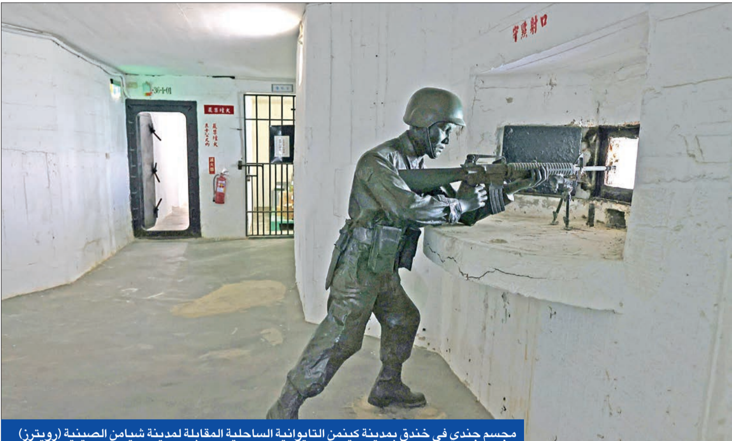
مجسم جندي في خندق بمدينة كينمن التايوانية الساحلية المقابلة لمدينة شيامن الصينية

تايبيه: الصين قادرة على إغلاق موانئنا ومطاراتنا وقطع روابطنا مع الخارج