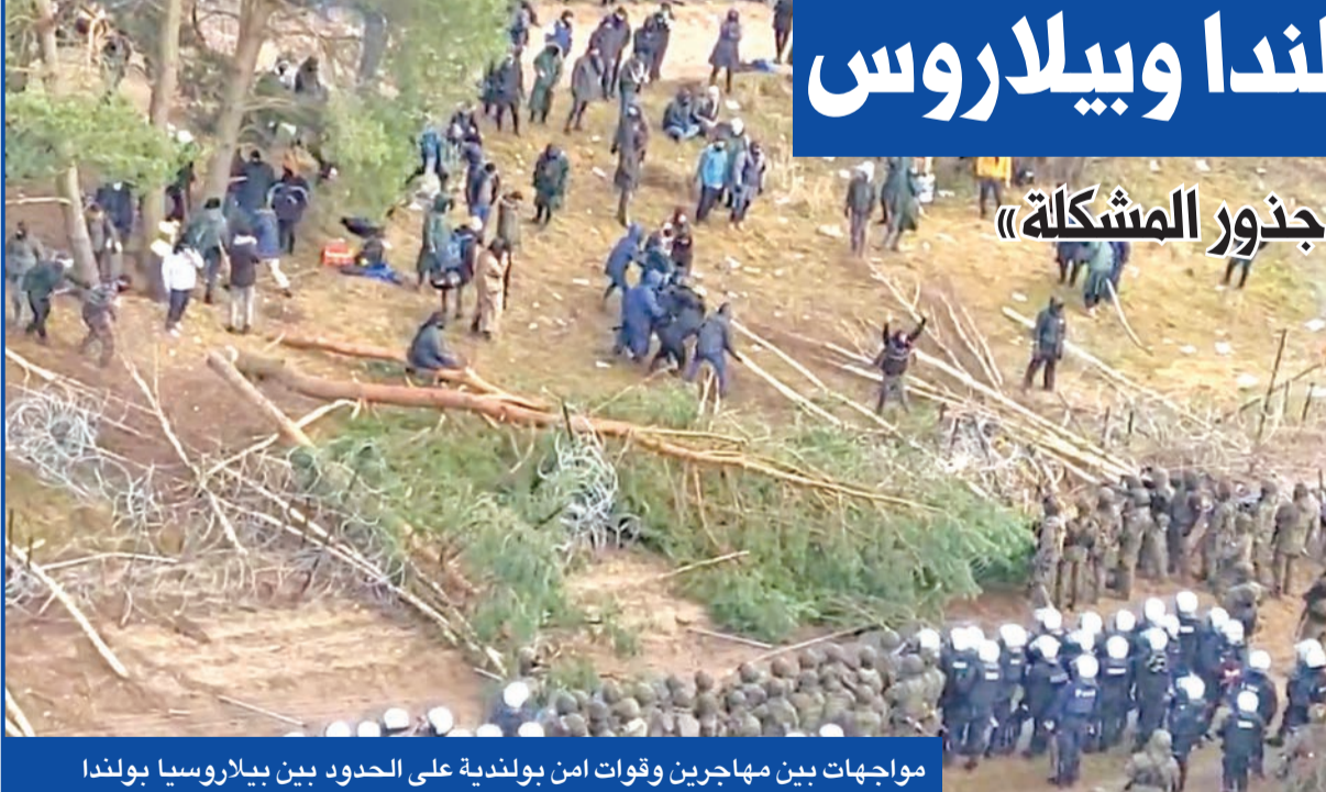
مواجهات بين مهاجرين وقوات امن بولندية على الحدود بين بيلاروسيا وبولندا

وارسو تنال دعماً ألمانيا... وموسكو تذكّر بـ«جنود المشكلة»