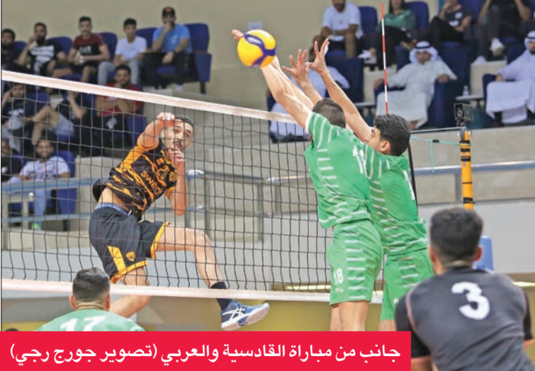
جانب من مباراة القادسية والعربي

حسمت الفرق الثمانية تأهلها إلى ربع نهائي الكأس من الجولة الماضية.