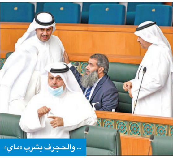
... والحجرف يشرب «ماي»

خلال المرحلة المقبلة، مطالبا بتشكيل حكومة كفؤة تتألف من فئحة المواطنين وممثلي الأمة المنتخبين، وستشارك بكل جهد إصلاحي كنواب من أجل الكويت ورفعته وتنميتها". وقال إن "المرحلة المقبلة ستكون مرحلة إنجاز"، مطالبا بأن "تكون الحكومة الجديدة على قدر طموحات أهل الكويت وتحقق آمالهم"، في وقت أكد زميله حمد روح الدين أنه بصور العفو تمت إزالة أهم عثرة في طريق الإصلاح الشامل وستكون المرحلة المقبلة مرحلة إنجاز وتنمية.