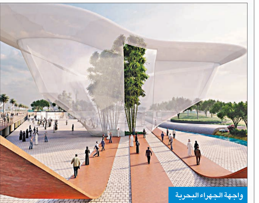
واجهة الجهراء البحرية