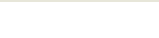
المناور في جلسة سابقة

بنعم يرجى تزويدي بصور من تلك التقارير وأسماء القيادات التي ترفض احترام قوانين الدولة، وإذا كانت أسباب عدم التزام بعض القيادات في مؤسسات الدولة بمنح الرياضيين التفرغ الرياضي، بناء على القانون رقم 87 لسنة 2017، مؤكداً أن أغلب الرياضيين يخضعون من هذا الأمر.