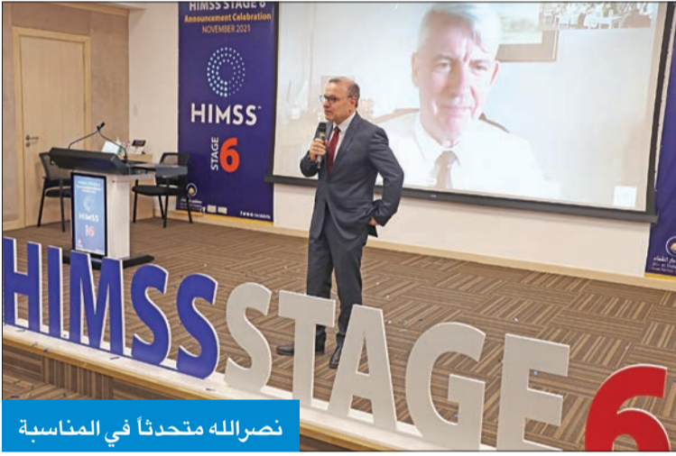
نصرالله متحدثاً في المناسبة