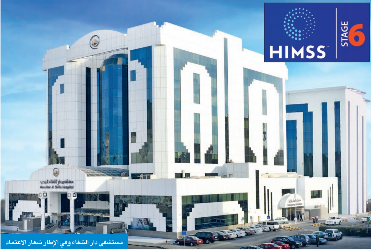
مستشفى دار الشفاء وفي الإطار شعار الاعتماد

بعد تحقيقه المرحلة السادسة من معايير جمعية HIMSS الرقمية