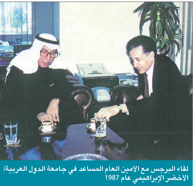
لقاء البرجس مع الأمين العام المساعد في جامعة الدول العربية/ الأخضر إبراهيمي عام 1987

في إطار توسعة انتشار الوكالة على الساحة الدولية تقدر في عام 1980 افتتاح مكتب لـ «كونا» في العاصمة الأميركية واشنطن. كان القرار منطقياً وملحاً في تلك المرحلة، خصوصاً بعد أن افتتح مكتب الوكالة في لندن عاصمة الإمبراطورية التي غابت عنها الشمس، ولم تكن تغطية أخبار الوطن العربي أو الشرق الأوسط أو حتى العالم لتستوي دون وجود فاعل ومؤثر للوكالة على الساحة الأميركية. فقبل وبعد كل شيء، تلعب الأصابع الأميركية في كل مشاكل وقضايا ومصائب العالم، خصوصاً في القضية الفلسطينية، وتأثيرها وأثر سياساتها يلمسه ويحضر منه الكثيرون، أما المستفيدون منه فهم المنضوون تحت العباءة الأميركية وأولهم الكيان الصهيوني.