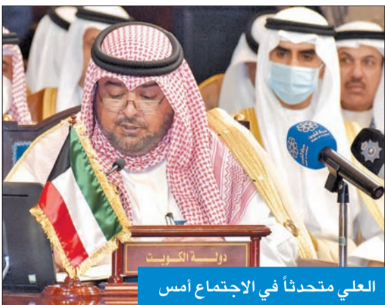
العلي متحدتاً في الاجتماع أمس

أكد وزير الداخلية الشيخ ناصر العلي، أمس، الرفض القاطع للأعمال الإرهابية التي تتعرض لها المملكة العربية السعودية الشقيقة من اعتداءات متكررة على المدنيين والمنشآت الحيوية. وشدد العلي، في كلمة له أثناء الاجتماع الـ 38 لوزراء الداخلية بدول مجلس التعاون لدول الخليج العربية، على الوقوف إلى جانب السعودية في جميع ما تتخذه من إجراءات لحماية مواطنيها وأراضيها، انطلاقاً من «أن أمن دول الخليج كل لا يتجزأ».