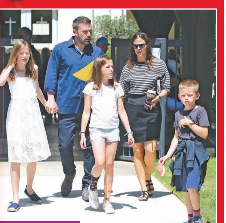
غارنر وبن أفلينك وأبنائها

تحل النجمة العالمية جينيفر غارنر بديلة لصديقتها النجمة جوليا روبرتس في مسلسل The Last Thing He Told Me، الذي يذاع على منصة Apple TV، وفقاً لما كشفه موقع "ديلي ميل". وجاء في تقرير للصحيفة البريطانية أن غارنر ستعود إلى عالم الدراما التلفزيونية من جديد خلال المسلسل المرتقب بعد فترة من التركيز على حياتها الخاصة بصحة عائلتها. يأتي ذلك بعد فترة اختارت فيها غارنر أن تستمتع بحياتها الشخصية، وسط تقارير تؤكد أنها تفكر في العودة إلى صديقتها السابق جون ميلر، بعد فترة انفصال عن زوجها النجم العالمي بن أفلينك، وهي فترة لم ترتبط خلالها بأخر. وقالت "ديلي ميل" إن غارنر ظهرت في الفترة الأخيرة متألقة في عدة مناسبات، وترتدي ملابس تعكس حالة السعادة التي تعيشها حالياً، بصحبة ميلر، وذلك بعدما رصدتها عدسات المصورين أثناء سيرها بشوارع برينتود وهي متوجهة للرعاية وتبتسم طوال الوقت، مع أزياء مبهجة، ومنها صورها بتنورة تتميز بالألوان الجميلة ولافتة مع "تيشرت" بسيط. كما انتقلت الممثلة العالمية إلى منزل ديلر، وشوهدت تستمتع بوقتها مع ابنها صموئيل، من خلال عدة صور نشرها موقع "ديلي ميل"، حيث تحرص غارنر على منح أبنائها المساحة والوقت في الخروج مع كل منهم بشكل منفرد على مدار الأسبوع. وظهرت الممثلة (49 عاماً) وابنها وهما يستمتعان بالخداء في Brentwood Country Mart قبل عطلة نهاية الأسبوع. ورغم أن النجم بن أفلينك انفصل