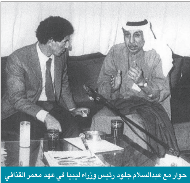
حوار مع عبدالسلام جلود رئيس وزراء ليبيا في عهد معمر القذافي