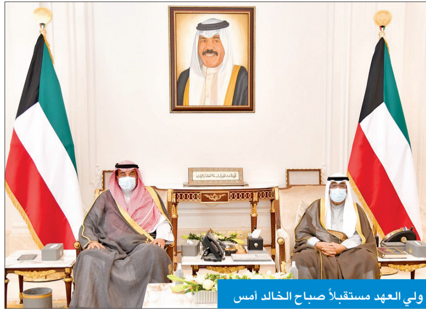
ولي العهد مستقبلاً صباح الخالد أمس

استقبل سمو ولي العهد الشيخ مشعل الأحمد، بقصر بيان صباح أمس، رئيس مجلس الأمة مرزوق الغانم، ورئيس مجلس الوزراء سمو الشيخ صباح الخالد. واستقبل سموه، نائب رئيس مجلس الوزراء وزير العدل وزير الدولة لشؤون تعزيز النزاهة عبدالله الرومي.