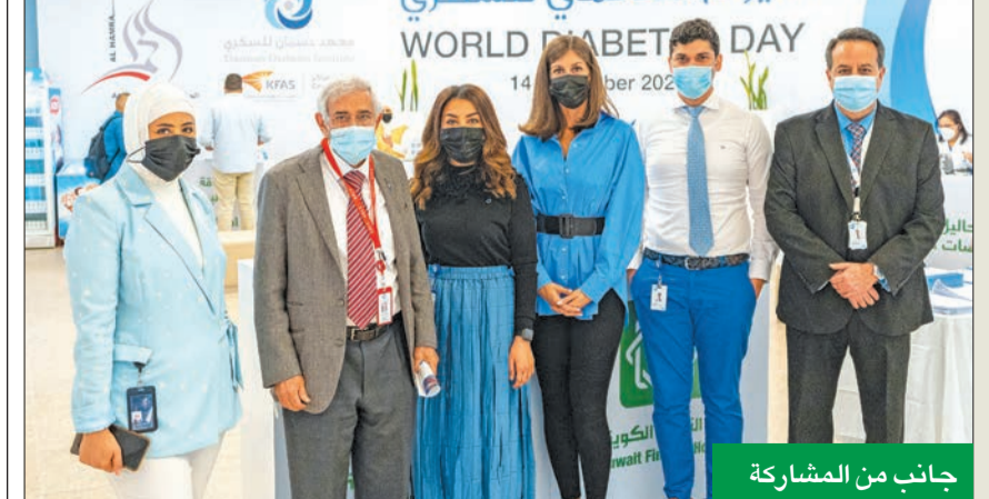
جانب من المشاركة