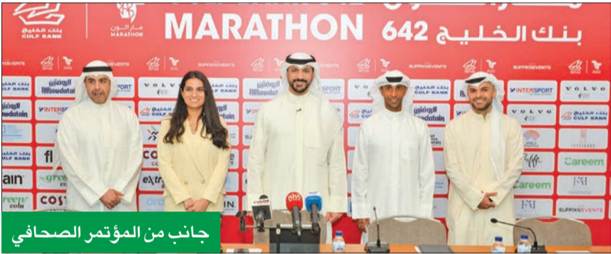
جانب من المؤتمر الصحفي

ويقدم البنك نموذجاً متميزاً لبرامج الاستدامة، حيث ينفذ مبادرات استدامة داخلية للموظفين ومجتمعية للعمال، على مدار العام، ويلتزم بنك الخليج بالحفاظ على برنامج قوي للحكومة البيئية والاجتماعية وحوكمة الشركات، ويقود العديد من المبادرات التعليمية في مدار العام، والتي لها تأثير مستدام على حياة الشباب والمجتمع.