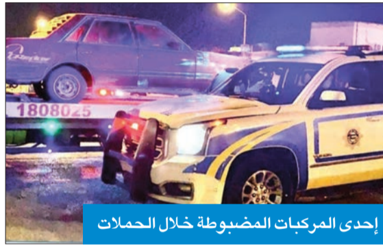
إحدى المركبات المضبوطة خلال الحملات

واصل قطاع المرور والعمليات في وزارة الداخلية تنفيذ الحملات الأمنية المرورية على المخالفين والمستهترين والمطلوبين أمنياً وقضائياً، وأسفرت خلال الأسبوع الماضي