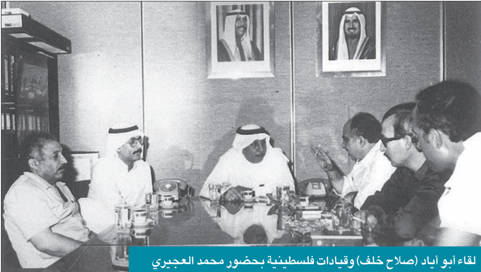
لقاء أبو أياد (صلاح خلف) وقيادات فلسطينية بحضور محمد العجيري