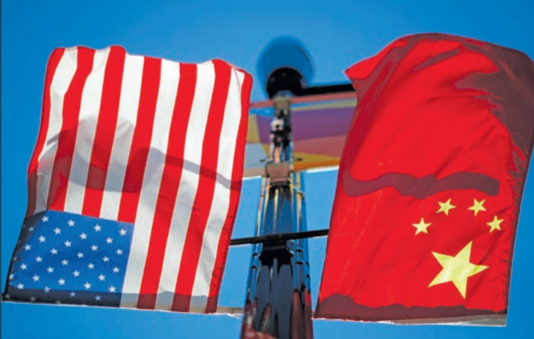
علماء أميركا والصين في بوسطن

قلق أميركي من الضغوط العسكرية الصينية ضد تايوان