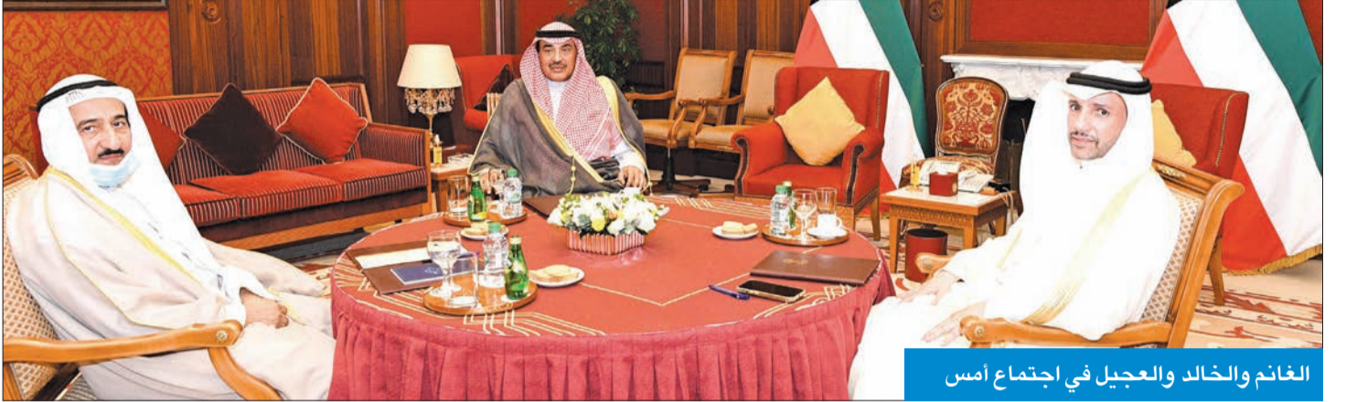
الغانم والخالد والعجيل في اجتماع أمس