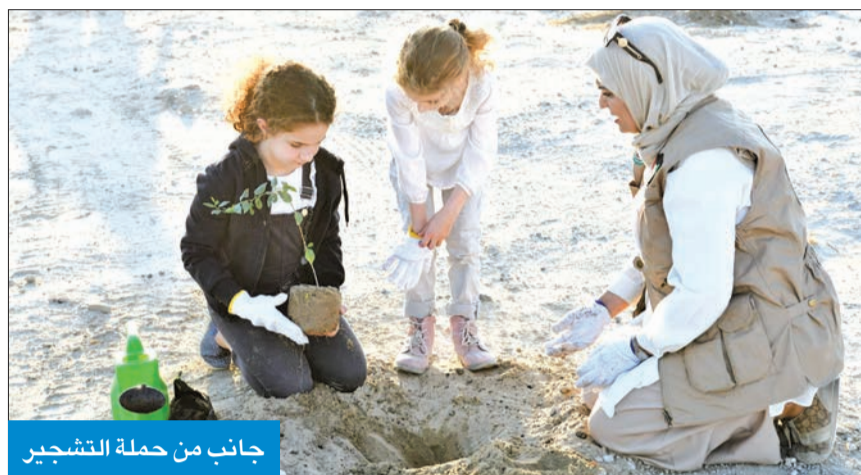
جانب من حملة التشجير

وفيما يتعلق بأخر المستجدات بشأن الحيازات الزراعية، أكد يوسف رفض استغلال الحيازات الزراعية لإقامة أنشطة تجارية داخلها مثل المطاعم والمقاهي وبيع بعض المستلزمات، لمخالفتها الغرض المخصصة لها، موضحاً أن الهيئة لم تقم بإغلاق أي حيازة، بل وجهت إنذارات من خلال الفريق التفتيشية التي ترصد أي مخالفات سواء في الحيازات الزراعية أو الحظائر المخصصة للماشية والأغنام. وذكر أن كل التوزيعات موقوفة لحين النظر فيما ستضمه اللائحة الجديدة، موضحاً أن هناك تصورات وأهدافاً للهيئة، ومجلس الإدارة يعمل على