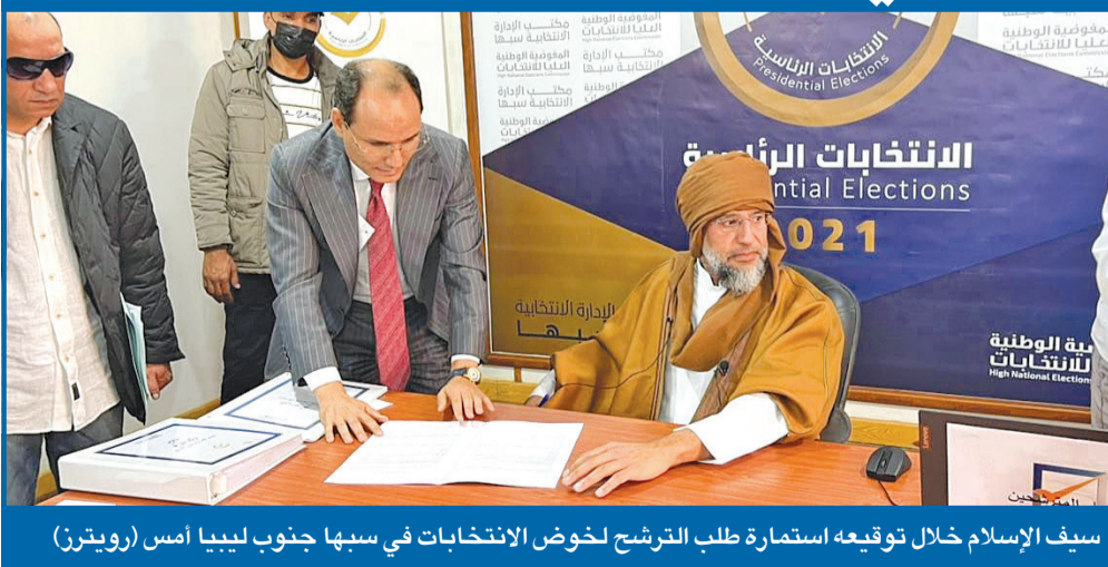
سيف الإسلام خلال توقيعه استمارة طلب الترشح لخوض الانتخابات في سبها جنوب ليبيا أمس (رويترز)