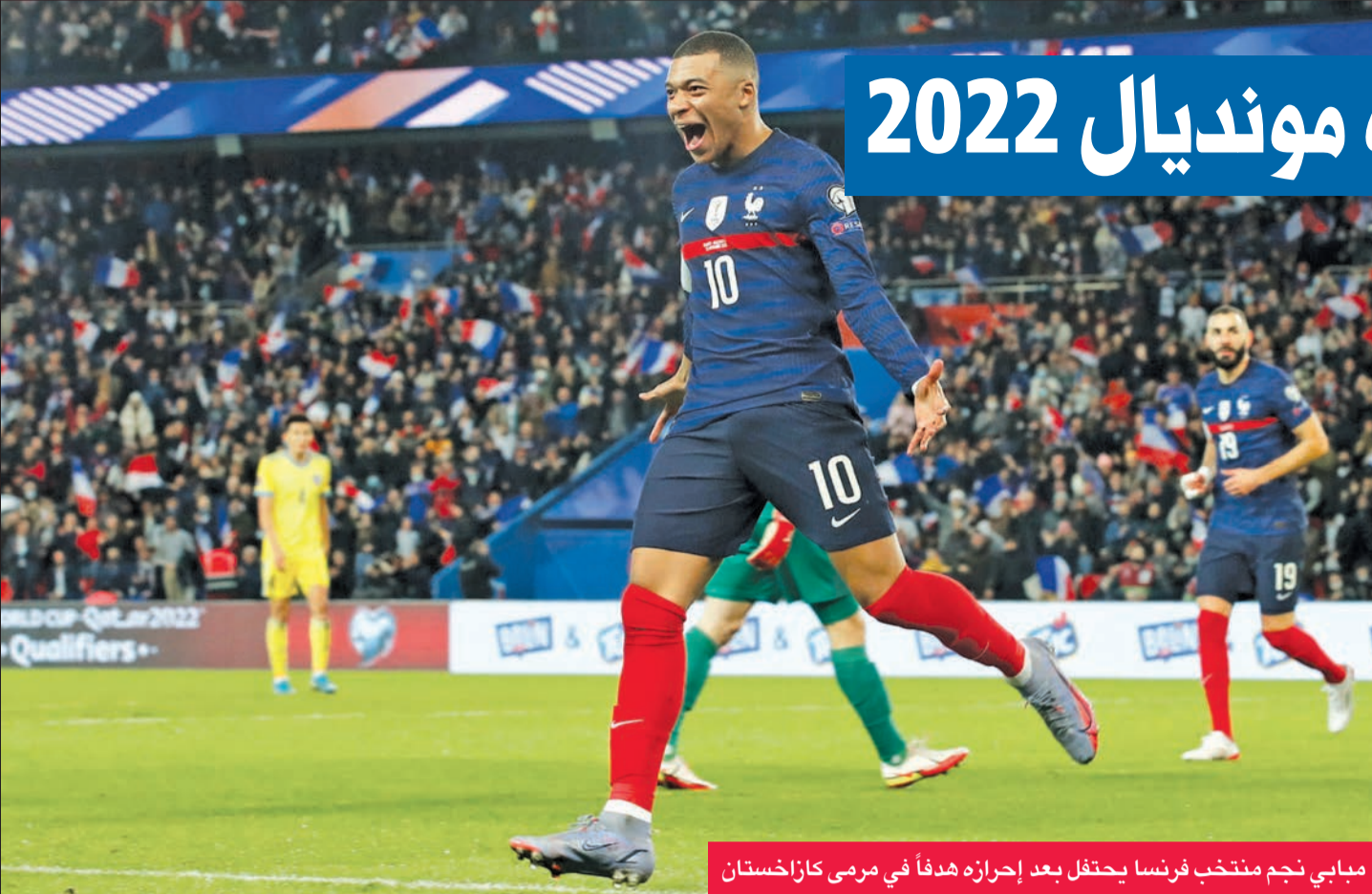
مبابي نجم منتخب فرنسا يحتفل بعد إحرازه هدفاً في مرمى كازاخستان

لحقت فرنسا حاملة اللقب وبلجيكا ثالثة النسخة الأخيرة في روسيا بركب المتأهلين لنهائيات مونديال قطر 2022 في كرة القدم بفوز الأولى الكاسح على صيفتها كازاخستان 8-صفر، والثانية على صيفتها إستونيا 3-1، أمس الأول في الجولة السابعة قبل الأخيرة من التصفيات الأوروبية. في المقابل، أهدرت هولندا فرصة اللحاق بهما بسقوطها في فخ التعادل أمام مضيفتها مونتينيغرو 2-2، وباتت مطالبة بانتظار الجولة الأخيرة الثلاثاء المقبل للعودة إلى العرس العالمي، بعدما غابت عن النسخة الأخيرة.