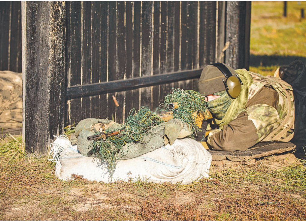
قناص روسي في تدريب بالمنطقة العسكرية الغربية (وزارة الدفاع)

• كيف تتوسع في استخدام المسيرات التركية • موسكو تعرض المساعدة لحل أزمة المهاجرين