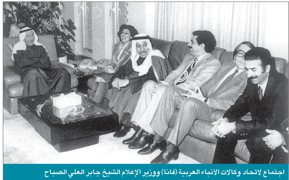
اجتماع لاتحاد وكالات الأنباء العربية (فانا) ووزير الإعلام الشيخ جابر العلي الصباح