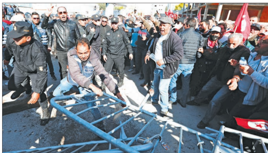
تونسيون يحاولون إزالة حواجز الشرطة للوصول إلى البرلمان أمس

اشتباكات مع الأمن وتحذير من انفجارات اجتماعية... وتظاهرة منددة بالانقلاب في باريس