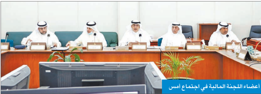
أعضاء اللجنة المالية في اجتماع أمس

حددت اللجنة المالية والاقتصادية البرلمانية أولوياتها لدور الانعقاد الثاني، خلال الاجتماع الذي عقده أمس برئاسة النائب أحمد الحمد، ومنها قانون تعويض أصحاب المشاريع الصغيرة والمتوسطة المتضررين من أزمة كورونا، وقانون يقضي بشراء الدولة القروض الاستهلاكية على المواطنين، وقانون يقضي بزيادة المعاشات التقاعدية لفئة المتقاعدين من المواطنين، وقانون لإنشاء صندوق للمتضررين من النصب العقاري جراء ما لحقهم من ضرر كبير بسبب النصب العقاري الذي تعرضوا له.