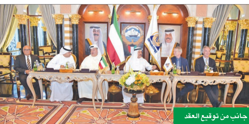
جانب من توقيع العقد

تجاري أرضي، وفندق، ووبرج مكاتب تجارية متميزة يضم مقر المجموعة الرئيسي وجميع شركاتها. ولغت إلى أن هذا المشروع من المتوقع أن يكون إضافة حقيقية لنهج التطوير العقاري الذي تسير عليه المجموعة والتي أنجزت برج الكريستال الخاص على العديد من الجوائز والشهادات العالمية، متوقفاً أن يتم العمل في المشروع، بعد الانتهاء من التصميم الذي ستقوم به المكاتب العالمية وبعض الإجراءات الإدارية الأخرى.