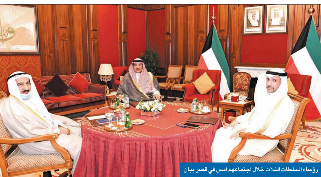
رؤساء السلطات الثلاث خلال اجتماعهم أمس في قصر بيان

الإفراج عن 20 محكوماً من «خلية العبدلي» والدفعة الأولى من «تركيا» تصل اليوم