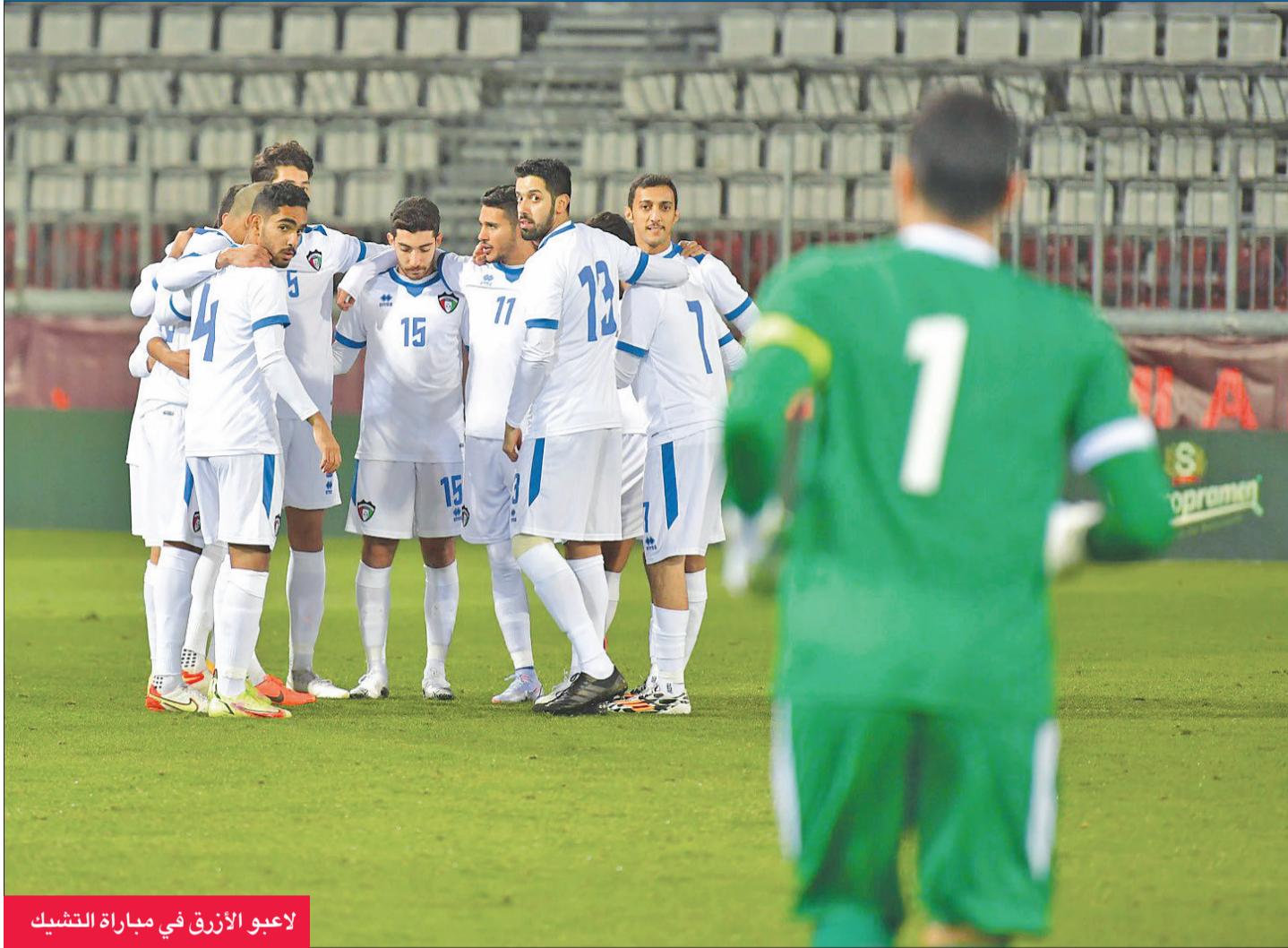
لاعب الأزرق في مباراة التشيك

المؤهلة لنهائيات كأس العالم 2022 بقطر، والتي دعها منتخب ليتوانيا مبكراً باحتلال المركز الأخير في مجموعته.