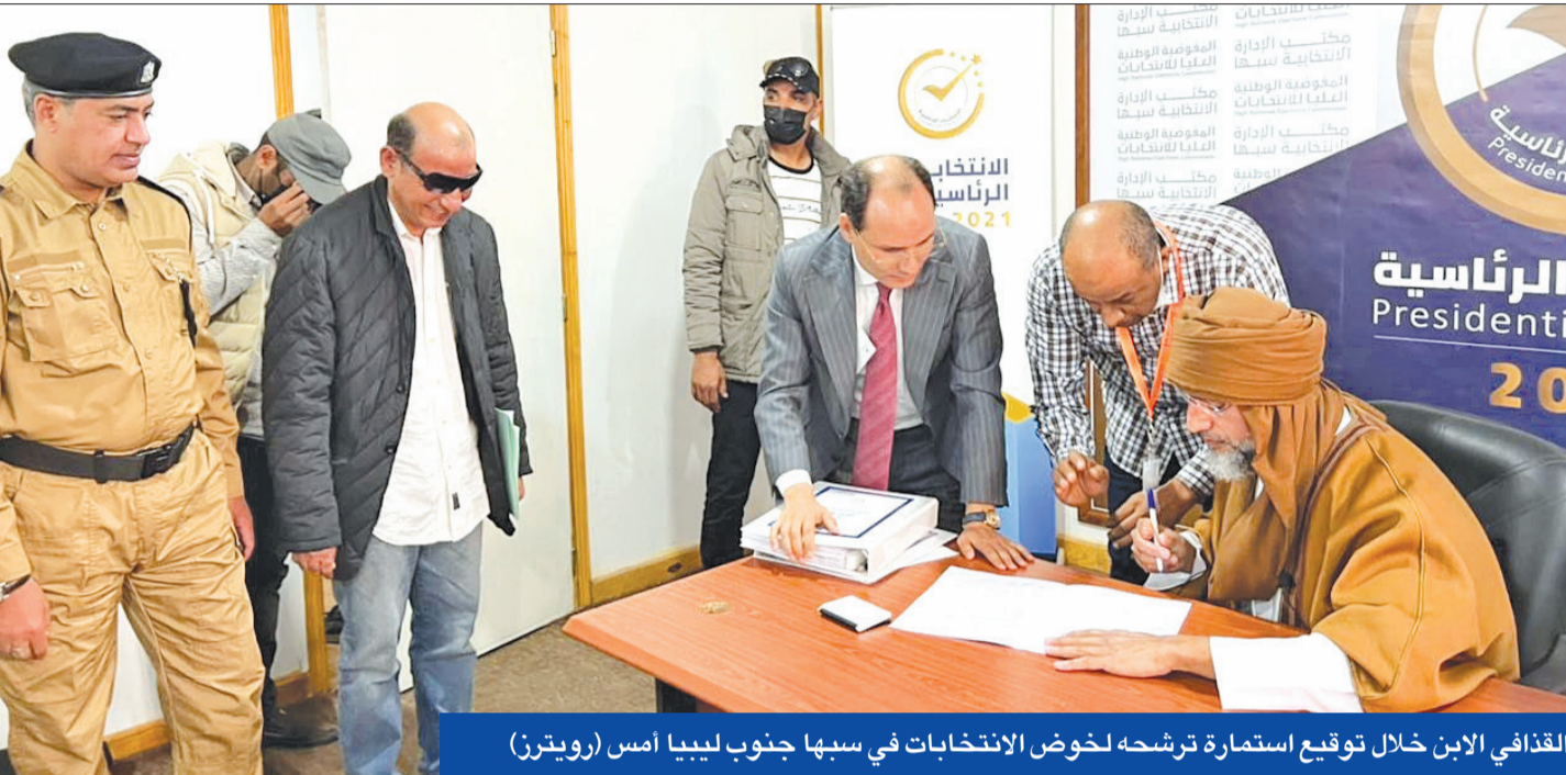
القذافي الابن خلال توقيع استمارة ترشحه لخوض الانتخابات في سبها جنوب ليبيا أمس

قذاف الدم: إجراء الاستحقاق يعيد ليبيا لليبيين • «الرئاسي» يشيد بمؤتمر باريس ويتمسك بتزامن الانتخابات