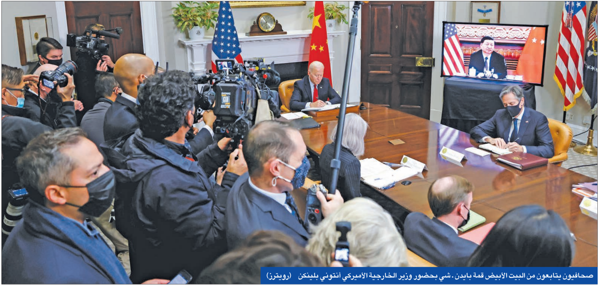
صحافيون يتابعون من البيت الأبيض قمة بايدين، شي بحضور وزير الخارجية الأميركي أنتوني بلينكن

واشنطن تطالب بضمانات لعدم الانزلاق لصراع مفتوح... وبكين تحذر من اللعب بنار تايوان