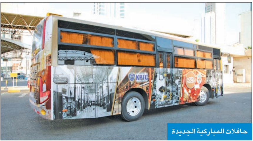
حافلات المباركية الجديدة