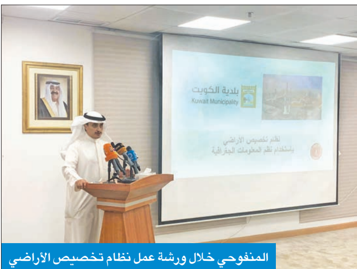
المنفوحى خلال ورشة عمل نظام تخصيص الأراضي