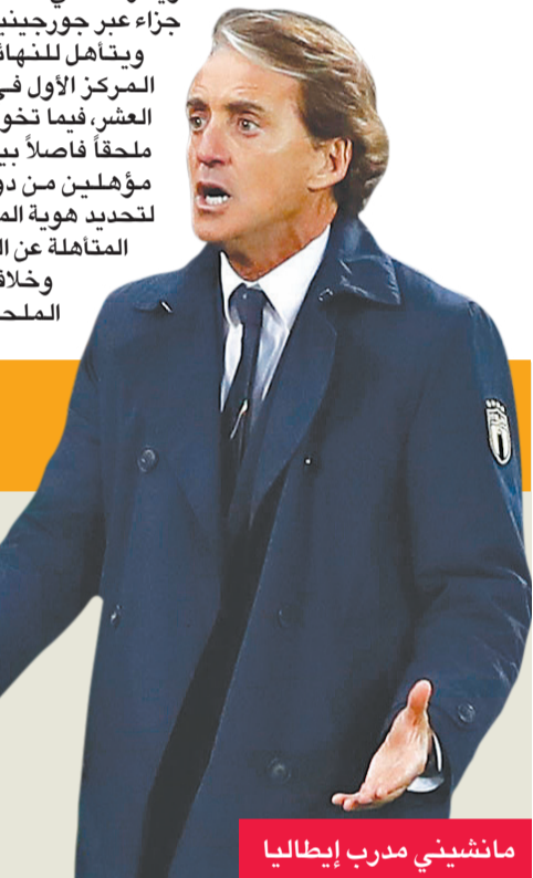
مانشيني مدرب إيطاليا

حاول مدرب إيطاليا، روبرتو مانشيني، طمأنة فريقه بعد عدم التأهل المباشر لمونديال كأس العالم 2022 في قطر واضطرابه لخوض الملحق، لدى تأكيده أن لاعبيه سيتأهلون في مارس "وربما" سيفوزون بكأس العالم للمرة الخامسة. وقال مانشيني عقب فشل إيطاليا في الاختبار الأهم لها في