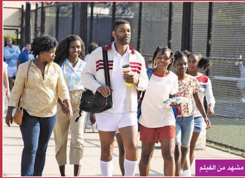
مشهد من الفيلم

يتبع فيلم «King Richard» الصعود المذهل للبطلتين سيرينا وفينوس وليامس، من ملاعب كرة المضرب في إحدى ضواحي لوس أنجلوس الفقيرة إلى الانتصارات في أهم الدوريات العالمية. ويُعتبر ويل سميث بفضل دوره في هذا الفيلم من بين الأوفر حظاً لنيل جائزة أوسكار أفضل ممثل في فبراير المقبل، بعدما فوّت مرتين فرصة الفوز بها، إذ سبق أن رشّح لها مرتين عن فيلمي «علي» و«ذي بورسوت أوف هابنيس».