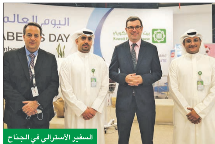
السفير الأسترالي في الجناح

فعاليت معهد دسمان ودعم مبادراته وجهوده منذ سنوات عديدة. وتضمنت فعاليات الحملة في اليوم العالمي للسكري مسابقات وأنشطة توعوية قام بها «بيتك» بهدف نشر التوعية، وحث المجتمع على القيام بفحوصات دورية، بحضور العديد من الكوادر الصحية والفرق المهمة بمرض السكري.