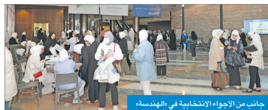
جانب من الأجواء الانتخابية في «الهندسة»