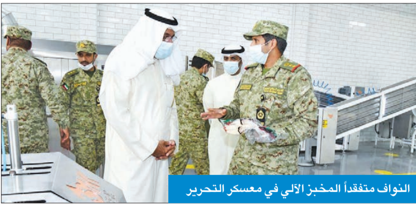
النواف متفقد المخبز الآلي في معسكر التحرير