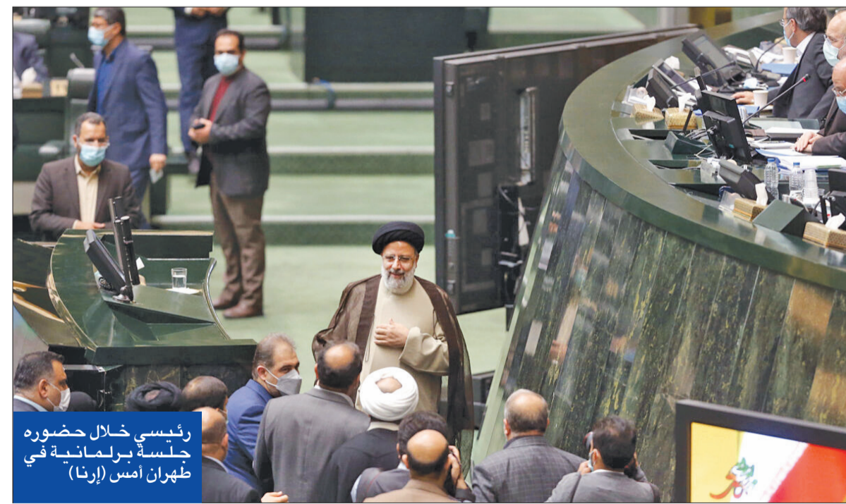
رئيسي خلال حضوره جلسة برلمانية في طهران أمس

إلى أن بلاده مازالت تشعر بقلق عميق من سلوك إيران في العراق وسورية ولبنان. وبينما بحث الرئيس الروسي فلاديمير بوتين مع نظيره الإيراني المفاوضات النووية المرتقبة وقضايا التعاون الثنائي والوضع في سورية وأفغانستان وقره باغ، أكد وزير الدفاع الإسرائيلي، بني غانتس، أن إسرائيل ستواصل مواجهة إيران على جميع الجبهات، بما في ذلك في الساحة الشمالية التي تشمل لبنان وسورية.