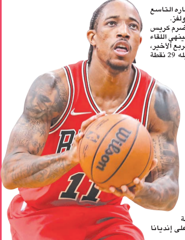
ديروزان نجم شيكاغو

البطل في الموسم الماضي، انتصاره التاسع توالياً بفوزه على مينيسوتا تمبولفرز. وتألّق في صفوف الفائز المخضرم كريس بول برمية ساهمت في تقدم فريقه، لينهي اللقاء وفي رصيده 21 نقطة، منها 19 في الربع الأخير، فيما برز زميله ديفن بوكر بتسجيله 29 نقطة ودياندرى إيتون مع 22. دالاس يهزم دنفر وفي دالاس، سجل الثنائي اللاتفي كريستابس بورزينغيس، والعملاق السلوفيني لوكا دونتشيتش 52 نقطة معاً، ليقلبا تأخر فريقهما دالاس مافريكس من 13 نقطة في الربع الثالث إلى فوز أمام دنفر تاغس 111-101. وأنهى بورزينغيس اللقاء مع 29 نقطة و11 مرئدة، فيما ساهم دونتشيتش بـ 23 وأضاف 11 تمريرة حاسمة و8 مرئدات، في مباراة شهدت تبدل هوية الفريق المتصدر أكثر من 13 مرة. وعاد نيويورك نيكس إلى نخمة الانتصارات بعد خسارتين بفوزه على إنديانا بايسرن 84-92.