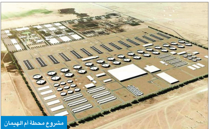
مشروع محطة أم الهيمنان

البيئة البرية والبحرية وصحة الفرد، وتخفيف التأثيرات السلبية على البيئة.