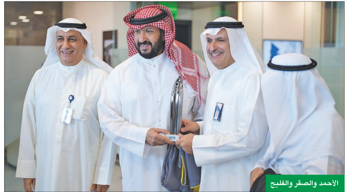
الأحمد والصقر والفليح