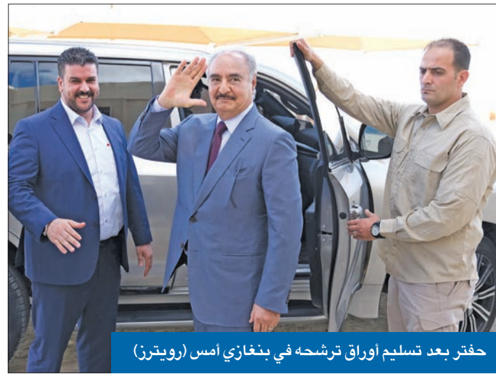
حفر بعد تسليم أوراق ترشحه في بنغازي أمس

في خطوة أكسبت الاستحقاق المقرر في 24 ديسمبر المقبل زخماً، رغم الشكوك الدائرة بشأن إتمامه، مع اتساع هوة الخلاف بين السلطتين القائميتين في غرب ليبيا وشرقيها، أعلن قائد قوات «الجيش الوطني» خليفة حفتر، ترشحه للرئاسة. وقال حفتر، في كلمة مصورة بثت بالترزامن مع تقديمه أوراق ترشحه في مدينة بنغازي، إن قراره «ليس طلباً للسلطة أو بحثاً عن مكانة، بل لقيادة شعبنا في مرحلة مصيرية نحو العزة والتقدم والأزدهار». وأضاف الرجل القوي بشرق ليبيا، أن لديه «أفكاراً لا تخضب وأعاوناً قادرين على إنجاز آمال الشعب»، داعياً الليبيين إلى ممارسة دورهم بدتوجيه أصواتكم، حيث يجب أن تكون، لنبدأ رحلة المصالحة والسلام»، في وقت تقف البلاد اليوم على مفترق طريقين، هما: الحرية والسلام والتقدم، والعبث والتوتر والخسائر». جاءت خطوة حفتر بعد يومين من تقديم سفد الإسلام، نجح الدكتاتور الليبي الراحل، أوراق ترشحه، لخوض السباق الرئاسي لمفوضية الانتخابات في سبها جنوب البلاد. في وسط توقعات بترشح عقيلة صالح رئيس البرلمان، الذي يتخذ من طبرق مقراً له، للانتخابات الرئاسية، هاجم رئيس حكومة الوحدة، عبدالحمد الدبيبة، قوانين الانتخابات التي أقرها البرلمان، واصفاً إياها بالمعيبة، و«المفصلة على مقاس أشخاص»، في إشارة إلى حفتر. وأكد رئيس الحكومة، التي