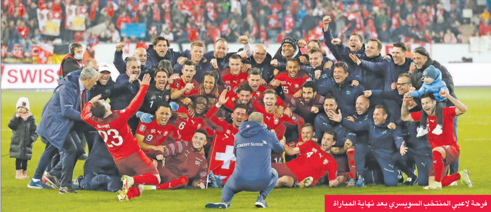
فرحة لاعبي المنتخب السويسري بعد نهاية المباراة

زاد منتخب سويسرا محنة منتخب إيطاليا. بعد أن قبل هديته بتعادله السلبي خارج قواعده أمام إيرلندا الشمالية، وأكرم ضيافة بلغاريا برباعية نظيفة. ليحجز مقعده في مونديال قطر العام المقبل، ضمن مواجهات الجولة العاشرة والأخيرة ضمن المجموعة الثالثة بالتصفيات.