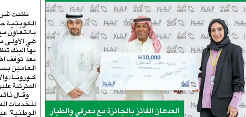
العدهان الفائز بالجائزة مع معرفي والطيار

شهرية بقيمة 5000 دينار لمدة 10 سنوات. وتجدر الإشارة إلى أنه سيكون بمقدور كل من عملاء البنك الأهلي