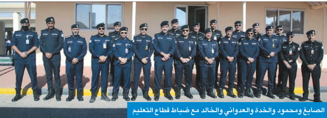
الصايغ ومحمود والخدة والعنواني والخالد مع صباط قطاع التعليم

تشهد عملية تطوير ميدانية لقسم الاختبار العملي، وقبل عدة أيام تم افتتاح قسم اختبار محافظة الأحمدية بعد أن تم تطويره ليتناسب مع آلية الاختبار الجديد، لافتاً إلى أن الأيام القليلة القادمة ستشهد أيضاً افتتاح قسم اختبار محافظة حولي ومبارك الكبير، والذي سيشهد نقلة نوعية في عملية الاختبار، لأنها تعد خط الأمان الأول للسائق إذا أرك معنى مدلول اللوحة الإرشادية. وأضاف أن أقسام الاختبار العامة للمرور للشؤون الفنية العميد محمد العنواني. وقال الخالد، لـ الجريدة، إن اللواء الصايغ اجتمع بقطاع التدريب في أكثر من مناسبة، وطلب منهم ضرورة تطوير آلية الاختبار النظرية والعملية، والتركيز على اللوحات الإرشادية في عملية الاختبار، لأنها تعد خط الأمان الأول للسائق إذا أرك معنى مدلول اللوحة الإرشادية. وأضاف أن أقسام الاختبار العامة للمرور للشؤون التعليمية العميد للمرور لشؤون التعليم الشيخ فواز الخالد أن أقسام الاختبار في المحافظات 6 تشهد حالياً عملية تطوير وتغيير جذرية تتناسب مع آلية الاختبار الجديدة المزمع تطبيقها قريباً جداً في سقي الاختبار النظري والعملي، والذي سيتناسب مع متغيرات الطريق العام، وما تشهده البلاد من إنشاء طرق وأنفاق وجسور جديدة في مختلف المحافظات.