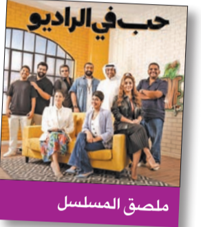
حب في الراديو

أطلقت الفنانة هيا عبدالسلام المصق الدعائي الرسمي لمسلسلها الجديد الرقمي «حب في الراديو»، معلنة انطلاق عروضه قريباً عبر إحدى المنصات الرقمية. وأوضحت هيا أن المسلسل تجربة درامية جديدة تقع في 10 حلقات، وهو من بطولة هيا إلى جانب زوجها الفنان فؤاد علي وياقة من النجوم كالفنانين أحمد العوان، وعبدالعزیز النصار، وخالد المظفر، وفرح الصراف، ومحمد عاشور، وأحمد المظفر، وبيبي العبدالمحسن، والعمل من إخراج سعود بو عبيد، وإنتاج شركة بي بروكتشن. من جانبه، قال المخرج سعود بو عبيد إن المسلسل انتهى تصويره في سبتمبر الماضي، وخضع للعمليات الفنية من مونتاج ومكساج وتصحيح ألوان، ويات جاهزاً للعرض خلال الأيام القليلة المقبلة.