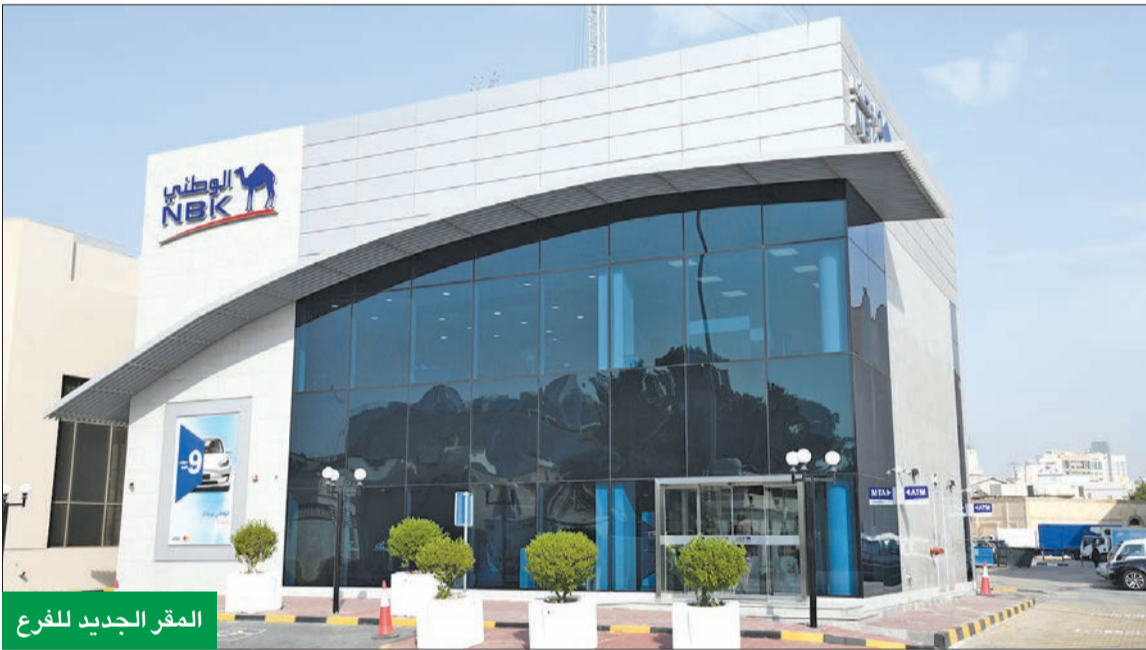
المقر الجديد للفرع

الفروع الجديدة تضاهي المستويات العالمية وتتكامل مع القنوات الإلكترونية لتقديم تجربة استثنائية للعملاء