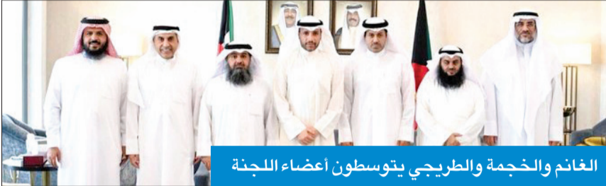
الغانم والخجعة والطريجي يتوسطون أعضاء اللجنة

استقبل رئيس مجلس الأمة مزروق الغانم أعضاء لجنة العجمان الخاصة بمتابعة أوضاع المواطنين شافي العجمي وشقيقه محمد الطريجي، والمواطن حجاج العجمي، وحضر اللقاء كل من النائبين مبارك الخجعة وعبدالله الطريجي.