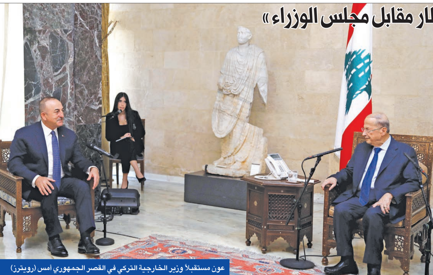
عون مستقبلاً وزير الخارجية التركي في القصر الجمهوري أمس