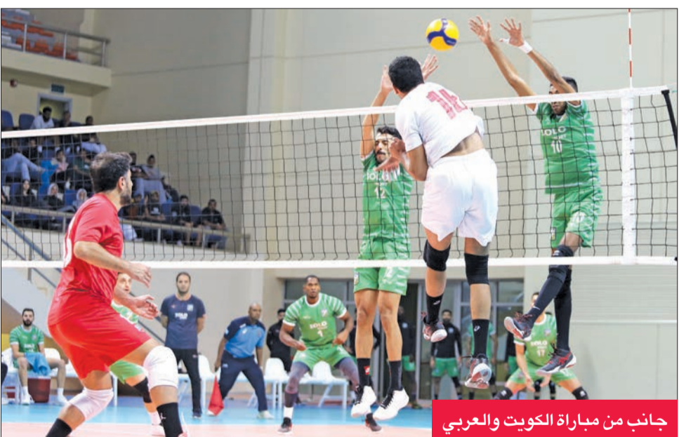
جانب من مباراة الكويت والعربي

حقق الفريق الأول لكرة الطائرة بنادي القادسية فوزه الثاني على