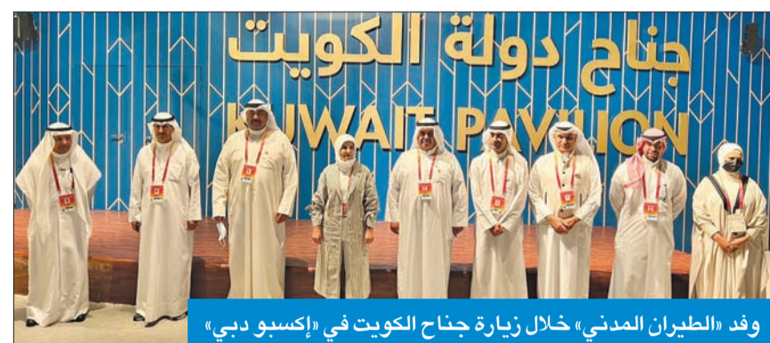
وفد «الطيران المدني» خلال زيارة جناح الكويت في «إكسبو دبي»

العتيبي: طاقته الاستيعابية 25 مليون مسافر سنوياً ويعتبر من أحدث مباني الركاب بالعالم