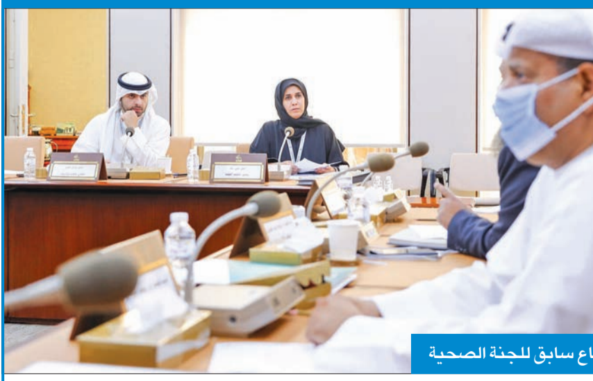
اجتماع سابق للجنة الصحية

وبناء على ذلك صدر القانون رقم 1 لسنة 2010 في شأن العمل بالقطاع الأهلي، وقد أحسن المشرع صنعا، إذ تضمن الفصل الأول من الباب الخامس منه المواد من 98 إلى 110 الإطار القانوني والنصوص القانونية في شأن منظمات العمال وأصحاب الأعمال وحق التنظيم النقابي، بما يتناسب والمتغيرات السياسية والاقتصادية والاجتماعية، وبما يساعد على تطور الحركة الحرة النقابية بالكويت، وبما يتفق مع أحكام دستور الكويت والاتفاقيات التي صدقت عليها في هذا الشأن.