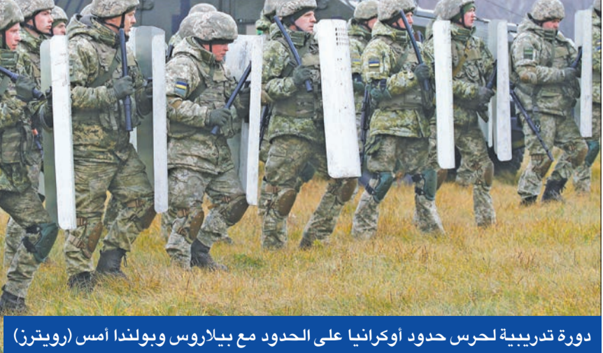
دورة تدريبية لحرس حدود أوكرانيا على الحدود مع بيلاروس وبولندا أمس

لوكاشينكو يهاتف ميركل ويطلب وساطة إماراتية في أزمة اللاجئين