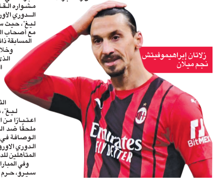
زلتان إبراهيموفيتش نجم ميلان

وخلافاً للنظام السابق الذي يؤهل أصحاب المركز الثالث في مجموعات دوري الأبطال مباشرة للدور الثاني من "يوروبا ليغ"، تخوض الأندية اعتباراً من الموسم الحالي ملحقاً ضد التي تحتل الوصافة في مجموعاتها في الدوري الأوروبي، لإكمال عقد المتاهلين للدور الثاني. وفي المباراة الثانية في سان سير، حرم رديف ليفربول