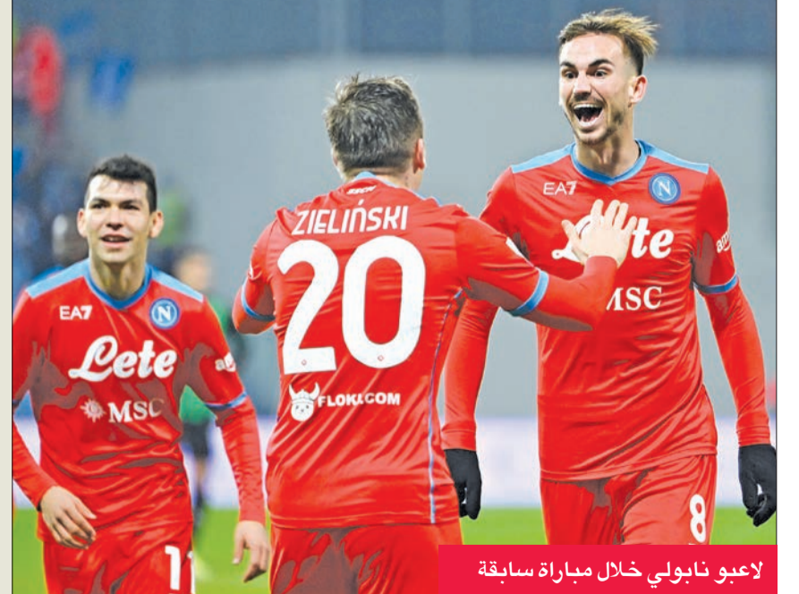
لاعبو نابولي خلال مباراة سابقة

صراع ثلاثي محتدم على المركزين الأولين ستشهده الجولة الأخيرة من دور المجموعات لمسابقة الدوري الأوروبي (يوروبا ليغ)، بين نابولي الإيطالي وضيفه ليدستر سيتي الإنكليزي اللذين يلتقيان في مواجهة قوية اليوم، وسيبارتاك موسكو الروسي الساعي لاستغلال نزلهما، عندما يحل على ليجيا وارسو في بولندا.