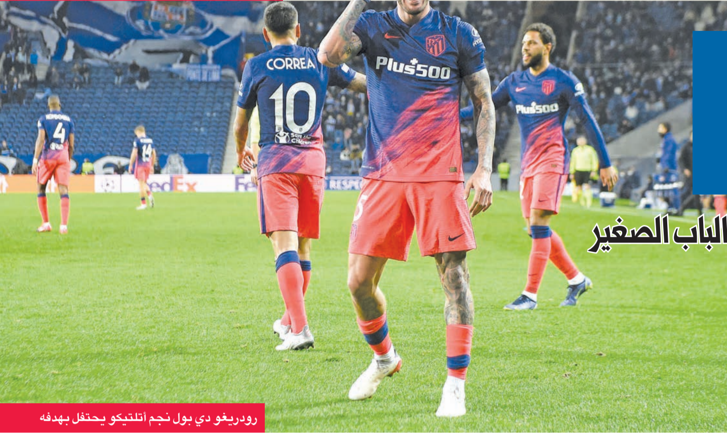
رودريغو دي بول نجم أتلتيكو يحتفل بهدفه