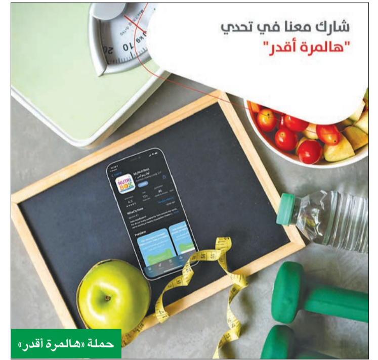
حملة "هالمره أقدر"

وأشار إلى أن تنفيذ برامج المسؤولية الاجتماعية لا يقتصر على إدارة معينة، بل نعبر كل إدارات وفروع البنك مسؤولين اجتماعيا ومشاركين رئيسيين في بناء المجتمع، لذا فإن موظفينا شركاء أساسيون في