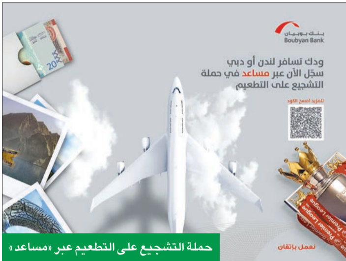
حملة التشجيع على التطعيم عبر «مساعدة»

وتعتبر "shighel.com" منصة تضم مجموعة متنوعة كبيرة ممن يطلق عليهم "فري لانسرز" أو المستقلين، والذين يستخدمون مواهبهم وخبراتهم في تقديم خدمات تسويقية مهمة وحيوية للشركات، مثل التصوير بكل الأشكال والتصميم بكل أنواعه، والإعلانات التسويقية، وكتابة النصوص، وغيرها مما يساعد على زيادة المبيعات.