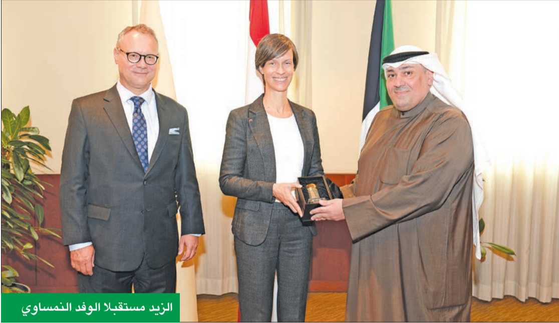
الزيد مستقبلاً الوفد النمساوي