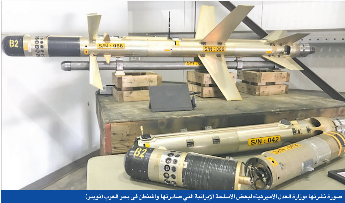
صورة نشرتها «وزارة العدل الأميركية» لبعض الأسلحة الإيرانية التي صادرتها واشنطن في بحر العرب

● فرضت عقوبات تشمل قائد «الباسيج» ● لندن لطهران: «آخر فرصة» لإحياء الاتفاق النووي