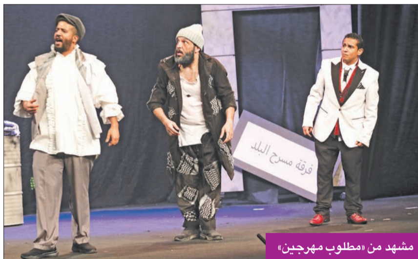
مشهد من «مطلوب مخرجين»

المسرحية كُتبت بطريقة ذكية وتحمل رسائل هادفة