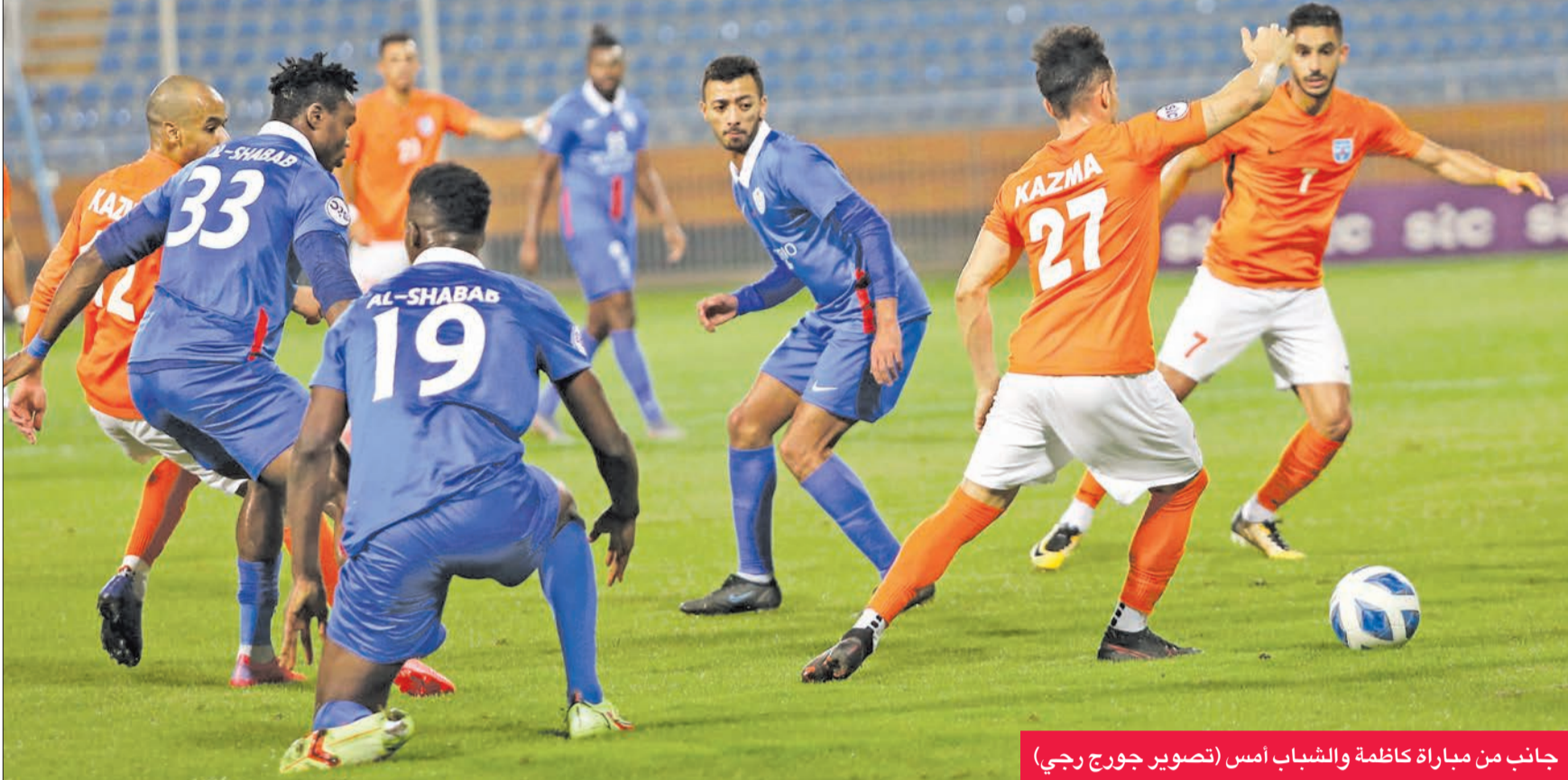
جانب من مباراة كاظمة والشباب أمس