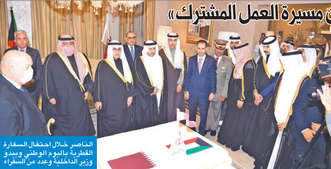
الناصر خلال احتفال السفارة القطرية باليوم الوطني ويبدو وزير الداخلية وعدد من السفراء

«أمل كبير أن تكون القمة الخليجية المقبلة مفصلية بشأن مسيرة العمل المشترك»