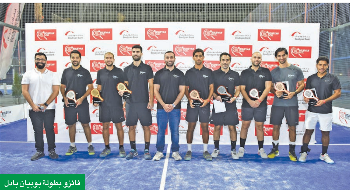
فائزو بطولة بوبيان بادل

البنك نظم أكبر حملة على مستوى الكويت للتشجيع على التطعيم استمرت 6 أشهر