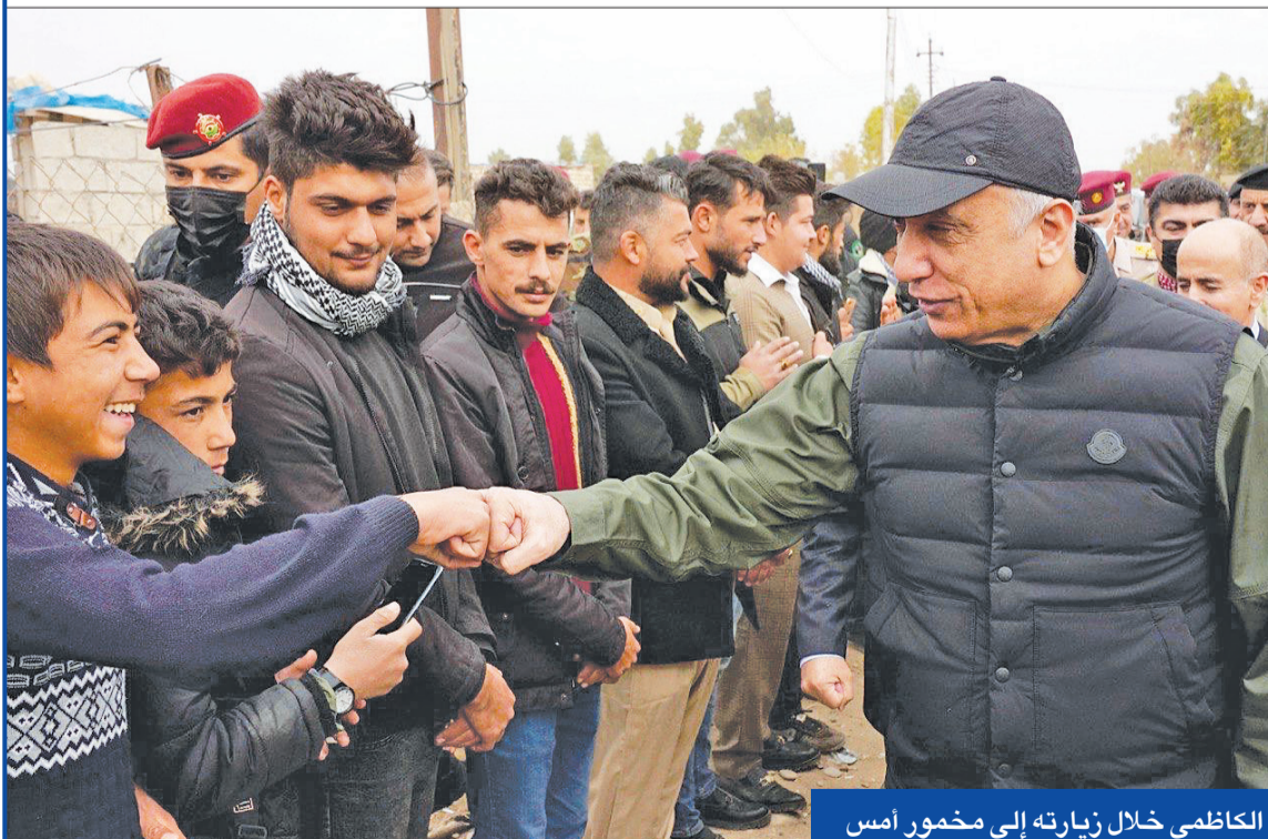
الكاظمي خلال زيارته إلى مخمور أمس

الصدر يدين اللجوء للعنف من أجل «بعض المقاعد»