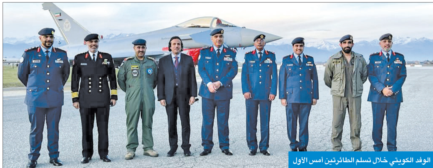
الوفد الكويتي خلال تسلم الطائرتين أمس الأول

أكد المدير التنفيذي لشركة الطائرات والفضاء لمجموعة ليوناردو ماركو زوف أن تسليم الطائرتين ليس نهاية مرحلة بل بداية جديدة هامة «المباراة التعاون الحقيقي». وقال زوف: اننا لا نسلم فقط اليوم أحدث وأكثر طائرات اليوروفايتر تقدماً وإنما نقدم خدمة دعم تقني كامل للقوة الجوية الكويتية ونظاماً كلياً حقيقياً، أي اننا لا نقدم مجرد طائرات بل خدمات وأرضية متقدمة لخلق نظام متكامل من أجل تنمية قدرات الكويت الدفاعية. وفي كلمته، رحب الرئيس التنفيذي لشركة يوروفايتر هيرمان كلاسين رسمياً بانضمام القوة الجوية الكويتية الى عائلة اليوروفايتر، موضحاً أن اليوروفايتر هي نتاج أكثر شركات التصنيع الأوروبية الدفاعية تقدماً، وتمثل العمود الفقري للدفاع عن أجواء أوروبا.