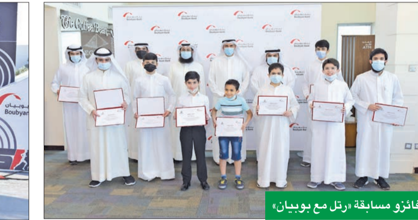
فائزو مسابقة "رتل مع بوبيان"