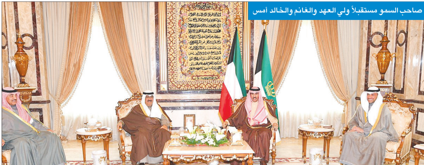
صاحب السمو مستقبلاً ولي العهد والغانم والخالد أمس

متمنياً سموه له كل التوفيق والسداد وموفور الصحة والعافية، وللعلاقات الطيبة بين البلدين الصديقين المزيد من التطور والنماء. وبعث سمو ولي العهد وسمو رئيس مجلس الوزراء ببرقتي تهنئة مماثلتين.