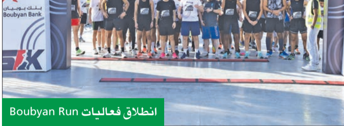
انطلاق فعاليات Boubyan Run

واستمر البنك في تنظيم برنامج "قصص بوبيان"،