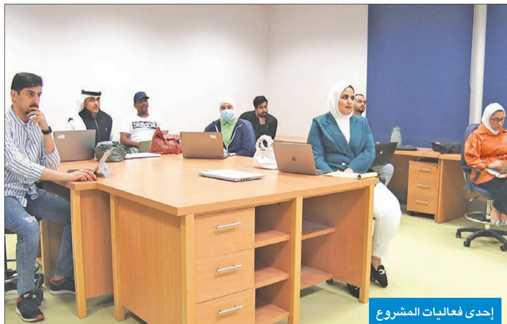
إحدى فعاليات المشروع