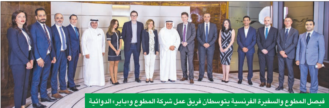
فصل المطوع والسفيرة الفرنسية يتوسطان فريق عمل شركة المطوع و«باير» الدوائية

أجل التوسع في تزويد الأسواق بالأدوية الضرورية للمرضى، وفي هذا السياق يعتبر تعزيز الشراكات الاستراتيجية مع شبكة الشركات المعتمدة لتوزيع منتجات باير في المنطقة ركيزة أساسية. وتعد شركة باير إحدى الشركات الألمانية الرائدة في مجال العقاقير الطبية والكيميائية، وبدأت عملياتها في منطقة الشرق الأوسط منذ أواخر ثمانينيات القرن التاسع عشر، حيث يقع المقر الرئيسي للشركة بالشرق الأوسط في مدينة دبي، ولديها هيئات تعليمية في قبرص ومصر والأردن والسعودية، ويتم التسويق لمنتجاتها في الدول الأخرى من خلال موزعين وكلاء خارجيين.