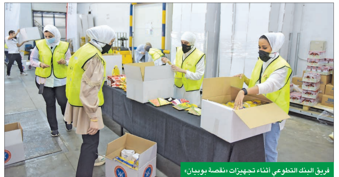
فريق البنك التطوعي أثناء تجهيزات «قصص بوبيان»