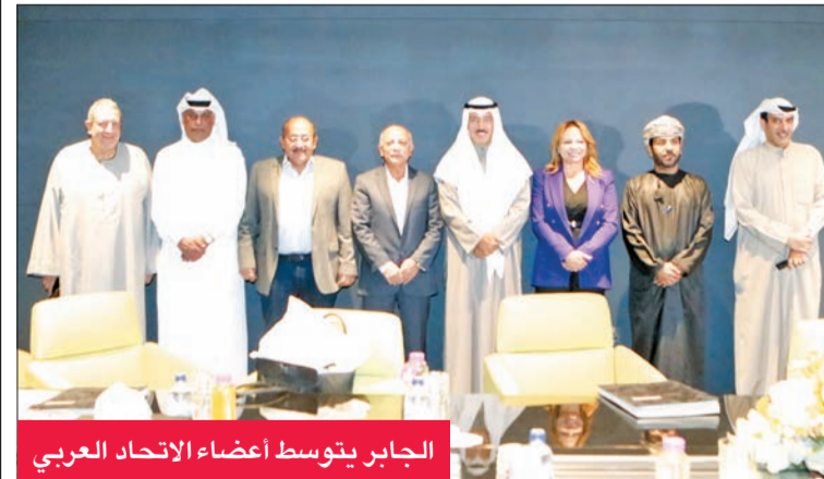
الجابر يتوسط أعضاء الاتحاد العربي

وصول إلى البلاد، أمس الأول، وفد منتخبنا الوطني للمعاقين بعد مشاركة ناجحة في دورة الألعاب البارالمبية الآسيوية الرابعة، التي اختتمت في العاصمة البحرينية المنامة أمس.