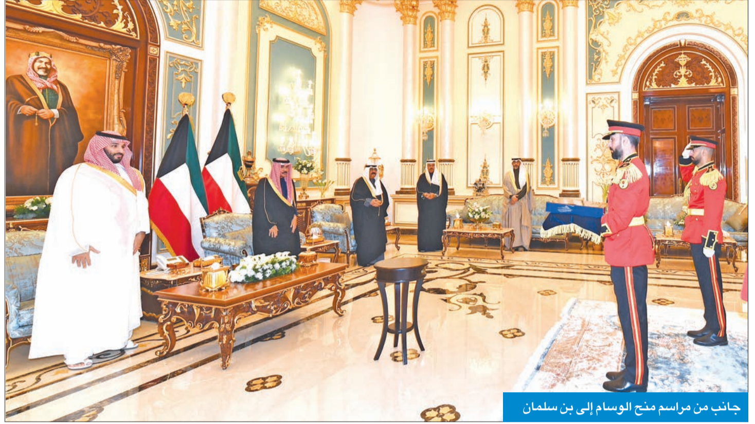
جانب من مراسم منح الوسام إلى بن سلمان