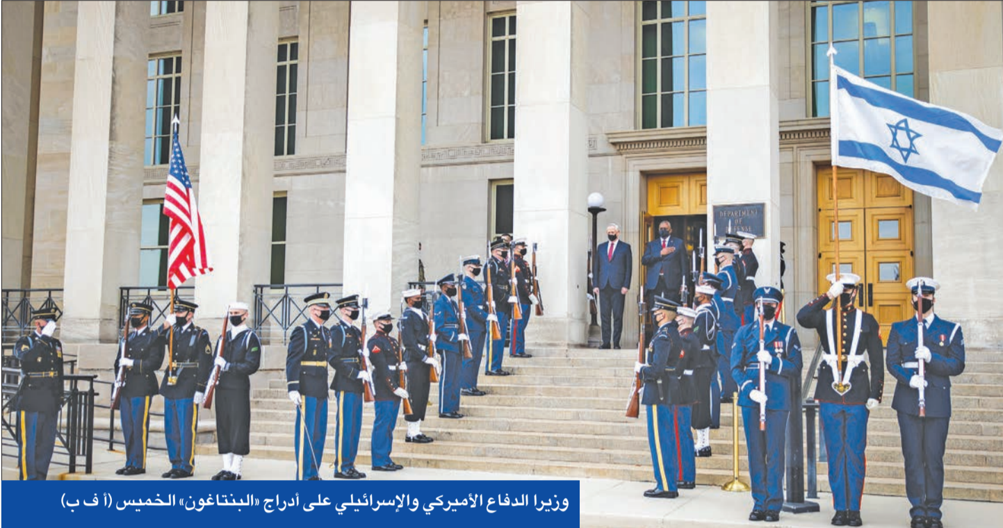
وزيرا الدفاع الأميركي والإسرائيلي على أدرج «البنتاغون» الخميس