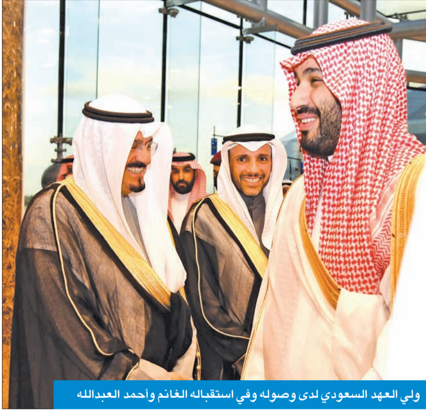
ولي العهد السعودي لدى وصوله وفي استقباله الغانم وأحمد العبدالله

أجواء ودية سادت المشاورات وعكست روح الأخوة ورغبة البلدين في المزيد من التعاون