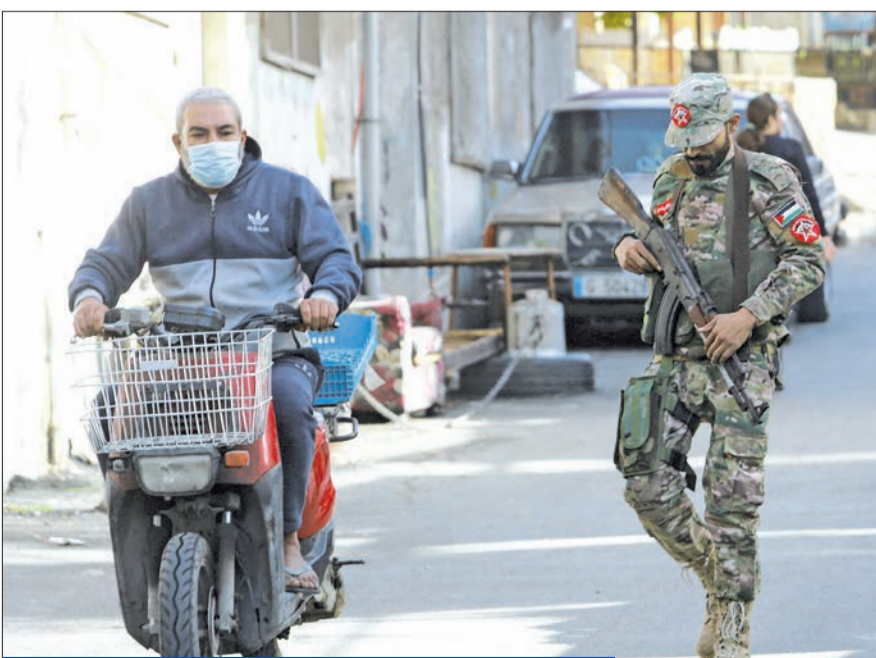
مسلح فلسطيني في مخيم الرشيدية في صور

في أحد مخازن السلاح التابعة لها، وأصرت على أنه ناتج عن انفجار عبوات أوكسجين، فإنه سيقتح الباب أمام انقسامات لبنانية داخلية مجدداً، تبدأ بالحديث عن السلاح الفلسطيني، لأنه يشكل خطراً على السكان. ويخالف مقررات الاتفاق على ضرورة نزع السلاح الفلسطيني من المخيمات. وعلى الأرجح ستعطف على ذلك مواقف سياسية داخلية وخارجية تصوب على سلاح حزب الله أيضاً، مما سيؤدي إلى ارتفاع منسوب الانقسام السياسي الداخلي. في الأثناء، قال رئيس مجلس النواب نبيه بري، إن البيطار يلعب بالنار، تعلقاً على إصدار القاضي على تنفيذ مذكرة توقيف بحق معاون بري السياسي الوزير السابق علي حسن خليل. وهذه أزمة مفتوحة على احتمالات متعددة، خصوصاً أن البيطار أصر على توقيف خليل من قبل قوى الأمن الداخلي، في حين يرفض المدير العام لقوى الأمن الداخلي اللواء عماد عثمان ذلك تحت عنوان الحفاظ على السلم الأهلي.