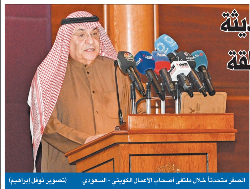
الصرقر متحدتاً خلال ملتقى اصحاب الأعمال الكويتي - السعودي