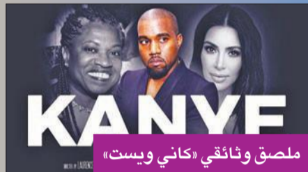
ملصق وثائقي «كاني ويست»

وتشمل العروض أيضاً أعمالاً وثائقية أخرى من بينها «وي نيد تو تارك أبوت كوسبي»، الذي يتناول قصة سقوط النجم التلفزيوني الأمريكي بيل كوسبي، و«ذي برينسس» عن حياة الأميرة ديانا ومقتلها.