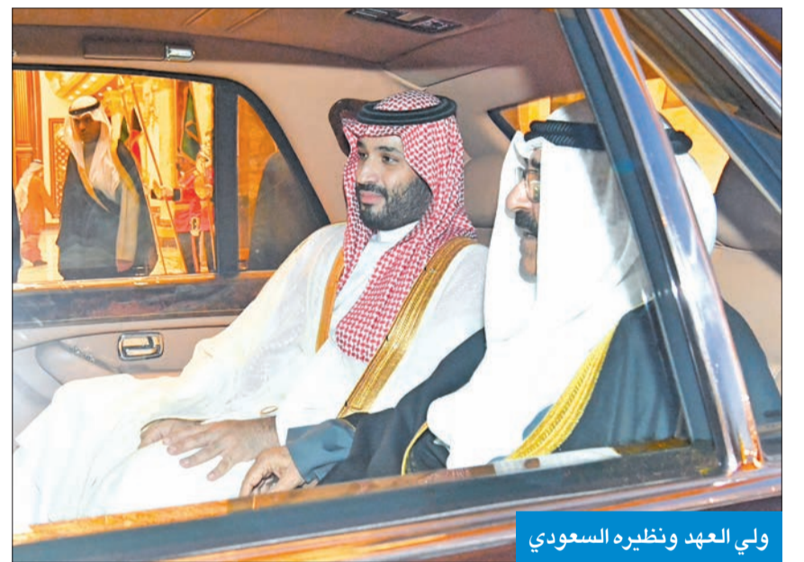
ولي العهد ونظيره السعودي