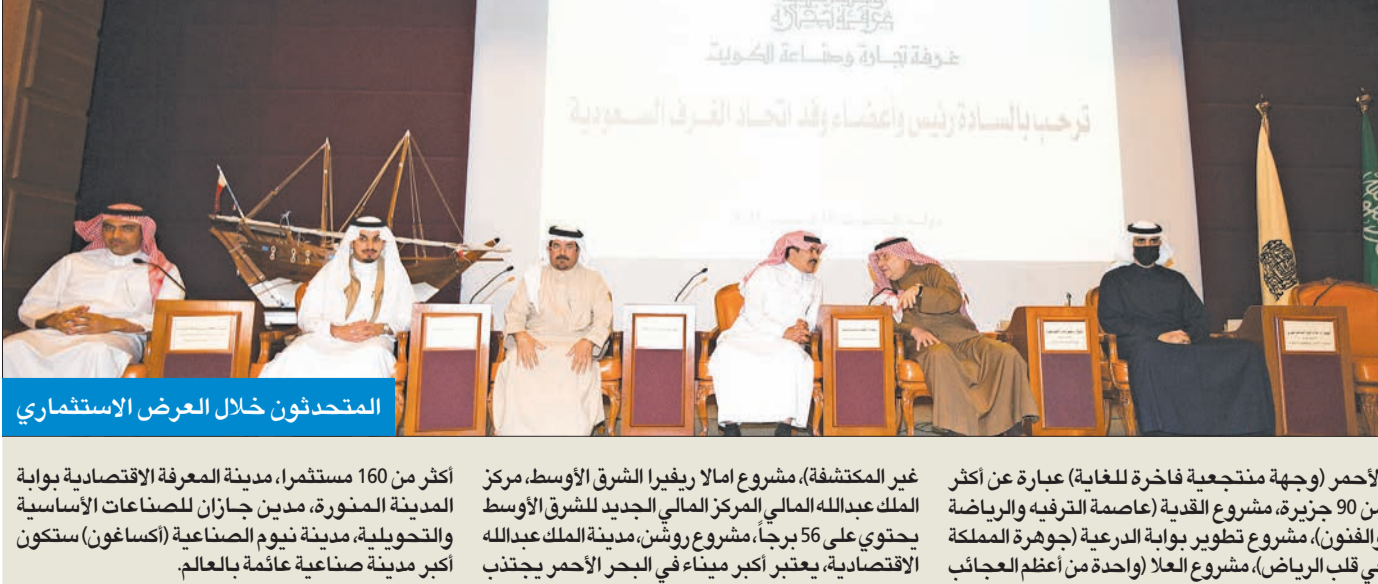
المتحدثون خلال العرض الاستثماري

أكثر من 160 مستقراً، مدينة المعرفة الاقتصادية بوابة المدينة المنورة، مدين جازان للصناعات الأساسية والتحويلية، مدينة نيوم الصناعية (أكساغون) ستكون أكبر مدينة صناعية عائمة بالعالم.