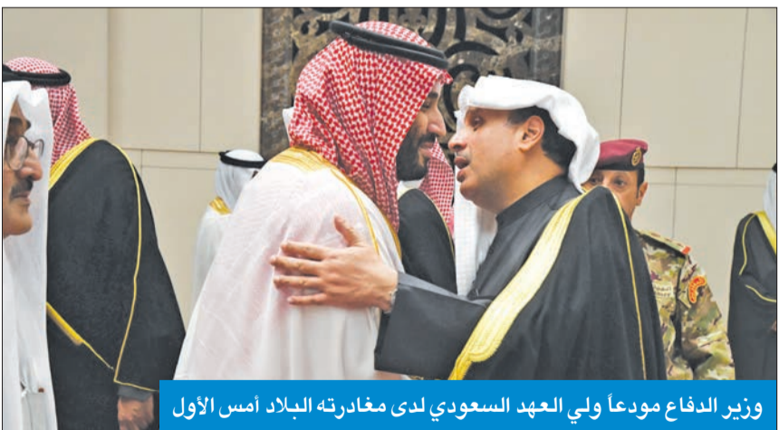
وزير الدفاع مودعا ولي العهد السعودي لدى مغادرته البلاد أمس الأول

الجانبان أكدا عزمهما تطوير التنسيق في المجالات الدفاعية والعسكرية