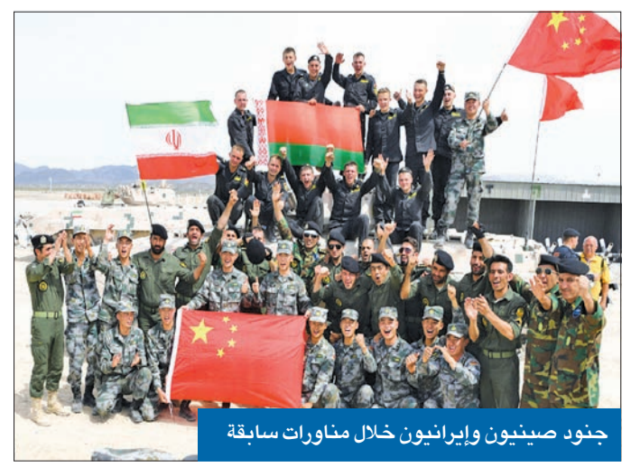
جنود صينيون وإيرانيون خلال مناورات سابقة

كشف مصدر مطلع في وزارة الدفاع الإيرانية أن الصين زودت إيران منذ نحو شهرين برفاقات إلكترونية تحتاجها لتصنيع أنظمة رادار وصواريخ تعمل باشعة الليزر، زاعماً أن طهران استخدمت بعض هذه القطع في تجارب لتصنيع أنظمة دفاعية جديدة تم تركيب واختبار أجزاء منها الأسبوع الماضي. وحسب المصدر، فإن الإيرانيين لديهم المعرفة التكنولوجية لتصنيع هذه الأنظمة منذ مدة، لكن المشكلة الأساسية التي كانوا يواجهونها تكمن في عدم قدرتهم على الوصول إلى رفاقات إلكترونية تملكها فقط الولايات المتحدة وروسيا، مضيفاً أن مطالباتهم المتكررة