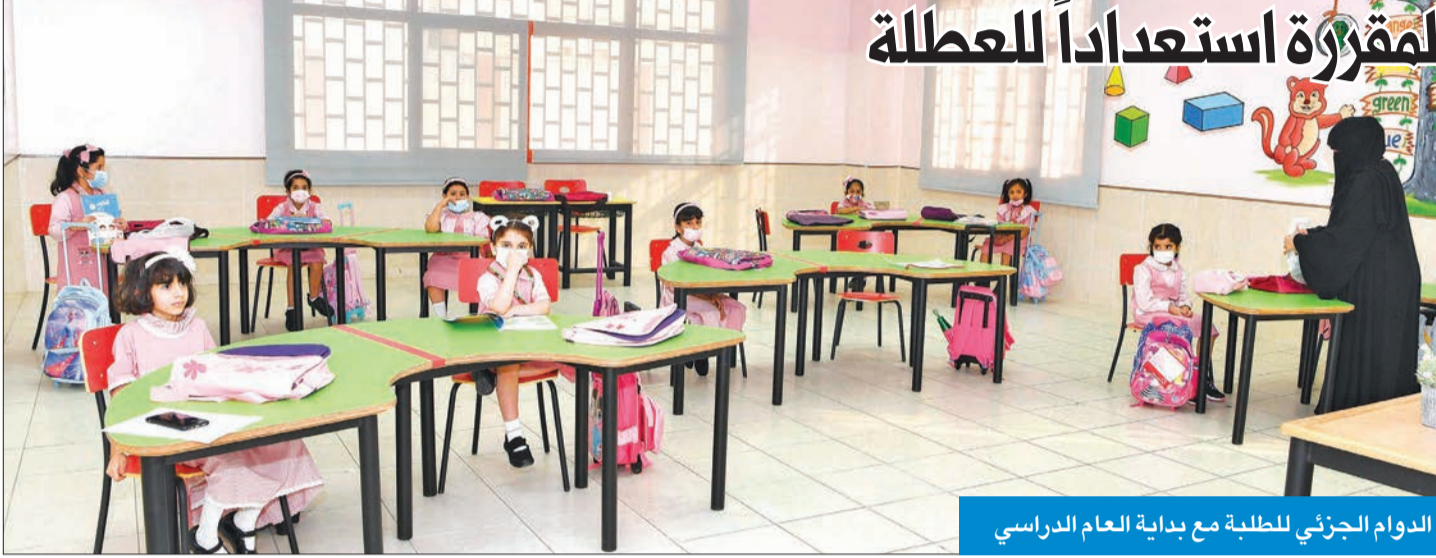
الدوام الجزئي للطلبة مع بداية العام الدراسي

● مدارس كثيرة بدأت «سلق» الدروس المقررة استعداداً للعطلة