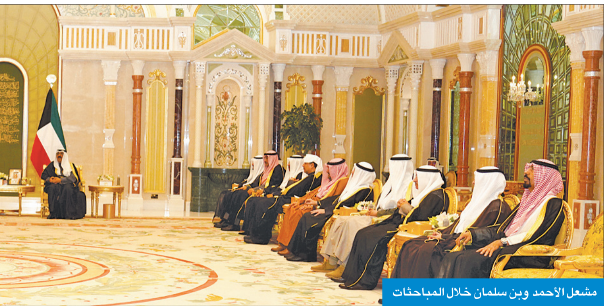
مشعل الأحمد وبن سلمان خلال المباحثات

مجلس التعاون الخليجي. حضر اللقاء نائب رئيس الحرس الوطني الفريق أول متقاعد الشيخ أحمد السواف ووزير شؤون الديوان الأميري الشيخ محمد بن عبدالعزيز ورئيس الديوان الأميري الشيخ مبارك السعود. وصرح عبدالله بأن اللقاء استعرض العلاقات الأخوية التاريخية والراسخة التي تربط الأسرتين الكريمتين والبلدين والشعبين الشقيقين في ظل ما يجمعهما من وصالح القربى والأخوة وسبل تعزيز أواصر التعاون المشترك بينهما