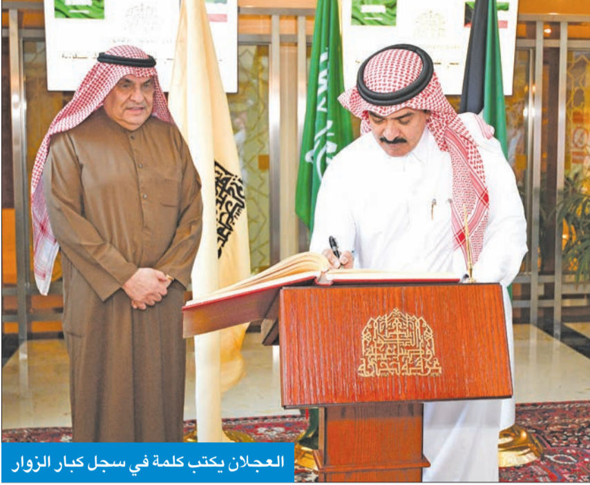
العجلان يكتب كلمة في سجل كبار الزوار