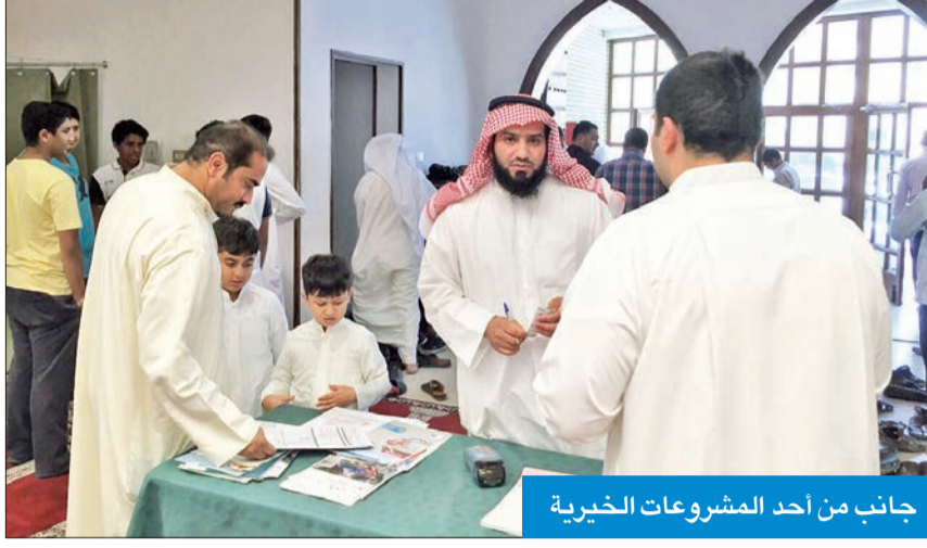
جانب من أحد المشروعات الخيرية

ضوابط وآليات جديدة وضعتها وزارة الشؤون للموافقة على طلبات الجهات الخيرية المرخصة الراغبة في تنفيذ المشروعات الخيرية والإنشائية للعام المقبل داخل الكويت وخارجها.