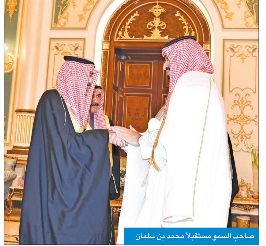
صاحب السمو مستقبلاً محمد بن سلمان