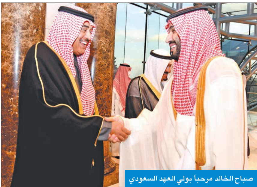
صباح الخالد مرحباً بولي العهد السعودي

أشاد رئيس مجلس الأمة مرزوق الغانم بنتائج زيارة سمو ولي العهد السعودي صاحب السمو الملكي الأمير محمد بن سلمان بن عبدالعزيز لدولة الكويت، مؤكداً أنها لبنة جديدة مهمة في صرح العلاقات التاريخية بين المملكة العربية السعودية الشقيقة والكويت. وقال الغانم في تصريح صحفي إن زيارة الأمير محمد بن سلمان لبلده الثاني الكويت ضمن جولته الخليجية مهمة جداً؛ لأنها تأتي في توقيت مهم، وفي ظل ظروف إقليمية تحتاج فيها دول مجلس التعاون الخليجي لأقصى درجات التعاون والتنسيق بينها.