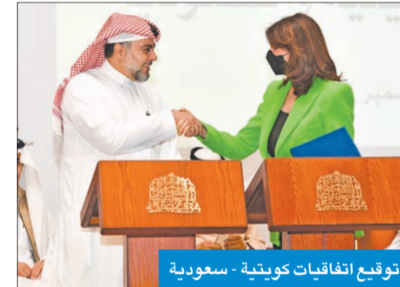
توقيع اتفاقيات كويتية - سعودية

● قيمة الصادرات السعودية في 2020 انخفضت بنسبة 15% عن قيمتها في 2019 في حين تراجعت الصادرات الكويتية للمملكة بنسبة 14%. مما أدى إلى تراجع حجم التبادل التجاري بين الدولتين بنسبة 15% مع وجود فائض في الميزان التجاري السعودي بنحو 4.4 مليارات ريال.