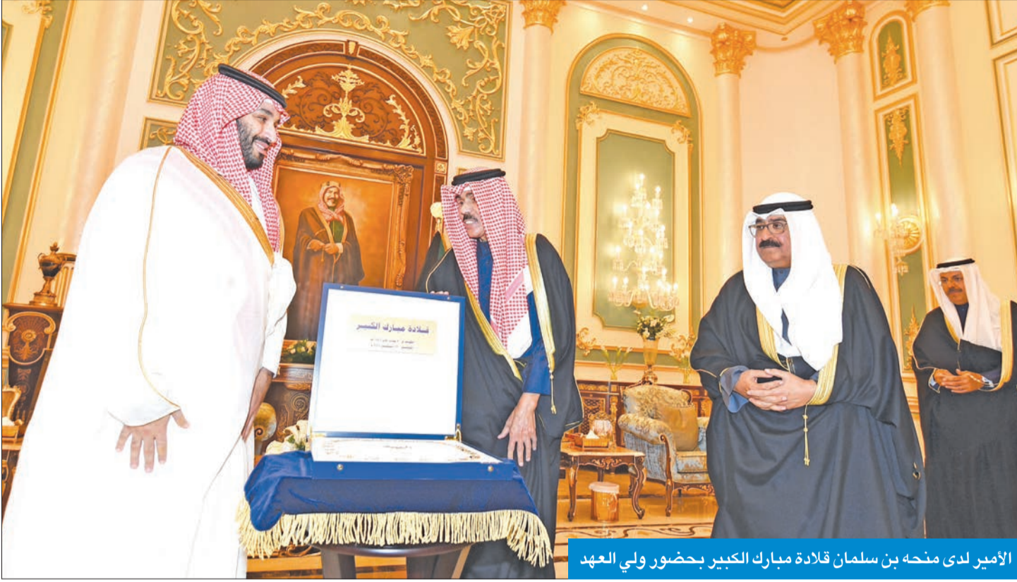
الأمير لدى منحه بن سلمان قلادة مبارك الكبير بحضور ولي العهد

العدالة: اللقاء استعرض العلاقات الراسخة والرغبة المشتركة في تعزيز التعاون