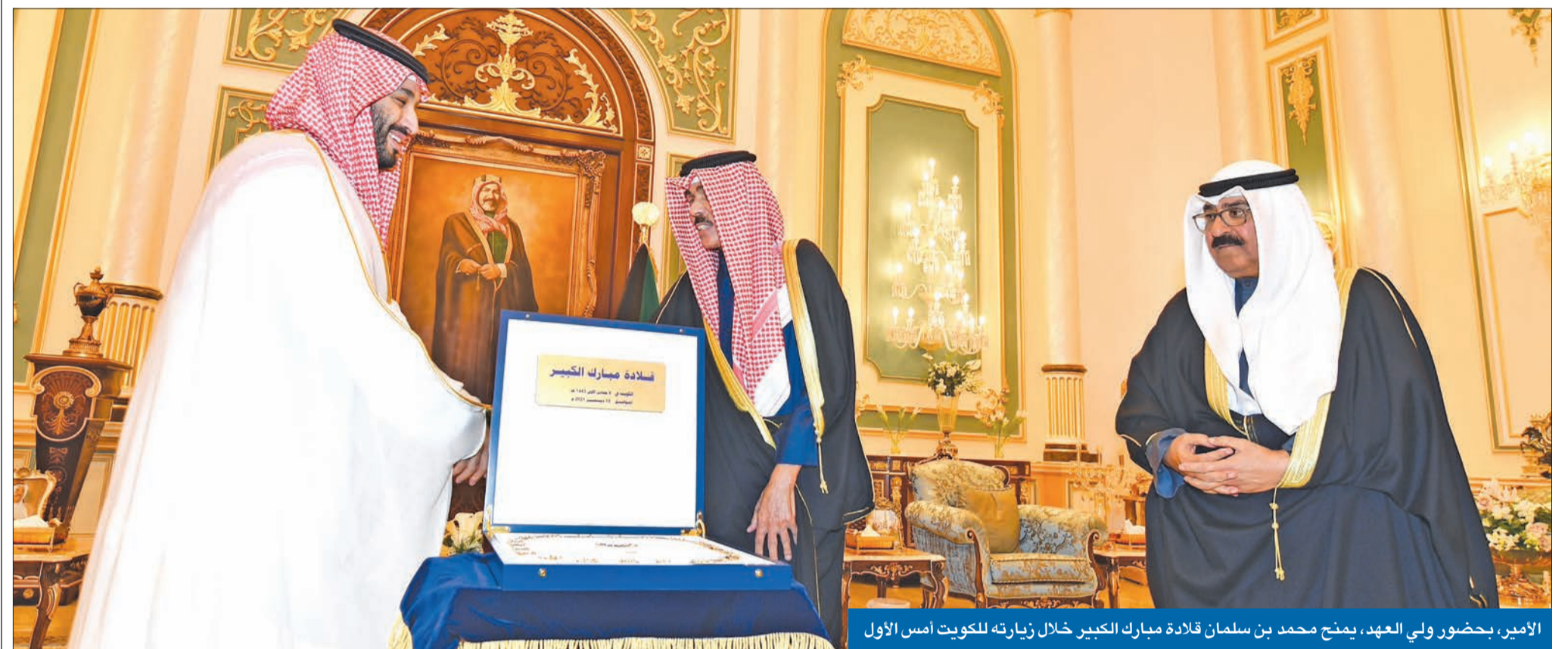
الأمير، بحضور ولي العهد، يمنح محمد بن سلمان قلادة مبارك الكبير خلال زيارته للكويت أمس الأول

مجلس التنسيق بين البلدين انعكاس لرغبة القيادتين في تحقيق النقلة المطلوبة بمجالات التعاون ضرورة استكمال وحدة دول الخليج والمنظومتين الدفاعية والأمنية العمل لزيادة إنتاج الخفجي والوفرة والتنسيق بين الشركات العاملة بالمنطقتين المقسومة والمغمورة