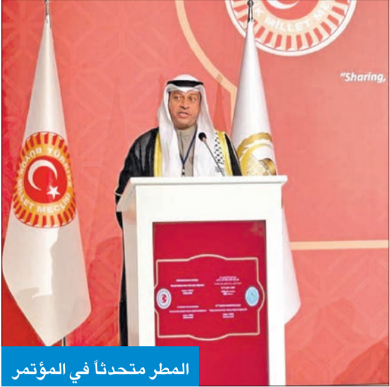
المطر متحدناً في المؤتمر

أكد أمين سر الجمعية البرلمانية النائب د. حمد المطر ضرورة حل الملفات والقضايا الإسلامية "من منطلق وعي الأمة، وإيقاظ الضمير الحي لدى المسلمين".