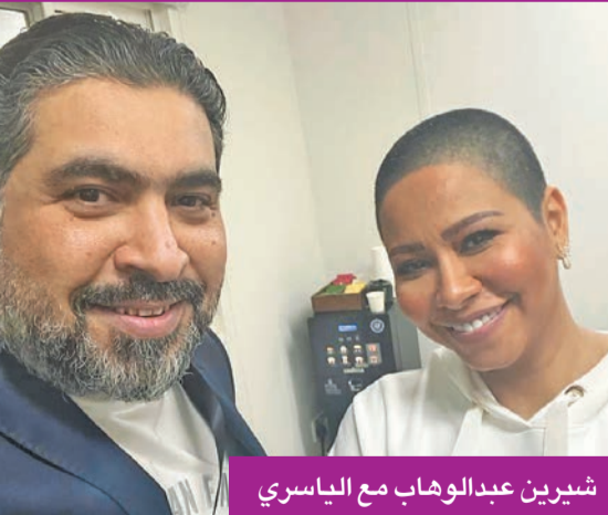
شيرين عبدالوهاب مع الياسري

ظهرت الفنانة المصرية شيرين عبدالوهاب حلقة الشعر في أول إطلالة لها بعد إعلان طلاقها على مسرح مهرجان أم الإمارات في أبوظبي، وشكلت مفاجأة كبيرة للجمهور الحاضر في الحفل، ولجمهور الوطن العربي عبر منصات التواصل الاجتماعي. وقالت شيرين خلال حديثها على المسرح: «مبسوطة اني معاكم، ويا رب تقبلوني بشكلي ده. أنا كده فقت، ووسط صحبات الجمهور المتفاجئ بجراتها والفرح بظهورها من جديد عبر مهرجان أم الإمارات، من خلال شركة الياسري للإنتاج الفني، متمنية بالمرح والممتج صلاح الياسري، الذي أكد حماس شيرين في الكوليس للظهور أمام الجمهور بهذا «اللون» الجديد، وقال: «الفنانة شيرين فنانة كبيرة وتحترم جمهورها، وكانت متحمسة للظهور بهذا اللون (حلقة الشعر) قبل الحفل، ولسماع ومشاهدة ردة فعل الجمهور، والتي أبدت احترامها ومحبتها له، حيث أعربت أنها مشتاقة للقاء على مسرح مهرجان أم الإمارات».