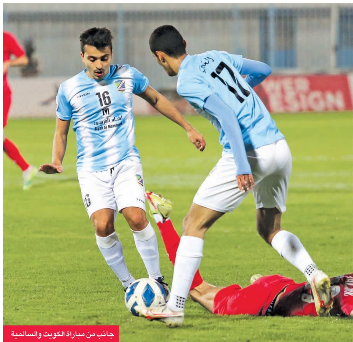
جانب من مباراة الكويت والسموية

إلى ذلك، كشف جدول ترتيب البطولة عن عدم استفادة العربي والسموية من فوزهما على الفحيحيل والكويت، إذ ظل الفريقان في المركزين الخامس والسادس على التوالي، بعدما رجحت الأهداف كفة الأخضر، إلى جانب معاناة فرق التضامن (3 نقاط)، والفحيحيل (نقطتين)، والشباب (نقطة)، والبرموك (بلا نقاط)، علماً بأن التضامن يقدم مستويات جيده لا تتناسب مع نتائجه.