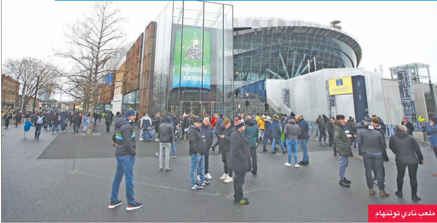
ملعب نادي توتنهام

بجروتوكولات البريميرليغ، وطالب مانشستر يونايتد بإعادة جدولة المباراة، وردت «البريميرليغ» باتخاذ قرار بتأجيلها، بعد العودة لمعايير مستشاريها الطبيين.