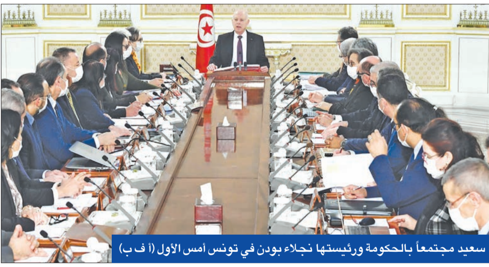
سعيد مجتمعاً بالحكومة ورئيستها نجلاء بون في تونس أمس الأول (أ ف ب)

ودعي للمشاركة في الاقتراع 2.5 مليون ناخب. لكن الحملة الانتخابية لم تبدأ بعد، وأرجى نشر لائحة المرشحين النهائية إلى موعد لم يحدد، مما يجعل حصول