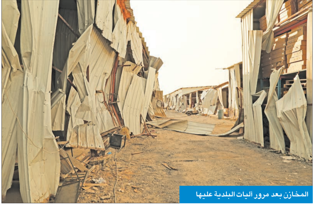
المخازن بعد مرور آليات البلدية عليها

وثن الغيث الفرق المساندة لفرق إزالة البلدية ومن تلك الفرق فريق الضبطية القضائية في وزارة الكهرباء والماء الذي قام بقطع التيار الكهربائي عن تلك القسائم بناء على كتب سابقة، إضافة إلى وزارة الداخلية، والهيئة