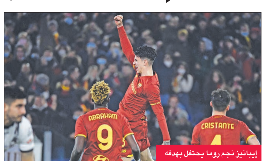
إيبانيز نجم روما يحتفل بهدفه

في المقابل، منى سبيتسيا بخسارته الحادية عشرة هذا الموسم والرابعة في مبارياته الخمس الأخيرة التي لم يذق فيها طعم الفوز فتجمد رصيده عند 12 نقطة في المركز السابع عشر.