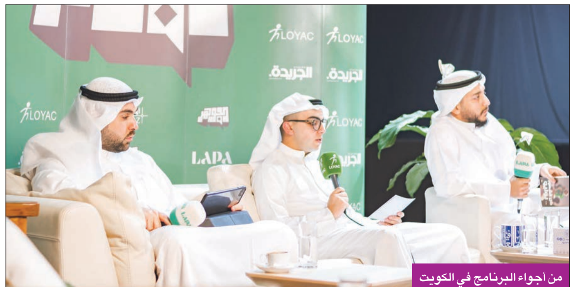
من أجواء البرنامج في الكويت