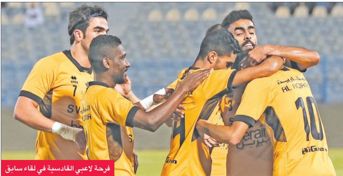
فرحة لاعبي القادسية في لقاء سابق