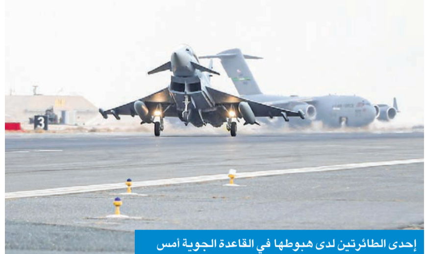
إحدى الطائرتين لدى هبوطها في القاعدة الجوية أمس