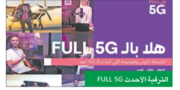
الترقية الأحدث Full 5G

والموقع الإلكتروني وأجهزة الخدمة الذاتية "kiosk"، بما يوفر رحلة مبسطة وسلسلة للعملاء في كل مكان. وأكد: "تأخذ الترقية الكاملة لتقنية Full 5G تجربة العملاء إلى بعد آخر في خطوة إلى الأمام لتعزز تجربة العميل داخل المياني باستخدام تكنولوجيا Full 5G، فضلاً عن الحفاظ على سرعات إنترنت عالية متوازنة. وسنواصل تنفيذ استراتيجياتنا لتطوير شبكة الجيل الخامس، واستكشاف وتقديم حلول مبتكرة يمكن للعملاء الاستفادة منها للتفاعل مع عالم الإنترنت".