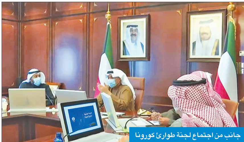
جانب من اجتماع لجنة طوارئ كورونا

أكد وزير الصحة الشيخ د. باسل الصباح، أن الوضع الصحي في الكويت مستمر بالاستقرار، والأرقام جيدة رغم ملاحظة الارتفاع الطفيف في عدد الإصابات، مشدداً على أنه لم يتم رصد أي حالة إصابة أخرى بمنحور «أوميكرون» في البلاد. وقال د. باسل، في تصريح عقب اجتماع اللجنة الوزارية لطوارئ كورونا أمس، برئاسة نائب رئيس الوزراء وزير الدفاع الشيخ حمد الجابر، إنه لوحظ وجود حالات إيجابية (بكورونا) لمواطنين قادمين من أوروبا في الأيام الماضية تزيد على المعدلات السابقة، مما يثير التساؤلات والقلق.