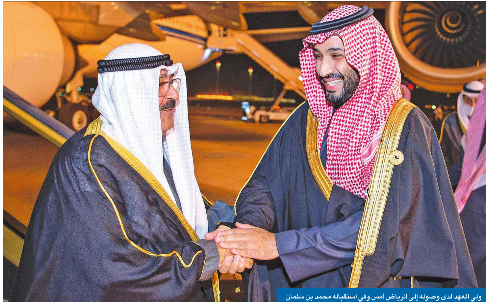
ولي العهد لدى وصوله إلى الرياض أمس وفي استقباله محمد بن سلمان

بيان «الرياض الختامي»: الهجوم على دولة في «التعاون» هجوم على أعضاء المجلس جميعاً بن سلمان يدعو إلى استكمال «الوحدة»... وحل فعال لأزمة «النووي» الإيراني