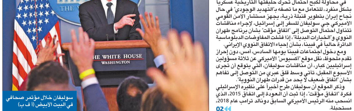
سوليفان خلال مؤتمر صحفي في البيت الأبيض