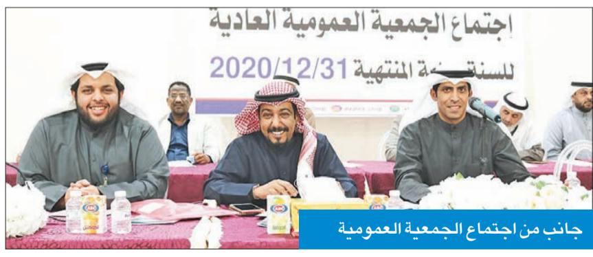
جانب من اجتماع الجمعية العمومية

بمدرسة الواحة الابتدائية، وتسهيل الإجراءات للمساهمين لحضور الاجتماع، شاكرًا رجال الأمن على حضورهم الجمعية العمومية وتنظيم عملية الدخول. وأشار إلى أنه سيتم تحويل أرباح 2020 إلى حسابات المساهمين البنكية نهاية الأسبوع، على أن تودع تدريجياً في مختلف البنوك، بالتعاون مع بيت التمويل الكويتي، داعياً المساهمين الذين لم يتقدموا بكتابات الإيذان المختم من البنك إلى تسليمه فوراً لقسم المساهمين خلال مواعيد العمل الرسمي، حتى يتسنى للجمعية تحويل الأرباح المستحقة على حساباتهم البنكية.