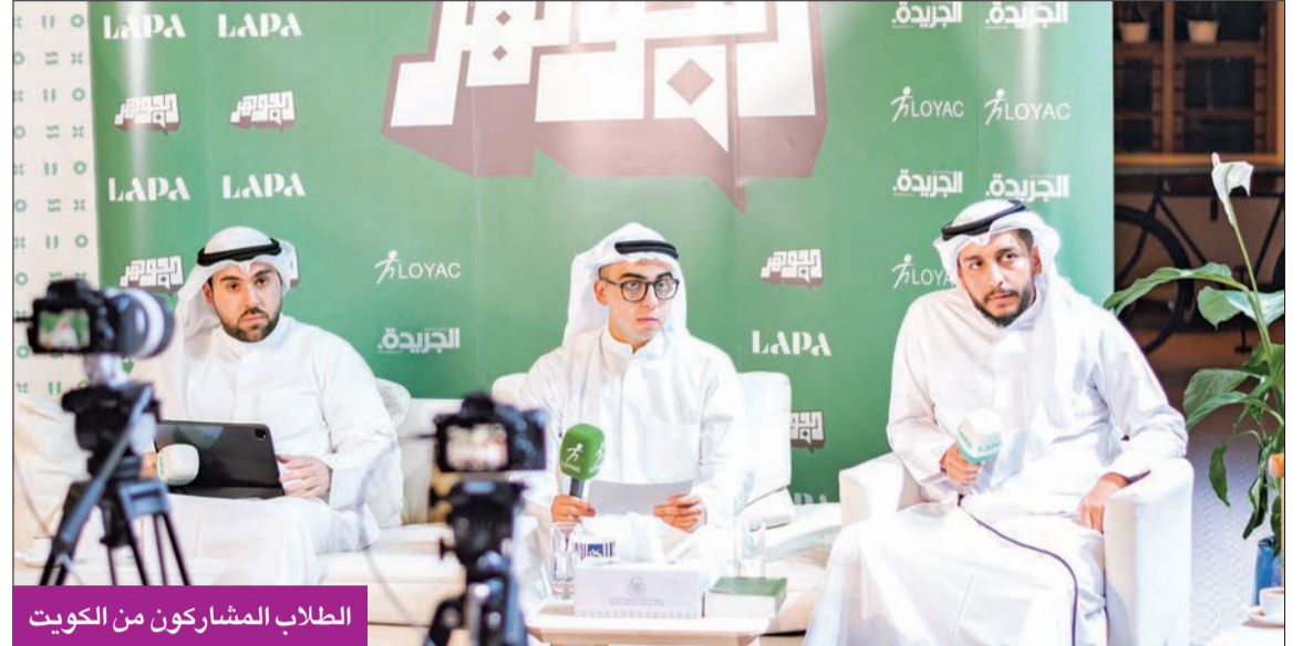
الطلاب المشاركون من الكويت