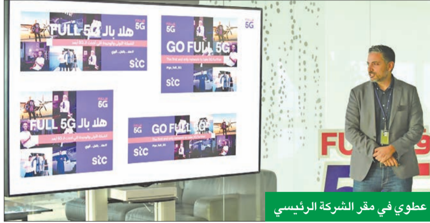
عطوي في مقر الشركة الرئيسي