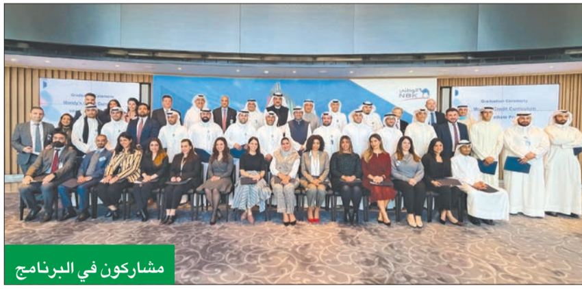
مشاركون في البرنامج

العبلاني: موظفونا ثروتنا الحقيقية... ونستثمر بقوة لتطوير مهاراتهم المهنية