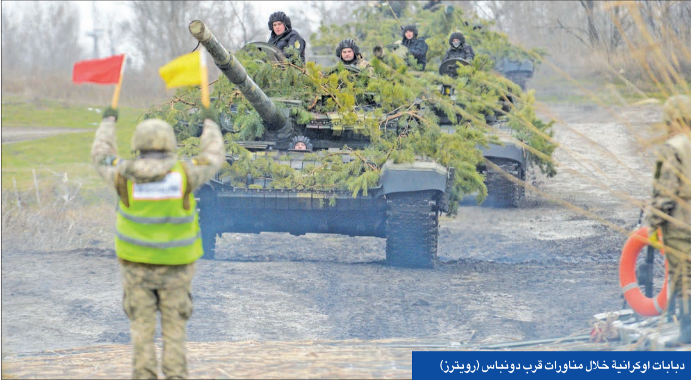
دبابات اوكرانية خلال مناورات قرب دونباس

● موسكو تتعقب فرقاطة فرنسية في «الأسود» ● بليكن: بكن تضر بالتجارة في البحر الجنوبي