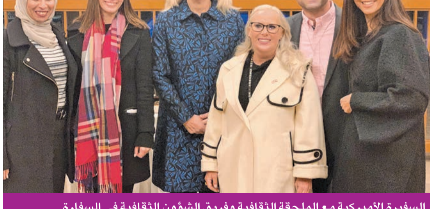
السفيرة الأميركية مع الملحقة الثقافية وفريق الشؤون الثقافية في السفارة

لرفع الوعي وتشجيع الموظفين على المشاركة في المبادرات الاجتماعية