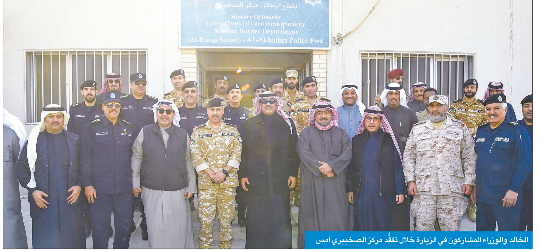
الخالد والوزراء المشاركون في الزيارة تفقد مركز الصخيري امس