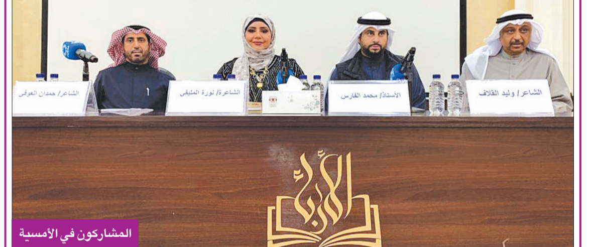
المشاركون في الأمسية