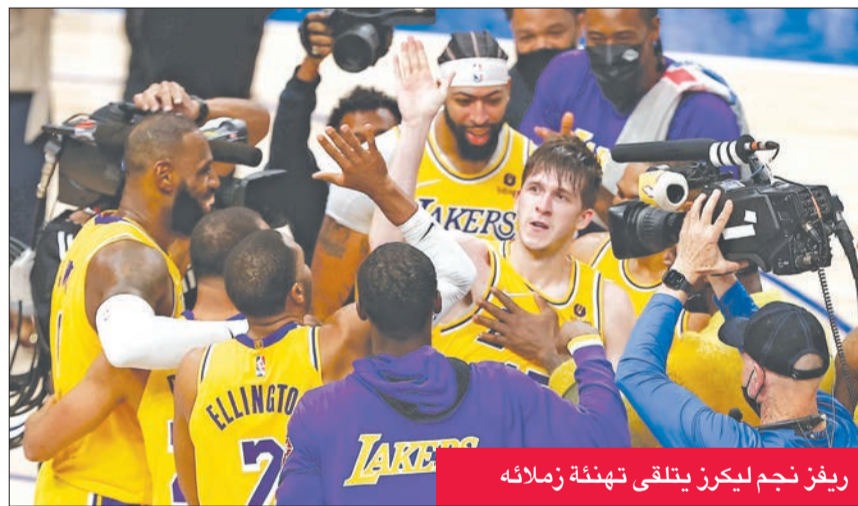
ريفز نجم ليكرز يتلقى تهنئة زملائه

يقود تشارلوت هورنتس للفوز 131-115 على مضيفه سان أنتونيو سبيرز. سجل ديفونتي غراهام ثلاثية قاتلة من على بعد قرابة 18.5 متراً، هي الأبعد في تاريخ الدوري، مع صافرة النهاية التي تمنح