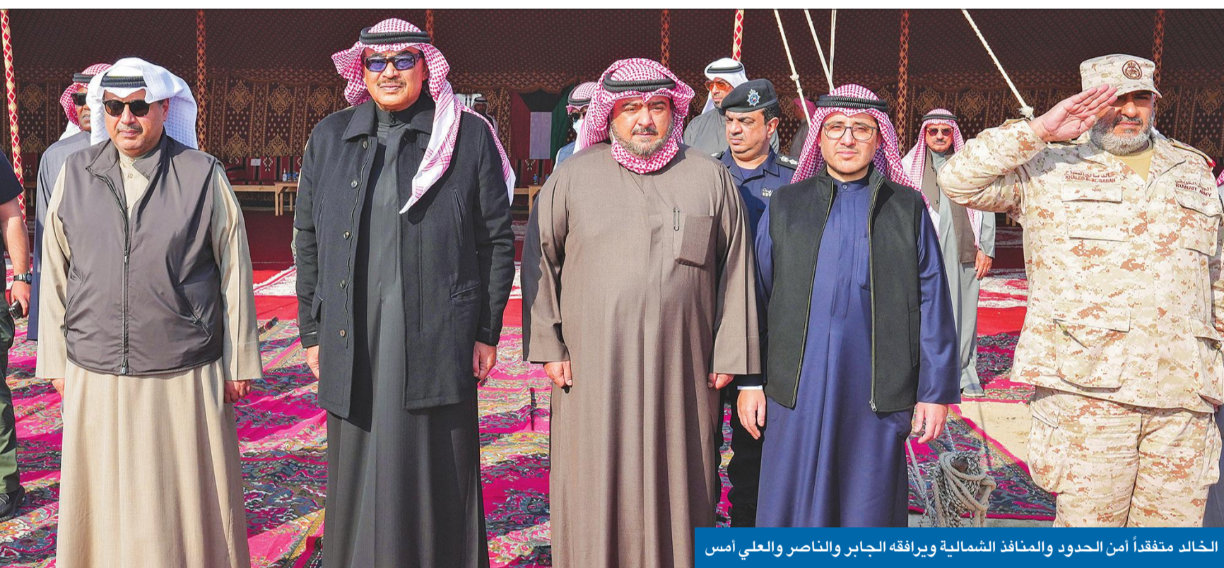
الخالد متفقدًا أمن الحدود والمنافذ الشمالية ويرافقه الجابر والناصر والعلي أمس

● العلي: ماضون في تطوير قطاعات الوزارة والارتقاء بمستوى منتسبيها