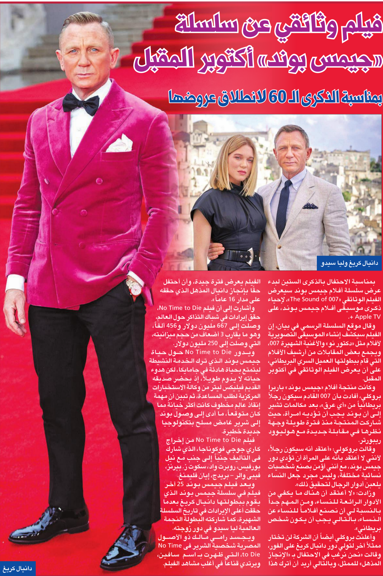
دانيال كريغ وليا سيدو

ولوحة «الفتاة مع البالون» لفنان الشارع البريطاني بانكسي، وحذاء كاني ويست. ودخلت القطع الرقمية بتقنية الرموز غير القابلة للاستبدال (NFT) بقوة إلى سوق الفن عام 2021، إذ بيع مثلا البرنامج التأسيسي لشبكة الإنترنت بشكلها الحالي في مقابل 5.4 ملايين دولار، لكن إجمالي مبيعات «NFT» لدى «سونديز» لابرال منخفضاً نسبياً (100 مليون عام 2021).