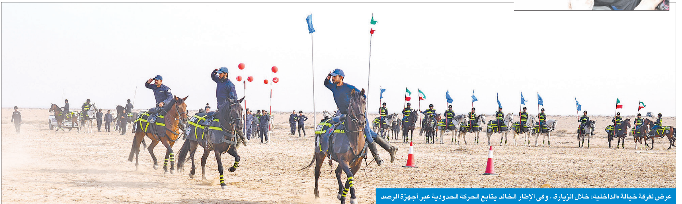
عرض لفرقة خيالة «الداخلية» خلال الزيارة... وفي الإطار الخالد يتابع الحركة الحدودية عبر أجهزة الرصد