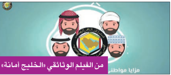
مزاييا مواطن من الفيلم الوثائقي «الخليج أمانة»