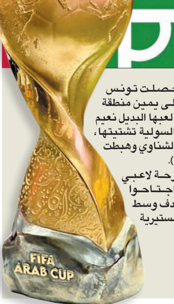
فليطح مع الأبطال

وبهذا الفوز ضرب منتخب الجزائر موعداً مع تونس، التي تجاوزت مصر في الدور نفسه بهدفين صديقة، في المباراة النهائية في الدوحة على استاد البيت عند السادسة مساءً غد، وقبلها عند الواحدة ظهرًا يواجه أصحاب الأرض «قطر» المنتخب المصري على استاد 974.