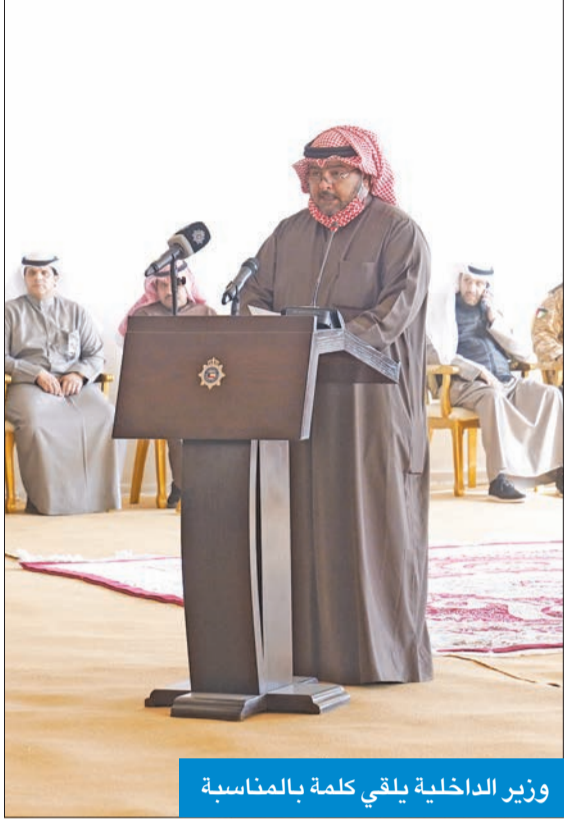
وزير الداخلية يلقي كلمة بالمناسبة