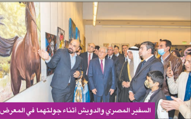
السفير المصري والدويش أثناء جولتهما في المعرض

الجمهور المتابع للحركة الفنية، ويظهر بوضوح تأثر الفنانين بالبيئة المحيطة بهم، وإيضاً انعكاس لتجاربيهم السابقة في مجال الفن التشكيلي، ومدى ثقافة الفنان وخبرته وإنتاجه الفني الذي يتمتع بمهارة ودفعة عالية في التنفيذ.