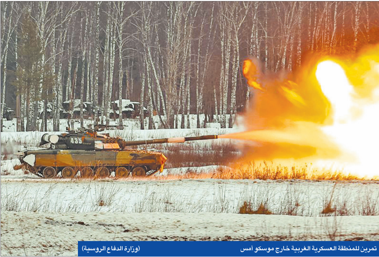
(وزارة الدفاع الروسية)

● اتصال ثان محتمل بين الرئيسين... وواشنطن تتسلم مبادرة موسكو للضمانات الأمنية ● «الناتو» يرفض استبعاد ضم أوكرانيا ● محكمة روسية: لدينا قوات في دونباس