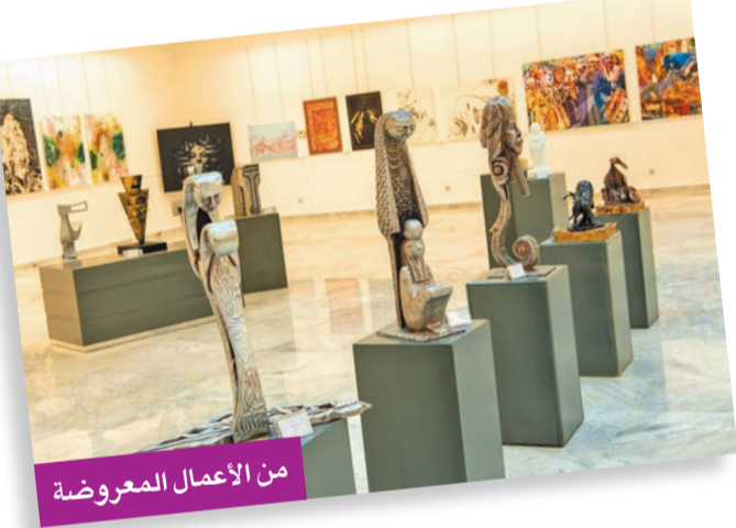
من الأعمال المعروضة

وأفتتح سفير مصر أسامة شلتوت والأمين العام المساعد لطعام الفنون التشكيلية د. بدر الدويش معرض «رؤى مصرية 6»، في قاعة الفنون بضاحية عبدالله السالم أمس الأول، في إطار التعاون الثقافي بين مصر والكويت. ويعبر المعرض عن ثقافة ممتدة عبر السنين بين البلدين من جوانب متعددة، لا تقتصر فقط على الفنون التشكيلية بل تمتد إلى كل النواحي الأخرى، والمعرض نتاج 46 فناناً مصرية، جاءت أعمالهم