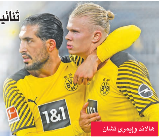
هالاند وإيمري تشان

واستعاد الفريق "الأصفر والأسود"، الذي يشرف على تدريبه ماركو روزه، توازنه بعد مباراتين من دون انتصار، حيث كان قد خسر أمام بايرن ميونخ 3-2، واتبعها بتعادل أمام بوخوم 1-1 في مرحلتين السابقتين.