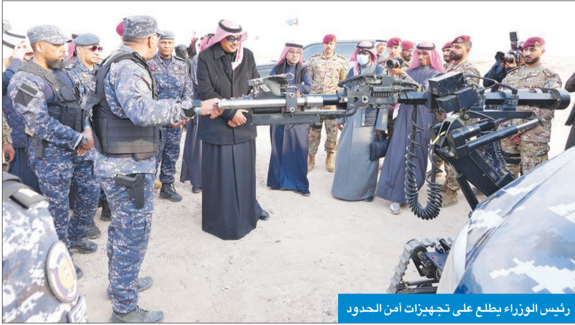
رئيس الوزراء يطلع على تجهيزات أمن الحدود

رئيس مجلس الوزراء والوزراء المرافقون حضروا كبار القادة في «الداخلية».