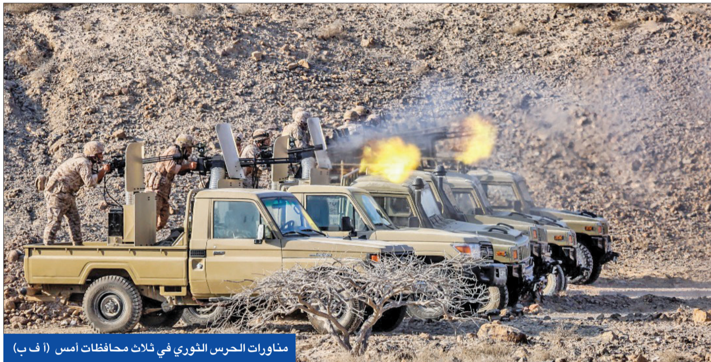
مناورات الحرس الثوري في ثلاث محافظات امس (ا ف ب)

أنه التقى رئيس أركان الحشد الشعبي، عبدالعزيز المحمداوي، وأعطاه نفس الرسالة، السيطرة على الفصائل، إلى ذلك، كشف منسق الاتحاد الأوروبي بشأن المحادثات النووية مع إيران إنريكي مورا، وتخليه الروسي ميخائيل أوليانوف، أن الجولة الثامنة من محادثات فيينا ستبدأ الاثنين المقبل. من جهته، قال أوليانوف، إن الجولة الجديدة ستنتقل 27 الجاري، مشيراً إلى أن الانخراط في محادثات رسمية في الفترة بين عيد الميلاد ورأس السنة الميلادية هو عمل «غير شعبي، لكن في هذه الحالة، فإنه يدل على إصرار المفاوضات على عدم هدر الوقت». وفي وقت سابق، حذر المبعوث الأمريكي الخاص لشؤون إيران روبرت مالي، أمس الأول، من أن الوقت المتبقي لإحياء الاتفاق النووي مع طهران سينفذ خلال أسابيع ويزد من خطر حدوث «أزمة متصاعدة». جاء ذلك في وقت أشار مصدر أمني كبير إلى أن مستشار الأمن القومي الأمريكي جيك