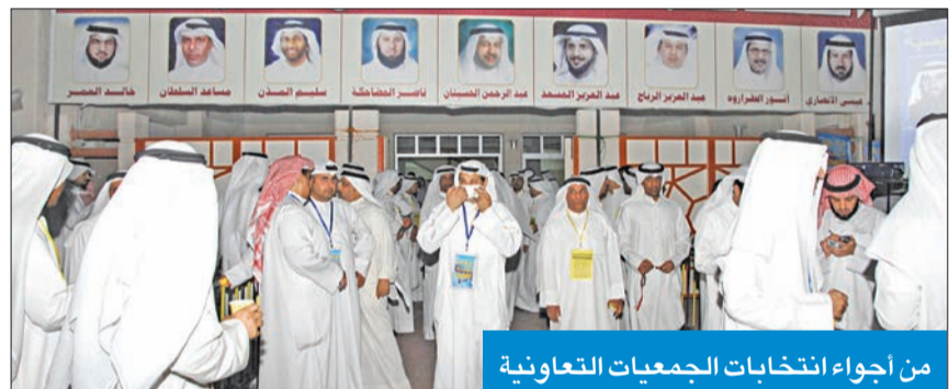
من أجواء انتخابات الجمعيات التعاونية