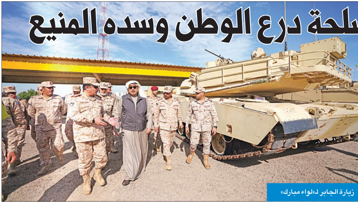
زيارة الجابر لهـلواء مبارك»

الكويت يحميها أبنائها الأوفياء الذين نذروا أرواحهم فداءً لأمنها واستقرارها