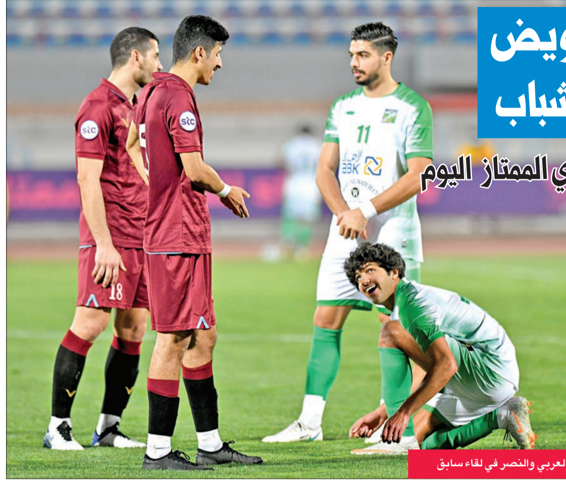
العربي والنصر في لقاء سابق