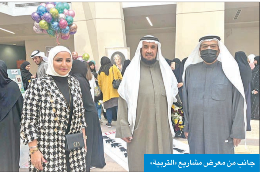
جانب من معرض مشاريع «التربية»

من أربعة مقررات، وكذلك الطالبات المختصات من قسم رياض الأطفال وقسم المرحلة الابتدائية وهن معلمات المستقبل، مبيحة أن عددهن يبلغ تقريباً 200 طالبة، تم تقسيمهن على أربع مجموعات.