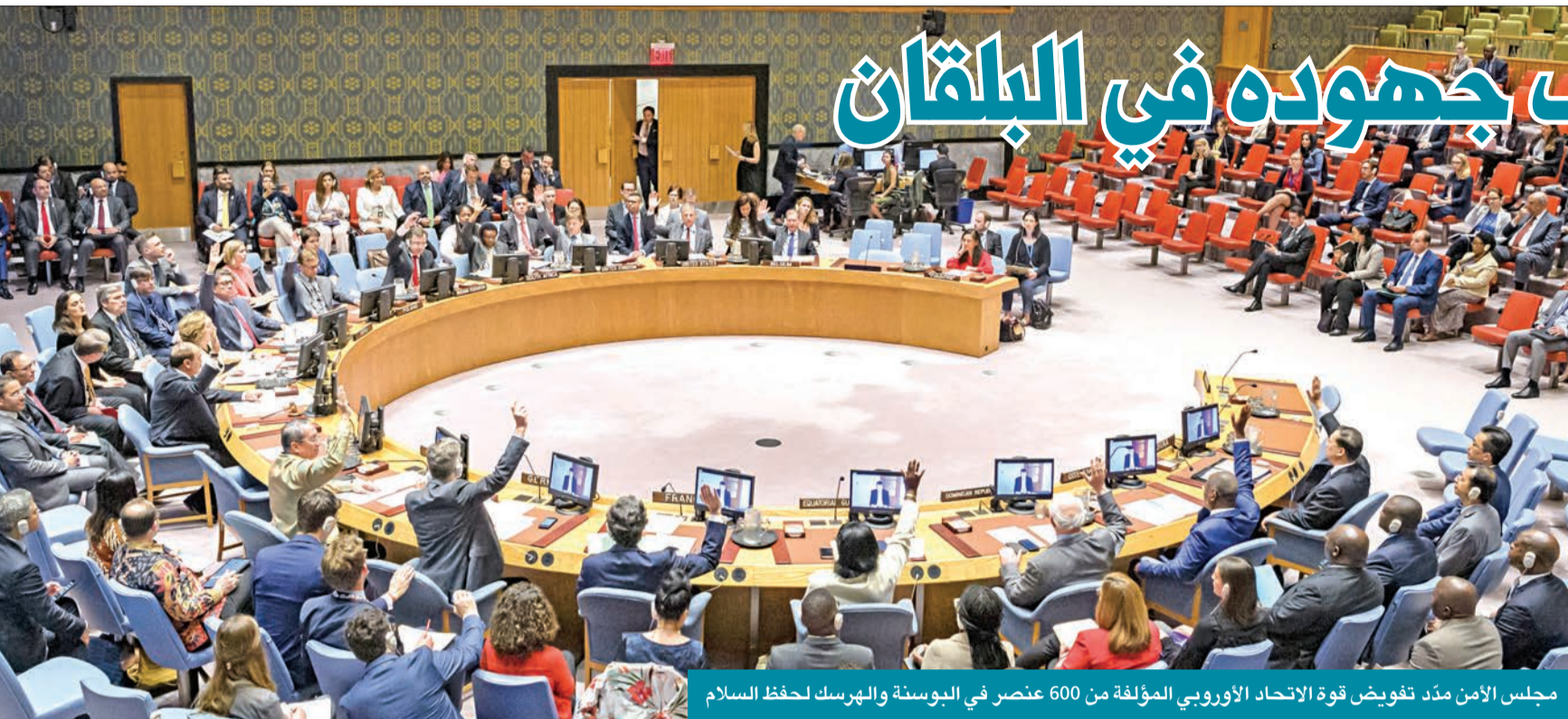
مجلس الأمن مدد تفويض قوة الإتحاد الأوروبي المؤلفة من 600 عنصر في البوسنة والهرسك لحفظ السلام