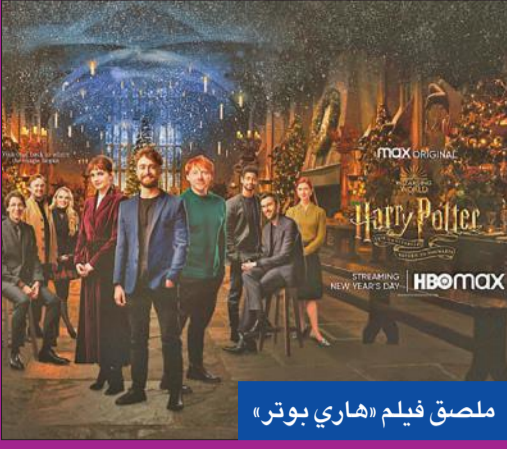
ملصق فيلم «هاري بوتر»

أعلنت شبكة OSN عرض واحد من أهم الأحداث التلفزيونية المرتقبة لهذا العام، حلقة «العودة إلى هوغوورتس» التي يجري تقديمها في الذكرى العشرين على انطلاق أفلام هاري بوتر، تكريماً لإحدى أشهر سلاسل الأفلام في العالم، حصرياً على OSN Streaming، في 1 يناير 2022.