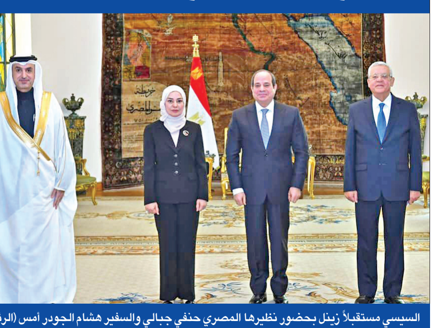
السياسي مستقبلاً زينل بحضور نظيره المصري حنفي جبالي والسفير هشام الجودر أمس

وقال مدبولي إن اجتماع أعضاء الحكومة في المقر الجديد بالعاصمة الإدارية أحد الأيام التاريخية، إذ يعتبر الاجتماع بمنزلة «رسالة قوية وواضحة للعالم أجمع، مفادها أن مصر تخطو بخطى حثيثة وقوية نحو المستقبل، رغم كل التحديات»، لافتاً إلى أن الاجتماع الأول للحكومة يأتي في إطار بدء الانتقال التدريجي