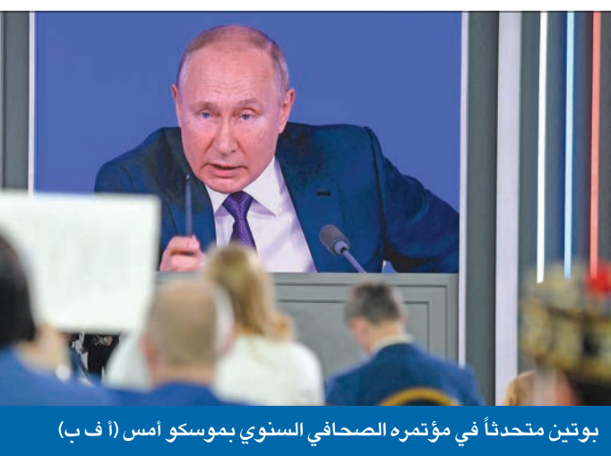
بوتين متحدثاً في مؤتمره الصحافي السنوي بموسكو أمس

دولة، «ولكن العكس حصل، وأصبحت واشنطن تنشر صواريخها على الأبواب، ولذلك فعليها وحلفائها (الناتو) أن يعطونا الضمانات، وليس نحن». وأثار بوتين المخاوف من أن يتحول الصراع المحتدم في شرق أوكرانيا إلى حرب مفتوحة، باعتباره أنه من المستحيل إقامة علاقات حسن جوار في ظل وجود حكومة كيبك الحالية بقيادة الرئيس فولوديمير زيلينسكي، مشدداً على حق سكان إقليم دونباس في تقرير مصير 02