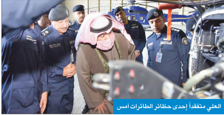
العلي متفقداً إحدى حظائر الطائرات أمس

ووجه العلي، خلال جولة على قطاعات الداخلية لمتابعة سير العمل، والتعرف على المعوقات ووضع الحلول لها، إلى ضرورة وضع دراسة شاملة لتطوير إدارة جناح طيران الشرطة، وأهم المعوقات التي تواجه عملها ووضع الحلول والمقترحات للتغلب عليها وتقديمها في أقرب وقت. وأضاف أن «الداخلية» حريصة على توفير كل