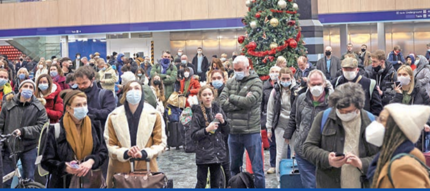
مسافرون يعضون الكمامات في محطة «ايوستن» للغطارات في لندن أمس

100 مليون حالة بالقارة الأميركية... وجرعة ثالثة من «استرازينيكا» فعالة لمواجهة «أوميكرون»