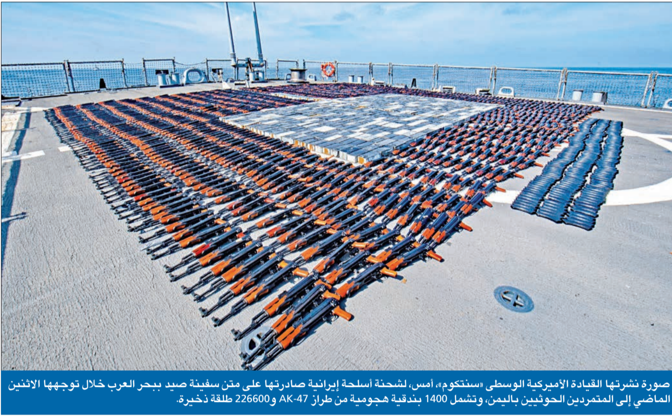
صورة نشرتها القيادة الأميركية الوسطى «سنكوم»، أمس، لشحنة أسلحة إيرانية صادرتها على متن سفينة صيد ببحر العرب خلال توجيها الاثني الماضي إلى المتمردين الحوثيين باليمن، وتشمل 1400 بندقية هجومية من طراز AK-47 و226600 طلقة ذخيرة.

في حدث أعاد إلى الأذهان الصفة المشبوهة مع إدارة الرئيس الأميركي الراحل رونالد ريغان، المعروفة بفضيحة «إيران غيت»، خلال الحرب العراقية - الإيرانية في ثمانينيات القرن الماضي، علمت «الجريدة» أن حكومة الرئيس الإيراني إبراهيم رئيسي تمكنت من تحصيل نحو 50 مليار دولار؛ جزء منها جاء من الأرصدة المجمدة في عدد من الدول، بموجب العقوبات الأميركية، وذلك على شكل مقايضة بعملات محلية غير الدولار وصفقات أسلحة وبضائع، والجزء الآخر دفع نقداً عبر شراء تجار أميركيين وإسرائيليين، على صلة بشخصيات سياسية نافذة في واشنطن وتل أبيب، لمنتجات نفطية إيرانية يعرض البحر. وقال مصدر رفيع المستوى في مكتب رئيسي، إن تقصياً حكومياً عن الحسابات والزبائن وجد أن الشركات المملوكة للأميركيين والإسرائيليين دفعت ثمن المحروقات الإيرانية نقداً، لكن قسماً كبيراً من الأموال مازال مخبأ في محل غير معلوم، وأشار المصدر إلى أن المسؤولين في إيران لن يُفاجأوا إذا ما اكتشفوا في نهاية تتبع الخيط أن النفط أدخل إلى العدو اللدود إسرائيل، التي تعارض علناً جهود إدارة الرئيس جو بايدن لإحياء الاتفاق النووي المبرم عام 2015. وبين أنهم اطلعوا على قيام 02