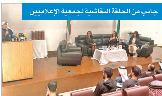
جانب من الحلقة النقاشية لجمعية الإعلاميين