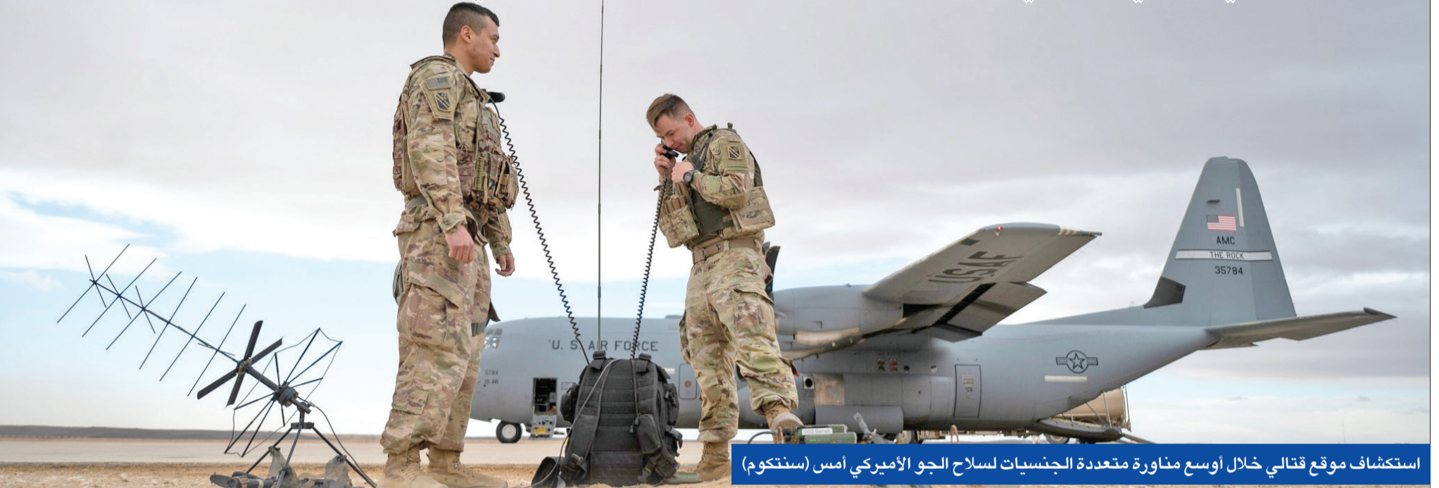
استكشاف موقع قتالي خلال أوسع مناورة متعددة الجنسيات لسلاح الجو الأميركي أمس (ستوكوم)

الجيش الروسي يحاكي التصدي لهجمات بالطائرات المسيرة... والأوكراني يناور لأول مرة بصاروخ «غافلين»