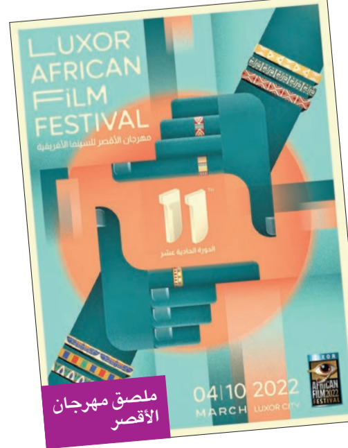
ملصق مهرجان الأقصر