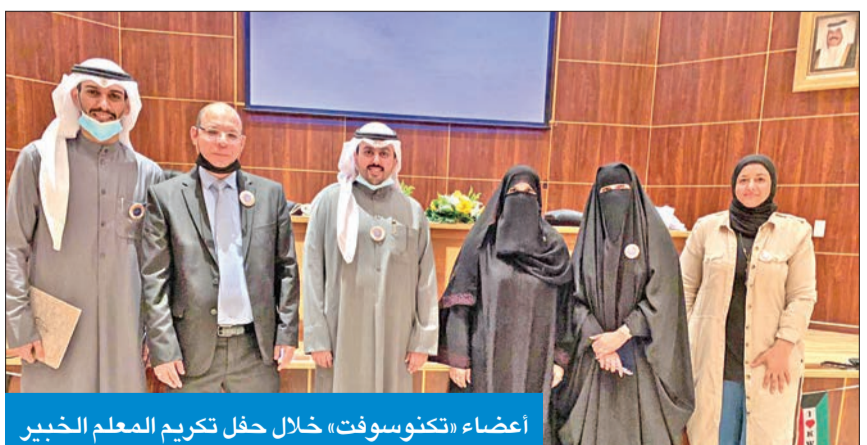
أعضاء «تكنوسوفت»، خلال حفل تكريم المعلم الخبير