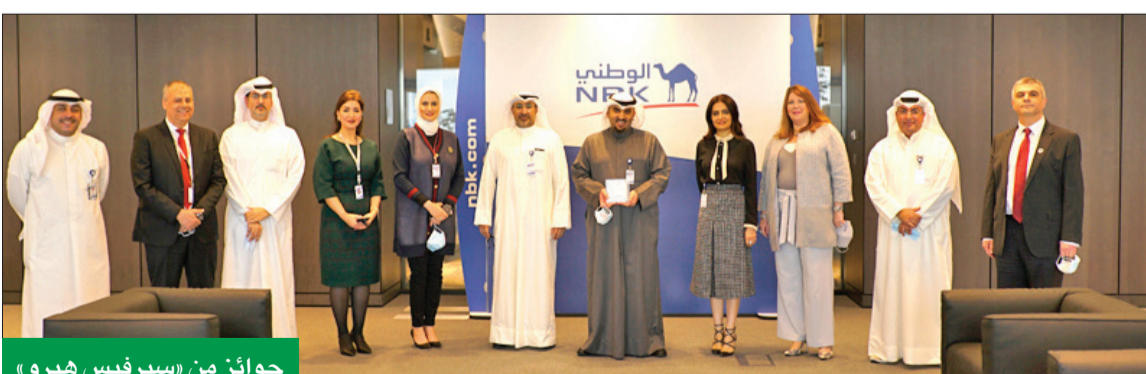
جوائز من «سيرفيس هيرو»