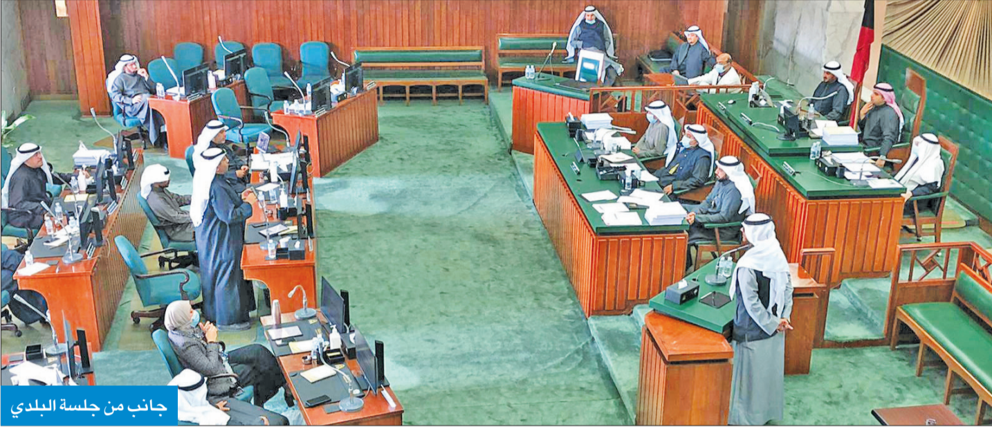
جانب من جلسة البلدي

خلافات الأعضاء حول الكتب المعطلة للمشروع تُشعل «البلدي»... وتحذيرات من تحوله إلى «ساحة قتال»