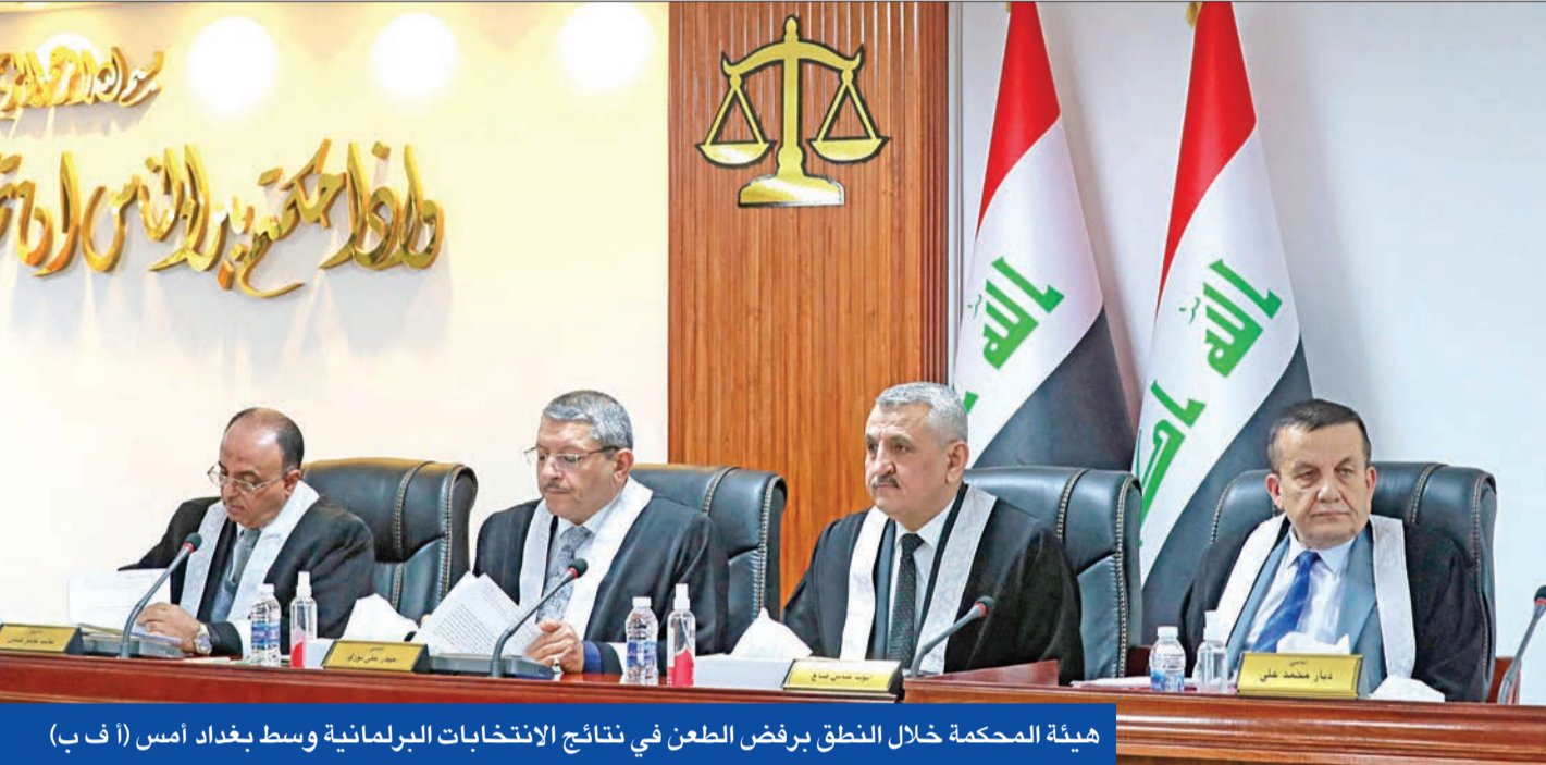
هيئة المحكمة خلال النطق برفض الطعن في نتائج الانتخابات البرلمانية وسط بغداد أمس

فوضى إدارية بالمحافظات والاحتجاجات تغرق شوارعها • الخزعلي لن يسمح بوجود أميركي بعين الأسد والحزب