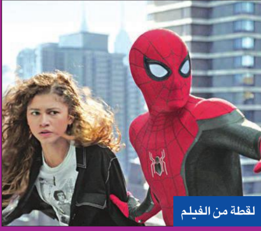
لقطة من الفيلم

حقق فيلم الحركة والمغامرات الجديد "سبايدرمان: لا عودة إلى الديار" إيرادات تجاوزت مليار دولار عالمياً، ليصبح أول فيلم يصل إلى هذا الرقم في ظل تفشي جائحة كورونا. حقق الفيلم هذه الإيرادات خلال 12 يوماً فقط، وهو بطولة توم هولاند وأندرو غارفيلد وتوبي ماغواير، ومن إخراج جون واتس. وتصدر الفيلم إيرادات السينما بأمريكا الشمالية في عطلة نهاية الأسبوع، مسجلاً 81 مليون دولار. وجاء في المركز الثاني بفارق كبير فيلم الرسوم المتحركة الموسيقي (سينغ 2)، بإيرادات 23.7 مليون دولار. واحتل فيلم "ذا ماتريكس رايبركشنز" المركز الثالث بفارق كبير أيضاً، بإيرادات 12 مليون دولار. واتي فيلم الإثارة "ذا كينجز مان" في المركز الرابع، بإيرادات 6.3 ملايين دولار في عطلة نهاية الأسبوع. وحل في المركز الخامس فيلم "أميركان أندردوج" بـ 6.2 ملايين دولار.