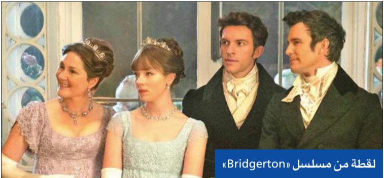
لقطة من مسلسل «Bridgerton»

أعلن القائمون على مسلسل "Bridgerton"، موعد عرض الموسم الثاني منه في 25 مارس المقبل على منقطع قصير. ووفقاً لما نشره موقع "TODAY"، يتناول المسلسل قصة عائلة تطالب بتحسين المكانة الاجتماعية في عام 1813 بالمجتمع الراقي في لندن، وعلاقات البلاط الملكي، وزيارتهم، والعديد من الحفلات. وركز الموسم الأول بشكل أساسي على الرومانسية بين دافني بريدجرتون، التي جسدت دورها فيبي ديبنفور، في حين جسدت دور دوق هاستينغز، رجبه جان بيغ، وكما هو الحال في سلسلة