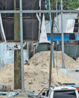
انتشار العسكر والحواجز قرب القصر الرئاسي في مقديشو أمس

أدى الإعلان في منتصف أبريل عن تمديد ولايته لمدة عامين، إلى اشتباكات مسلحة في مقديشو، وفي مبادرة تهدئة، كلف فارماجو روبلي بتنظيم الانتخابات، لكن في الأشهر التي تلت، استمر التوتر بين الرجلين، وبلغت المواجهة بينهما أوجها في 16 سبتمبر، مع إعلان رئيس الدولة تعليق الصلاحيات التنفيذية لرئيس الوزراء الذي رفض القرار.