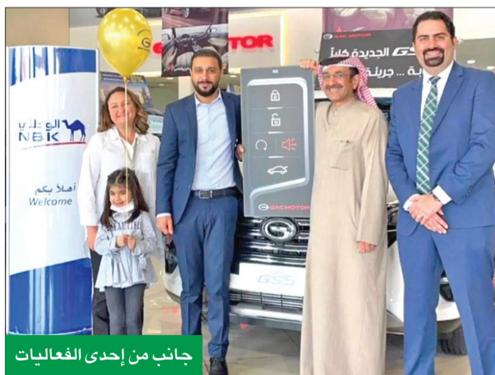
جانب من إحدى الفعاليات

توج بنك الكويت الوطني جهوده الرقمية خلال