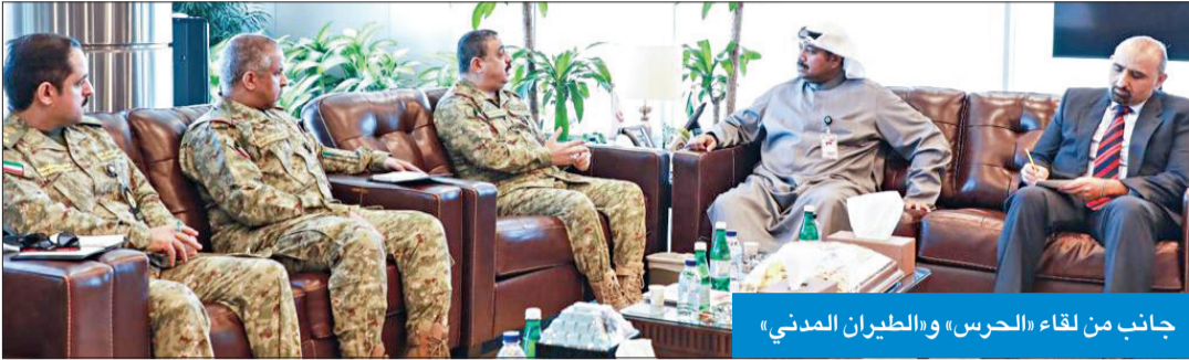
جانب من لقاء «الحرس» و«الطيران المدني»