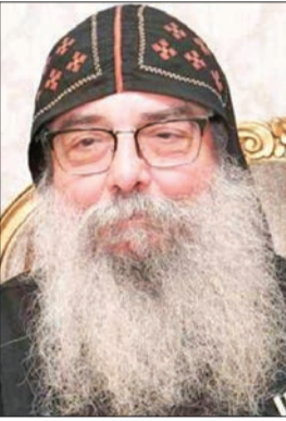
القمص يجول الانبا ييشوي

وقال «إننا في هذه الأعياد المباركة نواصل الصلوات كي يتحنن الله إلى البشرية، ويرفع عنها هذا الوباء، ونتمن جهود المسؤولين الكويتيين التي أسهمت في وصول البلاد إلى هذه الحالة الصحية الممتازة».