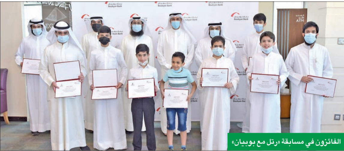
الفائزون في مسابقة «رتل مع بوبيان»