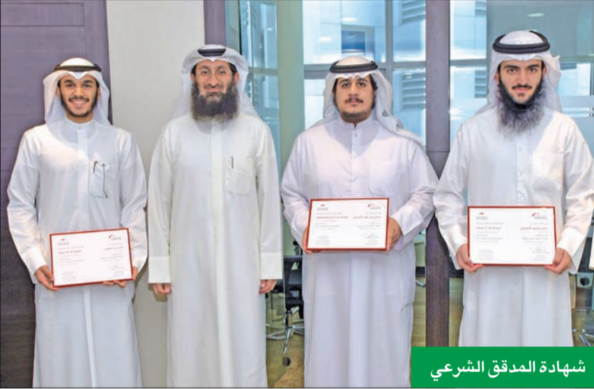
شهادة المدقق الشرعي

الكليب: وازنا بين تقديم منتجات وخدمات توابك العصر وضرورة توافيقها مع الأحكام الشرعية