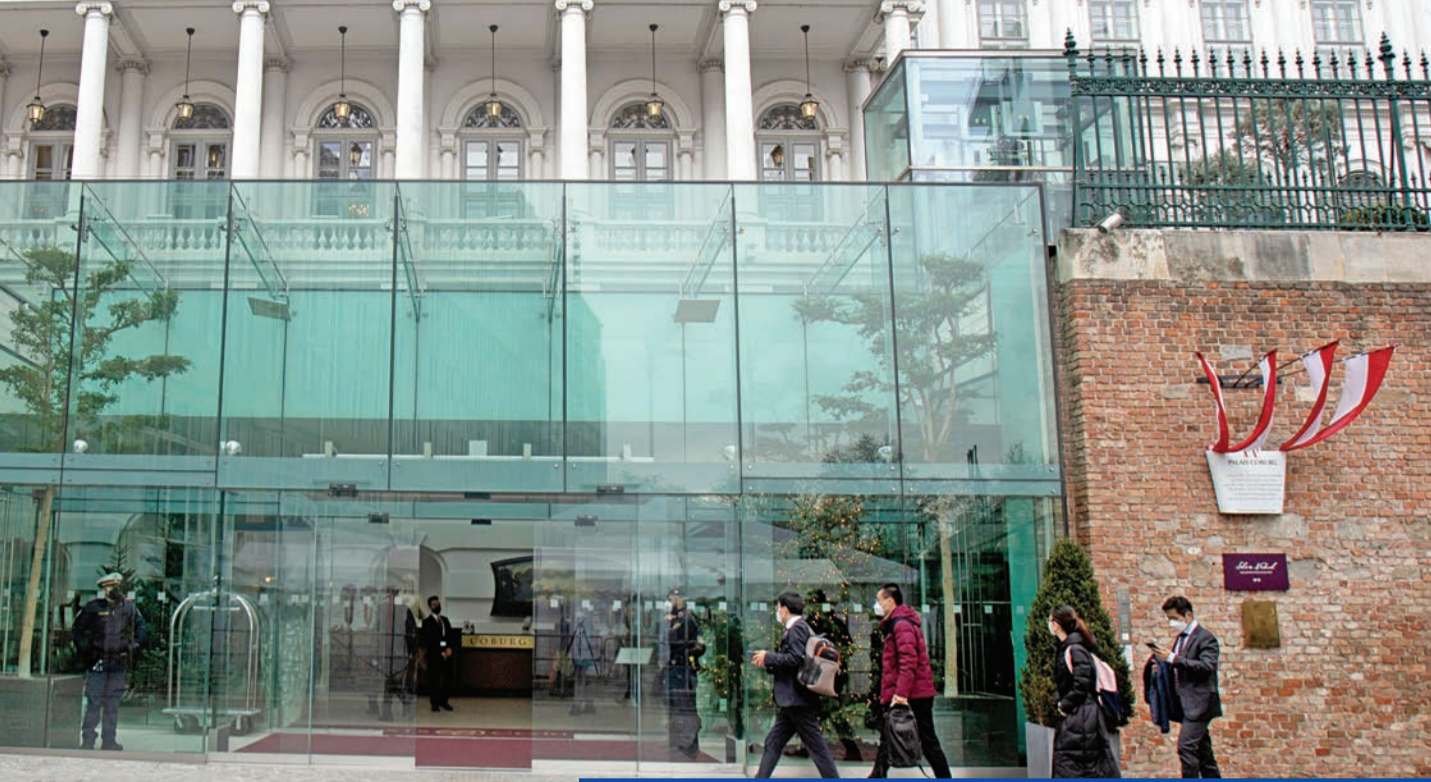
مشهد عام لمقر المفاوضات النووية في فيينا أمس

انطلقت الجولة الثامنة من مباحثات فيينا النووية بين طهران والقوى الكبرى، بالتزامن مع تجديد إسرائيل تهديدها بالتحرك منفردة لمنع الجمهورية الإسلامية من تطوير سلاح ذري، في حين كشفت «الخارجية» الإيرانية أنها تخطط لتعيين سفير جديد لدى المتمردين الحوثيين، وتحدثت عن سعيها لتجديد موعد من أجل عقد جولة خامسة من الحوار مع السعودية.