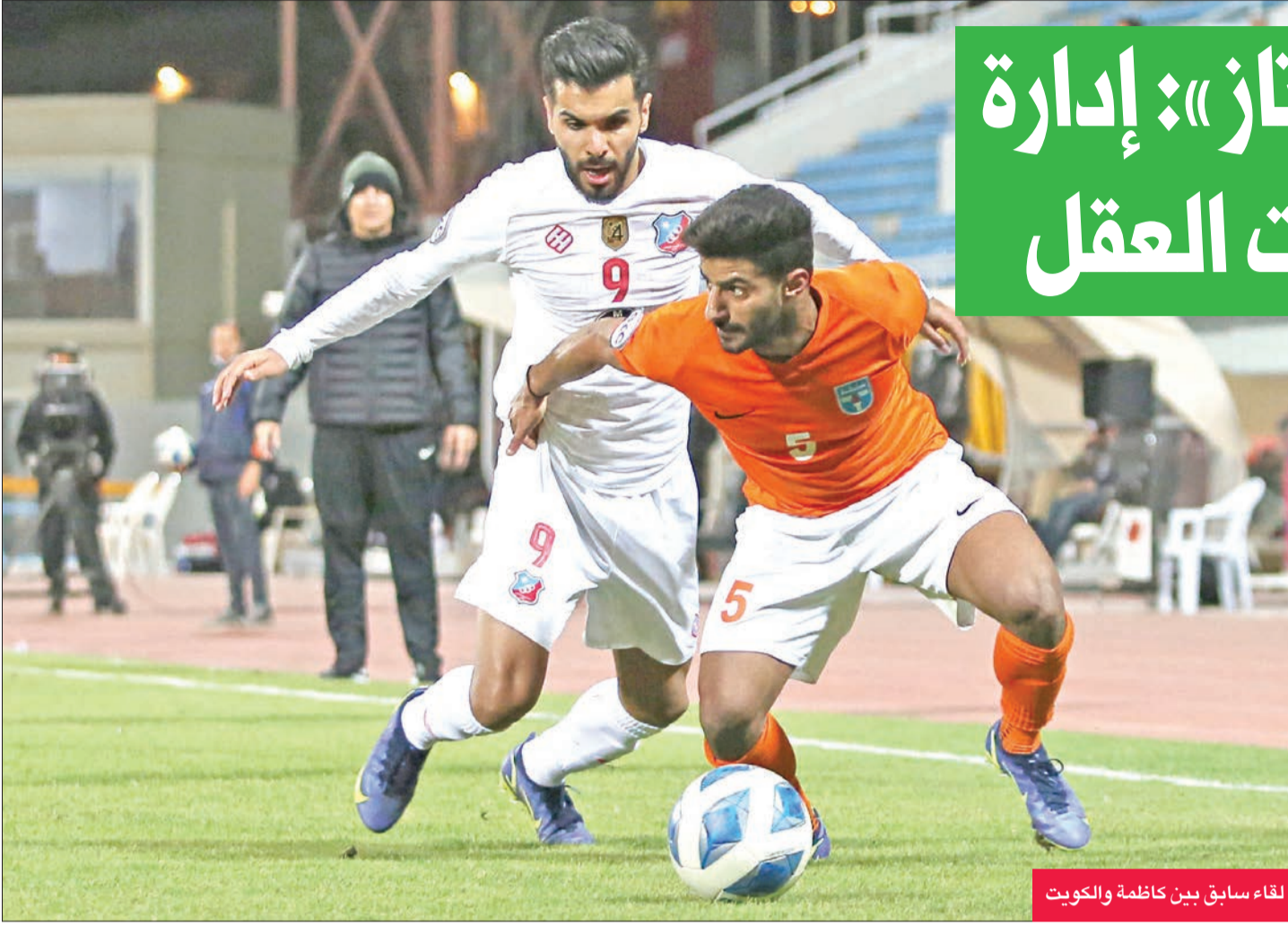
لقاء سابق بين كاملة والكويت