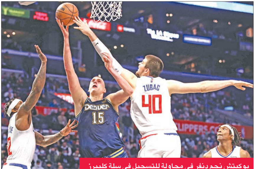
يوكيتش نجم دنفر في محاولة للتسجيل في سلة كليبرز

بعد بداية بطيئة على مضيفه ساكرامنتو كينغز بنتيجة 102-96.