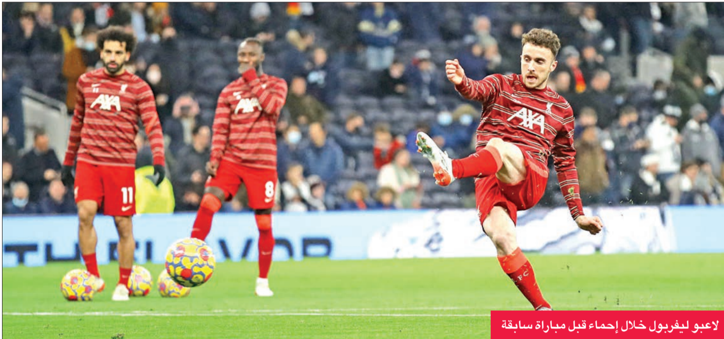
لاعبو ليفربول خلال إجماع قبل مباراة سابقة

ولفرهامبتون من جهة أخرى. وأعلن ليدز في بادئ الأمر تأجيل مباراته ضد أستون فيلا بسبب تأخر انتهاء الحجر الصحي للاعبين الذين ثبتت إصابتهم بفيروس كوفيد-19. ثم في وقت لاحق الأحد، أعلنت رابطة الدوري الممتاز تأجيل مباراة أرسنال وولفرهامبتون أيضاً لأن الأخير «لا يملك العدد المطلوب من اللاعبين