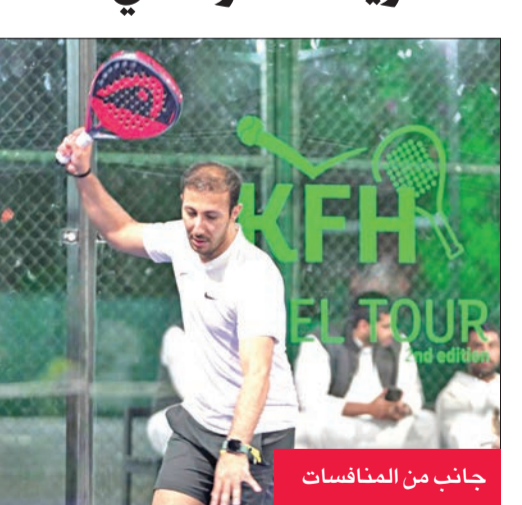
جانب من المنافسات

شهدت مشاركة شبابية واسعة، إضافة إلى إشارات عديدة لما حققته من صدى واسع ومتابعة جماهيرية وتغطية إعلامية شاملة في الوسائل المختلفة وقنوات التواصل الاجتماعي. وأضاف الرويح، أن تنظيم بطولة «بيتك» للعبة Padel، يندرج ضمن إطار المسؤولية الاجتماعية للبلد، والتركيبة على اهتمامات فئة الشباب، مؤكداً أهمية بطولة «بيتك» لـ Padel في تنوع الفعاليات الرياضية أمام اهتمامات الشباب الكويتيين، لاسيما أن هذه الرياضة باتت تكتسب زخماً وانتشاراً حول العالم، مشيراً إلى أن نجاح البطولة والمنافسة التي شهدتها والأداء الجيد من اللاعبين، يبشر بمستقبل واعد لهذه الرياضة محلياً.