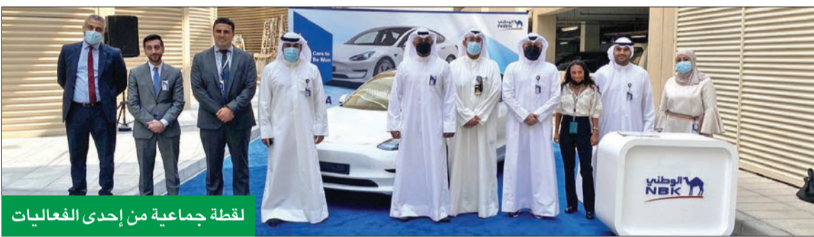
لقطة جماعية من إحدى الفعاليات

عام 2021 بإطلاق «وياي»، أول بنك رقمي في الكويت، والذي يمثل تأكيداً على استمرار قيادة البنك لمسار التحول الرقمي وترسيخاً لريادته في تقديم أحدث الابتكارات والحلول المصرفية المتطورة.