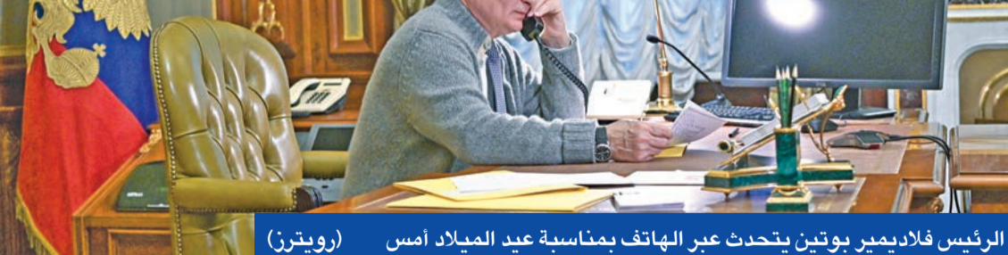
الرئيس فلاديمير بوتين يتحدث عبر الهاتف بمناسبة عيد الميلاد أمس

واكدت أن المفاوضات بشأن إقليم دونباس الانفصالي وصلت إلى طريق مسدود، بسبب عدم الامتثال للعديد من النقاط من اتفاقات مينسك، وفي الوقت ذاته، أعربت نولاند عن إمكانية تسوية الصراع شرق أوكرانيا. وعلى الأرض، أعلنت وزارة الدفاع الروسية عن بدء المنطقة العسكرية الغربية أمس، تدريباً قتالياً على صد غارات جوية مكثفة وضمنان حالة التأهب القصوى بمشاركة 10 آلاف جندي، مبيحة أنها جرت في عدة مناطق مثل فولغوغراد وروستوف وكراسنودار وشبه