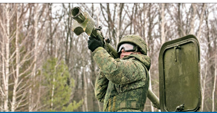
تدريب تكتيكي لوحدات الصواريخ المضادة للطائرات بمنطقة كورسك أمس (وزارة الدفاع)

استحضرت روسيا أمس أزمة الصواريخ الكوبية، التي قادت العالم إلى شفا حرب نووية عام 1962، ونعهدت بوضع حد للزحف الولايات المتحدة وحلفائها في شمال الأطلسي «الناتو» نحو حدودها الشرقية خلال «حرب صغيرة» في أوكرانيا. ومع إعلانها عن أول جولة من المحادثات المباشرة بين الدبلوماسيين والعسكريين الروس والأميركيين بعد عطلة رأس السنة في 12 يناير المقبل، لمناقشة قائمة الضمائم الأمنية المطلوبة من «الناتو»، اتهم وزير الخارجية الروسي سيرغي لافروف الدول الغربية 02