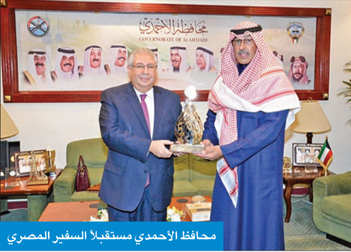
محافظ الأحمدية مستقبلاً السفير المصري

استقبل محافظ الأحمدية الشيخ فواز الخالد، في مكتبه بديوان عام المحافظة، سفير مصر لدى الكويت أسامة شلتوت، بمناسبة مباشرة مهامه، حيث جرى التعارف وبحث العلاقات الثنائية الوثيقة التي تربط البلدين الشقيقين، وسبل تعزيزها في جميع المجالات. وخلال اللقاء، بحث المحافظ الفرص والإمكانات القائمة لتطوير التعاون المشترك، وتبادل الخبرات بين البلدين على الصعد كافة، وعلى صعيد المحليات والمحافظة، معرباً عن تمنياته للسفير شلتوت بالتوفيق في مهامه، والدفع بعلاقات البلدين الشقيقين إلى آفاق أرحب خلال الفترة المقبلة. أعرب السفير شلتوت، خلال اللقاء، بحضور السكرتير الثالث بالسفارة ندى عادل، عن شكره للرعاية البالغة التي تحظى بها البعثة الدبلوماسية والجبالية المصرية في بلدهم الثاني الكويت.