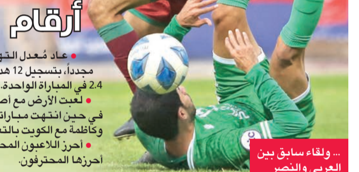
... ولقاء سابق بين العربي والنصر

• عاد مُعدل التهديد إلى الانخفاض مجدداً، بتسجيل 12 هدفاً فقط، بمعدل تهديفي 2.4 في المباراة الواحدة. • لعبت الأرض مع أصحابها في 3 مباريات، في حين انتهت مباريات النصر مع العربي، وكاملة مع الكويت بالتعادل. • أحرز اللاعبون المحليون 8 أهداف مقابل 4 أحرزها المحترفون.