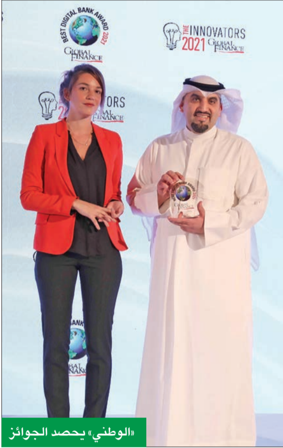
«الوطني» يحصد الجوائز

وكذلك وضع «الوطني» تشجيع عملائه على استخدام الحلول الإلكترونية في إتمام مدفوعاتهم ركيزة أساسية في برنامج مكافآته خلال العام، وأطلق العديد من المبادرات في ذلك الشأن، من بينها العروض الاستثنائية لعملائه خلال شهر رمضان، للحصول على استرداد نقدي بنسبة 15 في المئة على مشترياتهم من الجمعيات عند استخدام