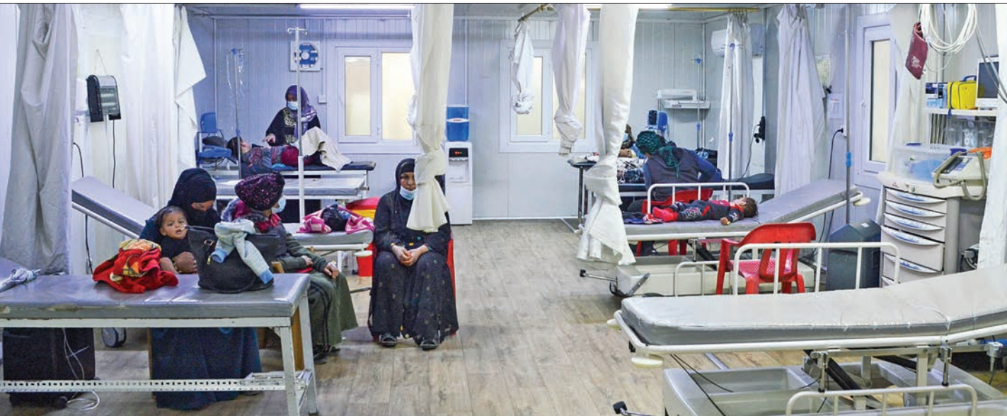
عراقيات داخل مشفى في الموصل منتصف ديسمبر الجاري

يضم فصائل مرتبطة بـ«الحشد الشعبي» المتحالف مع إيران، فقد هوى تمثيله البرلماني من 48 مقعداً إلى 17 فقط.