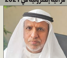
أعلنت الجمعية الخيرية

الكويتية «حفاظ» إنجازات إدارة الحلقات والمراكز القرآنية خلال عام 2021، حيث أقيمت 185 حلقة قرآنية إلكترونية، بمشاركة 7908 طلاب وطالبات.