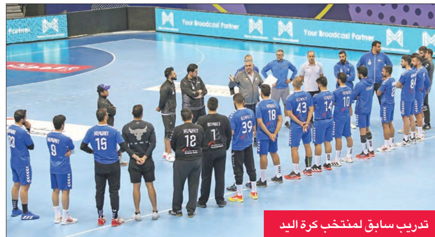
تدريب سابق لمنتخب كرة اليد

وتراجع الأهلي إلى المركز الحادي عشر برصيد 15 نقطة بعد ثلاث