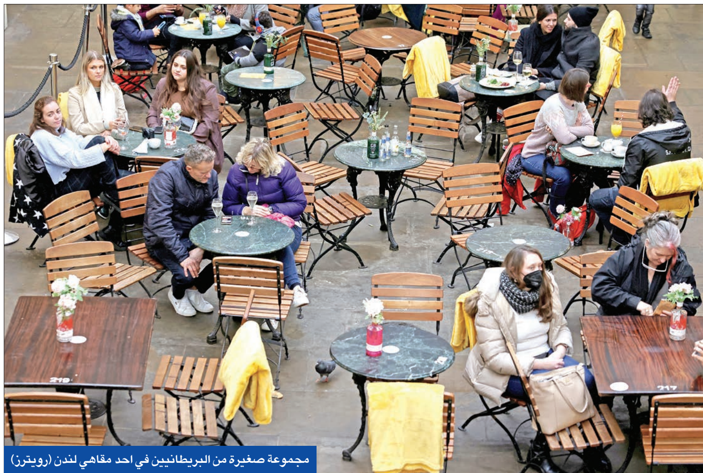
مجموعة صغيرة من البريطانيين في احد مقاهي لندن

يستعد العالم لاستقبال سنة 2022، في أجواء غير عادية، نظراً للظروف الصحية الناجمة عن وباء «كورونا»، لاسيما في ظل موجة تفشي متحور «أوميكرون» ذي القدرة السريعة على الانتشار، فيما وصل معدل الإصابة إلى مستويات قياسية في دول عدة.