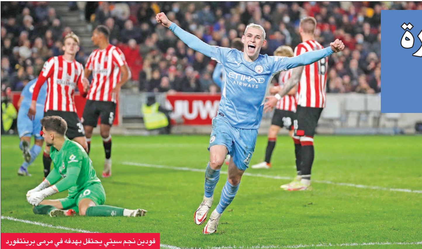
فودين نجم سيتي يحتفل بهدفه في مرمى برينتفورد