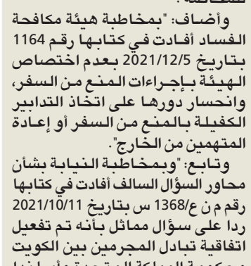
إعادة المتهم إلى البلاد لتقديمه للمحاكمة.

إعادة المتهم إلى البلاد لتقديمه للمحاكمة. وأضاف: «بمخاطبة هيئة مكافحة الفساد أفادت في كتابها رقم 1164 بتاريخ 2021/12/5 بعدم اختصاص الهيئة بإجراءات المنع من السفر، وانحسار دورها على اتخاذ التدابير الكفيلة بالمنع من السفر أو إعادة المتهمين من الخارج». وتابع: «وبمخاطبة النيابة بشأن محاور السؤال السالف أفادت في كتابها رقم م ن ع/1368 س بتاريخ 2021/10/11 رداً على سؤال مماثل بأنه تم تفعيل اتفاقية تبادل المجرمين بين الكويت وحكومة المملكة المتحدة وأيرلندا الشمالية بتاريخ 2016/12/15، ودخلت حيز التنفيذ اعتباراً من 2021/3/15، وأرسلت النيابة مذكرتها باستردادته بتاريخ 2021/6/3».