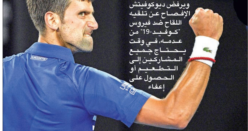
ويرفض ديوكوفيتش الإفصاح عن تلقيه اللقاح ضد فيروس "كوفيد-19" من عهده، في وقت يحتاج جميع المشاركين إلى التطعيم أو الحصول على إعفاء.

أكد لاعب كرة المضرب الصربي دوشان لايفويتش أمس أن مواطنه نوفاك ديوكوفيتش المصنف أول عالمياً قد يشارك في بطولة أستراليا المفتوحة، أولى البطولات الأربع الكبرى، وذلك على الرغم من قرار انسحابه في الدقيقة الأخيرة من كأس رابطة اللاعبين المحترفين (أي تي بي) المقررة في سيدني. وأعلن ديوكوفيتش، الفائز بـ 20 بطولة كبرى، انسحابه من المسابقة المرتقبة انطلاقاً من سيدني غداً، معززاً الشكوك حول الدفاع عن لقبه في بطولة أستراليا من عهده.