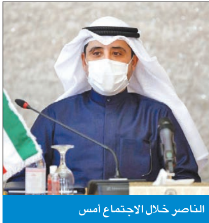
الناصر خلال الاجتماع أمس

ترأس اجتماعاً لمسؤولي الوزارة وتسلم أوراق اعتماد السفير الياباني