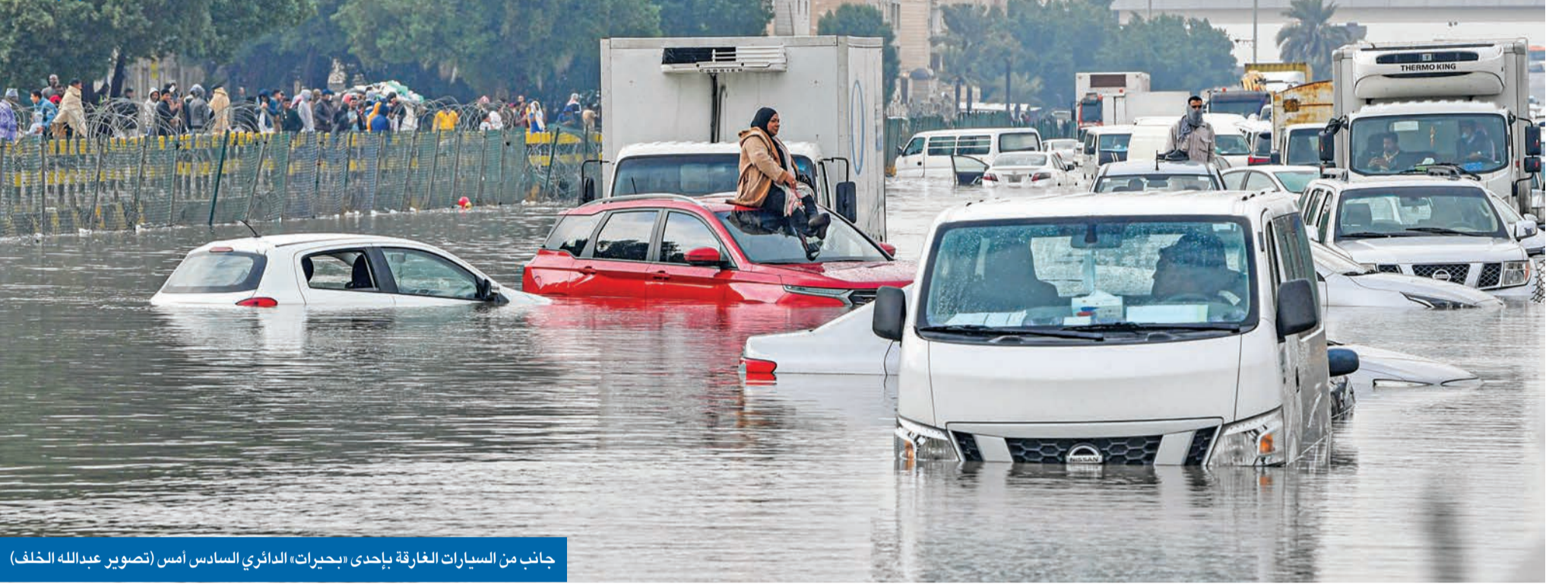
جانب من السيارات الغارقة بإحدى «بحيرات» الدائري السادس أمس