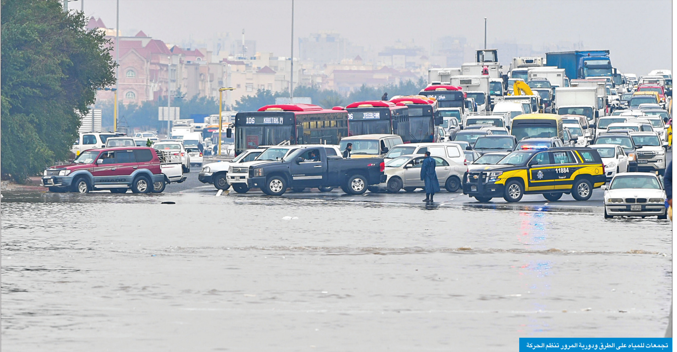
تجمعات للمياه على الطرق ودورية المرور تنظم الحركة

«الأشغال»: تلقينا 830 شكوى وفعلنا خطة الطوارئ... ومياه الأمطار فاقت استيعاب شبكة تصريفها