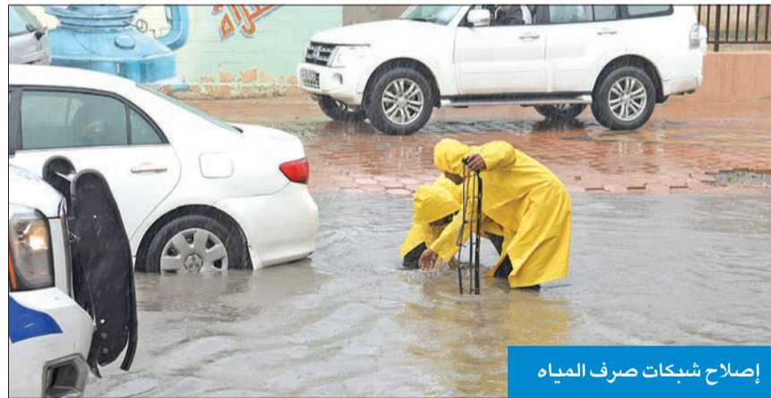
إصلاح شبكات صرف المياه