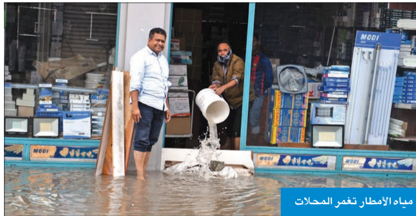
مياه الأمطار تغمر المحلات

طمأنت وزارة التجارة والصناعة المواطنين والمقيمين بتوفر جميع المواد والسلع الغذائية والمواد الأساسية في الجمعيات التعاونية، ومراكز نقاط البيع بدون أي زيادة مصطنعة في الأسعار، في ظل ما تشهده البلاد من هطول غزير للأمطار، وإغلاق بعض الطرق. وأكدت الوزارة، في بيان لها، تسخير جميع إمكانياتها وكوادرها الوطنية على الرقابة المستمرة، للتأكد والوقوف على مدى التزام الشركات والمحلات التجارية المختصة بعدم رفع الأسعار. وبينت أنه في حال رصد أي ارتفاع ستتم المخالفة والتحويل إلى النيابة التجارية، مشيرة إلى عمل شركة المطاحن الدقيق والمخابز الكويتية بصورة طبيعية في توزيع منتجاتها على كل مخابز الشركة ونقاط البيع.