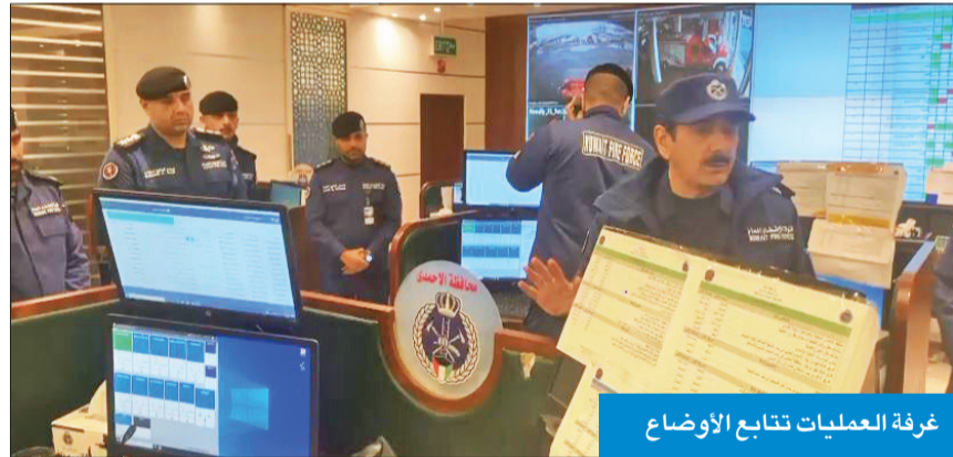
غرفة العمليات تتابع الأوضاع