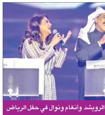
الرويشد وأنغام ونوال في حفل الرياض

اشهر أعمالهم الغنائية خلال 4 ساعات من الأغنيات المتنوعة والوصلات الطربية، سواء بشكل فردي أو ثنائي، أو تريبو يجمع ثلاثة فنانين وفنانات على المسرح لأداء وصلة غنائية، مثل ثنائية محمد عبده وعبدالمجيد عبدالله، وثلاثيات: نوال وعبدالله الرويشد وأنغام، أصيل أوبوكير وعلي بن محمد ووليد الشامي، ونيل شعيل وفهد الكبيسي وماجد المهندس، ونوال وأحلام وفنان العرب ولم يكن الحفل هو الوحيد في الرياض، بل كانت هناك احتفالات أخرى، حيث أحيا ليلة رأس السنة كذلك العديد من الفنانين العرب في عدد من المواقع والمناطق الترفيهية ضمن موسم الرياض، حيث غنى المطرب المصري سعد الصغير في 'المحروسة'، والفنانة