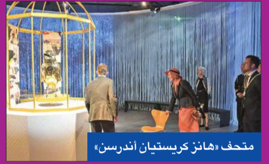
متحف «هانز كريستيان أندرسن»

تكرم الدنمارك كاتبها الأكثر شهرة هانز كريستيان أندرسن بمتحف حديث في مسقط رأسه يدخل زائريه إلى عوالم الخيال التي جسدها بكتابات.