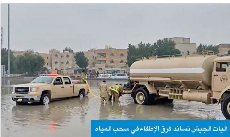
البيات الجيش تساند فرق الإطفاء في سحب المياه

في حالة تاهب واستعداد تام للتعامل مع البلاغات الواردة من غرفة عمليات الطوارئ، فيما يختص بالموقف الراهن. وذكرت أن مشاركة قوة إطفاء الجيش تأتي ضمن إطار التنسيق والتعاون المشترك لتقديم كل أوجه الدعم والإسناد لأجهزة الدولة لمواجهة الحالات الطارئة، في ظل عدم استقرار حالة الطقس في البلاد.