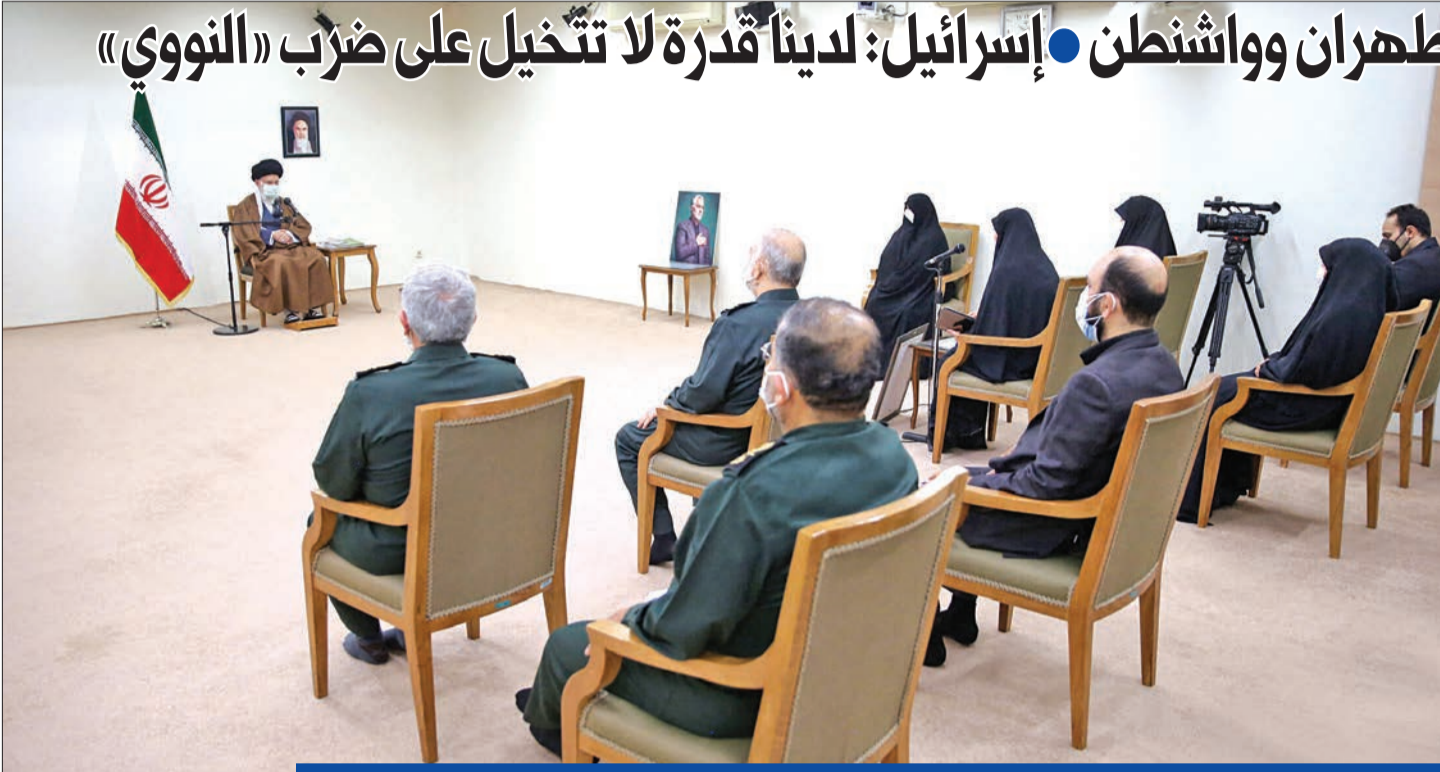
المرشد الإيراني علي خامنئي خلال اجتماع لتأبين قاسم سليمان في طهران أمس الأول

عشية استئناف مفاوضات فيينا بشأن الرامية لإحياء الاتفاق الدولي بشأن البرنامج النووي الإيراني، المبرم عام 2015، بعد توقف قصير للاحتفال برأس السنة الميلادية، أفادت أوساط إيرانية رسمية بان روسيا والصين أفتعا إيران بالتخلي عن بعض مطالبها الأساسية في المحادثات الذرية. وأكدت وكالة أنباء «نور نيوز» المقربة من المجلس الأعلى للأمن القومي الإيراني، ليل السبت، الأحد، أن «هذا النجاح لا يعني الخضوع المطلق لوجهات نظر روسيا والصين، بل إن إيران عدلت مقترحاتها بالتشاور معهما».