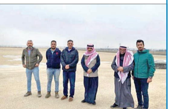
العرو خلال جولته التفقدية أمس