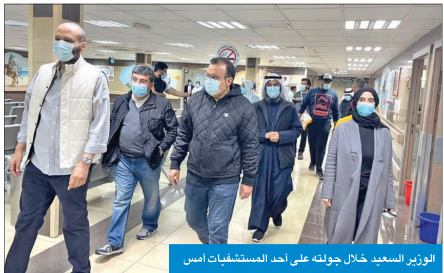
الوزير السعيد خلال جولته على أحد المستشفيات أمس