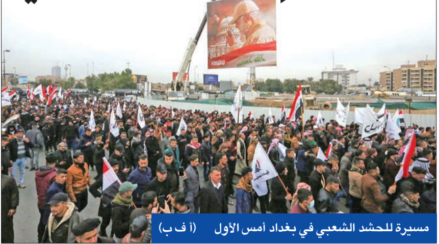
مسيرة للحشد الشعبي في بغداد أمس الأول

بقبول الصدر لتولي منصب رئيس الحكومة، منحه رئيسها السابق حيدر العبادي، والوزير الأسبق محمد السوداني، ومحافظ البصرة أسعد العبداني، والنائب الأسبق ومستشار رئاسة الجمهورية على شكري، مع بيان أن «التوافق قد يحصل بعد انعقاد الجلسة الأولى للبرلمان». (بغداد - وكالات)