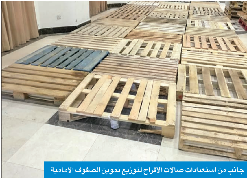
جانب من استعدادات صالات الأفراح لتوزيع تموين الصفوف الأمامية

شؤون العضوية وإشهار الجمعيات التعاونية بقطاع التعاون 5 دعوات جديدة لفتح باب الترشح والانتخاب في تعاونيات سلوى، وصباح السالم، ومشرف، والنسيم، والشامية والشويخ، ليرتفع بذلك إجمالي الجمعيات الموجهة الدعوات إليها إلى 13 جمعية، على أن تجري انتخابات الجمعيات التي انتهت الولاية القانونية لمجالسها تبعاً خلال الفترة المقبلة. ووفقاً لمصادر «الشؤون»، فإن قمة اجتماعاً سيعقد بين الوزارة وممثلي مجالس إدارة التعاونيات التي وجهت إليها دعوات فتح باب الترشح والانتخاب للاتفاق على موعد الترشح وإجراء الانتخابات، موضحة أنه عقب ذلك يفتح الباب لمدة 10 أيام، على أن يقدم كل من يرغب في خوض غمارها أوراق ترشحه إلى اللجنة المختصة في كل جمعية والتي تشرف الوزارة مباشرة عليها.