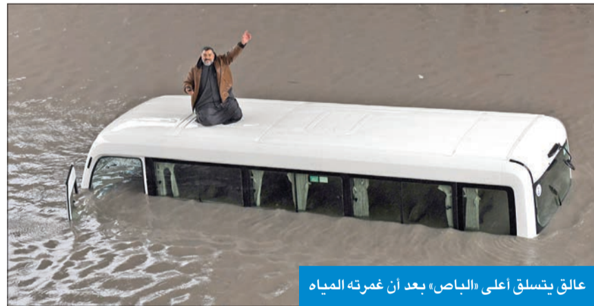
علق يتسلق أعلى الباص، بعد أن غمرته المياه