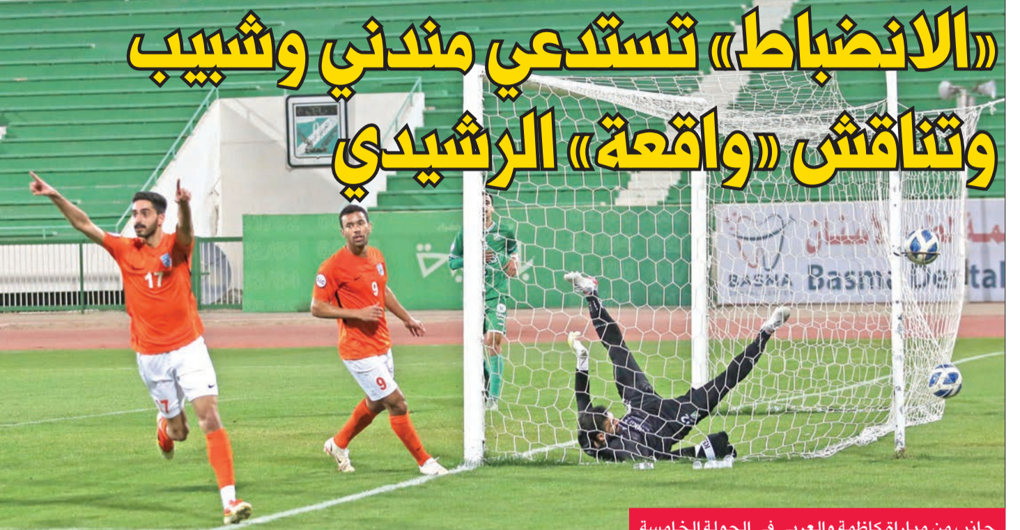
جانب من مباراة كاظمة والعربي في الجولة الخامسة