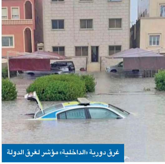
غرق دورية «الداخلية» مؤشر لغرق الدولة

بِسْمِ اللَّهِ الرَّحْمَنِ الرَّحِيمِ يَا أَيُّهَا النَّبِيُّ صَلِّ وَسَلِّمْ وَارْحَمْنَاهُ بِرَحْمَةِ اللَّهِ الْعَظِيمِ صَلِّ وَسَلِّمْ عَلَى سَيِّدِنَا مُحَمَّدٍ وَآلِهِ الطَّيِّبِينَ الطَّاهِرِينَ