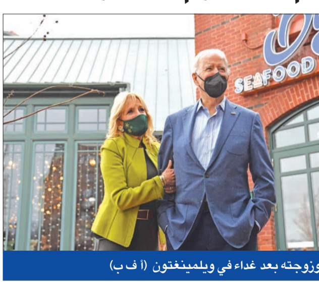
بايدن وزوجته بعد غداء في ويلمينغتون

أقصت إدارة الرئيس الأميركي جو بايدن، أمس الأول، كلاً من إثيوبيا ومالي وغينيا من برنامج الأفضليات التجارية لقانون «أغوا» التجاري بين الولايات المتحدة وإفريقيا، لأن إجراءات حكومات الدول الثلاث تنتهك مبادئ هذا الاتفاق. وقال ممثل التجارة الأميركية، في بيان، إن إدارة بايدن قلقة للغاية بشأن التغيير غير الدستوري لحكومتها في إثيوبيا ومالي، مضيفاً أنها تشعر بالقلق إزاء الانتخابات الصارخة للحقوق الإنسانية المعترف بها دولياً، التي تركتها الحكومة الإثيوبية وأطراف أخرى في النزاع الدائر في شمال إثيوبيا. وبعد عام على اقتحام أنصار الرئيس السابق دونالد ترامب الكابيتول وإغلاقهم «الكونغرس»، ما زال الأميركيون بانتظار محاسبة المسؤولين عن عملية مثلت تحدياً غير مسبوق للديموقراطية في الولايات المتحدة. ومما زال السؤال نفسه مطروحا: هل كانت مجرد تقاليد تحولت إلى أعمال شغب أم تمزّد أو محاولة انقلاب خطط لها ترامب؟ وتعد التسجيلات المصوّرة العائدة إلى 6 يناير 2021 شاهداً على العنف الذي ارتكب باسم الرئيس السابق. يظهر في التسجيلات مهاجمون أثناء ضربهم عناصر الأمن بقضبان حديدية وهراتوات، فيما يبدو شرطي في أحد الممرات وهو يتأوه المأ. وهفق المهاجمون الذي كانوا يحملون معدات الاعتداء «اشتقوا مايك بنسن» وهو