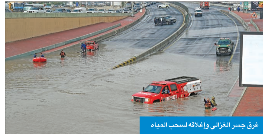
غرق جسر الغزالي وإغلاقه لسحب المياه