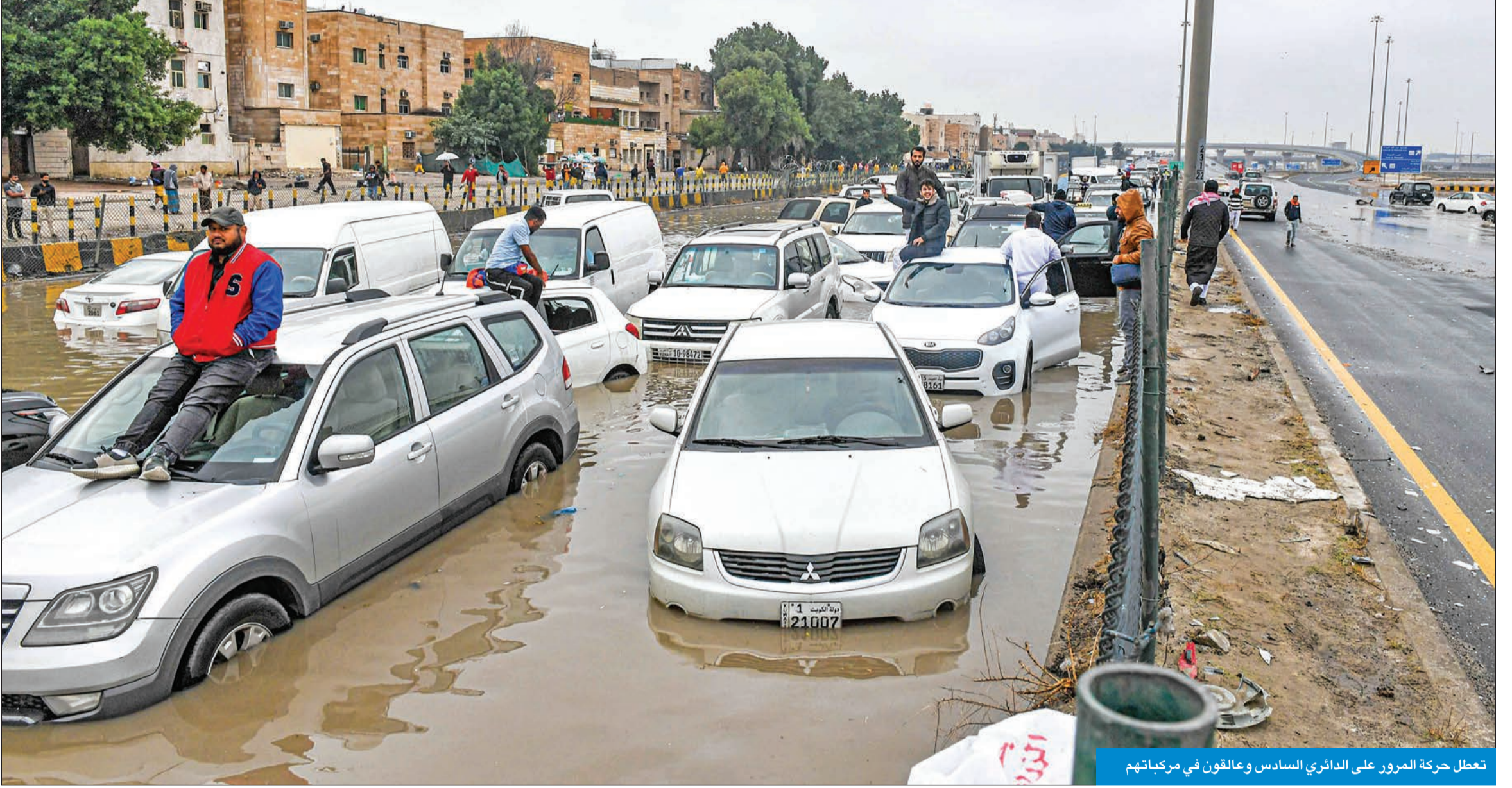
تعطل حركة المرور على الدائري السادس وعلقون في مركباتهم

استنفار الأجهزة الحكومية للتعامل مع المواقع المتضررة وإنقاذ العالقين في مركباتهم