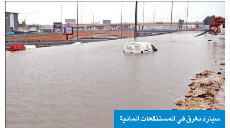
سيارة تغرق في المستنقعات المائية

شهدت الشوارع المختلفة تطاير الحصى من جراء الأمطار بكميات كبيرة اختلفت من موقع إلى آخر.