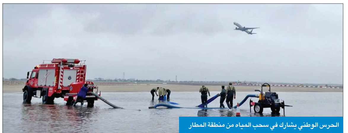
الحرس الوطني يشارك في سحب المياه من منطقة المطار