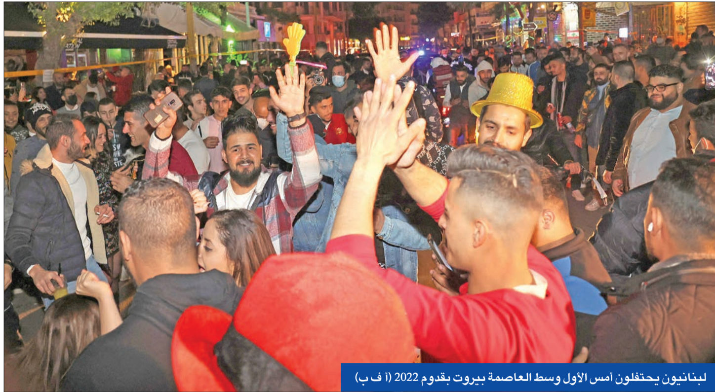
لبنانيون يحتفلون أمس الأول وسط العاصمة بيروت بقدم 2022

وقفنا وحدنا ضد مشاريع الخارج وأمراء الحرب في الداخل باسيل