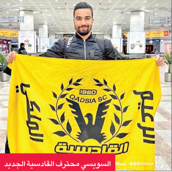
السويسي محترف القادسية الجديد