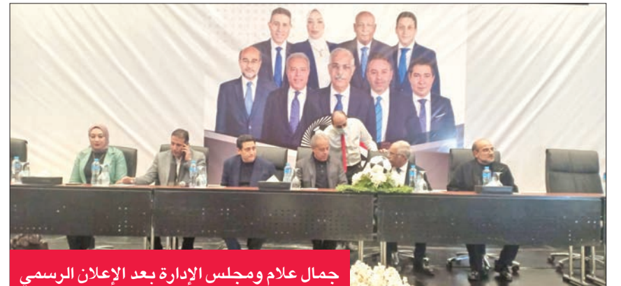
جمال علام ومجلس الإدارة بعد الإعلان الرسمي