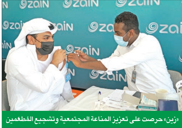
«زين» حرصت على تعزيز المناعة المجتمعية وتشجيع المُطعمين

شهد عام 2021 نقطة تحوّل محورية في جانحة «كورونا»، إذ اتخذت الكويت خطوات حذرة ومفعمة بالأمل نحو العودة التدريجية إلى الحياة الطبيعية، بعد أشهر طويلة من تطبيق الإجراءات الصحية الصارمة، والإغلاقات والجهود الضخمة بذلتها الصوف الأمامية في مكافحة آثار وتداعيات انتشار الوباء، وقد كانت زين -بصفتها إحدى كبرى شركات القطاع الخاص- في مقدمة المؤسسات الوطنية التي ساهمت في تمكين هذه العودة الحذرة من خلال دعمها للمعيد من المبادرات المجتمعية، وتعزيز الابتكار في ريادة الأعمال، وتمكين طموحات الشباب في عالم ما بعد «كورونا». وارتكزت جميع المبادرات التي أطلقتها ودعمتها «زين» خلال العام على استراتيجيتها المتكاملة للاستدامة والمسؤولية الاجتماعية، والتي امتدت عبر العديد من القطاعات الأكثر حيوية في المجتمع منها قطاعات الصحة والبيئة والتعليم والشباب وريادة الأعمال والرياضة وغيرها، وفي التقرير التالي، نستعرض «زين» أبرز البرامج والمشاريع المجتمعية التي أطلقتها ودعمتها خلال العام الماضي: