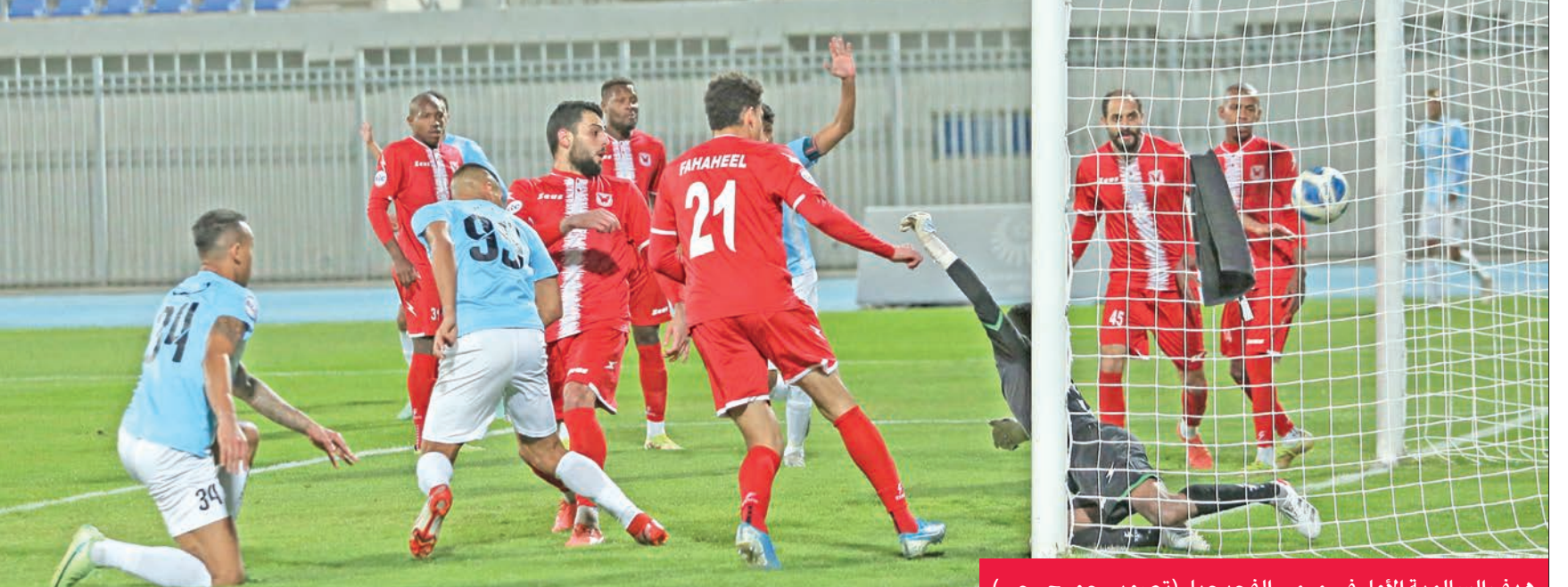
هدف السالمية الأول في مرمى الفحيحيل

3 نقاط، والعربي الخامس ب 11 نقطة، والتي تصب في مصلحة الأخضر بالطبع، فإن تعليمات مدربه الكرواتي انتي ميشا للاعبه جاءت بضرورة احترام المنافس، واللعب من أجل تحقيق الفوز حتى صافرة الحكم الأخيرة. ويولي ميشا ومعاونوه المباراة أهمية خاصة، خصوصا أن الفوز سيعيد به إلى أجواء المنافسة مجدداً، بعد أن ابتعد في الجولات الماضية بسبب سوء النتائج، لكن الفوز على الشباب في الجولة الماضية أعاد للفريق توازنه.