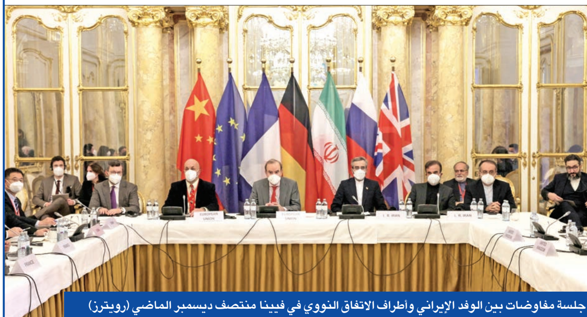
جلسة مفاوضات بين الوفد الإيراني واطراف الاتفاق النووي في فيينا منتصف ديسمبر الماضي

الاستخبارات العسكرية الإسرائيلية تخالف «الموساد» وتدعم «اتفاقاً نووياً» لكسب الوقت... وسجل بين عبد الله الثاني ولايب على «تويتز»