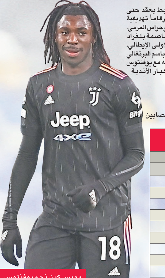
مويس كين نجم يوفنتوس