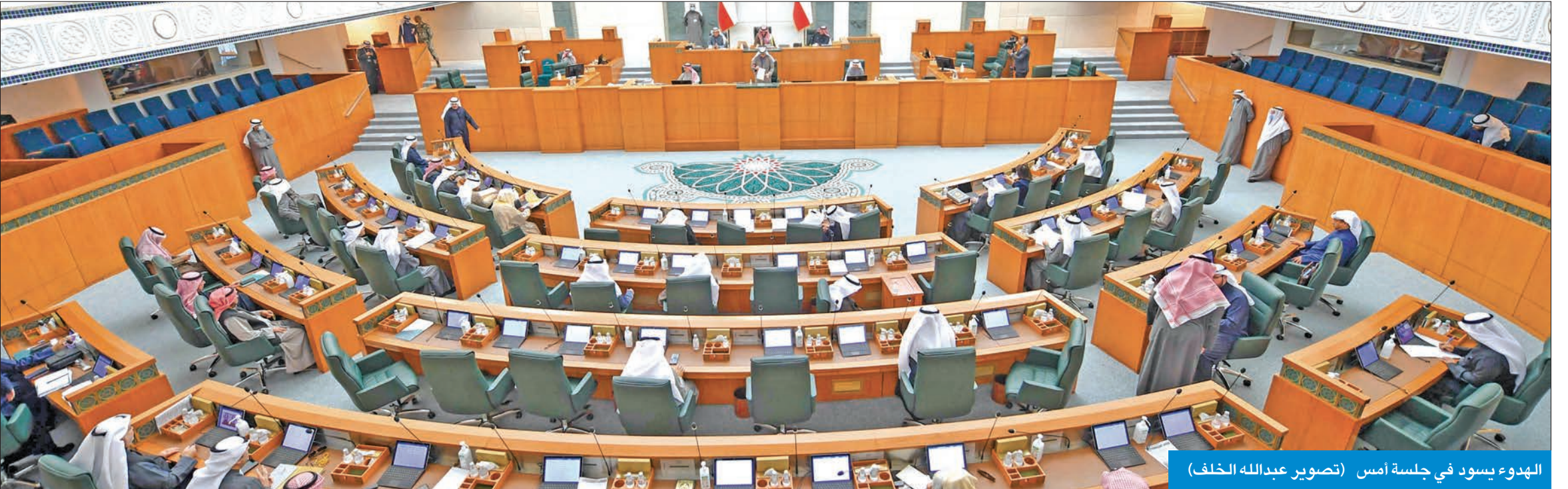
الهدوء يسود في جلسة أمس

الحكومة تتلقى تهديدات بالاستجابات في بند الأسئلة إذا لم ترد عليها في المواعيد المحددة