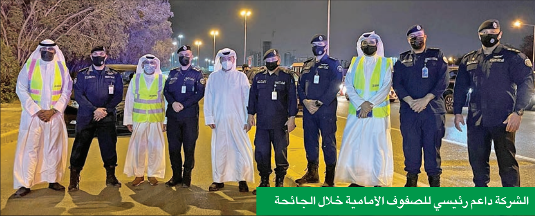
الشركة داعم رئيسي للصوف الأمامية خلال الجائحة