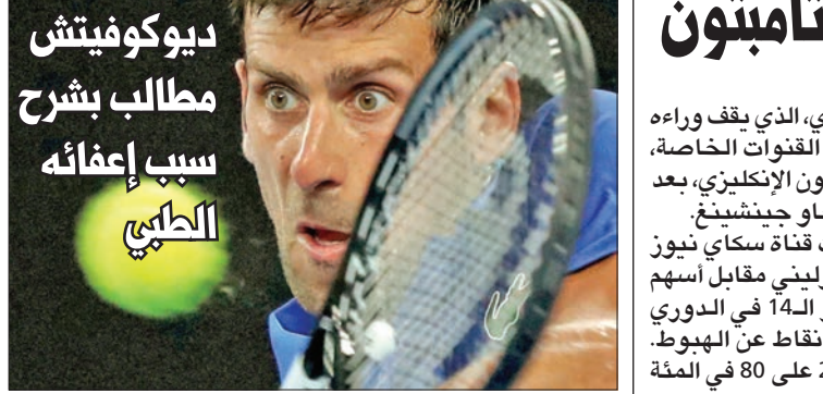
ديوكوفيتش مطالب بشرح سبب إعفائه الطبي

يذكر أن ليفربول قرر إلغاء المؤتمر الصحافي المقرر أمس عشية المباراة، وكان من المقرر أن يشارك فيه لياندرز.