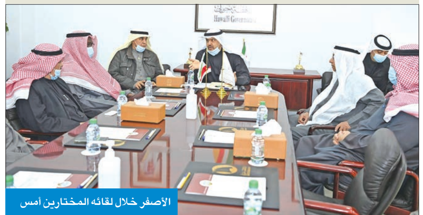
الأصفر خلال لقائه المختارين أمس

أكد محافظ حولي علي الأصفر ضرورة مد جسور التعاون مع المواطنين في جميع مناطق المحافظة، وتفعيل جميع أشكال التواصل الإيجابي لأخذ بملاحظات المواطنين ومشاكلهم.