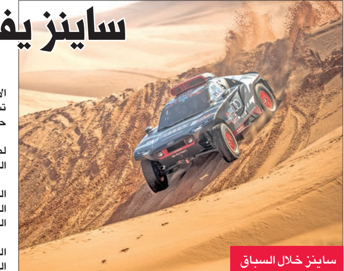
ساينز خلال السباق

فاز الإسباني كارلوس ساينز سائق فريق «أودي» أمس الأول، بالمرحلة الثالثة لفئة السيارات برالي داكار الذي تستضيفه السعودية للمرة الثالثة على التوالي ويستمر حتى 14 يناير الجاري. وجرت المرحلة الثالثة في القيصومة، وامتدت لمسافة 663 كم، منها 255 كم تملّثت بالمرحلة الخاصة الخاضعة للتوقيت. وجاء الجنوب إفريقي هينك ليتيجان في المركز الثاني، وحل الفرنسي بيتر هانسل بطل النسختة الماضية ثالثاً في الترتيب، وجاء السعودي يزيد الراجحي سائق فريق «أوفر درايف» في المركز السادس. وحافظ القطري ناصر العطية على صدارة الترتيب العام للرالي رغم احتلاله المركز الثامن في المرحلة الثالثة.