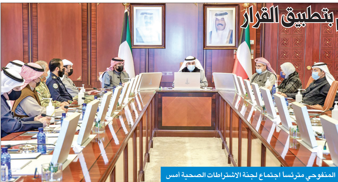
المنفوحى مترسدا اجتماع لجنة الاشتراطات الصحية أمس