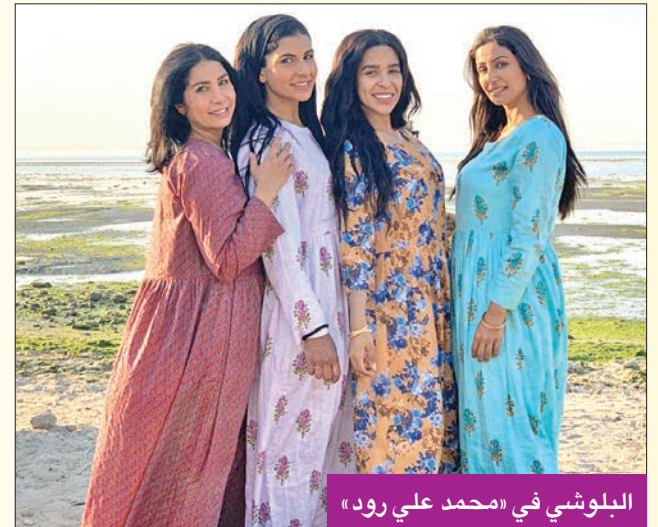
البلوشي في «محمد علي رود»

وحول التحول الذي سيطرأ على شخصية «أم حسين» في الجزء الثاني من «محمد علي رود»، قالت البلوشي: «هناك نقلة كبيرة في الأحداث الدرامية، التي تنتهدها شخصية «أم حسين» المسكينة،