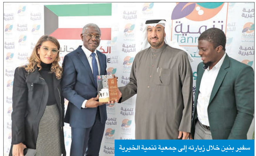
سفير بنين خلال زيارته إلى جمعية تنمية الخيرية