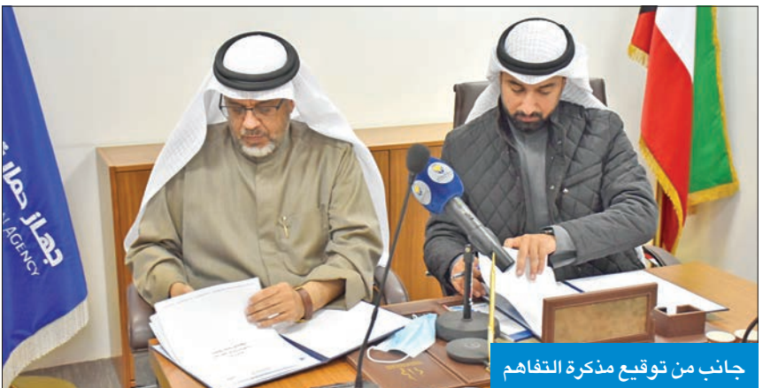
جانب من توقيع مذكرة التفاهم

تتضمن التعاون المشترك في البيانات والمعلومات