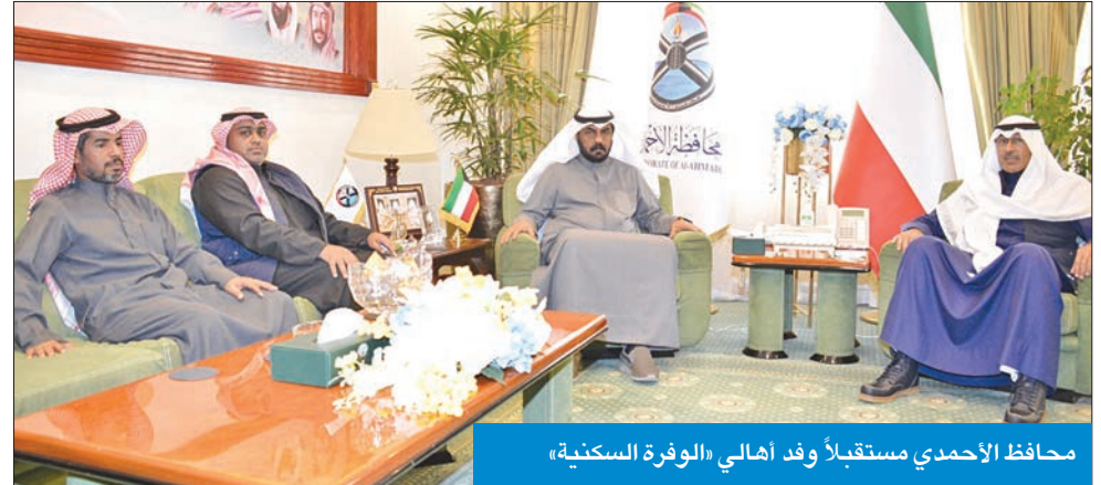
محافظ الأحمد مستقبلاً وفد اهالي «الوفرة السكنية»

على التواصل، مع الوعد بالدعم لاستيفاء احتياجات المنطقة لدى مختلف جهات الاختصاص الرسمية. من جانب آخر، هنا محافظ الأحمدى مجلس إدارة وأعضاء ومنتسبي نادي برقان الرياضي، بتخصيص موقع جديد للنادي بمدينة الأحمدى، متمنياً لهم المزيد من الإنجازات والعطاء في خدمة محافظتهم ووطنهم.