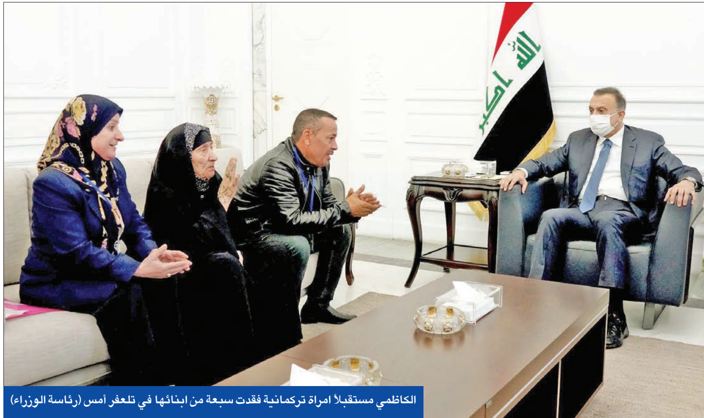
الكاظمي مستقبلاً امرأة تركمانية فقدت سبعة من ابنائها في تلعفر أمس

● الكعبي: لا هدنة ولا تهدئة ● «البتاغون» تحتفظ بـ «حق الرد» على «ميليشيات إيران»