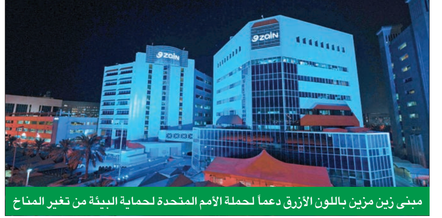
مبنى زين مزين باللون الأزرق دعماً لحملة الأمم المتحدة لحماية البيئة من تغير المناخ

«الشركة حرصت على تطعيم موظفيها وعائلاتهم ومؤازرة الطواقم الطبية وتشجيع المُطعمين»