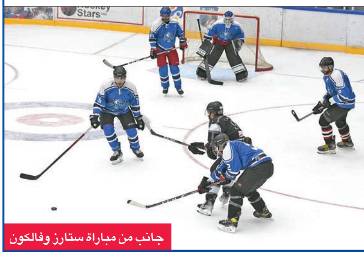
جانب من مباراة ستارز وفالكون

عزز فريق «كويت ستارز» صدارته لمنافسات بطولة الدوري الكويتي لهوكي الجليد للرجال للموسم الرياضي الحالي، الذي ينظمه نادي الألعاب الشتوية، بعد فوزه على ملاحقه المباشر فريق «فالكون» بنتيجة 7 أهداف مقابل 4 رافعا رصيده إلى 19 نقطة بينما بقي الخاسر ثانياً بـ 14 نقطة.