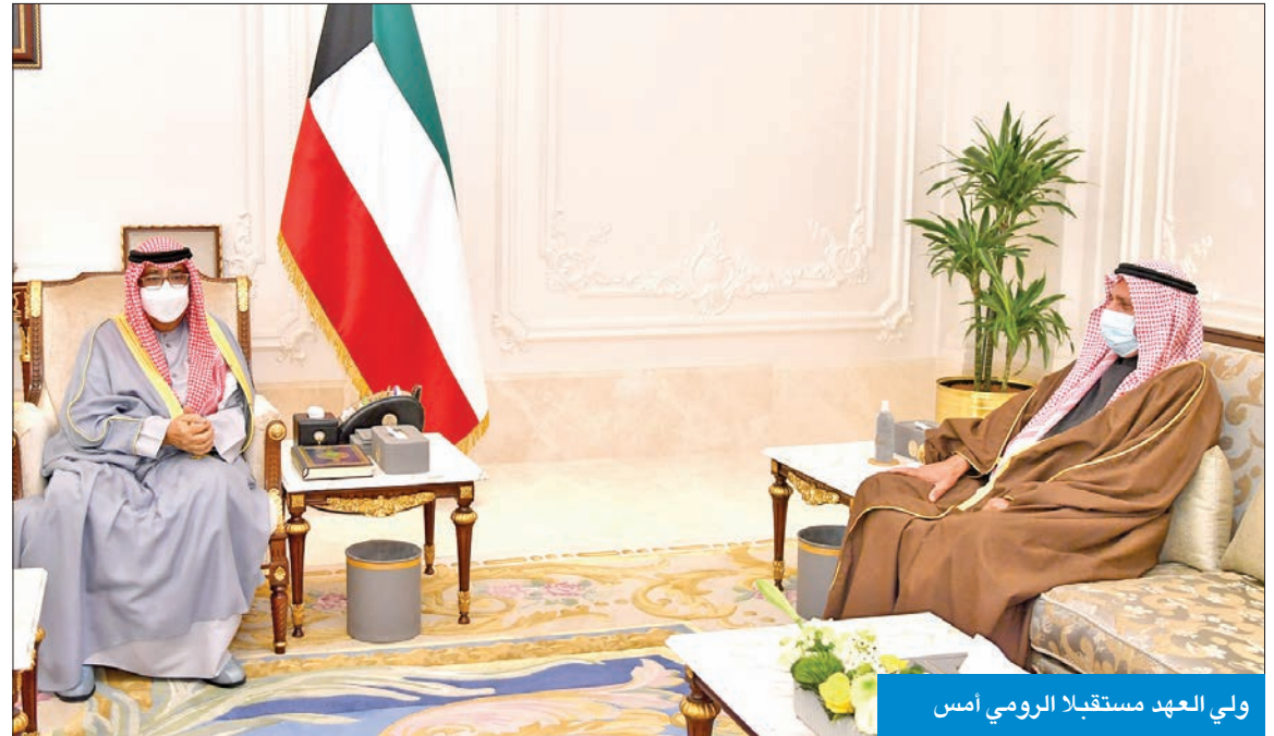
ولي العهد مستقبلاً الرومي أمس

إخلاص وتفان، معرباً سموه عن شكره وتقديره له على ما بذله من جهد وعطاء لمصلحة وطنه، خلال فترة توليه منصبه الوزاري، متمنياً سموه له دوام التوفيق والسداد.