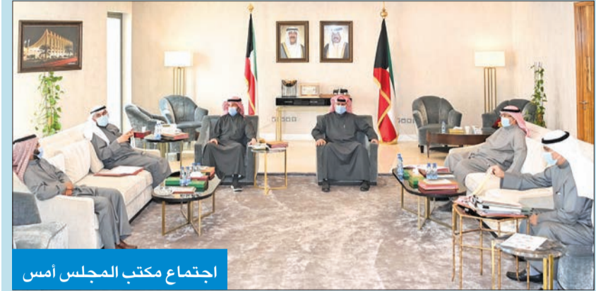
اجتماع مكتب المجلس أمس