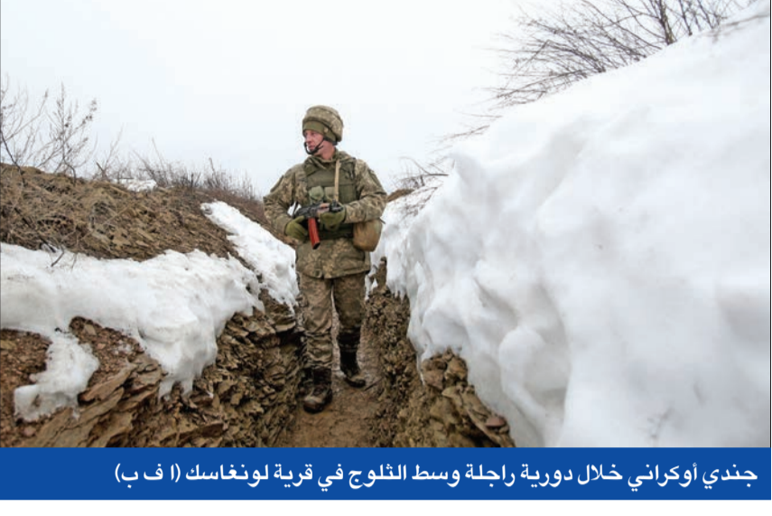
جندي أوكراني خلال دورية راجلة وسط الثلوج في قرية لونغاسك (أ ب)

نقلت صحيفة بوليتكو الأميركية عن مسؤولين أميركيين وأوكرانيين أن واشنطن ستنتقل سراً أسلحة بينها أنظمة رادار وبعض المعدات البحرية، بقيمة 200 مليون دولار، إلى كييف، في خضم مواجهة متوترة مع روسيا. وقال مستشار للرئيس الأوكراني، فولوديمير زيلينسكي، للصحيفة إن الأوكرانيين أبلغوا بالمساعدات المقيمة الشهر الماضي، مضيفا أنه «نظراً إلى أن الاستخبارات الأميركية تشير باستمرار إلى أن روسيا قد تشن غزوا شاملاً، باستخدام كل قوتها العسكرية، فإن هذه المساعدة ستسمح لنا بإلحاق أضرار إضافية بروسيا، لكنها لن تغير النتيجة بشكل كبير». وكشفت «بوليتكو» أن الموافقة على مبلغ 200 مليون دولار جاءت ضمن سلطات الرئيس جو بايدن، التي تخوله أن يطلب من وزير الدفاع تسليم مواد من مخزون البناتون الحالي إلى دولة معرضة للخطر.