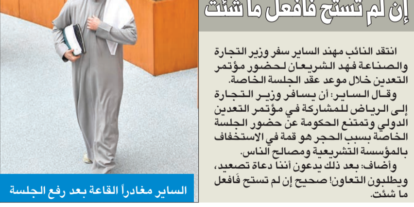
السائر مغادراً القاعة بعد رفع الجلسة