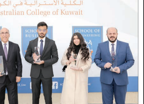
شارك طلبة هندسة الكهرباء لدى الكلية

اعلنت "دائنة غاز"، وشريكها "نفط الهلال"، تحقيقهما إنتاج غاز قياسي من إقليم كردستان العراق، وصل إلى 452 مليون قدم مكعبة قياسية يومياً بنهاية عام 2020. ويعد مستوى الإنتاج هذا نتيجاً للعديد من التحسينات التشغيلية التي تم إجراؤها في محطة خورمور لمعالجة الغاز، بما في ذلك مشروع التحويلة الذي تم الانتهاء منه عام 2020، ومشروع إزالة الإخفاق الذي تم الانتهاء منه قبل ذلك عام 2018. وقد أدت هذه التحسينات إلى زيادة الإنتاج بنسبة 50 بالمائة، مقارنة بـ 305 مليون قدم مكعبة يومياً عام 2018. وتقوم شركتا دائنة غاز و"نفط الهلال"، بتشغيل حقل خورمور وجميعما بالنجابة عن ائتلاف "بيرل بترولويوم"، ويقومان بتوفير الغاز المستخدم في توليد الكهرباء في إقليم كردستان العراق، وكذلك إنتاج نحو 16 ألف برميل من المكثفات و 1000 طن من الغاز البترولي المسال يوميا. وسيعمل مشروع توسعة "خورمور 250" قيد التنفيذ حالياً، على تعزيز الطاقة الإنتاجية للمحطة بنسبة 55 بالمائة، لتصل إلى 700 مليون قدم مكعبة قياسية