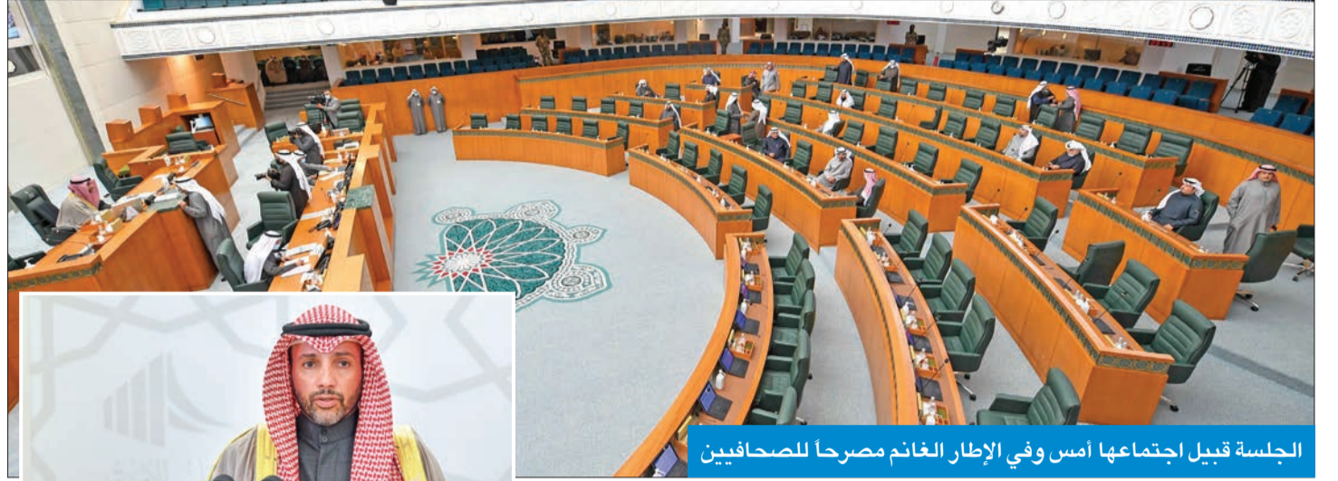
الجلسة قبيل اجتماعها أمس وفي الإطار الغانم مصرحاً للصحافيين