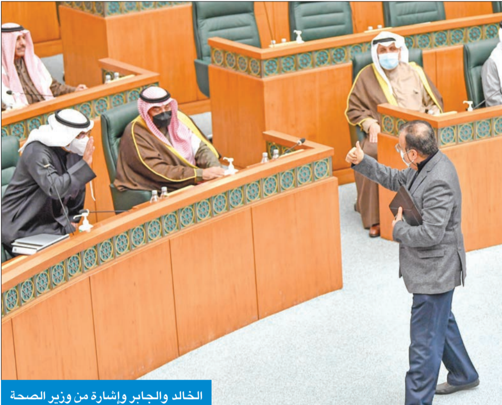
الخالد والجابر وإشارة من وزير الصحة

● التخوف من إسقاط القانون يمنع المجلس من التعجل في إقراره بالثانية