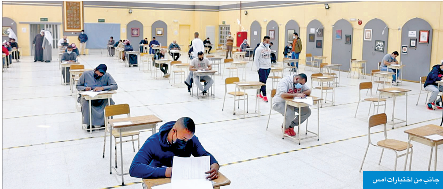
جانب من اختبارات امس

إلى ذلك، أدى طلبة القسمين العلمي والأدبي اختبارهم الثاني في مادة اللغة العربية،