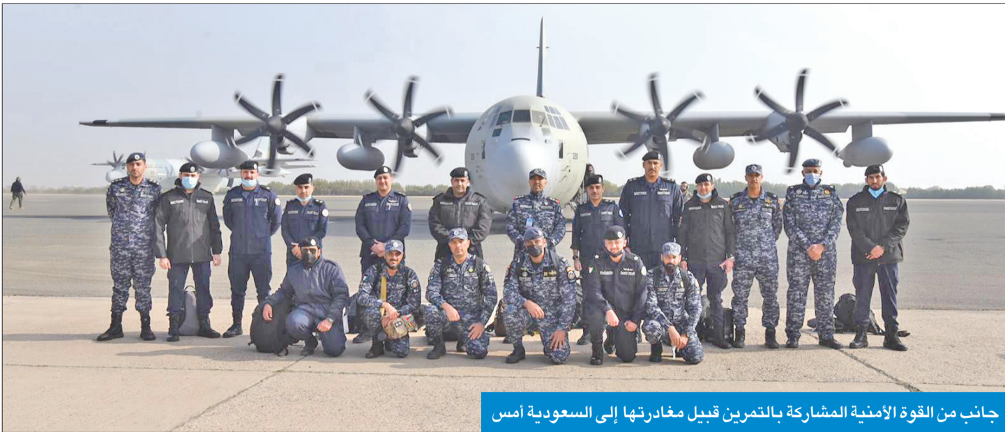
جانب من القوة الأمنية المشاركة بالتمرين قبيل مغادرتها إلى السعودية أمس

غادرت البلاد، صباح أمس، القوة الأمنية الكويتية المشكّلة من عدة قطاعات بوزارة الداخلية، عبر المنفذ البري والجوي، متوجهة إلى السعودية للمشاركة في فعاليات التمرين التعاوني الخليجي المشترك «أمن الخليج 3»، والذي سيقام خلال يناير الجاري.