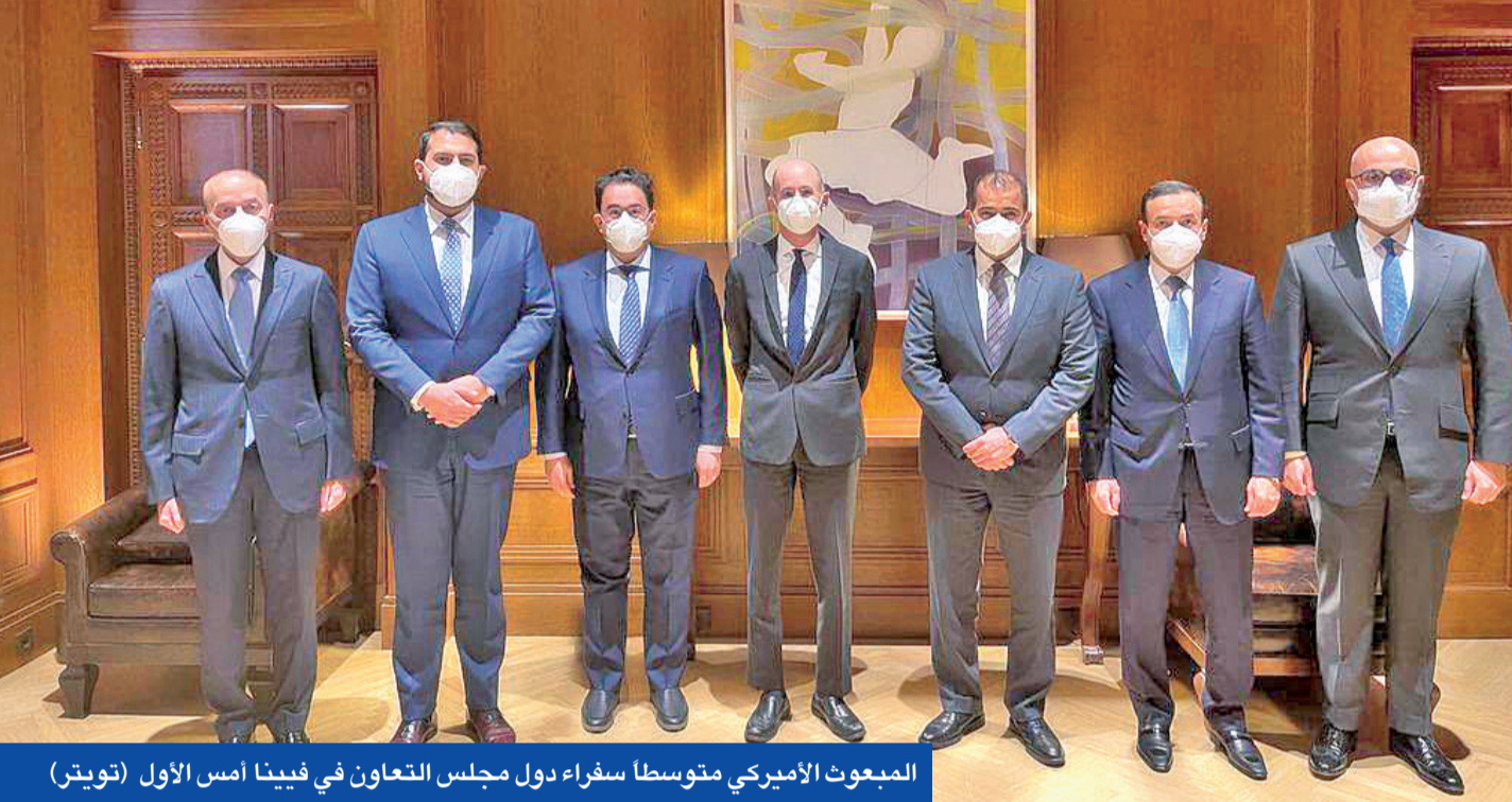
المبعوث الأميركي متوسطاً سفراء دول مجلس التعاون في فيينا أمس الأول

بينيت وبوتين يبحثان التطورات... وعبداللهيان يصل إلى بكين لبحث تفعيل «صفقة ربع القرن»