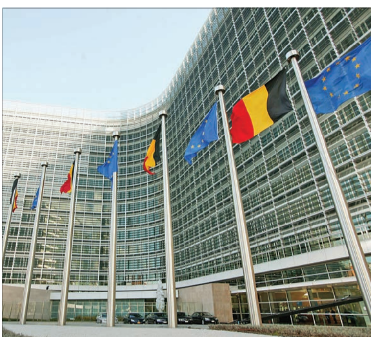
أحد الأسماء التي تطلق على الأبناء بروكسل خلال عام 2021.

احتل اسم محمد المركز الأول من بين أكثر الأسماء شيوعاً التي تطلق على الأبناء حديثي الولادة، في قلب الاتحاد الأوروبي في بروكسل خلال عام 2021. وتشير البيانات، التي نشرها مكتب الإحصاء البلجيكي "Statbel"، ونقلها موقع سبوتنيك أمس، إلى أن اسم محمد باحتراف طريقة كتابته "Mohamed and Mohammed"، من أكثر الأسماء شيوعاً للأطفال حديثي الولادة المولودين في منطقة بروكسل العام الماضي، بإجمالي 18.430 اسماً مسجلاً، بحسب موقع "ريميكس نيوز". وبحسب البيانات، كان اسم "Mohamed" الأكثر شيوعاً، حيث سجل 13595 مرة، والاسم الثاني الأخر شيوعاً هو "جين" عند 6089، بينما حصل "Mohammed" على المركز الثالث بـ 4835. وتم إعطاء أسماء العشرة الأوائل للمواليد الجدد في العاصمة الفلمنكية للاتحاد الأوروبي إلى 55232 طفلاً، حيث تمت تسمية 43 في المئة منهم باسماء إسلامية تقليدية، واحتل أحمد المرتبة الرابعة بين أكثر الأسماء شهرة، حيث بلغ عدد المسجلين 4166.