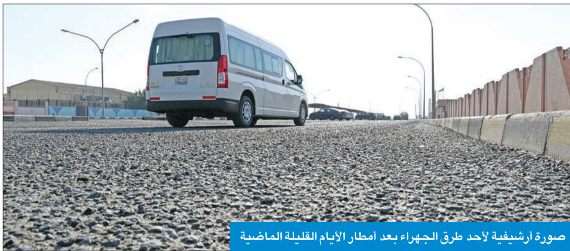
صورة أرشيفية لأحد طرق الجهراء بعد أمطار الأيام القليلة الماضية

بالتعاون مع مكتب محلي وجار تصميمها حالياً لرفع القدرة الاستيعابية للطريق ليصبح ذا مواصفات عالمية وقياسية مع تطوير التقاطعات القائمة والتي تخدم المنطقة لتصبح تقاطعات متعددة المستويات لخدمة حركة المرور الحالية والمستقبلية.