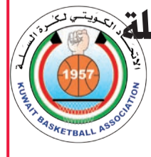
الكويت لكرة السلة

مع نجمها ساديو ماني عن حجز بطاقة العبور، عندما تلاقي غينيا في مباراة قوية في بافوسام بين فريقين حقاً الفوز في الجولة الأولى. فقد تغلب «أسود التيرانغا» على زيمبابوي بهدف قاتل من ركلة جزاء في الدقيقة السابعة من الوقت الجدل الضائع، حمل توقيع ماني نجم ليفربول الإنكليزي. أما غينيا، فحققت بدورها فوزاً ضيقاً أيضاً على مالاوي بهدف وحيد. وفي المجموعة عينها، يتوقع أن تنحصر منافسة مالاوي وزيمبابوي على مركز ثالث قد يؤهل للأدوار الاقصائية.