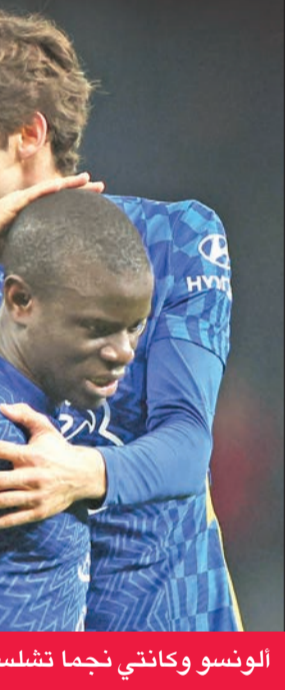
الونسو وكناتي نجما تشلسي

وهذه المرة الأولى التي يبلغ فيها تشلسي نهائي المسابقة منذ عام 2019، حيث طمّح إلى معانقة الكأس للمرة الأولى منذ عام 2015، كما قاد المدرب