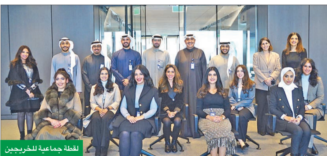
لقطة جماعية للخريجين

منذ 13 عاماً تجسيدا لاستراتيجية البنك الهادفة إلى توظيف الكفاءات الوطنية من الخريجين الجامعيين الجدد، إضافة إلى العمل على تطويرهم وتمكينهم من العمل في القطاع المصرفي.