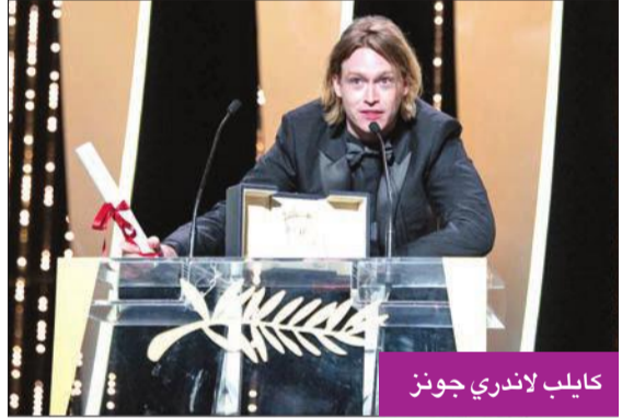
كايلب لاندري جونز

يستعد الممثل العالمي كايلب لاندري جونز لبطولة فيلم في الربيع للمخرج والمنتج الفرنسي لوك بيسون على ما أعلنت مجلة "قرايبي" المتخصصة.