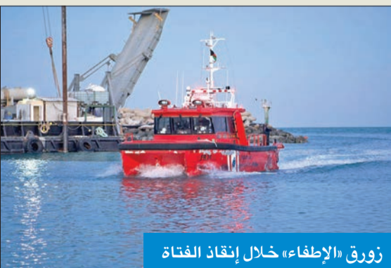
زورق الإطفاء خلال إنقاذ الفتاة

إغماء داخل البحر. وأضافت الإدارة أنه تم إنقاذ الفتاة والتوجه بها إلى اليابسة وتسليمها للطوارئ الطبية وهي بحالة صحية مستقرة مع فتح تحقيق لمعرفة أسباب الواقعة.