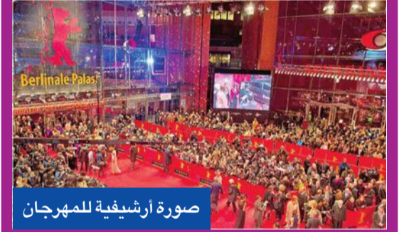
صورة أرشيفية للمهرجان

بحضور الجمهور، يقام مهرجان برلين السينمائي الشهر المقبل وسط احترازاات صحية مشددة، وتحددت سعة المقاعد المتاحة بدور العرض بنسبة 50% مع مطالبة الحضور بالالتزام بقواعد صارمة لمواجهة انتشار فيروس كورونا.