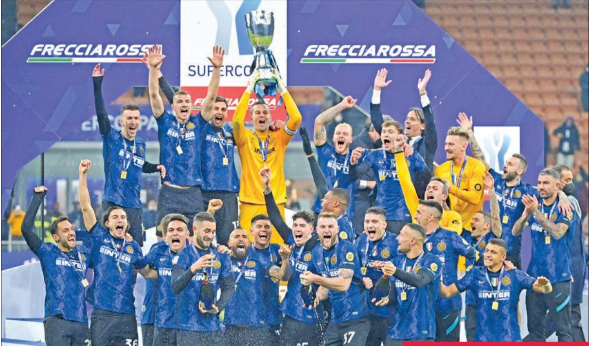
جانب من مراسم تتويج إنتر ميلان

بيرشيتش (72)، لينتهي الوقت الأصلي بالتعادل 1-1. وبينما كانت المباراة تتجه نحو ركلات الترجيح، وصلت كرة ماتيو دارميان إلى البديل المخضرم سانثيس سدها في رمى السيدة العجوز حاسماً للقب (1+120).