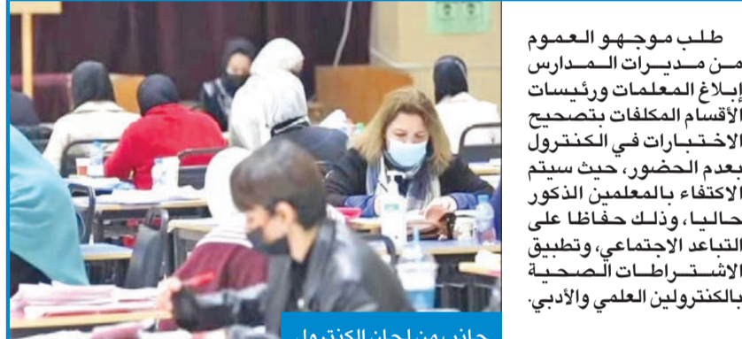
جانب من لجان الكنترول

طلب موجهو العموم من مديرات المدارس إبلاغ المعلمات ورئيسات الأقسام المكلفات بتصحيح الاختبارات في الكنترول لعدم الحضور، حيث سيتم الاكتفاء بالمعلمين الذكور حالياً، وذلك حفاظاً على التعاقد الاجتماعي، وتطبيق الاشتراطات الصحية بالتعاون والانسجام مع لجان الكنترول العلمي والأدبي.