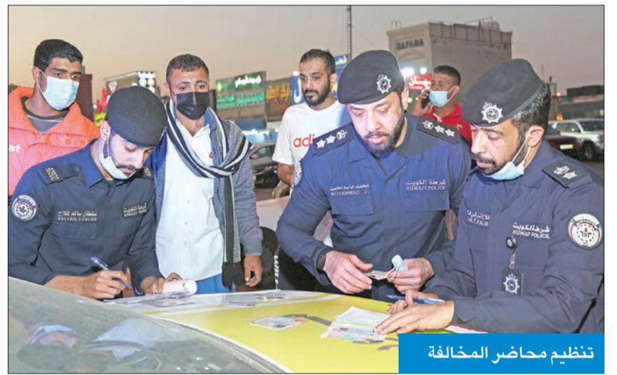
تنظيم محاضر المخالفة