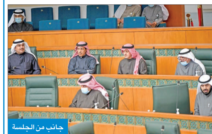
جانبا من الجلسة