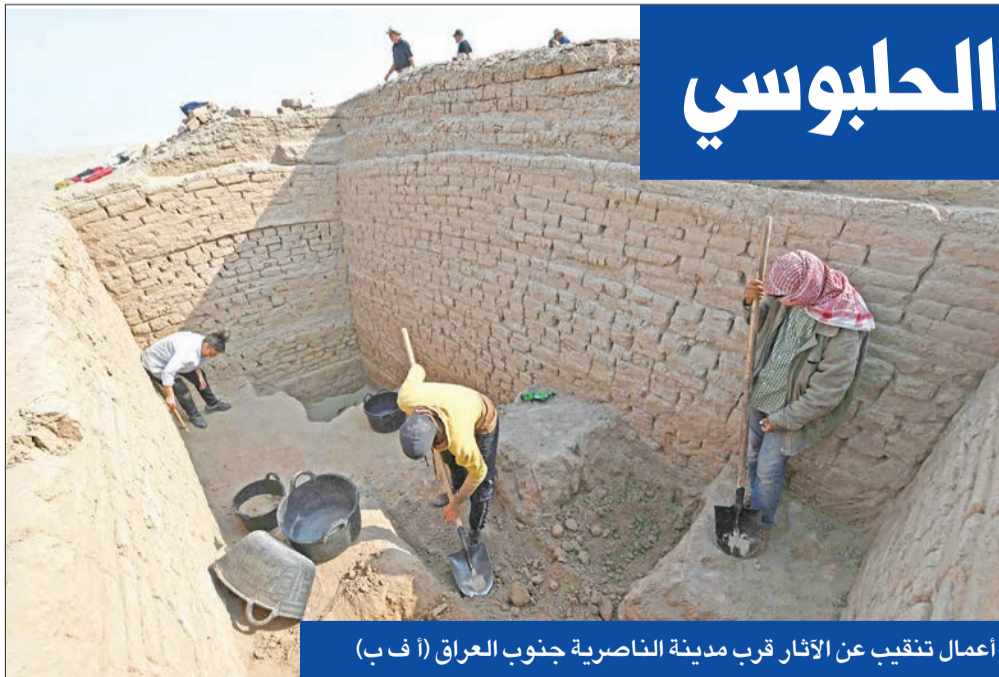
اعمال تنقيب عن الآثار قرب مدينة الناصرية جنوب العراق (أ ب)

يمكنني القول أصبح مؤكداً أنه سيكون رئيس الجمهورية للسنوات الأربع القادمة، وسينال ذات الأصوات التي نالها الرئيس الحلبوسي تقريباً، وذلك لأن جميع نواب أقطاب تحالف عزم تقدم - الديمقراطي - التجار، واصداقأهم سببوتون له، «مضيفاً: «ساكون له من المصوتين والداعمين».