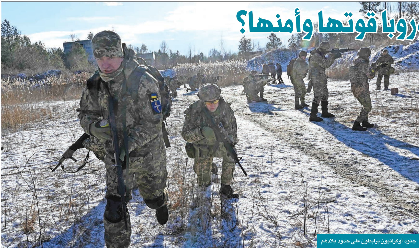
جنود أوكرانيون يرابطون على حدود بلادهم