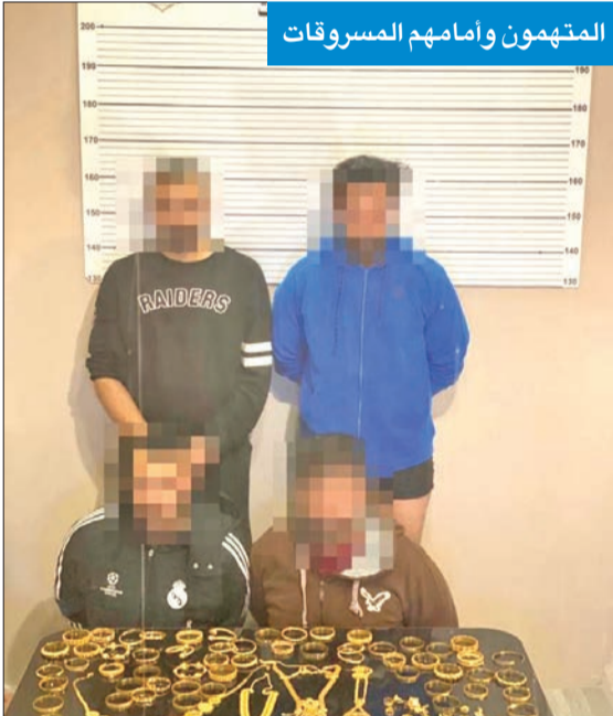
المتهمون وأمامهم المسروقات

وأوضح المصدر أن رجال مباحث العاصمة تمكنوا من تحديد هوية أحد أفراد التشكيل العصابي، وهو مقدم بصورة غير قانونية من أرباب السوابق، وحددوا محل وجوده في أحد المخيمات بمنطقة «أريحية»، وتمكنوا من ضبطه واقتياده إلى مكتب التحقيق، حيث اعترف على شركائه في الجريمة، والذين تم القبض عليهم في أماكن