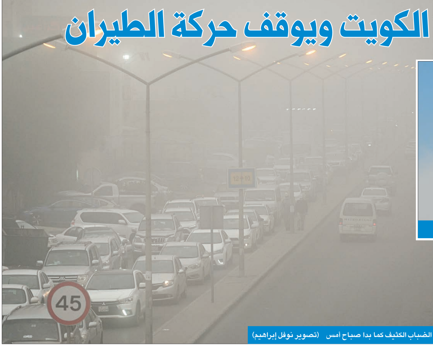
الضباب الكثيف كما بدا صباح أمس