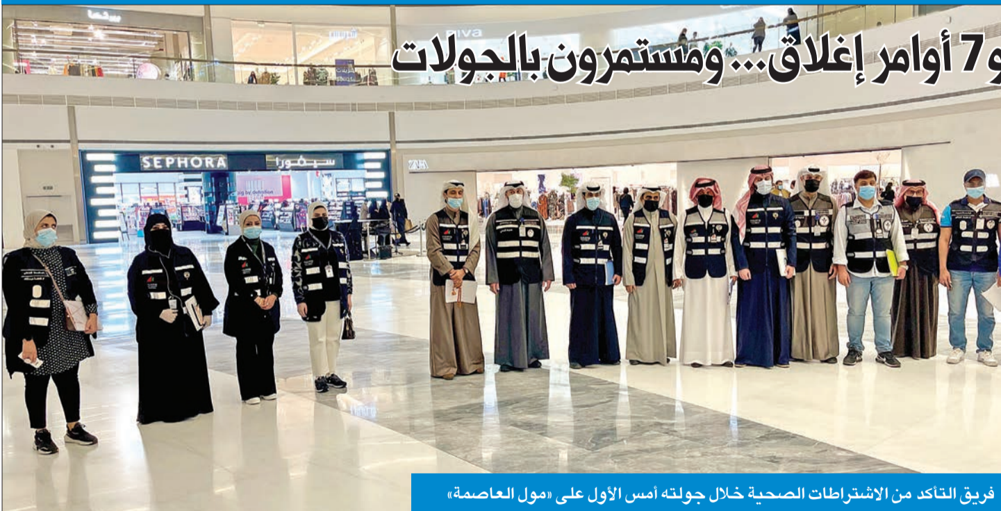
فريق التاكد من الاشتراطات الصحية خلال جولته أمس الأول على «مول العاصمة»