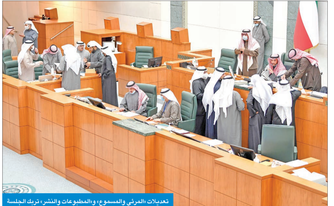
تعديلات «المرئي والمسموع» و«المطبوعات والنشر» تترك الجلسة

وطالب رئيس المجلس النواب بتقديم أي تعديلات يرونها مكتوبة قبل التصويت على المرئي والمسموع، ومن لديه رأي فليعبر عنه في التصويت أو يقدم تعديلات مكتوبة فيما يتعلق بالمرئي والمسموع.