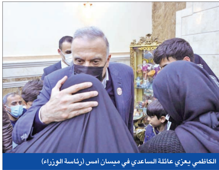
الكاظمي يعزي عائلة الساعدي في ميسان أمس

في ظل الانسداد السياسي والمخاوف من أن الانقسام الشيعي العميق بين مقتدى الصدر من جهة والقوى الشيعية الأخرى المحسوبة على إيران من الجهة الأخرى قد ينزلق إلى توتر أمني، وجه رئيس الوزراء مصطفى الكاظمي رسالة شديدة ال لهجة، محذراً من أن الفوضى ستمتد إلى دول في المنطقة.