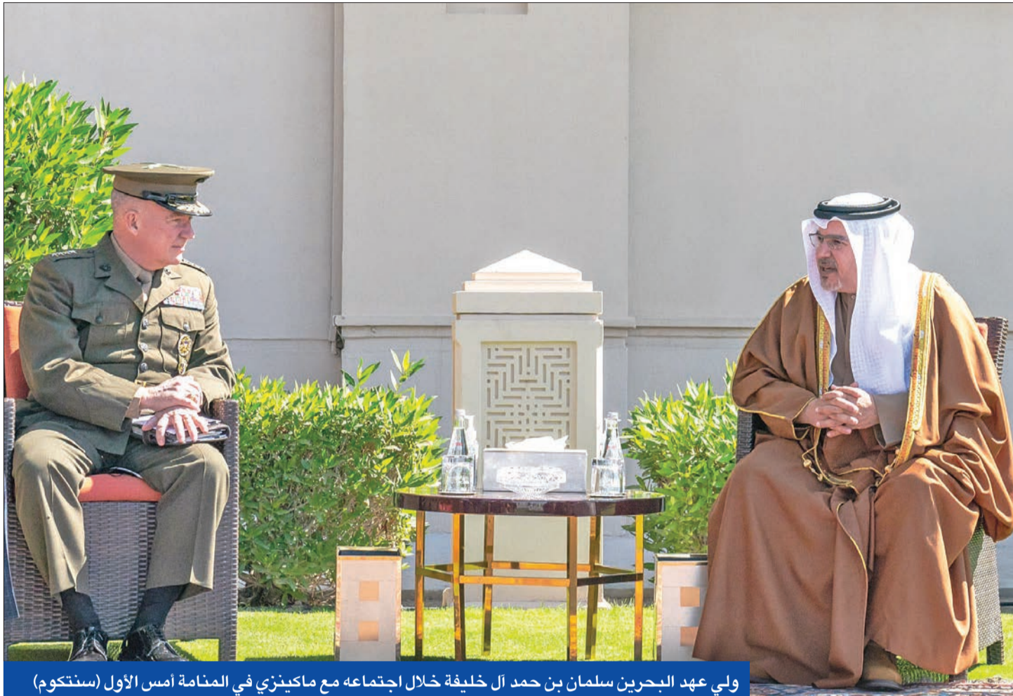
ولي عهد البحرين سلمان بن حمد آل خليفة خلال اجتماعه مع ماكينزي في المنامة أمس الأول (ستوكوم)

غداة استئناف المحادثات الدولية، التي انطلقت مطلع أبريل الماضي، بشأن الملف النووي الإيراني في فيينا، بعد توقف استمر 10 أيام، غير مباشر في المباحثات، بماقوى تهديد لطهران في حال لم تنجح الجهود الدبلوماسية النووية المبرم عام 2015.