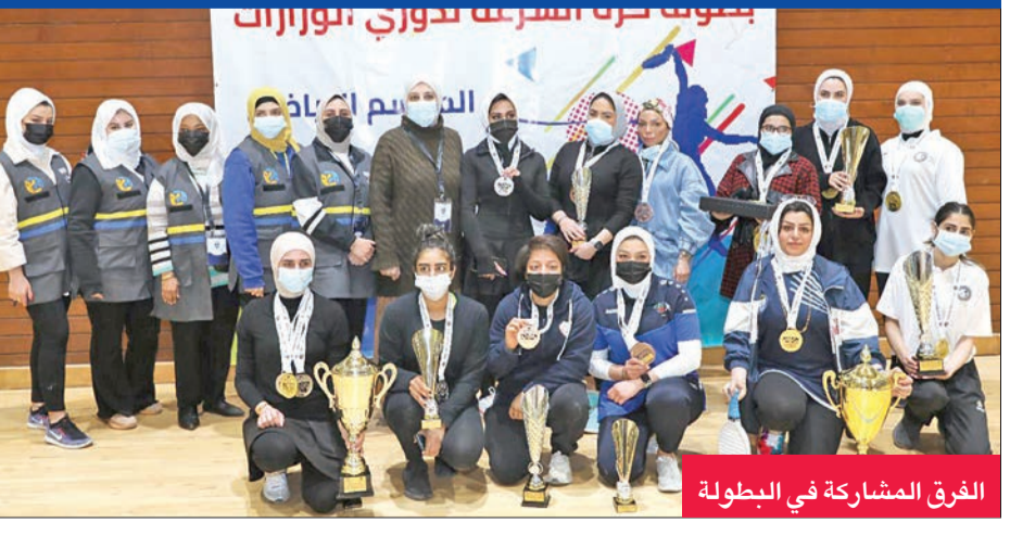
الفرق المشاركة في البطولة