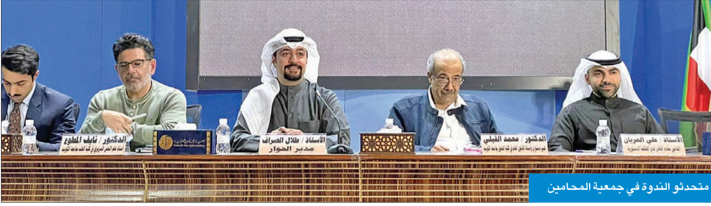
متحدثو الندوة في جمعية المحامين

العريان: جهات رسمية وفتاوى دينية اعترفت باضطراب الهوية الجنسية... والمادة 198 فضفاضة