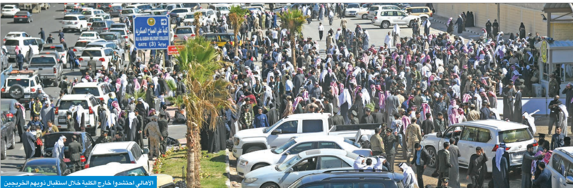
الأهالي احتشدوا خارج الكلية خلال استقبال ذويهم للخريجين

الرفاعي، ونائب رئيس الأركان العامة للجيش الفريق الركن فهد الناصر، ووكيل وزارة الداخلية بالتكليف أنور البرجس، وأعضاء مجلس الدفاع العسكري وعدد من كبار الضباط القادة بالجيش ووزارة الداخلية والحرس الوطني.