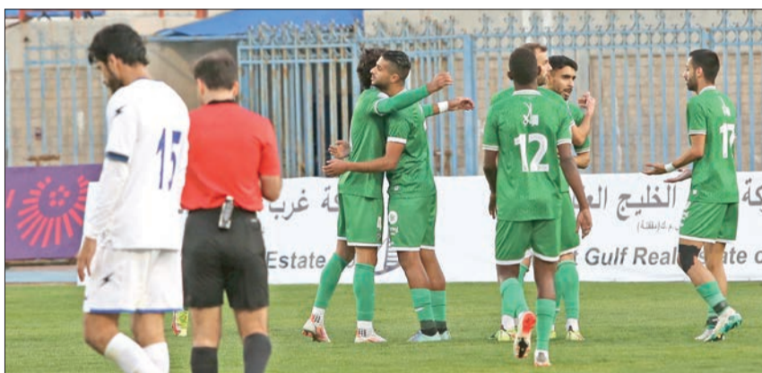
لاعبو العربي يحتفلون بهدف التقدم

مهمته خلفاً للمدرب سلمان عواد. ويفتقد النصر خليفة رحيل فقط بسبب الإصابة، الأمر الذي سيتيح للمشعاع اختيار التشكيل الأنسب للقاء دون ضغوط.