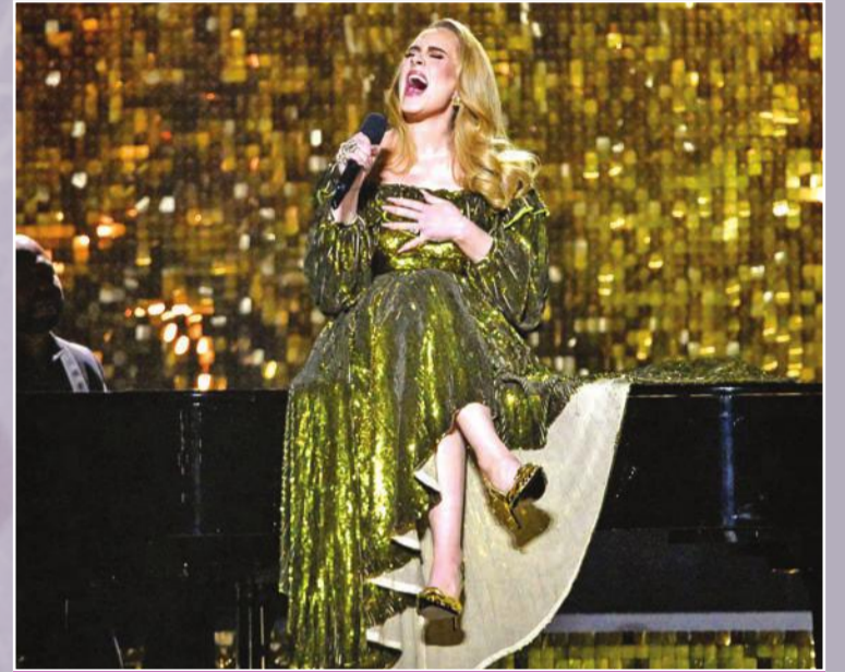
أديل تغني في الحفل

فازت النجمة أديل بالجوائز الثلاث الكبرى في حفل توزيع جوائز بريت (BRIT Awards)، في أول نسخة من الحفل السنوي لتوزيع جوائز موسيقى البوب في بريطانيا لا تتضمن فئات على أساس النوع. وحصلت المغنية ومؤلفة الأغاني المولودة في لندن، والتي أطلق عليها مقدم الحفل مو جيليجان «ملكة بريت»، على الجائزة الأولى في الاحتفال، وهي جائزة أغنية العام عن أغنياتها التي تصدرت قائمة الأكثر استماعاً (إيزي أون مي). وكانت هذه أول أغنية يتم إصدارها ضمن ألبومها «30» الذي دشّن عودتها. وكرّمت أديل أنها قدمت شرح ملبسات طلاقها لابنتها الصغرى. كما نالت جائزة اليوم العام.