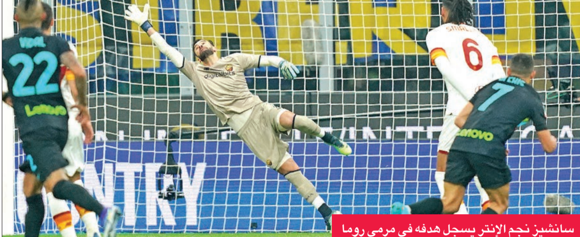
سانشيز نجم الإنتر يسجل هدفة في مرعى روما

تسديدة من مسافة بعيدة لنيكولو باريللا (6). ويعد السيطرة المطلقة لإنتر، دخل روما تدريجياً في أجواء اللقاء وكان قريباً من تقليص الفارق عبر نيكولو زانولولو لكن الحارس السلوفيني سمير هاندانوفيتش تالق في الدفاع عن مرماه (19). ورغم بعض المحاولات للطرفين، بقي هدف دجيكو الفاصل بينهما حتى نهاية الشوط الأول الذي خسرت إنتر في ثوانيه الأخيرة جهود اليساندرو باستوني واستبدله بالهولندي ستيفن دي فراي. وجاءت بداية الشوط الثاني رتيبة مع بعض المحاولات الخجولة حتى الدقيقة 62 حين أطلق البرتغالي سيرجيو أوليفيرا كرة صاروخية من خارج المنطقة تحولت من أحد مدافعي إنتر وكانت تدخ هاندانوفيتش، إلا أن الأخير تالق وانقذ الموقف.