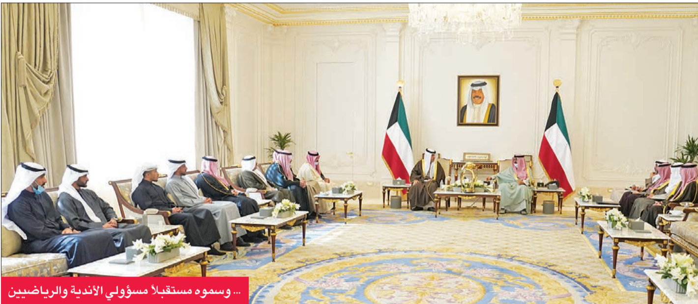
... وسموه مستقبلاً مسؤولي الأندية والرياضيين