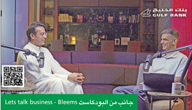
جانب من البودكاست Lets talk business - Bleems

تمويلية من مستثمرين حالياً، فليد الشركة السيولة الكافية لاستمرار أعمالها والتوسع المستقبلي. وأضاف: هذا لا ينفي حقيقة أن كل استثمار مطروح للبيع، وبالتالي استراتيجية التخارج مطروحة على الطاوله، سواء بالاستحواذ أو الإراج أو دخول مستثمر استراتيجي. وكشف أن شركة العديلية القابضة الماكلة لشركة Bleems تعكف حالياً على الاستثمار في مجال العطورات والتجميل بالتعاون مع شركة كبرى على مستوى الكويت والخليج، وتوقع أن يرى المشروع النور خلال أشهر.