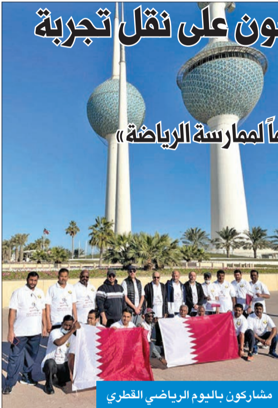
مشاركون باليوم الرياضي القطري

إلى ساحة كبرى لممارسة الرياضة، يتم فيها تشجيع الجميع من كل الأعمار على ممارسة الأنشطة والفعاليات الرياضية المختلفة التي تقيمها الجهات الحكومية والخاصة برفقة أفراد الأسرة حتى يستطيع الجميع المشاركة في فعاليات اليوم الرياضي للدولة.