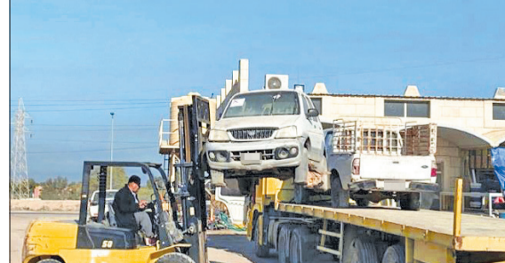
جانب من رفع السيارات المهملة

وأعلن بلدية الكويت أن الفريق الرقابي بمحافظة الجهراء رفع خلال جولاته الميدانية، أمس، 9 سيارات مهملة، ووضعت 23 ملصقا على السيارات المهملة، وتم رفع 4 دراجات نارية بائع متجول بمطقتي العبدلي وسعد العبدللة.