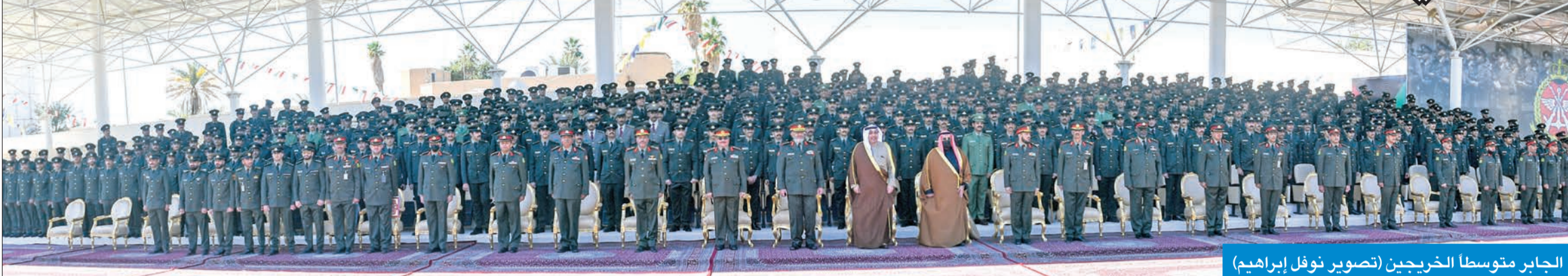
الجابر متوسماً للخريجين

الطالبة الضباط 48 المكونة من 327 طالباً ضابطاً منهم 313 من الجيش الكويتي و10 من الحرس الوطني و4 من قطر الشقيقة. وأشار إلى الطالبة الضباط من خريجي الكليات بالدول الشقيقة والصديقة وهم طالب من الكلية الملكية البريطانية و19 طالباً من الكلية البحرية بمصر الشقيقة وطالبان من كلية الملك فيصل الجوية بالسعودية الشقيقة، مبيناً أن عدد منتسبي دورة تاهيلية الضباط الأولى 157 طالباً ضابطاً بينما بلغ عدد منتسبي دورة الضباط الأطباء الأولى 43 طالباً ضابطاً.