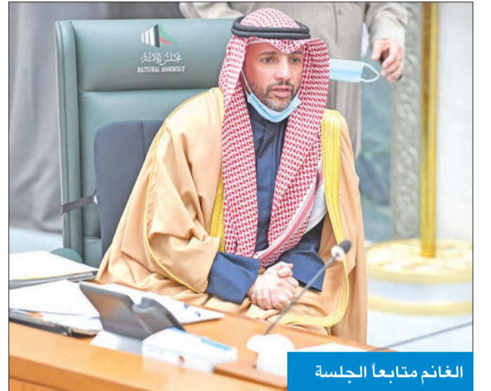
الغانم متابعاً الجلسة