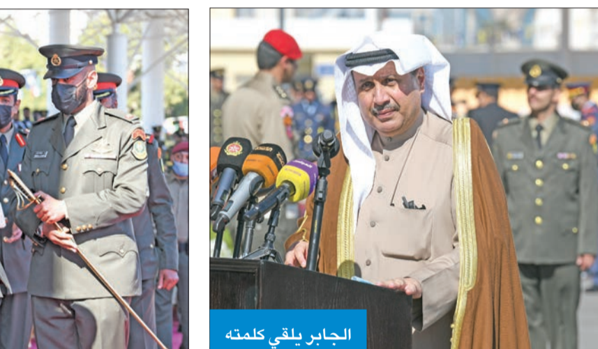
الجابر يلقي كلمته

واختتم كلمته بتقديم الشكر لمنتسبي كلية علي الصباح العسكرية، من قادة وضباط، ومعلمين ومدربين وإداريين،