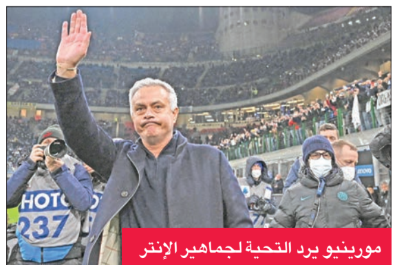
مورينيو يرد التحية لجمهور الإنتر

لم تكن الزيارة الأولى للمدرب البرتغالي جوزيه مورينيو إلى ملعب فريقه السابق إنتر منذ قيادته إلى الثالثة التاريخية عام 2010، موفقة، إذ ودع فريقه الحالي روما مسابقة كأس إيطاليا لكرة القدم من الدور ربع النهائي بخسارته أمس الأول صفر-2، وحل مورينيو في «سان سيرو» للمرة