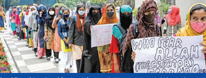
طالبات هندية خلال احتجاج على حظر الحجاب أمام جامعة في كالكوتا أمس

وعدا رئيس حكومة الولاية بإسافراج بوماي إلى الهدوء، أمس الأول، وقال: «أناشد جميع الطلاب والمعلمين وإدارات