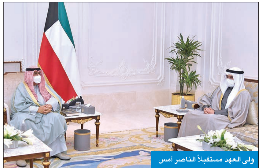
ولي العهد مستقبلاً الناصر أمس

استقبل سمو ولي العهد الشيخ مشعل الأحمد بقرص بيان صباح أمس، وزير الخارجية وزير الدولة لشؤون مجلس الوزراء الشيخ د. أحمد الناصر.