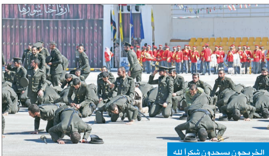
الخريجون يسجدون لشكر الله

وتابع: "تمر بنا خلال الأيام القادمة، نذكرى العيد الوطني الـ 61، والذكرى الـ 31 ليوم التحرير، التي نستذكر فيها، بكل مشاعر الفخر والاعتزاز، التضحيات الجليلة، والبطولات الكبيرة، التي قدمها منتسبو الجيش الكويتي، في صد العدوان الغاشم على بلدنا الحبيب في عام 1990، والمشاركة الفعالة والمتميزة، في حرب تحريرها من يد عدو غاصب في عام 1991،