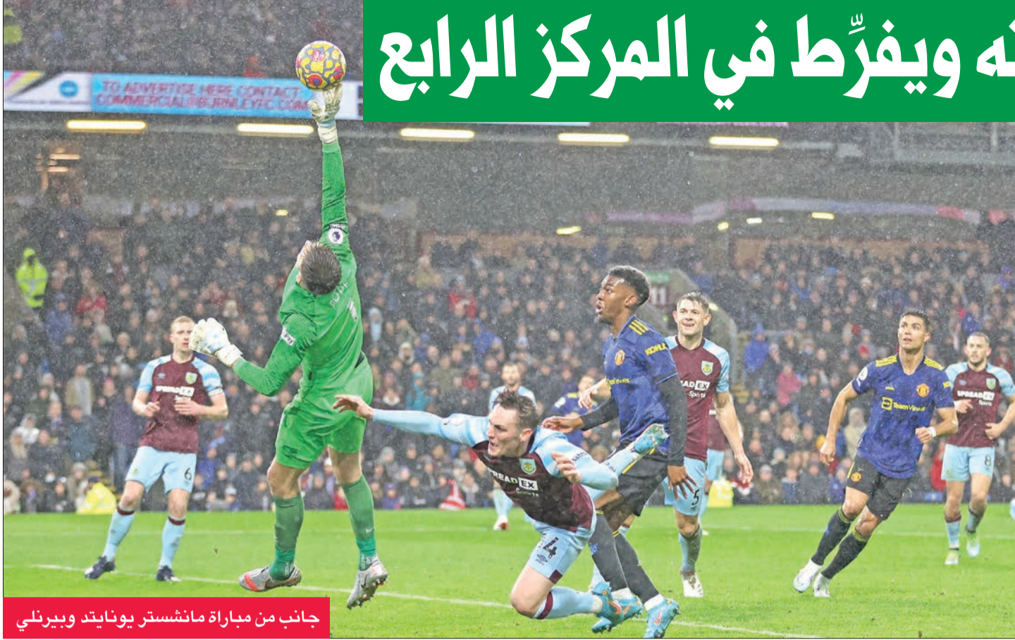
جانب من مباراة مانشستر يونايتد وبيرنلي

وخسارة. وستكون المباراة ثارية لبطل العام قبل الماضي، كون ليستر سيتي هزمه في 28 ديسمبر الماضي 1 - صفر، في مباراة شهدت إهدار الدولي المصري محمد صلاح ركلة جزاء في آخر مباراة له مع فريقه قبل السفر إلى الكامبيون للمشاركة في كأس الأمم الإفريقية، التي خسرها مباراتها النهائية أمام زميلة السنغالي ساديو ماني بركلات الترجيح.