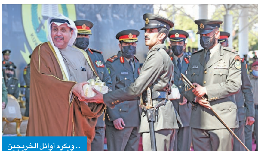
... ويكرم أوائل الخريجين