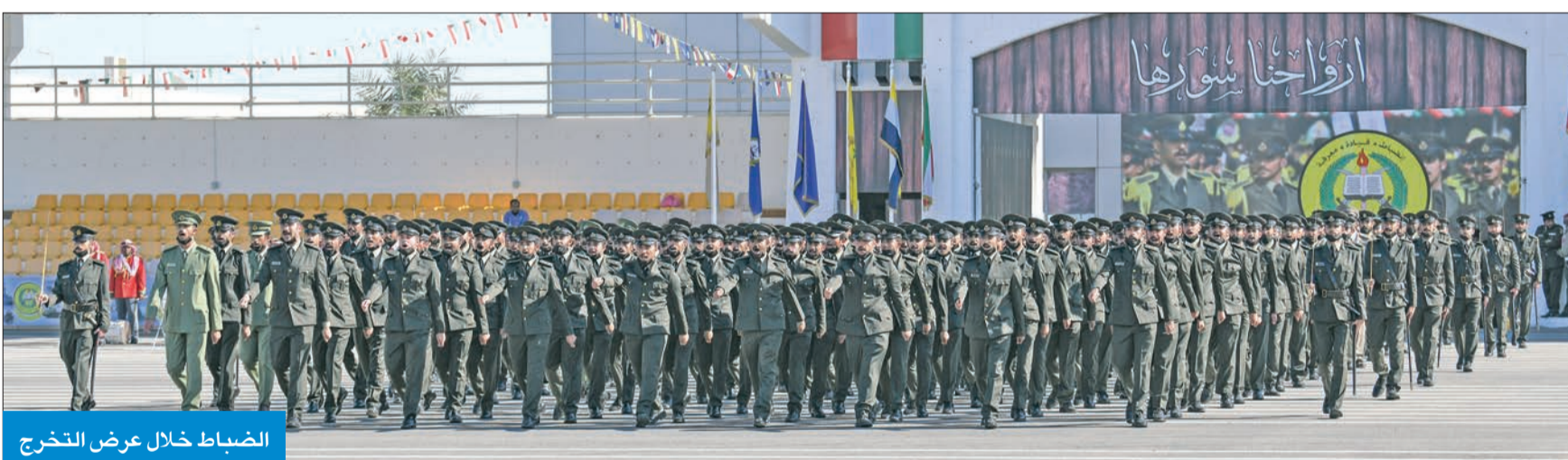
الضباط خلال عرض التخرج