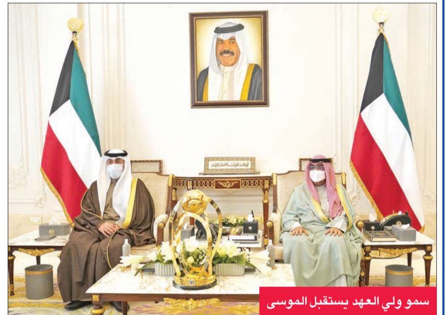
سمو ولي العهد يستقبل الموسى

على أن يخطط ويتابع وينزل إلى الميدان... ووصيتي للرياضيين لاسيما لاعبي كرة القدم التحلي بالقيم النبيلة والأخلاق الرفيعة فالرياضي قدوة في الأخلاق قبل أن يكون قدوة في الأداء.