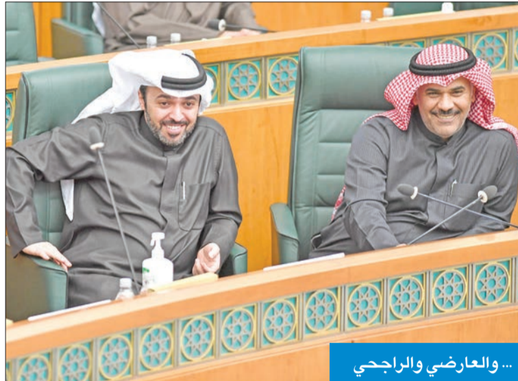
... والعارضي والراجحي