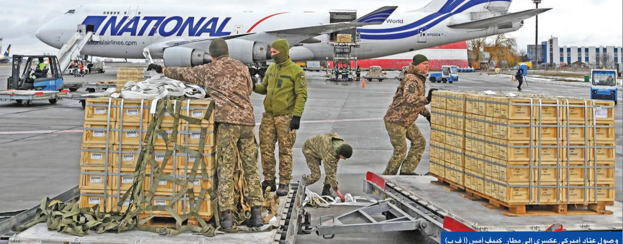
وصول عتاد أميركي عسكري إلى مطار كيف أمس

وزارة الطاقة الألمانية تحذر من نقص كبير في مخزون الغاز