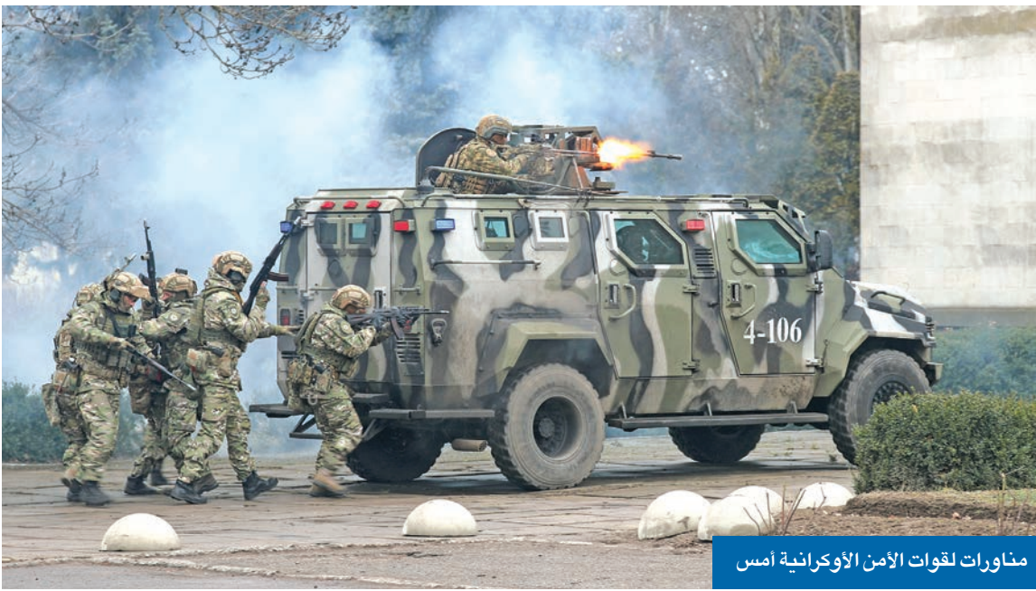
مناورات لقوات الأمن الأوكرانية أمس

توتر في «الدونباس» قد يولد مبرراً لها و3 سيناريوهات أمام بوتين قد تنتهي بتوغل محدود ● خطة أوكرانية للدفاع عن العاصمة وإجلاء سكانها... والكويت ودول العالم تدعو رعاياها للمغادرة ● بايدن أبلغ الأوروبيين تحديد بوتين 16 الجاري موعداً لشن الهجوم الروسي على كيف