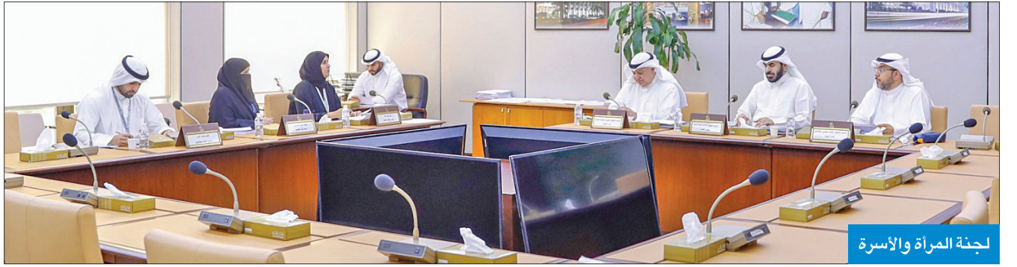
لجنة المرأة والأسرة