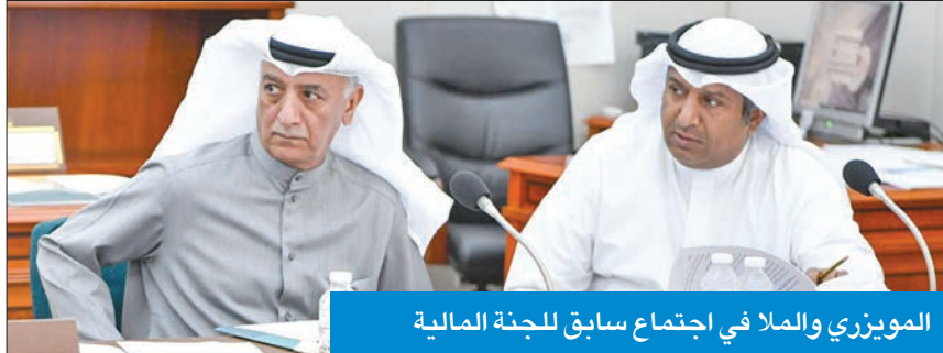
الموزير والملا في اجتماع سابق للجنة المالية

تبنت لجان برلمانية مقترحات بقوانين شعبية وأقرتها ورفعتها إلى مجلس الأمة كتقارير للتصويت عليها، ويتجلى ذلك من خلال لجنتي الشؤون المالية والاقتصادية، وشؤون المرأة والأسرة والطفل ووافق المجلس على إحالتها إلى الحكومة، حيث بانتت الكرة في ملعبها، إما تنفيذها أو رفضها مع توضيح الأسباب.