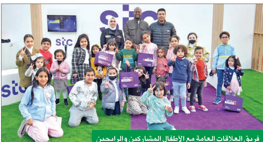
فريق العلاقات العامة مع الأطفال المشاركين والراغبين

مع مختلف الجهات، من خلال المبادرات المجتمعية التي من شأنها أن تساهم وتساعد في إعادة الحياة إلى طبيعتها على المستوى الاجتماعي. وتقام الفعاليات في المساحة الخارجية من «الأقنيوز» بمنطقة سكند أفنيو، وصولاً إلى منطقة فرست أفنيو، حتى أجواء ترفيهية عائلية مميزة وجديدة، إضافة إلى مناطق لعب مفتوحة للأطفال.