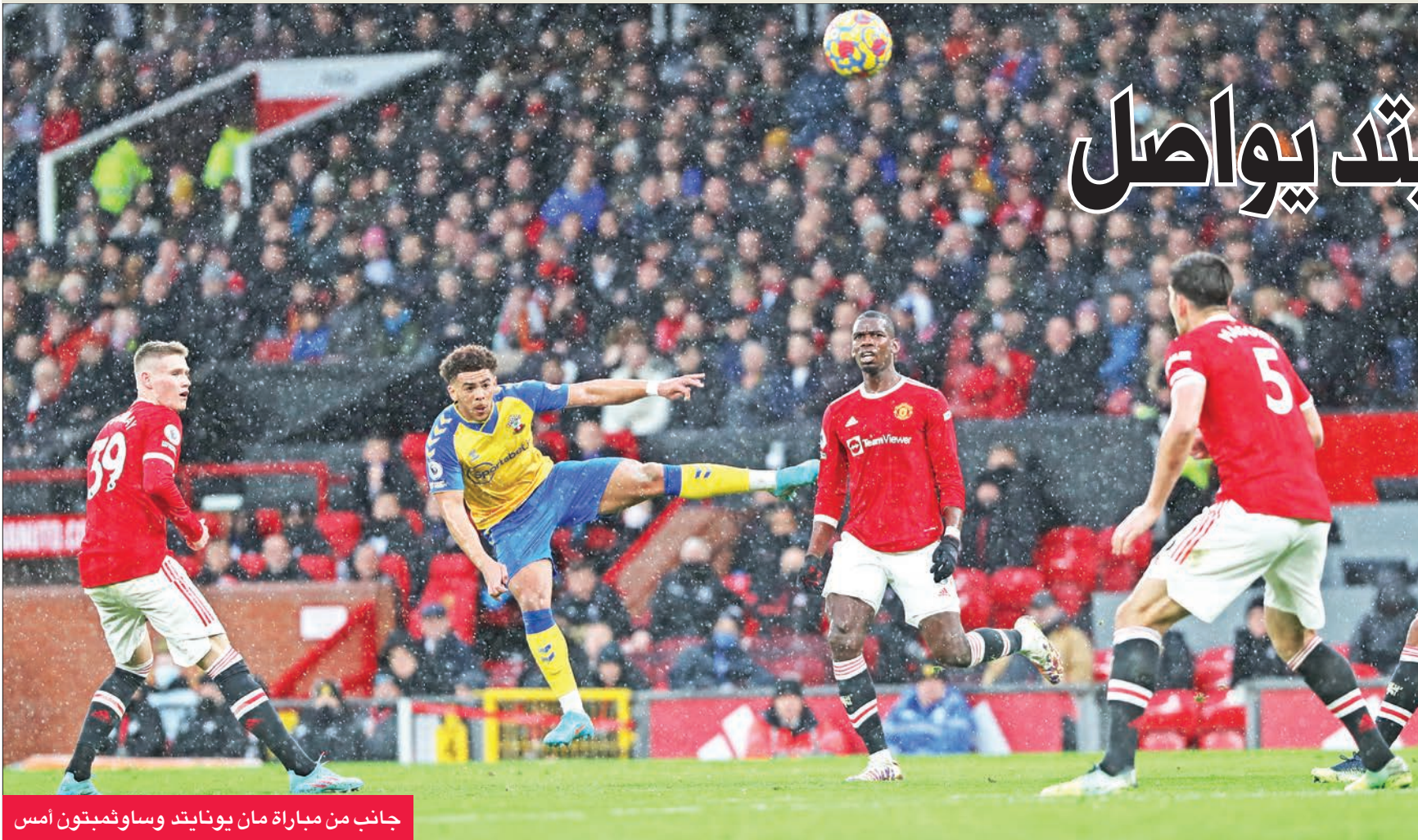
جانب من مباراة مان يونايتد وساوثمبتون أمس