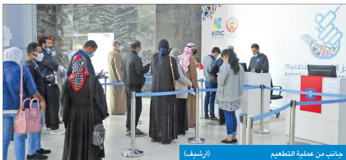
جانب من عملية التطعيم (أرشيف)

● السالم لـ الجريدة: 66% نسبة انخفاض حالات «كوفيد 19»