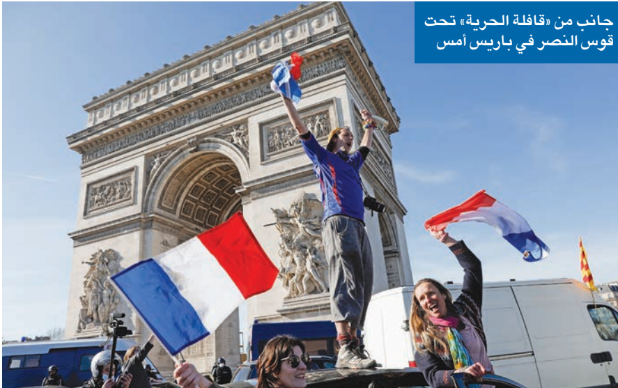
جانب من «قافلة الحرية» تحت قوس النصر في باريس أمس

بدأت الشرطة الكندية، أمس، تفريق محتجين يغلقون جسر «امباسادور» الذي يربط بين كندا والولايات المتحدة، بعد أكثر من 12 ساعة على صدور حكم قضائي بإنهاء إغلاقه، ودخول الاحتجاجات على الإجراءات الصارمة بشأن جائحة «كورونا»، بما فيها التطعيم الإجباري، أسبوعها الثالث. ولليوم الخامس على التوالي، توقف المرور على الجسر الذي تغلقه في الاتجاهين نحو 15 شاحنة، مما أدى إلى خلق سلسلة الإمداد للمصانع السيارات في مدينة ديترويت الأميركية، وسط اتهامات للحكومة جاستن ترودو بـ «التردد» في مواجهة الاحتجاجات بسبب حسابات سياسية مع قرب الانتخابات. وخلال اتصال هاتفي مع ترودو، تناول الرئيس الأميركي جو بايدن، الخميس الماضي، «العواقب» 02