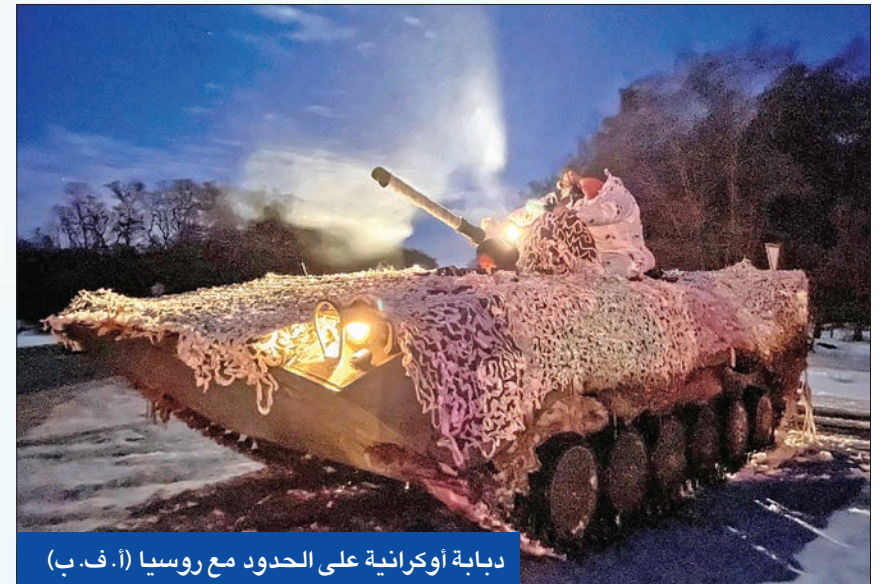
دبابة أوكرانية على الحدود مع روسيا

أعلنت واشنطن أنّ روسيا قد تغزو أوكرانيا «في أي وقت»، خلال الأيام القليلة المقبلة، الأمر الذي دفع دول العالم وبيدها الكويت إلى دعوة مواطنيها إلى مغادرة هذا البلد بسرعة. ووسط حديث عن عدة سيناريوهات للهجوم الروسي، بينها غزو كامل وصولاً إلى العاصمة كييف أو مجرد توغل محدود، حذر البيت الأبيض من أنّ غزواً عسكرياً روسياً لأوكرانيا تتخلله حملة غارات جوية «وهجوم خاطف» على كييف، بات «احتمالاً فعلياً جداً» خلال الأيام المقبلة حتى قبل موعد انتهاء الألعاب الأولمبية الشتوية في بكين في العشرين من الجاري.