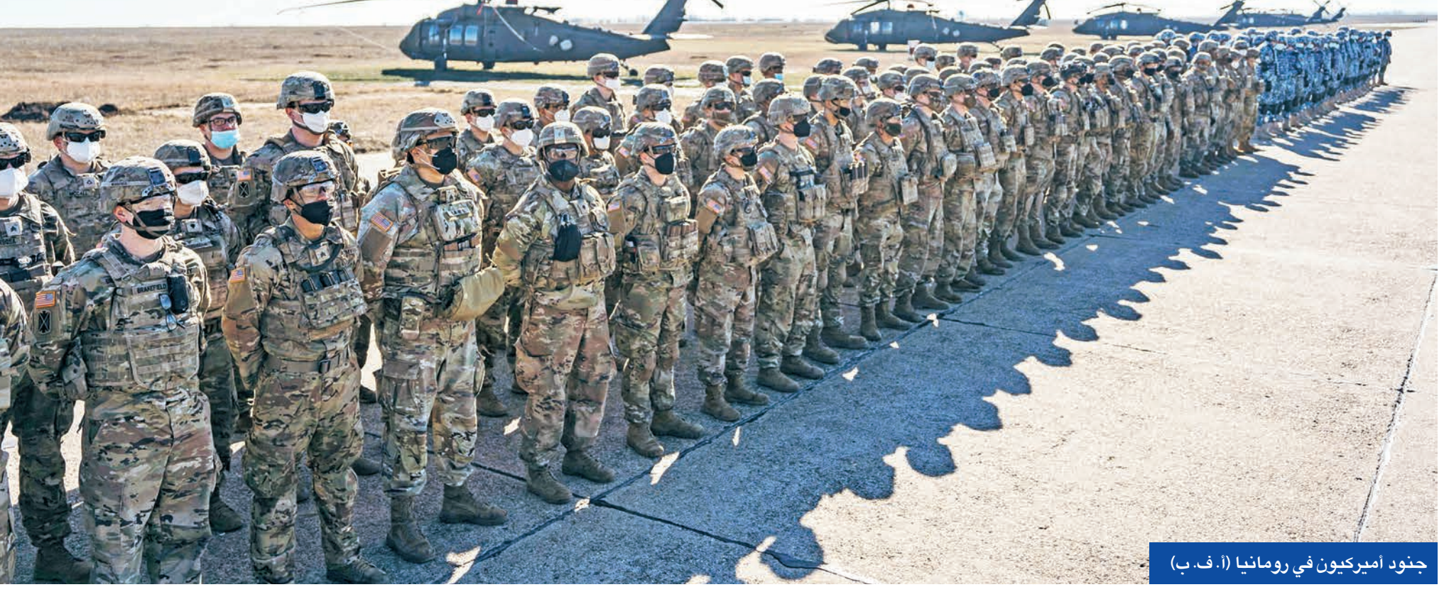
جنود أميركيون في رومانيا

وكان السفير الروسي لدى الولايات المتحدة أناتولي أنتونوف، قال إن «حالة التاهب» تنتشر عبر الولايات المتحدة بدون تقديم أي دليل لدعم هذا المزاعم. وأضاف أن البيانات التي تصدر في الولايات المتحدة شهادة على حقيقة أنها كتفت «حملتها الترويجية ضد بلدانا».