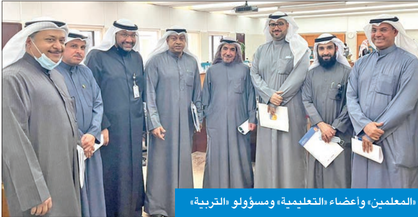
«المعلمين» وأعضاء «التعليمية» ومسؤولو «التربية»