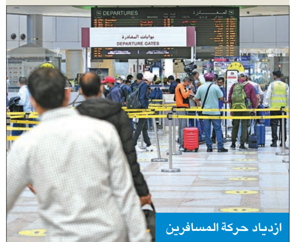
ازدياد حركة المسافرين