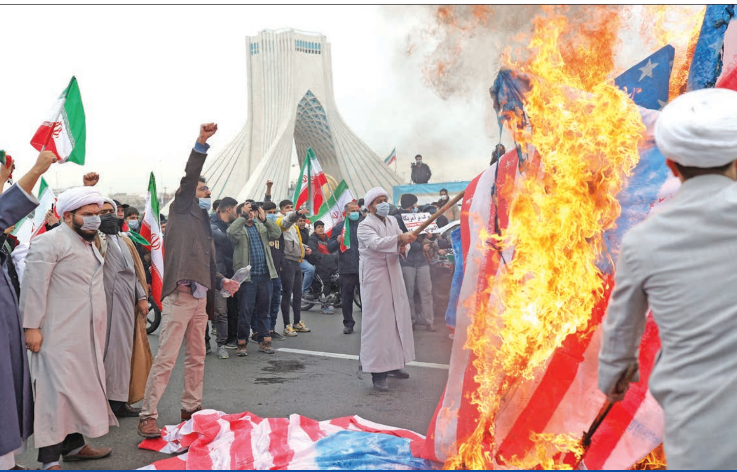
إيرانيون يشعلون النار في العلم الأميركي خلال احتفالات بالذكرى الـ43 للثورة في طهران أمس الأول

ورأى غيوروا إيلاند، اللواء المتقاعد والرئيس السابق لمجلس الأمن القومي الإسرائيلي، أن «تلّوز أصبح ستكون في موقف حرج