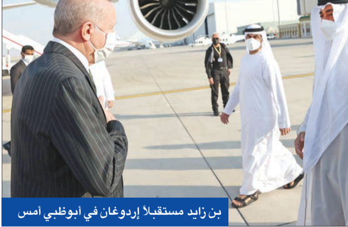
بن زايد مستقبلاً إردوغان في أبوظبي أمس

في أول زيارة له للبلد الخليجي منذ نحو 9 سنوات، بعد عودة الدفاء للعلاقات بين القوتين الإقليميتين اللتين وقفتا على النقيض في العديد من ملفات المنطقة، بدأ الرئيس التركي رجب طيب إردوغان، زيارة رسمية للإمارات، أمس، مؤكداً أن «الحوار والتعاون بين تركيا والإمارات يحملان أهمية من حيث السلام والاستقرار في منطقتنا بأسرها».