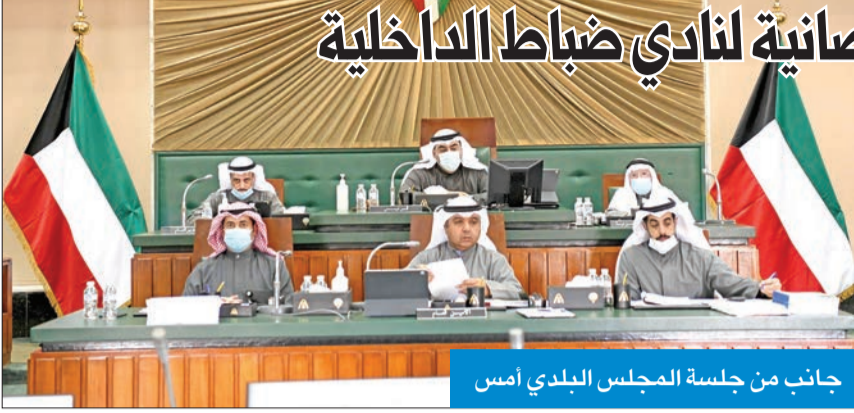
جانب من جلسة المجلس البلدي أمس