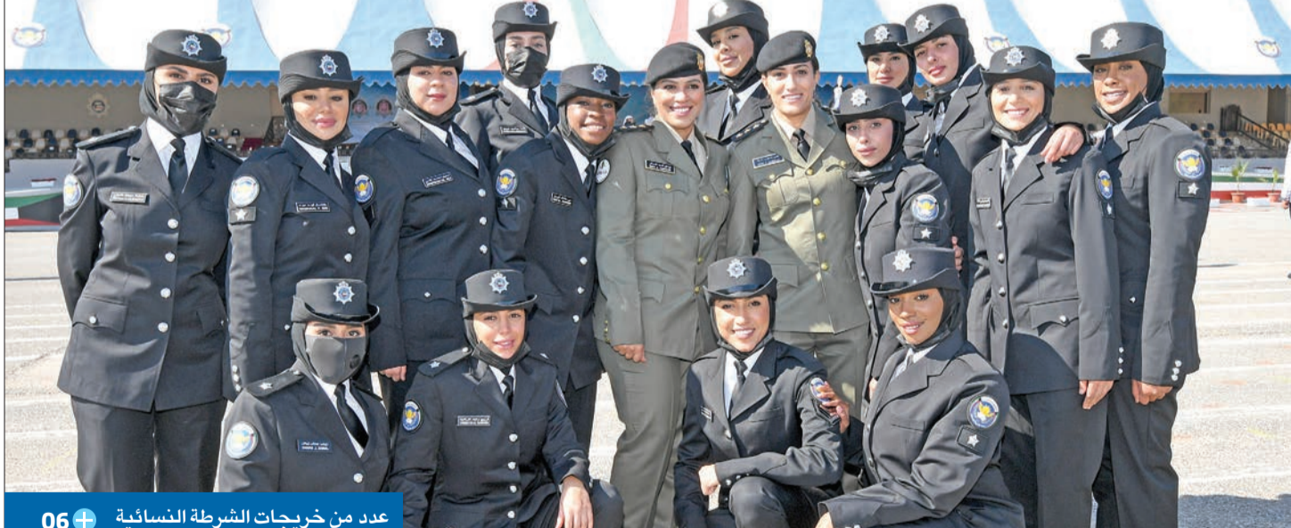
عدد من خريجات الشرطة النسائية