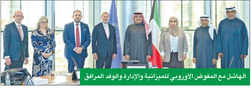
الهاشل مع المفوض الأوروبي للميزانية والإدارة والوفد المرافق

الاقتصادية في المرحلة المقبلة، وسرعة التعافي الاقتصادي بعد أزمة الجائحة التي ألتفت بتبعات اقتصادية غير مسبوقة على جميع الدول، كما تطرق اللقاء إلى العديد من الجوانب المتصلة بالشأن المالي والمصرفي. واختتم البيان بالتأكيد على أهمية التواصل مع صناعات السياسات في الاقتصادات الكبرى لتبادل الآراء وجهات النظر بما يعزز التعاون بين الكويت والدول الصديقة في المجالات الاقتصادية والمالية.