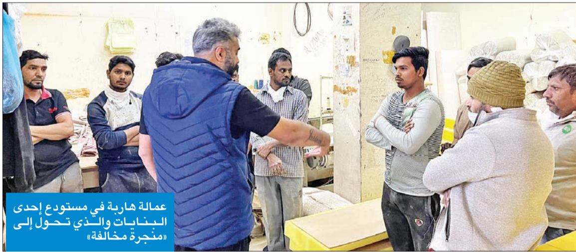
عمالة هاربة في مستودع إحدى «منجرة مخالفة»

أصحاب الأعمال، ليجتسنى مجابهة تجار الإقامات والشركات الوهمية التي أغرقت السوق بالعمالة الهامشية. من جهة، قال رئيس فريق اللجنة المشتركة محمد الظفيري إن الجولة شملت أيضاً التفتيش على عشرات الأنشطة التجارية غير المرخصة من المحال والمطاعم وصالونات الحلاقة وضبط عمالها المخالفة، إضافة إلى التفتيش على «المناجر» التي تتخذ من سرايب البنائيات مقراً لإنجاز أعمالها، مع ما يشكك ذلك من خطر داهم على السكان، لاسيما في ظل افتقارها لأدنى اشتراطات الأمان والسلامة المهنية أو الخاصة بمعدات الإطفاء وتجهيز مداخل وخارج الأجزاء العمالة الهامشية والسائبة أو التي تعمل لدى «الجريدة» أن الجولة كشفت عن عشرات العمالة المنزلية الهاربة من أصحاب أعمالها وتعمل