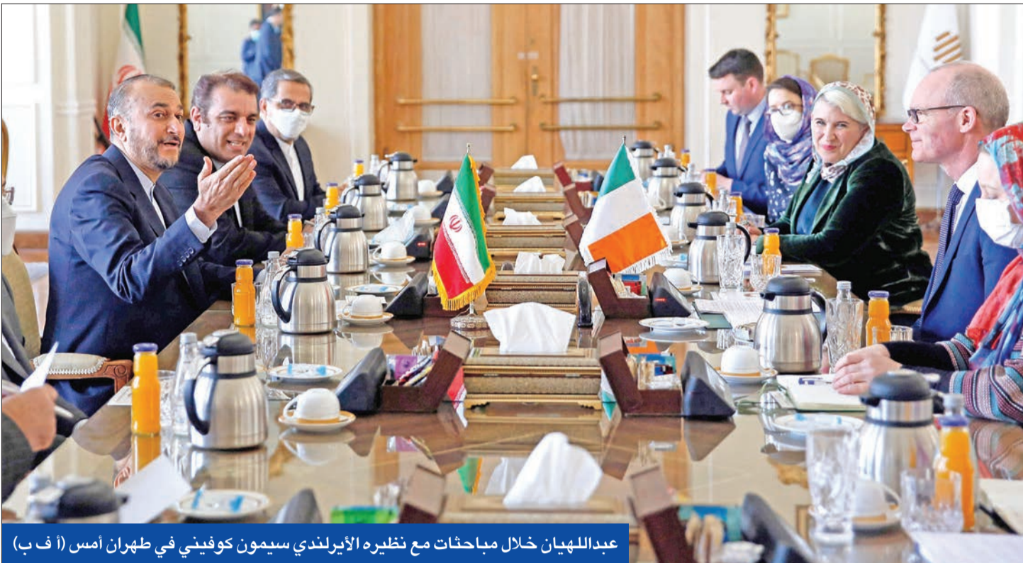
عبداللهيان خلال مباحثات مع نظيره الإيرلندي سيمون كوفيني في طهران أمس

تباين داخلي حول سير مفاوضات فيينا... ورئيسي يشارك في «قمة الغاز» بالدوحة بعد غد