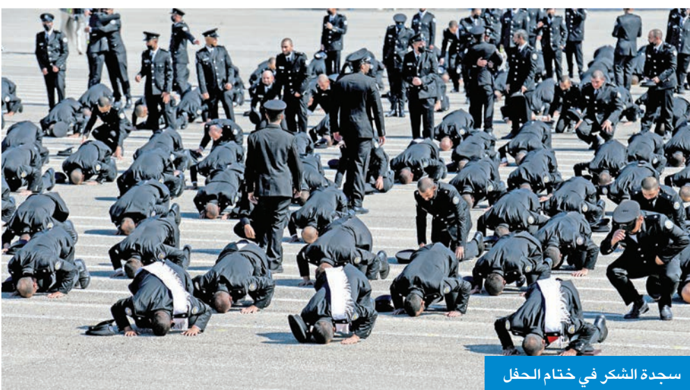
سجدة الشكر في ختام الحفل

قدمت الأكاديمية عرضاً شمل جميع آليات «الداخلية»، المستخدمة في جميع القطاعات الأمنية، كما تم تقديم عرض للخيالة والهجانة.