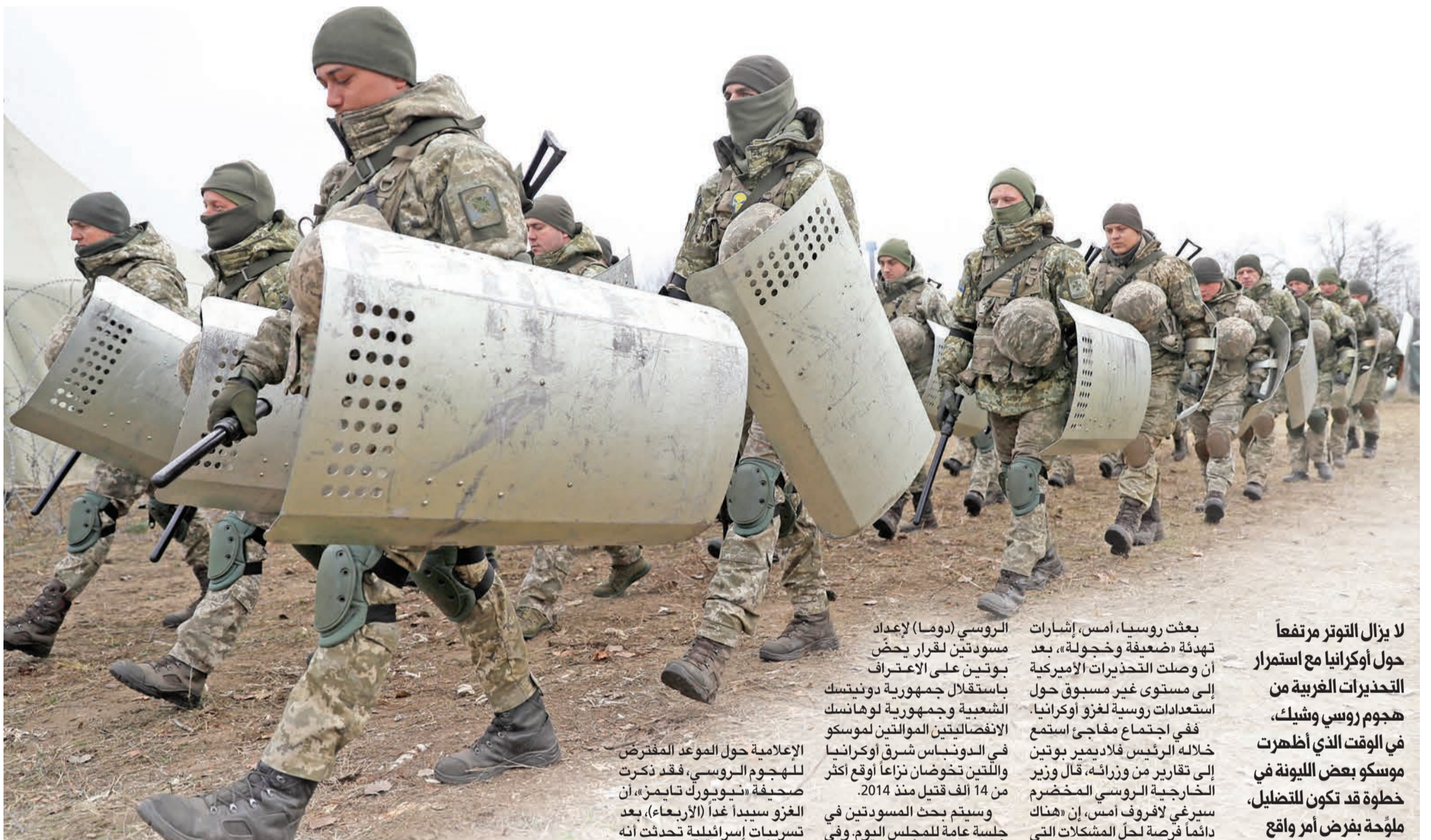
حرس الحدود الأوكراني قرب الخط الفاصل مع بيلاروسيا