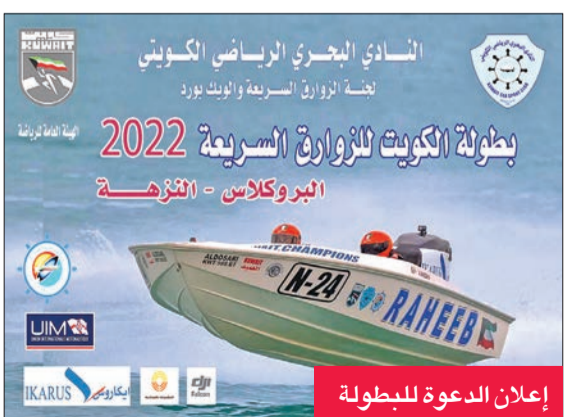
إعلان الدعوة للبطولة