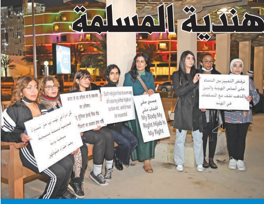
جانب من الوقفة التضامنية في ساحة الإرادة

عبر عدد من الناشطات والناشطين بمجال حقوق الإنسان عن تضامنهم مع المرأة المسلمة في الهند، مبدئين رفضهم لأي اعتداء على المحجبات هناك أو إجبارهن على نزع الحجاب، رافضين أي تمييز عنصري بين النساء على أساس الهوية والدين والعرق. جاء ذلك خلال الوقفة التضامنية التي دعت لها عدد من الناشطات في مجال حقوق الإنسان في البلاد، أمس الأول، بساحة الإرادة، للتعبير عن رفضهن لأي اعتداء ضد المرأة المسلمة في الهند،