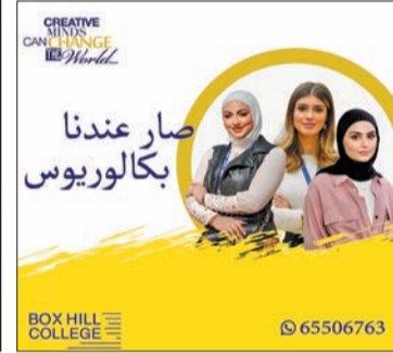
صار عندنا بكالوريوس

التجارة بمختلف فروعها، كتخصص المحاسبة، وتخصص إدارة الأعمال الدولية، إضافة إلى تخصص تجارة الأزياء، وهو تخصص تفرّد به كلية بوكسهل الكويت، والذي يجمع ما بين تخصصات التصميم وإدارة الأعمال الدولية. وينصب تركيز المنهج على تطوير مهارات التصميم والتقنيات الحديثة في التسويق، وفق تطورات من يطعمون إلى تأسيس المشروع الخاص.