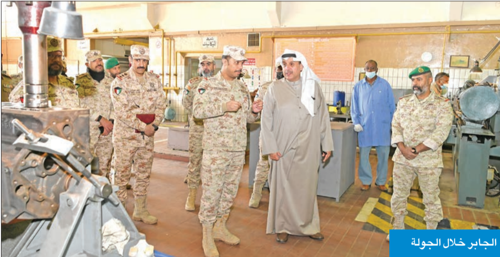
الجابر خلال الجولة

تفقد قيادة الصيانة والتزويد الفني وميادين الرماية والفروسية