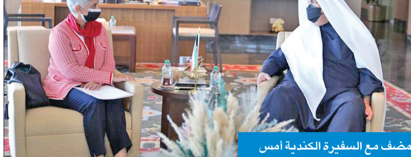
المضف مع السفيرة الكندية أمس

الطلامي لديه مشاريع مختلفة تتعلق بالكفاء الإصطناعي والتكنولوجيا، وستعرض تلك المشاريع بالمنظمة سيغدق في الفترة من 20 حتى 26 الجاري، مؤكدة أن مشاريع الطلبة الكويتيين المشاركة في الملحق تم اختيارها بعد تنقيح ما لا يقل عن 60 مشروعاً قد تم البدء بها خلال الشهرين الماضيين.