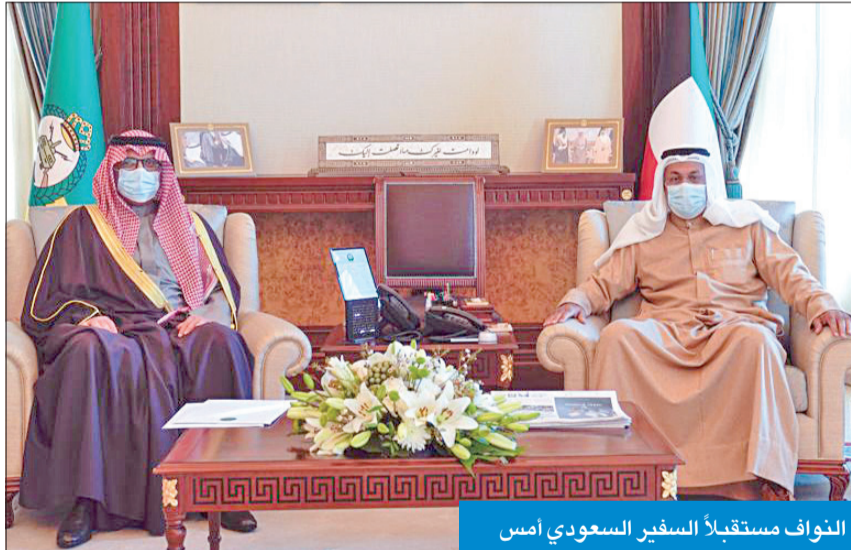
النواف مستقبلاً السفير السعودي أمس

استقبل نائب رئيس الحرس الوطني، الشيخ أحمد النواف، في ديوانه بالرئاسة العامة للحرس، سفير خادم الحرمين الشريفين لدى الكويت، الأمير سلطان بن سعد بن خالد آل سعود، مع ورخب النواف بالسفير، ويحث معه الموضوعات ذات الاهتمام المشترك، وتأكيد أهمية تعزيز العلاقات بين البلدين الشقيقين.