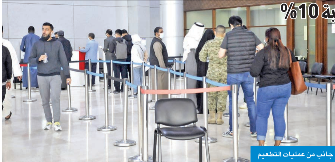
جانب من عمليات التطعيم

«الصحة» تسمح لموظفيها بالإجازات بنسبة 10%