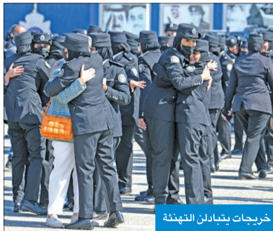
خريجات يتبادلن التهنية