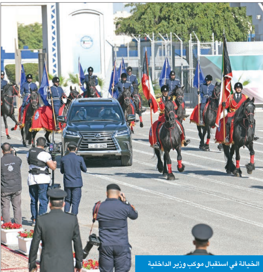
الخيالة في استقبال موكب وزير الداخلية