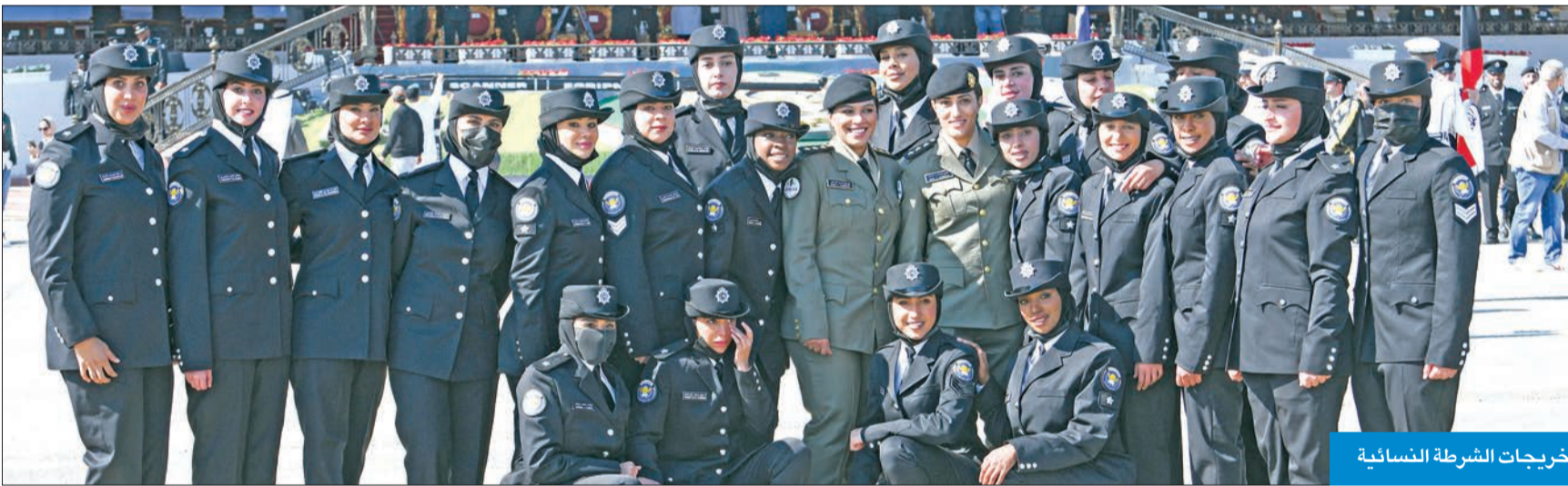
خريجات الشرطة النسائية