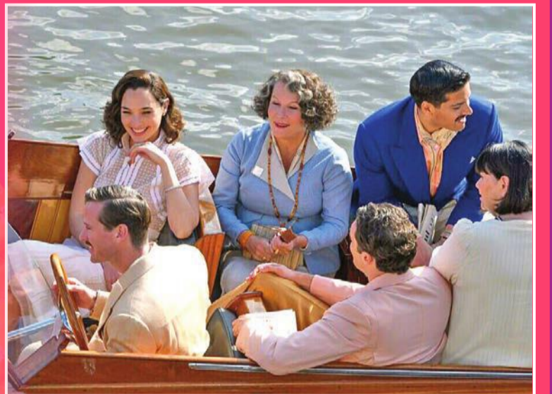
مشهد من الفيلم

اكتسح فيلم «الموت على ضفاف النيل» أو «Death on the Nile»، السينما الأميركية، محققاً أعلى إيرادات بشباك التذاكر في أول أسبوع من عرضه، وهو الاقتباس الجديد من رواية آغانا كريستي الشهيرة. واستطاع الفيلم، الذي يروي قصة أحد أشهر تحقيقات التحري البلجيكي صدي الشارين إركول بوروار، أن يقفز في صدارة شبك تذاكر صالات أميركا الشمالية في عطلة نهاية الأسبوع فور انطلاق عروضه، وتمكن من تحقيق إيرادات بلغت 12.8 مليون دولار من الجمعة إلى الأحد، حسبما بينت تقديرات أولية نشرتها شركة «إكزيبتر ريليشنز» المتخصصة أمس الأول. وهذا الفيلم، الذي أخرجه كينيث براناه، هو الاقتباس السينمائي الثالث للقصة التي كتبها عام 1937 ملكة الرواية البوليسية آغانا كريستي، بعد اقتباسين سابقين لبيتر أوستينوف وجاين بيركين، وتولى براناه كذلك دور المحقق بوروار بعد 5 سنوات من تاديته شخصيته أيضاً في فيلمه السابق «موردر أون ذي أوريينت إكسبرس»، المقتبس هو الآخر عن رواية شهيرة لآغانا كريستي.