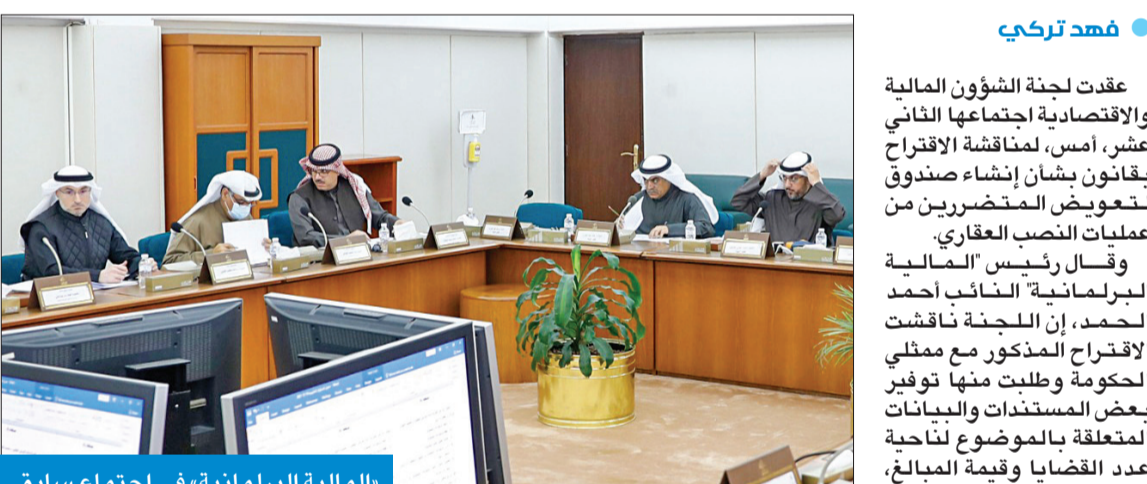
«المالية البرلمانية» في اجتماع سابق