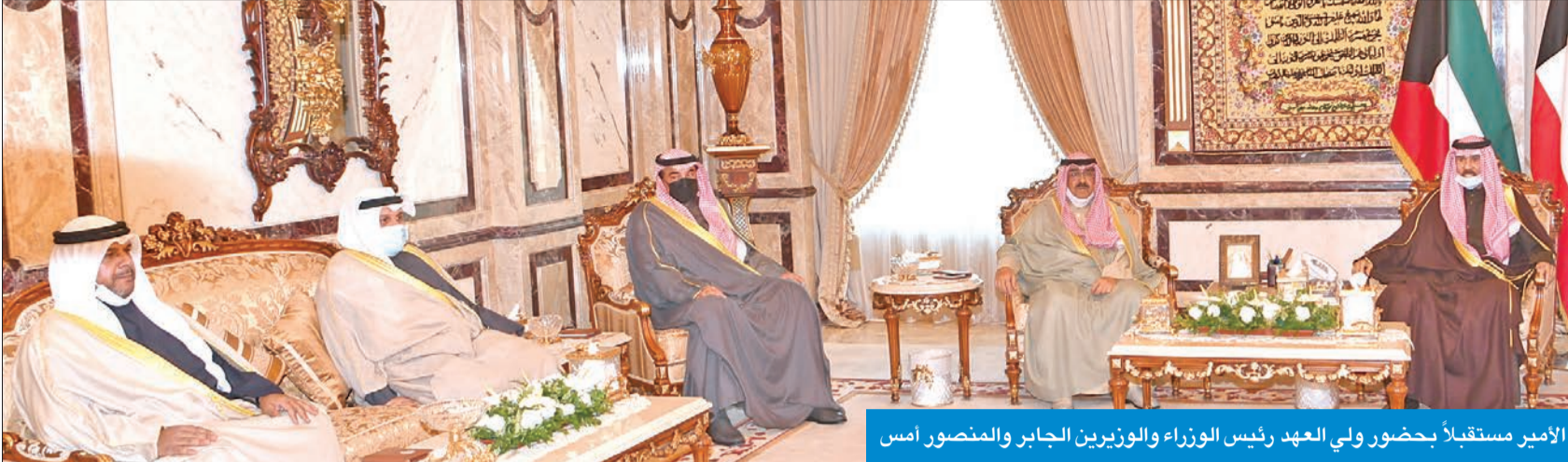
الأمير مستقبلاً بحضور ولي العهد رئيس الوزراء والوزيرين الجابر والمنصور أمس

صاحب السمو هنا ملك البحرين بذكرى إقرار الميثاق والرئيس الألماني بإعادة انتخابه