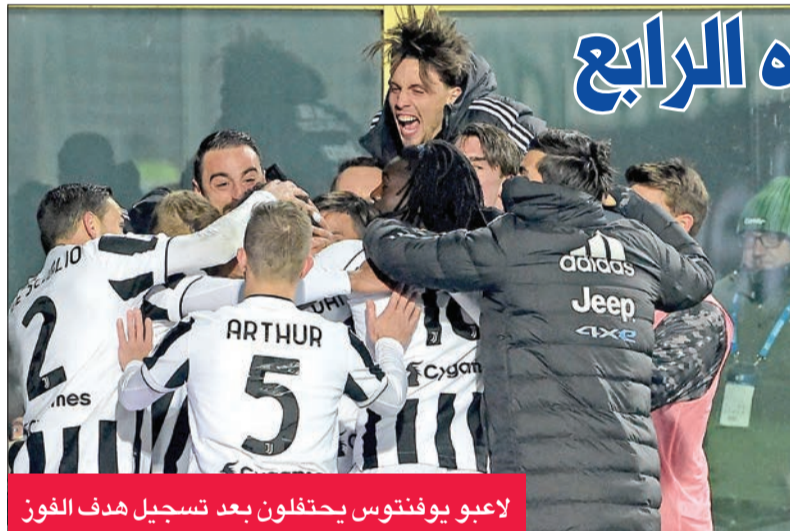
لاعبو يوفنتوس يحتفلون بعد تسجيل هدف الفوز