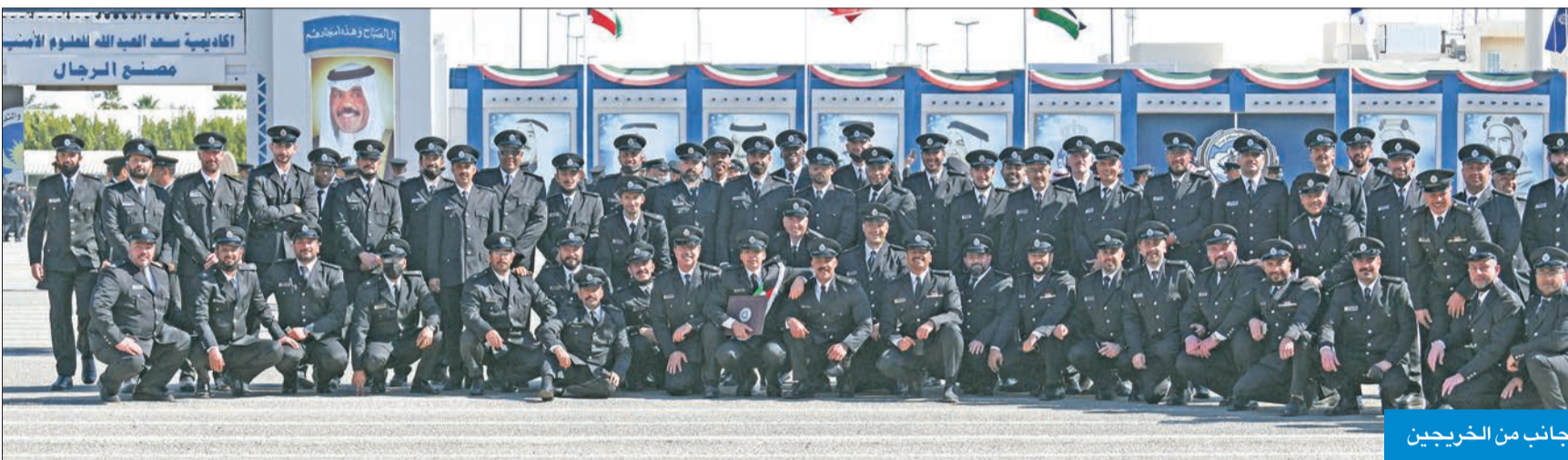
جانب من الخريجين