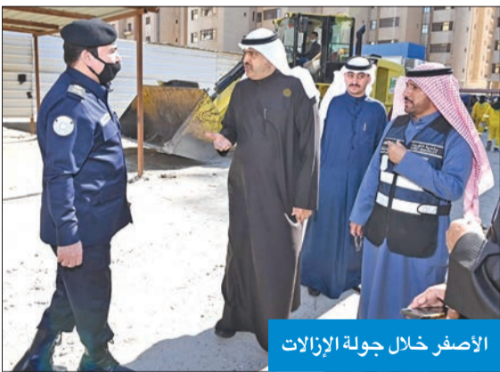
الأصفر خلال جولة الإزالةات

أكد محافظ حولي علي الأصفر، ضرورة تلمس معاناة المواطنين في المحافظة، الأمر الذي أوجب النزول إلى الشارع، ومتابعة فرق الإزالةات، والتشجيعهم، والأخذ بالملاحظات.