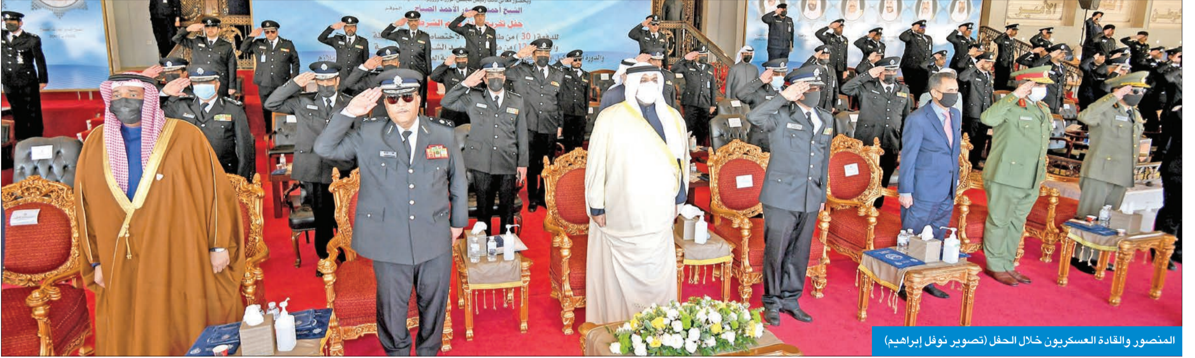
المنصور والقادة العسكريون خلال الحفل

شهد تخريج الدفعتين 30 من ضباط الاختصاص و12 من الشرطة النسائية والدورة 4 لوكيل أول ضابط