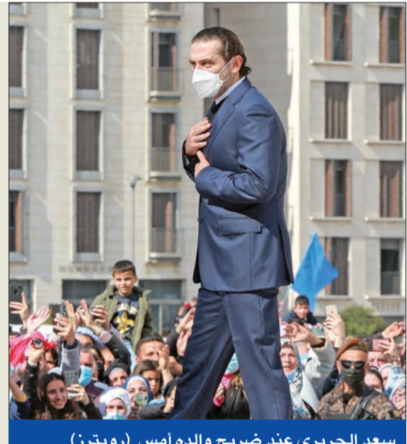
سعد الحريري عند ضريح والده أمس

في هذه الأثناء، لا يزال التباين سيد الموقف بخصوص تقييم مسار المفاوضات النووية الإيرانية على باقري كني، وبين الخارجية الإيرانية ومصادر