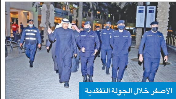
الأصفر خلال الجولة التفقدية

تفقد محافظ حولي علي الأصفر عدداً من النقاط الأمنية خلال جولة قام بها برفقة مدير أمن المحافظة اللواء عبدالله العلي، للاطلاع على الاستعدادات المقدمة من الجهات المعنية.