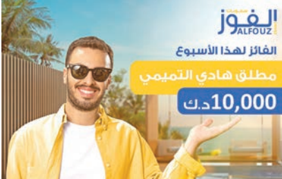
مطلق لهذا الأسبوع