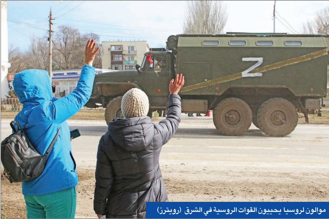
مواطنون في روسيا يحيون القوات الروسية في الشرق