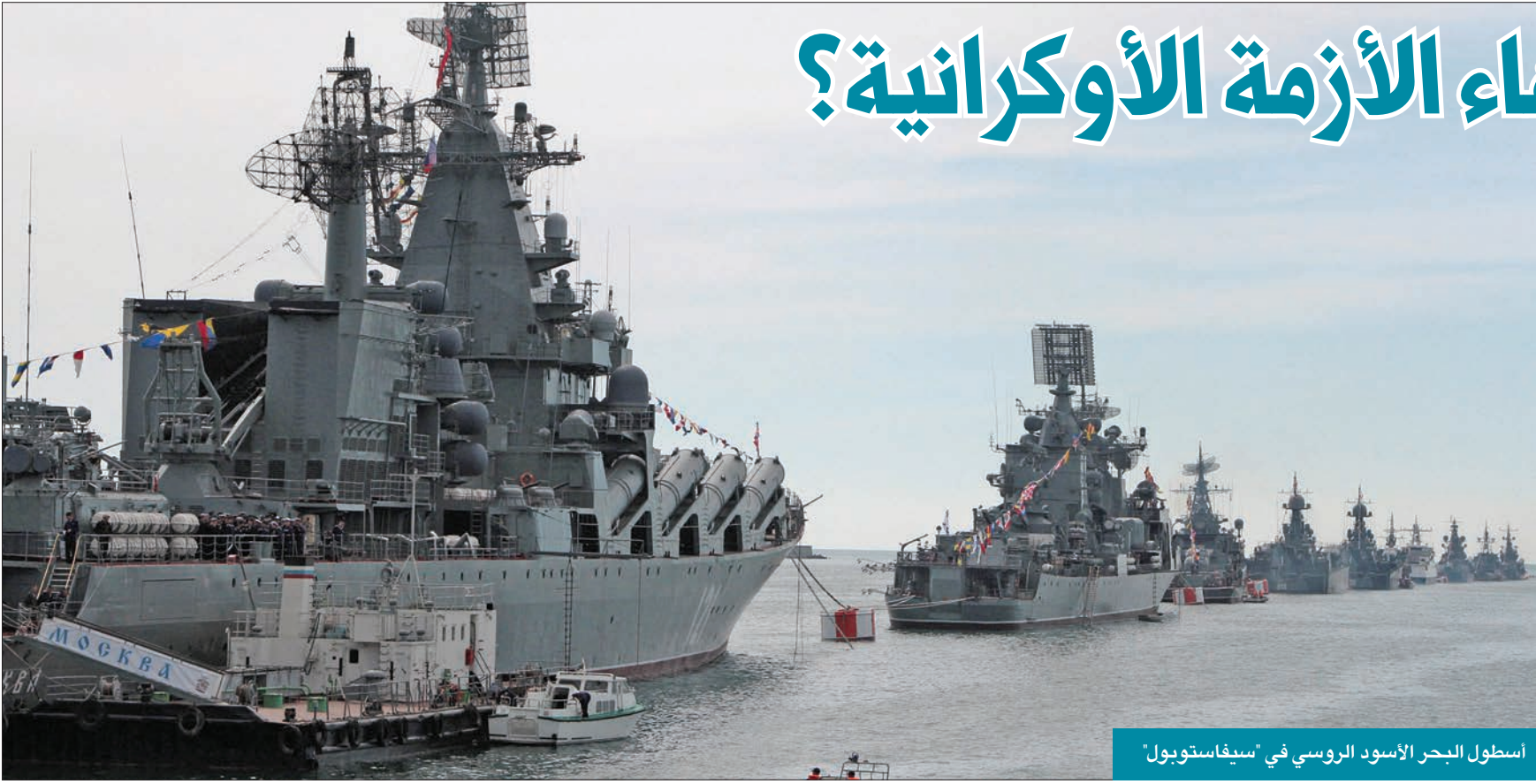
اسطول البحر الأسود الروسي في "سيفاستوبول"