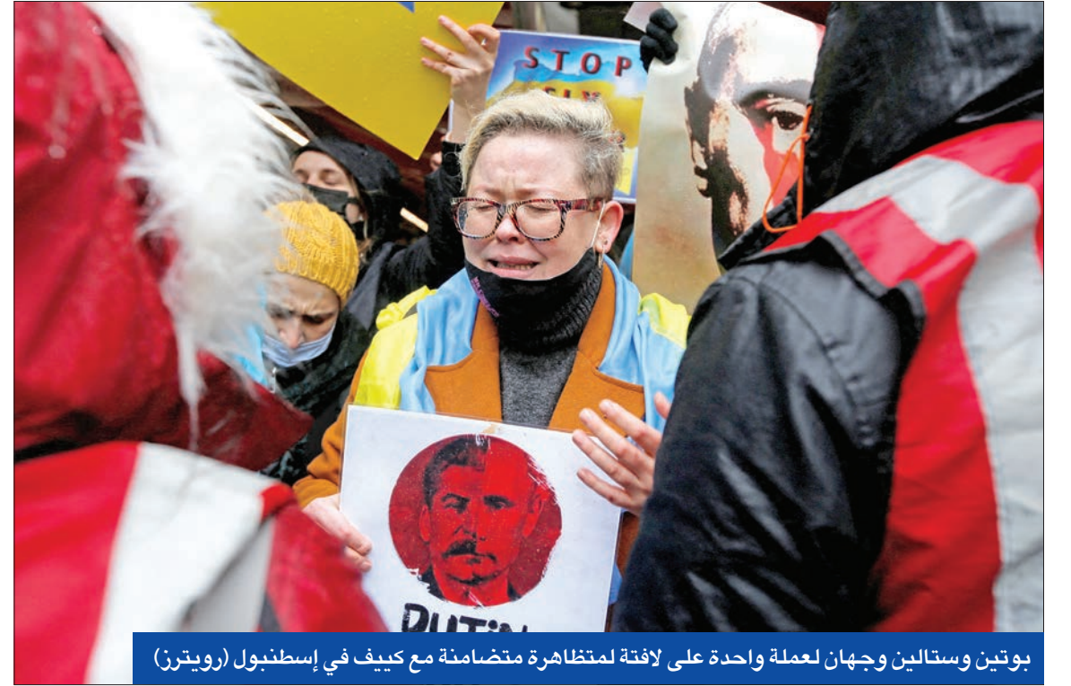
بوتين وستالين وجهان لعملة واحدة على لافتة لمتظاهرة متضامنة مع كييف في إسطنبول (رويترز)

بالإضافة إلى أصول بحرية إضافية لتعزيز "استعداد قواتنا للاستجابة لجميع الحالات الطارئة". ودان بيان التحالف "بأشد العبارات الممكنة الهجوم الروسي المروع". وأعلن الحلف أنه مع شعب أوكرانيا، مدنيا بيلاروس التي اتهمها بأنها ساعدت في الهجوم الذي وصفه بأنه "انتهاك خطير للقانون الدولي ويتعارض مع اتفاقيات مينسك التي وقعت عليها روسيا".