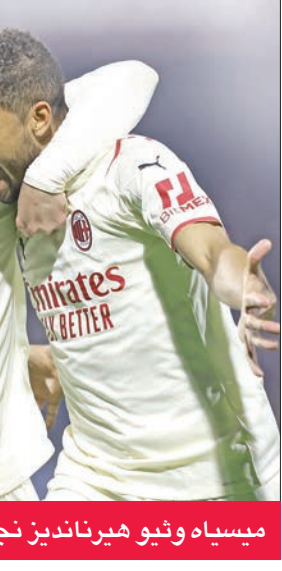
ميسييه ونيو هيرانديز نجما ميلان

والخير الجيد لإنتر في زيارته إلى ملعب جنوى القابع في المركز التاسع عشر قبل الأخير بانتصار يتيم مقابل 13 تعادلاً و12 هزيمة، أنه سيستعيد خدمات لاعب الوسط المؤثر جردا الكرواتي مارسيلو بروزوفيتش الذي غاب عن لقاء ساسوولو بسبب الإيقاف. ورغم تعثره أمام متذيل الترتيب ساليرنيثانا، يبدو ميلان في وضع معنوي أجل التمسك بالمركز الرابع والإبقاء أقله على فارق النقاط الثالث الذي يفصله عن أتالانتا الخامس.