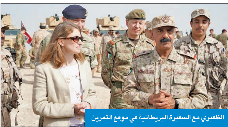
الظفيري مع السفارة البريطانية في موقع التمرين

اختتم صباح أمس تمرين محارب الصحراء 6 بين كتيبة الاستطلاع 4 من القوة البرية وعناصر من لواء المغاوير 25 وهيئة الخدمات الطبية ولواء 16 من القوة البريطانية المشاركة، بحضور أمر القوة البرية اللواء الركن محمد الظفيري وسفيرة المملكة المتحدة البريطانية بليندا لويس.