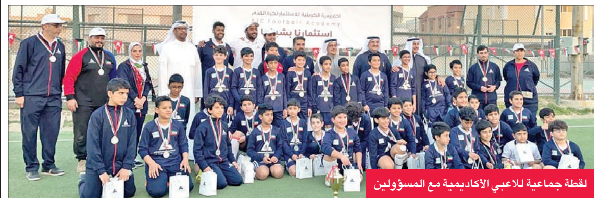
لقطة جماعية للاعبين الأكاديمية مع المسؤولين

اللاعبون استعرضوا مهاراتهم في حفل «الأعياد الوطنية»