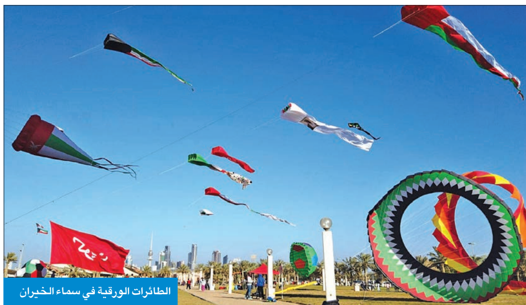
الطائرات الورقية في سماء الخيران

الافتتاح بشأن «كورونا» يعيد بهجة الاحتفالات