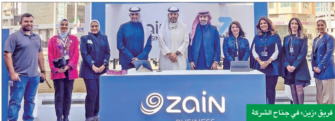
فريق «زين» في جناح الشركة

أعلنت شركة زين اختتام شركتها الاستراتيجية لفعالية FoodBuzz المجتمعية، والتي قدمت بيئة اجتماعية وترفيهية للزوار للتواصل والاستمتاع بالأجواء الريفية والشعبية مرتين شهرياً من نوفمبر الماضي حتى فبراير الجاري، وتم تنظيمه هذه المرة بقلب العاصمة في برج الحمراء، بمشاركة العديد من المطاعم والمقاهي ذات العلامات التجارية المتميزة بإدارة الشباب الكويتيين.