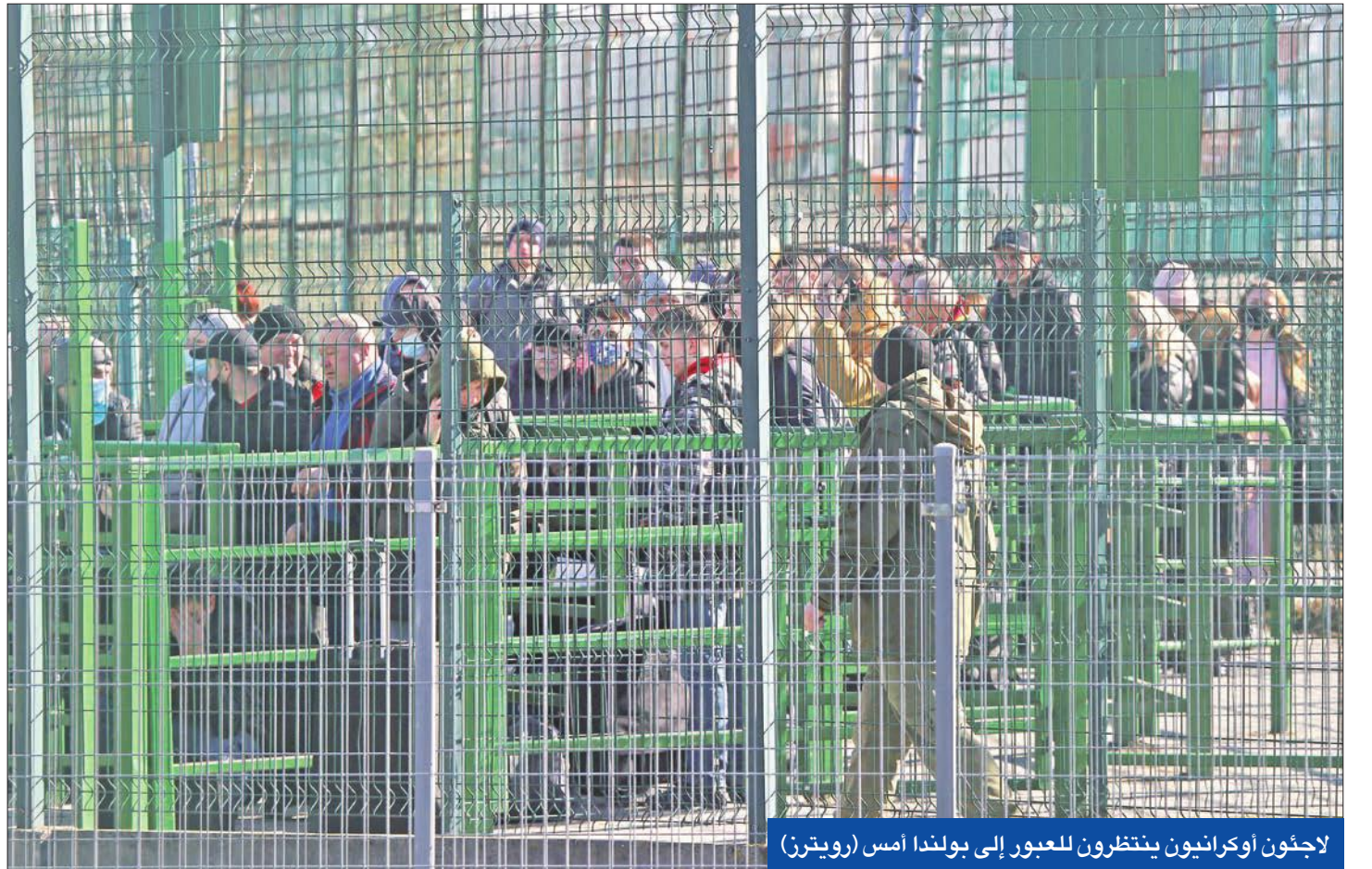
لاجئون أوكرانيون ينتظرون للعبور إلى بولندا أمس

دعم أوكرانيا بأسلحة ومعدات، إضافة إلى مساعدة مالية، ومساعدة إنسانية.