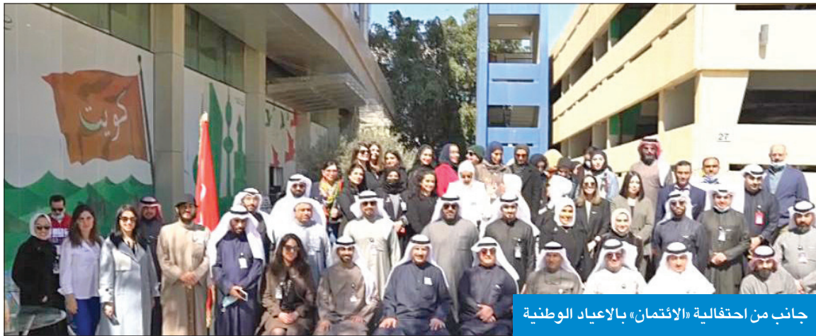
جانب من احتفالية «الائتمان» بالأعياد الوطنية

الخشتي: المستفيدون من الخدمات الإلكترونية أكثر من 4 ملايين