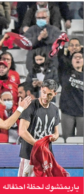
ياريمتشوك لحظة احتفاله

احتفل الأوكراني رومان ياريمتشوك، لاعب بنفيكا البرتغالي، بهدفه في دوري أبطال أوروبا، أمس الأول، بالكشف عن قميص يحمل شعار بلاده، قبل ساعات من بدء روسيا «عملية عسكرية» في أوكرانيا. سجل ابن الـ 26 عاماً هدف المباراة الأخير ضد أياكس أمستردام الهولندي في ذهاب الدور ثمن النهائي من دوري الأبطال، والتي انتهت 2-2 على أرض فريقه بنفيكا، ثم كشف عن قميص أسود عليه الشعار الوطني لأوكرانيا الذي يُسمى «تريزوب» أي «رمح ثلاثي». وقال ياريمتشوك، في حديث مع شبكة «سي إن إن برتغال»، بعد المباراة: «أردت أن أدمع بلادي، فكرت كثيراً في الأمر، وأنا خائف من الوضع». وتابع: «النادي يدعمني، تحدثوا معي، ويريدون القيام بأي شيء لمساعدتي. شكرتهم، رغم أن كل شيء الآن على ما يرام»، في تصريح قبل ساعات من بدء العملية العسكرية.