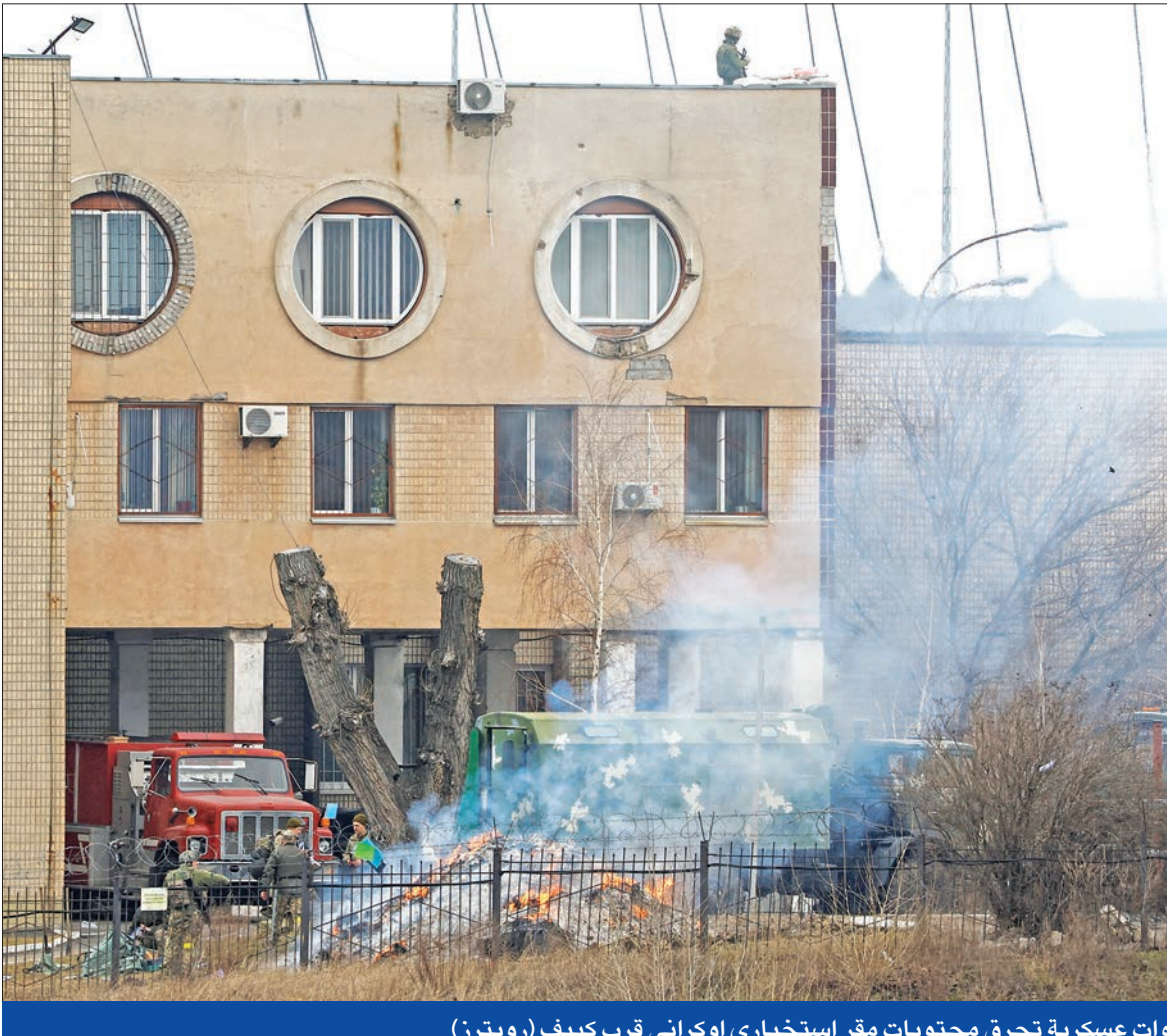
قوات عسكرية تحرق محتويات مقر استخباري اوكراني قرب كييف

في نهاية 1994، بعد غض الطرف على استقلال الشيشان بحكم الأمر الواقع مدة 3 سنوات، أدخلت موسكو جيشها لتطويع هذه الجمهورية الواقعة في القوقاز الروسي. انسحبت القوات الفدرالية في 1996 بعدما واجهت مقاومة شرسة. لكن في أكتوبر 1999، وبدفع من رئيس الوزراء حينها، فلاديمير بوتين، الذي انتخب بعد ذلك رئيساً، دخلت القوات الروسية الشيشان مرة أخرى للقيام بعملية مكافحة الإرهاب". بعد هجوم شنه الانفصاليون الشيشان على جمهورية داغستان في منطقة القوقاز الروسية وعدة اعتداءات دامية في روسيا، نسبتها موسكو إلى الشيشانيين. في فبراير 2000، سيطرت روسيا على العاصمة غروزني التي دمرتها المدفعية وسلاح الجو الروسي، لكن حرب العصابات تواصلت. في 2009، أعلن الكرملين إنهاء عملياته، بعدما أدى النزاع إلى مقتل