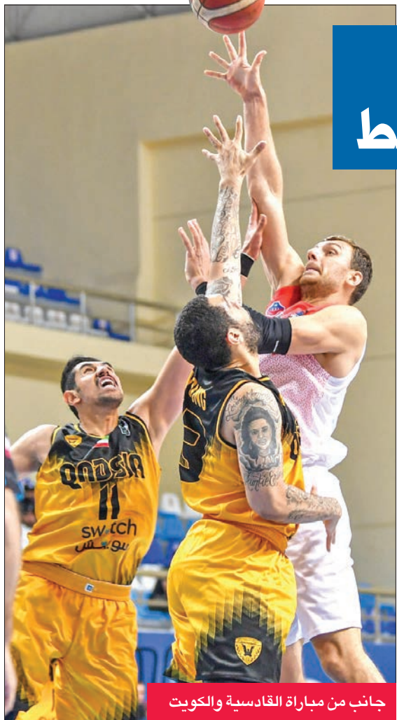
جانب من مباراة القادسية والكويت

وحافظ «الأبيض» على تفوقه في الربع الأخير دون صعوبة، وأنهاه بانتصار ساحق 106-65.