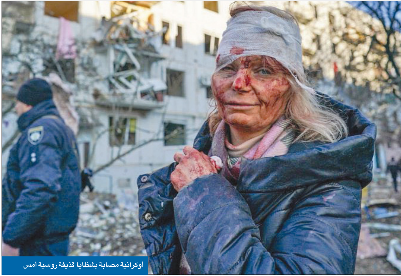
أوكرانية مصابة بشظايا قذيفة روسية أمس

بوتين يتحدى العالم ويطلب نزع سلاح أوكرانيا وإسقاط حكومتها... وكيف تقاوم وتطلب الدعم ● «الناتو» يستنفر عسكرياً ويستعد لعزل اقتصادي مدمر لروسيا إذا لم تنسحب فوراً ● مئات القتلى وآلاف اللاجئين ومعارك عنيفة حول العاصمة وفي محيط مفاعل تشيرنوبيل