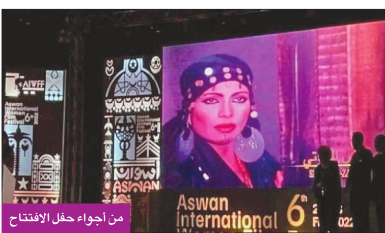
من أجواء حفل الافتتاح

يحتفي مهرجان أسوان لأفلام المرأة بالفنانة المصرية سوسن بدر، مسلطاً الضوء على مسيرتها الفنية، بعد أن جرى تكريمها في حفل الافتتاح أمس الأول، ومنحها جائزة إيزيس للإنجاز، تقديراً لمشوارها الطويل وعطائها الكبير على شاشة السينما. وخصص المهرجان ندوة عن المحتفى بها، والتي تأتي كأول نشاط بعد حفل الافتتاح، وسيعقب ذلك ورش عمل ضمن المهرجان الذي يشهد عروضاً لعشرات الأفلام التي تعالج قضايا المرأة. وكان حفل افتتاح المهرجان شهد تكريم 4 وجوه نسائية سينمائية عربية وإفريقية وأوروبية، هن: الصومالية هيباق عثمان، مؤسسة حركة «كرامة» لإنهاء العنف ضد المرأة في الشرق الأوسط وشمال إفريقيا، والمخرجة المصرية إنعام محمد علي، والفنانة المصرية سوسن بدر،