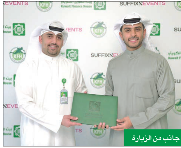
جانب من الزيارة

أعلن بيت التمويل الكويتي، فتح باب التسجيل بمسابقة بيتك لسباق الحواجز KFH Obstacle Challenge، بالتعاون مع شركة سافيكس لتنظيم الفعاليات الرياضية، والتي ستقام يوم السبت (26 مارس المقبل) على شاطئ المارينا. وأشار «بيتك» إلى أن هذه المسابقة تأتي ضمن سلسلة من الفعاليات التي يقمها البنك على مدار العام، ضمن مساعي دعم الرياضة والشباب، وتأكيداً على دوره في المسؤولية الاجتماعية. وكشف عن أن طول السباق سيكون 5 كيلومترات، مع التأكيد على أن الحواجز ستكون بمستويات مختلفة ومتنوعة على المتسابقين، وستكون المنافسة متاحة لفئة الشباب (رجال) من 16 عاماً وما فوق، وسيتم تقسيم المشاركين إلى أربع فئات مختلفة بواقع: - الفئة الأولى من 16 إلى 24 سنة. - الفئة الثانية من 25 إلى 34 سنة.