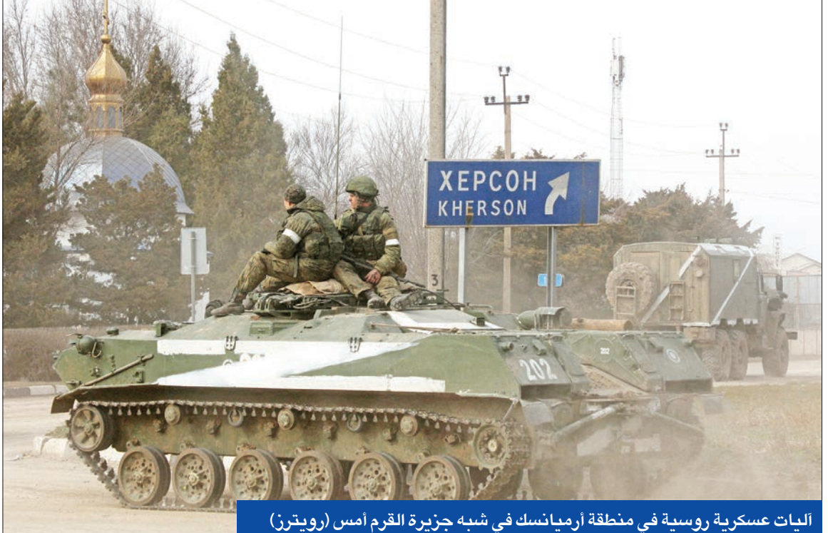
اليات عسكرية روسية في منطقة أرميانسك في شبه جزيرة القرم أمس