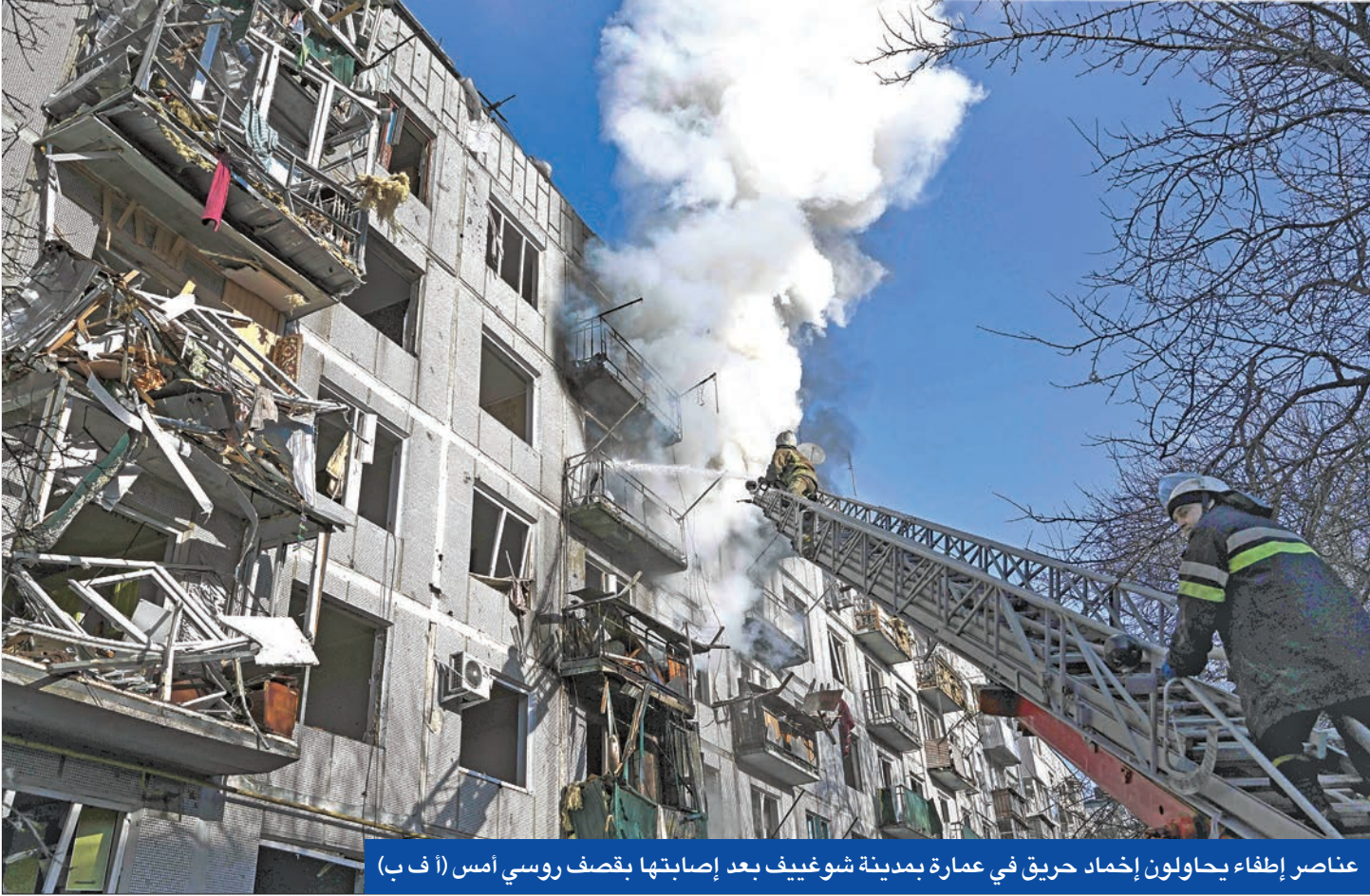
عناصر إطفاء يحاولون إخماد حريق في عمارة بمدينة شوتيف بعد إصابتها بقصف روسي أمس