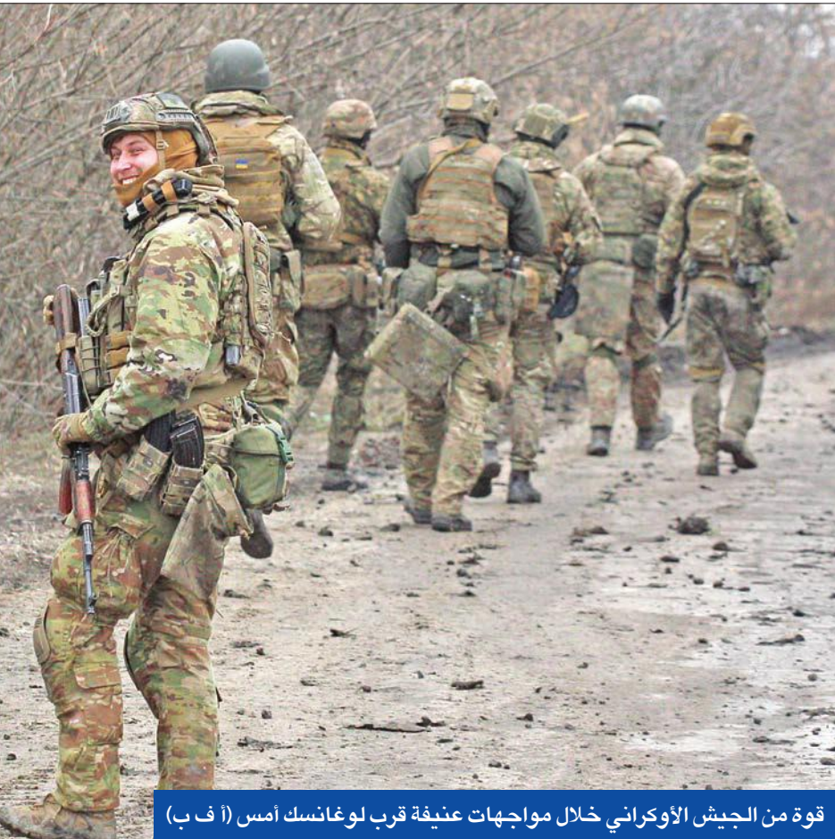
قوة من الجيش الأوكراني خلال مواجهات عنيفة قرب لوغانسك