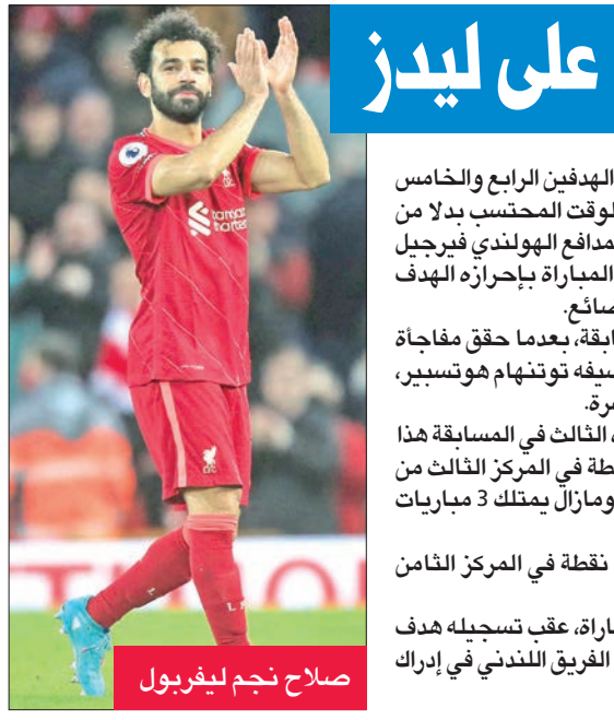
صلاح نجم ليفربول