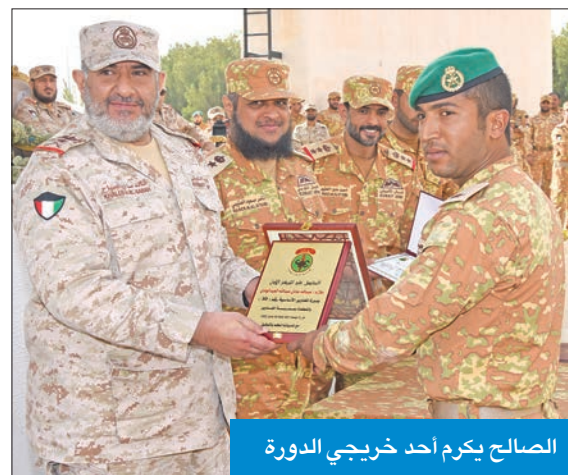
الصالح يكرم أحد خريجي الدورة

يرتقي إلى مستوى عالٍ من الأداء، وعرب عن أمنيته الدائمة «لهذه الوحدة بالتطور والارتقاء إلى مستويات متميزة، حتى يكون الجيش الكويتي دائماً على أتم الاستعداد، منفذاً لمهامه التي