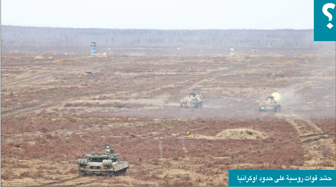
حشد قوات روسية على حدود أوكرانيا

على سعيد آخر، قد تثير صدمة التحرك العسكري الروسي الواسع تساؤلات كثيرة في أنقرة، فقد كانت تركيا في عهد الرئيس رجب طيب أردوغان تستمتع بلعبة الحرب الباردة وتتلاعب بالقوى العظمى، لكن علاقتها مع أوكرانيا تبقى مهمة، ولن تستفيد تركيا المنتسبة إلى حلف الناتو من عسكرة البحر الأسود وشرق البحر الأبيض المتوسط، وقد تدفع التحركات الروسية التي تزعزع استقرار المنطقة كلها بتركيا إلى التقرب من الولايات المتحدة مجدداً، مما يعني توسع الشرخ بين أنقرة وموسكو، وقد ينعكس هذا الوضع إيجاباً على الناتو أو يزيد احتمال عقد شراكة أميركية تركية في الشرق الأوسط، وبدل أن تبقى تركيا مصدر إزعاج، قد تتحول إلى دولة حليفة.