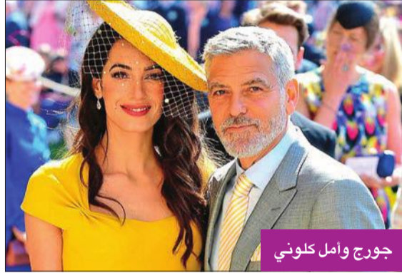
جورج وأمل كلوني

يعيش النجم الأمريكي العالمي جورج كلوني قصة حب رائعة مع زوجته الحامية اللبانية الشهيرة أمل علم الدين في منزل مفعم بالحب والتفاهم بشكل يفوق الخيال، وفقاً لتصريحات أدلت بها لمجلة "تايم" الأميركية، عقب اختيارها واحدة من أبرز 12 امرأة لعام 2022.