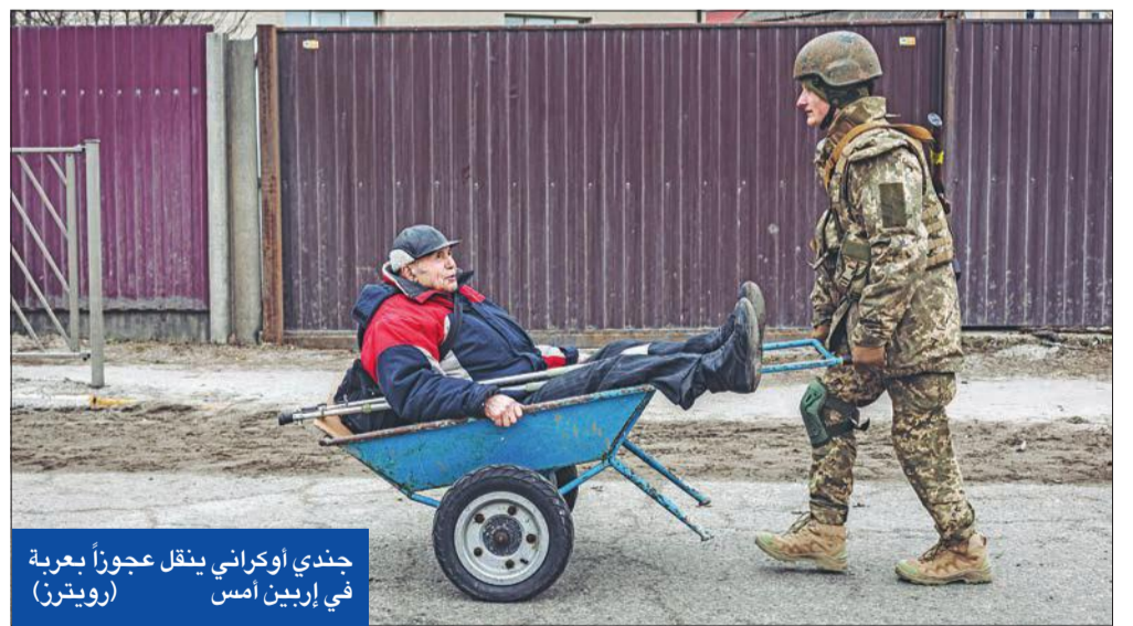
جندي أوكراني ينقل عجزاً عبرية في إربين أمس