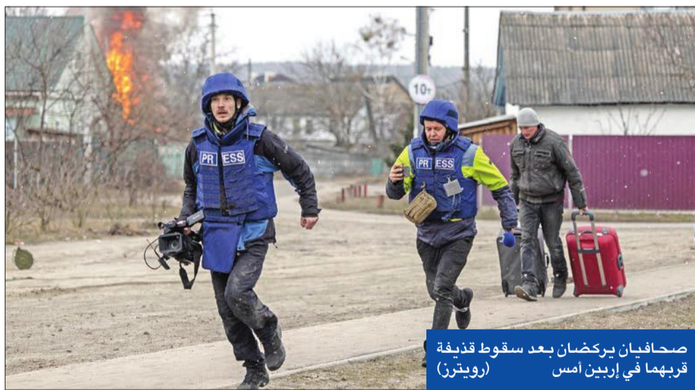
صحافيان بركضان بعد سقوط قنبلة قريهما في إربين أمس

من الضروي إبقاء قوات الاتصال مع موسكو وسنساعد مولدوفا