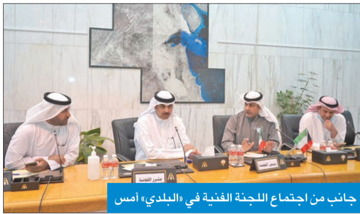
جانب من اجتماع اللجنة الفنية في «البلدي» أمس

من جانب آخر، تناقش لجنة محافظة الأحمدي، في اجتماعها غداً، طلب هيئة تشجيع الاستثمار المباشر بشأن تخصيص أراضٍ لإقامة مشاريع صناعية لتدوير النفايات النفطية شمال مصفاة الزور، وطلب الهيئة العامة للطرق