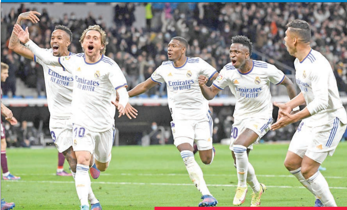
فرحة لاعبي ريال مدريد بعد إحراز هدف في مرمى ريال سوسبيداد