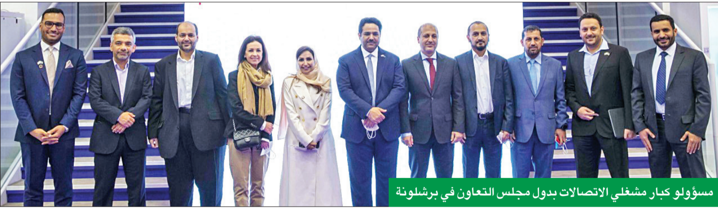
مسؤولو كبار مشغلي الاتصالات بدول مجلس التعاون في برشلونة

لمعالجة تغير المناخ وتعزيز أجندة الاستدامة في المنطقة