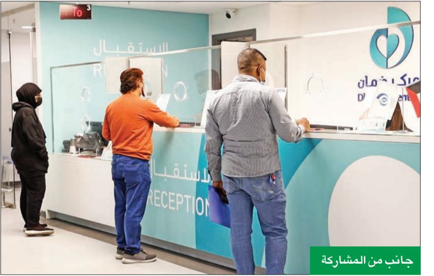
جانب من المشاركة

لقطاع التكنولوجيا الذي من شأنه أن يصبح ممكناً رئيسياً للحد من التغير المناخي. وتعليقاً على هذا التعاون، صرح الشيخ بدر بن راشد آل خليفة مدير عام «بتلكو» بأن الشركة «تولي اهتماماً كبيراً بتعزيز الاستدامة البيئية وتقليل البصمة الكربونية، وقد باشرنا تنفيذ العديد من المبادرات التي تتماشى مع مساعي الشركة لتصبح شركة صديقة للبيئة وتحقق أهداف الاستدامة المؤسسية». وأضاف الشيخ بدر آل خليفة أنه كان من أبرز ذلك افتتاح حديقة «بتلكو» للطاقة الشمسية، التي تساهم حالياً بإنتاج طاقة نظيفة ومتجددة لتشغيل عمليات الشركة، «ونطلع دورنا إلى الاستثمار في بديل أفضل الجهود للمساهمة في دعم البرامج البيئية وخلق مستقبل أكثر استدامة».