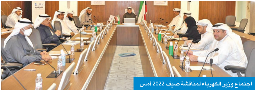
اجتماع وزير الكهرباء لمناقشة صيف 2022 أمس

عقد وزير النفط وزير الكهرباء والماء والطاقة المتحدة وزير الداخلية بالوكالة د. محمد الفارس اجتماعاً مع وكلاء قطاعات «الكهرباء» للاطلاع على استعداداتها لصيف 2022، وتم خلاله عرض حالة وحدات توليد الطاقة الكهربائية، ووحدات تحلية المياه في قطاع محطات القوى الكهربائية وتقطير المياه، ونسب الصيانة المنجزة وجاهزية شبكات الوقود. واستعرض الاجتماع الذي عقد صباح أمس حالة محطات التحويل الرئيسية، والخطوط الهوائية ذات الجهد العالي، وجاهزية قطاع «شبكات التوزيع» لحدوث أي طارئ في المحطات وشبكة الضغط العالي، إضافة إلى الآليات الجديدة التي تم تدشينها لضمان سلامة الشبكة الكهربائية. وناقش الفارس ما انتهت إليه برامج صيانة محطات التحويل الثانوية، ووحدات التوزيع المتكاملة حيث تمت سنوياً في الفترة من بداية أكتوبر حتى نهاية مايو أعمال الصيانة المختلفة للمحطات، إضافة إلى آلية عمل المراقبات المتوزعة في المحافظات الست.