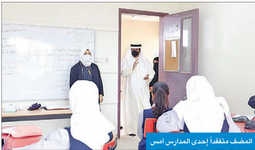
المضف يتفقد إحدى المدارس أمس

والتلاميذ جميع منتسبي «التربية» بمناسبة بداية الفصل الثاني، بعد حصول طويلاً، بمنحياً أن تكفل الجهود بنجاح الطلبة. وبينت المصادر اضطراب معلمين ومعلمات إلى تنفيذ مكاتبتهم بأنفسهم في بعض المدارس، منوهة إلى أن الوزارة ستعمل خلال الأيام المقبلة على استكمال أعمال التنظيف والصيانة، للوصول إلى جاهزية المناسبة، تمهيداً للعودة الشاملة التي من المتوقع اعتمادها قريباً.