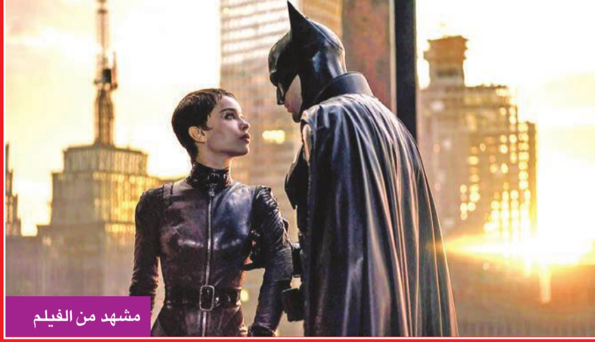
مشهد من الفيلم

الفيلم حقق أكبر إيرادات افتتاحية لعام 2022