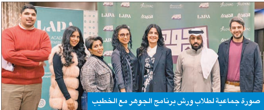
صورة جماعية لطلاب ورش برنامج الجوهر مع الخطيب

وحول ما تناهى به من حرية تعبير مطلقة، أوضحت الخطيب أن «للحرية حدوداً، حسب الإنفتاح وقبول المجتمع، لكن حرية الرأي والفكر المفروض أنها مطلقة، وكذلك حرية البحث العلمي، مضيقة «عادة ما يحدّ الحريات، هو الكذب أو إيذاء الآخرين جسدياً أو نفسياً، لكن، من المفروض أن تكون حدود الحرية محددة وقليلة».