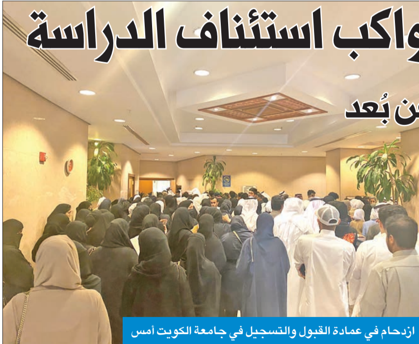
ازدحام في عمادة القبول والتسجيل في جامعة الكويت أمس

د. سالم الطحيح ضرورة إعادة دراسة تجربة التعليم عن بعد لمعرفة سلبياتها وإيجابياتها، مبيحاً أن العودة للدراسة التقليدية موضع ترحيب من الجميع. وقال الطحيح لـ «الجريدة»: «اعتقد أن الإجازة الطويلة لا تؤثر على التحصيل العلمي»، لافتاً إلى أن «أي طالب لا يمانع في أخذ الإجازات الطويلة».