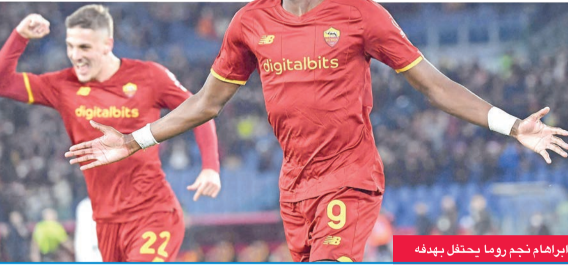
أبراهام نجم روما يحتفل بهدفه

وفي مباراة أخرى، عاد لانسبو إلى سكة الانتصارات بفوزه على مضيغة كالياري بثلاثة أهداف دون رد. وافتح لانسبو التسجيل عبر مهاجمة تشيرو إيموبيلي (19) من ركلة جزاء، قبل أن يضيف الإسباني لويس البرنو الهدف الثاني (42)، والبرازيلي فيليبى الهدف الثالث (62). وبهذا الفوز رفع لانسبو رصيده إلى 46 نقطة في المركز السابع، بينما تجدد رصيد كالياري عند 25 نقطة في المركز السابع عشر.