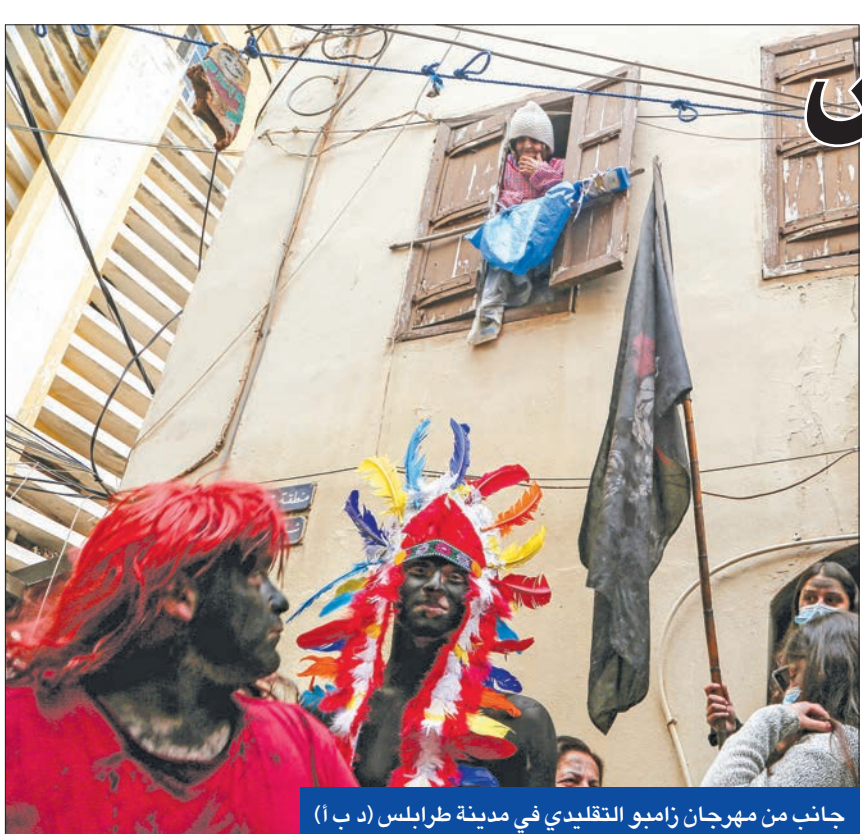
جانب من مهرجان زامبو التقليدي في مدينة طرابلس