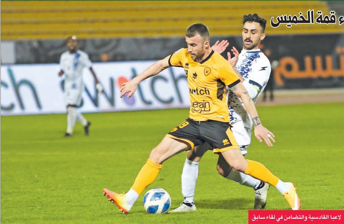
لاعبا القادسية والتضامن في لقاء سابق