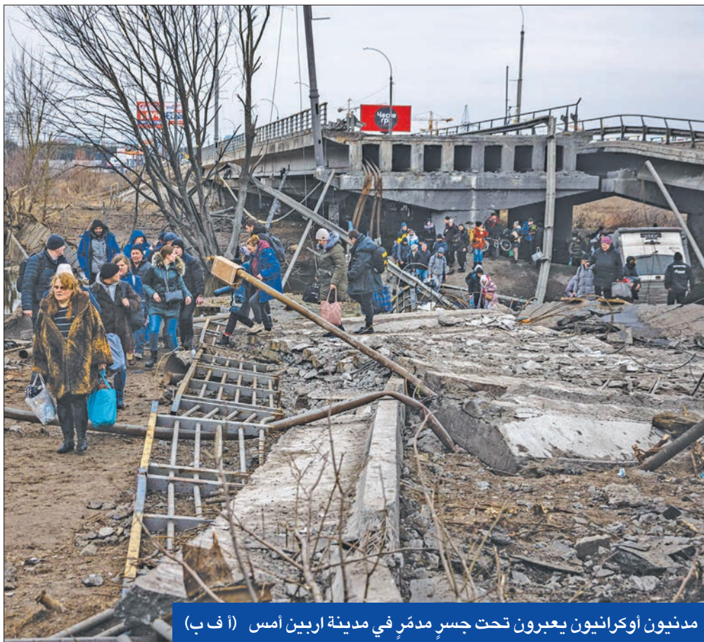
مدنيون أوكرانيون يعبرون تحت جسر مدمر في مدينة أربين أمس

وقال وانغ: "الصين وروسيا عضوان دائمان في مجلس الأمن، ولدينا شراكة استراتيجية وعلاقتنا هي الأكثر أهمية على صعيد العلاقات الثنائية". واعتبر أن العلاقة بين الدولتين "مهمة لأنها مستقلة وتقوم على أساس عدم استهداف الآخر، وهذا ما تبين عبر الخبرة التاريخية". وإن حضّ الأطراف على عدم إضافة "وقود إلى النار" في الحرب الدائرة بأوكرانيا، وتعهد باستعداد الصين للعمل مع المجتمع الدولي للقيام بالوساطة اللازمة، قال وزير الخارجية الصيني: "يجب أن يكون واضحا أن قضية تايوان تختلف اختلافا جوهريا عن قضية أوكرانيا، ولا توجد مقارنة بينهما". وزير تايوان: الأوكرانيون أصبحوا مصدر إلهام لنا. إلى ذلك، قال وزير الخارجية التايواني جوزيف وو في مؤتمر صحفي أمس، إن الأوكرانيين الذين يقاثلون ضد الغزو الروسي أصبحوا مصدر إلهام لشعب تايوان "في التصدي للتهديدات والإكراه من قبل السلطة الاستبدادية"، وأعلن عن تقديم مساعدات بملايين الدولارات للاجئين الأوكرانيين.