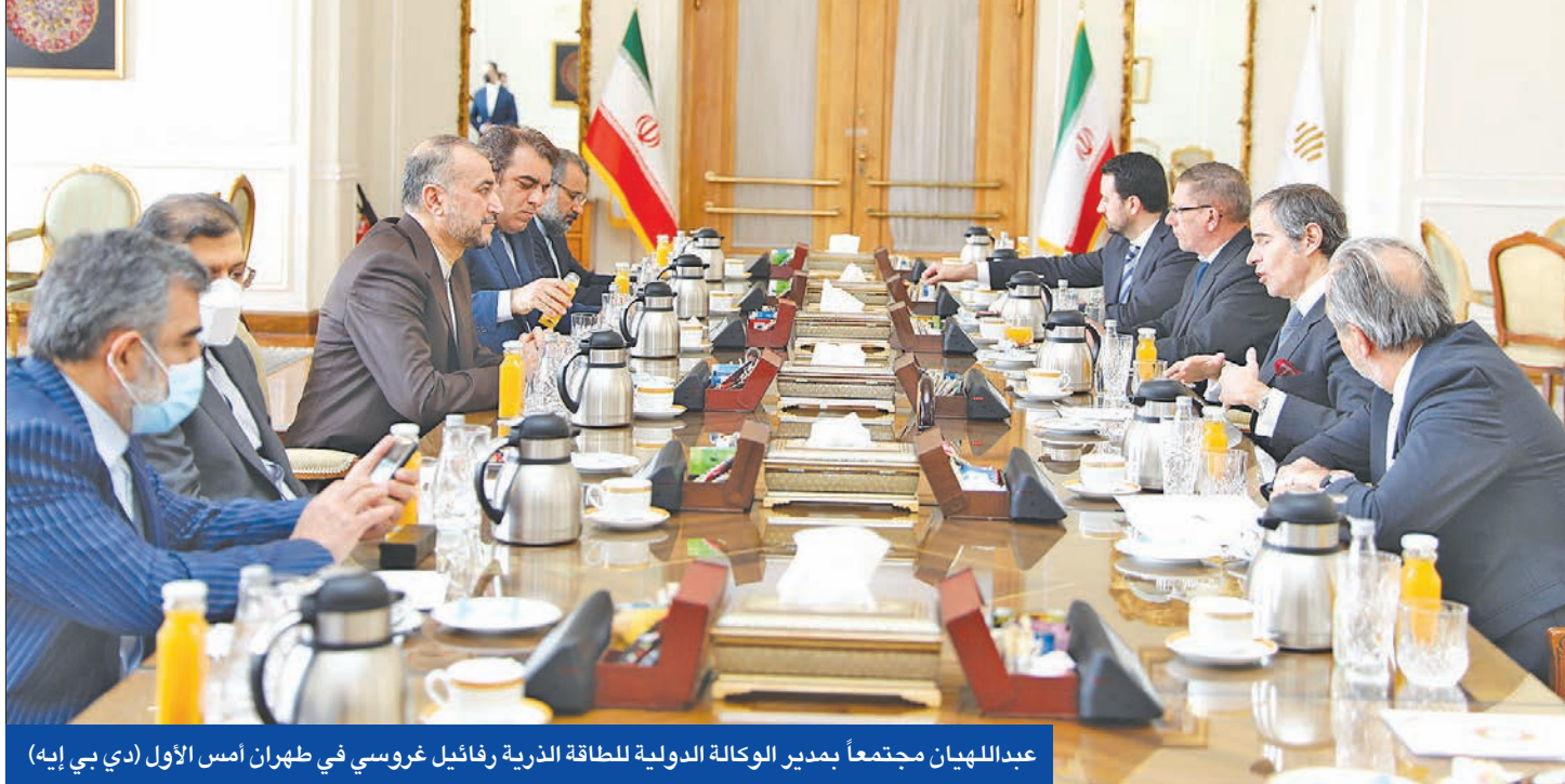
عبداللهيان مجتمعاً بمدير الوكالة الدولية للطاقة الذرية رفائيل غروسو في طهران أمس الأول

تلتزم واشنطن بتنفيذ التفاهات بهذا الخصوص حتى يتسنى «غلق هذا الملف الإنساني الذي كان من ضمن أولوياتنا». وفي الوقت نفسه، جدد المتحدث رفض بلاده للتفاوض المباشر مع واشنطن. وقال إن «مطلب واشنطن بالتفاوض المباشر مع طهران لا يحقق معانيه ما لم تغتبر الإدارة الأميركية سلوكها». وأكد أن حل النقاط المتبقية من أجل التوصل إلى اتفاق نووي يحتاج إلى قرار من إدارة الرئيس جو بايدن، فيما نقلت وكالة «رويترز» عن دبلوماسيين أن هناك على الأقل قضيتين أساسيتين لم تتم تسويتها بعد بين طهران وواشنطن ومنها مدى رفع العقوبات عن الجمهورية الإسلامية.