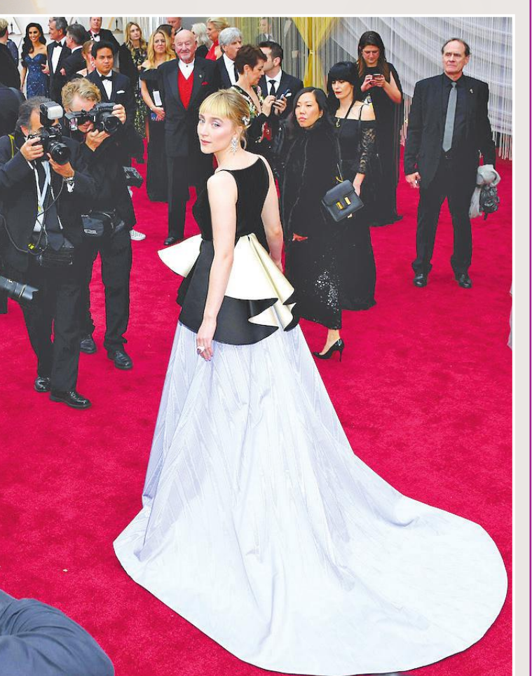
صورة أرشيفية من حفل الأوسكار

وحسب ما ذكره موقع "هوليوود ريبورتر"، فإن جوائز الأوسكار ستنتقل من حالة جفاف إلى طوفان من العروض، وبعد أن ظل الحفل بدون مضيف مدة 3 سنوات، سيستعين بثلاثة مقدمي برامج متنوعين يستطيعون جذب ملايين المشاهدين على شبكة ABC التي تنقل الحدث. ويبحث حفل جوائز الأوسكار رقم 94 على الهواء مباشرة يوم 27 مارس من مسرح دولبي بهوليوود الذي يتسع لأكثر من 3400 شخص، ويحلم المنظمون بتحطيم الرقم القياسي لحفل أوسكار عام 2004، الذي تحظى فيه عدد المشاهدين 46 مليوناً، بعد أن تملك العالم كله سحر وانبهار الفيلم الأسطوري The Lord of the Rings.