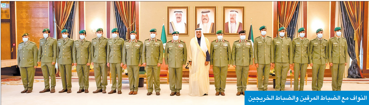
النواف مع الضباط المرقيين والضباط الخريجين

تحت رعاية وحضور نائب رئيس الحرس الوطني، الفريق أول متقاعد الشيخ أحمد النواف، وحضور وكيل الحرس الوطني الركن هاشم الرفاعي، وكيان القيادة والضباط، احتفل الحرس بتكريم عدد من القادة بمناسبة صدور مرسوم أميري بترقيتهم إلى رتبة عميد، وتنادية 14 ضابطاً من كلية أحمد بن محمد العسكرية ضمن الدفعة السابعة عشرة بدولة قطر الشقيقة، و10 ضباط من خريجي كلية علي الصباح العسكرية ضمن الدفعة الثامنة والأربعين القسم. وهذا النواف القادة المترقين على ثقة القيادة السياسية بهم، ممثلة في صاحب السمو أمير البلاد القائد الأعلى للقوات المسلحة، وسمو ولي عهده،