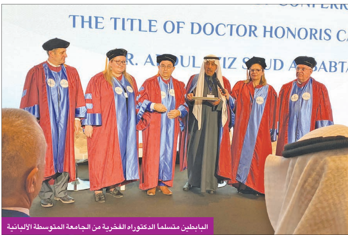
البابطين متسلماً الدكتوراه الفخرية من الجامعة المتوسطة الألبانية

إذا لم يشد السلام في أوكرانيا فلن يشهده العالم رئيسة كوسوفو