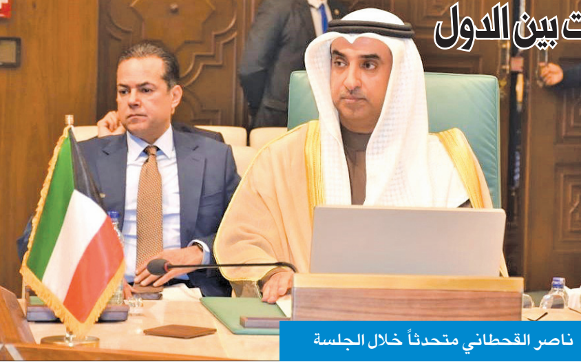
ناصر القحطاني متحدثاً خلال الجلسة

قال مساعد وزير الخارجية لشؤون الوطن العربي ناصر القحطاني، إن التطورات الخطيرة على الساحة الدولية تستوجب تكثيف التعاون والتنسيق بين الدول العربية لمواجهة الأزمات الدولية التي قد تنعكس على المنطقة العربية.