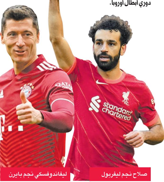
ليفاندوفسكي نجم بايرن

يملك بايرن ميونخ الألماني فرصة لتحسين نتائجه المتقلبة في الآونة الأخيرة، عندما يستقبل سالزبورغ النمساوي اليوم في إياب دور الـ16 من دوري