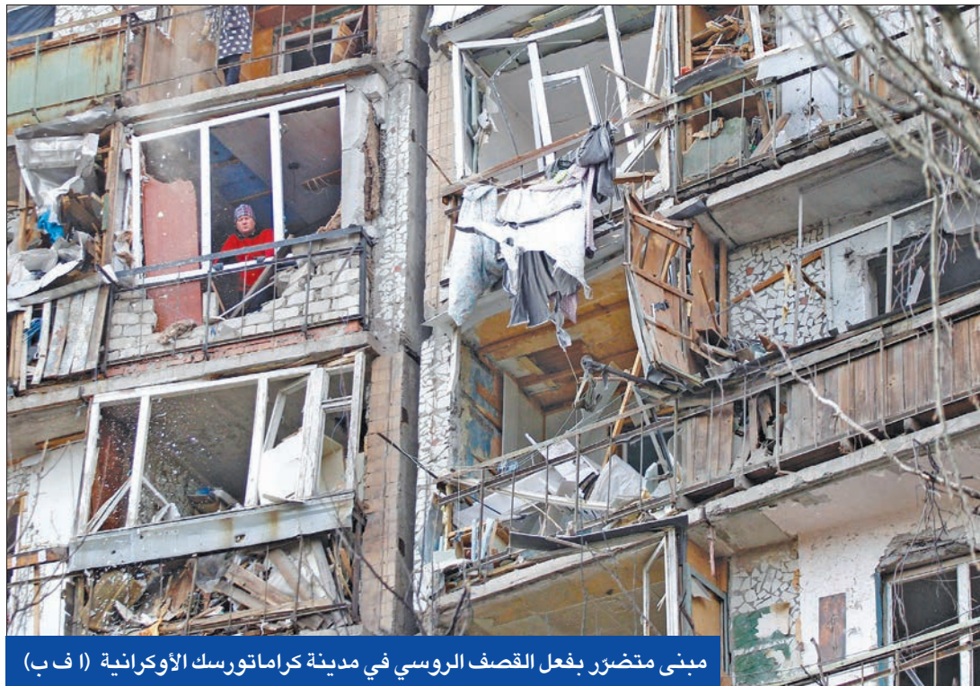
مبنى متضرر بفعل القصف الروسي في مدينة كراماتورسك الأوكرانية