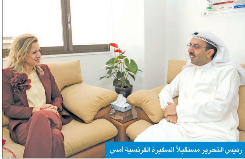
رئيس التحرير مستقبلاً السفيرة الفرنسية أمس

وجرى التطرق إلى الوضع في لبنان، والانتخابات الرئاسية الفرنسية المقررة