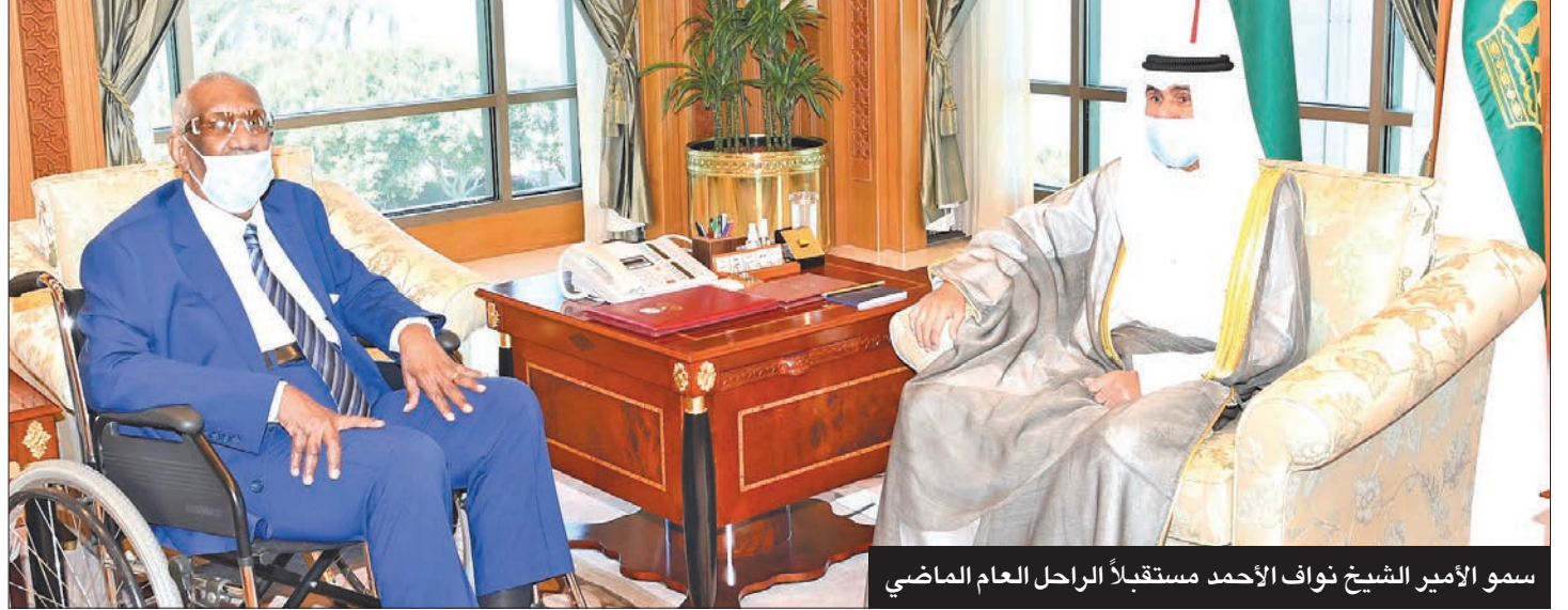
سمو الأمير الشيخ نواف الأحمد مستقبلاً الراحل العام الماضي