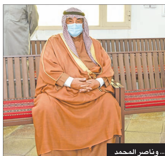
... وناصر المحمد

نعجز عن رثائك بكلمات تليق بمقامك. كنت وستظل الأب، والمعلم، والملمه، والقدوة، والرمز الوطني الحقيقي. معرفتك شرف، ودعمك وسام، لن نرحل عنا بهذه البساطة، فقد رحلت جسداً وستظل ماثراً محفورة في وجداننا، فالمعلم والملمه يظل حياً لا يموت. تعلمنا منك أن التواضع رفعة، وأن الصدق سيد الأخلاق. تعلمنا منك كيف يمكن للسياسي أن يحافظ على إنسانيته، كيف له أن يحافظ على قيمه الأخلاقية ومبادئه في زمن أصبح فيه الجمع بين السياسة والأخلاق عملة نادرة. تعلمنا منك أن الكرسي النيابي وسيلة وليس هدفاً، بل مصلحة الكويت وشعبها. تعلمنا منك العبء بلا مقابل، والإيمان بقضايا الوطن والدفاع عنها بكل صدق بعيداً عن المصالح الذاتية وأهمها كسب الشهرة والمال. تعلمنا منك التعبير عن الرأي وقول الحق دون الإكترار بردود الأفعال وحساب الربح والخسارة. تعلمنا منك شرف الترحل عن المنصب والسلطة في زمن الهوس بالالتئين. تعلمنا منك إيمانك بالشباب والثقة بقدرتهم على التغيير للأفضل، فكتبت حتى آخر لحظة في حياتك داعماً ولمهلاً لكل طموح ومحتهد. تعلمنا منك المعنى الحقيقي للقيادة، وللشجاعة، وللعمل السياسي الشريف. تعلمنا الكثير... الكثير وداعاً يا صاحب القلب الذي اتسع للجميع. وداعاً يا دكتور... نقولها بغصة فمن مثلك؟