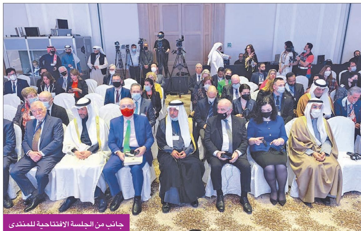
جانب من الجلسة الافتتاحية للمنتدى