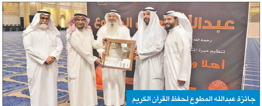
جائزة عبدالله المطوع لحفظ القرآن الكريم