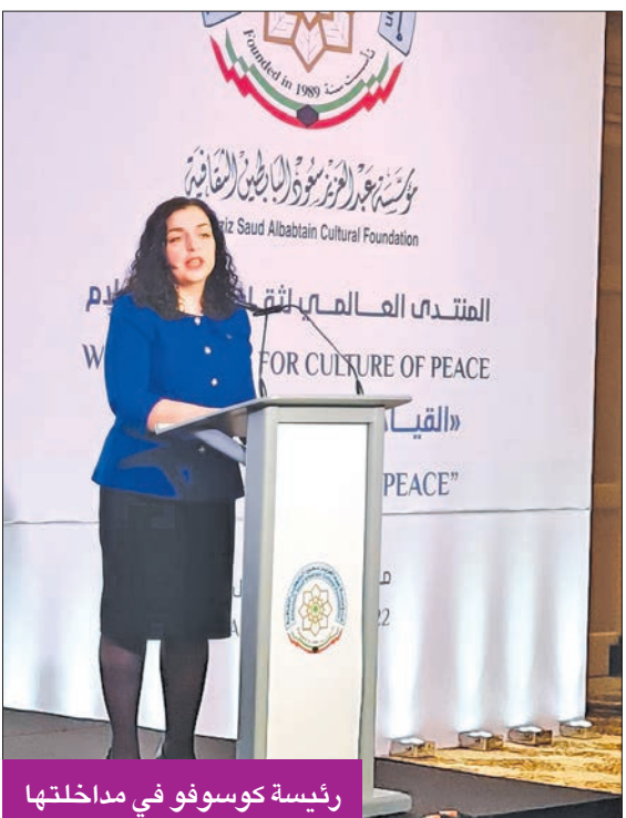
رئيسة كوسوفو في مداخلتها