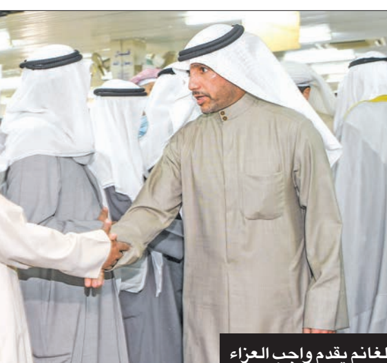
السعدون بين المعزينا

دبلوماسية: دوره أساسي بتشكيل الهوية الديموقراطية «فقدت الكويت أحد رموزها السياسية الدكتور أحمد الخطيب، أحد كتبة الدستور الكويتي، والذي لعب دوراً أساسياً في تشكيل الهوية الديموقراطية للبلاد عندما كان نائب رئيس المجلس التأسيسي». وختمت «خالص العزاء لأسرة الخطيب وللشعب الكويتي». أما السفارة الفرنسية لدى البلاد كلير لو فليشر فكتبت على «تويتر»: «فقدت الكويت أحد رموزها السياسية ومؤسسي الدستور الكويتي، وصيفة: «كان الخطيب من أبرز السياسيين والمفكرين في الساحة العربية. خالص التعازي لأسرته ولكل أبناء الشعب الكويتي». ومن جهته، أسف السفير الهندي لدى البلاد تسيبي جورج، «لفقدان الكويت أحد رجالاتها السياسيين النابغ السابق في مجلس الأمة ونائب رئيس المجلس التأسيسي وأحد كتبة الدستور الكويتي».