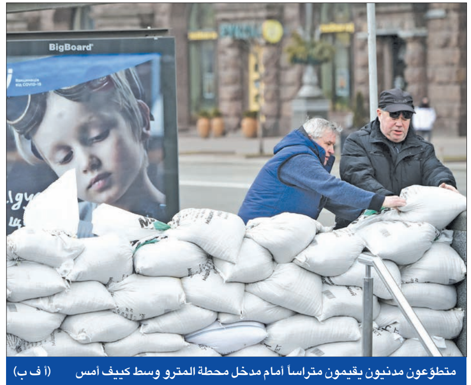
متطوعون مدنيون يقيمون متراسا أمام مدخل محطة المترو وسط كيف أمس

مطاراتها في النزاع الحاصل مع كيف. كما أكدت لبيتوانيا، أنها لن ترسل مقاتلات لأوكرانيا، ولن تسمح لها باستخدام مطاراتها.