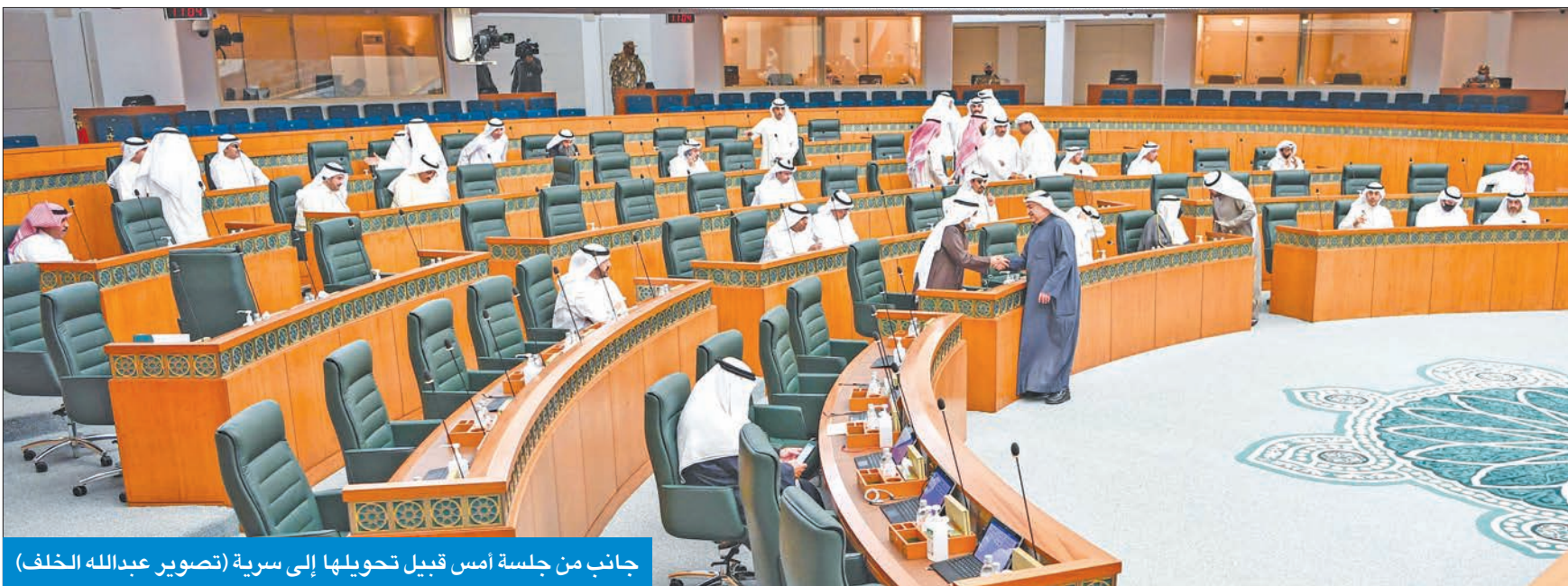
جانب من جلسة امس قبيل تحويلها إلى سرية

الغانم: سموه كلفني نقل رسالة دعا خلالها أبناءه النواب لوضع مصلحة البلاد العليا فوق كل اعتبار