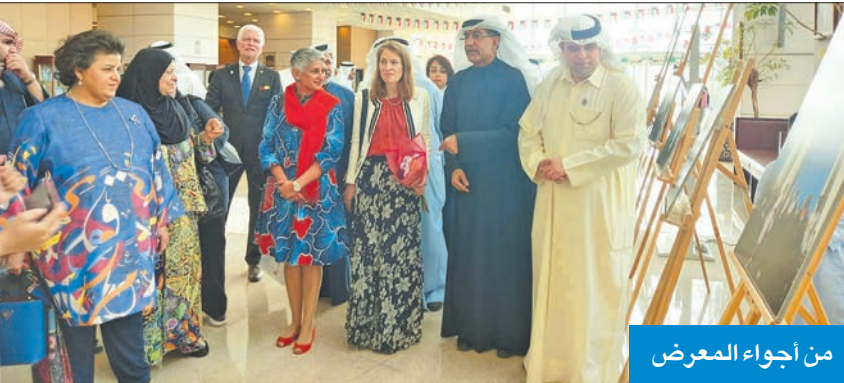
من أجواء المعرض

بداً المشرف»، لافتة إلى أن موقف الكويت في الأمم المتحدة أظهر معدن القيادة.