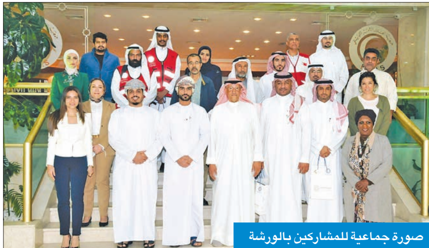
صورة جماعية للمشاركين بالورشة

الشكر للهلال الأحمر لتنظيم ورشة إعداد الكوادر الإعلامية في المجال الإغاثي والإنساني. وقال إن الأمانة العامة