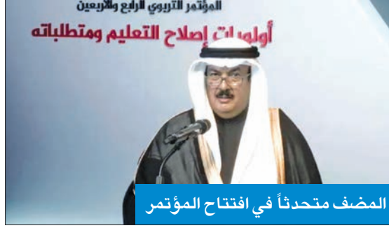
المضف متحدثاً في افتتاح المؤتمر

العهد للمؤتمر تأتي انطلاقاً من حرص سموه على دعم المسيرة التربوية، وتحقيق أهدافها المنشودة، وتأكيداً لما يحظى به المعلمون بشكل عام، وجمعية المعلمين بشكل خاص، من مكانة رفيعة لدى سموه. وأضاف الوزير: "لا بُد من الإشارة أولاً إلى الأهتمام الكبير الذي توليه الكويت لإصلاح وتطوير المسيرة التربوية وتنميتها، وقد استطاعت أن تخطو خطوات واسعة وشاسعة نحو التقدم والرقي، ومواكبة كل التطورات والمستجدات الحديثة والاتجاهات المعاصرة، التي تتوافق مع احتياجاتنا وتطلعاتنا، وتنسجم مع