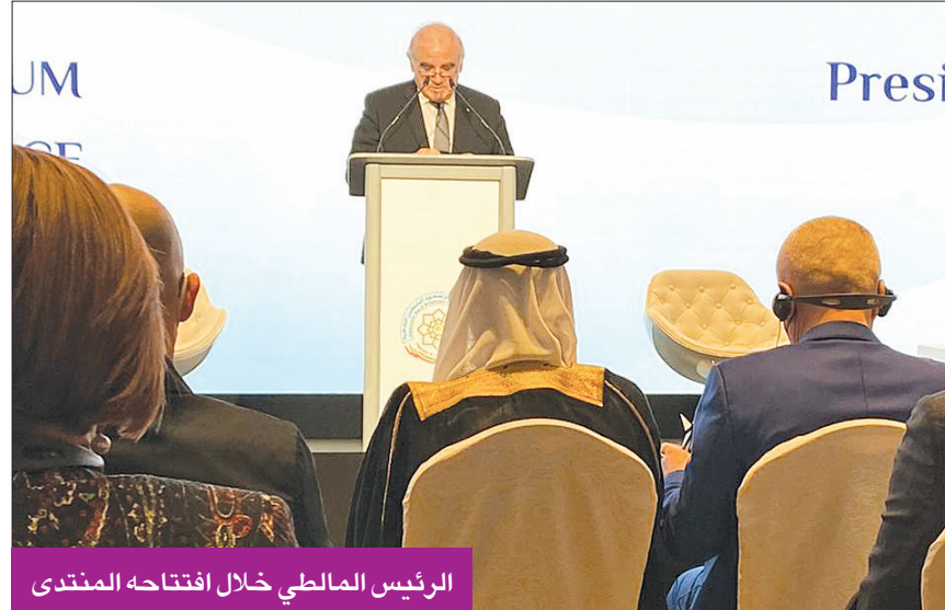
الرئيس المالطي خلال افتتاحه المنتدى

بعد أيام قليلة من اندلاع الحرب الطاحنة التي شنتها روسيا على أوكرانيا، وبافكار مهمة بين الواقع المتردي بتبعات الحروب والأطماع والتعديات من جهة والأمنيات بعالم سعيد يسوده السلام وتراعى فيه حقوق الإنسان وتحفظ له فيه أدميته من جهة أخرى، نظمت مؤسسة البابطين الثقافية، في ضيافة جمهورية مالطا ورعاية رئيسها، على مدى يومين، المنتدى العالمي الثاني للسلام، تحت شعار «القيادة من أجل السلام العادل» وعلى نفس السرد الذي سارت عليه مؤسسة البابطين الثقافية منذ إنشائها تحت قيادة العم عبدالعزيز سعود البابطين، جاء هذا المنتدى، خطوة أخرى بارزة ترسخ الاهتمامات العالمية والإنسانية والمعرفية والحقوقية والثقافية التي وضعتها المؤسسة في مقدمة أولوياتها، لتكون بذلك المساعي الخفية والأهداف النبيلة خير سفير للكويت، وعلامة ساطعة على اهتمام مؤسسات الكويت المدنية والثقافية بالسلام حتماً وشعاراً وثقافة وتطبيقاً وواقعاً معيشاً لجميع شعوب الأرض.