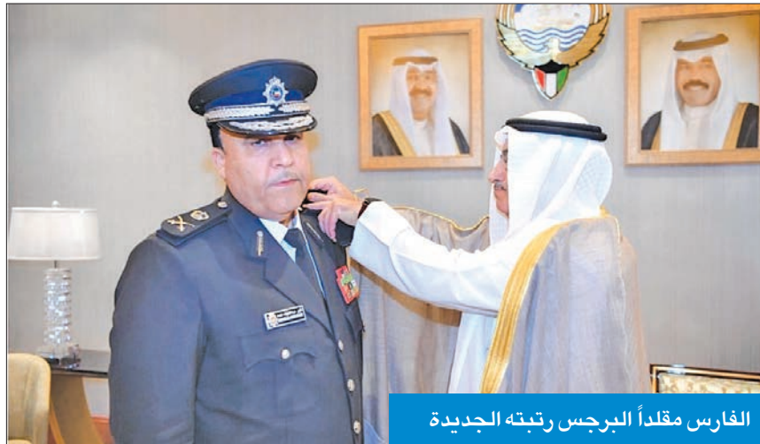
الفارس مقلداً البرجس رتبته الجديدة

الداخليّة، وفقاً للبيان، عن اعترازه وفخره بثقة القيادة السياسية، متمنياً له تعدد حافزاً ودافعاً له لبذل المزيد من الجهد والعطاء لخدمة الوطن الغالي، معبراً عن شكره وتقديره لوزير الداخليّة على الدعم والمساندة.