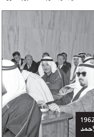
من جلسات المجلس التأسيسي 1962 ويبدو الأمير الراحل الشيخ جابر الأحمد

من الغزو العراقي، شارك في انتخابات مجلس الأمة 1992 عن الدائرة التاسعة وحصل على 886 صوتاً وحل بالمركز الثاني وفاز، وكانت هذه المرة الأخيرة التي يترشح فيها لمجلس الأمة مبرراً لهذا الاستحباب من العمل النيابي هذا الاستحباب اعطاء الفرصة للشباب لإكمال مسيرة الديمقراطية، إلا أنه ظل حاضراً من خلال مشاركته بالندوات السياسية التي تقام بين الحين والآخر، وزيارة دواوين المواطنين لمشاركتهم أفراحهم وأتراسهم، بالإضافة لتفرغه لبعمله كطبيب في عيادته الخاصة.