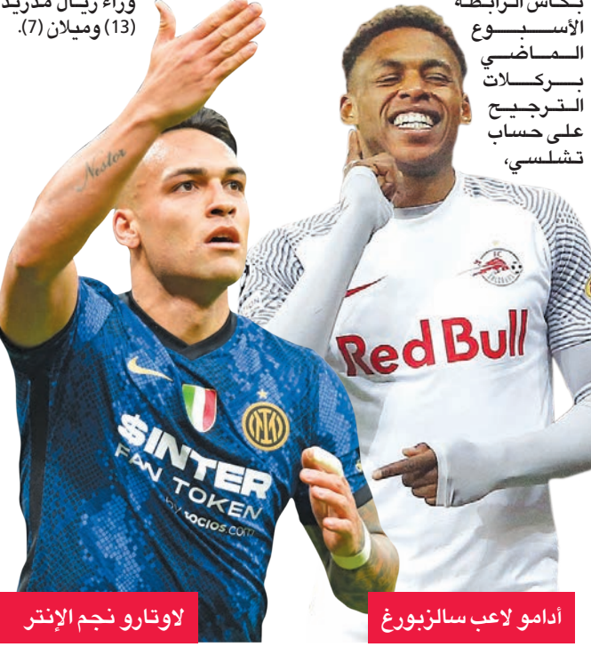
لاوتارو نجم إنتر