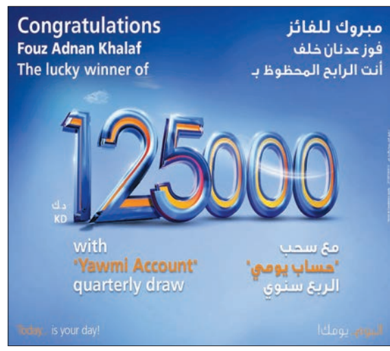
مع سحب 'حساب يومي' الربع سنوي

أعلن المدير العام لمعهد الدراسات المصرفية د. يعقوب الرفاعي، أن المعهد سيستضيف البروفيسور سكوت سنوك محاضر أول من كلية هارفارد لإدارة الأعمال، ليعقد برنامجاً تدريبياً عن بُعد بعنوان «متطلبات التميز الشامل: تنمية المهارة والجدارة القيادية»، في 29 الجاري. ويعقد هذا البرنامج برعاية بنك الكويت الوطني وبنك الخليج وبنك برقان وبنك وربة. ويعتبر البروفيسور سكوت خبيراً في القيادة والتنمية، ويمتلك خبرات فريدة كقائد وباحث، إذ أمضى 22 عاماً في قيادة الجنود بجيش الولايات المتحدة الأميركية، وتقاعد كعقيد، كما أنه درّس القيادة في الأكاديمية العسكرية الأميركية في ويست بوينت، وهو حاصل على ماجستير في إدارة الأعمال ودكتوراه من جامعة هارفارد.