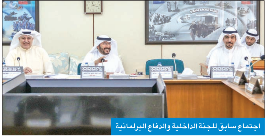
اجتماع سابق للجنة الداخلية والدفاع البرلمانية

وافقت على إلغاء القيود الأمنية على المواطنين