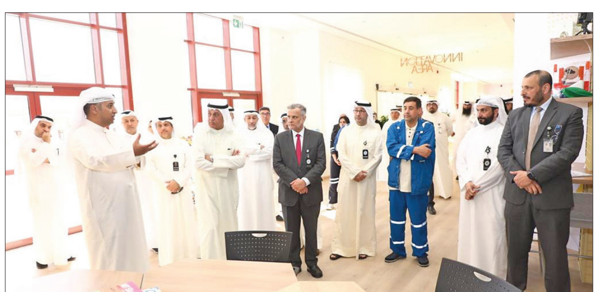
مسؤولو «نفط» الكويت يستمعون إلى شرح في أحد أجنحة المركز

وأضاف: سيتم ذلك من خلال برامج الابتكار (مثل تصنيع اللوحات الإلكترونية والأنظمة المدمجة، وتسجيل براءات الاختراع) والوادي العلمية (مثل نادي الروبوت، والبرمجة، والإلكترونيات، والتصميم). وأشار الزعابي إلى أن مركز حباري سيمكّن موظفي شركة نفط الكويت من تنفيذ مشاريعهم الخاصة بدعم من فرق فنية متخصصة، باستخدام المعدات والأجهزة الموجودة في مختبراته. وقال إن المركز سيكون فعالاً في بناء أجيال مستقبلية قوية من موظفي شركة نفط الكويت، الذين سيسخرون إمكاناتهم في مجال الابتكار للتصدي للتحديات المقبلة، وتهيئة المجال الدينامي، داعياً العاملين على تحقيق طموحاتهم من فرق فنية متخصصة، باستخدام المعدات والأجهزة الموجودة في مختبراته. وقال إن المركز سيكون فعالاً في بناء أجيال مستقبلية قوية من موظفي شركة نفط الكويت، الذين سيسخرون إمكاناتهم في مجال الابتكار للتصدي للتحديات المقبلة، وتهيئة المجال الدينامي، داعياً العاملين على تحقيق طموحاتهم من فرق فنية متخصصة، باستخدام المعدات والأجهزة الموجودة في مختبراته. وقال إن المركز سيكون فعالاً في بناء أجيال مستقبلية قوية من موظفي شركة نفط الكويت، الذين سيسخرون إمكاناتهم في مجال الابتكار للتصدي للتحديات المقبلة، وتهيئة المجال الدينامي، داعياً العاملين على تحقيق طموحاتهم من فرق فنية متخصصة، باستخدام المعدات والأجهزة الموجودة في مختبراته.