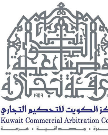
مركز الكويت للتحكيم التجاري Kuwait Commercial Arbitration Centre خبرة • مصداقية • سرية

● حنا: ZainTech لمواصلة تطوير حلول الأعمال