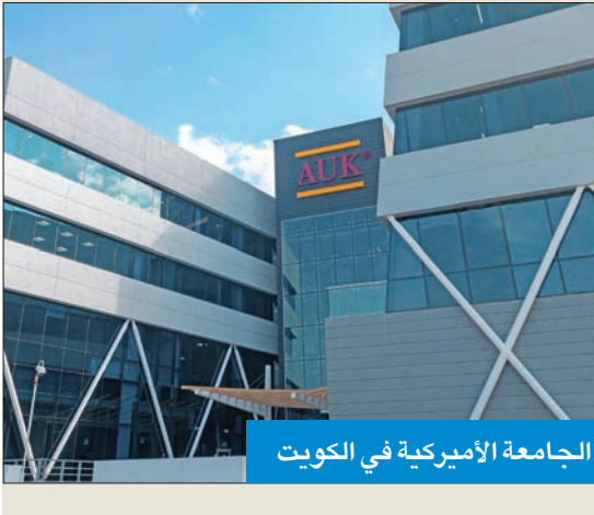
الجامعة الأميركية في الكويت

وأضاف أن «هذا الاعتماد يولد شعوراً بالإنجاز الشخصي، لأنه نتاج لعمل مشترك من قبل مجتمع الأميركية في الكويت».