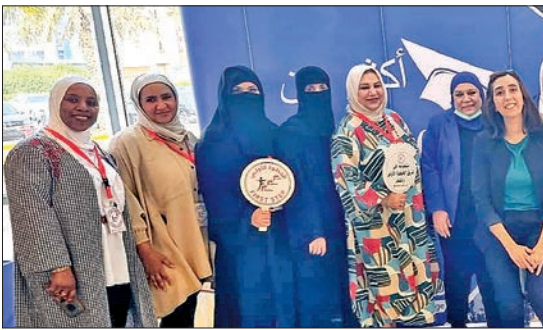
مشاركات في معرض بوكسهل