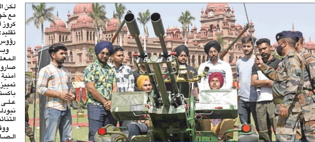
طلاب هنود يتصورون أمام مصاد جوي خلال معرض في أمريتسار

لكن المعلومات المتاحة تتطابق مع خواص رحلة صاروخ براهموس للسلطات المعنية. كما شكل إطلاق الصاروخ تهديداً خطيراً للطيران المدني، حيث كانت العديد من الرحلات تابعة لخطوط الجوية السعودية، تحلق على هذا المسار، وكان بإمكان الحكومة الهندية إصدار إنذارات لطيارين بشكل طارئ للطائرات القادمة لتجنب كارثة جوية محتملة. كما يضع الحادث علامة استفهام حول قوة ونطاق تدابير بناء الثقة القائمة بين الهند وباكستان، وتم إبرام اتفاقية الحد الساخن لعام 2004 لهذا الغرض بالذات، للإبلاغ بأي حالة طوارئ قد تؤدي إلى أي أزمة غير مقصودة، لكن هذا الإجراء الضروري لم تتخذه الهند. ويغض النظر عما إذا كان إطلاق الصاروخ عرضياً أو متعمداً، فإن هذا الحادث هو تذكير صارخ بأن جنوب آسيا لا تزال بؤرة اشتعال نووية. (واشنطن - د أ ب)