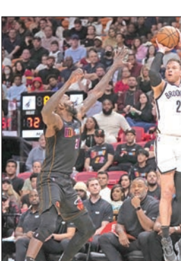
غريغنج نجم بروكولين يسدد من أمام ديدمون نجم ميامي

تخلى ميامي هيت عن صدارته لترتيب المنطقة الشرقية بعد أداء ضعيف أنتج خسارة أربعة توالياً 95 - 110 على أرضه أمام كيفن دورانت ورفاقه في بروكلين نتس. وبتلك الخسارة قفز فيلادلفيا سفنتس سيكسرز إلى الصدارة بدلاً من ميامي، مع إضاعة ميلووكي باكس حامل اللقب فرصة تخطي الفريقين بخسارة 102-127 أمام ممفيس غريزلز. وسجل الصربي نيكولا يوكيتش 35 نقطة و 12 كرة مرتدة ليلبلغ "الترينجل دابل" رقم 25 توالياً، مساهمياً في فوز دنفر ناغتس على ضيفه أوكلاهوما سيتي ثاندر 107-113.