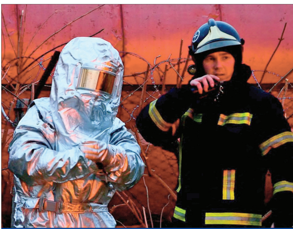
عاملاً إنقاذاً أوكرانياً يصلان إلى مخزن وقود أصيب بقصف روسي على ليفيف

● واشنطن تتراجع عن «زلة بايدن»: لا نسعى لإسقاط بوتين ● ماكرون يدعو لوقف التصعيد اللفظي