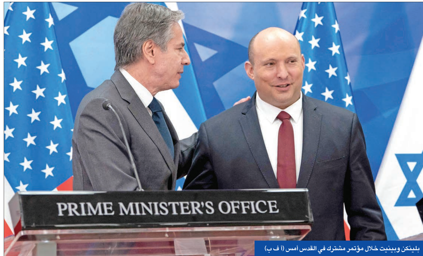
بليكن وبينيت خلال مؤتمر مشترك في القدس أمس

بليكن يجدد وصف «الحرس الثوري» بالإرهابي وعبداللهيان يتراجع بعد انتقادات للمتشددين