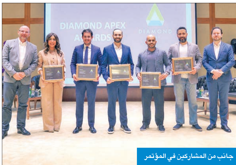
جانب من المشاركين في المؤتمر

وقال السعيد، في مؤتمر عقد الخميس الماضي بفندق الجميرا، حضره أطباء متخصصون عن التقويم الشفاف في الكويت، وقدمت خلاله محاضرات عرضت لعدد من الحالات لأطفال من سن 11 سنة تم تركيب التقويم الشفاف