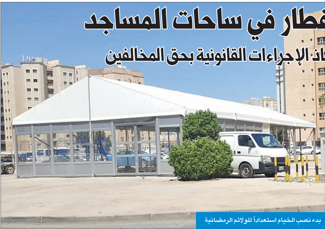
بدء نصب الخيام استعداداً للولائم الرمضانية

وأكد التعميم، الذي حصلت «الجريدة» على نسخة منه، أهمية تفيد الجهة الراغبة في إقامة الولائم بتقديم كتاب رسمي لإدارة مساجد المحافظة الواقع بها المسجد الذي سيقام بساحته الإفطار، لاخذ الموافقات الرسمية بعد