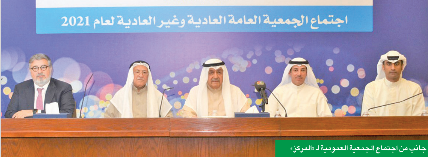
جانب من اجتماع الجمعية العمومية لـ «المركز»

«العمومية» وافقت على توزيع أرباح نقدية بنسبة 10% وأسهم منحة بـ 5%