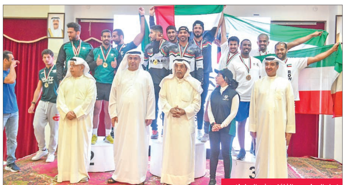
كبار الحضور والفائزون في البطولات

مجلس إدارة النادي الكويتي للرياضات الإلكترونية