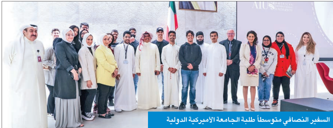
السفير النصافي متوسطاً طلبة الجامعة الأميركية الدولية

التقاهم وحثهم على «التركيز على تخصصهم لا وظيفتهم»