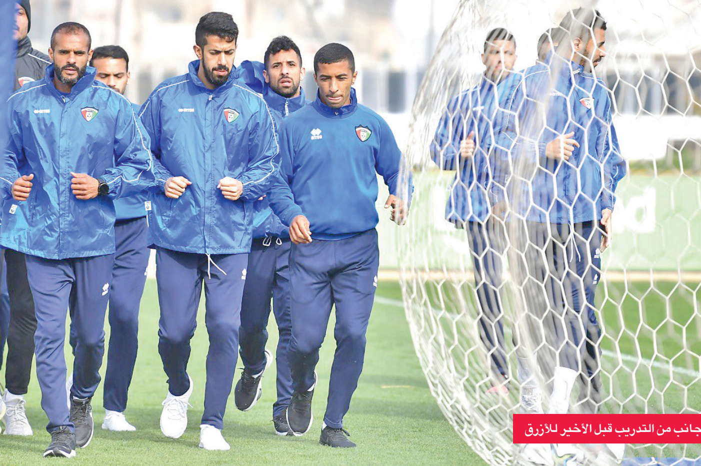
جانب من التدريب قبل الأخير للأزرق

لافيا يجري تغييراً على الخطة والتشكيل الأساسي