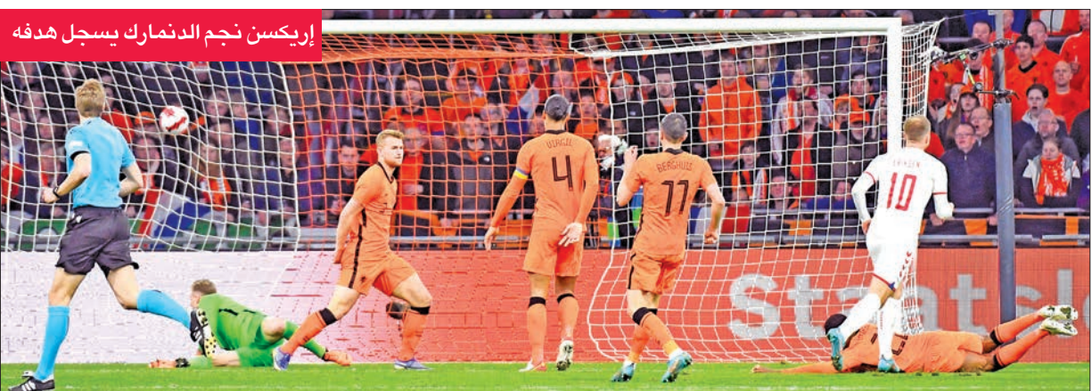
إريكسن نجم الدنمارك يسجل هدفه

دشن صانع الألعاب الدنماركي كريستيان إريكسن عودته إلى المنافسات الدولية، بعد قرابة تسعة أشهر من السكته القلبية التي تعرض لها، بتسجيله هدفاً بعد دقيقتين من دخوله في المباراة الودية التي خسرتها بلاده الدنمارك 4-2 ضد مضيفتها هولندا على ملعب يوهان كرويف أرينا في أمستردام، أمس الأول، في إطار استعدادات المنتخبين لنهايات كأس العالم 2022 في قطر. وعانى إريكسن (30 عاماً) نوبة قلبية خلال