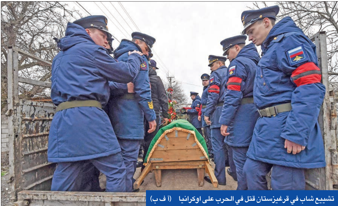
تشبيح شاب في قرغيزستان قتل في الحرب على أوكرانيا

رذت موسكو بلهجة حاسمة وغير معتادة على اشتباك محدود في كاراباخ بين القوات الأذربيجانية والقوات المحلية في الإقليم الذي يظننه الأرمن. واتهمت موسكو باكو بالتمركز داخل المنطقة التي تسيطر عليها قوات حفظ السلام الروسية التي تحمي هدنة 2020 الهشة بين أرمينيا وأذربيجان في الإقليم، وشن ضربة بطائرات مسيرة تركية من طراز بيرقدار. ونفت أذربيجان الاتهامات الروسية، بينما نددت وزارة الخارجية الأرمينية بـ "الغزو" الذي اتسم بـ "قصف مدفعي متواصل"، متهمه جارتها بحرمان رامن كاراباخ من الغاز، مما حال دون حصول السكان على التدفئة، وحذرت من "كارثة إنسانية".