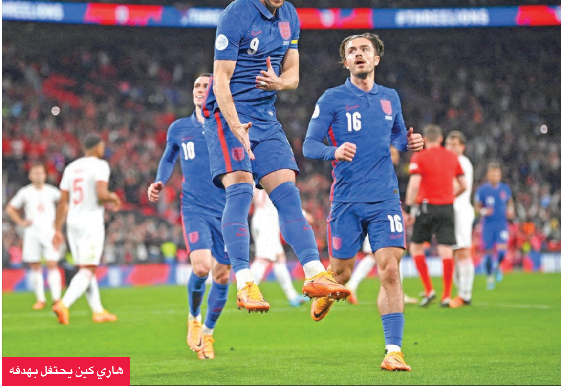
هاري كين يحتفل بهدفه

ثم تقدم الشياطين الحمر مجدداً بواسطة هانس فانانكا بكرة راسية من ركلة ركنية (58)، وأدرك ابن براون من كرة راسية أيضاً التعادل قبل نهاية المباراة بخمس دقائق.