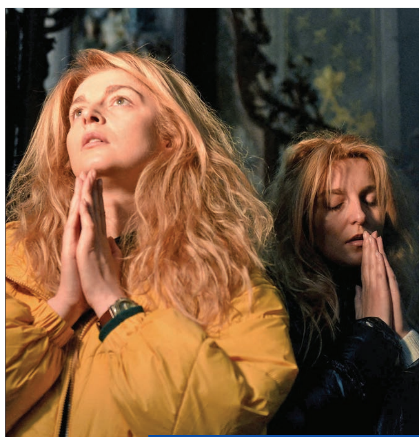
أوكرانيا داخل كنيسة كاثوليكية في ليفيف

الدخول في حرب. هذا هو الهدف، وإذا أردنا القيام بذلك، فيجب ألا نضعف لا الكلام ولا الأفعال"، لافتاً إلى أنه ستحدث مع بوتين اليوم أو غداً لتنظيم عملية إجلاء لسكان مدينة ماريوبول المحاصرة، التي شهدت مقتل أكثر من ألفي مدني.