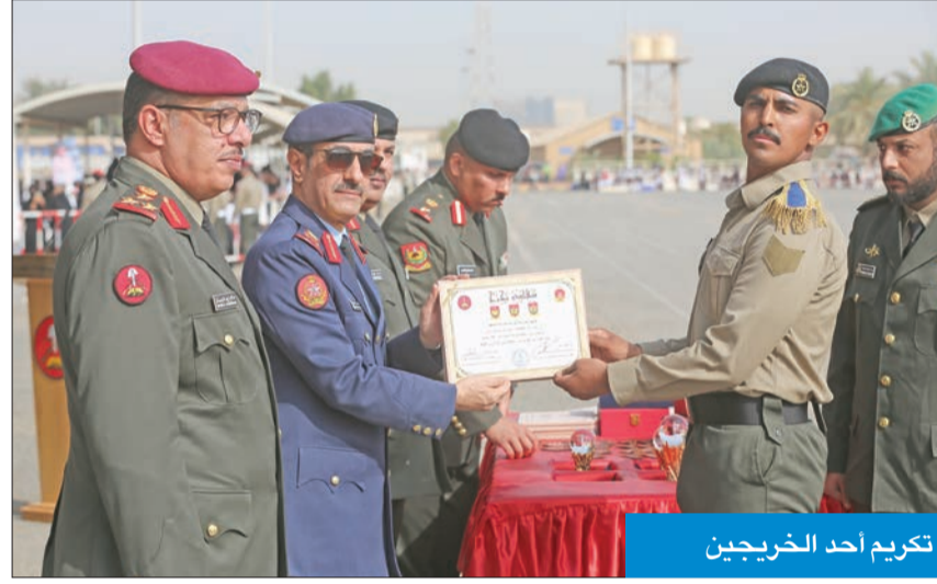
تكريم أحد الخريجين

العسكرية لتحقيق أعلى درجات الجاهزية في الدفاع عن الوطن.