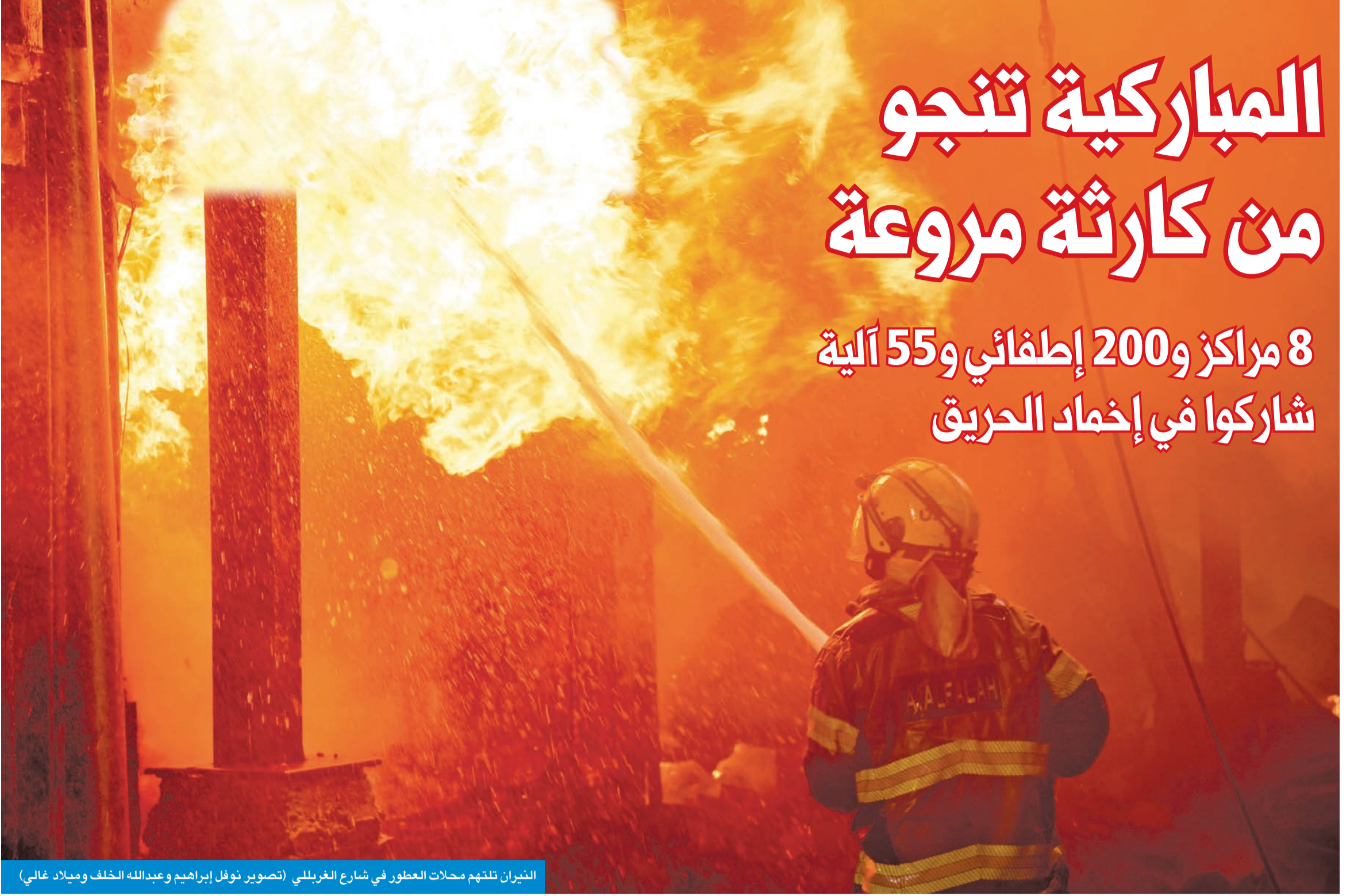
النيران تلتهم محلات العطور في شارع الغربلي

8 مراكز و200 إطفائي و55 آلية شاركوا في إخماد الحريق