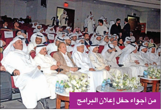
من أجواء حفل إعلان البرامج