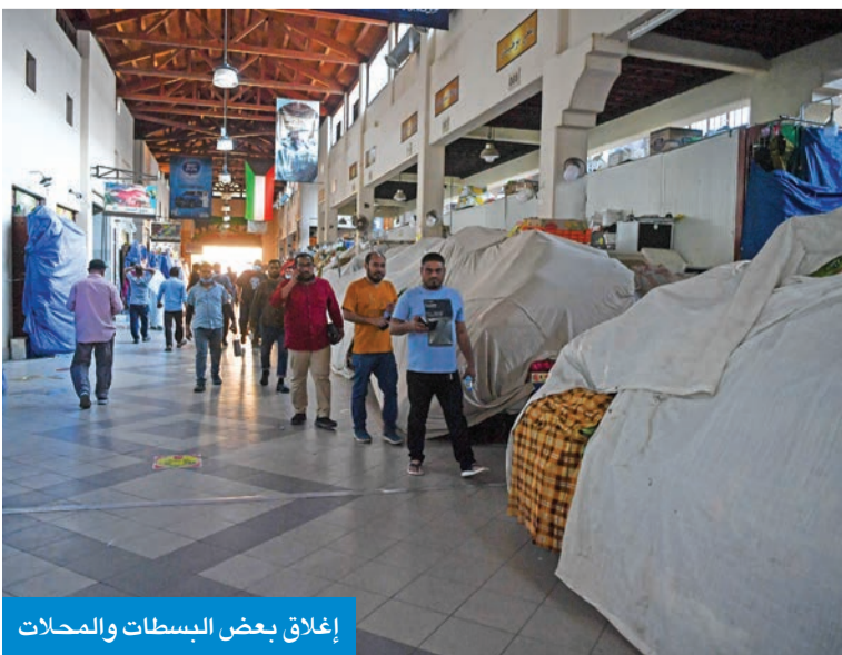
إغلاق بعض البسطات والمحلات

قال مدير إدارة العلاقات العامة والإعلام بقوة الإطفاء العام، العقيد محمد الغريب، إن غرفة عمليات قوة الإطفاء حركت مراكز إطفاء المدينة، والهلال، وحولي، ومشرف، والشهداء، والإسناد، والعارضية الحرفي، والمواد الخطرة إلى موقع الحريق بواقع 200 رجل إطفاء، و55 آلية.