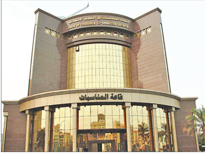
الآباء المالية على كاهل التعاونيات، وقد يضر بمراكزها المالية. إن جمعية «الجريدة»، التي تعتبر من أفضل تعاونيات الكويت من حيث نسب المبيعات والأرباح، تصل نسبة التوظيف داخلها إلى 4.5 في المئة، معتبراً أن زيادة نسبة التوظيف قد يزيد العمالة الهامشية داخل