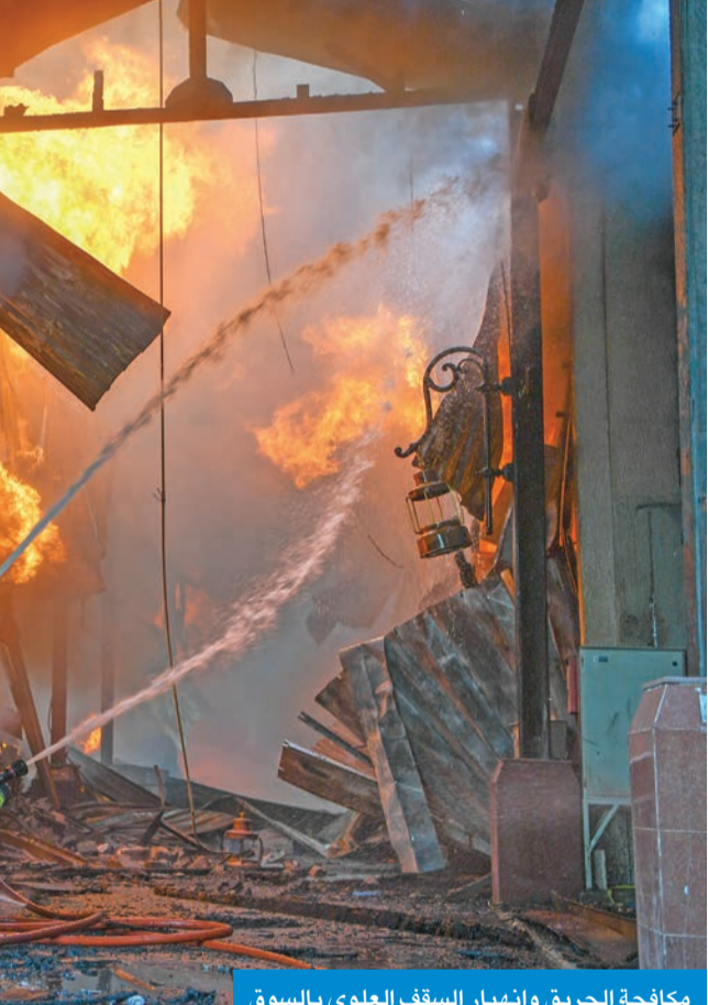
مكافحة الحريق وانهيار السقف العلوي بالسوق

الوصول إلى موقع الحريق وفرض تجمهر أصحاب المحلات والمتسوقين، والذي أعاق أعمال رجال الإطفاء في البداية. وطالب البرجس أصحاب المحلات والأهالي ومرتادي