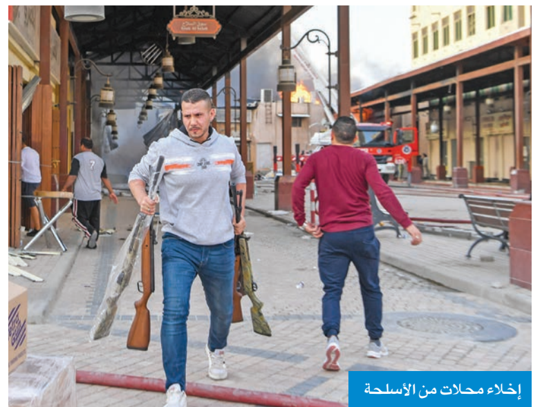
إخلاء محلات من الأسلحة