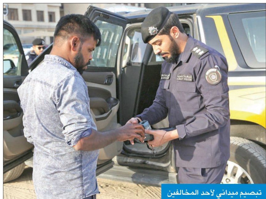
تبصيص ميداني لأحد المخالفين

ولشهر رمضان المبارك هذا العام اجتمع فريق الطهاة، حيث أعدوا كل ما لذ وطاب لمؤاد الإفطار والغبة والسحور وقوائم الطعام التي تحاكي جميع الأذواق، لاسيما أنواع الحساء والسلطات الغربية منها والشرقية، والمآرات التقليدية بكافة أشكالها، وأشهى المأكولات الساخنة والطبخ العربي الفاخر والقوزي بالمكسرات التي تتنوع على مدار أيام الشهر الفضيل، هذا وللطهي الحي محطات عديدة تأسر وأغيبها، وكما هو متعارف عليه للحوليات الرمضانية حصة كبيرة بانواعها الشرقي والغربي والمحضرة أمام روادها، ولتجربة رمضان مميزة ركن خاص بالمشروبات الرمضانية المنعشة واستراحة للنشاي والقهوة والشيشة، بالإضافة إلى أجواء الخبقة الرمضانية، والتي تقدم على أنغام الموسيقى الحية المتنوعة من مقطوعة تجعل من أمسياتكم ذكري جميلة بنكهة فاخرة.