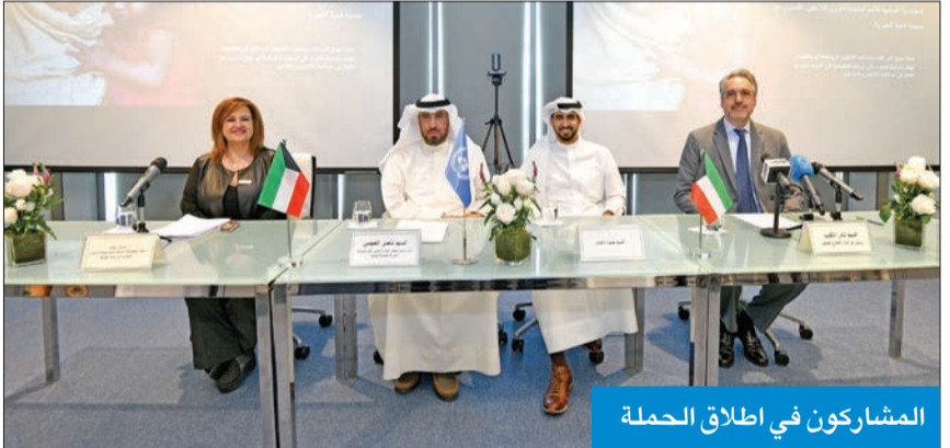
المشاركون في إطلاق الحملة