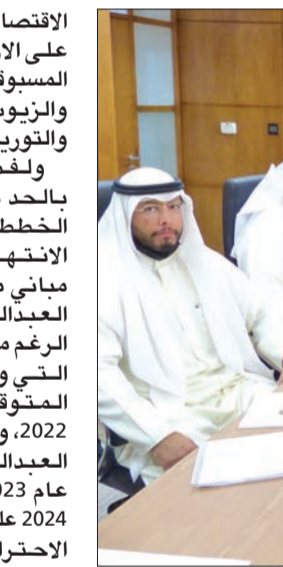
جانبا من «العمومية»

إجراءات استباقية واستدرك الزايد: «من ناحية أخرى قمنا بإجراءات استباقية للتعاقد مع المكاتب الاستشارية العالمية، لبناء صوامع جديدة بسعة تخزينية 50