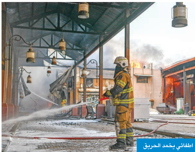
إطفائي يخمد الحريق