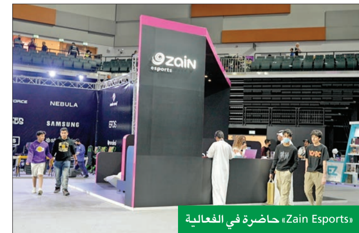
«Zain Esports» حاضرة في العالمية

وقد دخلت Zain Esports أخيراً في شراكة مع اللجنة الأولمبية الكويتية، لإدارة فعاليات البطولة المفتوحة للجنة الكويتية للألعاب الإلكترونية التي امتدت على مدار أربعة أسابيع. وتدرك «زين» أهمية دور مؤسسات القطاع الخاص في تشجيع مثل هذه المبادرات التي تدعم المشاريع المتوسطة والصغيرة بالدعم الحكومي، وتقدم محتوى ثقافياً واجتماعياً مميزاً للشباب، وخاصة كونها إحدى أكبر الشركات الوطنية الرائدة في القطاع الخاص، حيث أنت مشاركتها تؤكد اهتمامها والزامها بتطوير رياضة الأعمال في المجتمع الكويتي المليء بالشباب الشغوف بالمعدات الذي يملك أفكاراً إبداعية تهدف إلى تقديم حلول فعالية لاحتياجات السوق.