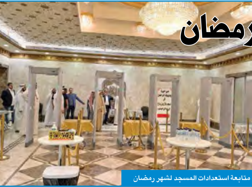
متابعة استعدادات المسجد لشهر رمضان

33.3% نسبة استخدام الأسلحة البيضاء في الاعتداء على النفس