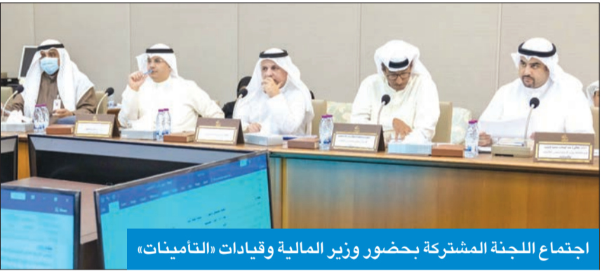
اجتماع اللجنة المشتركة بحضور وزير المالية وقيادات «التأمينات»