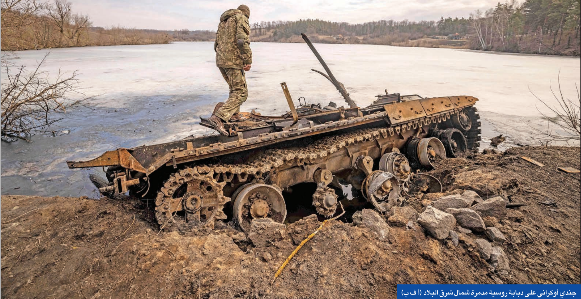
جندي أوكراني على دبابة روسية مدمرة شمال شرق البلاد

بوتين: الوقت غير مناسب لوقف النار ولقاء زيلينسكي