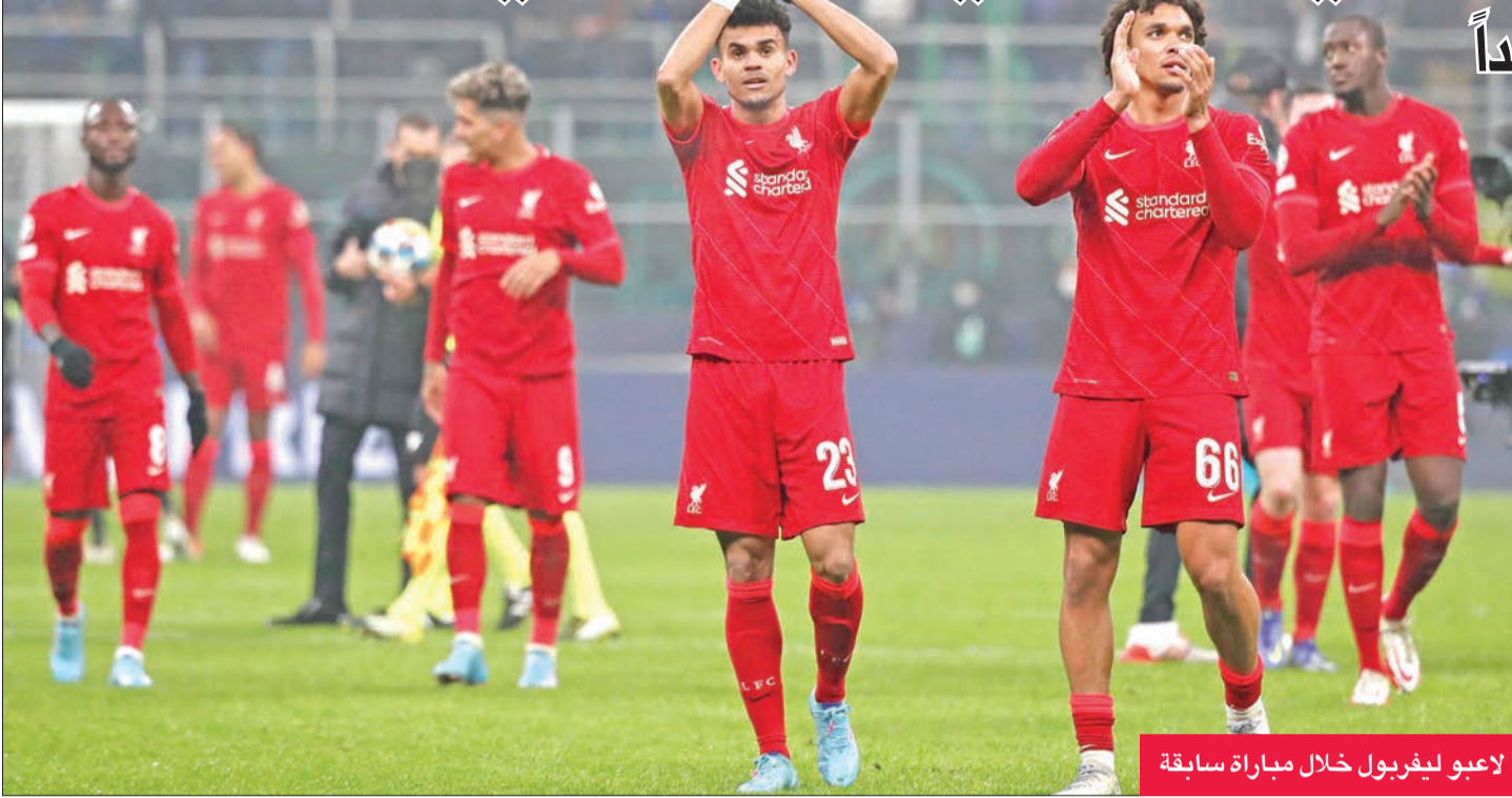
لاعبو ليفربول خلال مباراة سابقة

بعد التوقف الدولي تعود عجلة البطولات الأوروبية إلى الدوران غداً، إذ تخوض أندية دوري الإنكليزي الممتاز منافسات المرحلة الحادية والثلاثين، بينما تخوض أندية الدوري الإسباني منافسات المرحلة الثلاثين.