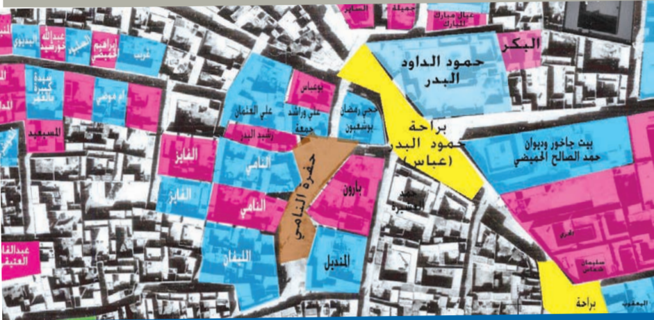
حفرة النامي (باللون البني) وحولها بعض البيوت التي استطعت التعرف عليها من خلال وصف بعض كبار السن