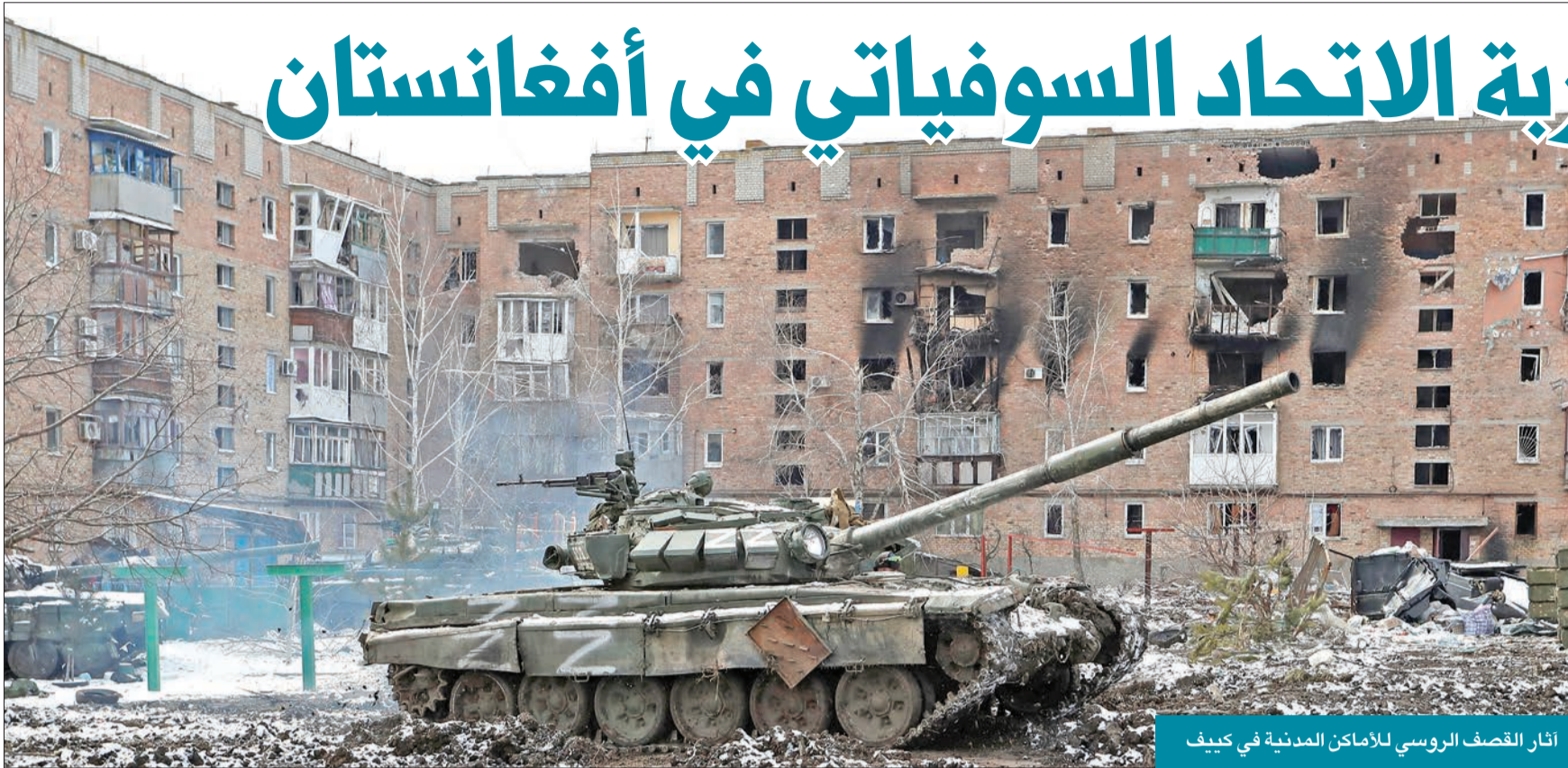
آثار القصف الروسي للأماكن المدنية في كيف