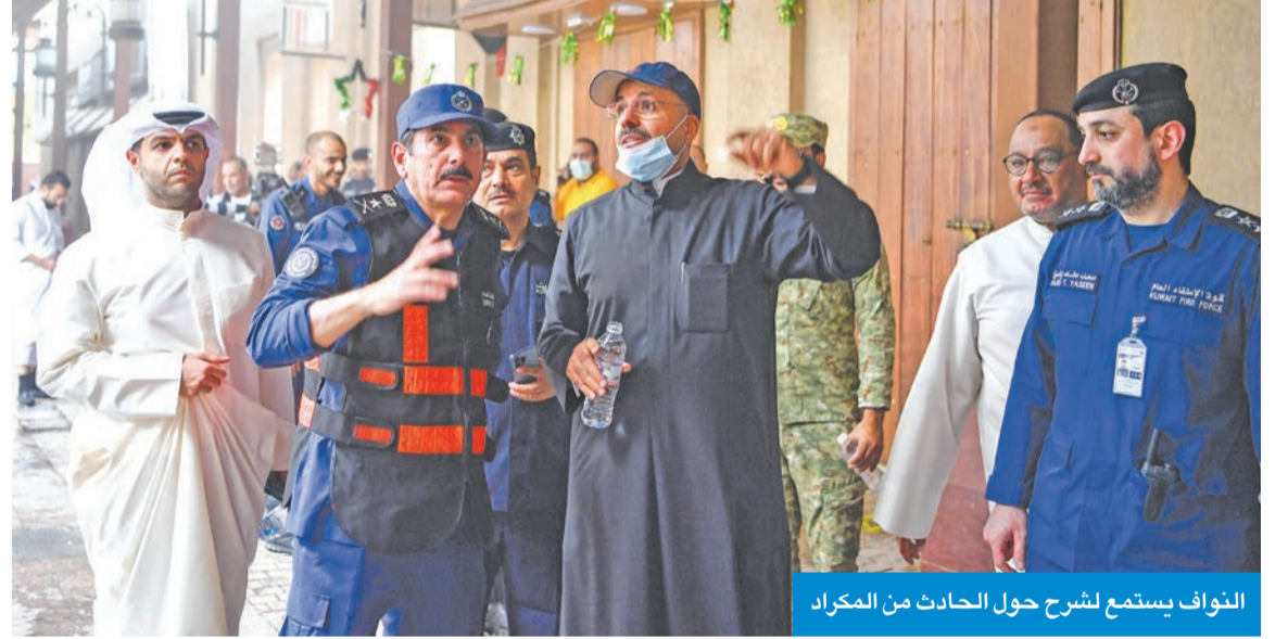
النواف يستمع لشرح حول الحادث من المكراد

وذكر أن قيادات «الإطفاء» بالموقع وضعت خطة ميدانية لمكافحة الحريق والسيطرة عليه وحصره في الموقع الذي أصابته النيران ومنع وصوله إلى الأسواق والمطاعم المجاورة، لافتاً إلى أن القيادات الإطفائية، من خلال خطة المكافحة، وزعت الفرق التي بلغ عددها 8 فرق تضمنت 200 رجل إطفاء، إضافة إلى 55 آلية، في محيط موقع الحريق من