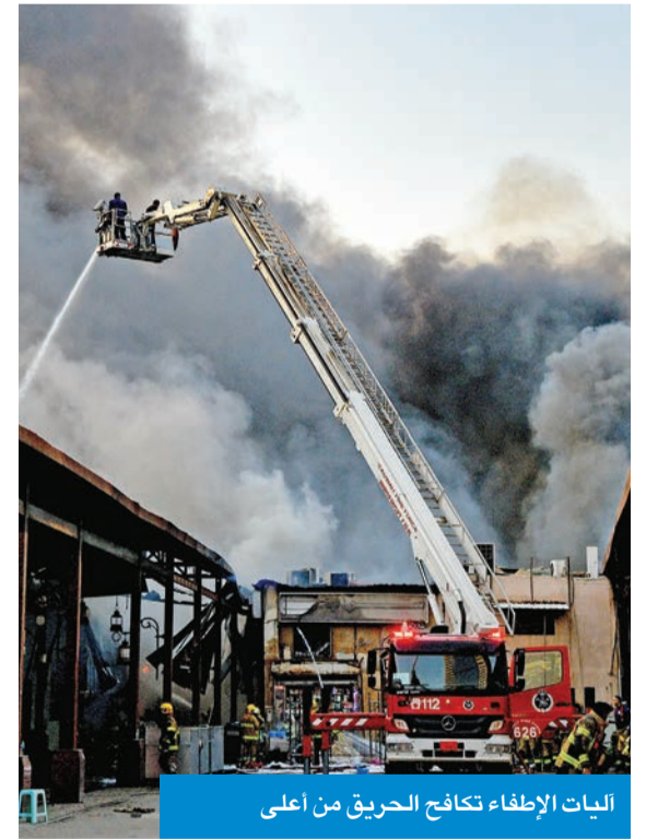
اليات الإطفاء تكافح الحريق من أعلى