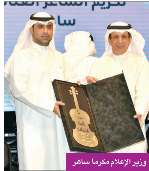
وزير الإعلام مكرما ساهر

الذي قُدّم ثلاث أغنيات، هي: مضمون، روح الله حسيك، ونهاية قصتك. بينما تميّز الفنان سلطان المفتاح بأغنيات ثلاث أيضا، هي: مر يا حلو، حال الهوى، وشالعجب مريت. أما الفنان مطرف المطرف، فقد شارك بأغنيات: لا خطا وينا، يفوق الوصف، وإذا أنت الحب. وكان مسك الختام على وقع تفاعل الجمهور مع «سفير الأغنية الخليجية» الفنان عبدالله الرويشد، الذي بدأ وصلته بكلمة عبّر فيها عن سعادته بالمشاركة في ليلة تكريم «ساهر»، ومن ثم إختار أن يشدو «يا حبك للزعل» و«اللي تساك».