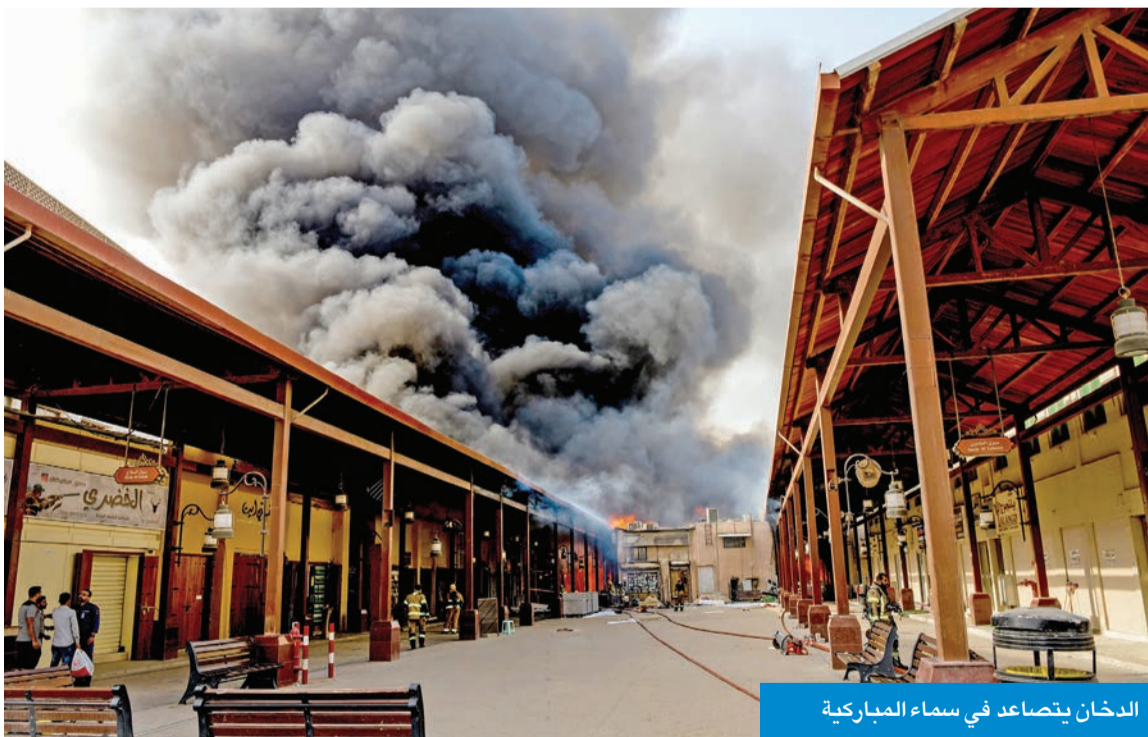
الدخان يتصاعد في سماء المباركية

اصابة 14 شخصاً منهم 3 رجال إطفاء بحالات اختناق وإجهاد حراري وتم علاجهم من نفس موقع الحادث من قبل فني الطوارئ الطبية، مشيراً إلى أن الحادث لم يسفر عن وقوع وفيات سواء بين صفوف رجال الإطفاء أو المدنيين.