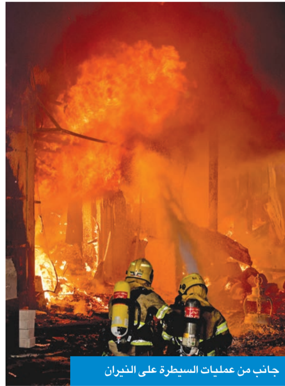
جانب من عمليات السيطرة على النيران