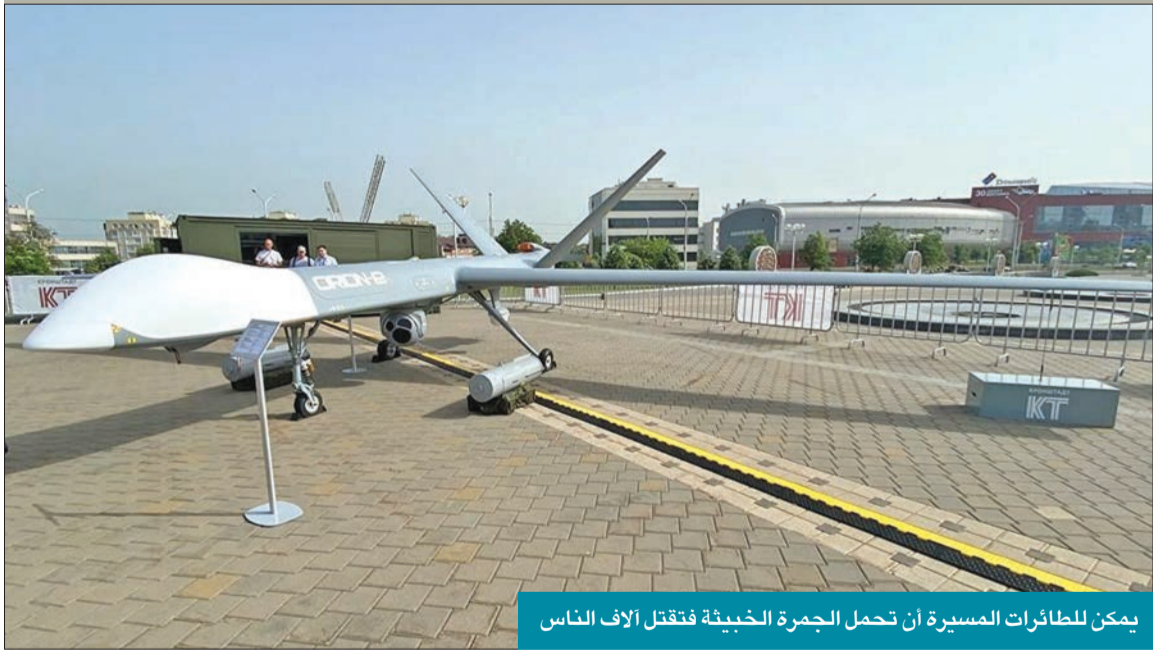
يمكن للطائرات المسيرة أن تحمل الجمرات الخبيثة فقتل آلاف الناس

● مايكل أوسترهولمومارك أولشبيكر - أتلانتيك