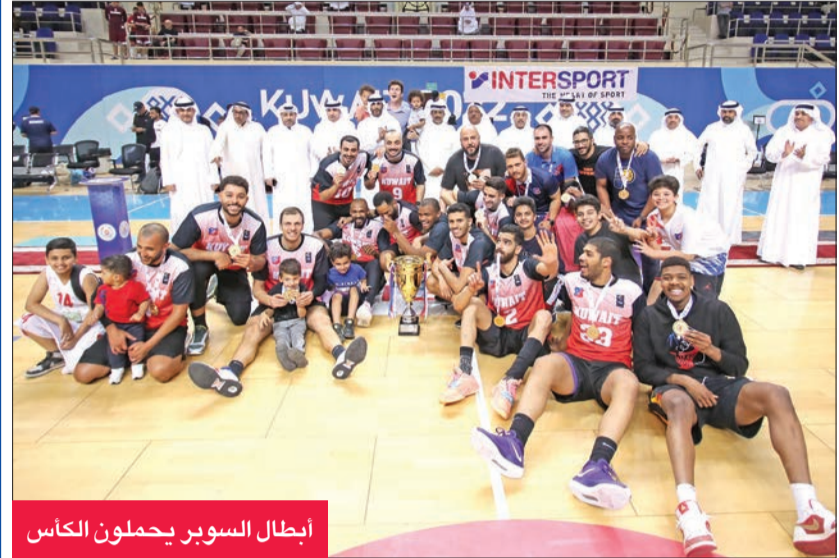
إبطال السوبر يحملون الكأس