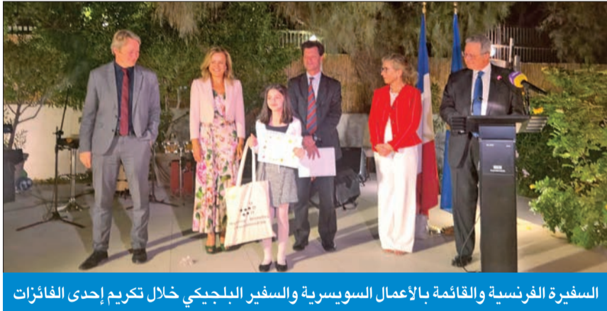
السفيرة الفرنسية والقائمة بالأعمال السويسرية والسفير البلجيكي خلال تكريم إحدى الفائزات