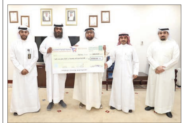
وفد «الوفرة السكنية» تسلّم زكاة مالها

في خطوة تبرز مدى اهتمام إدارة جمعية الوفرة السكنية بالجانب الإنساني والاجتماعي، وإيماناً منها بدور الزكاة؛ تلك الفريضة السامية، سلمت الجمعية باكورة زكاة أموالها، وفقاً للمعايير والأسس الشرعية، إلى بيت الزكاة، تفعيلًا لدوره في المشاركة المجتمعية والتخفيف عن كاهل الأسر الأولى بالرعاية ومشاركة من جمعية الوفرة السكنية لبيت الزكاة للقيام بدوره الإنساني والخيري.