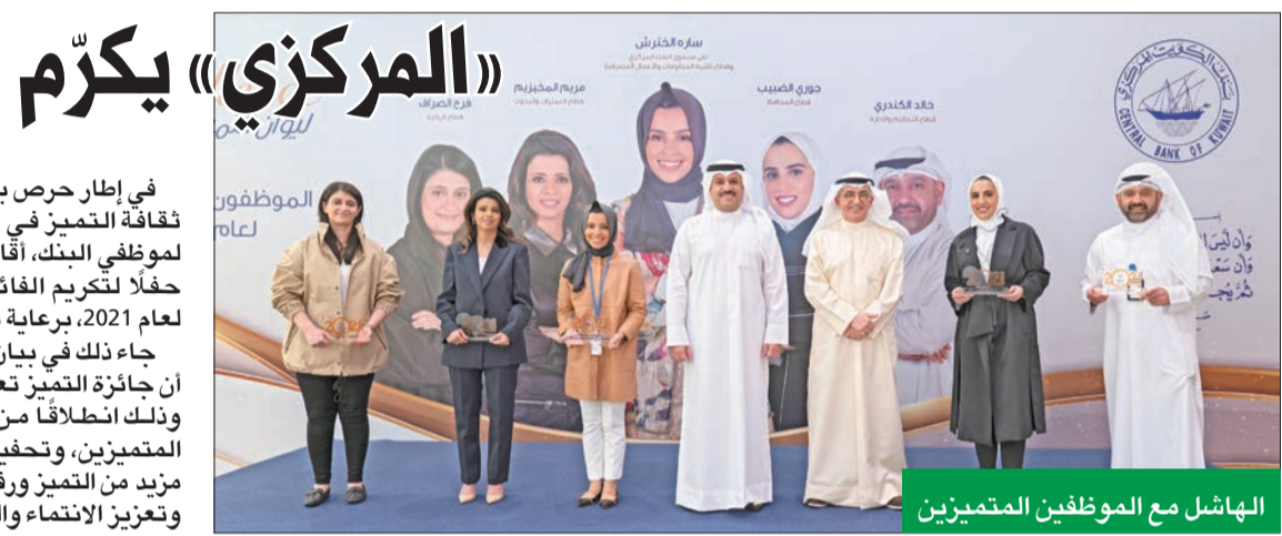
الهاشل مع الموظفين المتميزين

في إطار حرص بنك الكويت المركزي على تعزيز ثقافة التميز في البنك وتعزيز مستوى الأداء لموظفي البنك، أقام بنك الكويت المركزي، أمس، لعام 2021، برعاية محافظ البنك د. محمد الهاشل، جاء ذلك في بيان صحفي للبنك، أشار فيه إلى أن جائزة التميز تعقد للعام التاسع على التوالي، وذلك انطلاقاً من تقدير «المركزي» لموظفيه المتميزين، وتحفيز العاملين في المؤسسة على مزيد من التميز ورفع مستوى الأداء وجودة العمل، وتعزيز الانتماء والولاء الوظيفي لديهم.