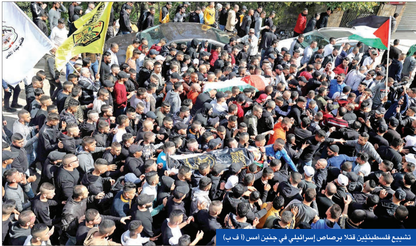
تشجيع فلسطينيين قتل برصاص إسرائيلي في جنين أمس

● محاولة طعن في حافلة قرب بيت لحم... والجيش الإسرائيلي يقتل فلسطينيين باقتحام جنين ● عباس يتهم تل أبيب بالدفع نحو انفجار... وبايدن يعرض تقديم المساعدات المناسبة