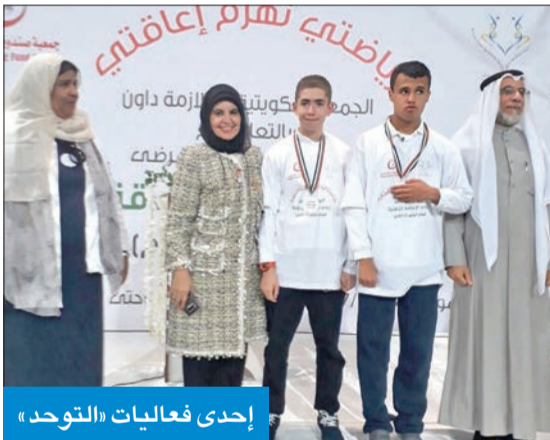
إحدى فعاليات «التوحد»

الجمعية تطلق فعاليات مميزة بمناسبة اليوم العالمي للتوحد