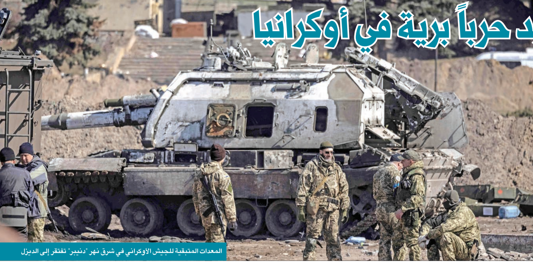
المعدات المتبقية للجيش الأوكراني في شرق نهر "دنيبر" تفترق إلى الدبزل