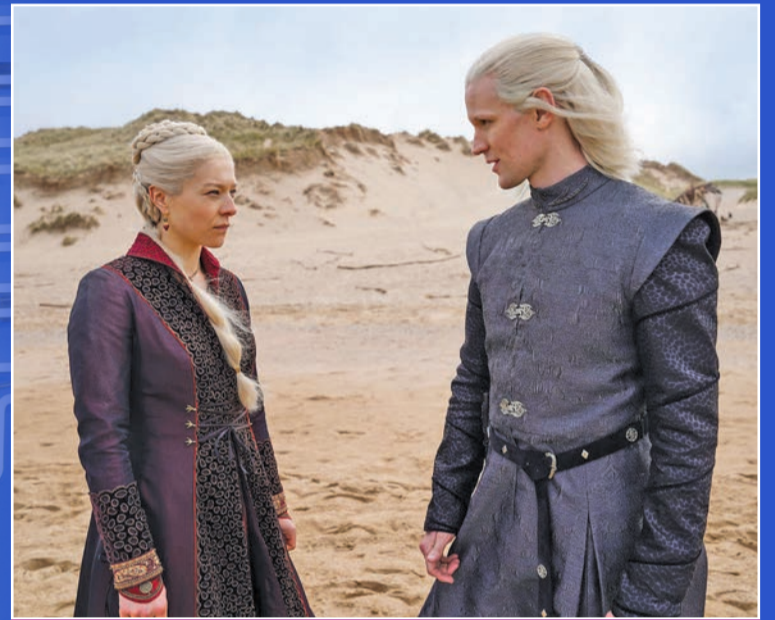
مشهد من «House of the Dragon»

مسلسل «House of the Dragon» هو ملحمة ثانية للمؤلف جورج مارتن، الذي اتخذ شهرة عالمية بعد إصدار سلسلة Game of Thrones، التي كانت من تأليفه أيضاً، والذي أعلنت شبكة «HBO» الأميركية أمس الأول، انطلاق عرضه اعتباراً من 21 أغسطس المقبل.