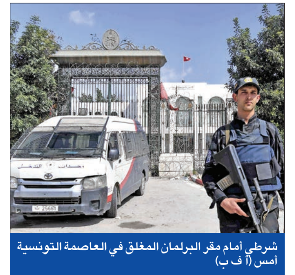
شرطي أمام مقر البرلمان المغلق في العاصمة التونسية أمس

وقال نائب رئيس المكتب السياسي لـ «النهضة»، بلقاسم حسن، إن «حل البرلمان هو مواصلة السير في نهج الانقلاب والاستبداد وضرب الشرعية». في المقابل، أعربت رئيسة «الحزب الدستوري الحر» عبير موسى، عن سعادتها بخطة سعيد. وقالت إنه «يجب أن يقترن بالدعوة إلى انتخابات