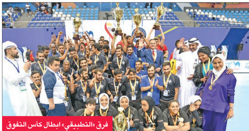
فريق «التطبيقي» أبطال كأس التفوق

وفق استراتيجية واضحة تستهدف تطوير الرياضة المدرسية، إذ أطلق هذا العام دورات عدة منها (دوري المدارس لكرة القدم) ومسابقات أخرى في ألعاب جماعية وفردية فضلاً عن دعمه النشاط الرياضي النسائي (كونا)