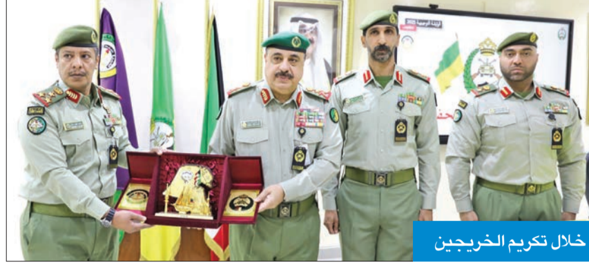
خلال تكريم الخريجين

وفي ختام الحفل كرم وكيل الحرس الوطني المتفوقين، مشيدا بحصولهم على مراكز متقدمة في الدورة.