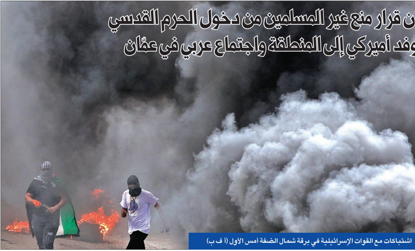
اشتباكات مع القوات الإسرائيلية في برقة شمال الضفة أمس الأول

● اقتحام جديد يسبق سريان قرار منع غير المسلمين من دخول الحرم القدسي ● حظر «مسيرة الأعلام» ووفد أميركي إلى المنطقة واجتماع عربي في عمان