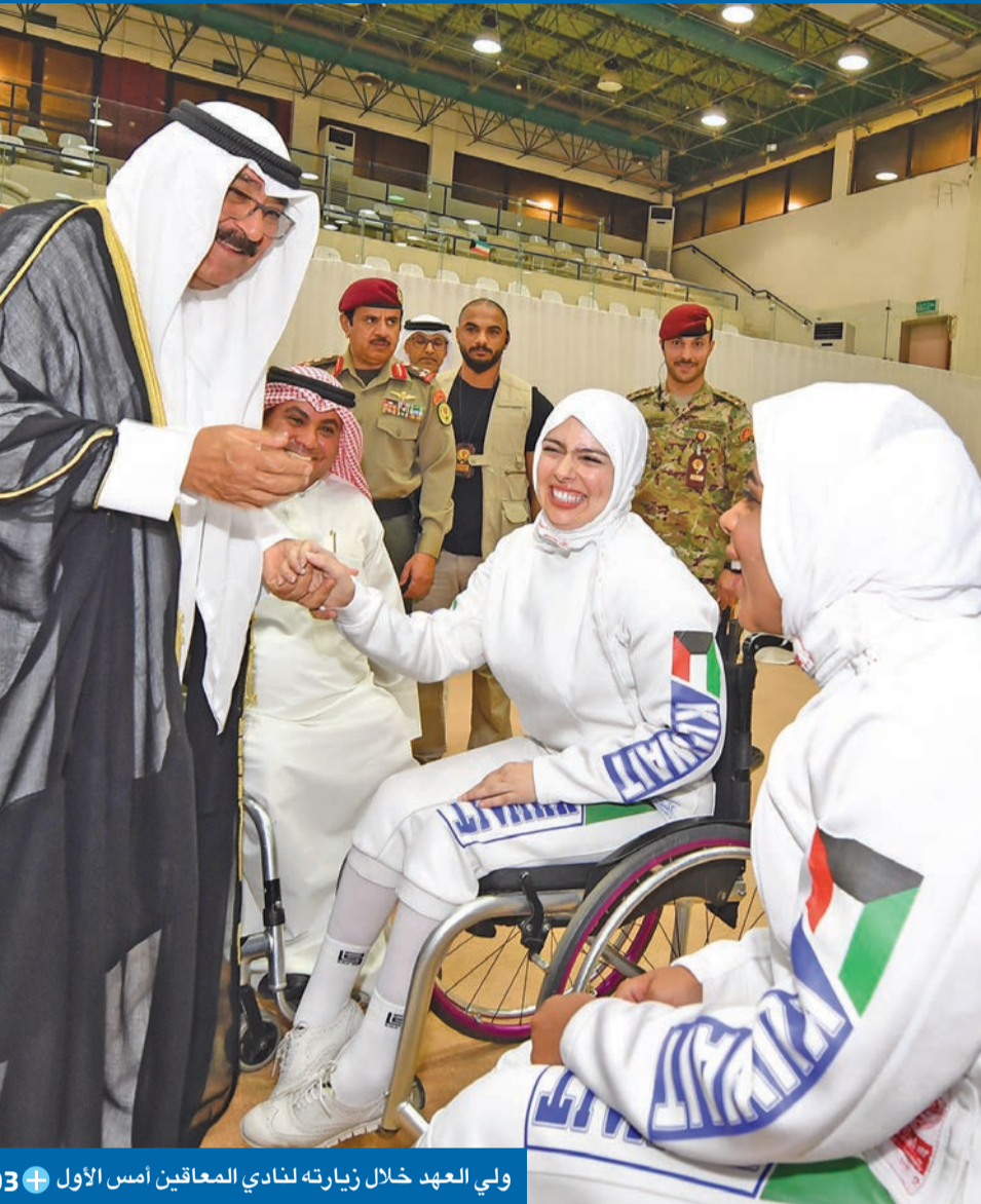
ولي العهد خلال زيارته لنادي المعاقين أمس الأول 03