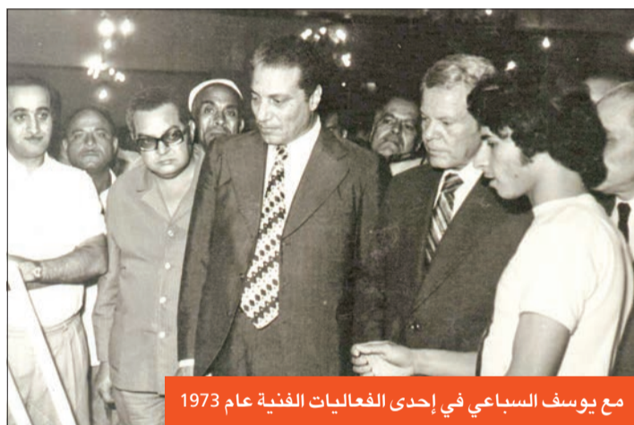
مع يوسف السباعي في إحدى الفعاليات الفنية عام 1973

إخانتون، وصلاح الدين الأيوبي، وهتلر، وشهرزاد.