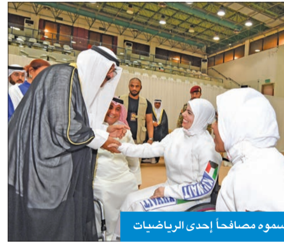
سموه مصافحاً إحدى الرياضيات

أنكم ثروة حقيقية فعالة في مسيرة نهضة الوطن وشركاء أساسيون في بنائه، مشيداً بإنجازاتكم المشهودة، داعياً الله أن يوفقكم لمواصلة مسيرة التميز وأن يوفق الجميع لخدمة وطننا العزيز في ظل القيادة الحكيمة لصاحب السمو أمير البلاد المفدى حفظه الله ورعاه وسدد على دروب الخير خطاه، وكل عام وانتم بخير وأعاد الله عليكم شهر رمضان المبارك بالخير واليمن والبركات».