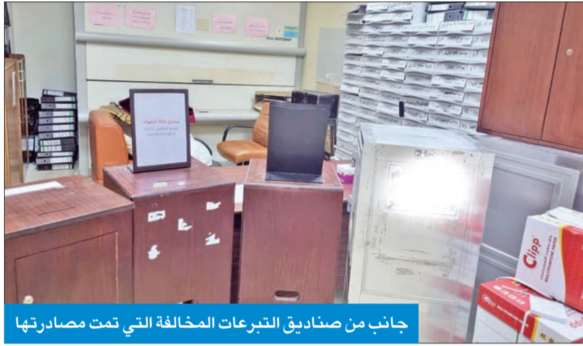
جانب من صناديق التبرعات المخالفة التي تمت مصادرتها

تأكيداً لخبر الجريدة... والتحفظ على الأموال المجموعة