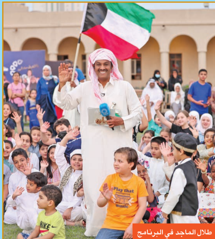
طلال الماجد في البرنامج