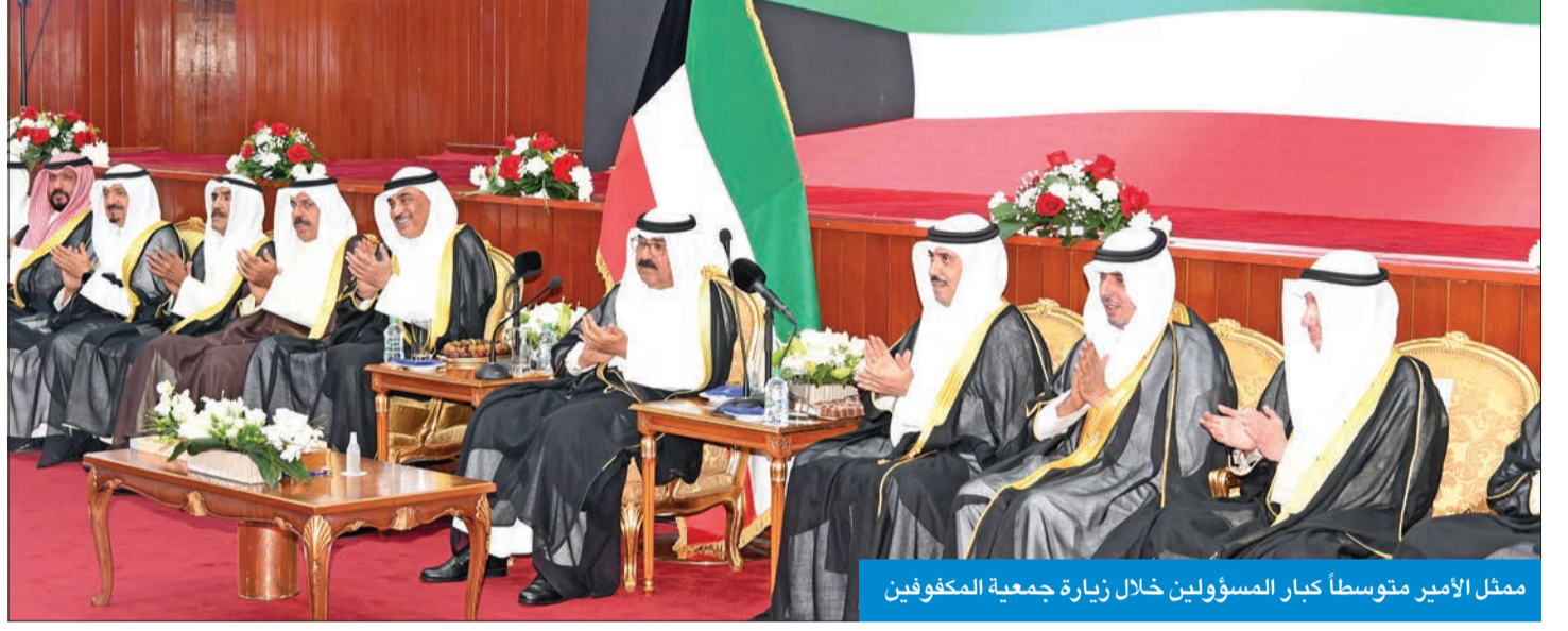
ممثل الأمير متوسلاً كبار المسؤولين خلال زيارة جمعية المكفوفين

والبركات وسموه يتمتع بموقور الصحة والعافية». وأكد العازمي أن «جمعية المكفوفين الكويتية تشرفت بلقاءك، وهذا ليس بغريب على حكماننا، فقد سعدت الجمعية، منذ تأسيسها عام 1972، بالزيارات المتتالية لأمراء الكويت، طيب الله ثراهم، ابتداء من الشيخ جابر الأحمد، مستطرداً: «ولذلك لا يسعني اليوم إلا أن نستذكر سمو الشيخ صباح الأحمد طيب الله ثراه، وجعل قبره روضة من رياض الجنة، وهو الذي وضع إنجازات عديدة لجمعية المكفوفين، فقد أنشأ المكتبة الإلكترونية، ومركز الشباب لسن تحت 18 عاماً، كما أنشأ المنشأة الرياضية للمكفوفين، التي تستغل من قبل جمعية المكفوفين، ونادي البصير الرياضي ليمارس المكفوفون شتى الألعاب الرياضية التي حرموها منها على مدى السنين».