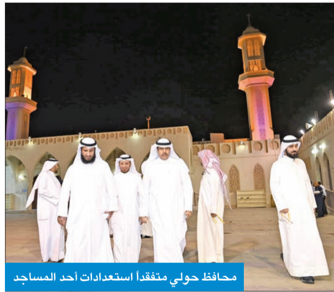
محافظ حولي متفقداً استعدادات أحد المساجد