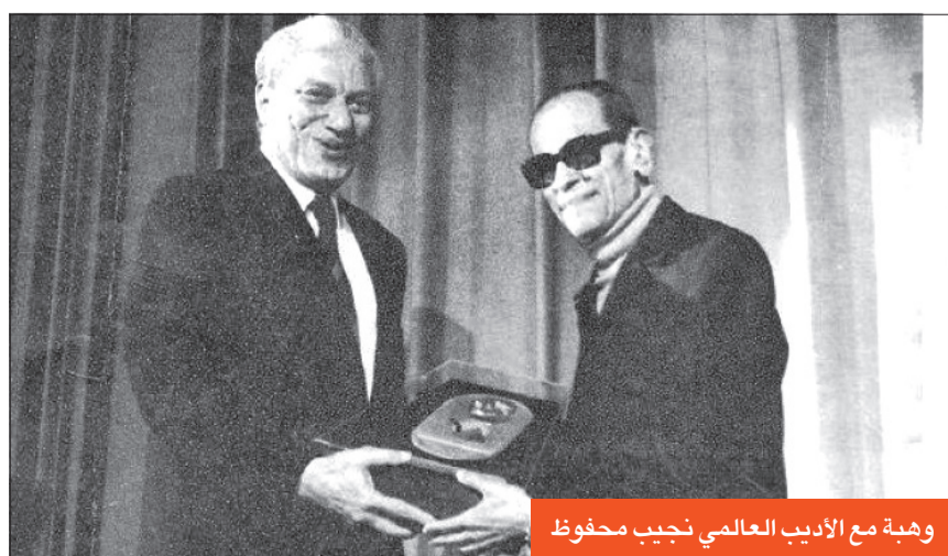
وهبة مع الأديب العالمي نجيب محفوظ

وتعد مسرحية "سكة السلامة" من أشهر أعمال وهبة، وقد عُرضت لأول مرة على خشبة المسرح القومي في عام 1065، وشارك في بطولتها كوكبة من الفنانين، منهم سميحة أيوب، وعبد المنعم إبراهيم، وتوفيق الدقن، وشفيق نور الدين، وعبد الرحمن