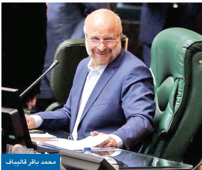
محمد باقر قاليباف

سفر ابنته إلى إسطنبول لشراء ملابس طفلها المقبل يثير الغضب