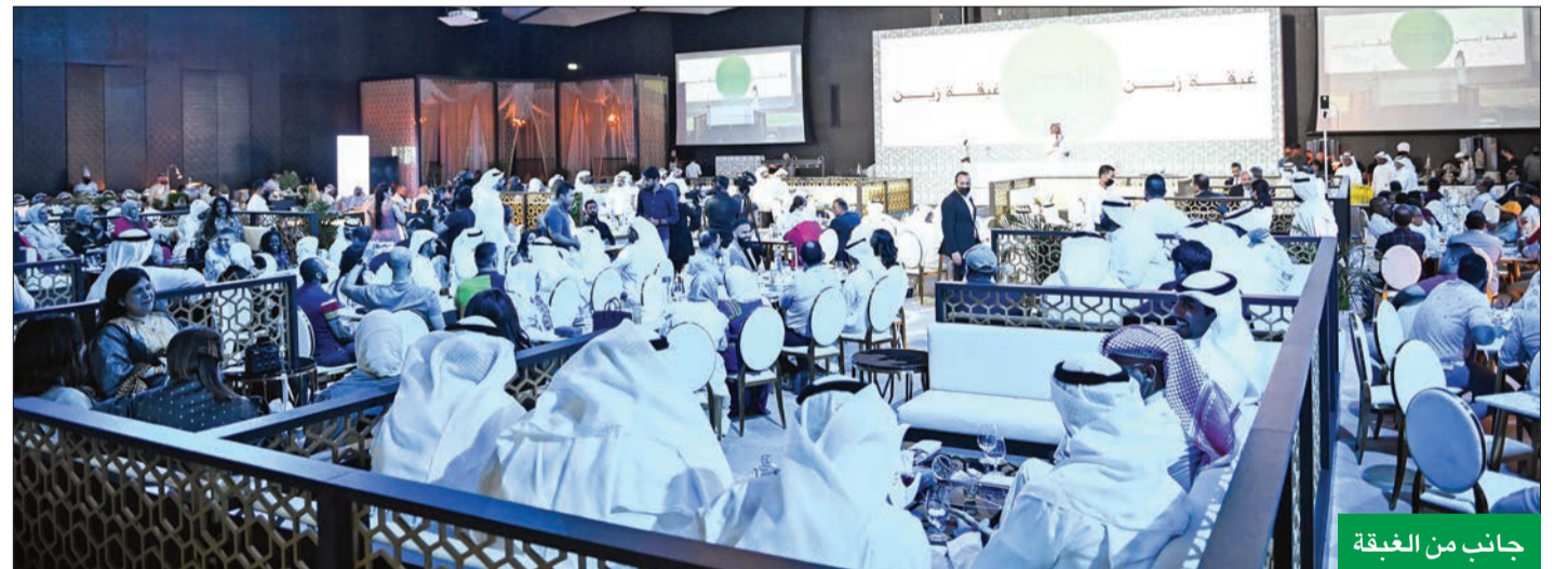
جانب من الغبقة