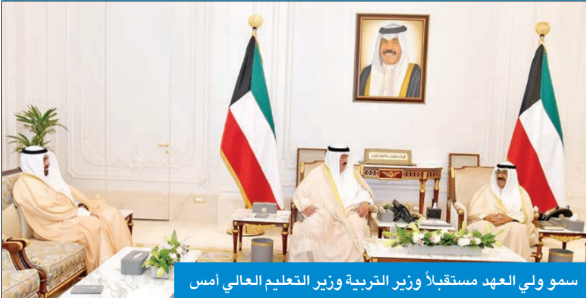
سمو ولي العهد مستقبلاً وزير التربية وزير التعليم العالي أمس

استقبل سمو ولي العهد الشيخ مشعل الأحمد، بقصر بيان صباح أمس، وزير التربية وزير التعليم العالي والبحث العلمي، د. علي المصنف، حيث قدم لسموه مدير جامعة الكويت، د. يوسف الرومي، وذلك بمناسبة تعيينه في منصبه الجديد. وقد تمنى سموه لهذه المناسبة، التوفيق والنجاح في خدمة الوطن العزيز.