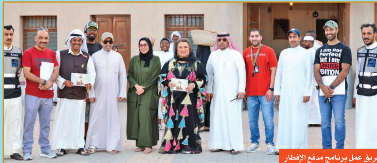
فريق عمل برنامج مدفع الإفطار