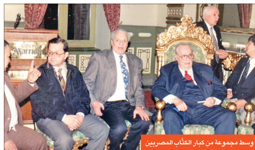
وسط مجموعة من كبار الكتاب المصريين

وتعد تلك المسرحية قفزة نوعية في مسرحيات وهبة، وتوفرت لها الحكمة الدرامية والخيال والوعي بتباين الخمل والحوارية، وفق طبيعة الشخص، وتحريكها في فضاء افتراضي (كفر الأخضر) بدلالاته الرمزية، بما يشكل واقعاً موازياً، وليس