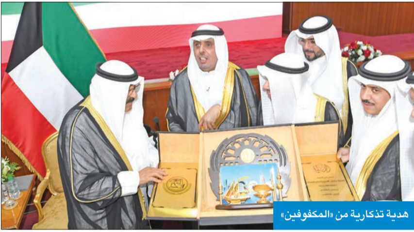
هدية تذكارية من «المكفوفين»

وتم خلال هذه الزيارة إهداء ممثل سمو الأمير هدية تذكارية بهذه المناسبة، كما تفضل سموه بالتوقيع على سجل الشرف. ورافق سمو ممثل الأمير في الزيارات النائب الأول لرئيس مجلس الوزراء وزير الداخلية الفريق أول المتقاعد الشيخ أحمد النواف، ونائب رئيس مجلس الوزراء وزير الدفاع الشيخ طلال الخالد، وكبار المسؤولين بال دولة.