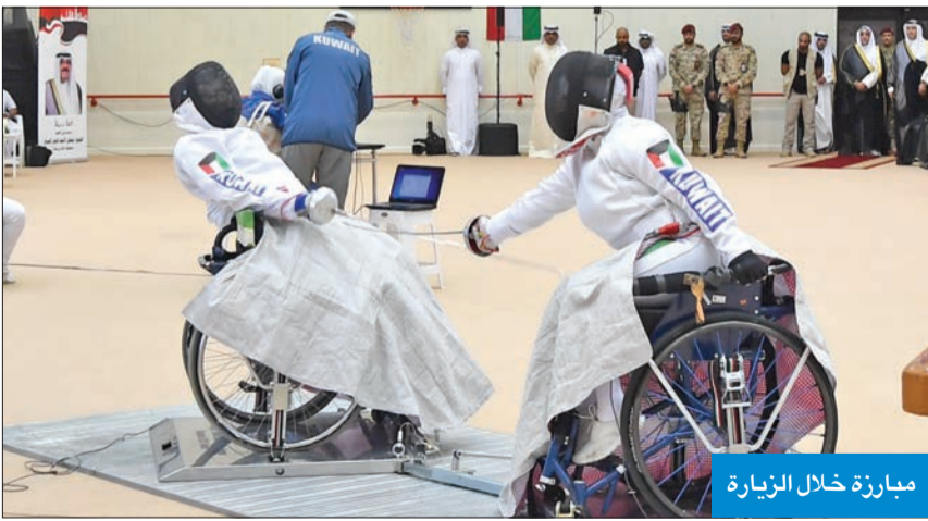
مبارزة خلال الزيارة