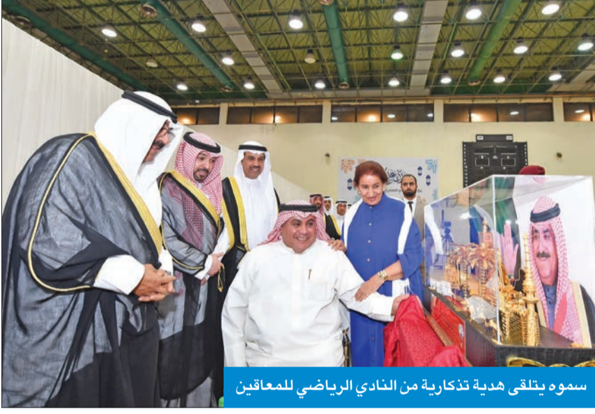
سموه يتلقى هدية تذكارية من النادي الرياضي للمعاقين