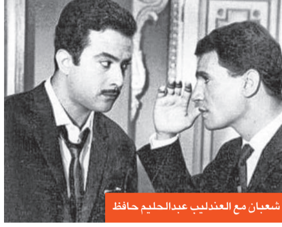
شعبان مع العنديلبي عبدالحليم حافظ

شعبان، وأشركه في بطولة مسرحية «الطريق المسدود» قصة إحسان عبدالقدوس، التي سبق تقديمها في فيلم سينمائي عام 1958، إخراج صلاح أبو سيف، وبطولة فاتن حمامة وأحمد مظهر وفردوس محمد وزوزو ماضي وتوفيق الدقن. وعرضت «الطريق المسدود» عام 1967، وجسّد يوسف شعبان دور «الكاتب أحمد» الذي قدمه في السينما الفنان أحمد مظهر، وتعد تلك المسرحية من الأعمال التي اندثرت من أرشيف التلفزيون المصري. ثم قدم شعبان مع المخرج نور الدمرداش عدة مسرحيات أهمها «شيء في صدري» للكاتب إحسان عبدالقدوس، و«أرض النفاق» للكاتب يوسف السباعي.