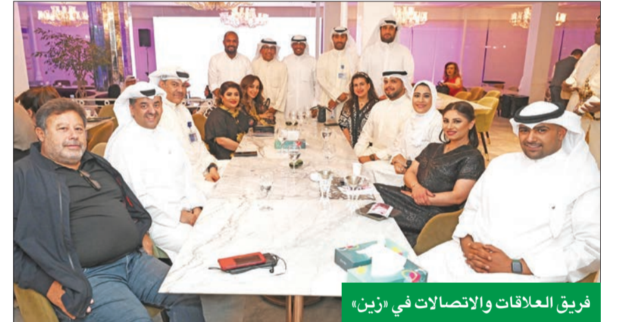
فريق العلاقات والاتصالات في «زين»