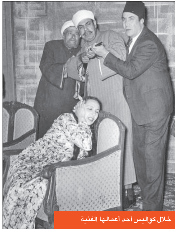
خلال كواليس أحد أعمالها الفنية