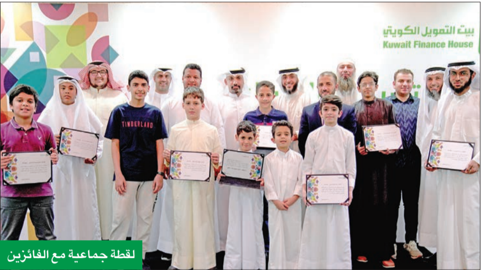
لقطة جماعية مع الفائزين

الذكور والإناث وفق الشروط والضوابط المعلنة. وتشجع المسابقة على اكتشاف المتسابقين الموهوبين، سواء في التويد أو الصوت أو الحفظ، كما تساهم في تحفيز الجيل الحالي على قراءة القرآن الكريم مع توضيح بعض أحكام التجويد، وجرى بث عدة حلقات مباشرة عبر قناة «بيتك» في «إنستغرام» (kfhgroup) لاختيار بعض المشاركين في المسابقة، كما كانت قنوات «بيتك» في التواصل الاجتماعي جاهزة للرد على أي استفسارات تتعلق بالتسجيل والمشاركة في المسابقة. وتستهدف فعاليات «بيتك» الرضائية خلال هذا العام جميع شرائح العملاء، مع التركيز على شريحة الشباب، من خلال بعض الفعاليات التي تمزج بين الجانب الرياضي والجانب الاجتماعي، كما خصص «بيتك» بعض الفعاليات لتشجيع أصحاب المشروعات الصغيرة ومعظمهم من شريحة الشباب.