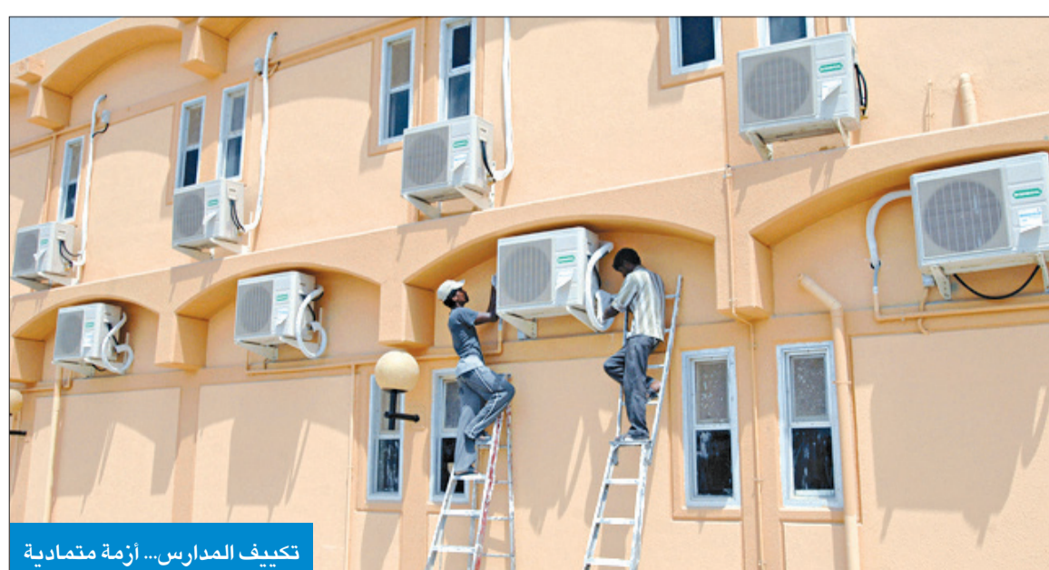
تكييف المدارس... أزمة متعادلة

عبر اقتراح قدمه المطيري وبانتظار موافقة الوزير لمعالجة أزمة الصيانة