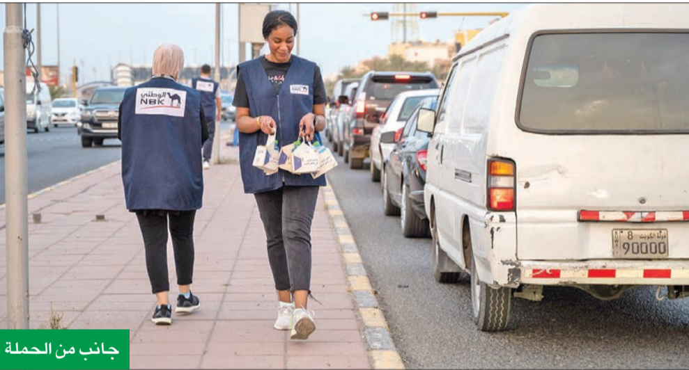
جانب من الحملة

وأعمال الرعاية الاجتماعية والأنشطة التطوعية، ويأتي البرنامج في إطار حرص البنك الوطني على التواصل مع مختلف المؤسسات الاجتماعية وفئات المجتمع كافة، محافظاً على موقعه في مقدمة مؤسسات القطاع الخاص المحلي التي كرست مبادئ المسؤولية الاجتماعية وترجمتها من خلال برامج ومبادرات تأخذ بعداً اجتماعياً حقيقياً.