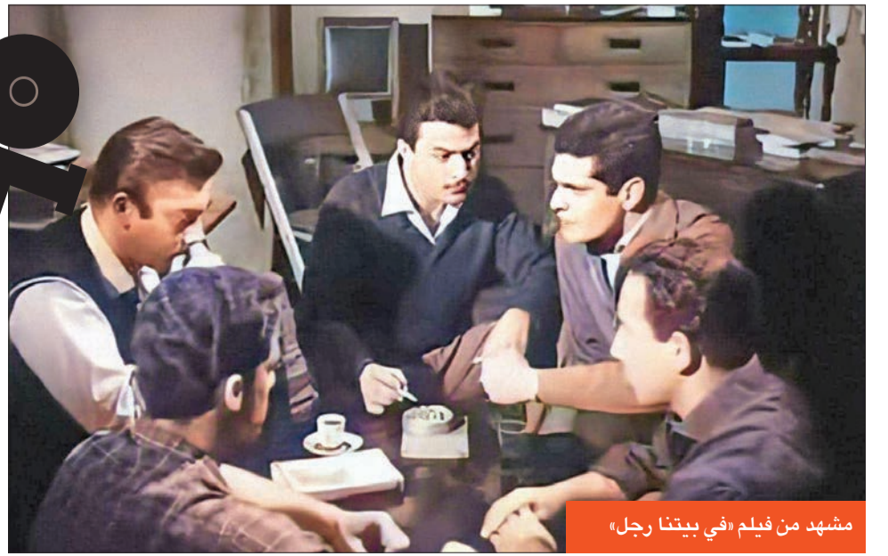
مشهد من فيلم «في بيتنا رجل»