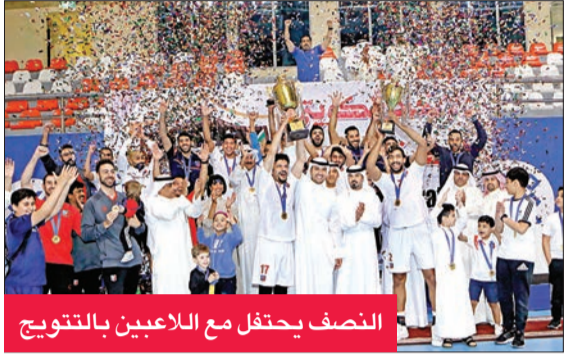
النصف يحتفل مع اللاعبين بالتتويج