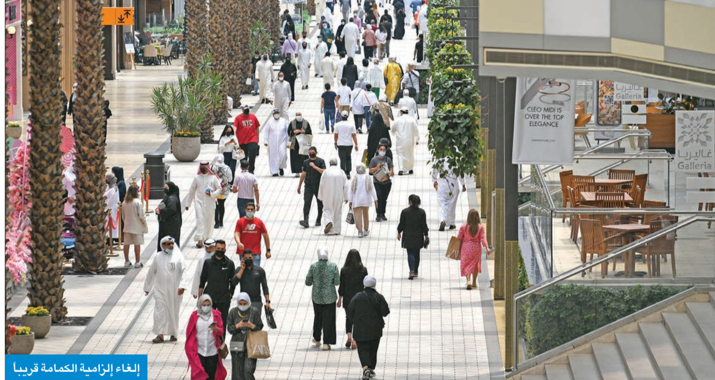
إلغاء الزامية الكمامة قريباً

«الصحّة»: استحداث قسمين لعلاج السرطان في «الجهراء» و«جابر»