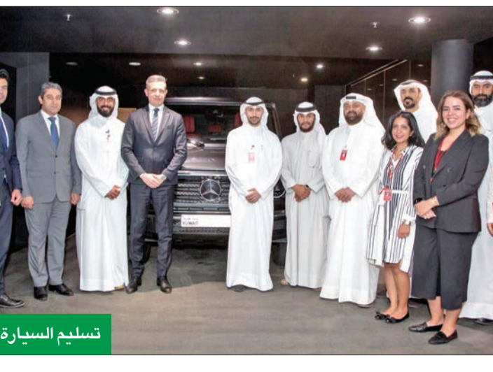
تسليم السيارة للفائزة

شاركت الإدارة التنفيذية في البنك التجاري الكويتي، بحضور رئيس الجهاز التنفيذي إلهام محفوظ ومسؤولي القطاعات المختلفة في البنك، في مأدبة الإفطار مع موظفي مركز الاتصال، تقديراً لجهودهم وتفانيهم في العمل خلال شهر رمضان، خصوصاً خلال فترة الإفطار. وقد جاءت هذه الزيارة في إطار حرص الإدارة التنفيذية على مشاركة موظفي مركز الاتصال القائمين على خدمة العملاء مأدبة إفطار، تعزيزاً لتقدير الأسرة الواحدة التي تميز «التجاري»، وتقديراً لجهود موظفي البنك وتقديم الدعم اللازم لهم، والإطلاع على سير العمل، والتأكد من تقديم خدمات مصرفية مميزة لعملاء البنك في جميع الأوقات. وفي هذا السياق، قالت محفوظ: «ندرك في (التجاري) أهمية التواصل مع عملائنا وخدمتهم على مدار الساعة، من خلال موظفي مركز الاتصال، الذين يبذلون جهداً في خدمة العملاء، ومن هذا المنطلق جاءت هذه الزيارة لموظفي مركز الاتصال ومشاركتهم مأدبة الإفطار أثناء عملهم، لتعزيز روح الأسرة الواحدة بين جميع الموظفين