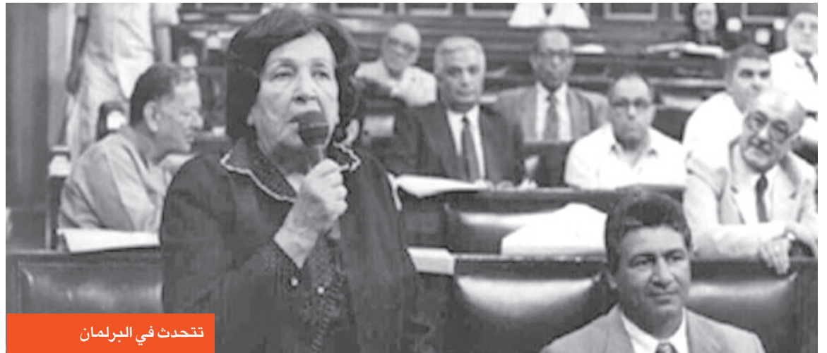
تتحدث في البرلمان