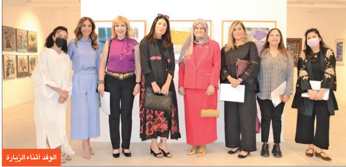
الوفد أثناء الزيارة

وسعى إلى استطلاع الأمر، يتوجه قسم من أفراد الأسرة، مع خدمهم، إلى كوت دازور في فرنسا، فيما يدور في «داونتاون أبي» في بريطانيا تصوير فيلم صامت تشرّف عليه اللدي ماري (ميشيل دوكري).