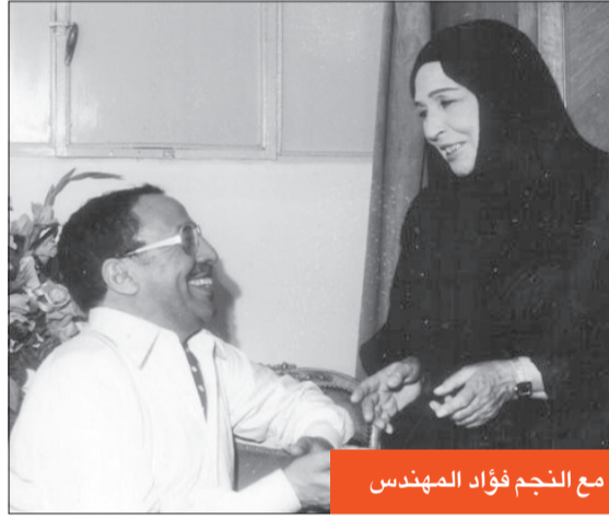
مع النجم فؤاد المهندس

وتتابعت رحلة أمينة رزق في مسرح رمسيس، وظلت البطلة الأولى للفرقة، وقدمت مع يوسف وهبي مسرحية «عاصفة على الأحداث»