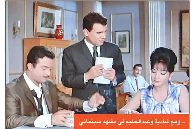
... ومع شادية وعبدالحليم في مشهد سينمائي