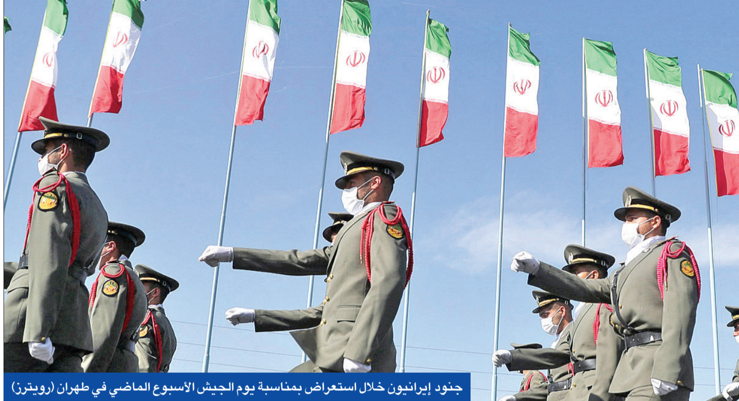
جنود إيرانيون خلال استعراض بمناسبة يوم الجيش الأسبوع الماضي في طهران

حيث غادر جميع العناصر الروس المطار عبر طوافة عسكرية، قبل أن تقوم القوات الروسية بسحب مروحياتها من المطار أيضا، لأسباب غير معلومة. وبحسب المصادر، فإن المروحيات الروسية والقوات التي غادرت مطار تدمر اتجهت إلى مطار التفيرور بريف تدمر وبذلك يصبح مطار تدمر العسكري خاضعا لسيطرة «حزب الله» اللبناني ولواء فاطميون، الذي يضم عددا كبيرا من المقاتلين الأفغان الشيعية المواليين لإيران، إضافة إلى وجود بعض عناصر وضباط النظام داخل المطار. كما أعلن المرصد أن فاطميون، طرد تشكيلات الدفاع الوطني السوري الموالي للحكومة السورية من منطقة البوكمال.