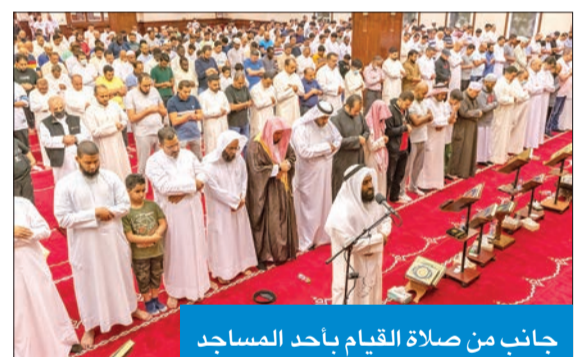
جانب من صلاة القيام بأحد المساجد

ويضيف رص الصفوف هذا العام أجواء روحانية أكثر من العامين الماضيين، ونعمة يتسابق المصلون إلى اغتنامها شكرياً لله تعالى على نعمة الأمن والطمأنينة وعلى انحسار جائحة كورونا.