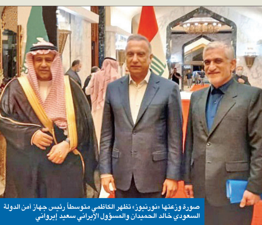
صورة وزعتها «نورنيوز»، تظهر الكاظمي متوسلاً رئيس جهاز أمن الدولة السعودي خالد الحميدان والمسؤول الإيراني سعيد إيرواني