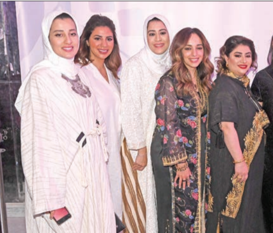
جانب من الغبقة

استضافت شركة زين غبقة رمضان خاصة على شرف مُنتسبي وسائل الإعلام والصحافة الكويتية ضمن حملتها الرمضانية «زين الشهر» تقديراً لدورهم البارز وجهودهم الكبيرة في خدمة قطاعي الإعلام والثقافة بالبلاد. وذكرت الشركة، في بيان، أن الغبقة أنت احتفاءً بالدور الكبير الذي تلعبه وسائل الإعلام المقروءة والمرئية والسموعة في رفعة وازدهار الوطن، وذلك يأتي انطلاقاً من إيمانها الشديد بأهمية دور الإعلام وأثر الرسالة الإعلامية في توعية المجتمعات، وخاصة خلال جائحة كورونا على مدار العامين الماضيين. وشهدت الغبقة حضور عدد كبير من ممثلي وسائل الإعلام المحلية والإقليمية، من رؤساء تحرير الصحف ومسؤولي الصحافة ومحطات التلفزيون والقنوات الإذاعية والمنصات الإخبارية الإلكترونية والشخصيات الإعلامية وطواقم التصوير، بالإضافة إلى ممثلي وزارة