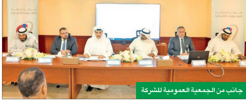
جانب من الجمعية العمومية للشركة

«عمومية» الشركة تقر توزيع أرباح نقدية بنسبة 15%