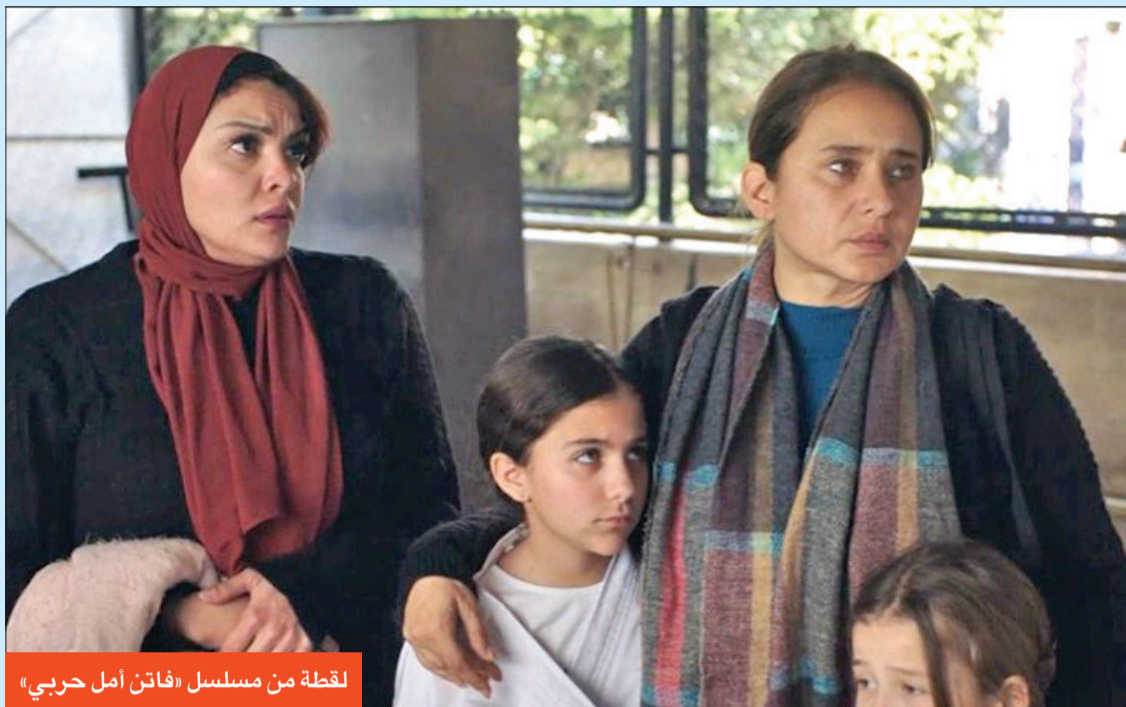
لقطة من مسلسل «فاتن أمل حربي»

وضع اسمها في نهاية الشارة يتناسب مع تاريخها ومكانتها الفنية