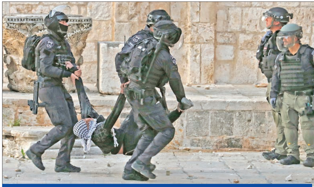
الشرطة الإسرائيلية تعتقل فلسطينياً مصاباً في المسجد الأقصى أمس الأول

وتكشف المصادر، أن ما تحقق في هذا الاجتماع كان فائق الأهمية، وهناك تقدم بارز يتم إحرازه، على أن تُرفع التقارير