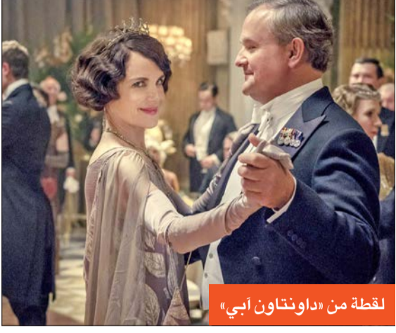
لقطة من «داونتاون أبي»

بعد 3 سنوات من فيلم داونتاون أبي (Downton Abbey)، تعود إلى السينما في جزء ثانٍ منه شخصيات الأرسقراطيين البريطانيين الذين يتناولهم هذا العمل المستمد من مسلسل تلفزيوني بريطاني حقق نجاحاً عالمياً واسعاً بين 2010 و2015. وقالت لورا كارمايكل، التي تؤدي دور اللدي إديث كراولي، في حديث لوكالة فرانس برس، خلال وجودها في باريس مع إليزابيث ماكغوفرن (اللدي غرانثام)، والمخرج سايمون كورتيس، للترويج للفيلم: "في كل مرة، نعتقد أن الأمر انتهى، ولكن يتبين أن الأمر غير صحيح، فهذا نحن مجدداً".