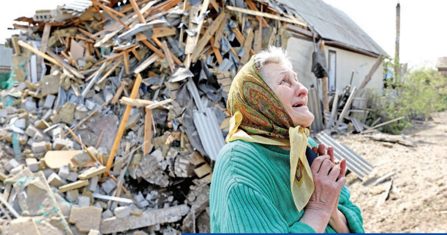
عجوز أوكرانية تبكي قرب منزلها المدمر في منطقة ليومان بدونيتسك

أكدت واشنطن أن أكثر من 20 دولة من أصدقاء أوكرانيا ستشارك في مؤتمر مقره في ألمانيا، في وقت أبدت مولدوفا تخوفها من تعرضها لغزو روسي، وذلك بعد تحذير الرئيس الأوكراني فولوديمير زيلينسكي من أن غزو بلاده مجرد بداية، وأن موسكو لديها خطط للاستيلاء على دول أخرى.