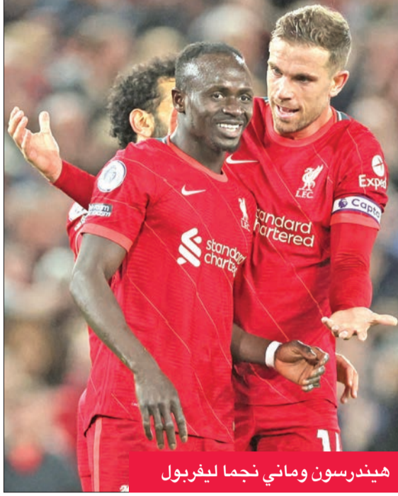
هيندرسون وماني نجما ليفربول