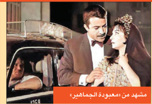
مشهد من «معبودة الجماهير»

تعرض الفنان يوسف شعبان للعديد من المواقف الصعبة في بداية مشواره الفني، ومنها خلاف كبير حدث قبل بدء تصوير فيلم «معبودة الجماهير» 1967، قصة الكاتب مصطفى أمين، حين أسند إليه المخرج حلمي رفلة دوراً بارزاً في هذا الشريط السينمائي، ليقف أمام المطرب عبدالحليم حافظ والفنانة شادية وفؤاد المهندس وحسن فايق ومحمد رضا وزينات صدقي.