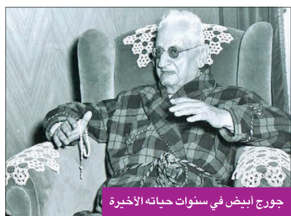
جورج أبيض في سنوات حياته الأخيرة

عندما قدّم جورج أبيض مسرحية «أوديب ملكاً» حدث في ليلة الافتتاح موقف طريف مع الممثل المغموّر آنذاك عبدالفتاح القصري، وحين قال أبيض «صه يابن الجحيم» رد القصري بقوله المميز «واحسرتاااه أنا تقول لي صه»، فانفجر الجمهور ضحكاً، وغضب أبيض، وأمر بإغلاق الستار، وانفعل على القصري وصفعه على وجهه في الكواليس. وسمع نجيب الريحاني بأن فناناً مغموّراً