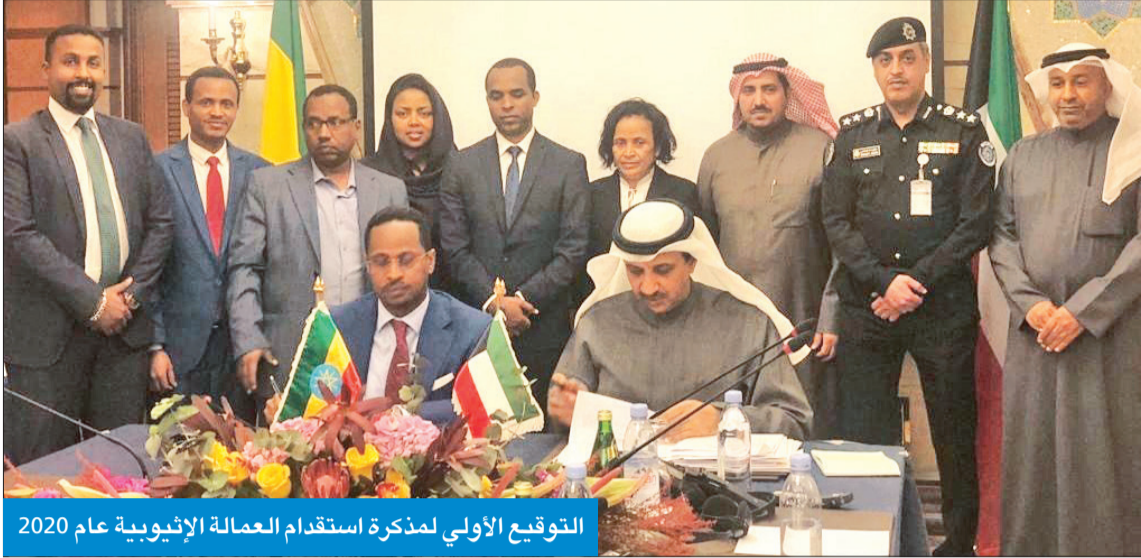
التوقيع الأولي لمذكرة استخدام العمالة الإثيوبية عام 2020

الشمري لـ الجريدة: خطوة لسد النقص الذي يعانيه السوق حالياً