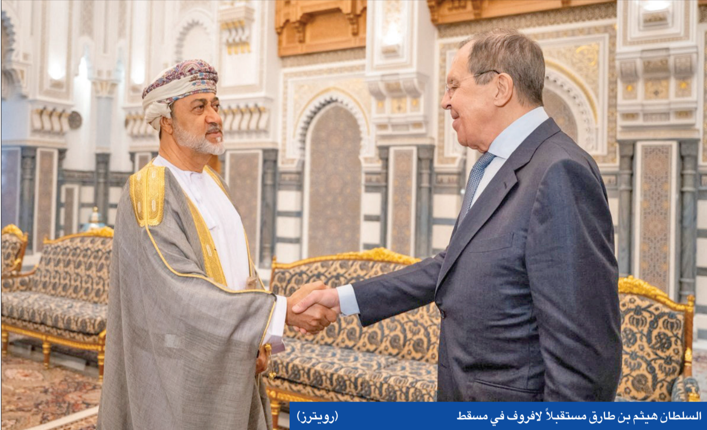
السلطان هيثم بن طارق مستقبلاً للافروف في مسقط

توقف تدفق الغاز الروسي إلى أوروبا عبر نقطة عبور رئيسية في أوكرانيا. وأندحت شركة تشغيل خطوط أنابيب الغاز الأوكرانية باللوم على وجود قوات الاحتلال التي تمنع حسن سير عمل البنية التحتية.