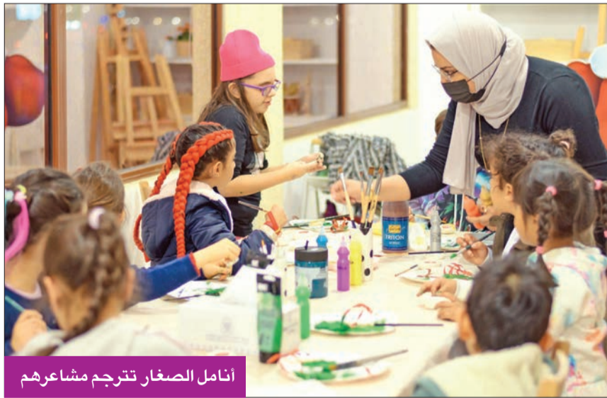
أنامل الصغار تترجم مشاعرهم

مجلس إدارة أكاديمية «كيدز آرت»، فلفتت إلى أنه «التعاون الأول من نوعه مع أكاديمية بمنطقة الشرق الأوسط، وهو تعاون مهم لتعزيز وإغناء خبراتنا، كما تنمية المهارات وتمكين الأجيال الصاعدة، كلانا يعيش التعامل مع الأطفال، ونحن معجبون بتوجهات (لابا) وتركيزها على تعليمهم تقنيات الفنون المختلفة، مشيرة إلى أن «الفن فلك العلوم بأكملها، فمن خلاله يمكن نقل المعرفة للأجيال على تفرغهم، وفق قول الفنان ليوناردو دافنشي منذ 500 عام، وهو ما زال صحيحاً للغاية تاريخياً».