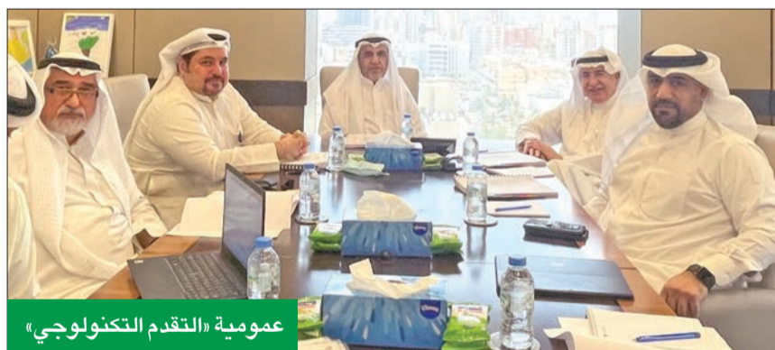
عمومية «التقدم التكنولوجي»

«عمومية» الشركة وافقت على توزيع 15 فلساً للسهم أرباحاً نقدية