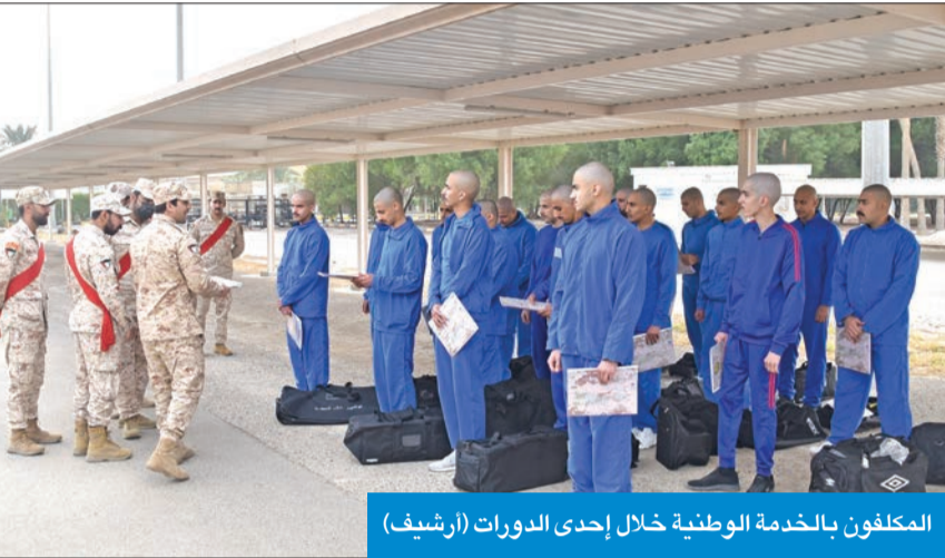
المكلفون بالخدمة الوطنية خلال إحدى الدورات (أرشيف)

تنسيق مع «الداخلية» لمنع «الليسن» إلا ب «إفادة الخدمة»... وإلحاق فوري لمن يتم ضبطه