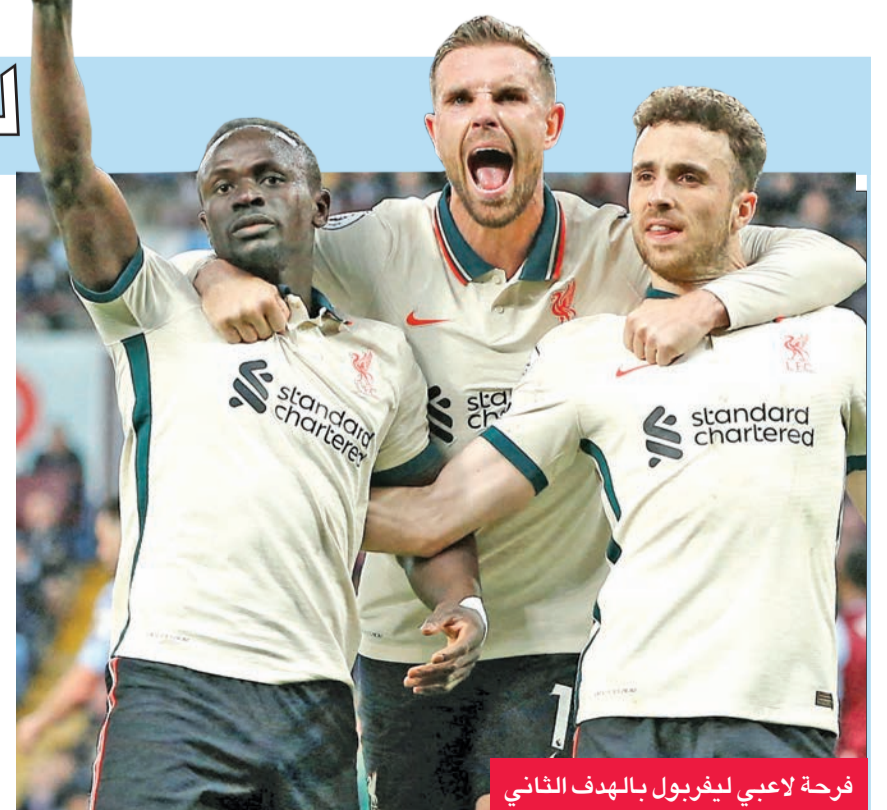
فرحة لاعبي ليفربول بالهدف الثاني

وابرز من أبقاهم كلوب على مقاعد البدلاء المصري محمد صلاح، هداف الدوري برصيد 22 هدفاً، ولاعب الوسط الإسباني تياغو الكانتارا، ربما لإزاحتها قبل المباراة النهائية لمسابقة كأس إنكلترا السبت المقبل ضد