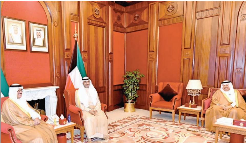
العبدالله خلال تسلمه رسالة خادم الحرمين لصاحب السمو من السفير السعودي

الملك سلمان: المزيد من الرقي والازدهار للكويت في ظل القيادة الحكيمة لصاحب السمو