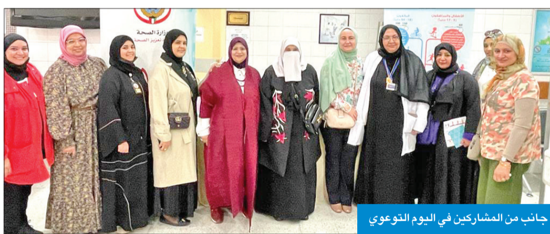
جانب من المشاركين في اليوم التوعوي

البدني في الكويت بنسبة 10 بالمئة بحلول عام 2026. وأضافت أن معدل الانتشار العام للتدخين في الكويت بلغ 20.5 بالمئة، لافتة إلى أن نسبة التدخين بين الرجال بلغت 39.2 بالمئة، مقابل 3.3 بالمئة بين النساء.