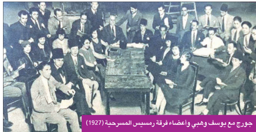
جورج مع يوسف وهبي وأعضاء فرقة رمسيس المسرحية (1927)

واشتهرت الفرقة بالقيادة، وجورج أبيض والفرق الأخرى، وأبرزها «فرقة سلامة حجازي، والندمجت الفرقتان بعد الأزمة الاقتصادية العالمية أثناء نشوب الحرب العالمية الأولى عام 1914، ولكن «جوق أبيض وحجازي» انفصلا لاختلاف وجهات النظر في أمور فنية، والنزاع على الأفراد بالقرار، وانفضت الشراكة بينهما في غضون شهرين قليلة. وكان من الصعب استمرار هذا الاندماج، لفرقتين لهما توجهات مختلفة، فرقة جورج أبيض تخصصت في الأعمال التراجيدية، بينما اهتم سلامة حجازي بالأوبريت الغنائي، وبدأت الدعاية بالمصطلحات عن مولد «جوق أبيض وحجازي» وظهر الخلاف أثناء التحضير لعرضهما المسرحي الأول، واتجه كلاهما إلى تكوين فرقة جديدة.