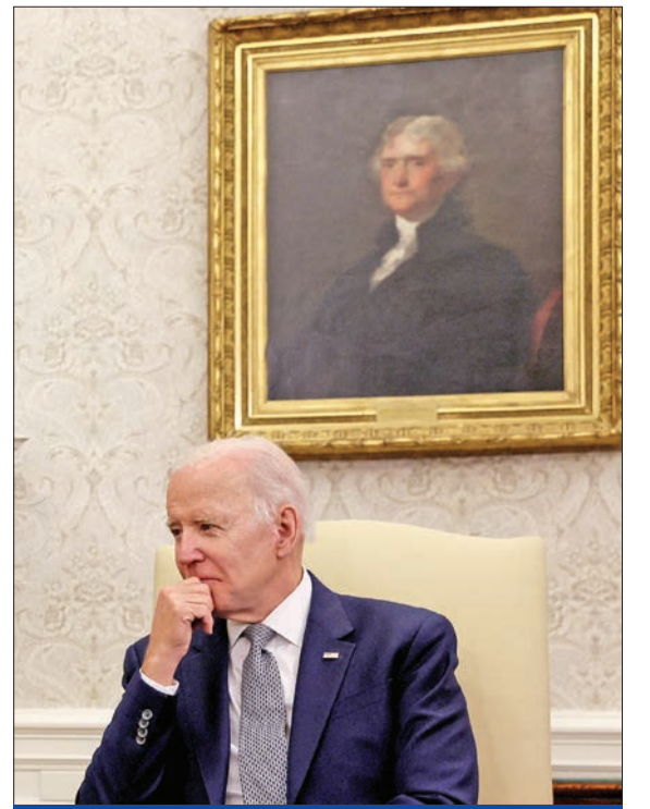
بايدن خلال استقبال رئيس الوزراء الإيطالي ماريو دراغي في المكتب البيضاوي أمس الأول

في نبراسكا، كان ترامب رسمياً وراء ترشيح تشارلز هريستر، السيني الذي صنع ثروته من تربية الماشية. واتهمت ثمانى نساء الرجل المرشح لمنصب الحاكم باعتداءات جنسية بينهن نائبة محلية، وهي تهم نفيها كلها. لكنّ الناخبين اختاروا في النهاية خصمه جيم