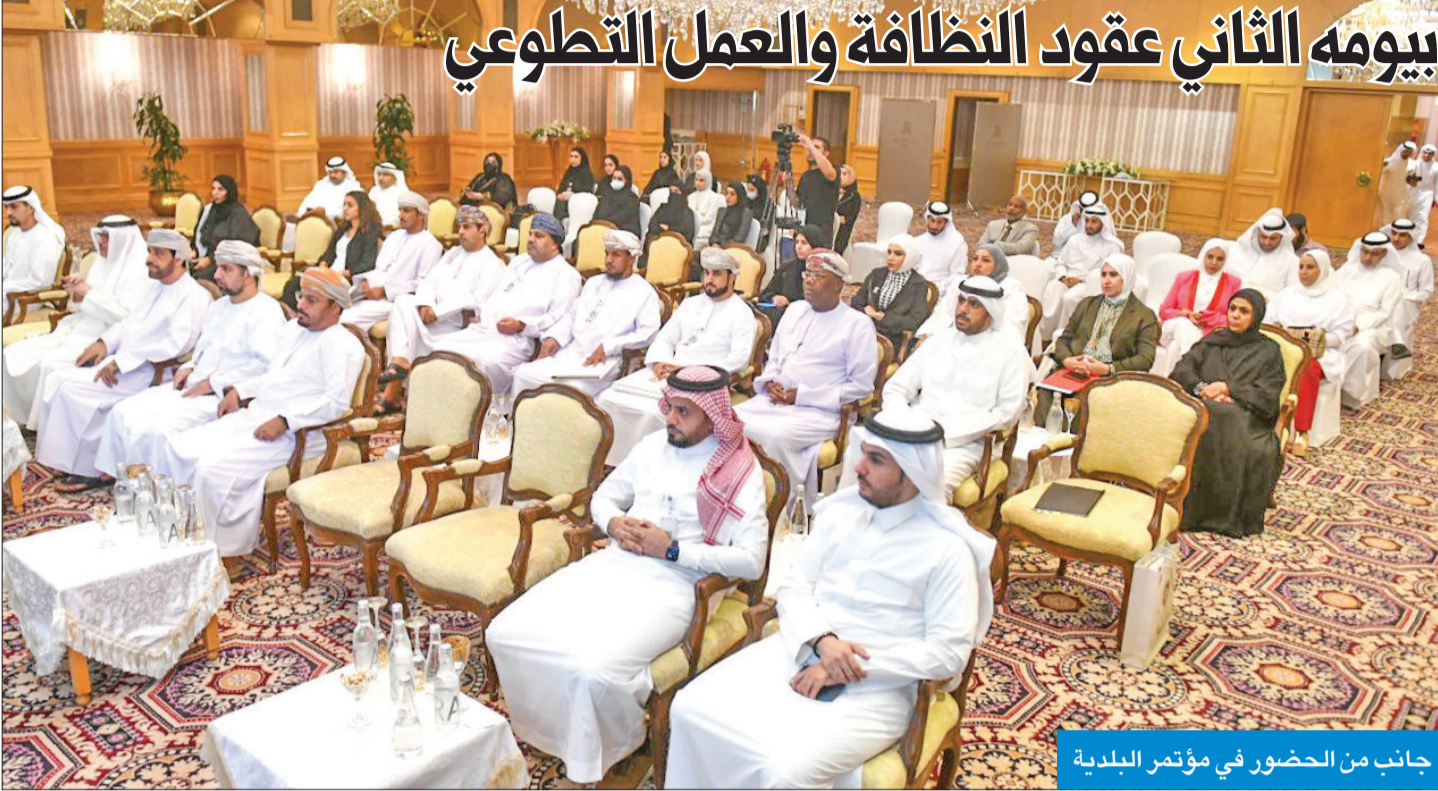
جانب من الحضور في مؤتمر البلدية