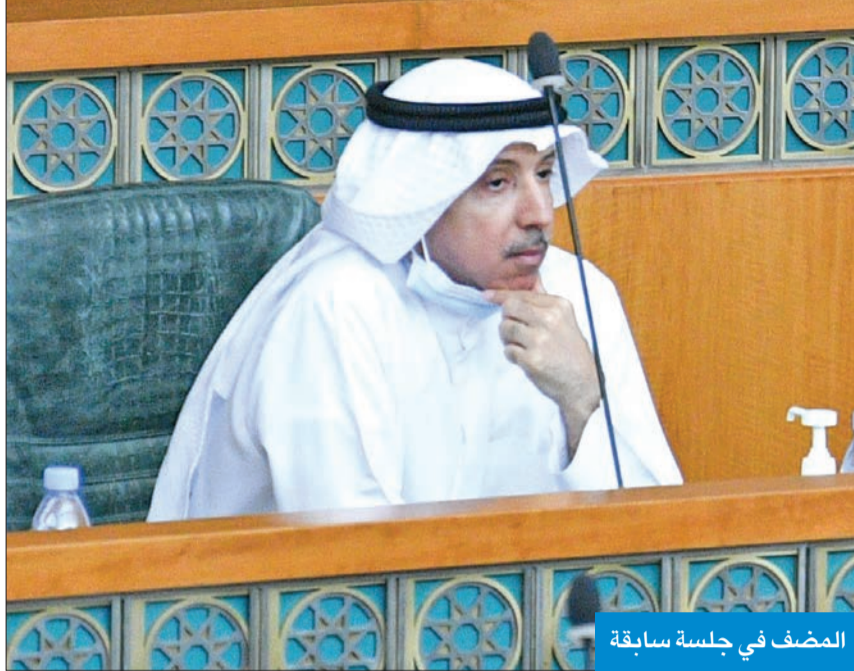
المضف في جلسة سابقة

عدم تخفيض رتبة خريجي كلية علي الصباح من ملازم إلى رقيب