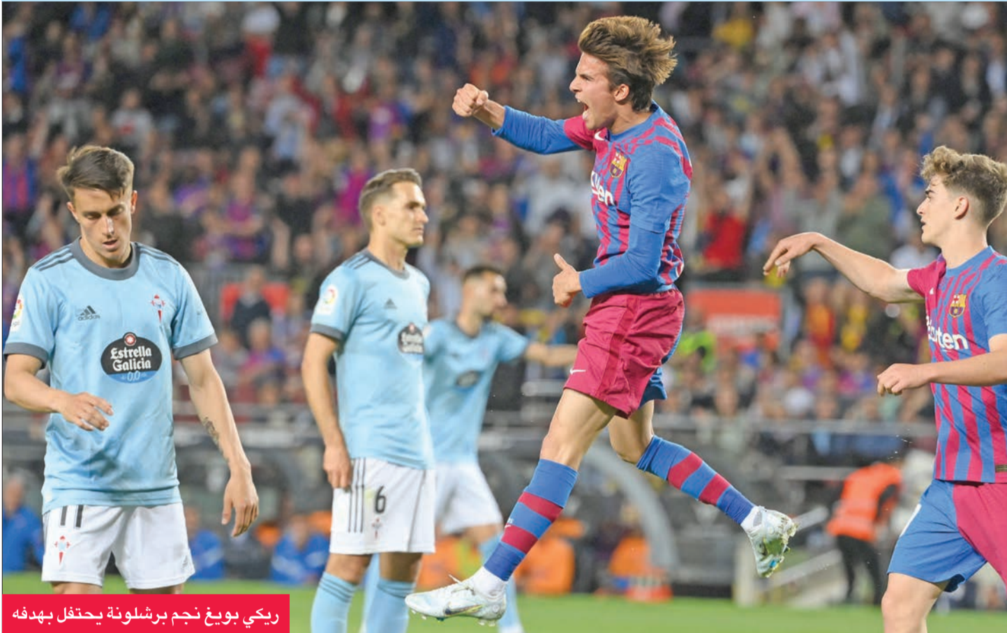
ريكي بويغ نجم برشلونة يحتفل بهدفه