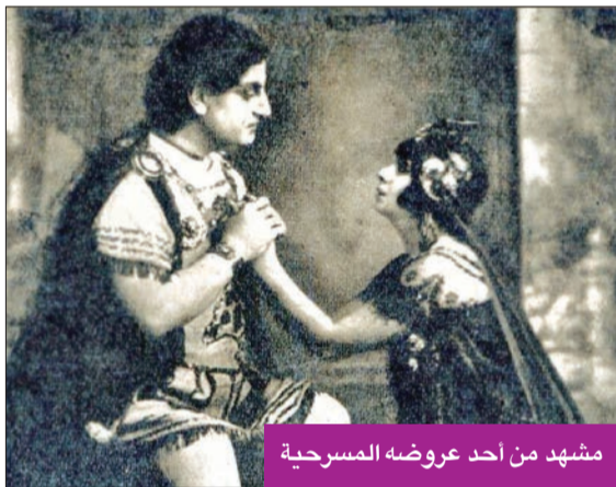
مشهد من أحد عروضه المسرحية

وقد كرس حياته للمسرح لأكثر من 50 عامًا، وحين بلغ من العمر 43 عامًا، تزوج من الفنانة الراحدة حاضرة في ذاكرة المسرح المصري، وأبرزها مسرحية «الإسكندر الأكبر»، وفي أعوامه الأخيرة تفرغ للتدريس بمعهد الفنون المسرحية حتى رحيله، وكرمه الدولة المصرية بإقامة تمثال نصفي له في بهو المعهد، وتمثال آخر بالمسرح القومي، وسُمي مسرح الأزبكية باسمه في عام 1972، وتم وضع صورته على طابع بريدي، ولا تزال إسهاماته الراحدة حاضرة في ذاكرة المسرح العربي.