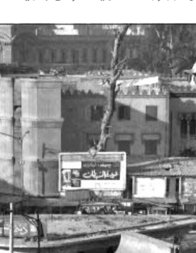
مسرح جورج أبيض (المسرح القومي) عام 1976

التحق جورج أبيض بوظيفة في السكة الحديد بمدينة الفن المسرحي، لأنهم عرفوا مرة عن طريق الفنان الراحل النقاش الذي قدم أول مسرحية عربية «البحيل» عام 1840 المأخوذة من حكايات ألف ليلة وليلة.