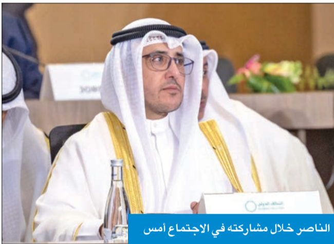
الناصر خلال مشاركته في الاجتماع أمس

وتابع: استنشعنا للمعانة الإنسانية لذوي المقاتلين الأجانب من نساء وقصر من القابعين في السجون السورية، والتزاما كذلك من الكويت بدورها كعضو فاعل في التحالف الدولي لمحاربة تنظيم داعش، واستضافتها 14 دولة عضوة على الواضح بالقارة الأفريقية من بعد زيادة رقعة الصراع الحاصلة في منطقة الساحل، ولن يالو جهدا في استنابة الأمن والسلم الدوليين هناك.