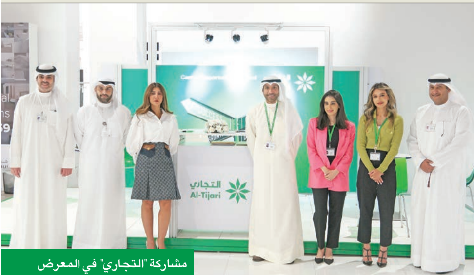
مشاركة «التجاري» في المعرض

وفق تخصصاتهم ومؤهلاتهم العلمية، وعن الفعاليات المرتبطة بالمعرض، رأت جامعة الشرق الأوسط الأميركية أن يتضمن معرضاً افتراضياً، لتوفير منصة للتواصل للخريجين الراغبين في حضور المعرض عن بُعد، وآخر حضورياً بالحرم الجامعي للخريجين الراغبين في التواصل وجهاً لوجه مع فريق الموارد البشرية المتواجدين بالمعرض.