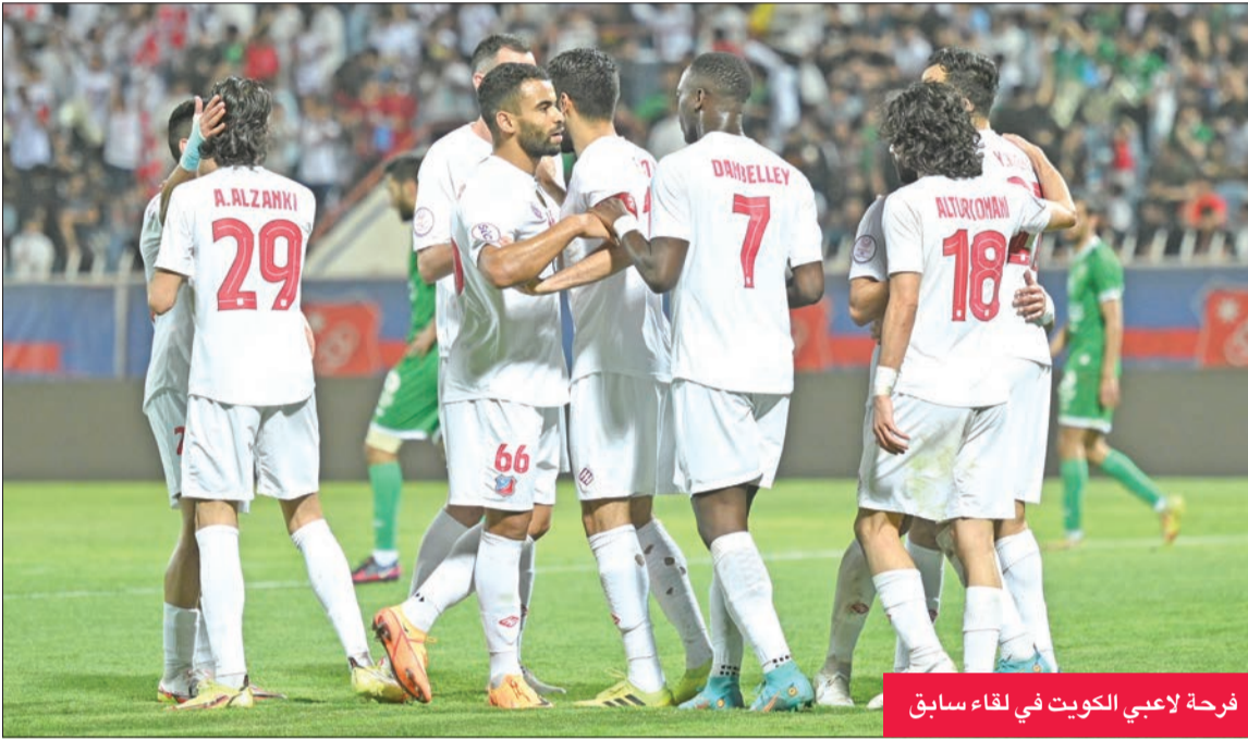
فرحة لاعبي الكويت في لقاء سابق