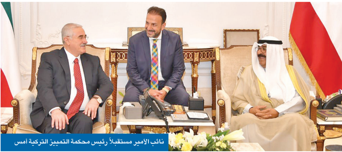
نائب الأمير مستقبلاً رئيس محكمة التمييز التركية أمس

● «أدعو إلى تخصيص دائرة حكومية للوصول إلى بيئة استثمار كويتي آمن»