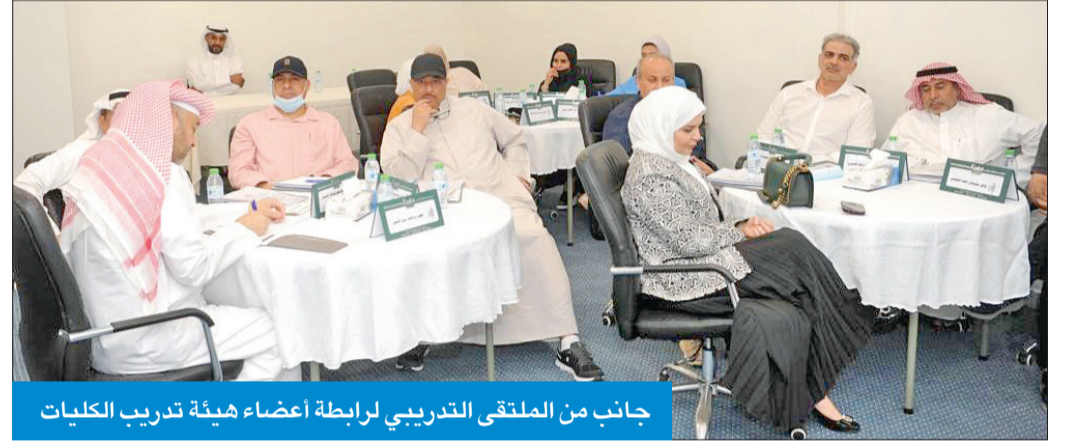
جانب من الملتقى التدريبي لرابطة أعضاء هيئة تدريسي الكليات