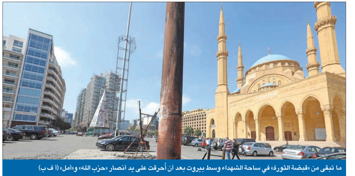
ما تبقى من «قبضة الثورة» في ساحة الشهداء وسط بيروت بعد أن أحرقت على يد أنصار «حزب الله» وأمل

جنبلاط يعود «بيضة القبان»... و«التغيير» تحصد 17 مقعداً