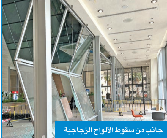
جانب من سقوط الألواح الزجاجية

أدى عيب مصنعي إلى سقوط ألواح زجاجية كبيرة معلقة في البهو الأخير من المبنى الجنوبي بكلية الآداب في جامعة الكويت- الشداية، أمس، دون وقوع أي إصابات بين الطلاب، رغم وجودهم بالقرب منها، إلا أنهم تفادوا الحادث في اللحظة الأخيرة. وعلمت «الجريدة» من مصادر في إدارة الكلية، أنه تبين أن الألواح الزجاجية التي سقطت بها عيب مصنعي، وجارٍ التأكد من الألواح المجاورة لتفادي تكرار الحادث.