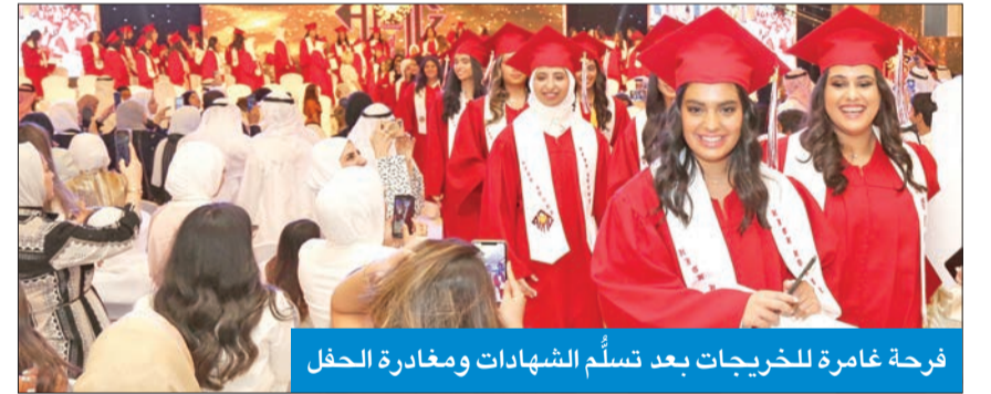
فرحة غامرة للخريجات بعد تسلم الشهادات ومغادرة الحفل

«الشباب»: التسجيل مستمر في إعداد مساعد محام وقادة المستقبل