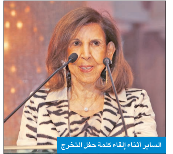
الساير أثناء إلقاء كلمة حفل التخرج