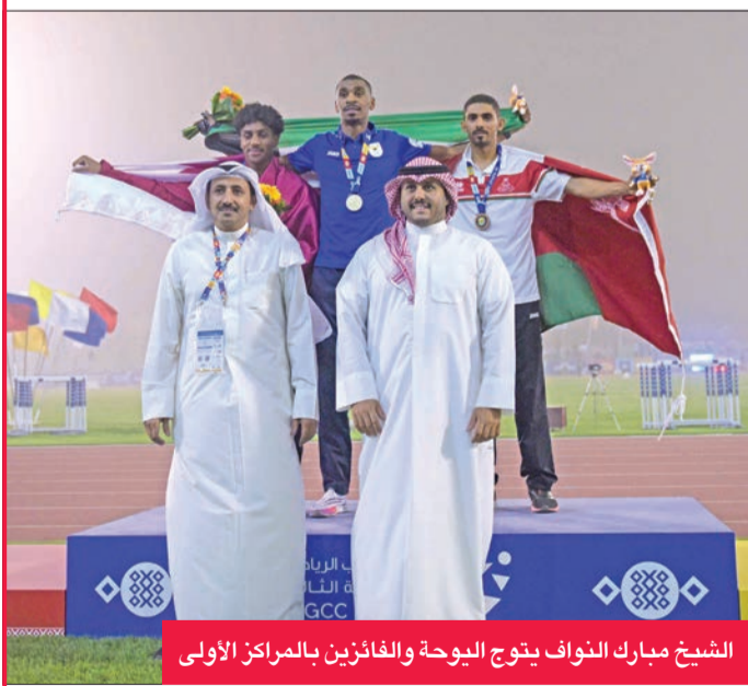
الشيخ مبارك الثواف يتوج اليوحة والفائزين بالمراكز الأولى

وسباقات 400 متر حواجز و800 متر و3000 متر حواجز و4 × 100 متر تتابع.