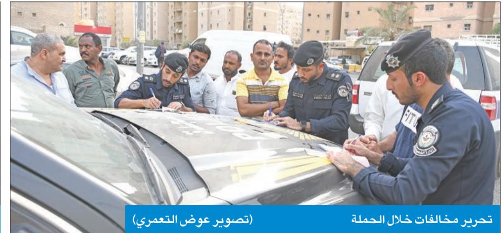
تحرير مخالفات خلال الحملة