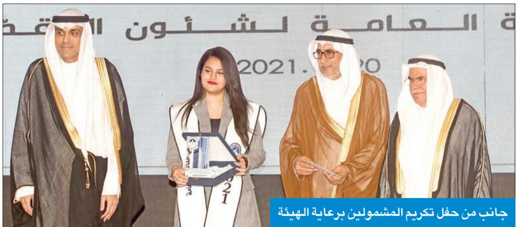
جانب من حفل تكريم المشمولين برعاية الهيئة