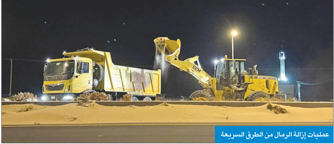
عمليات إزالة الرمال من الطرق السريعة

مواصلة إزالة «السافي» من الطرق السريعة لليوم الرابع