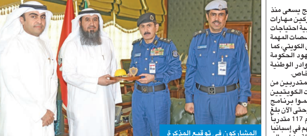
المشاركون في توقيع المذكرة