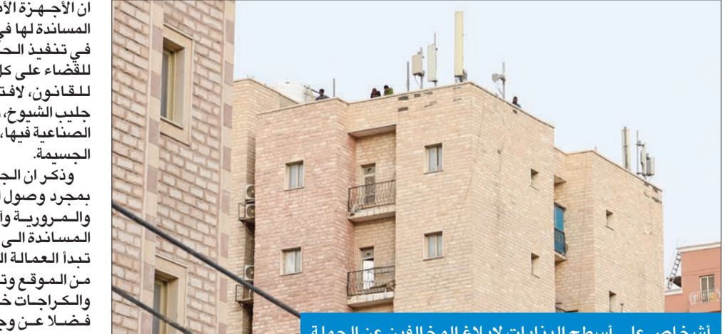
أشخاص على أسطح البنائيات لإبلاغ المخالفين عن الحملة