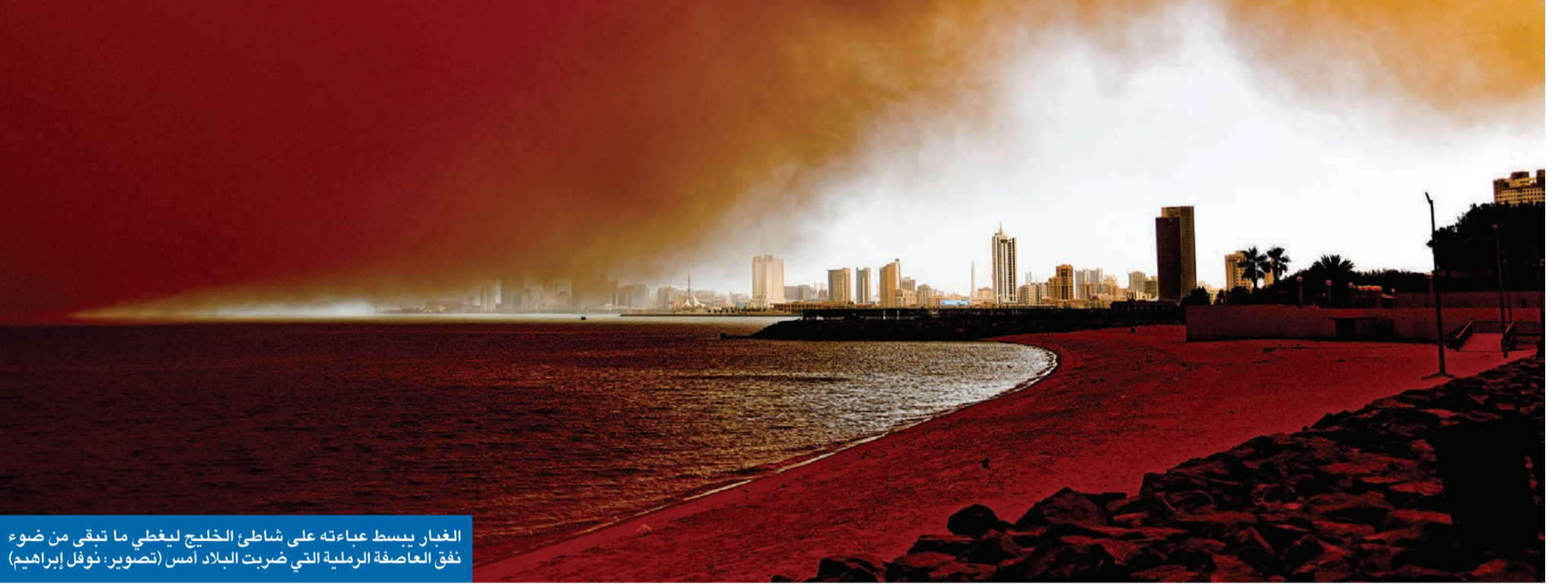
الغبار يبسط عباءته على شاطئ الخليج ليغطي ما تبقى من ضوء ثقب العاصفة الرملية التي ضربت البلاد أمس

عطل الملاحة الجوية وأجل نهائي كأس الأمير وانتخابات «التعاونيات»