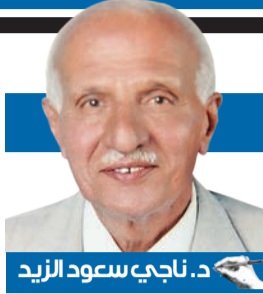
د. ناجب سعود الزيد

انتهت مزحة قام بها أحد حراس حديقة حيوان جامايكا، بوضع يده في فم أسد، والعمل على مضايقته بلحظات رعب حقيقية، عندما هاجمه الأسد، وعمل على قضم إصبعه أمام الزوار. وقال موقع "روسيا اليوم" أمس، إن مقطع الفيديو الصادم انتشر على مواقع التواصل الاجتماعي، ويظهر الحارس، وهو يحاول التهاجي أمام الزوار، أنه قادر على وضع يده في فم الأسد، ولكنه لم يتوقع أن وراء زمجرة الأسد انزعاجاً حقيقياً من هذه الحركة، ما دفعه إلى قضم إصبع الحارس.