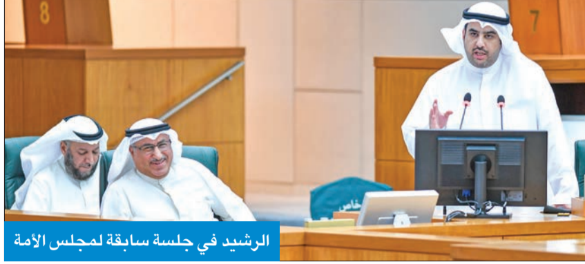
الرشيد في جلسة سابقة لمجلس الأمة

«بنك الائتمان مثل الكويت بدعوة من وزارة الإعلام»