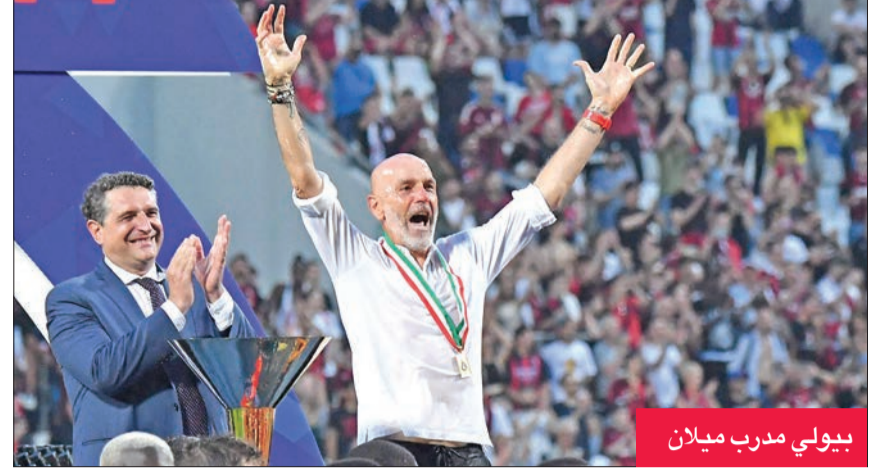
بيولي مدرب ميلان

وانغليك ومنح بيولي فرصة لدفع النادي إلى الأمام. هذا الإيمان الذي تلقاه بيولي أتى ثماره للطرفين، له وللنادي، حيث احتل مركز الوصيف في الموسم الماضي، وأقبعه الآن بلقب الدوري الذي لم يتوقعه أحد في بداية الموسم. الآن أصبح بيولي وميلان جنباً إلى جنب في محاولتهما لإعادة أحد أكثر الفرق الأوروبية عراقة، إلى قمة اللعبة.