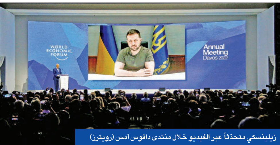
زيلينسكي متحدّثاً عبر الفيديو خلال منتدى دافوس أمس

● وفد أميركي يجول في «حديقة موسكو الخلفية» ● بوتين يتبرأ من «المجاعة»