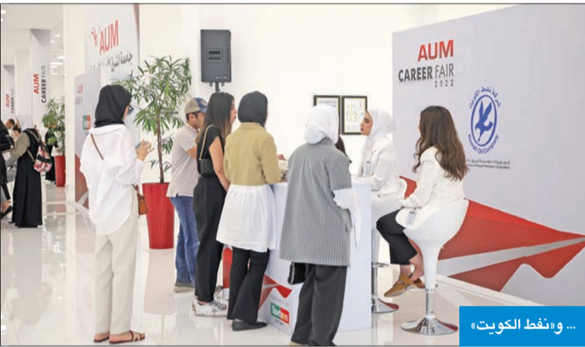
... و«نفت الكويت»