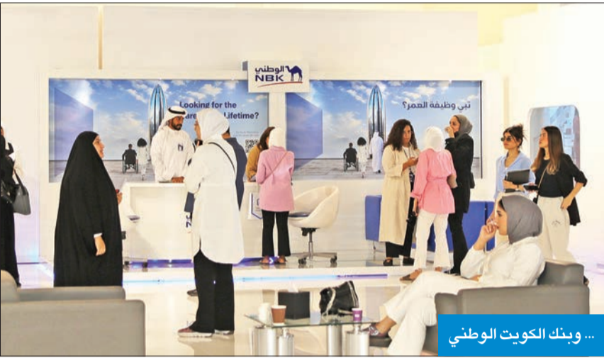
... وبنك الكويت الوطني