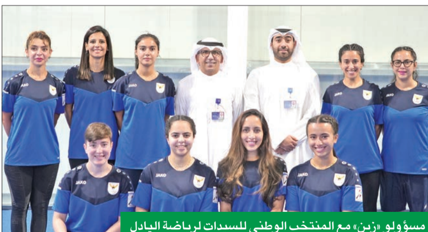
مسؤولو «زين» مع المنتخب الوطني للسيدات لرياضة البادل

دفع عجلة الاقتصاد الوطني وتنمية الحركة السياحية والاقتصادية في الدولة. وتشهد دورة الألعاب الرياضية الخليجية الثالثة مشاركة واسعة من منتخبات دول مجلس التعاون الخليجي وهي 16 رياضة مختلفة، وهي المبارزة والألعاب الإلكترونية وتنس الطاولة والسباحة والكاراتيه والجودو والعب القوي والتنس الأرضي والرمادية والدراجات الهوائية وهوكي الجليد وكرة قدم الصالات وكرة السلة وكرة الطائرة وكرة اليد، إضافة إلى رياضة البادل التي ترعى «زين» مُنافساتها.