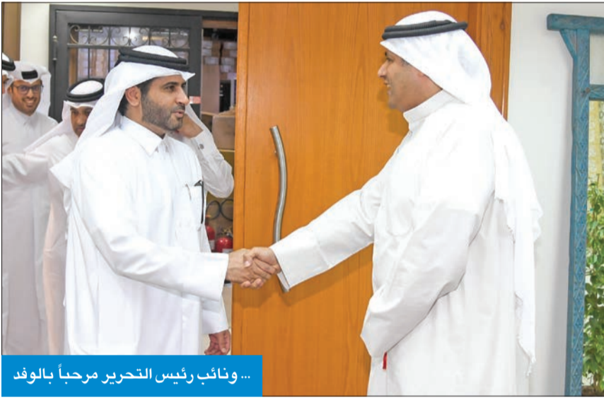
... ونائب رئيس التحرير مرحبا بالوفد