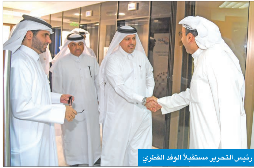
رئيس التحرير مستقبلاً الوفد القطري