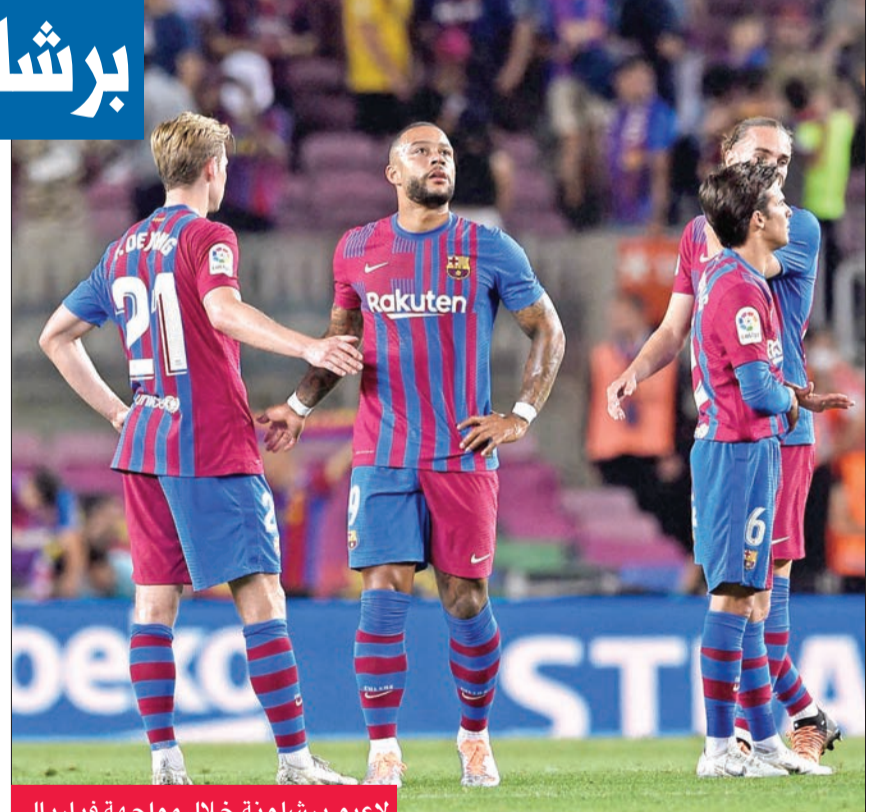
لاعبو برشلونة خلال مواجهة فياريال

ودّع برشلونة الموسم الحالي من بطولة إسبانيا لكرة القدم بالخسارة على أرضه أمام فياريال صفر-2، أمس الأول، في المرحلة الثامنة والثلاثين الأخيرة من الدوري الإسباني لكرة القدم. وبقي برشلونة ثانيا وراء ريال مدريد البطل برصيد 73 نقطة. وخاض الفريق الكتالوني المباراة بتشكيلة قوية، لكنه لم يتمكن من هز شبك منافسه وضيّفه. وافتتح فياريال التسجيل عبر الفونسو بدارسا (41) قبل أن يضيف موي غوميس الثاني (55). وبهذا الفوز حل فياريال سابعا، وضمن المشاركة في الدوري الأوروبي، علما بأنه بلغ هذا الموسم الدور نصف النهائي من دوري الأبطال قبل الخروج على يد ليفربول الذي سيخوض النهائي ضد ريال مدريد الإسباني السبت المقبل. في المقابل، عاد أتلتيكو مدريد بالفوز من أرض ريال سوسيداد، بهدفين سجلهما الأرجنتينيان رودريغو دو بول (51) وأنخل كوريا (69)، مقابل هدف ليون غيردي (3+90). وتغلب اشبيلية على أتلتيك بلباو بهدف نظيف سجله رافا مير الذي حل بدلا من المغربي يوسف النصيري (68).