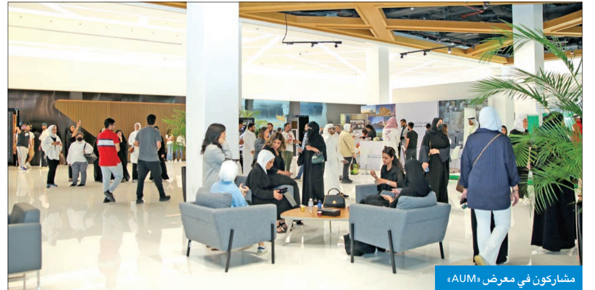
مشاركون في معرض «AUM»

استقطب المعرض عدداً كبيراً من الطلبة والخريجين من مختلف المجالات والتخصصات، حيث شهد حضور أكثر من 15000 زائر ومستخدم مسجل، وما يقارب 1500 فرصة عمل. الجدير بالذكر أنه تم إطلاق المعرض افتراضياً وفي الحرم الجامعي، وشهد مشاركة العديد من الطلاب الذين أتاحت لهم الفرصة للتعرف على أهم الشركات المشاركة، واستكشاف الفرص الوظيفية أو فرص التدريب التي يقدمها السوق الكويتي في مختلف القطاعات والمجالات، والتقديم عليها وحجز مواعيد مسبقة لإجراء المقابلات المباشرة مع إحداهما، إضافة إلى حضور الندوات وورش العمل في الجامعة