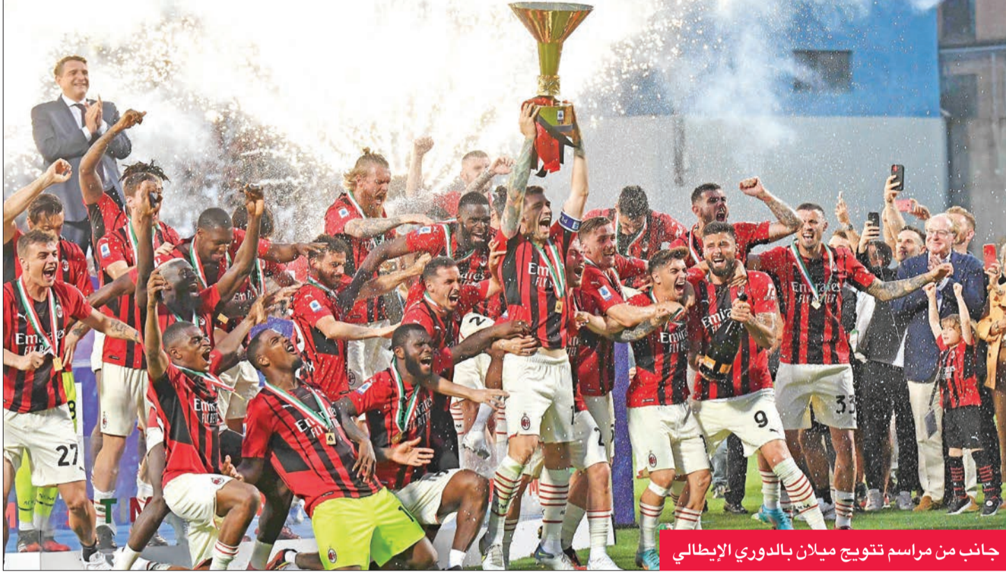
جانب من مراسم تتويج ميلان بالدوري الإيطالي