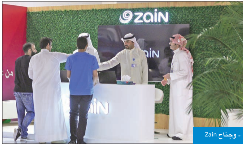
... وجناح Zain

الجامعة استضافت أكثر من 50 من كبريات الشركات المحلية والعالمية في الكويت