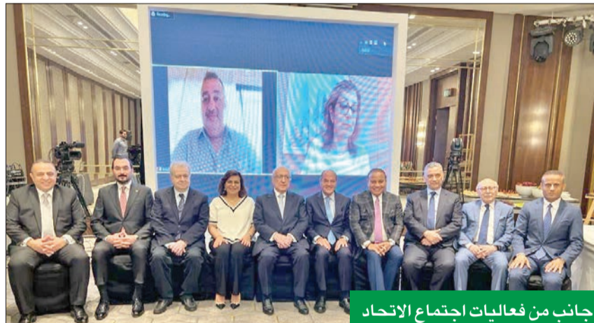
جانب من فعاليات اجتماع الاتحاد