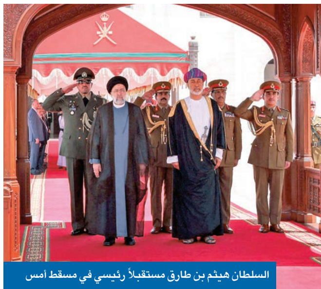
السلطان هيثم بن طارق مستقبلاً رئيسي في مسقط أمس

توعد مسؤولون إيرانيون في مقدمتهم الرئيس إبراهيم رئيسي بالانتقام لمقتل العقيد البارز في «فيلق القدس» المسؤول عن العمليات الخارجية لـ «الحرس الثوري»، العقيد حسين خدائي، الذي يعتقد أنه اغتيل على يد عملاء لـ «الموساد» الإسرائيلي في قلب طهران أمس الأول. وقال رئيسي، قبيل مغادرته مطار طهران متوجهاً إلى سلطنة عمان أمس: «ليس لدي شك أن الانتقام لدماء الشهيد العظيم من أيدي المجرمين أمر حتمي».