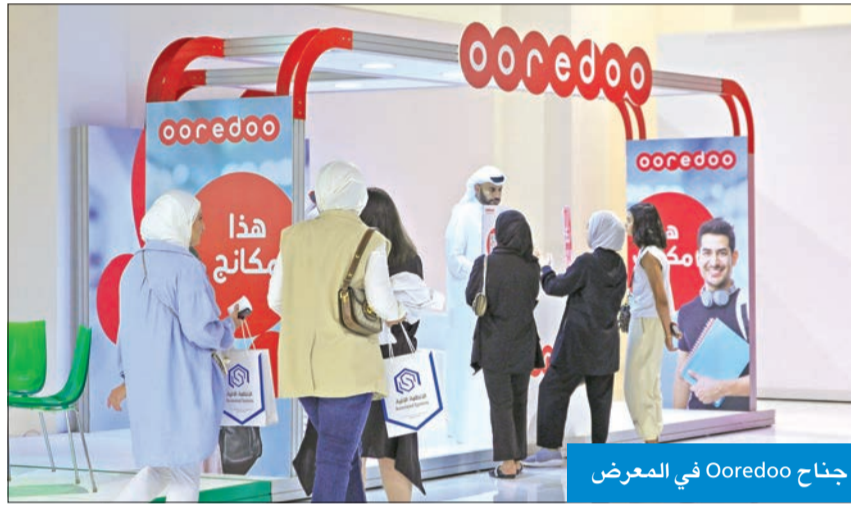
جناح Ooredoo في المعرض