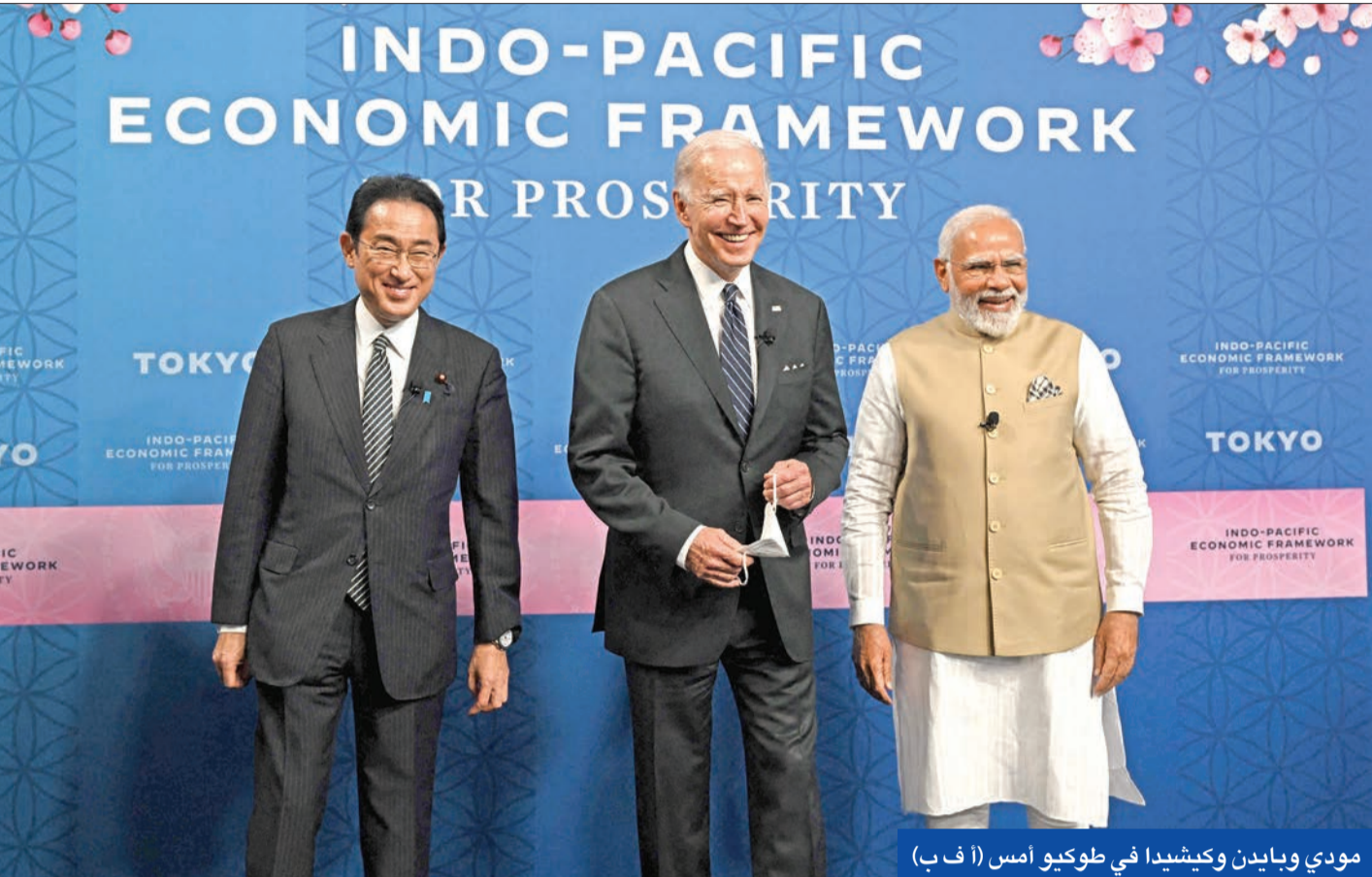
مودي وبايدن وكيشيدا في طوكيو أمس

بكين تدعو واشنطن إلى عدم الاستهانة بقدراتها في حماية سيادتها... والبيت الأبيض يوضح