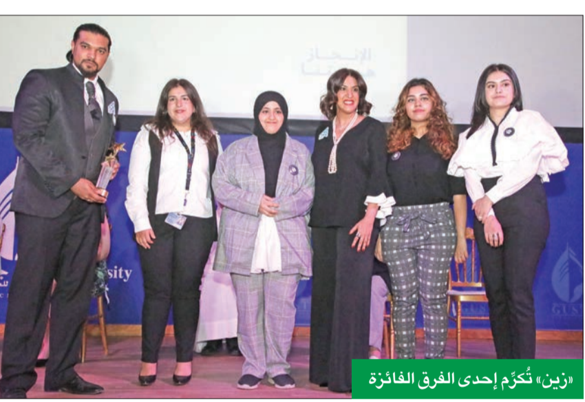
«زين» تُكّرّم إحدى الفرق الفائزة

قيمة مضافة للمجتمع. الجدير بالذكر أن «إنجاز الكويت» أسست عام 2005 كمؤسسة غير ربحية وغير حكومية بدعم من القطاع الخاص في الكويت، وعبر شراكة وتعاون استراتيجي مع القطاع الخاص وقطاع التعليم بالكويت، وبمساعدة متطوعين ذوي خبرة وكفاءة في مختلف المجالات، وهي جزء من مؤسسة «إنجاز العرب» التي تعد من كبريات المؤسسات العالمية المختصة بتعليم وتحقيف الطلبة لتأهيلهم لخوض معترك الحياة العملية وتنظيم المشاريع ومحو الأمية المالية من خلال التدريب العملي.