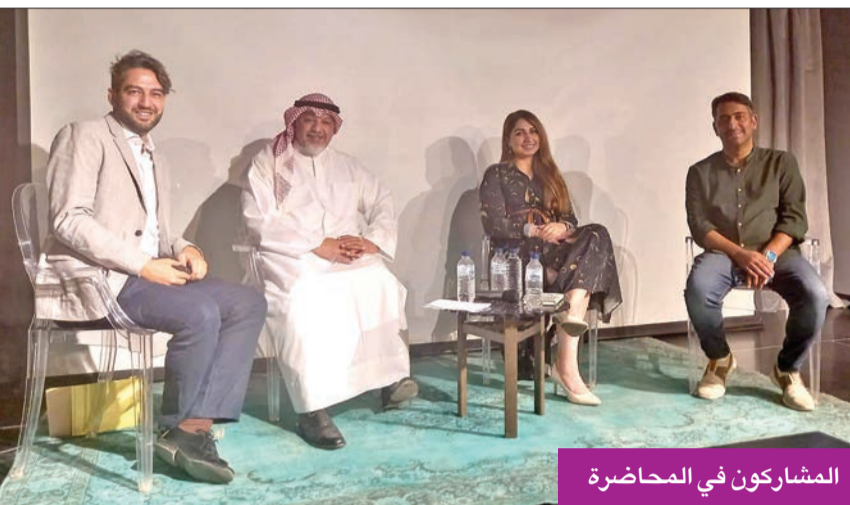
المشاركين في المحاضرة

أجمع المشاركون في المحاضرة على ضرورة تكاتف جميع المؤسسات الفنية والجهات الراعية للفنون، إضافة إلى الفنانين، لتطوير دور الفن في المجتمع.