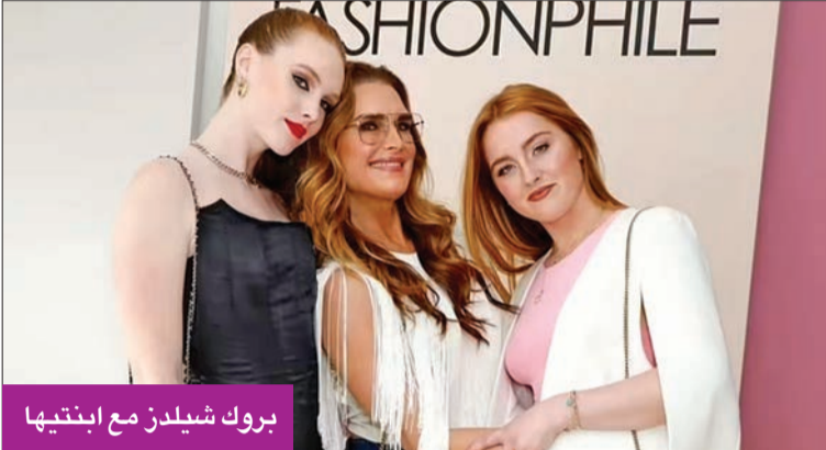
بروك شيلدز مع ابنتها

وسنقت شيلدز مع بلويزة بلا أكمام الجينز الضيق الغامق ومحفظة مبطنة، وكانت وروان، التي بدأت بالفعل في اتباع خطى والدها في عرض الأزياء، ترتدي قميصاً أسود وبنطلوناً أبيض واسعاً وحقيبة يد من شانيل، بينما ارتدت شقيقها الصغرى ستره بيضاء، وحقيبة غوتشي مطبقة، وقميصاً وردياً، إضافة إلى بنطلون جينز أزرق فاتح.