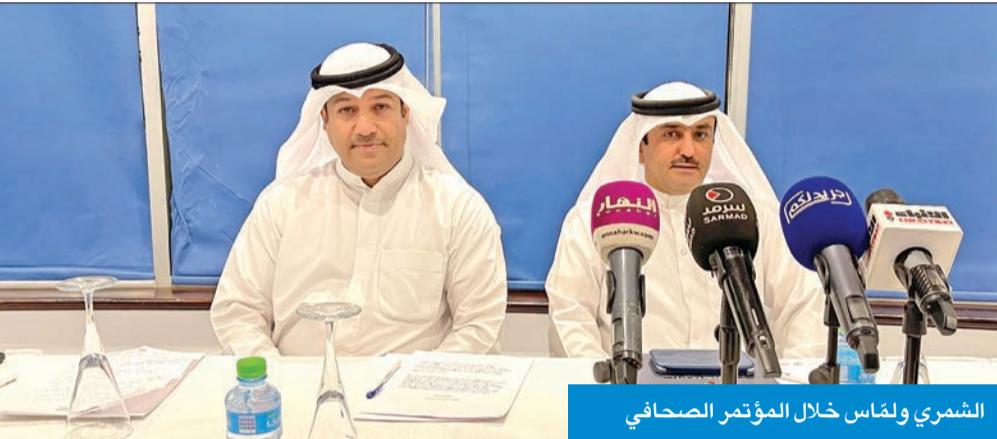
الشمري ولناس خلال المؤتمر الصحفي

هدد 79 صاحب مكتب استقدام عمالة منزلية بتسليم رخص مزاولة النشاط إلى وزارة التجارة خلال أسبوعين، رداً على قرار الأخيرة الصادر بشأن تحديد تكاليف استقدام العمالة بما لا يزيد على 890 ديناراً، شاملة تذكرة السفر وفحص السبي سي آر، للعامل المستقدم، مشددتين على ضرورة إلغاء هذا القرار غير المدروس، وإعادة النظر في أسعار عقود الاستقدام، لتكون بالتنسيق مع أصحاب المكاتب أو من يمثلهم.