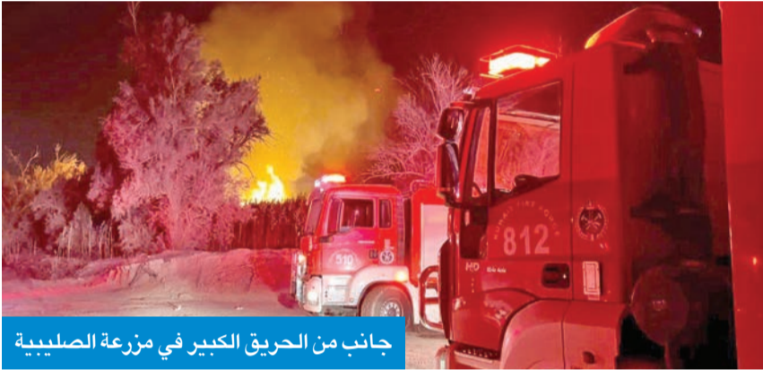
جانب من الحريق الكبير في مزرعة الصليبية

وأضاف أن الحادث لم يسفر عن وقوع إصابات بين رجال الإطفاء، واقتصرت على الخسائر المادية الجسيمة التي لحقت بالموقع، والتي قدرها أصحاب المحلات في السوق بأنها تصل إلى ملايين الدنانير، مشيراً إلى أن قوة الإطفاء العام بالتعاون والتنسيق مع بلدية الكويت وجهات حكومية أخرى شكلت لجنة تحقيق للوقوف على أسباب اندلاع الحريق.