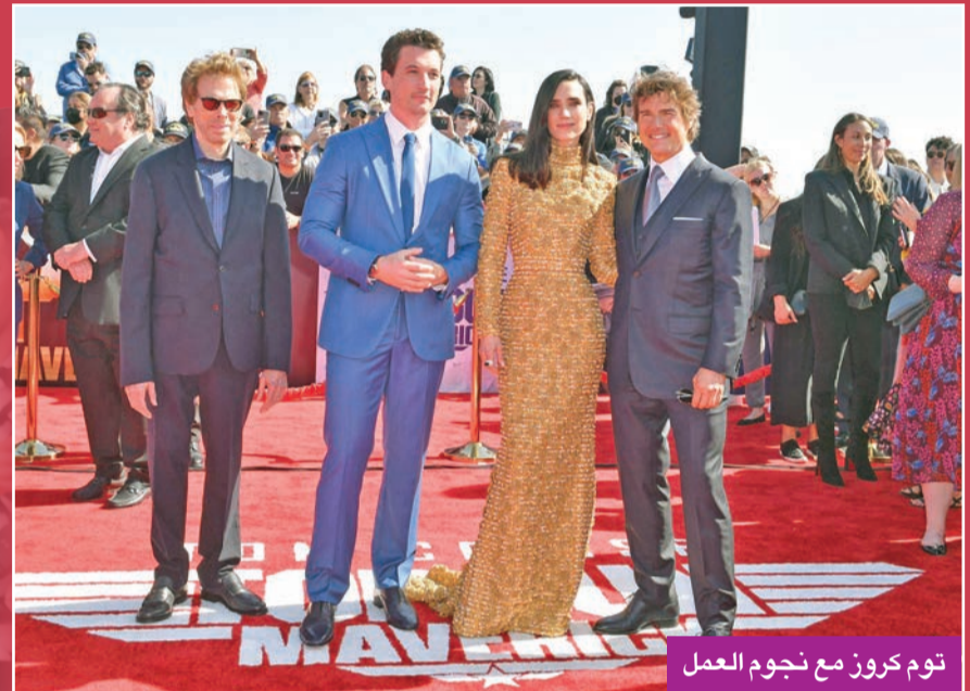
توم كروز مع نجوم العمل

تحققاً في أسبوعه الرابع 16.4 مليون دولار في الفترة الممتدة بين الجمعة والأحد و 21.1 مليون دولار خلال العطلة الكاملة. وحقق الفيلم، وهو من إنتاج شركة «ديزني» وبطولة الممثل البريطاني بنديكت كامبرباتش، إيرادات بلغت 187 مليون دولار في أولى أيام انطلاق عروضه. وجاء في المرتبة الثالثة فيلم «بوب برغر» الجديد لـ «توينتيث سينتوري ستوديوز»، وحقق الفيلم الذي تستند قصته إلى مسلسل تلفزيوني شهير 12.6 مليون دولار في أول ثلاثة أيام من العطلة و 15 مليون دولار خلال الأيام الأربعة.