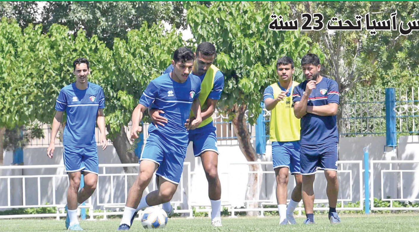
جانب من التدريب الأخير لـ «الأزرق الأولمبي» في أوزبكستان