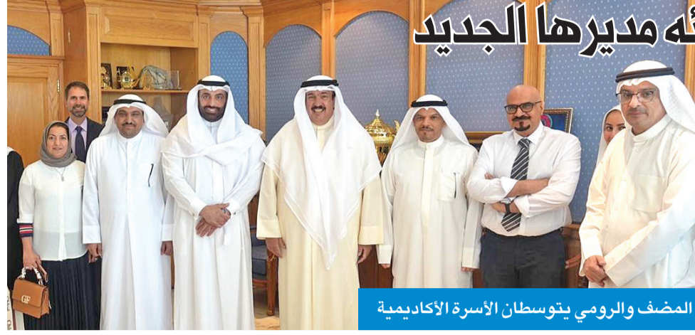
المضف والرومي يتوسطان الأسرة الأكاديمية

أكد وزير التربية وزير التعليم العالي والبحث العلمي د. علي المضف أن جامعة الكويت تعد من الجامعات المرموقة، ليس على مستوى الكويت فحسب وإنما على المستويين الخليجي والعربي، متطلعا إلى المزيد من النجاحات القريبة بقيادة مدير الجامعة د. يوسف الرومي الذي بدوره يساهم ويسعى إلى أن يرفع من مستواها في القريب العاجل في ظل التنافس بين الجامعات على المستويين العربي والعالمية.