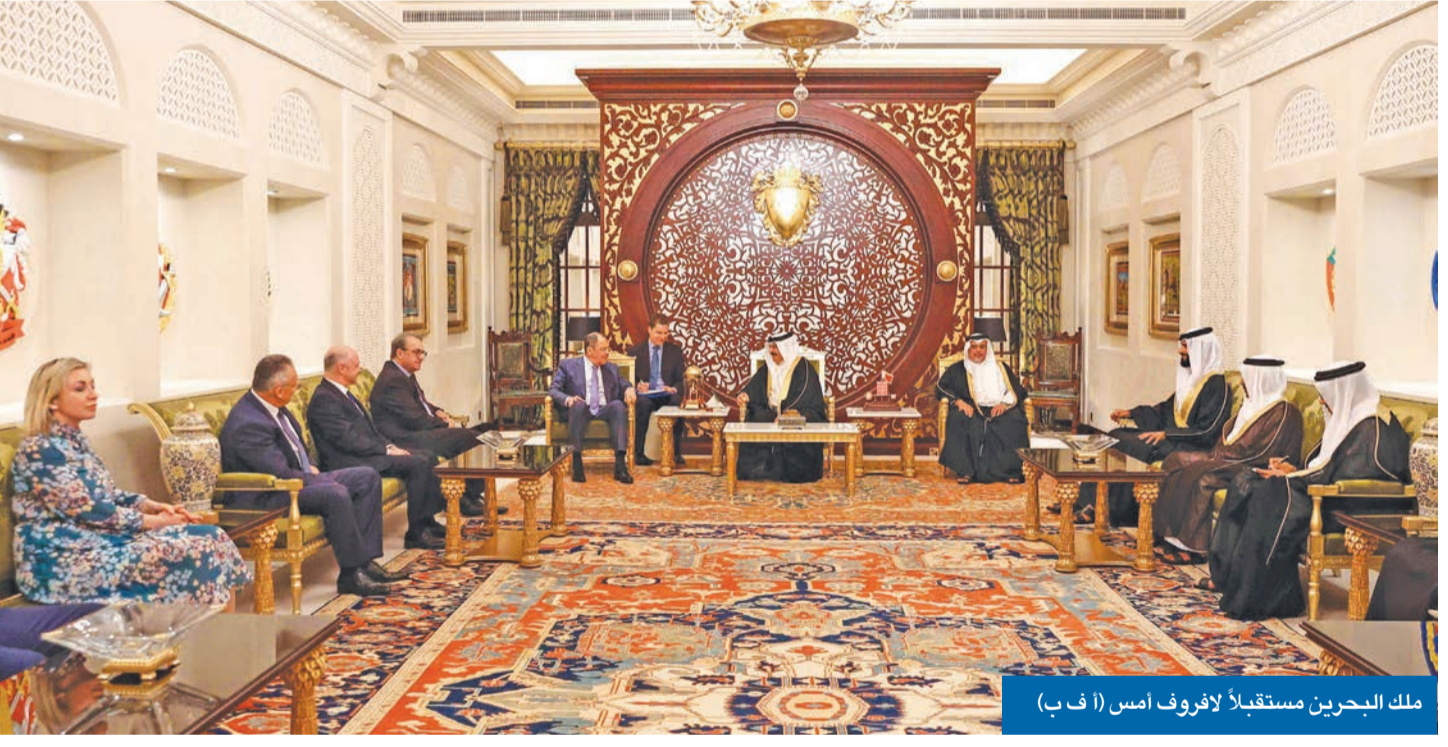
ملك البحرين مستقبلاً لأفروف امس

اتصال بين بليكن وبن فرحان قبيل زيارة محتملة لبايدن إلى السعودية