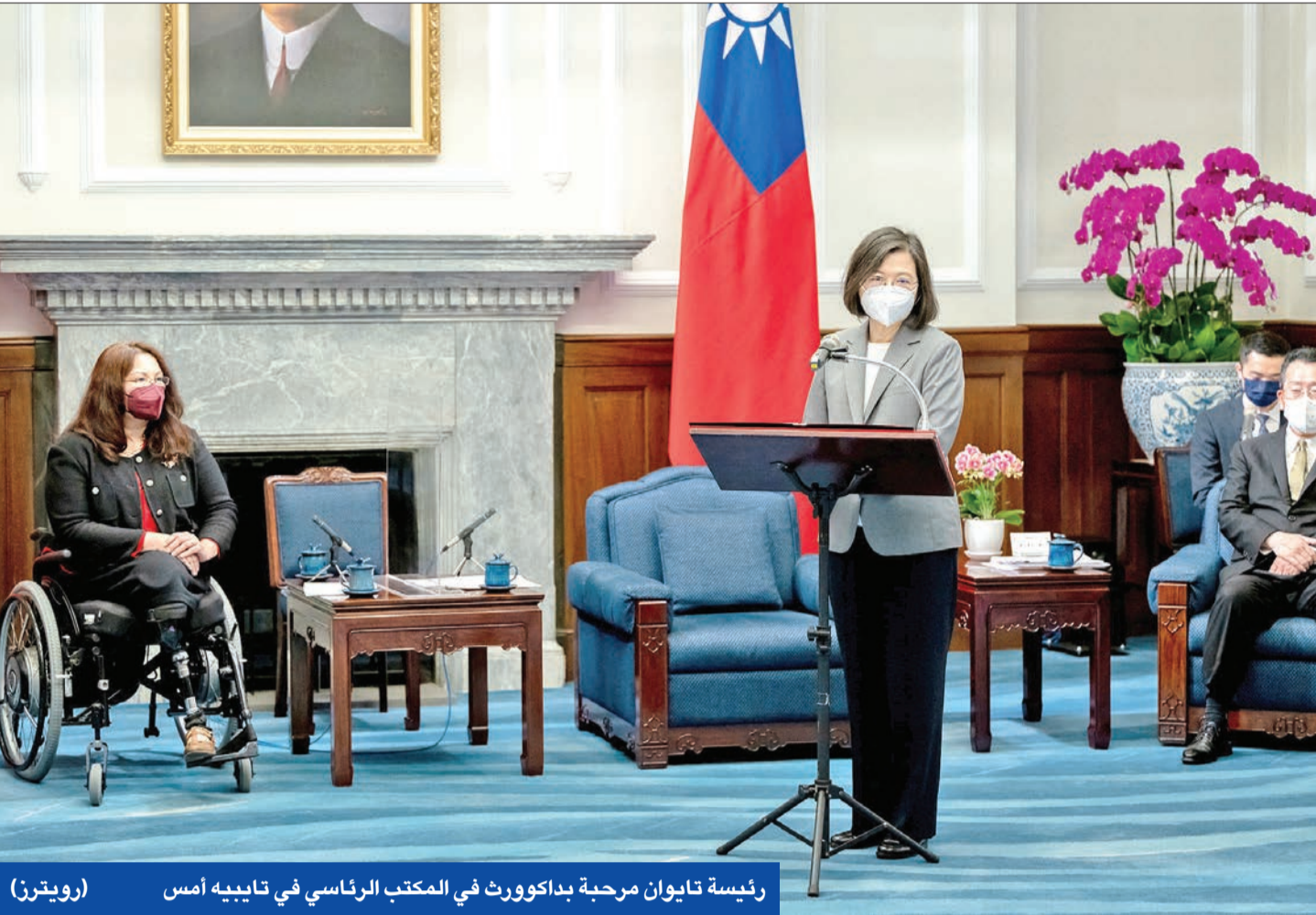
رئيسة تايوان مرحبة بداكويرث في المكتب الرئاسي في تايبيه أمس

بايدن يبحث مع رئيسة وزراء نيوزيلندا أمن «الهادئ» • الفلبين تعترض على مضايقات صينية