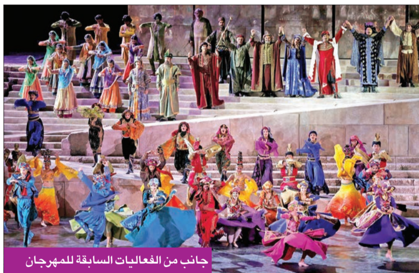
جانب من الفعاليات السابقة للمهرجان

ومن المقرر أن تبدأ الفنان حمادة هلال التحضير لفيلم جديد بالاطباع الكوميدي يقدمه خلال العام القادم، بعد غيابه عن السينما خلال الفترة الماضية، والتي وصلت إلى ما يقرب من 5 سنوات. ويتعاون حمادة في الفيلم مع الفنان كريم فهمي، الذي يكتب له العمل الجديد، بعد اقتناعه بفكرة معينة، حيث رفض خلال الفترة الماضية عشرات الأفكار والسيناريوهات المكتوبة، التي رأى أنها لم ترضه، أو أنها جديدا بعد الأعمال التي قدمها خلال السنوات الماضية.