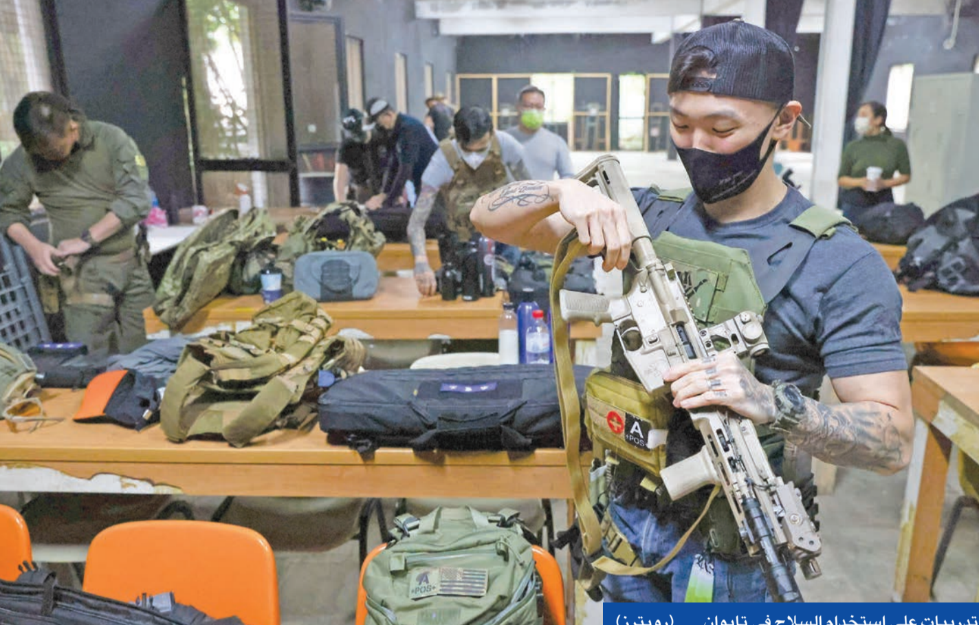
تدريبات على استخدام السلاح في تايوان

في تحدٍّ لبكين التي زابت من تحركاتها العسكرية حول الجزيرة، بدأت تايوان أمس محادثات تجارية مع واشنطن، في وقت أشاد الرئيس الأميركي جو بايدن برفض جزر جنوب الهادئ للاتفاق الأمني الصيني.