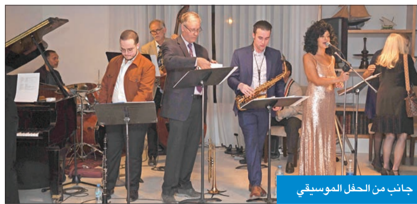
جانب من الحفل الموسيقي

خلال حفل أقامه «المعهد الفرنسي» بالتعاون مع «فرقة الأحمدي الموسيقية»