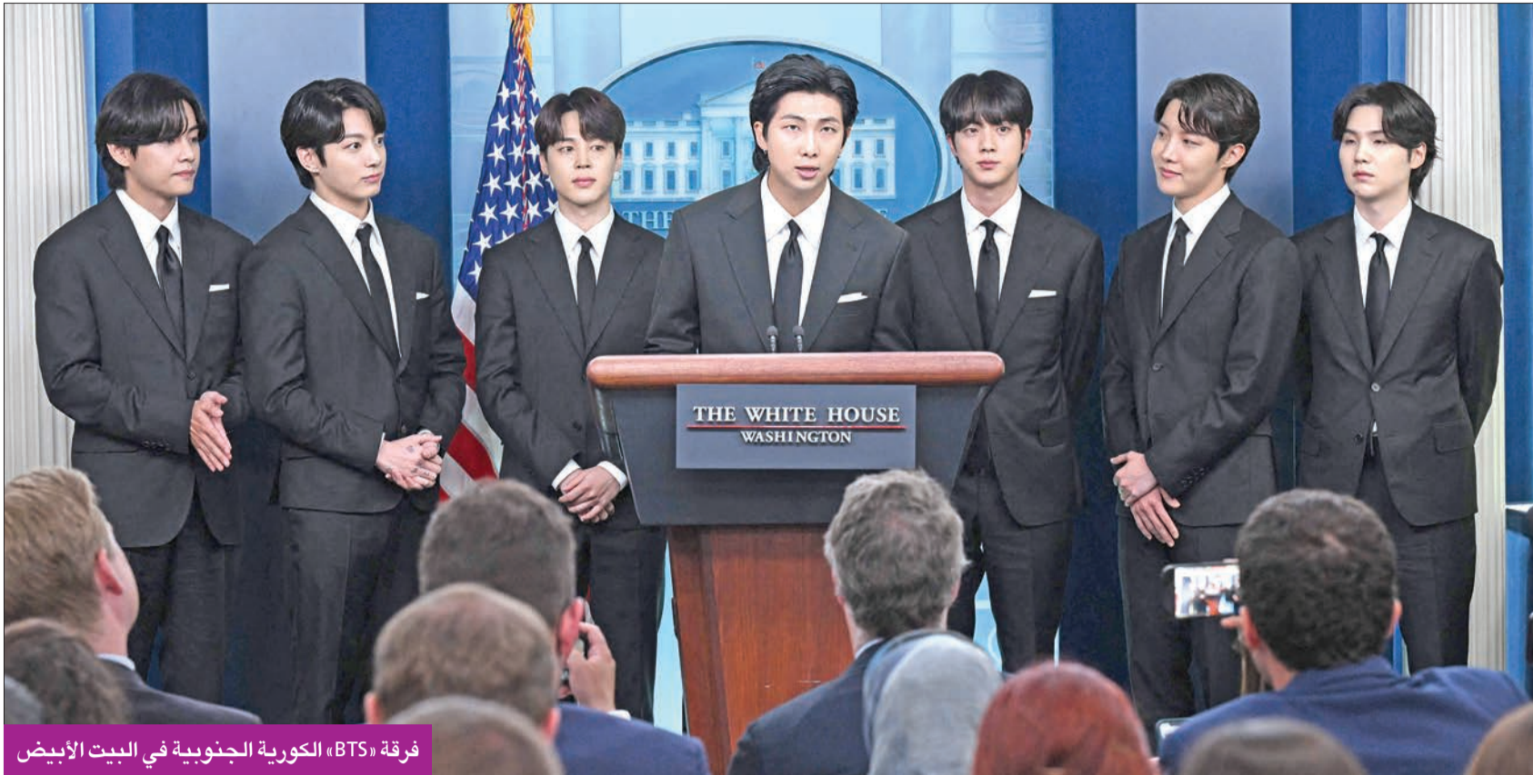
فرقة «BTS» الكورية الجنوبية في البيت الأبيض

دولار، مدفوعة بالمحتوى عبر الإنترنت ومبيعات الألبومات. وأطلق الفريق الإعلامي لجو بايدن، البالغ 79 عاماً، وهو أكبر رئيس جمهورية يتم انتخابه في الولايات المتحدة، منذ وصوله إلى البيت الأبيض، حملات إعلامية كبيرة لاستمالة الجماهير الشابة، من خلال التعاون مع الكثير من النجوم والمؤثرين. واستقبل البيت الأبيض في هذا الإطار نجمة الجوب الأمريكية أوليفيا رودريغو، وفرقة «جوناس براذرز» المحببة لدى المراهقين، والتي أتت أفرادها إلى مقر الرئاسة الأمريكية لتسجيل مقاطع فيديو مع الرئيس بايدن للترويج للتصميم ضد كوفيد 19.