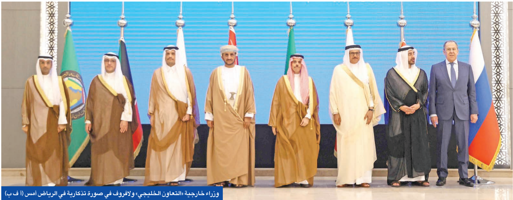
وزراء خارجية «التعاون الخليجي» ولافروف في صورة تذكارية في الرياض أمس (أ ف ب)

أجراها الرئيس التركي رجب طيب إردوغان إلى السعودية لنهايات أبريل. وكان الوزير السعودي قد أكد، أمس الأول، لتظيره الروسي بعد وصوله من المنامة، أن «المملكة على استعداد لبذل الجهود اللازمة للمساهمة في التوصل إلى حل سياسي للأزمة بأوكرانيا، مشدداً على أن التعاون ورؤوساء دول عربية أخرى في العاصمة السعودية، مكرراً بذلك معلومات متواترة أشارت إلى الزيارة.