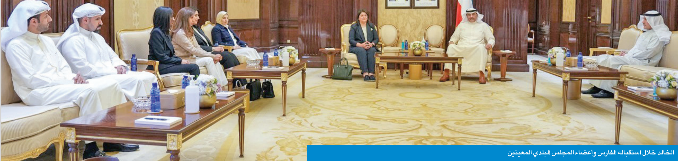
الخالد خلال استقباله الفارس وأعضاء المجلس البلدي المعيّنين

استقبل وزيرة البلدية وأعضاء المجلس المعيّنين ودعا إلى تلبية طموحات المواطنين وخطط التنمية