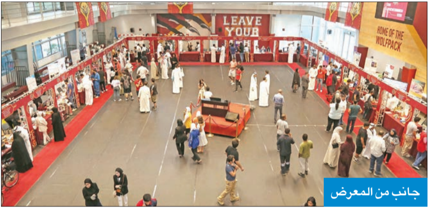
جانب من المعرض

زيد: بمشاركة 100 طالب وتشمل 5 تخصصات بينها تطبيقات للهواتف والواقع الافتراضي و«الإطفائي الآلي»