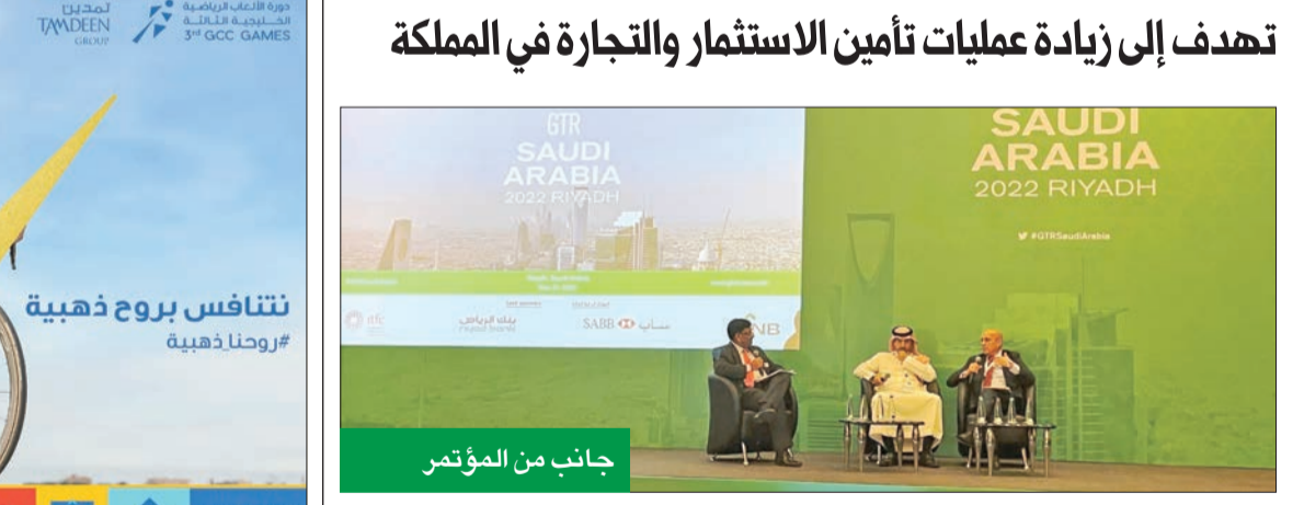
جانب من المؤتمر

مع العديد من الجهات السعودية، كما أسست اتحاد أمان بالتعاون مع المؤسسة الإسلامية لتأمين الاستثمار وأئتمان الصادرات. وأضاف أن المؤسسة تتعاون مع الجهات السعودية ذات الصلة في أمور الاستشارات والبحوث وتبادل المعلومات اللازمة لإصداراتها، مثل تقرير مناخ الاستثمار والنشرات والدراسات الأخرى، كذلك تشارك المؤسسة في عدد من المؤتمرات والأنشطة التي تنظمها السعودية، مبينا أن المؤسسة تقدم عدة خدمات للسعودية، أبرزها تأمين الاستثمارات العربية والأجنبية الوافدة إلى المملكة، كما تقدم خدمة تأمين أئتمان الصادرات السعودية إلى مختلف دول العالم، وكذلك تأمين ائتمان واردة السلع الرأسمالية والاستراتيجية السعودية.