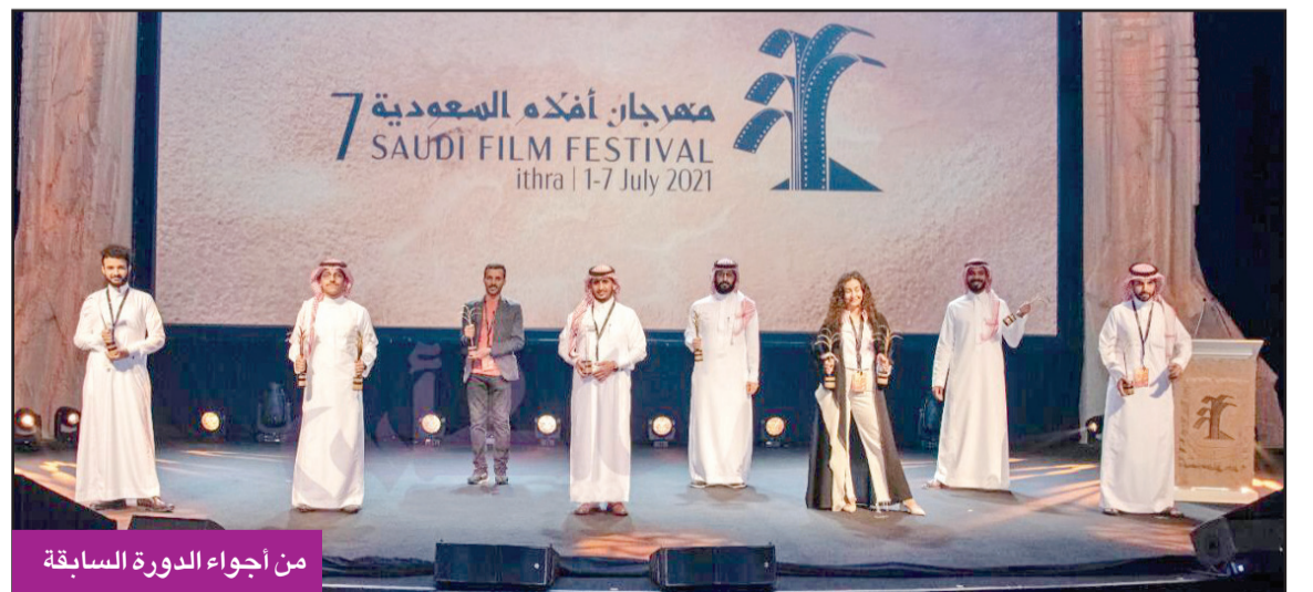
من أجواء الدورة السابقة

80 فيلماً تشارك في دورته الثامنة على مسرح إثراء