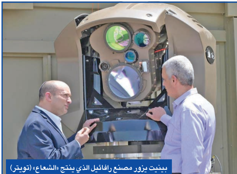
بينيت يزور مصنع رافائيل الذي ينتج «الشعاع»

غاز العراق... مجدداً من جهة أخرى، أعلنت وزارة الكهرباء العراقية، تأخرها في دفع الاستحقاقات المالية لطهران مقابل إمدادات الغاز الإيراني، موضحة أن «خفض