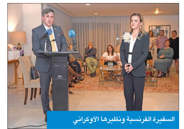
السفيرة الفرنسية ونظيرها الأوكراني

دولة الكويت لدعمها المبكر والواضح والحاسم لأوكرانيا». وقالت لوفليشر: «اجتمعنا هنا للتعبير عن عميق مشاعر الحزن والتعاطف تجاه الدمار غير المبرر والفظائع التي يعانيها أبناء الشعب الأوكراني الذين سقطوا ضد إرادتهم في حرب بربرية من عدوان غير المبرر».