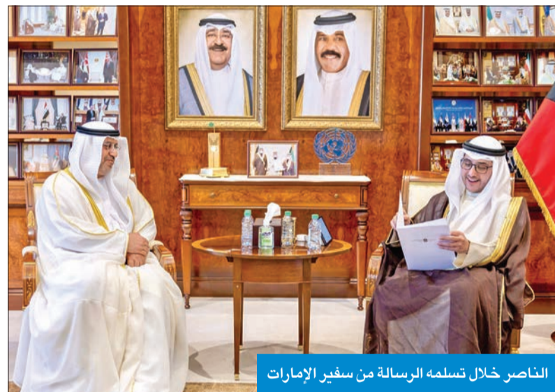
الناصر خلال تسلمه الرسالة من سفير الإمارات

تناولتا العلاقات الأخوية والثيقة وسبل تعزيزها