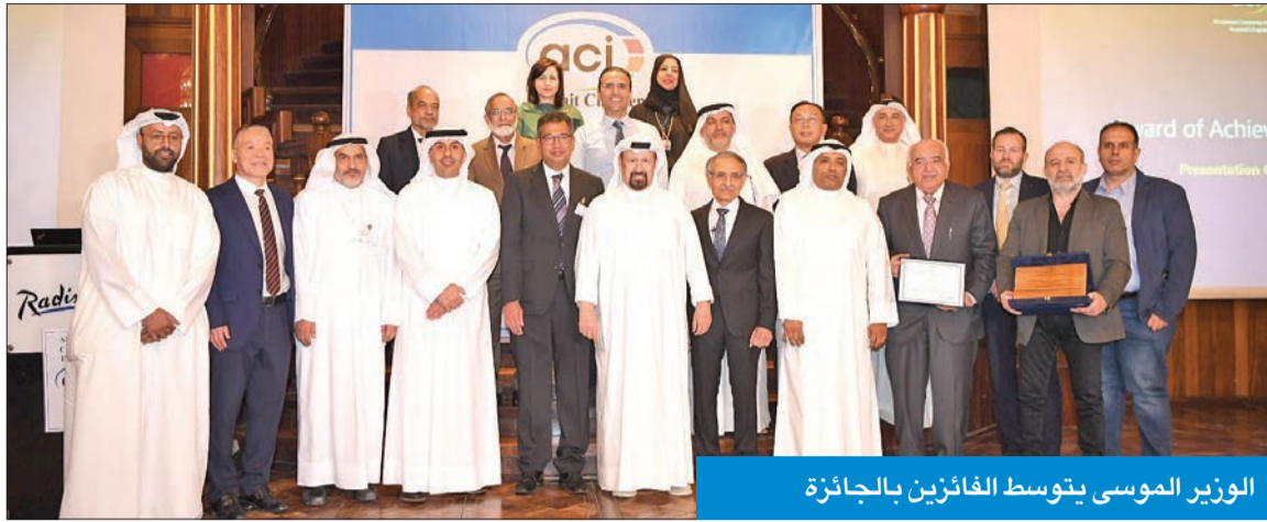
الوزير الموسى يتوسط الفائزين بالجائزة

برعاية وحضور وزير الأشغال العامة وزير الكهرباء والماء والطاقة المتجددة م. علي الموسى، أعلن المعهد الأمريكي للخرسانة- فرع الكويت، فوز مبنى كلية الهندسة والبتترول الجديد التابع للبرنامج الإنشائي لجامعة الكويت (صباح السالم)، بجائزة التميز للعام الحالي كأفضل مبنى.