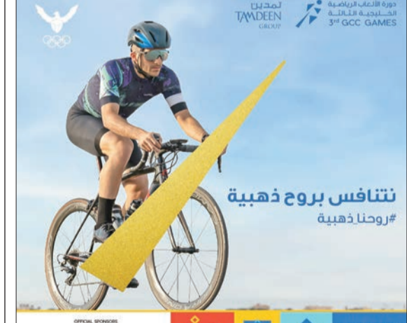
نتنافس بروح ذهبية

أعلنت مجموعة الخليج للتأمين - الكويت (gig-Kuwait)، رعايتها الرسمية لدورة الألعاب الرياضية الخليجية الثالثة بدول مجلس التعاون لدول الخليج العربية، تحت شعار «روحنا ذهبية» والتي استضافتها الكويت بتنظيم من اللجنة الأولمبية الكويتية من 16 إلى 31 مايو الماضي، تحت رعاية صاحب السمو أمير الكويت الشيخ نواف الأحمد. وأكدت الخليج للتأمين - الكويت، في بيان صحفي، أن رعايتها جاءت تمازجياً مع استراتيجيتها الاجتماعية التي تنتهجها تجاه قطاعي الرياضة والشباب، مغربة عن فخرها برعاية ودعم مجموعة كبيرة من الرياضيين الكويتيين الذين يظفون البلاد في المحافل المحلية والإقليمية والعالمية من خلال إنجازاتهم.