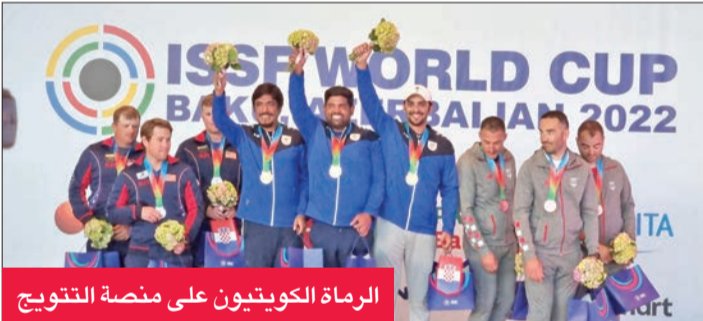
الرماة الكويتيون على منصة التتويج

إلى القيادة السياسية للبلاد وإلى الشعب الكويتي.