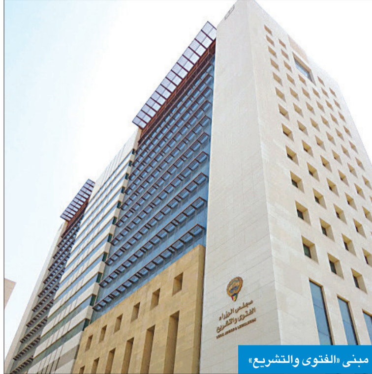
مبنى «الفتوى والتشريع»

الحقت بوزير الدولة لشؤون مجلس الوزراء بالمرسوم رقم 302 لسنة 2012، فإننا نقيد بأنه سبق أن أبدت الإدارة الرأي في شأن مدى صحة القرارات الصادرة عن نائب المدير العام لقطاعي الزراعة التجميلية والثروة النباتية بالهيئة العامة لشؤون الزراعة والثروة