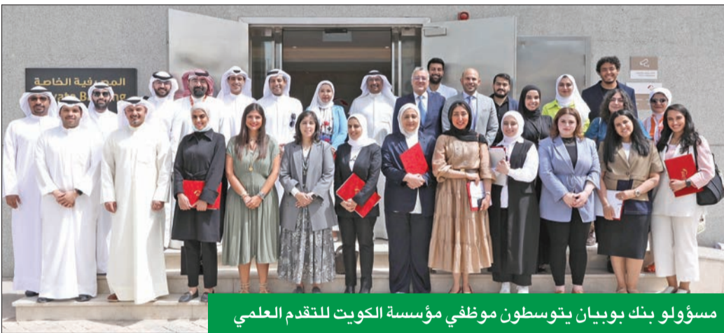
مسؤولو بنك بوبيان يتوسطون موظفي مؤسسة الكويت للتقدم العلمي

بمنظومة المؤسسات الإدارية بجانب ضبط الجودة. وأفاد بأن الدورة التدريبية أقيمت تحت إشراف فريق إدارة التطوير المستمر في بنك بوبيان، واستمرت 3 أيام، وشهدت مشاركة 25 موظفاً من مؤسسة الكويت للتقدم العلمي، وتم خلالها تناول أفضل أساليب التطوير، ورفع مستوى الأداء، من خلال تقنيات الحد من الوقت المستغرق للإجراءات والتركيز على تطويرها، مؤكداً أن المختصين في إدارة التطوير المستمر ببنك بوبيان سيتولون الإشراف على متابعة مبادرات ومشاريع المتدربين ومشاركتهم بعض الخبرات بجانب التنسيق والمتابعة مع الإداريين في المؤسسة فيما يتعلق بمراحل تطوير تلك المبادرات ومستجداتها.