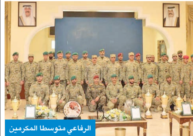
الرفاعي متوسطا المكرمين

كرم المتميزين والفرق الفائزة في الموسم التدريبي 2021/2022