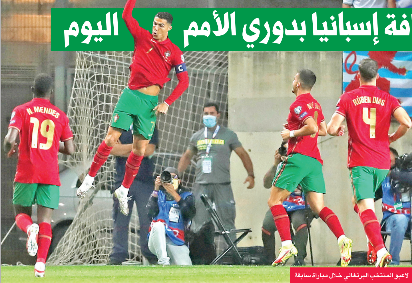
لاعبو المنتخب البرتغالي خلال مباراة سابقة

يحل المنتخب البرتغالي ضيفاً على نظيره الإسباني، اليوم، ضمن منافسات بطولة دوري الأمم الأوروبية لكرة القدم.