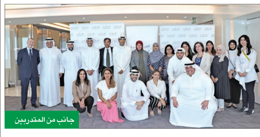
جانب من المتدربين

تزيد فرق عملنا بالمعرفة التي تساعد على تطبيق المعايير المحلية والعالمية وإدارة شؤون غسل الأموال، وغيرها من المخاطر بكفاءة وفاعلية. البرنامج التدريبي يجسد التزام فريق إدارة الثروات في (المركز) بتنمية ثروات العملاء عبر أفضل ممارسات الامتثال وأعلى مستويات الحماية. وضمن برامجه التدريبية ومبادراته المتواصلة، التي تهدف إلى تطوير كفاءة فرق عمله، نظم «المركز» أخيراً