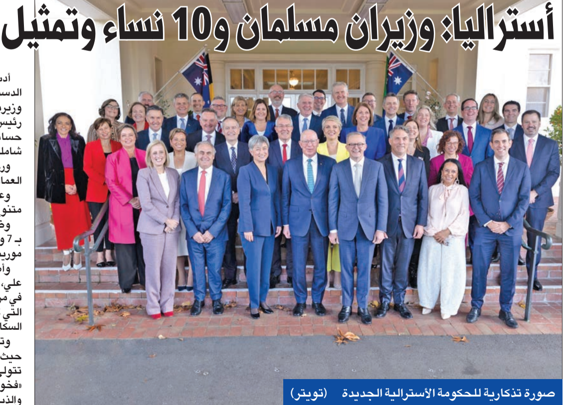
صورة تذكارية للحكومة الأسترالية الجديدة

وأصبح وزير الصناعة إد هوسيك ووزيرة الشباب أن علي، أول وزيرتين مسلمين في الحكومة الاتحادية، وذلك في مراسم بالعاصمة كانبرا. كما أصبحت ليندا بورني، التي كانت ترثدي عباءة من جلد الكفرو، أول امرأة من السكان الأصليين تتولى وزارة السكان الأصليين في البلاد. وتخضع الآن وزارتان من أهم الوزارات لقيادة نسائية، حيث تتولى كلير أونيل وزارة الشؤون الداخلية بينما تتولى حقيبة الخارجية بيني وونغ، التي عُزيت قائلة: «فخورة باستقبالنا أعضاء جددًا في تجمع حزب العمال والذين يعكسون الكثير من أستراليا الحديثة».