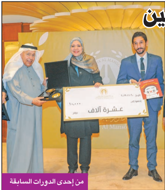
من إحدى الدورات السابقة