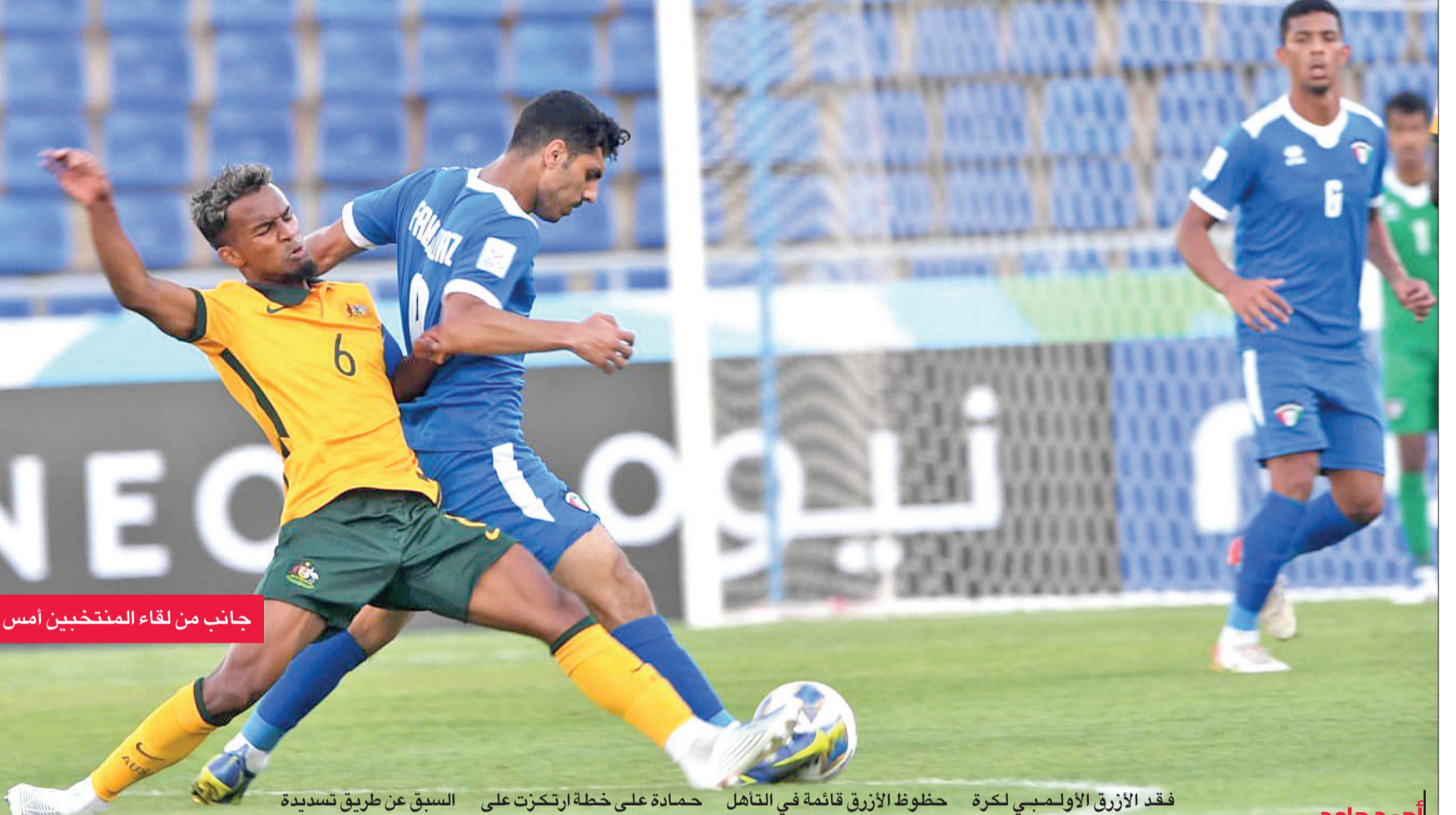
جانب من لقاء المنتخبين أمس

السبق عن طريق تسديدة من خارج منطقة الجزاء للويس داريغو، سكنت شبك عجاجي. ويعدّها تحرر الأزرق من الدفاع المتكامل، وبدأ في الظهور بالمناطق المتقدمة للمنتخب الأسترالي، إلا أن الشوط الأول انتهى بهدف من دون رد. وفي الشوط الثاني تكررت انكماش الأزرق في المناطق الدفاعية، وهو ما أعطى الفرصة مجدداً للمنتخب الأسترالي،