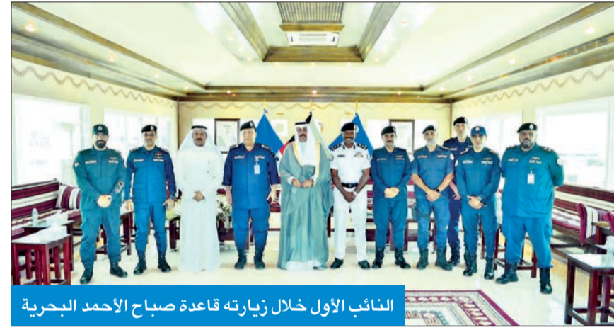
النائب الأول خلال زيارته قاعدة صباح الأحمد البحرية