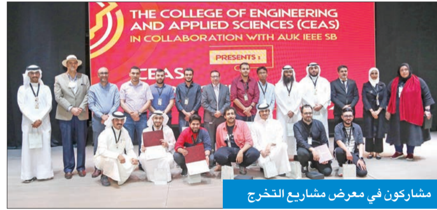
مشاركون في معرض مشاريع التخرج

الجامعة في المركز، «كما ندعم طلبة التسويق في الجامعة من خلال إجراء مسابقة، ومن يربح يطبق مشروعه في الشركة».