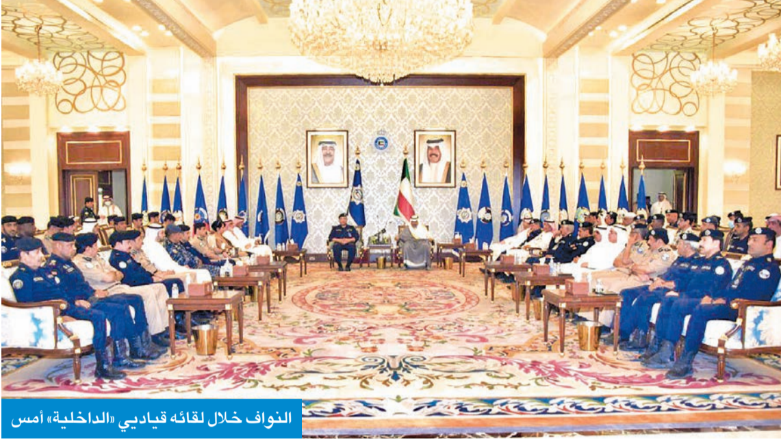
النواف خلال لقائه قيادتي «الداخلية» أمس

إحصائيات مكافحة المخدرات دليل على يقظتهم وتفانيهم في العمل ونشاطهم بزيادة الجهد والحفاظ على شبابنا