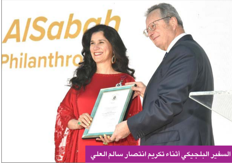
السفير البلجيكي أثناء تكريم انتصار سالم العلي

من جانبها، استهلته الشبيخة انتصار كلمتها قائلة: «عندما تمنح الجوائز غالباً ما تكون لشخص واحد يمثل القمة فقط للجيل جليدي يتكون أساسه من فريق عمل كله شغف وثقافة وعطاء بلا حدود، قد يكونون تحت الماء ولا يراهم المرادار. لكن الحقيقة أنهم صانعو هذا الجبل الجليدي العملاق من الإنجازات». وتابعت، بداية أحب كثيراً أن أشكر والدي ووالدي فهما أساس ما أنا عليه الآن، وكذلك أشكر إخوتي وإخواني لتفوقهم وتميزهم كل في مجاله، لذلك لم يكن لدي أي خيار إلا التائق والأزهار ملتهم. وبناتي الرائعات الغائبات أحبكم وايد... لقد بارك ربي فيني عندما أصبحت أمم... وأمل أن أكون ملتهمك أيضاً لتصبحوا أفضل ما يمكنكم أن تكونوا عليه». واستطردت: «كم أنا محظوظة أيضاً بمجموعة مميزة من النساء والرجال الداعمين لي، فقد اجتمعوا معاً لهدف سام هو إحداث فرق كبير في الكويت والعالم العربي. مجموعة من الأفراد من ذوي الرؤية الرائدة لما يمكن أن تأتي به الإيجابية ويمكن أن يحدثه السلام لمجتمعاتنا، وفي بلدنا والمنطقة، لماذا الإيجابية والسلام؟ لأن الحياة ببساطة ستكون أفضل لنا جميعاً عندما ننظر للحياة بإيجابية، ليس فقط أنها تجعلنا شخصياً أكثر سعادة وإنجازاً وأفضل صحياً ونفسياً، لكنها أيضاً تستضئ لنا العيش بهدف خدمة الإنسانية، وهذا لن يحدث إلا عندما يرى