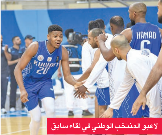
لاعب المنتخب الوطني في لقاء سابق