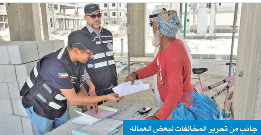
جانب من تحرير المخالفات لبعض العمالة

60% من العمالة المخالفة للقرار منزلية هاربة وتعمل في القطاع الأهلي