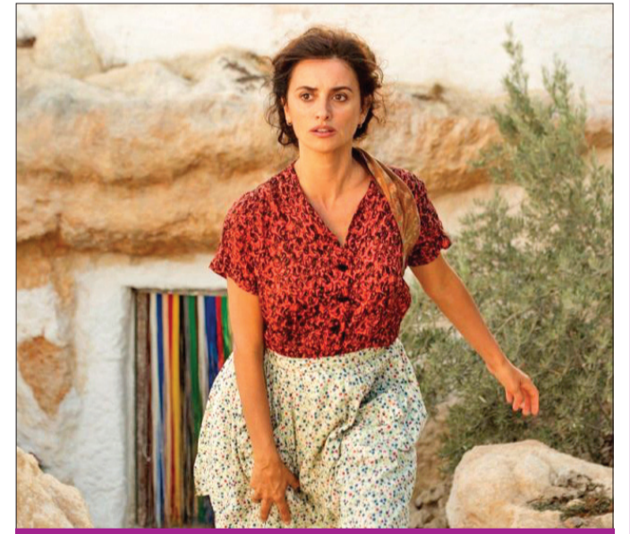
كروز في أحد أعمالها

فازت الممثلة العالمية بينيلوب كروز بالجائزة الوطنية الإسبانية للأفلام لعام 2022، حيث منحتها لجنة التحكيم، هذه الجائزة البالغة قيمتها 30 ألف يورو، بالإجماع بعد عام 2021 المليء بنجاحاتها الدولية، مع الأخذ في الاعتبار أنها أصبحت في العام الماضي أول فنانة إسبانية تفوز بكأس «فولبي» في مهرجان البندقية، بالإضافة إلى ترشيحها الرابع لجوائز الأوسكار، الأمر الذي رفع مكانتها كأكبر ممثلة إسبانية ترشيحاً في التاريخ.