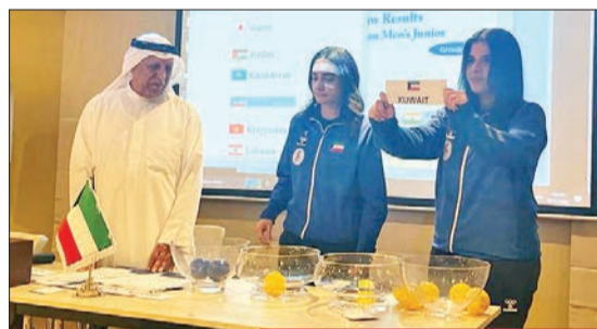
جانب من مراسم سحب القرعة

كما أعرب عن امتنانه وشكره الجزيل للاتحاد البحريني على استضافته بطولتي آسيا المقبلتين، وأضاف: «القرعة عادلة في بطولتي الشباب والناشئين، وأتمنى أن تقدم جميع المنتخبات المشاركة في البطولة أفضل مستوى فني ممكن لحجز بطاقات التأهل لبطولتي العالم المقبلتين».