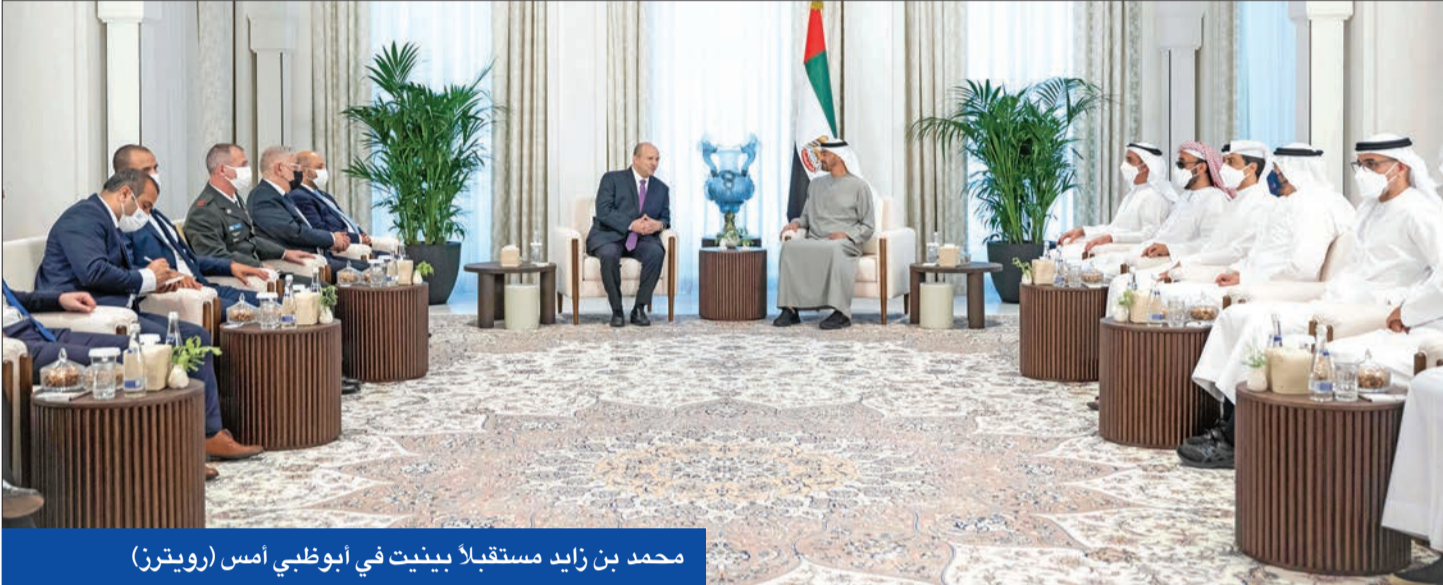
محمد بن زايد مستقبلاً بينيت في أبو ظبي أمس

في سياق آخر، ذكرت مصادر مطلعة أن محكمة يونانية ألغت حكماً قضائياً سمح للولايات المتحدة بمصادرة جزء من شحنة نفط إيراني من ناقلة ترفع علم إيران قبالة سواحل اليونان. وأثار الحادث رد فعل غاضباً من طهران، إذ احتجزت قواتها الشهر الماضي ناقلتين يونانيتين في الخليج بعد أن أُنذرت إيران بأنها ستتخذ «إجراءات عقابية» ضد أثينا. على صعيد منفصل، قتل شخصان وأصيب أربعة آخرون بانفجار مبنى مؤلف من 3 طوابق في بلدة نوسود بمحافظة كرمانشاخ في غرب إيران، وذلك بعد أسبوعين من فاجعة انهيار مبنى «متروبول» التي خلفت 43 قتيلًا وتصبحت في إطلاق موجة احتجاجات بعدة محافظات جنوب غرب البلاد. (أبو ظبي، طهران - وكالات)