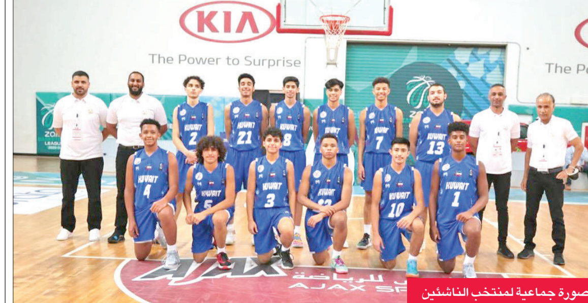
صورة جماعية لمنتخب الناشئين

فرصة لكسب الخبرات مع أهم منتخبات القارة. وقال إن «أزرق» الناشئين يسعى إلى تقديم مستوى جيد في البطولة رغم بعض الصعوبات التي واجهها المنتخب لتزامن الاستعدادات النهائية في الفترة السابقة مع فترة اختبارات الطلبة.