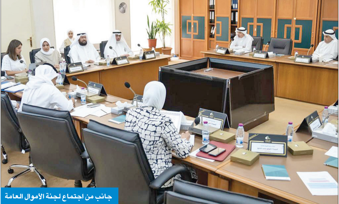
جانب من اجتماع لجنة الأموال العامة

بالتقارير والبيانات المتعلقة بالمشروعات السياحية في الكويت، واستعرضت البيانات والمستندات التي تم تزويدها بها في شأن مدى التزام الشركة بتصويب ملاحظات «المحاسبة»، وهو ما سيتم تضمينه في تقرير اللجنة الذي سيرفع قريباً إلى مجلس الأمة. إلى ذلك، وجه الطريجي سؤالاً إلى وزير المالية وزير الشؤون الاقتصادية والاستثمار عبدالوهاب الرشيد، قال فيه إنه بالإشارة إلى قيام لجنة حماية