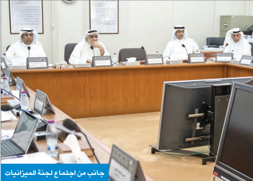
جانب من اجتماع لجنة الميزانيات

عدم اتخاذ الهيئة إجراءات جادة لتسوية ما سجل عليها من ملاحظات وأوضح أن ممثلي ديوان المحاسبة أشاروا إلى استمرار عدم تمكنهم من القيام بدورهم الرقابي المنوط لهم قانوناً، من خلال عدم تزويدهم بالمستندات التي يقومون بطلبها من الهيئة. وبيّن أن ممثلي الديوان أشاروا إلى أن ملاحظة «عدم تمكن الهيئة ديوان المحاسبة من ممارسة دوره، مستمرة في تقريرهم لأكثر من سنة مالمية» وأشار إلى ان اللجنة طالبت الهيئة باتخاذ إجراءات جادة لتسوية ما سجله ديوان المحاسبة من ملاحظات، كما أكدت ضرورة تمكين الديوان من القيام بدوره الرقابي، وتزويده بما يطلبه من مستندات إحصائية للمعمل الرقابي، وأن ذلك الأمر يع أساساً في تحديد موقعها بالموافقة على ميزانية الجهات وحساباتها الختامية من عدمه.