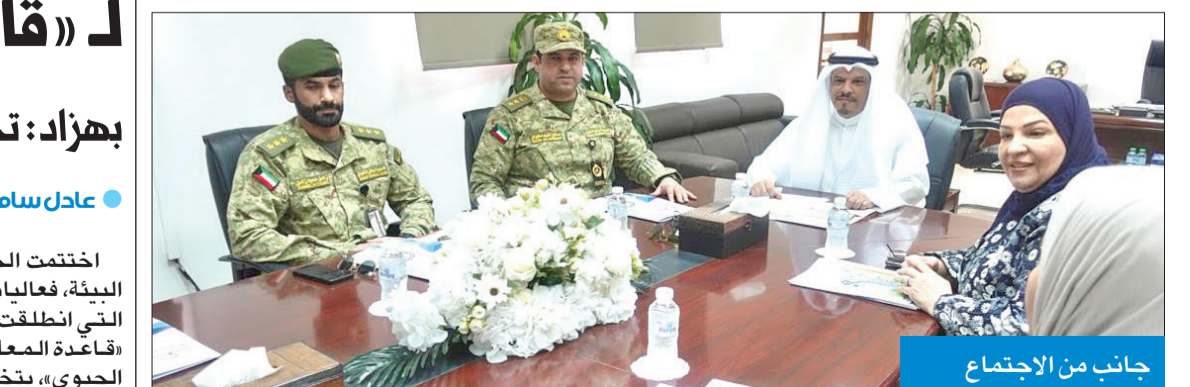
جانب من الاجتماع

العلاقات مع مؤسسات المجتمع المدني ومن ضمنها الرئاسة العامة للحرس الوطني بما يكفل الارتقاء بالمعرفة العلمية والثقافية والتقنية وتطوورها بكل تطبيقاتها وصولاً للأهداف المنشودة.