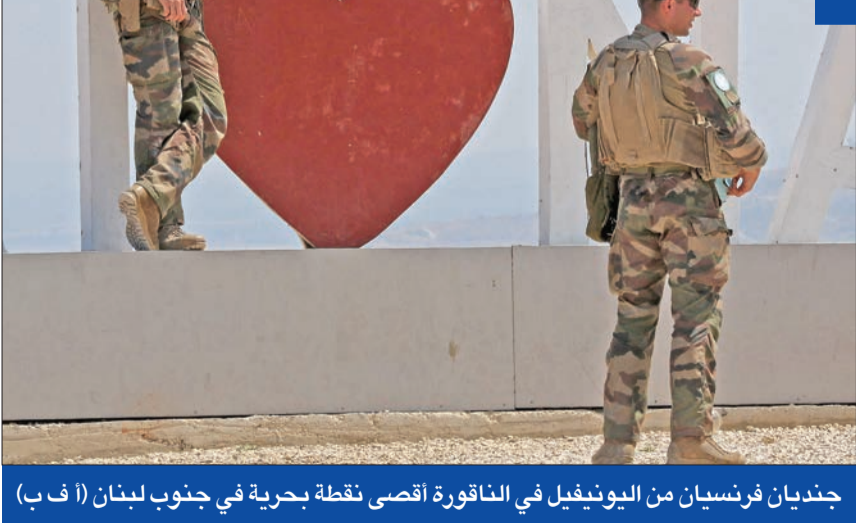
جنديان فرنسيان من اليونيفيل في الناقورة أقصى نقطة بحرية في جنوب لبنان

تقدمه هوكشتاين، وسيركز على المطالبة بمساحة 860 كلم مربع كاملة، إضافة إلى حقل كاريش، مع اعتماد صيغة «لا غاز من كاريش من دون غاز من قانا»، وقال عون أمس إن «ترسيم الحدود يندرج في إطار المفاوضات الدولية هو من صلب مسؤوليات رئيس الجمهورية، استناداً إلى المادة 52 من الدستور».