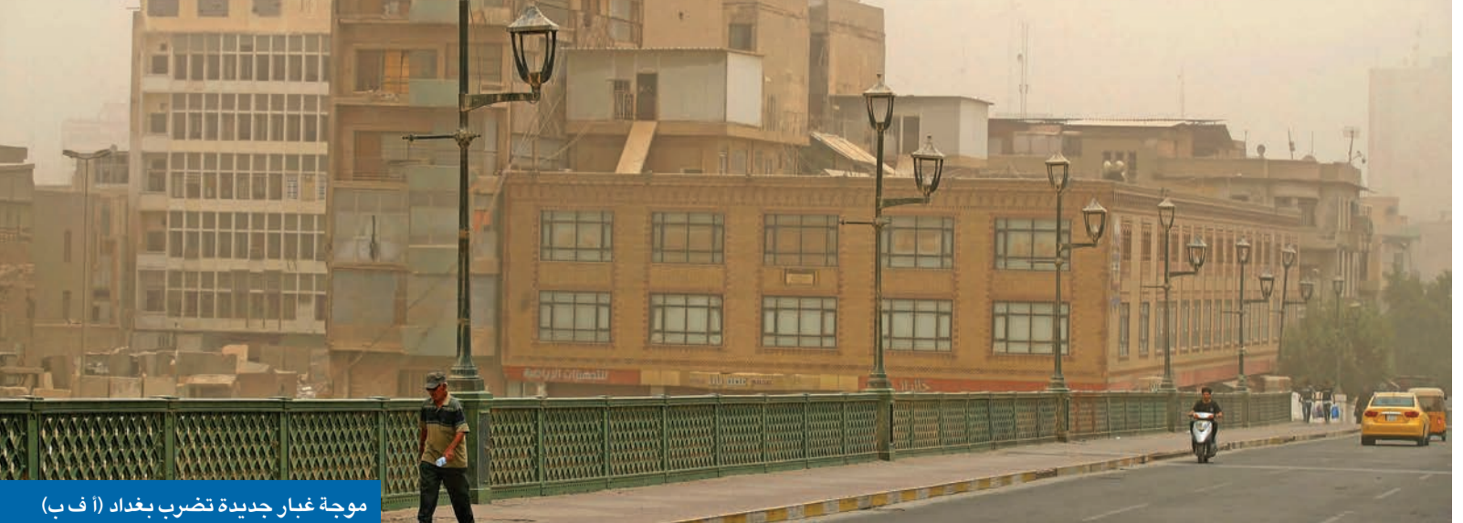
موجة غبار جديدة تضرب بغداد

البارزاني أكبر المتضررين... والصدريون لضبط اللعبة من الشارع