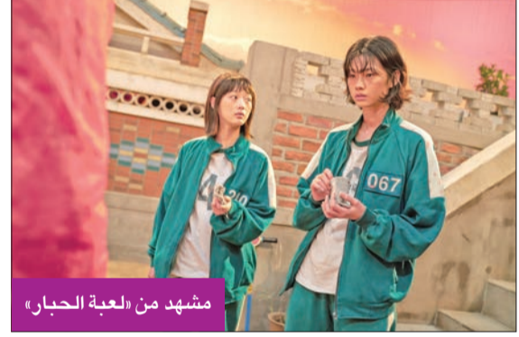
مشهد من «لعبة الحبار»

أعلنت شبكة «نتفليكس» للبت المباشر إطلاق الجزء الثاني من مسلسل «لعبة الحبار»، أو Squid Game 2. وذكرت صحيفة نيويورك ديلي نيوز أن «نتفليكس» أعلنت، أمس الأول، عن موسم ثان من المسلسل الذي حقق نسبة مشاهدة قياسية على مستوى العالم. ولم تقدم «نتفليكس» التي وصفت الموسم الثاني بأنه «جزء جديد بالكامل»، أي تفاصيل أخرى، بما في ذلك موعد العرض. وأصبح «لعبة الحبار» أكثر المسلسلات مشاهدة على منصة نتفليكس عندما بدأ عرضه في سبتمبر 2021. ويتناول المسلسل قصة 456 متسابقاً يعانون ضائقة مالية فيكافحون من أجل النجاة بحياتهم في منافسة بأشعة، ويعلمون ألعاب أطفال للحصول على فرصة لكسب مبالغ مالية تغير حياتهم وهي جائزة كبرى قيمتها 36 مليون دولار.