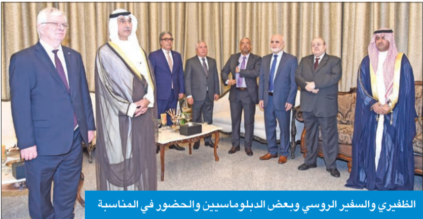
الظفيري والسفير الروسي وبعض الدبلوماسيين والحضور في المناسبة