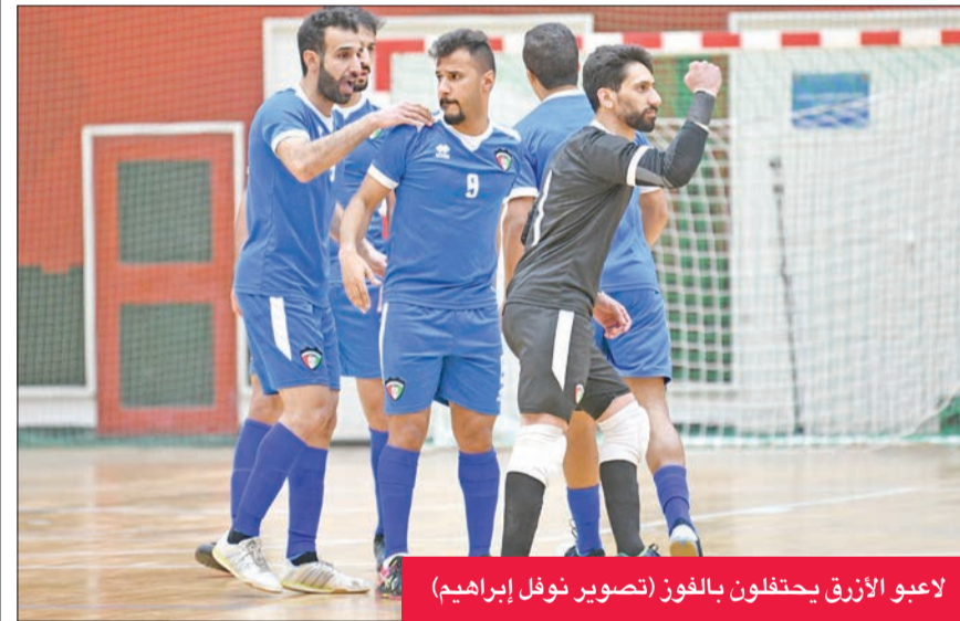
لاعب الأزرق يحتفلون بالفوز

توج منتخبنا الوطني الأول لكرة القدم للصالات بلقب بطولة غرب آسيا الرابعة بفوزه على شقيقه السعودي 5-3 في المباراة، التي جمعت بينهما مساء أمس، على صالة قشيعان المطيري بنادي النصر.