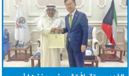
الفهد مستقبلاً تشويغ بيونغ ها أمس