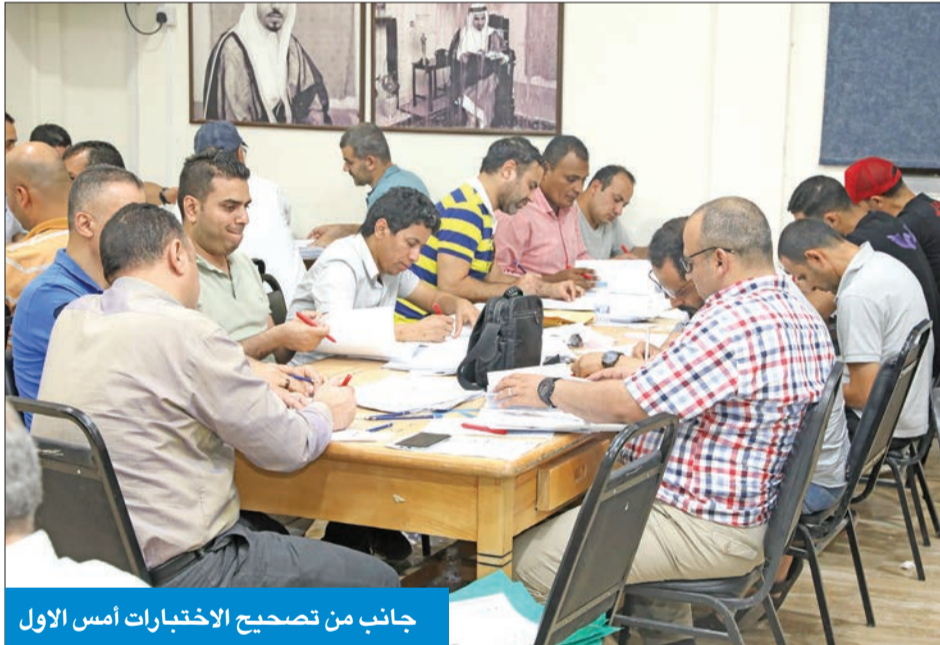
جانب من تصحيح الاختبارات أمس الأول