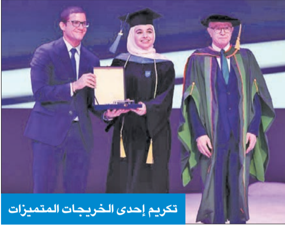
تكريم إحدى الخريجات المتميزات

الكلية احتفلت بتخريج كوكبة من طلبة البكالوريوس والدبلوم... وانطلاق الجامعة في الكويت