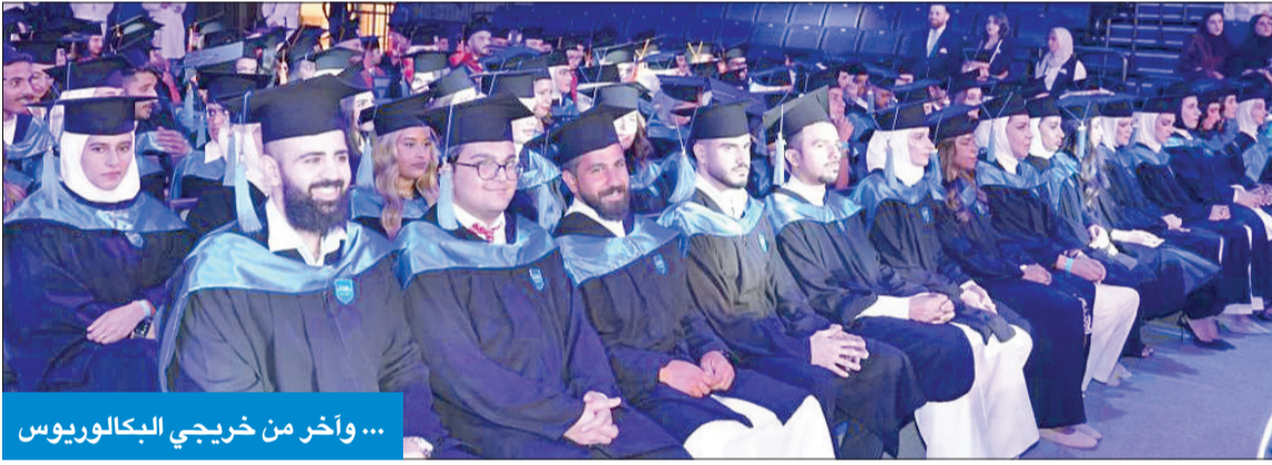
... وآخر من خريجي البكالوريوس