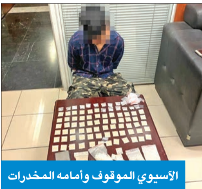
الأسوي الموقوف وأمامه المخدرات

محمد الشهران أظهرت الإحصائية الأسبوعية لقطاع الأمن العام أن القطاع في مديريات الأمن بالمحافظات الست وسرية المهام الخاصة بالأمن العام، تعاملت خلال الأسبوع الماضي مع 2263 بلاغاً وردت إلى غرفة العمليات عبر هاتف الأمان بوزارة الداخلية، وقدمت 826 مساعدة إنسانية. وكشفت الإحصائية أن رجال الأمن العام، بإشراف وكيل وزارة الداخلية المساعد لشؤون الأمن العام اللواء فراج الزعبي، أقاموا خلال الأسبوع الماضي 653 نقطة تفتيش أمنية أسفرت عن ضبط 18 شخصاً تبين أنهم مطلوبون جنائياً وصادرة بحقهم أحكام بالحبس واجبة النفاذ، مشيرة إلى أن رجال الأمن تمكنوا من خلال الدوريات الأمنية الثابتة والمتحركة ونقاط التفتيش من ضبط 432 مخالفاً لقانون الإقامة والعمل، و222 وأداة مسجلة بحقهم قضايا تغيب. وأوضحت أن رجال الأمن العام ضبطوا 294 شخصاً لا يحملون أذيات شخصية، كما تم تقديم 826 مساعدة أمنية فضلاً عن التواجد الأمني في 718 بلاغاً متنوعاً. وأظهرت أن رجال قطاع الأمن العام تمكنوا من تحرير 1976 مخالفة مرور متنوعة، وضبط وإحالة 4 مركبات مطلوبة لجهات أمنية وقضائية وصادرة بحقها أوامر ضبط وإحضار، إلى كراج الحجز بالإدارة العامة للمرور، فضلاً عن تعاملهم مع 692 حادثاً مرورياً.