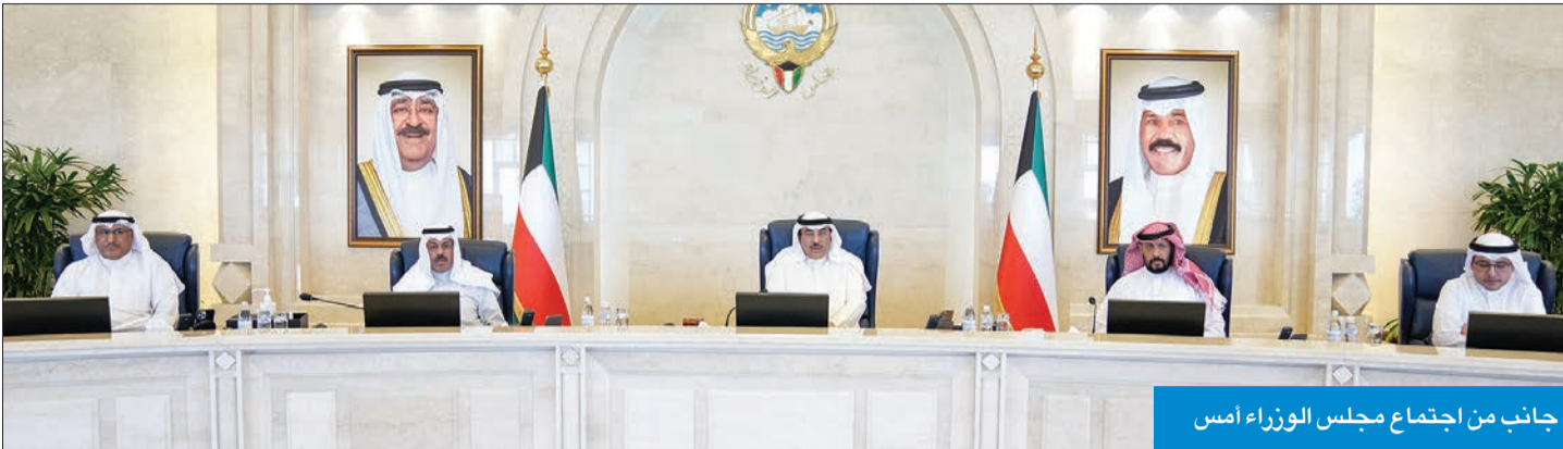
جانب من اجتماع مجلس الوزراء أمس

وأقر مجلس الوزراء على حضور الحكومة جلسة مجلس الأمة اليوم لإقرار منحة الـ 3 آلاف دينار، وقانون المتقاعدين وصرف 500 مليون دينار سنوياً لسد العجز الاكتواري.