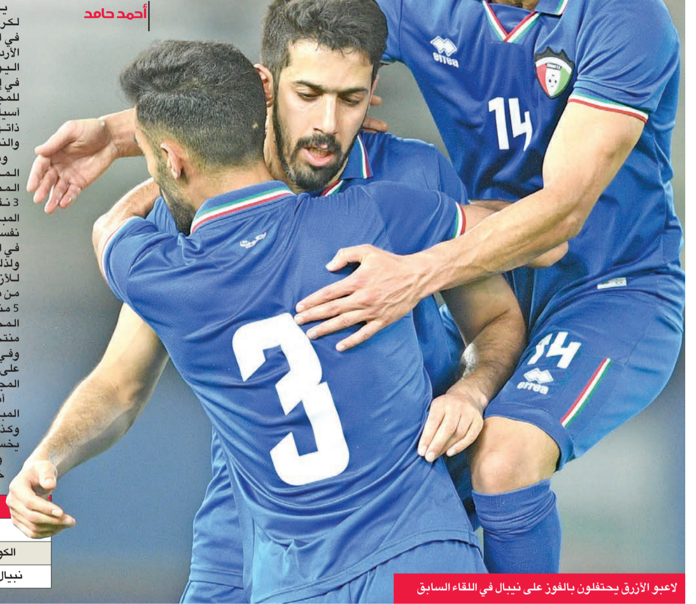
لاعب الأزرق يحتفلون بالفوز على نيبال في اللقاء السابق

يرفع منتخبنا الوطني الأول لكرة القدم شعار الفوز ولا غيره في مواجهة المرتقبة أمام نظيره الأردني في السابعة والربع من مساء اليوم، على استاد جابر الدولي، في إطار منافسات الجولة الأخيرة للمجموعة الأولى والمؤهلة لكأس آسيا 2023، كما يلتقي في المجموعة ذاتها المنتخبان الأندونيسي والنيبالي.