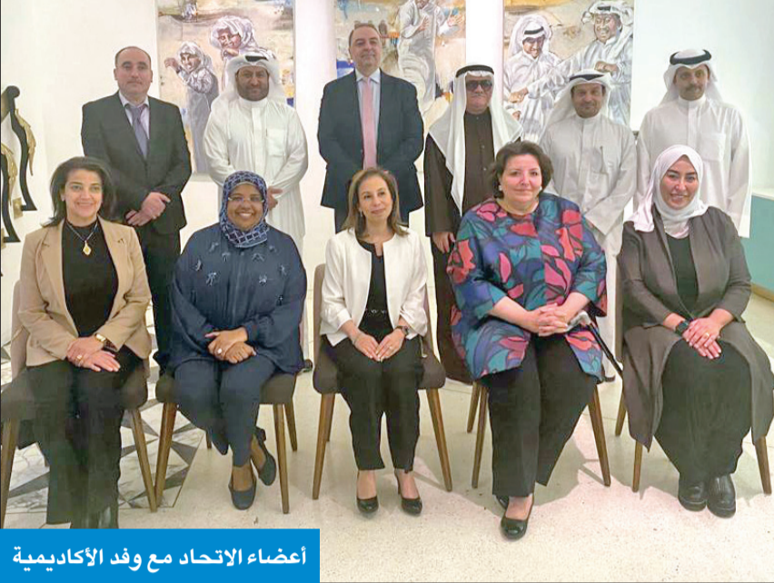
أعضاء الاتحاد مع وفد الأكاديمية