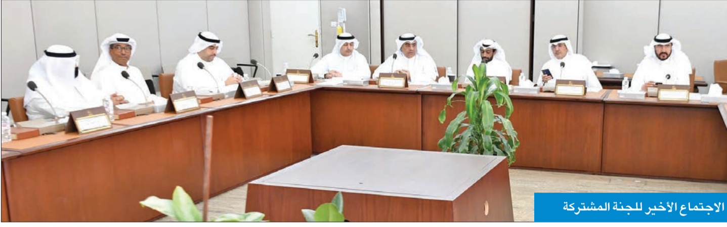
الاجتماع الأخير للجنة المشتركة

وسط تفاؤل بانعقاد الجلسة وتأكيد مصدر وزاري حضور الحكومة لها، رفعت اللجنة المشتركة من لجنتي الشؤون المالية والاقتصادية، والشؤون التشريعية والقانونية، إلى مجلس الأمة تقريرها التكميلي بشأن مشروع قانون مصرف منحة مالية لأصحاب المعاشات التقاعدية والمستحقين عنهم، وتعديل بعض أحكام قانون التأمينات الاجتماعية الصادر بالأمير الأميري بالقانون رقم (61) لسنة 1976، والمقرر التصويت عليه في جلسة اليوم في حال انعقاد الجلسة وحضور الحكومة.