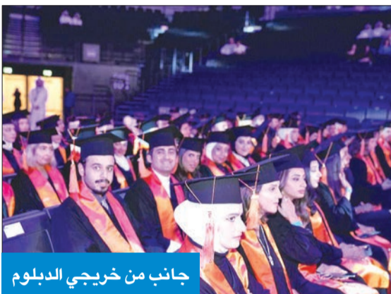
جانب من خريجي الدبلوم

وذكر زعبلاوي أن الجامعة عملت على تحقيق التميز في التعليم والتعلم والبحث العلمي وخدمة المجتمع، لتقديم خريجين مؤهلين يتمتعون بالمهارات والقدرة، جاهزين للانخراط في سوق العمل، من خلال تطوير وطرح برامج دراسية محدثة متكاملة كانت نتاج تعاون مثمر مع القطاع الصناعي من خلال المجالس الاستشارية الصناعية التي أنشأتها الجامعة على مستوى الجامعة والكليات.