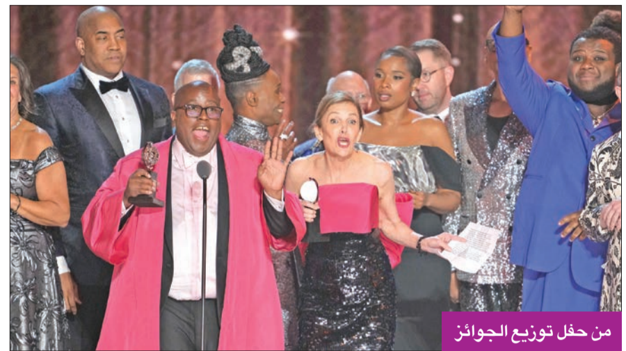
من حفل توزيع الجوائز

فازت مسرحيتان عن المال والتنوع بنصيب الأسد في جوائز توني المسرحية، الأولى مسرحية عن مصرف «ليمان برانرز» والأخرى استعراضية عن النجم الراحل مايكل جاكسون. وتم توزيع الجوائز، التي تكافئ أفضل الأعمال على خشبات برودواي، في نسخة أعادت الزخم لهذا الحدث بعد الجائحة، أمس الأول. وكانت ضيفة الحفل النجمة العالمية حائزة الأوسكار أريانا دييوز، التي نالت جائزة أوسكار عن دورها في فيلم «ويست سايد ستوري»، مؤكدة لدى وصولها إلى قاعة مسرح «راديو سيتي ميوزيك هال»، اعترافها بجهود برودواي للانفتاح أكثر على التنوع وأعمال السود، كما شاركت في عرض افتتاح حفل توزيع الجوائز. واقامت هذه المكافآت التي توصف بأنها «أوسكار المسرح»، بدورها الخامسة والسبعين ونقلت على قناة «سي بي إس»، متوجة موسماً تشهد تجديداً للمسرح في العاصمة الثقافية الأميركية التي استأنفت نشاطها خلال الخريف الفائت بعد إغلاق استمر 18 شهراً بسبب «كوفيد 19». وفي مدينة وول ستريت، هيمنت على الاحتفال مسرحية عن الأسواق المالية تحمل اسم «ذي ليمان تريلوجي»، إذ فازت بخمس جوائز بينها عن فئة أفضل مسرحية وأفضل ممثل «سامين راسل بيل» وأفضل مخرج مسرحي «سام ميندينس». وتروي مسرحية الإيطالي ستيفانو ماسيني المسيرة الطويلة لمصرف «ليمان برانرز» الأميركي، الذي أسس في منتصف القرن التاسع عشر على يد 3 أشقاء مهاجرين من ألمانيا، وصولاً إلى سقوطه المدوي سنة 2008 الذي شكّل شرارة أزمة مالية عالمية. كذلك، نالت مسرحية «إم جي ذي ميوزيكل» عن سيرة مايكل جاكسون 4 جوائز بينها أفضل ممثل في مسرحية استعراضية لمابلز فروست البالغ 22 عاماً. وكان لاثنتين من أبناء النجم الذي توفي سنة 2009 عن 50 عاماً، وهما باريس وبريس جاكسون، ظهور