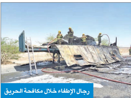
رجال الإطفاء خلال مكافحة الحريق