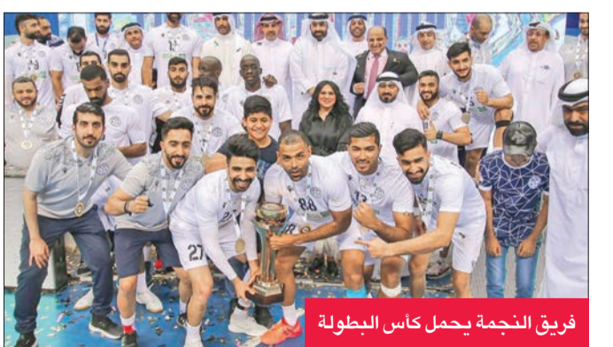
فريق النجمة يحمل كأس البطولة