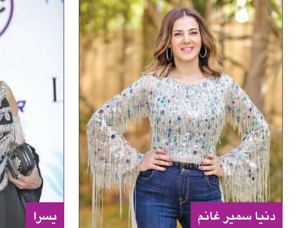
دنيا سمير غانم