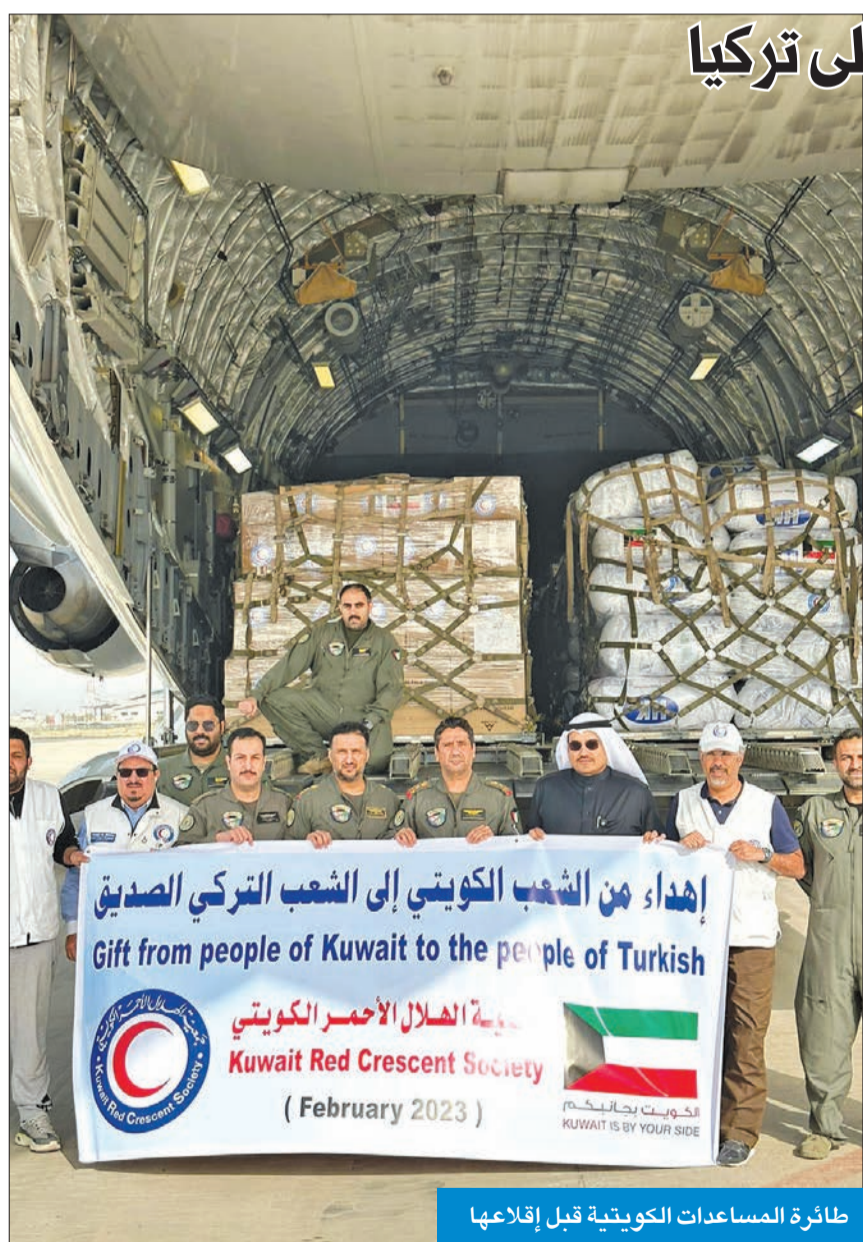
طائرة المساعدات الكويتية قبل إقلاعها

تابعة للقوة الجوية الكويتية أقلعت صباح أمس محملة بمواد إغاثية تقدر بحوالي 42 طناً، بالإضافة إلى اطعم «شفاة الطبية» التابعة لبيت الزكاة الكويتي لتجنيب تركيا لمساعدة المتضررين من الزلزال. وأضاف العوضي أن جسر الإغاثة الجوي لمتضرري الزلزال في الجمهورية التركية مستمر، إذ هناك عدد من الطائرات يتم تجهيزها بالتعاون والتنسيق مع «الهلال الأحمر» وجهات حكومية أخرى، ولجان خيرية وإغاثية لنقل المساعدات الطبية والإغاثية والمعيشية إلى المناطق المنكوبة في تركيا.