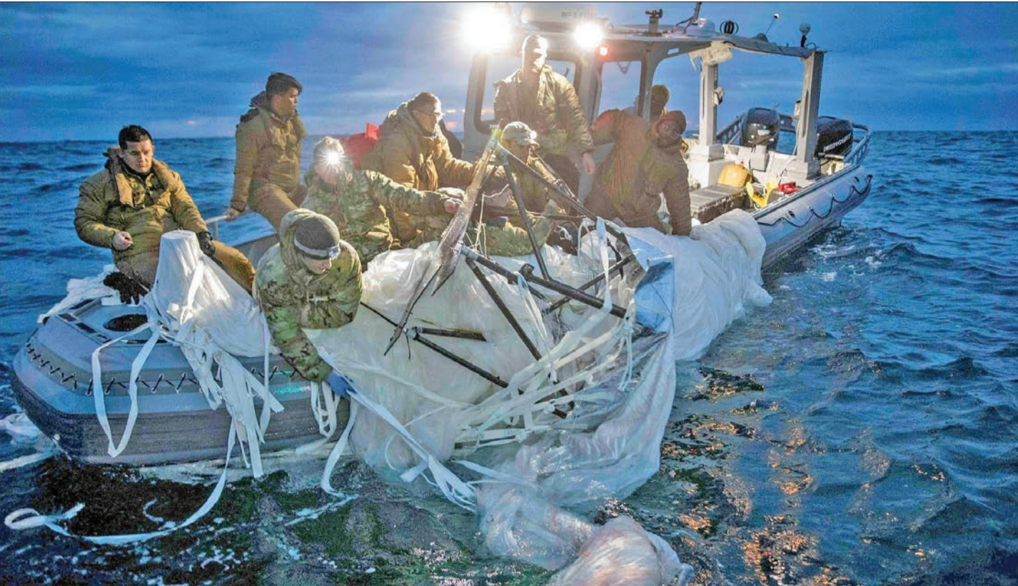
بحارة اميركيون يستعيدون أجزاء من المنطاد الصيني في المياه الإقليمية الأميركية قبالة ساوث كارولينا

الولايات المتحدة تسترجع أجزاء من المنطاد بها معدات مراقبة وتضيف 6 شركات صينية للقائمة السوداء