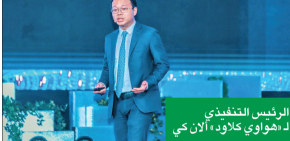
الرئيس التنفيذي لـ «هواوي كلاود» آلان كي

أعلنت «هواوي»، خلال مؤتمر «ليب 2023» التقني، أنها ستستثمر 400 مليون دولار خلال السنوات الخمس المقبلة لإنشاء منطقة مخصصة للحوسبة السحابية في السعودية. وسيشهد إطلاق «هواوي كلاود» HUAWEI CLOUD بتوفير الخدمات السحابية المتطورة والأمن، لتسهيل أعمال الشركات المحلية والمؤسسات والهيئات الحكومية في المملكة. وتأتي هذه الخطوة في إطار التزام الشركة بدعم خطط المملكة لتعزيز التحول الرقمي، ودفع عجلة التنمية الاجتماعية والاقتصادية فيها. وتؤمن «هواوي» بأهمية دور السحابة باعتبارها أساس التحول الرقمي والمحرك الرئيسي لعالم رقمي ديناميكي، حيث توفر السحابة للبيانات الأساسية للتقنيات المتقدمة الأخرى التي تقود عالمنا الرقمي، مثل: الذكاء الاصطناعي، وتترنت الأشياء، والبيانات الضخمة، والبلوكتشين، وغيرها. وبمساعدة العملاء على اعتماد السحابة بسهولة والاستفادة منها بالشكل الأمثل، ومنحهم وصولاً سريعاً إلى التقنيات والتطبيقات الرائدة القائمة على السحابة، ودعم أهدافهم الرامية لإطلاق قدرات التقنيات الرقمية، تدعو «هواوي كلاود» إلى اتباع نموذج «كل شيء كخدمة»، الذي يستند إلى ثلاثة أسس، هي: «البنية التحتية كخدمة»، و«التكنولوجيا كخدمة»، و«الخبرة كخدمة». ولا يسهم هذا النموذج في دفع عجلة التحول الرقمي فحسب، بل الحد من البصمة الكربونية للبنية التحتية لتقنية المعلومات، وتطوير التطبيقات والعمليات التجارية، وتعزيز الابتكار في المؤسسات.