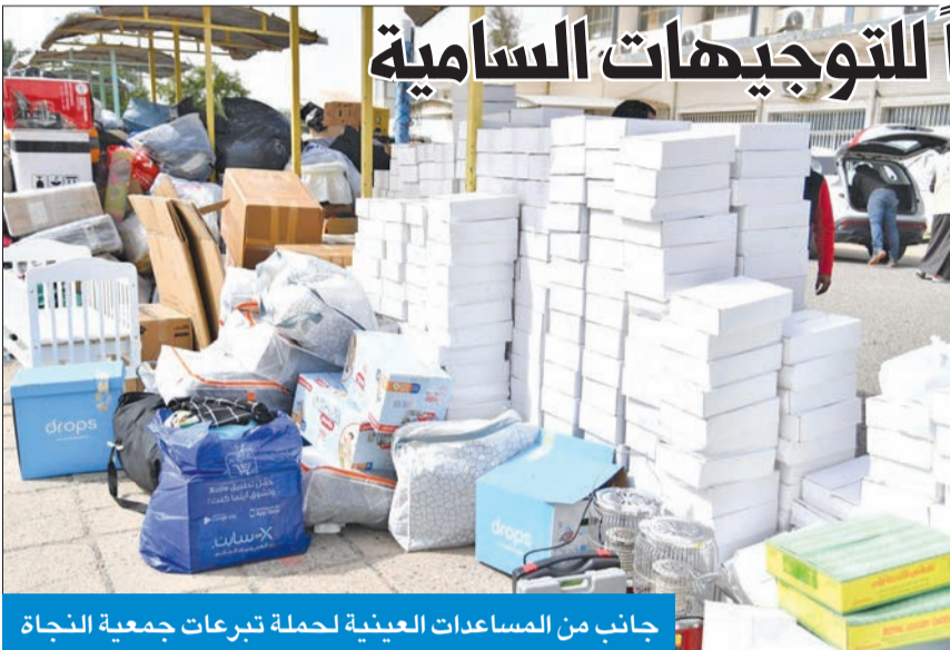
جانب من المساعدات العينية لحملة تبرعات جمعية النجاة

الأولى تستقبل التبرعات العينية من أغذية وملابس وأجهزة كهربائية جديدة وغير مستعملة والمرسلة لتركيا بالتنسيق مع سفارتها لدى البلاد والجهات الرسمية هناك، داعياً الجميع إلى الإسهام في الحملة عبر منصات الجمعية وموقعها الرسمي، بهدف تخفيف آثار الأزمة الإنسانية.