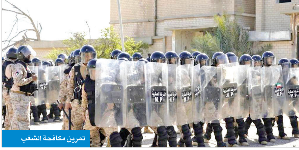
تمرين مكافحة الشغب

وأوضح العوضي أن التمرين يحتوي على تدريبات مكافحة الشغب، وتدريبات الأمن والسيطرة، وتأمين المواقع الحيوية، وكذلك تأمين المواقع العسكرية، وتنظيم نقاط التفتيش الثابتة والمتحركة، إضافة إلى تمارين الرمايات المختلفة. ولفت إلى أن تمرين «مبارك 2» يُعد من التمارين التعويبية الدورية التي تنفذها مديرية الشرطة العسكرية لمختلف وحداتها.