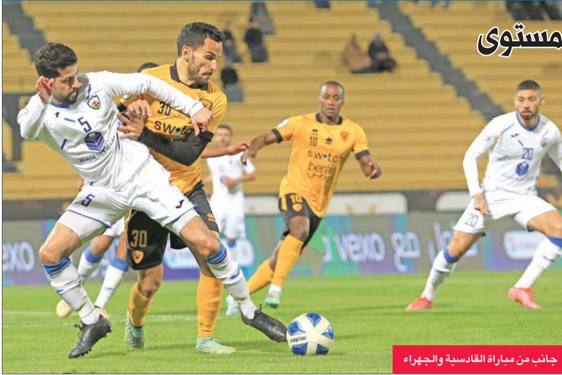
جانب من مباراة القادسية والجهراء

هائلة للنصر من المركز قبل الأخير (التاسع) إلى الخامس، وتراجع التضامن إلى التاسع، في حين يعاني الفحيحيل والسالمية والقادسية من التواجد في مراكز متأخرة من السادس إلى الثامن بنفس الرصيد من النقاط (16 نقطة). وشهدت هذه الجولة ارتفاعاً ملحوظاً في المستوى، وكانت النتيجة معلقة في ثلاث مباريات، في حين جاء فوزا العربي والنصر بسهولة تامة. وتعد مباراة السالمية والفحيحيل هي الأقوى، بسبب تبادل الفريقين التقدم، واستمرار المتعة والإثارة حتى الدقيقة الأخيرة، في حين يصعب اختيار المباراة الأسوأ في هذه الجولة، حتى في ظل الفوز السهل للعربي والنصر، لكن كل فريق منهما قدم مستوى جيداً.