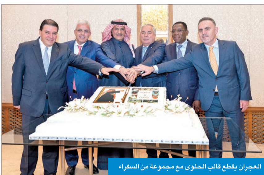
العجran يقطع قالب الحلوى مع مجموعة من السفراء

النبيلة خلال عمله في وزارة الخارجية، وعلى جهوده الطبية وإنجازاته المتميزة والمشهود لها، والتي قدمها لدولة الكويت العزيزة.