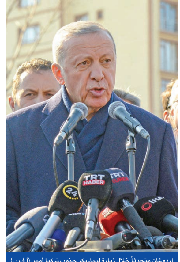
إردوغان متحدثاً خلال زيارة لدياربيكو جنوب تركيا أمس

في وقت تنجته مؤشرات الكارثة الناجمة عن الزلزال المدمر الذي ضرب طرفي الحدود التركية السورية الاثنين الماضي لتسجيل أرقام قياسية مع تجاوز عدد القتلى في البلدين 27 ألفاً، 21 ألفاً منهم أخصتهم أفرقة وحدها حتى الآن، طرحت الكارثة الأعباء على الإطلاق التي تضرب تركيا منذ عام 1939، عدة أسئلة بشأن وجود احتمالات لتفادي تلك المأساة الهائلة وتساؤلات عن مستقبل الرئيس التركي رجب طيب إردوغان الذي أطلق الوجود بإعادة إعمار المناطق المنكوبة في غضون عام واحد فقط.