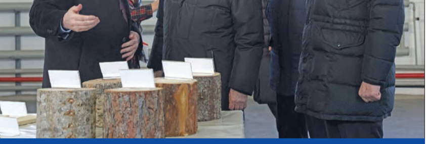
الرئيس فلاديمير بوتين يزور مجمع الأخشاب في أرخانغلسك أمس الأول

ورفضت رومانيا ادعاء القائد الأعلى لأوكرانيا بان صاروخي «كروز» روسيين عبرا المجال الجوي للعصف في حلف شمال الأطلسي (الناتو)، بينما استدعت مولدوفا السفير الروسي، بعد مرور المقدوفتين فوق أراضيها، وسقطت 17 قذيفة في منطقة زابورجيا، خلال ساعة، وهو ما وصفه الحاكم الإقليمي أناتولي كوريباف بأنه «أكبر عدد منذ