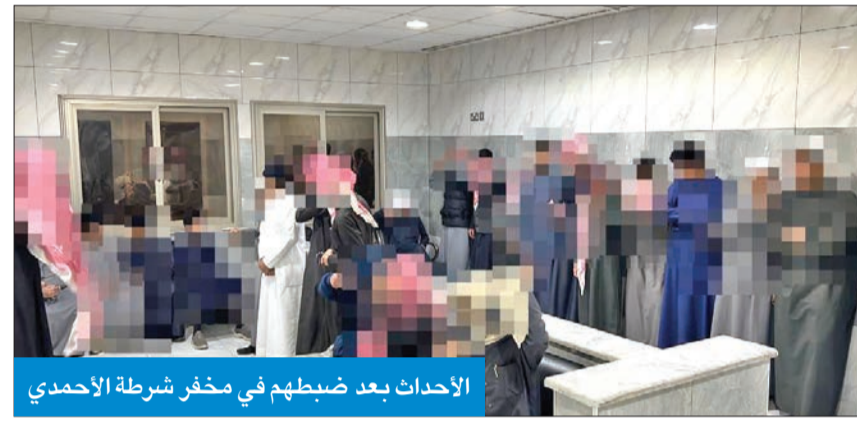
الأحداث بعد ضبطهم في مخفر شرطة الأحمدي