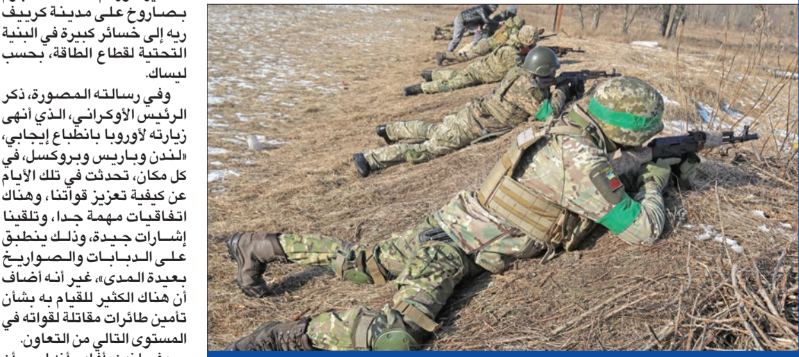
الجيش الأوكراني يدرّب عسكريين أجانب متقاعدين في خاركييف أمس الأول

ورفضت رومانيا ادعاء القائد الأعلى لأوكرانيا بان صاروخي «كروز» روسيين عبرا المجال الجوي للعصف في حلف شمال الأطلسي (الناتو)، بينما استدعت مولدوفا السفير الروسي، بعد مرور المقدوفتين فوق أراضيها، وسقطت 17 قذيفة في منطقة زابورجيا، خلال ساعة، وهو ما وصفه الحاكم الإقليمي أناتولي كوريباف بأنه «أكبر عدد منذ