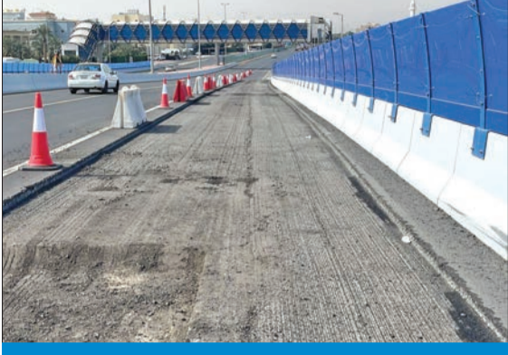
جسر مشرف - بيان بعد عمليات كشط الأسفلت التالف

وقالت مصادر «الطرق» لـ «الجريدة»، إن الهيئة لديها فرق دورية تتمر على الطرق السريعة في البلاد بشكل يومي وأسبوعي وشهري، لرصد جميع المشاكل التي قد تحدث على الطرق السريعة، وبيان أسبابها، ومن ثم الإسراع في معالجتها بعد التنسيق مع «المرور». وأرجعت «الطرق» تشقق