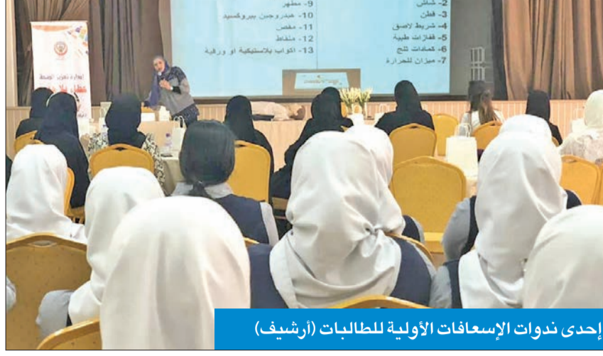
إحدى ندوات الإسعافات الأولية للطلاب (أرشيف)

دمج المقرر مع «التوعية المرورية» وتدرسه ضمن المواد الأساسية في المرحلة الثانوية