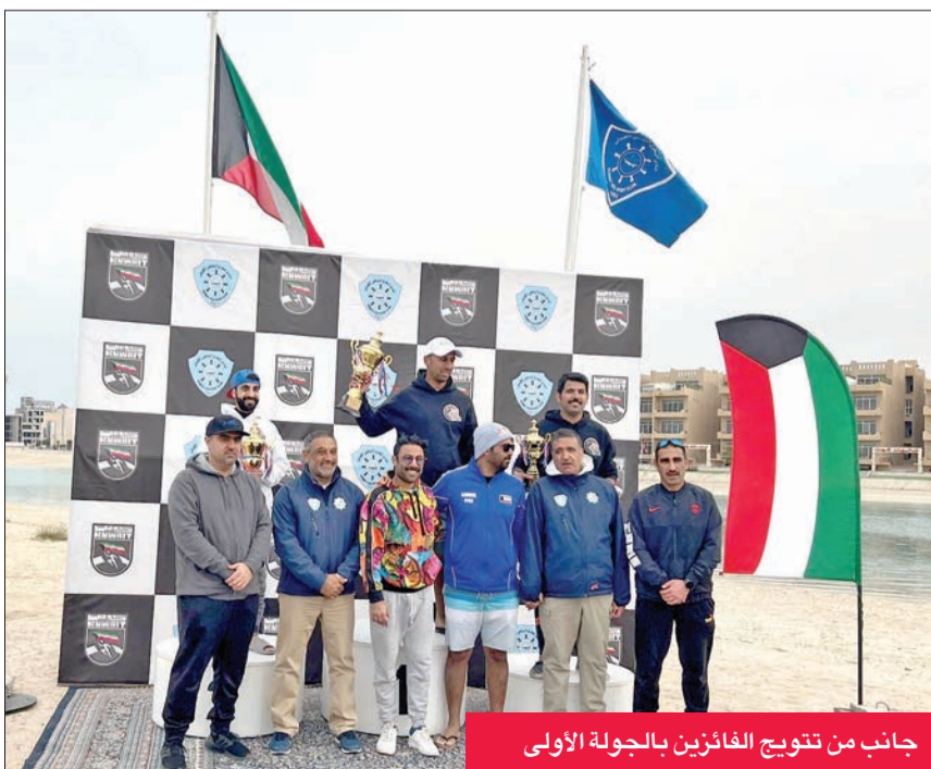
جانب من تتويج الفائزين بالجولة الأولى