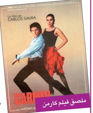
ملصق فيلم كارمن