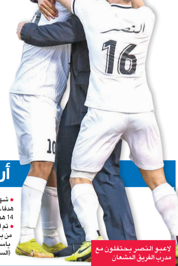
لاعبو النصر يحتفلون مع مدرب الفريق المشعان