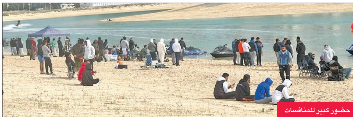
حضور كبير للمنافسات

الرياضة، ولشركة لآلي الكويت العقارية لاستضافتها جولات البطولة، وبالتعاون مع وزارات الصحة والداخلية والإعلام - القناة الرياضية الثالثة، وقوة الإطفاء العام، وأشد بالمبادرة الكريمة من «عبودكا»، بحضوره ومساهمته الشخصية في تكريم الفائزين.