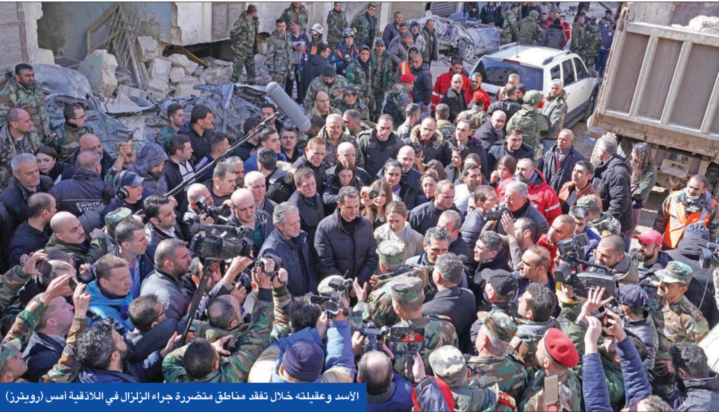
الأسد وعيقلته خلال تفقد مناطق متضررة جراء الزلزال في اللاذقية أمس

وريف حلب الجنوبي كان هناك ضحايا وجرى دفنهم. الأرقام كبيرة جداً، والأصل بمعجزة للعثور على ناجين تحت ركام المباني التي انهارت». وأشعار مدير المرصد المعارض إلى وجود فرق إغاثة عربية لم تتمكن حتى الآن من بدء مساعدة من هم على قيد الحياة من المشردين والمصابين، لأن الحكومة السورية لا تملك المازوت من أجل أن تشغل الأليات. في موازاة ذلك، حذرت «الخوذ البيضاء»، الدفاع المدني بالمناطق الخاضعة لسيطرة المجموعات المسلحة، من أن المعدات التي طالب بها للمساعدة في رفع الأنقاض لم تصل رغم مرور 6 أيام على وقوع الكارثة، مؤكدة أنها لم تتمكن من الوصول إلا إلى 5 في المئة من المباني المتضررة.