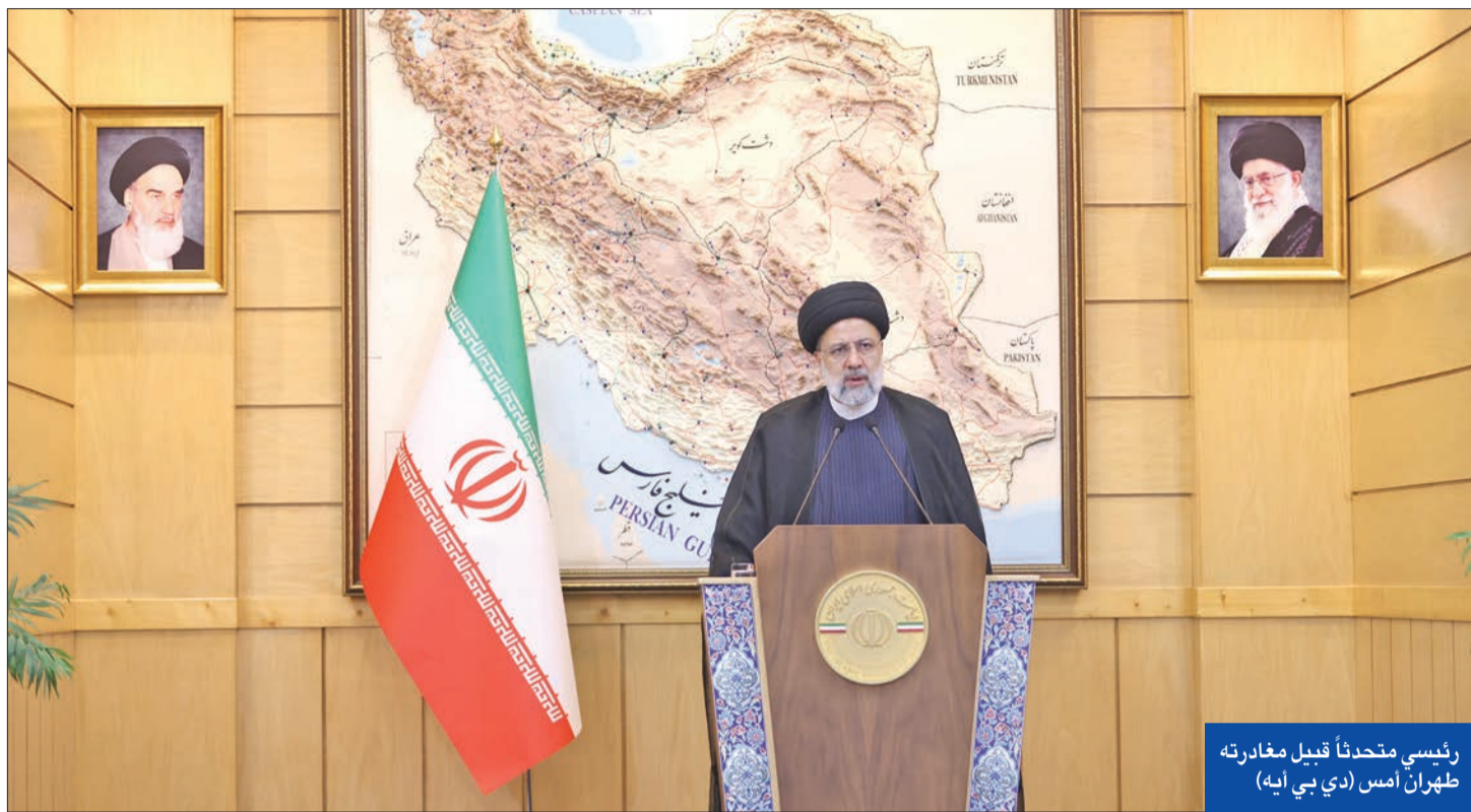
رئيسي متحدثاً قبيل مغادرته طهران أمس

على كيانات وشركات صينية لتعاملها مع إيران، مشيراً إلى أنه يتعين على واشنطن وقف قمعها غير العقلاني للشركات والأفراد الصينيين، وتعد بان تتخذ كبح الإجراءات اللازمة لحماية الحقوق والمصالح المشروعة للشركات والأفراد الصينيين.