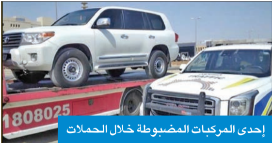
إحدى المركبات المضبوطة خلال الحملات

إحالة 26 حدثاً إلى النيابة وضبط 30 مستهتراً