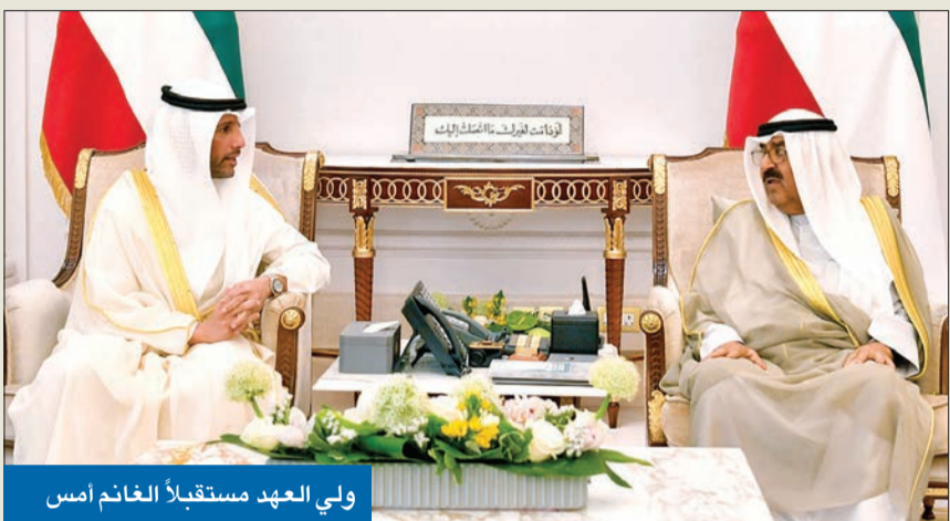
ولي العهد مستقبلاً الغانم أمس

استهل سمو ولي العهد، الشيخ مشعل الأحمد، أمس، المشاورات التقليدية لتشكيل الحكومة الجديدة. وفي هذا الصدد، استقبل سموه، بقصر بيان، على التوالي، رئيس مجلس الأمة السابق مرزوق الغانم، ورئيس المجلس الأسبق أحمد السعدون.