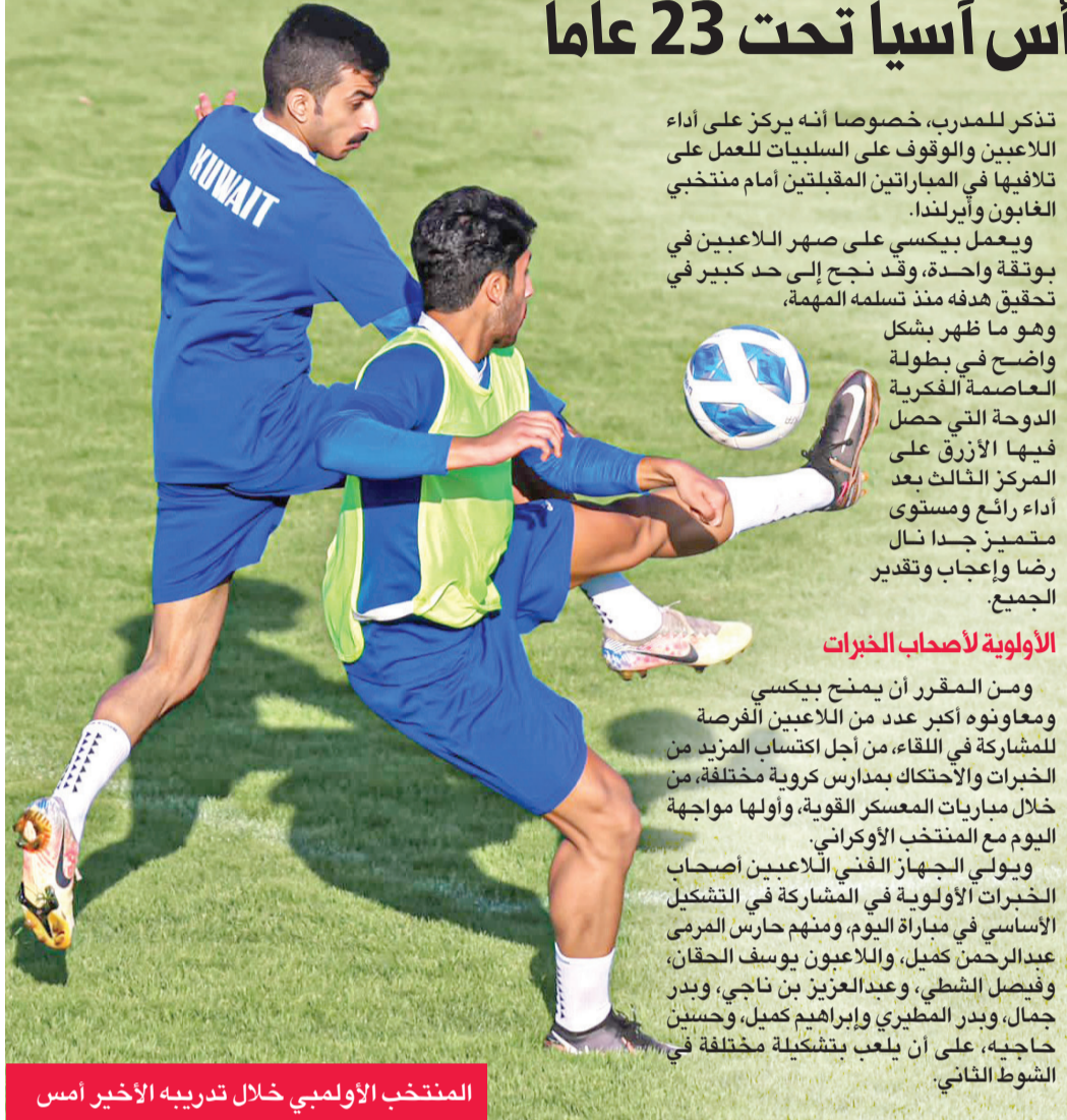
المنتخب الأولمبي خلال تدريبه الأخير أمس

ضمن استعداداته لتصفيات كأس آسيا تحت 23 عاماً