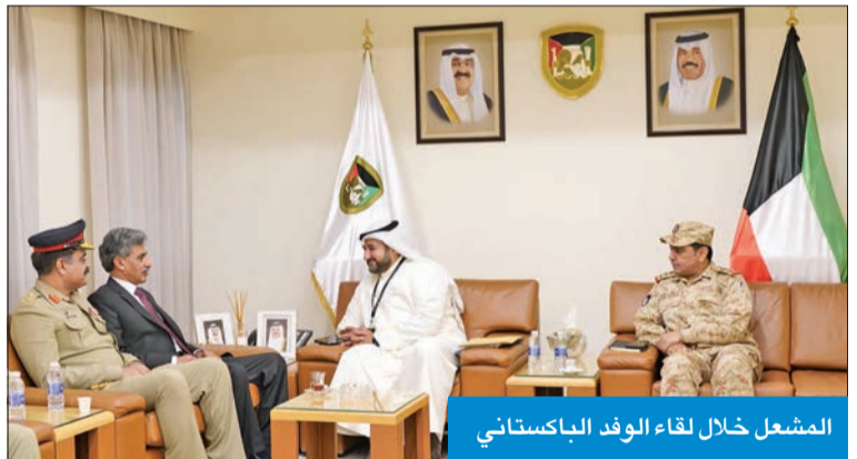
المشعل خلال لقاء الوفد الباكستاني

وأكد وكيل «الدفاع» خلال اللقاء أن اتفاقية التعاون المشتركة في المجال العسكري والدفاعي التي أبرمت أمس الأول، ما هي الا استكمال للجهود الحثيثة التي تجسد عمق التعاون والتكامل القائم بين البلدين الصديقين في مختلف المجالات العسكرية والدفاعية.