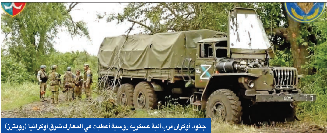
جنود أوكران قرب الية عسكرية روسية أعطبت في المعارك شرق أوكرانيا

قبل الانتخابات الرئاسية في الولايات المتحدة المقررة في 2024. على الجانب الآخر، تعهد زعيم كوريا الشمالية، كيم جونج أون، بـ «وضع يده في يد» الرئيس الروسي فلاديمير بوتين، وتعزيز التعاون الاستراتيجي لتحقيق هدفهما المشترك المتمثل في بناء دولة قوية.