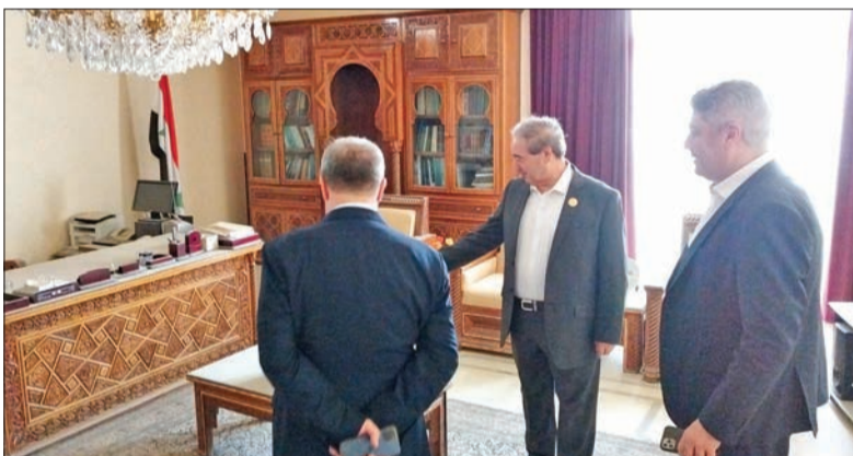
المقداد يتفقد مقر السفارة السورية بالرياض أمس

وتمن وزير الخارجية جهود السعودية والجامعة العربية في التحضير لهذا الاجتماع لمناقشة أوجه التعاون والتقارب بين المجموعتين العربية ومجموعة دول جزر الباسيفيكي، التي تضم فيجي، كيريباتي، جزر مارشال، تانوروا، بابوا غينيا الجديدة، ساموا، جزر سليمان، تونجا، توفالو، فانواتو، ولايات ميكرونيسيا المتحدة، بالاو، جزر كوك، ونيوي، مستذكراً دور الإمارات في وضع اللبنة الأولى