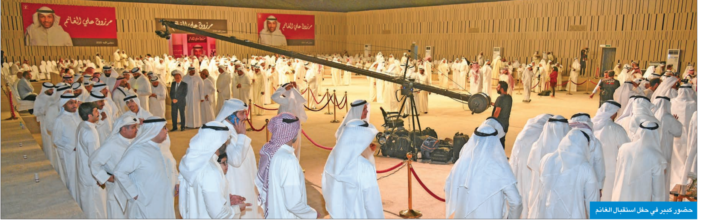
حضور كبير في حفل استقبال الغانم