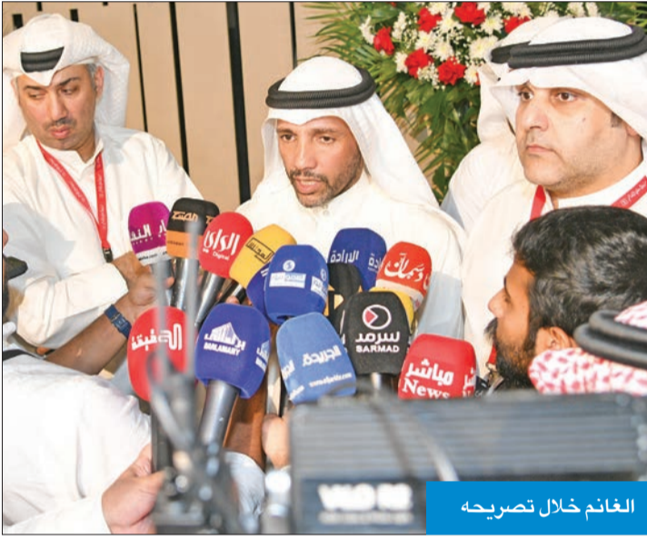
الغانم خلال تصريحه