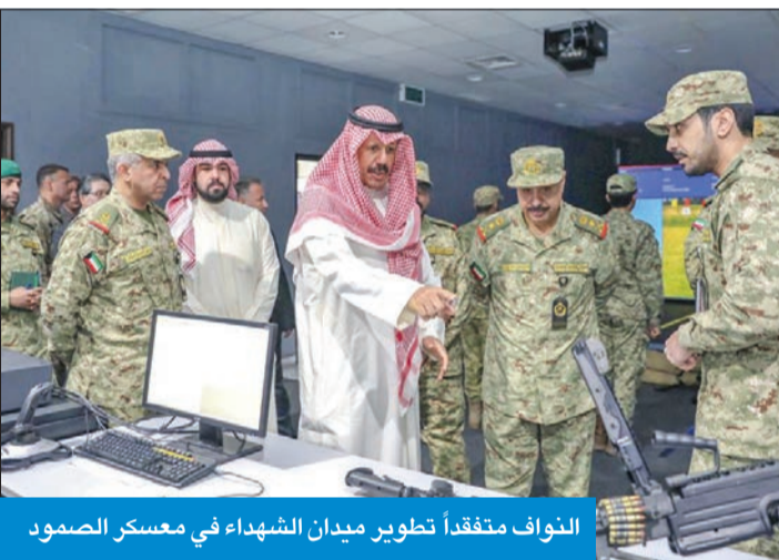
النواف متفقداً تطوير ميدان الشهداء في معسكر الصمود

وأشار نائب رئيس الحرس إلى أن إعادة تطوير وتحديث ميدان الشهداء تأتي ضمن أهداف الوثيقة التوجيهية 2025 (حماية وسند) بتطوير البنية التحتية في كل المعسكرات، لقتلاع مع خطط وطموحات الحرس في الارتقاء بدوره بخدمة المنظومة الأمنية بالتعاون مع وزارتي الدفاع والدخالية، وقوة الإطفاء العام.