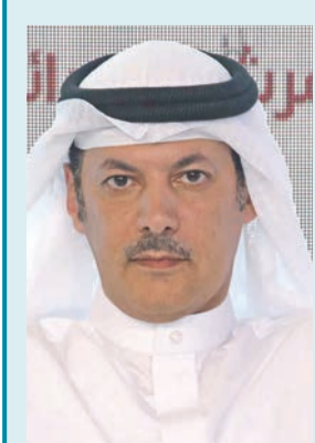
فهد بن جامع

بعد انتهاء الاجتماع التنسيقي النيابي في ديوان النائب محمد شايف بالاتفاق على مجموعة من الأولويات، يستكمل نواب مجلس الأمة اليوم اجتماعهم من داخل مبنى المجلس بناء على دعوة من النائب خالد المونس لإنجاز مهمة التنسيق والتوافق على مناصب مكتب المجلس واللجان البرلمانية.