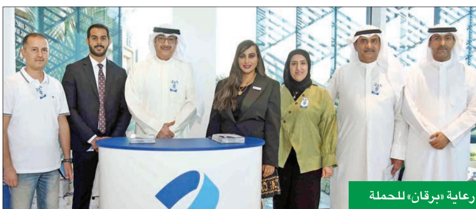
رعاية «برقان» للحملة

التبرع بالدم من مختلف الفئات بين أفراد المجتمع على مدار العام، وبالنيابة عن بنك برقان، أود أن أقدم بالشكر من جميع المتبرعين الذين قاموا بواجب إنساني وطني تجاه جميع المرضى والمحتاجين للدم، كما أن الشكر موصول لمحافظة الأحمدية على جهودهم لإنجاح هذه الحملة التوعوية الإنسانية».