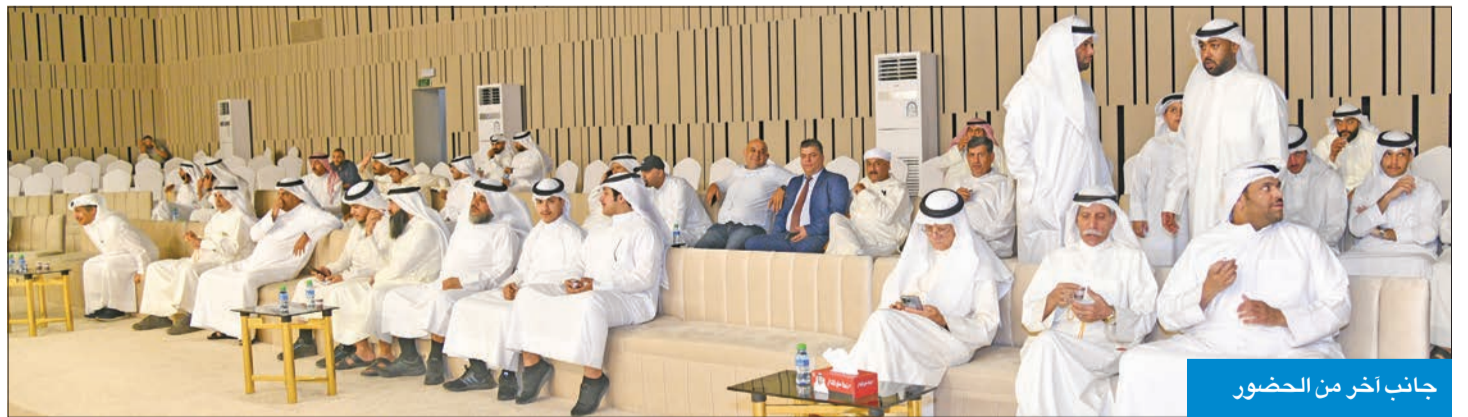
جانب آخر من الحضور