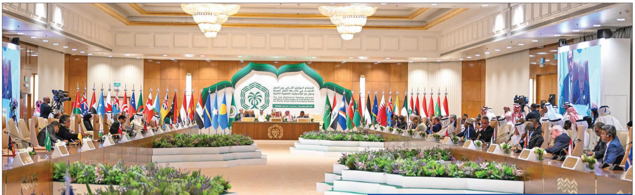
جانب من الاجتماع الوزاري العربي - الباسيفيكي الثاني في الرياض أمس

بن فرحان في الاجتماع العربي - الباسيفيكي: نرفض التصعيد بالمنطقة • المقداد يتفقد سفارة سورية بالرياض