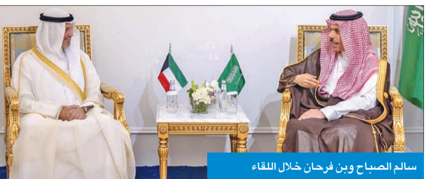
سالم الصباح وبن فرحان خلال اللقاء

التقى وزير الخارجية الشيخ سالم الصباح ونظيره السعودي الأمير فيصل بن فرحان، على هامش أعمال الاجتماع الوزاري الثاني بين الدول الأعضاء في جامعة الدول العربية ودول جزر المحيط الهادئ (الباسيفيك) الصغيرة النامية، والذي عقد أمس في الرياض.