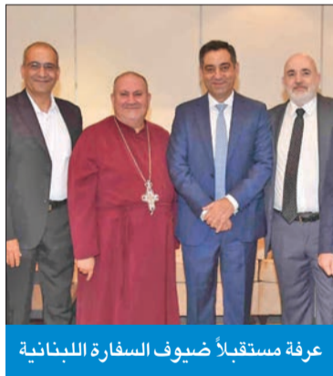
عرفة مستقبلاً ضيوف السفارة اللبنانية

والثانية، وهذا ما يدل على أن لبنان موجود في قلب الشعب الكويتي الشقيق وحكومته، وأنه بلد مُقدّر لدى البعثات الدبلوماسية في الكويت، التي توافد عدد كبير من ممثلها؛ سواء على مستوى السفراء أو الدبلوماسيين، وهو ما يشعرنا بأن لبنان غير متروك وحده رغم كل الظروف الصعبة التي يمر بها.