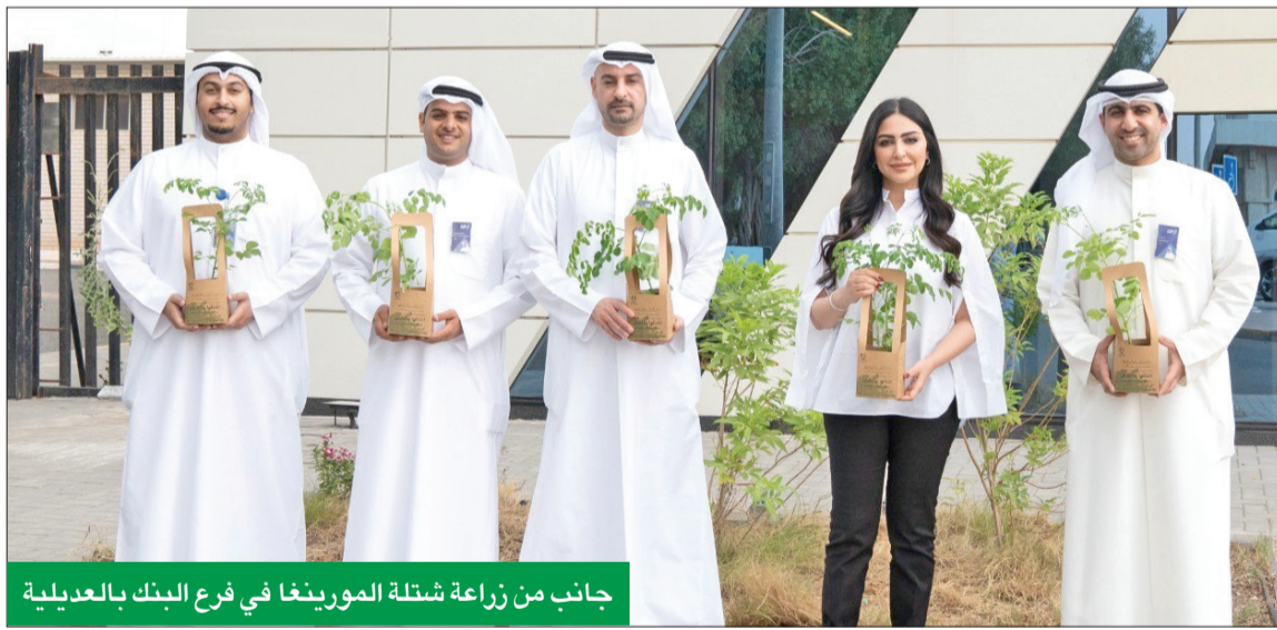
جانب من زراعة شتلة المورينغا في فرع البنك بالعدلية

دعم «وربة» وشارك في العديد من الأنشطة المتعلقة بمجال البيئة، بالتعاون مع عدد من الجهات الأخرى، وشارك في جهود تشجيع أفراد المجتمع على التخضير والحفاظ على البيئة من التلوث.