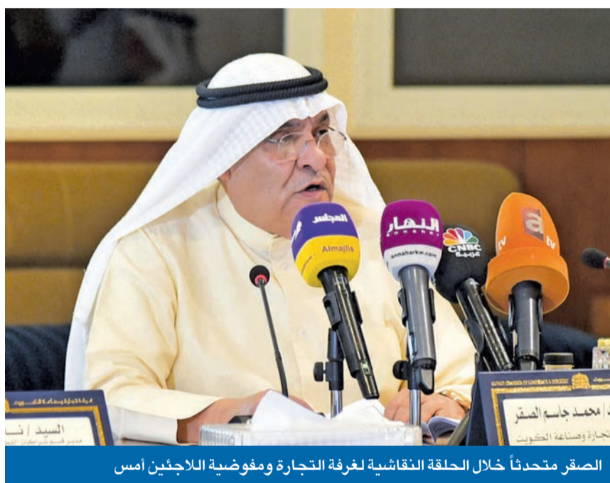
الصقر متحدثاً خلال الحلقة النقاشية لغرفة التجارة ومفوضية اللاجئين أمس

«تقف مع الأنظمة الظالمة... وتتنكر لمبادئ الحرية والعدالة أو تلتزم بها تبعاً لمصلحتها»