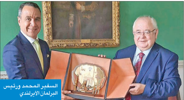
السفير المحمد ورئيس البرلمان الأيرلندي

مبيناً أن المسؤولين في الكويت يتميزون بالحمكة والرياسيد. وأعرب أوفاريل عن إعجابها بالنظام الديمقراطي والتجربة البرلمانية اللذين تتميز بهما الكويت، مهنئاً في الوقت نفسه بنجاح الانتخابات التشريعية التي عقدت أخيراً.