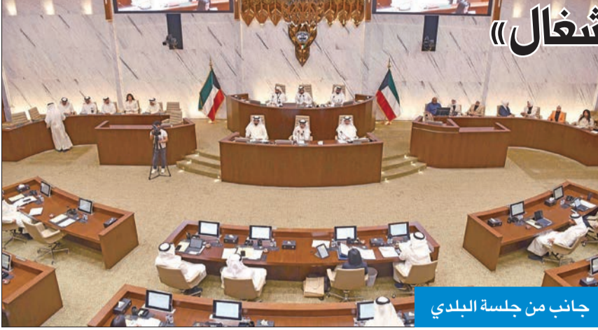
جانب من جلسة البلدي

«البلدي» رفض توسعة قسيمة صناعية لتجاوزها على أرض لـ «الأشغال»