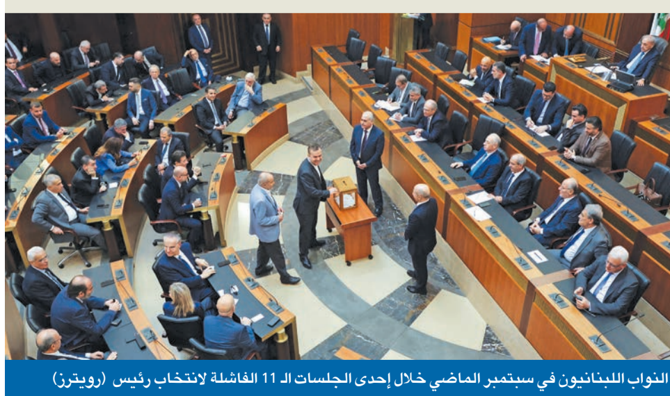
النواب اللبنانيون في سبتمبر الماضي خلال إحدى الجلسات الـ 11 الفاشلة لانتخاب رئيس

في حين يشغل المشهد الداخلي اللبناني بالاستعدادات والتخمينات والسيناريوهات لجلسة مجلس النواب المقررة غدا الأربعاء، والتي ستكون، في حال انعقادها، المحاولة الـ 12 لانتخاب رئيس جديد للبلاد التي تعيش شعوراً رئاسياً منذ نهاية ولاية الرئيس السابق ميشال عون في أكتوبر الماضي، يبدو أن المشهد الخارجي لن ينتظر نتائج ووقائع الجلسة للمضي