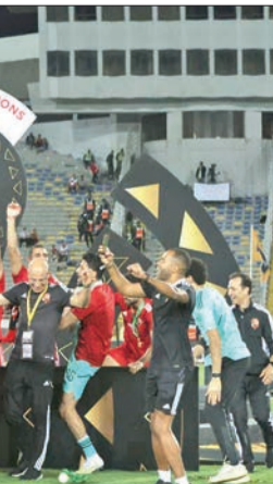
الأهلي المصري متوجاً بدوري أبطال إفريقيا

وبادر فريق الوداد بالتسجيل في شبك الأهلي عند الدقيقة 27 من زمن الشوط الأول عن طريق يحيى عطية الله، وفي الشوط الثاني نجح المدافع الدولي محمد عبدالمنعم في إدراك التعادل برأسية متقنة في الدقيقة 78.