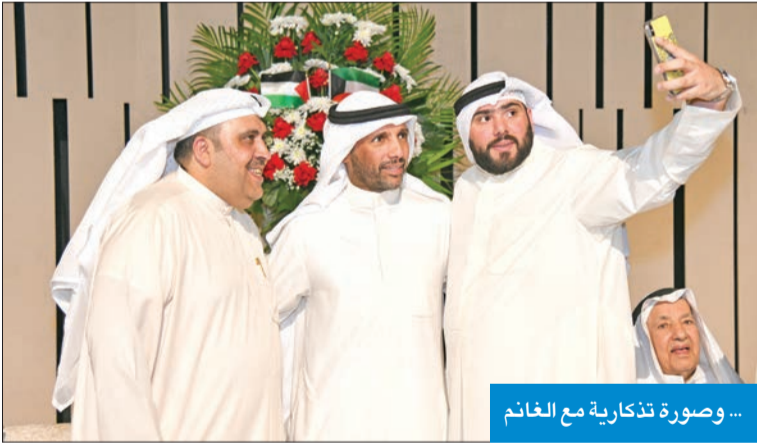
... وصوره تذكارية مع الغانم