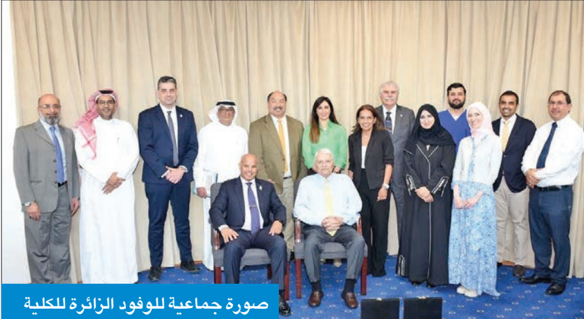
صورة جماعية للوفود الزائرة للكلية

مستوى الدراسات العليا بمجال طب وجراحة الأسنان.