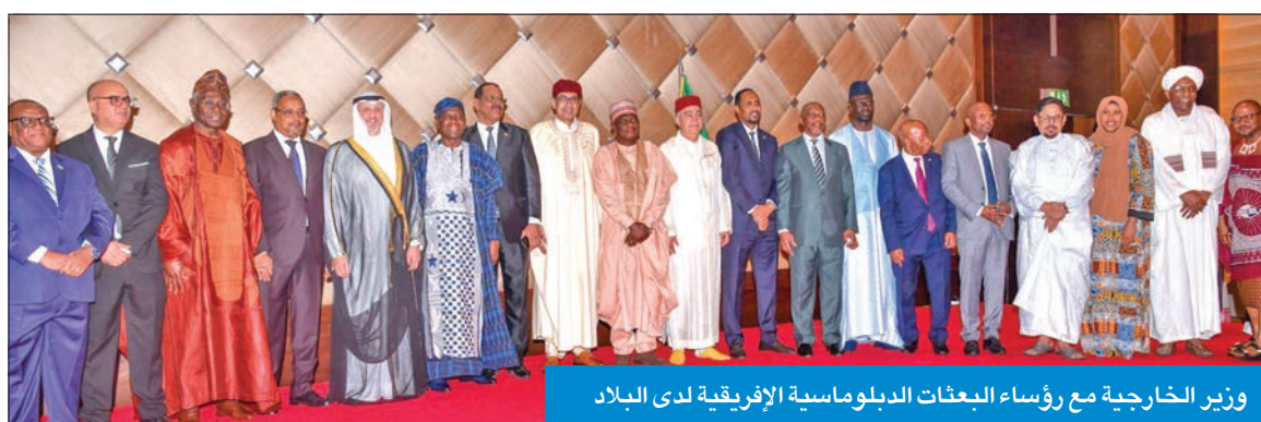
وزير الخارجية مع رؤساء البعثات الدبلوماسية الإفريقية لدى البلاد

أكد وزير الخارجية الشيخ سالم الصباح، أن الكويت لها علاقات تاريخية واستراتيجية مع دول إفريقيا، موضّحاً أن الصندوق الكويتي للتنمية الاقتصادية العربية استثمر بكثافة في مشاريع البنى التحتية والتنمية الحيوية في جميع أنحاء القارة منذ تأسيسه عام 1961.