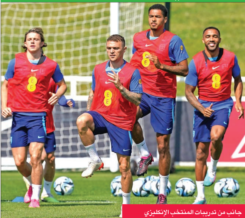
جانب من تدريبات المنتخب الإنكليزي

يد المنتخب الأرجنتيني، لكنه خرج من دور الستة عشر في يورو 2020، ويتطلع لاستعادة مستواه كرواتيا قبل أن يخسر نهائي مونديال قطر 2022 بركلات الجزاء الترجيحية على