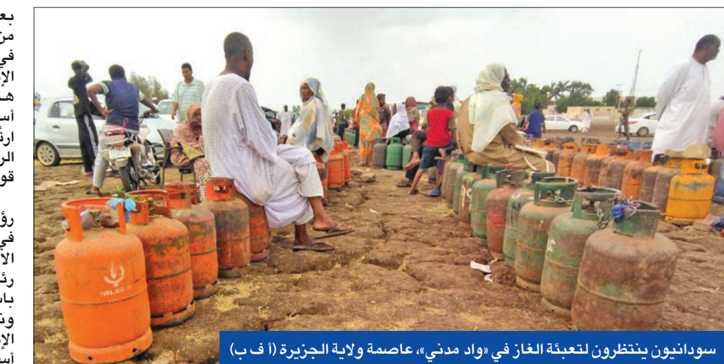
سودانيون ينتظرون لتعبئة الغاز في «واد مدني»، عاصمة ولاية الجزيرة (أ ف ب)

مع دخول النزاع في السودان شهره الثالث، دانت أطراف محلية وخارجية، أمس، مقتل والي غرب دارفور خميس أكر، بعد ساعات من إدلائه بتصريحات تلفزيونية اتهم فيها «قوات الدعم السريع» بزعامة محمد حمدان دقلو (حميدتي) بـ «تدمير» مدينة الجنينة، مركز ولاية غرب دارفور، إحدى الولايات الأربع المكونة لإقليم دارفور الواقع بغرب السودان عند الحدود مع تشاد.