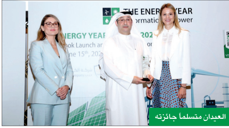
العيان متسلماً لجائزته

والقى ممثل شركة الكويت للتأمين وشركة زين للاتصالات كلمتين مماثلتين، ليتم في نهاية الاحتفالية الإعلان عن منح الرئيس التنفيذي جائزة «شخصية العام»، والنويه ببعض إنجازات الشركة في مجالات الاستكشاف والغاز والنفط الثقيل.