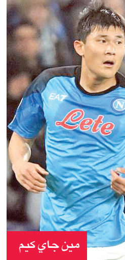
مين جاي كيم

كشفت عدة وسائل إعلام في ألمانيا الخميس أن نادي بايرن ميونيخ الألماني لكرة القدم يفكر في ضم الكوري الجنوبي مين - جاي كيم مدافع نادي نابولي الإيطالي. وذكرت هذه الوسائل أن لاعب قلب الدفاع كيم (26 عاماً) واحد من اللاعبين الذين يدرس النادي صاحب الأرقام القياسية من البطولات في ألمانيا ضمه ليكون بديلاً محتملاً للوكاس هيرنانديز الذي ربما ينتقل إلى نادي العاصمة الفرنسية باريس سان جرمان.