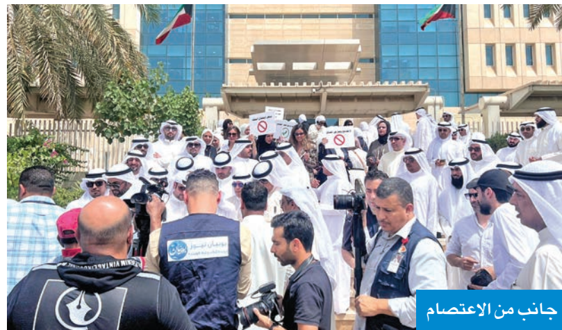
جانب من الاعتصام