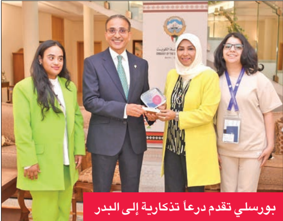
بورسلي تقدم درعا تذكارية إلى البدر

استضاف السفير الكويتي لدى ألمانيا نجيب عبدالرحمن البدر الوفد الكويتي المشارك في دورة الألعاب العالمية الصيفية للأولمبياد الخاص - برلين 2023، التي تنطلق منافساتها بين 17 و25 الجاري، وأقام مأدبة عشاء على شرف الوفد.