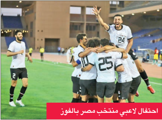
احتفال لاعبي منتخب مصر بالفوز

● الجريدة - القاهرة حسم المنتخب المصري تأهله رسمياً لنهائيات كأس الأمم الأفريقية العام المقبل في كوت ديفوار، بعد فوزه على نظيره الغيني 1-2، في اللقاء الذي أقيم ضمن مباريات الجولة الخامسة للتحضيرات الأفريقية. واستقبلت شبكات الفراعنة الهدف الأول من غينيا في الدقيقة 26 من سيرهو جبراسي، قبل أن يتعادل محمود حسن لمصر في