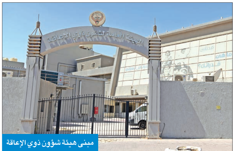
مبنى هيئة شؤون ذوي الإعاقة

أعلنت الهيئة العامة لشؤون ذوي الإعاقة فتح باب التقديم للبعثات الخارجية للعام الدراسي 2023/2024 من 18 الجاري حتى 13 يوليو المقبل. وذكرت الهيئة في بيان لها أن هناك عدداً من الشروط يجب أن تتوافر في المتقدم للبعثة وهي أن يكون كويتي الجنسية وأن يحمل المتقدم شهادة إثبات إعاقة حديثة صادرة من الهيئة العامة لشؤون ذوي الإعاقة للإعاقات التالية: إعاقة سمعية - متوسطة وشديدة، وإعاقة بصرية - متوسطة وشديدة، وإعاقة حركية - متوسطة وشديدة، وإعاقة جسدية - متوسطة وشديدة، وإعاقة تعلمية - صعوبات التعلم. وتقتضي الشروط أيضاً بأن يكون حاصلًا على شهادة الثانوية العامة الكويتية بالنظام الموحد أو ما يعادلها بقسمها العلمي والأدبي على ألا تتجاوز صلاحية الشهادة 3 أعوام دراسية من تاريخ التخرج للطلبة المتقدمين للتنافس على مقاعد