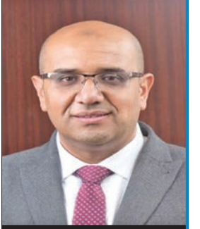
ب.قلم: المستشار القانوني محمد بدر

أقرت محكمة التمييز الكويتية مبدأ قضائياً جديداً في قضاء حديث لها يقضي بانطباق أحكام الدعوة لانعقاد الجمعية التأسيسية للشركة المساهمة العامة على إجراءات الدعوة لانعقاد الجمعيات العمومية للشركات المساهمة المقفلة والمسؤولية المحدودة، وكان المتبع قبل صدور هذا القضاء أن إجراءات الدعوة للجمعيات العمومية للشركات المساهمة المقفلة والمسؤولية المحدودة، تخضع لإجراءات الدعوة للجمعية التأسيسية للشركة المساهمة المقفلة، حيث أسست المحكمة المبدأ القضائي، سالف الذكر، تأسيساً على أنه لما كانت المادة 111 من القانون رقم 1 لسنة 2016 بشأن إصدار قانون الشركات تنص على أنه يكون للشركة ذات المسؤولية المحدودة جمعية