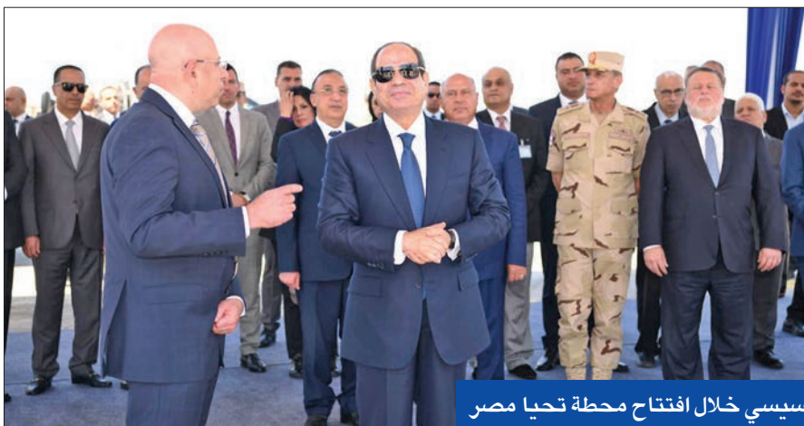
السيسي خلال افتتاح محطة تحيا مصر

ورفض السيسي، بشكل مبطن، الحديث عن استبعاد