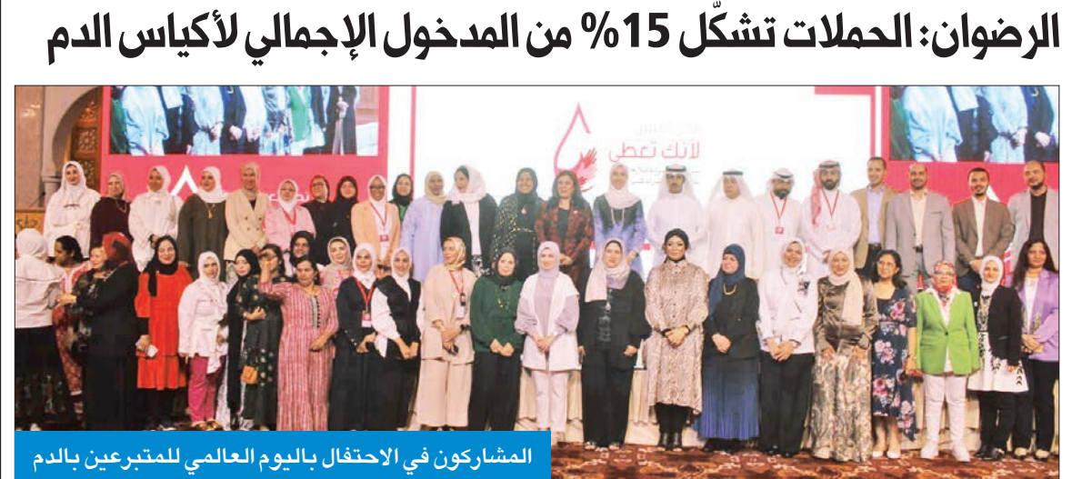
المشاركون في الاحتفال باليوم العالمي للمتبرعين بالدم