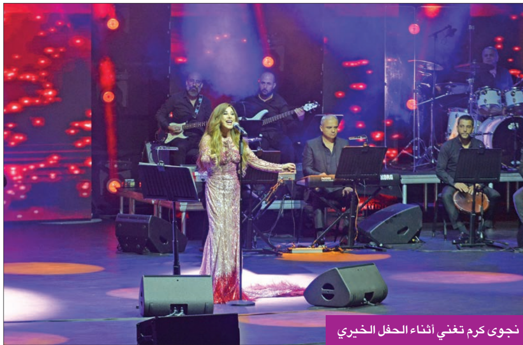
نجوى كرم تغني أثناء الحفل الخيري