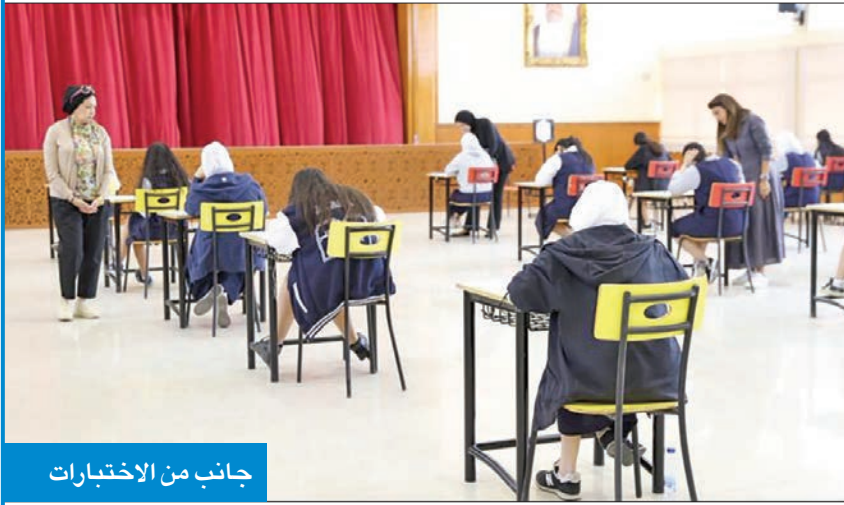
جانب من الاختبارات

امتحانات منتصف العام الحمله في توعية الطلاب وأولياء الأمور. وأكد أن لجان امتحانات ثانوية فلسطين تسير وفق ما هو معد له من التزام دخول الطلاب في الوقت المحدد لهم، وتفتيشهم قبل دخولهم اللجان، ولتأكد من عدم حمل أي وسيلة من وسائل الغش، وتوزيع أوراق الامتحان بالوقت المناسب له، ولم تكن هناك مشاكل تذكر أو تأخير، سواء فيما يتعلق بتسليم وفتح صناديق الامتحان، أو توزيع أوراق الامتحان.