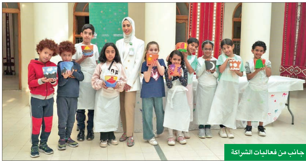
جانب من فعاليات الشراكة

قرب وما تمثله من مخزون تاريخي وتراخي يزيد من الترابط بين الأطفال ومجتمعهم.