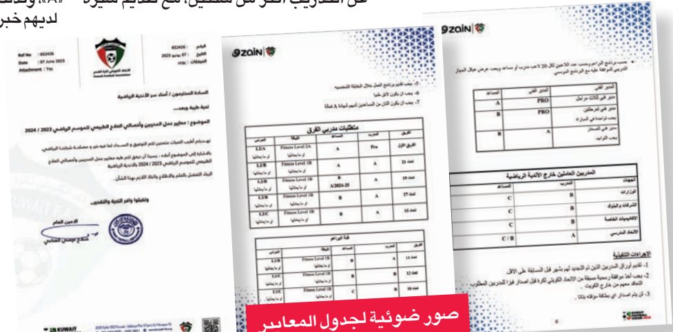
صور ضوئية لجدول المعايير

في خطوة تصحيحية من شأنها أن ترفع كفاءة المدربين وبقية العاملين في الأجهزة الفنية والطبية، وتقضي على المحسوبة والواسطة المتفشية في تعيين الكثير من العاملين منهم في الأندية، أرسل مجلس إدارة الاتحاد الكويتي لكرة القدم تعميماً إلى الأندية يتضمن المعايير المطلوبة للتعاقد مع المدربين