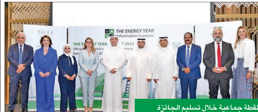
لقطة جماعية خلال تسليم الجائزة

وكانت سابقاً تحمل اسم The Oil & Gas Year، لكنها تحولت إلى اسمها الحالي نظراً لتعدد مصادر الطاقة وتوسيعها بما يتجاوز النفط والغاز.