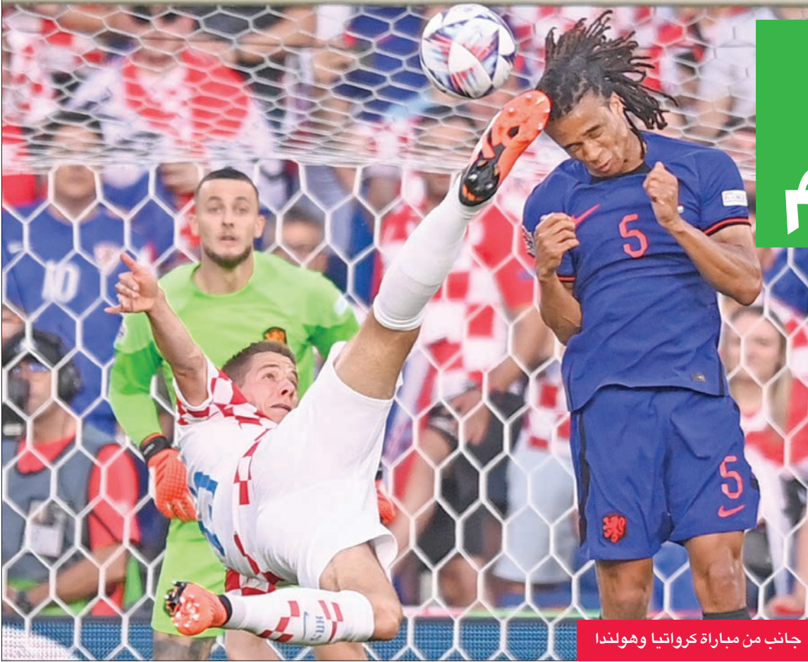
جانب من مباراة كرواتيا وهولندا

تدرب إلكاي غوندوغان، المتوج قبل أيام مع فريقه مانشستر سيتي الإنكليزي للمرة الأولى بلقب دوري أبطال أوروبا، بشكل منفرد خلال حصة مران المنتخب الألماني أمس عقب وصوله لمعسكر الفريق في فرانكفورت متأخراً. وفاز سيتي على إنتر ميلان الإيطالي بهدف دون رد في نهائي دوري أبطال أوروبا في اسطنبول، السبت الماضي، والتحق غوندوغان بمنتخب بلاده مساء أمس الأول. وقبل ملاقاة بولندا الودية الجمعة، أكمل غوندوغان حصة مران بشكل منفرد داخل ملعب فرعي. كما وصل روبن جونسون لاعب إنتر ميلان لمعسكر الماكتات مساء الأربعاء، لكنه تدرّب رفقة زملائه اليوم.