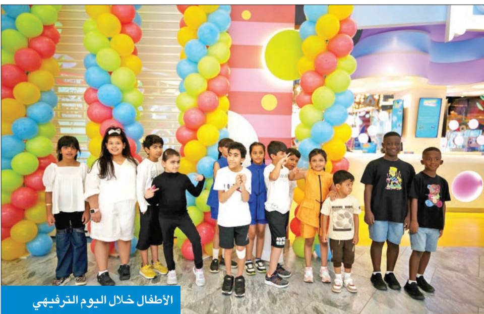
الأطفال خلال اليوم الترفيهي