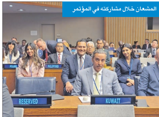
المشعان خلال مشاركته في المؤتمر

المشعان شارك في مؤتمر أممي رفيع وقدم عرضاً بالجهود الكويتية