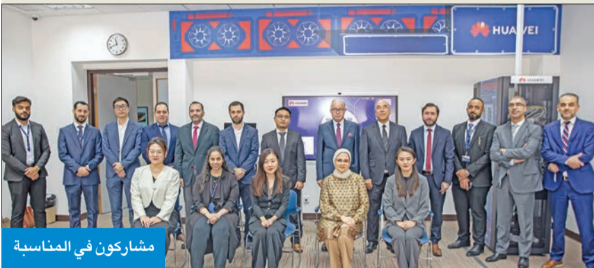
مشاركون في المناسبة

لتعزيز مهارات الشباب ومنحهم فرصة توظيف في شبكات الحاسوب