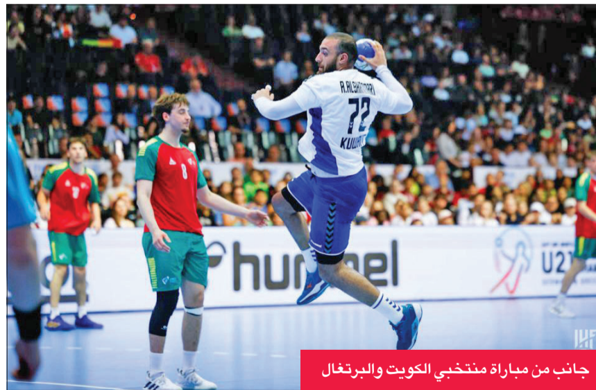
جانب من مباراة منتخب الكويت والبرتغال

النهائي البرتغال للقاء لمصلحته. نتائج الجولة الأولى وأسفرت نتائج بقية مباريات الجولة الأولى عن فوز مصر على كوبا 25 - 16، وسولوفينيا على غينيا 48 - 23، وأيسلندا على المغرب 17 - 15، وجزر الفارو على أنغولا 34 - 21، وهنغاريا على الأرجنتين 16 - 13.