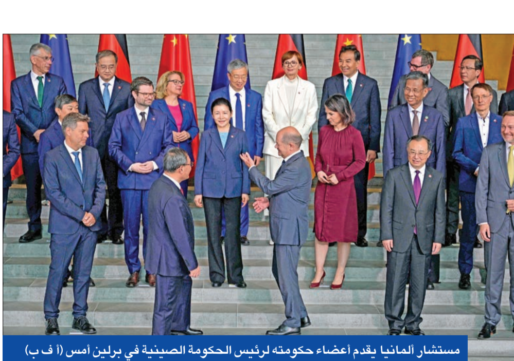
مستشار ألمانيا يقدم أعضاء حكومته لرئيس الحكومة الصينية في برلين أمس

الرئيس الأميركي جو بايدن، في سان فرانسيسكو، أمس، مجموعة من الخبراء في مجال تكنولوجيا الذكاء الاصطناعي في إطار مساعي إدارته للحد من مخاطر التقنية الوليدة.