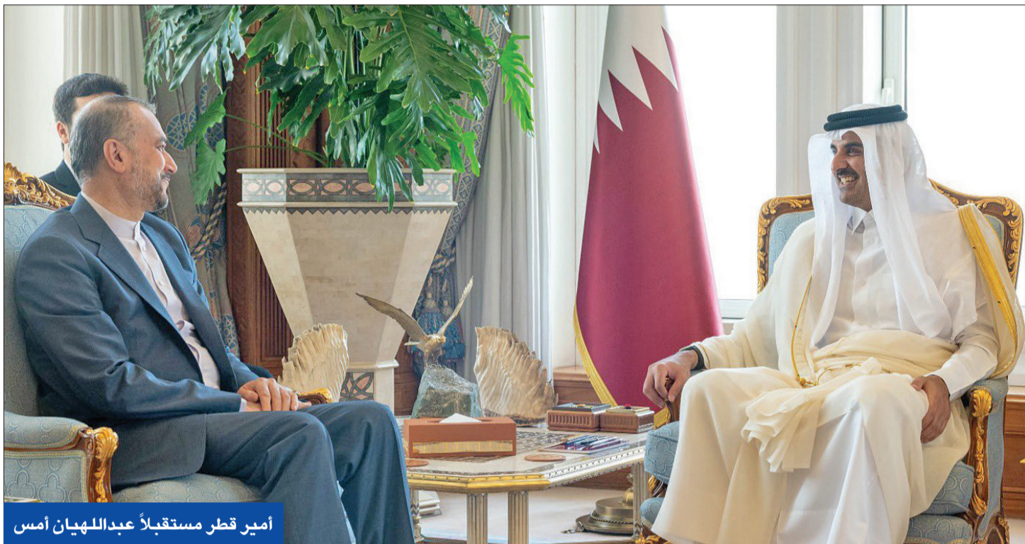
أمير قطر مستقبلاً عبداللهيان أمس

هنية خلال لقائه رئيسي: «المقاومة» تنمو في «الضفة» وداخل «الخط الأخضر»... ونسق مع «حزب الله»