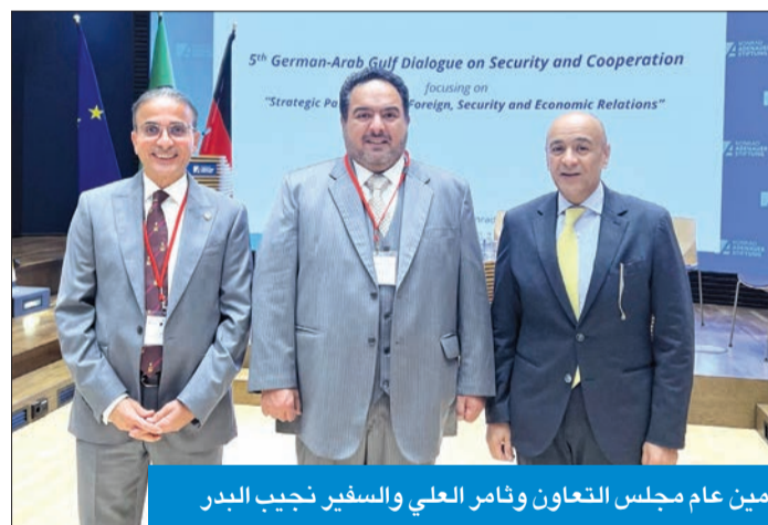
أمين عام مجلس التعاون وتامر العلي والسفير نجيب البدر

أطراف الشعب اليمني لتحقيق الأمن والاستقرار. وناقش المشاركون في المؤتمر كذلك التأثيرات والتداعيات السلبية الكبيرة التي تخلفها الأزمة الأوكرانية على مكونات الاستقرار الأمني والاقتصادي الإقليمي والدولي والتأكيد على الدور الذي يمكن أن تلعبه ألمانيا على صعيد حلحلة هذه الأزمة.