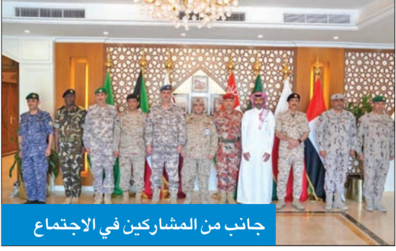
جانب من المشاركين في الاجتماع