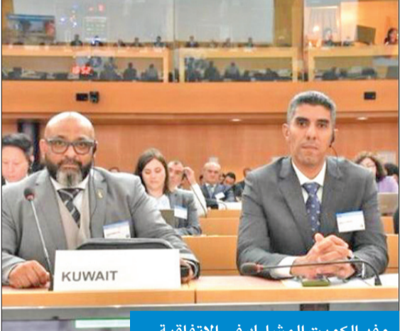
وفد الكويت المشارك في الاتفاقية

شارك وفد من القوة البرية متمثلاً بمجموعة التفتيش والتخلص من المتفجرات بمؤتمر اتفاقية حظر الألغام المضادة، والمنعقد في جنيف خلال الفترة من 19 إلى 21 الجاري، بحضور أكثر من 300 مشارك من 80 دولة.