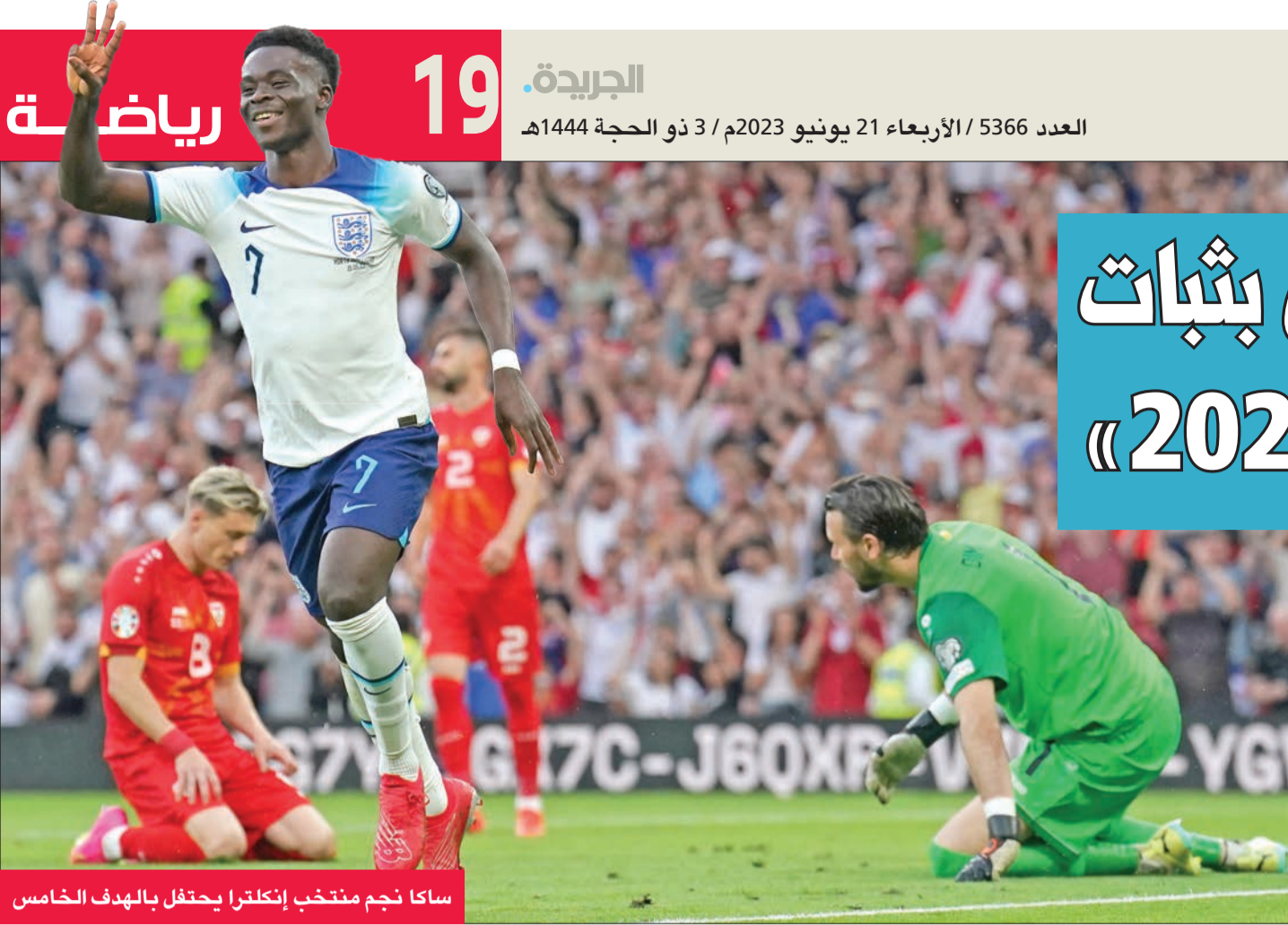
سكا نجم منتخب إنكلترا يحتفل بالهدف الخامس