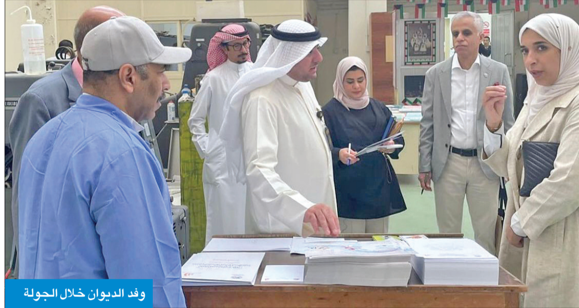
وفد الديوان خلال الجولة

لجنة الشكاوى والتظلمات تفقدت الإدارة واطلعت على أوضاع النزلاء والأنشطة المقدمة لهم