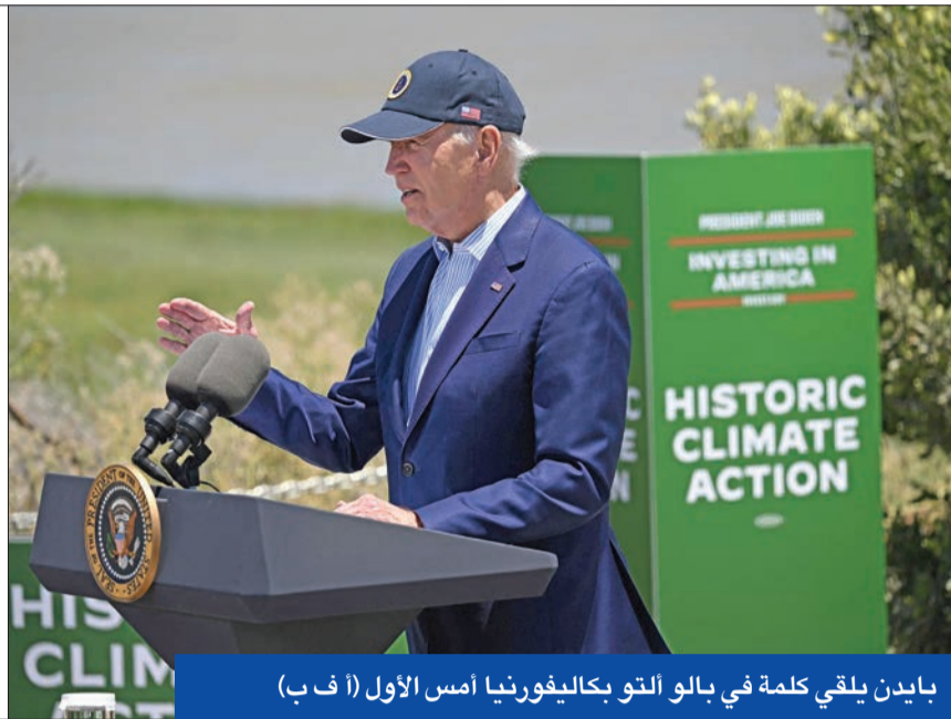
بايدن يلقي كلمة في بالو التو بكاليفورنيا أمس الأول (أ ف ب)

وزير الخارجية الأمريكي أنتوني بلينكن والبريطاني جيمس كليفلرلي ضيفاناً المشوع في الكاتدرائية الأوكرانية في لندن أمس (أ ف ب)