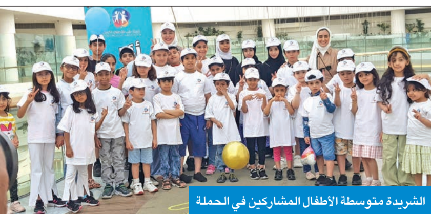
الشريفة متوسطة الأطفال المشاركين في الحملة

وعن أسباب الإصابة بفقر الدم المنجلي، أكدت الشريفة أنها تحدث نتيجة تغير في الجين الذي يحث الجسم على إنتاج الحديد في خلايا الدم الحمراء، والذي يتيح لخلايا الدم الحمراء نقل الأكسجين من الرئتين إلى جميع أجزاء الجسم، مرور الوقت، وتختلف كذلك من شخص إلى آخر، ومنها فقر الدم، ونوبات من الألم، وتورم اليدين والقدمين، وحالات العدوى المتكررة، وتأخر النمو أو البلوغ ومشاكل الإبصار.