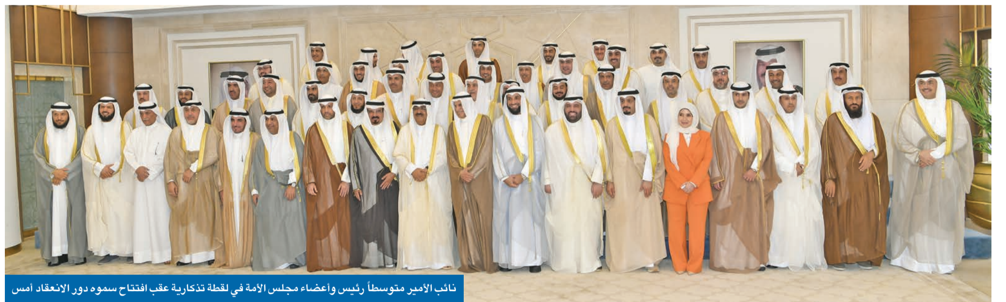
نائب الأمير منوسط رئيس وأعضاء مجلس الأمة في لحظة تذكارية عقب افتتاح سموه دور الانعقاد امس

طموح المواطنين وتطلعاتهم، وإعطاء الحكومة مهلة كافية للإنجاز ثم استخدام الوسائل الدستورية بحكمة ورشد إذا كان لها محل، والارتقاء بالخطاب البرلماني لتبقى الكويت - كما عهدنا الجميع - نموذجاً أصيلاً في ممارسة الديمقراطية. وطالب سموه النواب بأن يراعوا في تقديم مقترحاتهم العدالة الاجتماعية، وأن تعود بعد إقرارها بالنفع على أبناء الوطن جميعهم، على أن تكون «مقترحات تحافظ على ثروات