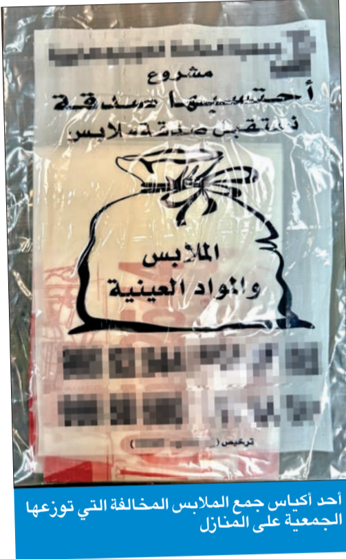
أحد أكياس جمع الملابس المخالفة التي توزعها الجمعية على المنازل

أجرى وكيل وزارة الشؤون الاجتماعية بالإبادة عبدالعزيز ساري، أمس الأول،