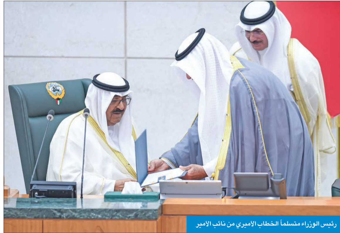
رئيس الوزراء متسلماً الخطاب الأميري من نائب الأمير

وختاما نتوجه إلى المولى سبحانه أن يوفقنا لما فيه مرضاته وأن يظهر قلوبنا وبقوي عزائمنا ويحفظ بلدنا ويؤيدنا بالتوفيق ويسد خطانا على دروب الخير لخدمة وطننا العزيز في ظل قيادة حضرة صاحب السمو أمير البلاد المقدي وسمو ولي عهده الأمين حفظكم الله ورعاكم. والسلام عليكم ورحمة الله وبركاته.