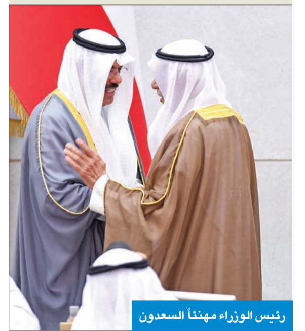
رئيس الوزراء مهنتاً السعدون

ووافق مجلس الأمة خلال جلسة أمس العادية على طلب نياي بشأن مد دور الانعقاد واستعمال اللجان المختصة بإنجاز القوانين وإدراجها على جلسات مجلس الأمة المقبلة. ووافق المجلس على مد دور الانعقاد العادي الأول من الفصل التشريعي السابع عشر حتى الانتهاء من القوانين المعلن عنها في بيان الخريطة التشريعية. وعقد جلسة خاصة يوم الخميس تكون مكملة لجلسة الثلاثاء والأربعاء حتى فضاء دور الانعقاد، واستعمال اللجان المختصة بإنجاز التقارير النهائية للقوانين المعلن عنها في بيان الخريطة التشريعية وإدراجها على جلسات مجلس الأمة العادية والخاصة لمناقشتها والتصويت عليها.