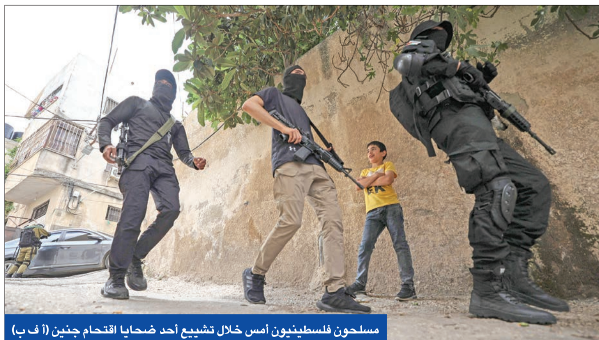
مسلحون فلسطينيون أمس خلال تشييع أحد ضحايا اقتحام جنين

غالانت يلمح لعملية عسكرية واسعة في «الضفة» لمنع تحولها إلى «غزة ثانية»