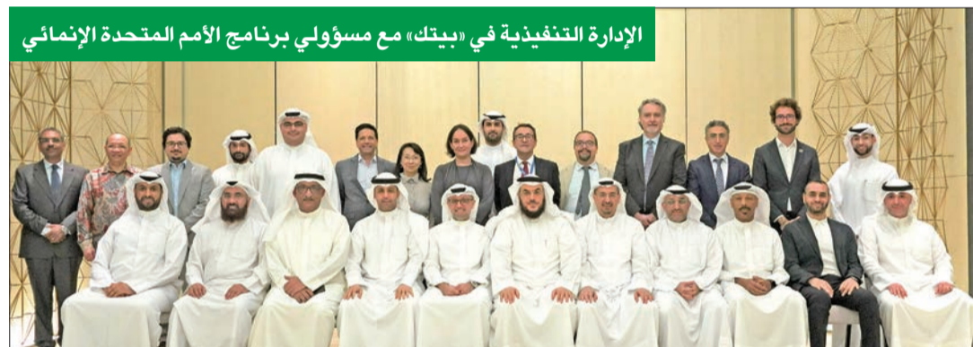
الإدارة التنفيذية في «بيتك» مع مسؤولي برنامج الأمم المتحدة الإنمائي

نظم ورشة عمل «التمويل المستدام» بالتعاون مع برنامج الأمم المتحدة الإنمائي