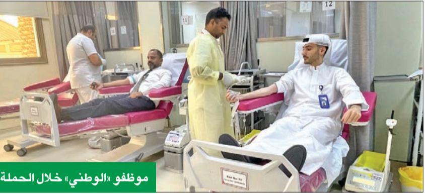
موظفو «الوطني» خلال الحملة