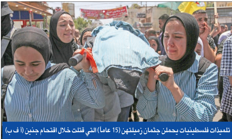
تلميذات فلسطينيات يحملن جثمان زميلتهن (15 عاماً) التي قتلت خلال اقتحام جنين

شُعب الفلسطينيين والإسرائيليون قتلاهم، أمس، بمن فيهم فتية من الجانبين سقطوا إثر تجدد دائرة العنف في الضفة الغربية المحتلة. وقتل 4 إسرائيلييين وأصيب 4 بجروح؛ وإصابة أحدهم خطيرة، في هجوم مسلح أمس الأول قرب مستوطنة عيلي بين مدينة رام الله ونابلس. وقال الجيش الإسرائيلي إنه تم إطلاق النار وتحييد مهاجمين أحدهما في مكان الهجوم والآخر بعد فراره.