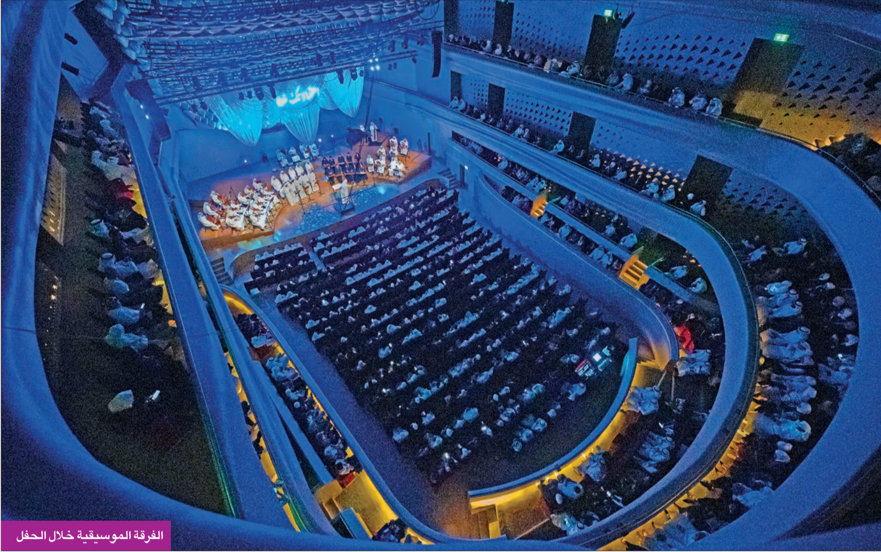
الفرقة الموسيقية خلال الحفل

الفرقة الموسيقية بقيادة نوري أبدعت واستذكرت بمشاركة 50 عازفاً ومغنياً أجمل الأصوات النسائية