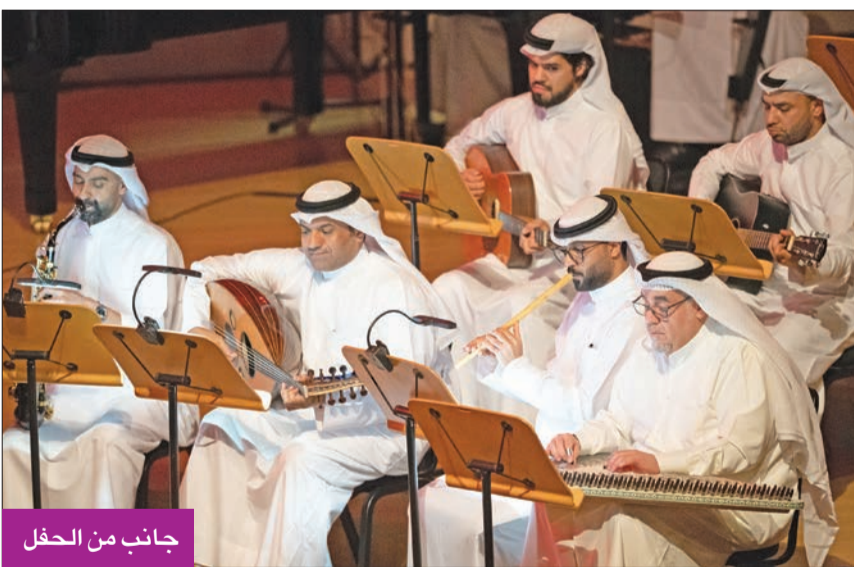
جانب من الحفل