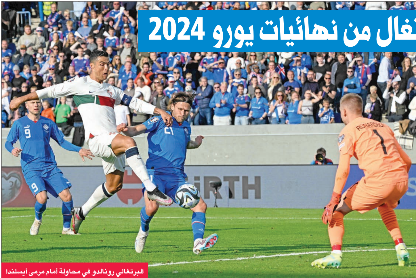
البرتغالي رونالدو في محاولة أمام مرمرى آيسلندا

سجل كريستيانو رونالدو هدفاً متأخراً ليقيده البرتغال للفوز 1 - 0 صفر على مضيفتها آيسلندا الثلاثاء، ليعزز صدارة بلاده للمجموعة العاشرة لتصفيات بطولة أوروبا لكرة القدم.