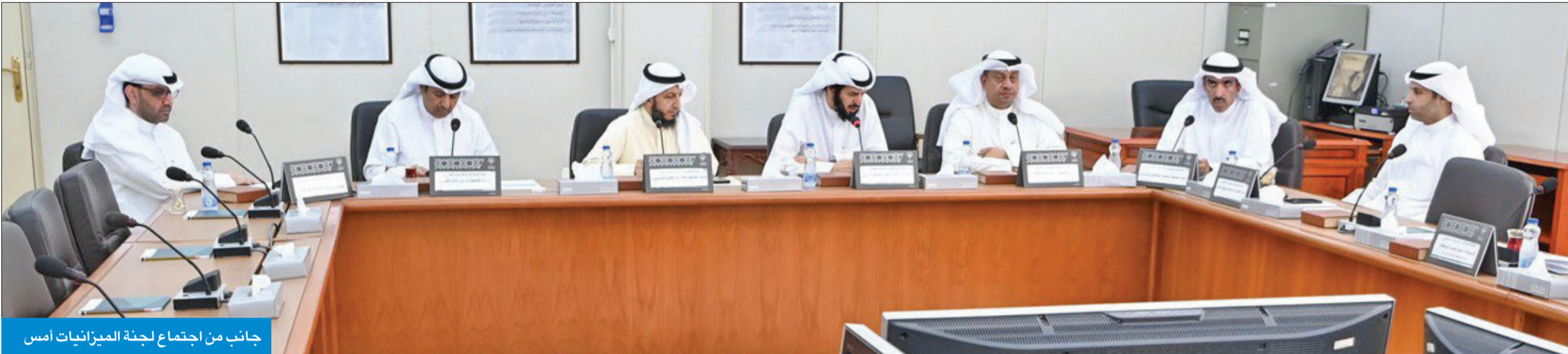
جانب من اجتماع لجنة الميزانيات أمس

الزيد: «الميزانيات» أمامها تحديات كبيرة لإقرار الميزانية المقبلة وستنجزها في الوقت المحدد