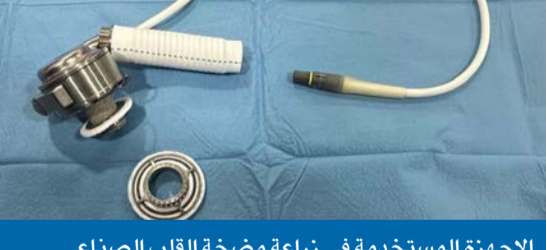
الإجهزة المستخدمة في زراعة مضخة القلب الصناعي

أعلنت وزارة الصحة نجاح أول زراعة مضخة قلب صناعي (Impella 5.5) في الكويت، وللمرحلة الثانية على مستوى الوطن العربي، لمواطن في العقد السادس من العمر، إلى جانب زراعة مضخة قلب صناعي أخرى دائمة في الجهة اليسرى (LVAD). وفي هذا الصدد،