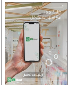
مزايا برنامج التكافل

قدمت شركة بيتك للتأمين التكافلي «بيتك تكافل» مزايا وخصومات لعملائها حاملي بطاقات التأمين الصحي على العديد من الخدمات ذات العلاقة بالتأمين الصحي ومنها الأندية الرياضية والتغذية الصحية والعناية الدائمة طوال فترة سريان وثيقة التأمين الصحي تحت برنامج امتيازات تكافل. ويأتي ذلك في إطار سعي الشركة الدائم بالاهتمام في الأنشطة التي تتناسب مع طموحات عملائها ومنحهم امتيازات إضافية بمجرد كونهم عملاء «بيتك تكافل»، حيث نسعى جاهدين لتوفير تجربة مميزة لهم. ووقعت «بيتك تكافل» بالتعاون مع مختلف الشركات والمتاجر اتفاقيات لتقديم خصومات على مختلف الأندية الرياضية والعيادات الطبية وخدمات التغذية الصحية إضافة لمراكز العناية لعملاء التأمين الصحي بهدف توفير كل السبل لتشجيع عملائنا على تحسين الصحة العامة والقدرة على اتباع نمط حياة صحي وهذا سيساهم في الوصول إلى صحة جيدة باعتبار أن الرياضة والغذاء