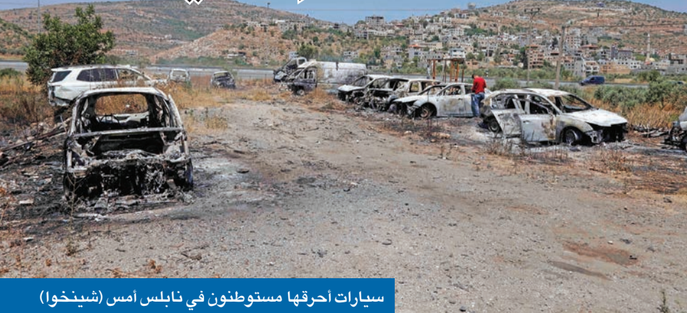
سيارات احرقها مستوطنون في نابلس أمس (شيشخو)

شنّ مستوطنون إسرائيليون مساء أمس الأول هجمات انتقامية ضد مدنيين فلسطينيين في الضفة الغربية المحتلة، في حين أعلنت حكومة بنيامين نتنياهو تسريع الاستيطان في الضفة، كما نفذ الجيش الإسرائيلي حملة اعتقالات رداً على مقتل 4 إسرائيليون في هجوم نفذه فلسطينيان ينتميان إلى حركة حماس قرب مستوطنة عيلي بين مدينتي رام الله ونابلس رداً على اقتحام إسرائيلي