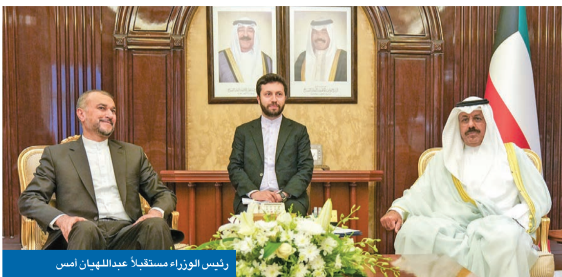
رئيس الوزراء مستقبلاً عبداللهيان أمس

نحلت اتصالات جرت في الساعات الأخيرة في تامين زيارة وزير الخارجية الإيراني حسين أمير عبداللهيان إلى الكويت، في إطار جولته الخليجية التي شملت قطر وعمان، والتي نُختمت بالإمارات، وعنوانها الأساسي التقارب الذي تشهده العلاقات الخليجية. الإيرانية على ضوء الاتفاق السعودي - الإيراني، وضرورة إغلاق وتسوية جميع الملفات الخلافية، إلى جانب التطورات التي يشهدها الملف النووي، وإمكانية إحياء مفاوضاته الدولية مع إيران في فيينا، والتي توأمتها تقاضيات أميركية - إيرانية للتهدئة وبناء الثقة. ورغم أن زيارة عبداللهيان للكويت جاءت في إطار جولته الخليجية، فإنها كانت فرصة لبحث القضايا الثنائية، لا سيما أن الوزير الإيراني كان يرغب في زيارة البلاد منذ تسلمه منصبه، لكنها تأجلت عدة مرات لأسباب متعددة. ووصل عبداللهيان إلى الكويت قادماً من مسقط، وكان في استقباله بالمطار وزير الخارجية الشيخ سالم الصباح. وعقب ذلك أجرى عبداللهيان مباحثات مع رئيس مجلس الوزراء سمو الشيخ أحمد النواف، تناولت العلاقات الثنائية، وسبل تعزيز التعاون، وتبادل الإراء بشأن آخر المستجدات الإقليمية والدولية. وأفادت مصادر دبلوماسية إيرانية لـ «الجريدة»، بأن عبداللهيان استغل فرصة زيارته لتقديم ضمانات للمسؤولين الكويتيين