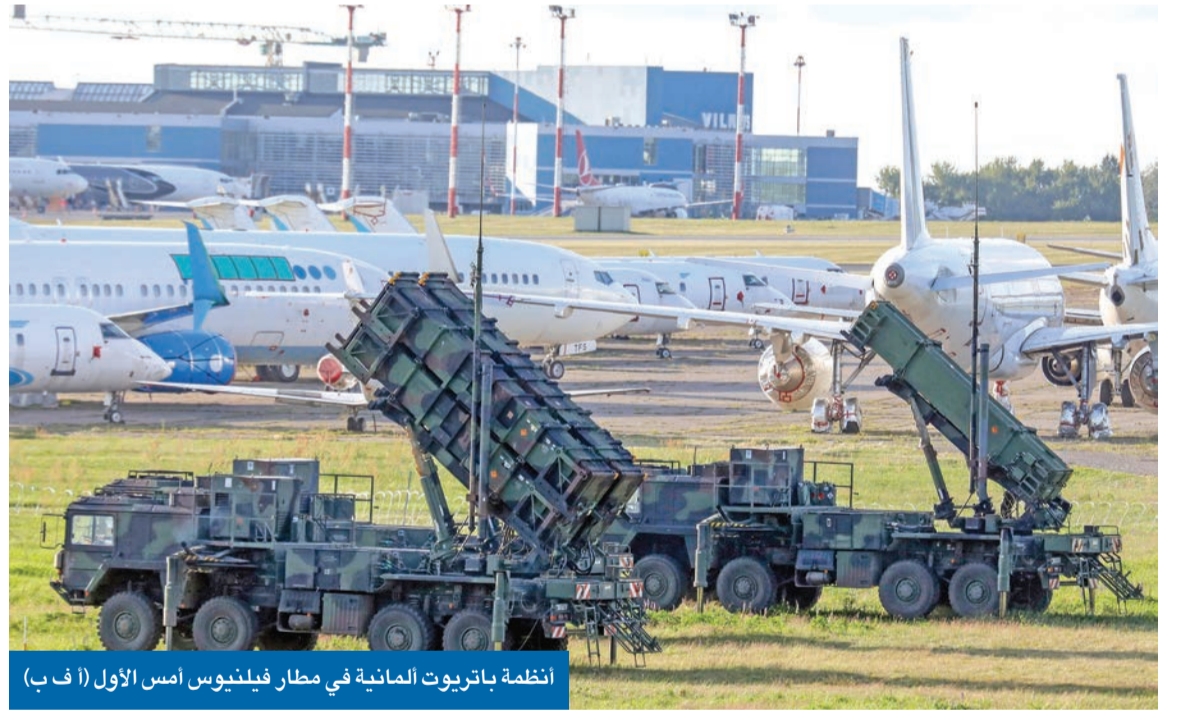
انظمة باتريوت المانية في مطار فيلنيوس امس الاول

نشر صواريخ باتريوت ومضادات جوية مع قوات خاصة وطائرات ومدافع