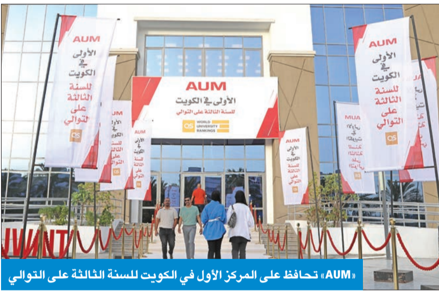
«AUM» تحافظ على المركز الأول في الكويت للتصنيف QS للمرة الثالثة على التوالي

بحضور الآلاف من طلبتها وخريجها في حرمها الجامعي