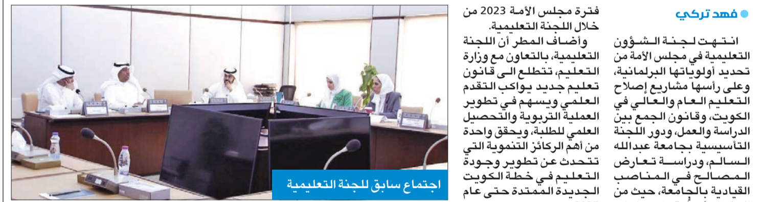
اجتماع سابق للجنة التعليمية

من المجلس أهمها ما يتعلق بموضوع الأمن الغذائي. وأوضح أن اللجنة أنتجت الى ضرورة أن تكون لحكومة الكويت رؤية واضحة لإنجاز استراتيجي للأمن الغذائي، والذي تعتبر الكويت بحاجة ماسة إليه، خاصة في الأزمات، وذكر أن الكويت تمتلك تجربة كبيرة فيما يتعلق بقضية الأمن كانت خلال الأزمات التي مرت بها البلاد، خاصة كورونا، لافتاً إلى أن الكويت تمتلك كل الإمكانيات الكفيلة لإنجاز الأمن الغذائي في البلاد على كل الصعيد والمستويات والمجالات، ولا يتقصها شيء. وتابع أن اللجنة تمتلك رؤية طموحة للأمن الغذائي، وستجتمع مع اللجنة الوطنية الحكومية للأمن الغذائي من أجل بلورة التصور النهائي للأمن الغذائي، فهناك قوانين لا بد أن ينجزها مجلس الأمة لتكرس الأمن الغذائي. وأكد أن الأمن الغذائي على هرم أولويات لجنة البيئة والأمن الغذائي والمائي في المجلس، إضافة