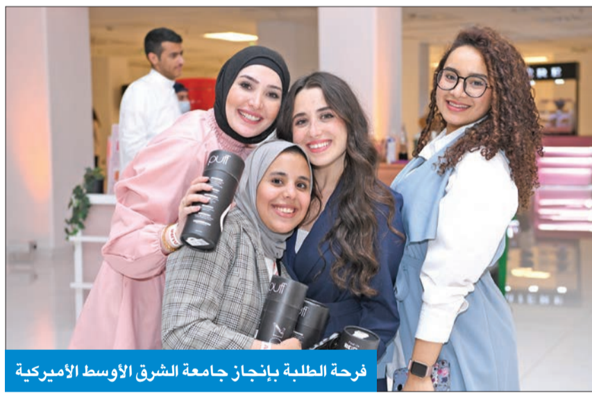
فرحة الطلبة بإنجاز جامعة الشرق الأوسط الأميركية

الإنجاز العالمي يعزز سمعة الجامعة ويؤكد مكانتها الإقليمية في قطاع التعليم العالي