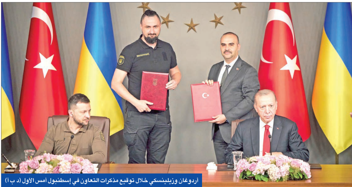
أردوغان وزيلينسكي خلال توقيع مذكرات التعاون في إسطنبول أمس الأول

وعـــارض مـــشرعون ديمقراطيون بارزون الرئيس الأميركي في قراره المثير للجدل، قائلين إن إمداد كيف بأسلحة تحظرها نحو 120 دولة، بمثابة «تنازل عن العبء الأخلاقي»، وإن من شأن تلك الخطوة أن تؤدي إلى «قتل المدنيين دون تمييز». وانتقد الديمقراطيون في لجنة القواعد بمجلس النواب، ولجنة تمويل وزارتي الدفاع (البنائون) والخارجية، بايدن علناً في حادثة نادرة، معلنين مخالفتهم للرئيس الديمقراطي. في هذه الأثناء، أدانت الأمم المتحدة الخسائر في صفوف المدنيين بسبب الهجوم على أوكرانيا في بيان بمناسبة مرور 500 يوم على انطلاق العملية الروسية الخاصة. وقالت العبة الأمريكية، إن أكثر من 9 آلاف مدني بينهم 500 طفل قتلوا منذ بدء الغزو، مع أن مسؤولي الأمم المتحدة صرحوا في السابق أن العدد الفعلي أكبر بكثير على الأرجح. (إسطنبول، ١٠ ف ب، رويترز، د ب أ)