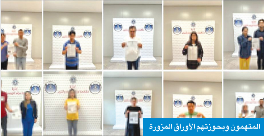
المتهمون وبحوزتهم الأوراق المزورة

وذكر أن رجال دوريات الإدارة العامة للمرور أحالوا 47 مطلوباً أمنياً، تنوعت