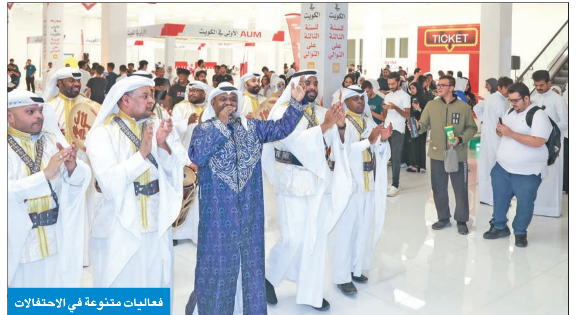
فعاليات متنوعة في الاحتفالات