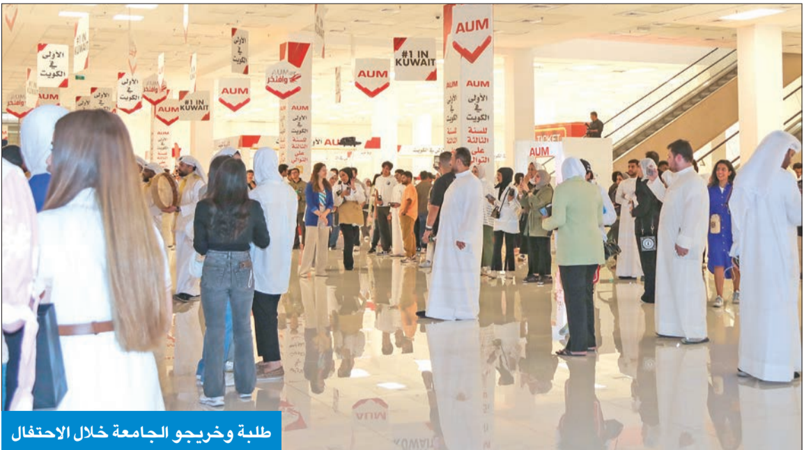
طلبة وخريجو الجامعة خلال الاحتفال

التقدم العالمي المتميز والمستمر للجامعة يُعد اعترافاً بجودة تعليم «AUM»