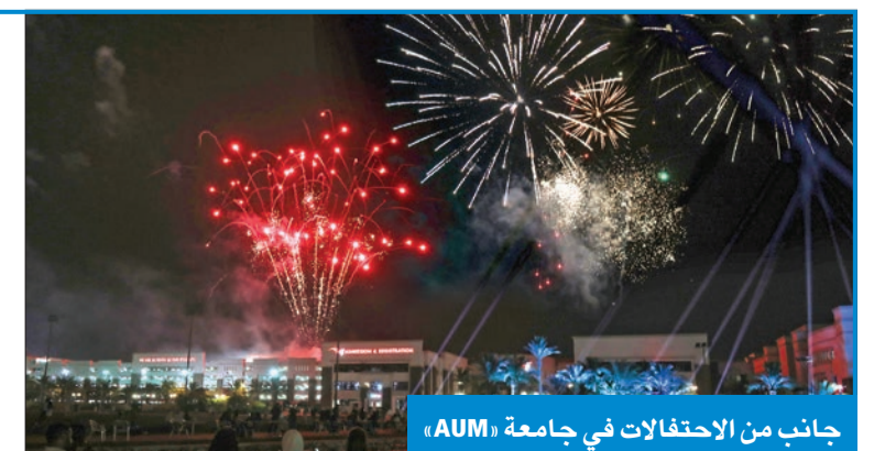
جانب من الاحتفالات في جامعة «AUM»