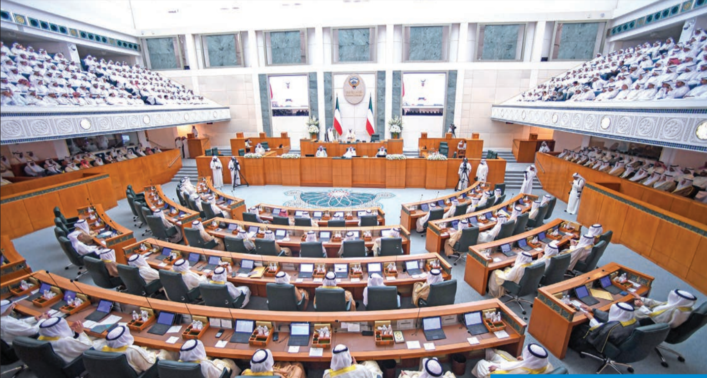
جانب من الجلسة الافتتاحية لمجلس 2023

موجة مطالبات بزيادات تشمل بدل الإيجار وعلاوة الأولاد وقرض البناء