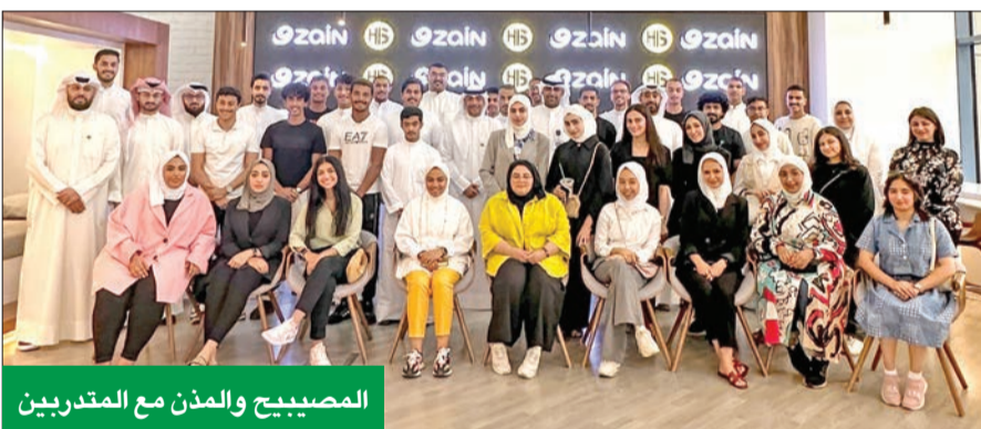
المصبيح والمدن مع المتدربين

انطلاق الموسم الرابع من البرنامج الميداني بالتعاون مع «HS Store»