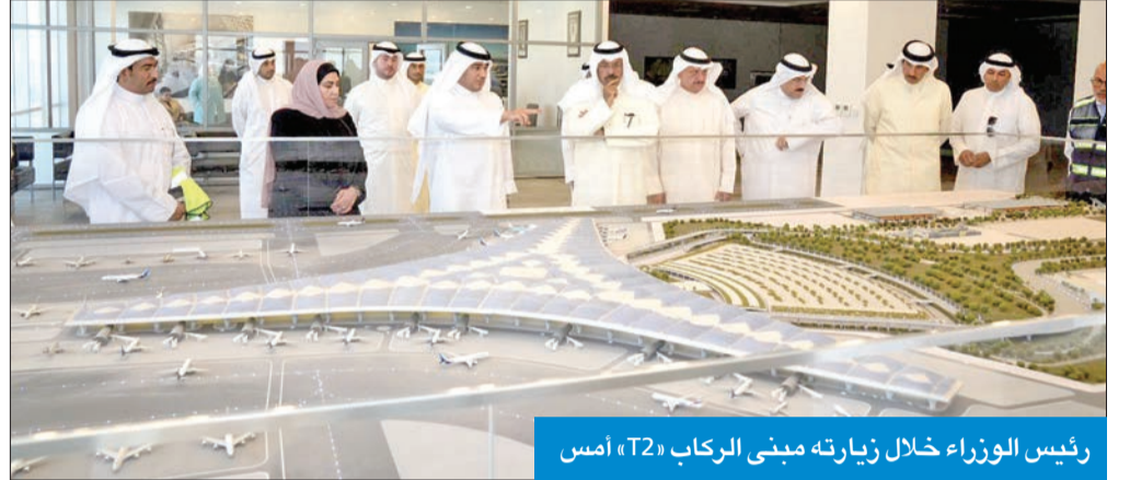
رئيس الوزراء خلال زيارته مبنى الركاب «T2» أمس

صاحفي عقب زيارته، عن بالغ اعتزازه وتقديره للدور البارز والمشهود الذي تميزه الكوادر الوطنية والطاقات الشبابية المشاركة في تنفيذ المشروع بكل كفاءة واقتدار، وما يتحلقون به من مسؤولية مهنية، بالتعاون مع الشركة العالمية المنفذة.