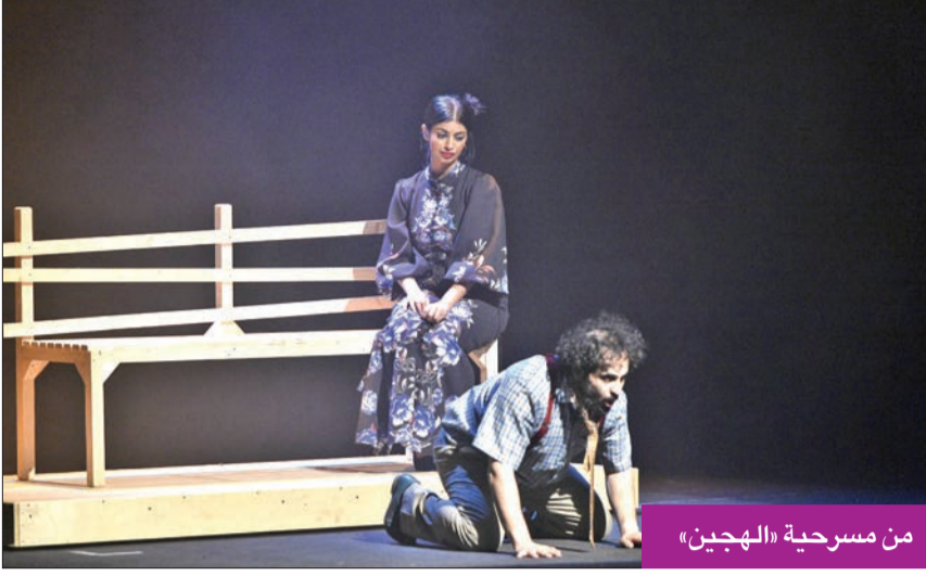
من مسرحية «الهبجين»

«أنوي تجربة الدراما والسينما ولديّ نصوص لم ترَ النور»