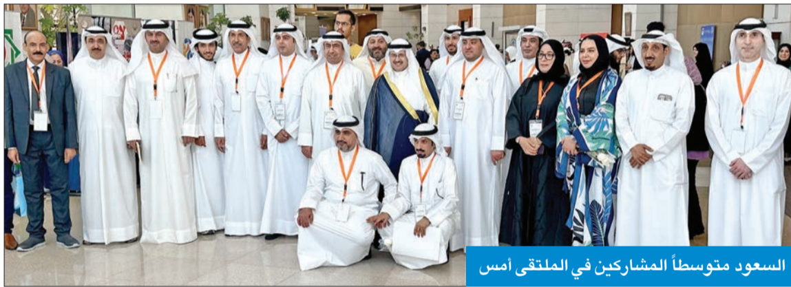
السعود متوسطاً المشاركين في الملتقى أمس

أطلقت إدارة رعاية الأحداث في وزارة الشؤون، أمس، الملتقى العلمي الاجتماعي الأول تحت شعار «نحو مجتمع آمن بعيداً عن المخدرات»، بالتعاون مع الجهات الحكومية المعنية، برعاية وحضور وزير الشؤون الاجتماعية وشؤون الأسرة والطفولة الشيخ فراس السعود. وأكد الوزير السعود، في تصريح، على هامش الملتقى، أن ثمة جهوداً مضنية مبذولة من جهات الدولة كافة، سواء الحكومية أو منظمات المجتمع المدني، لمكافحة ومجابهة هذه الآفة التي تستهدف في المقام الأول الشباب، مؤكداً أنه «بالتعاون والشراكة الواسعة بين هذه الجهات نحن قادرون على هزيمة، في ظل جهود مجلس الوزراء وتضاف جميع الجهات، وعلى رأسها وزارتا الشؤون الداخلية والعمل فيما يخص الشق الأمني والقانوني، إضافة إلى وزارة الصحة المعنية بالشق العلاجي، ووزارتَي الشؤون والإعلام فيما يخص الجانب الوقائي والتوعوي بإخطار هذه الآفة، إلى جانب