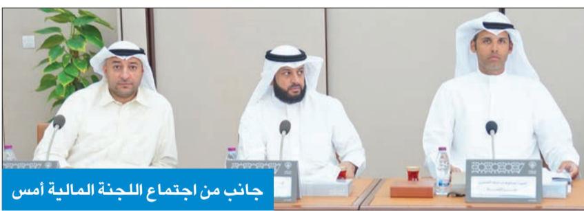
جانب من اجتماع اللجنة المالية أمس

في مجال اخر، وافقت لجنة الشؤون الصحية والاجتماعية والعمل خلال اجتماعها أمس الأحد بحضور وزير الصحة د. أحمد العوضي على تعديل