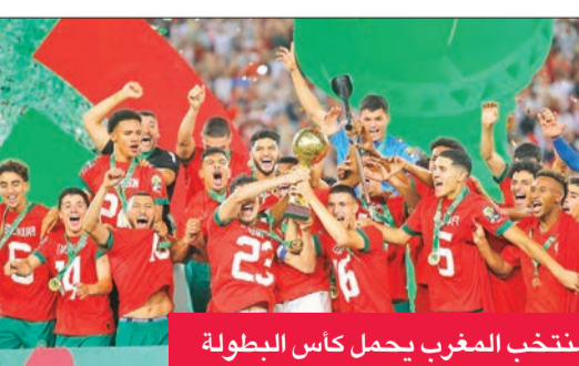
منتخب المغرب يحمل كأس البطولة

جَزء المنتخب المغربي الأولمبي نظيره المصري المنقوص من لقب كأس الأمم الإفريقية لكرة القدم تحت 23 عاماً، بفوزه عليه في المباراة النهائية 1-2 في التمديد بعد انتهاء الوقت الأصلي بالتعادل 1-1 السبت على ملعب «الأمير المغربية الرباط» ويواصلها إلى النهائي، ضمن المنتخبان العربيان التأهل لنهائيات مسابقة كرة القدم في أولمبياد باريس 2024 برفقة منتخب مالي الذي أحرز المركز الثالث بفوزه على نظيره الغيني 3-4 وبركلات الترجيح. وهذا اللقب الأول لمنتخب «أسود الأطلس» من أصل 4 نسخ من المسابقة، بقيادة المدرب عصام الشرعبي، وبتشكيلة محترفة باغلبية عناصرها في الجنوب المركز الخامس عشر بنفس الرصيد. وفي المباراة الأخيرة، حلح البلك الأهلي، صاحب المركز الحادي عشر بـ 35 نقطة، ضيفاً ثقيلاً على غزل المحلة السابع عشر بـ 32 نقطة. وفي نفس التوقيت، يلتقي طلائع الجيش مع أسوان، إذ يحتل الفريق العسكري المركز الرابع عشر بـ 33 نقطة، وأبناء الجنوب المركز الخامس عشر بنفس الرصيد. وفي المباراة الأخيرة، حلح البلك الأهلي، صاحب المركز الحادي عشر بـ 35 نقطة، ضيفاً ثقيلاً على غزل المحلة السابع عشر بـ 32 نقطة. باللعب مع تعادل أو خسارة فريق بيراميدز، صاحب مركز الوصافة، لمباراته أمام سيراميكا كليوباترا، والتي تقام في السابعة والنصف اليوم (الاثنين) في ملعب المغاولون بالجبل الأخضر. ويحتل سيراميكا كليوباترا المركز الثاني عشر برصيد 34 نقطة، فيما ضمن بيراميدز