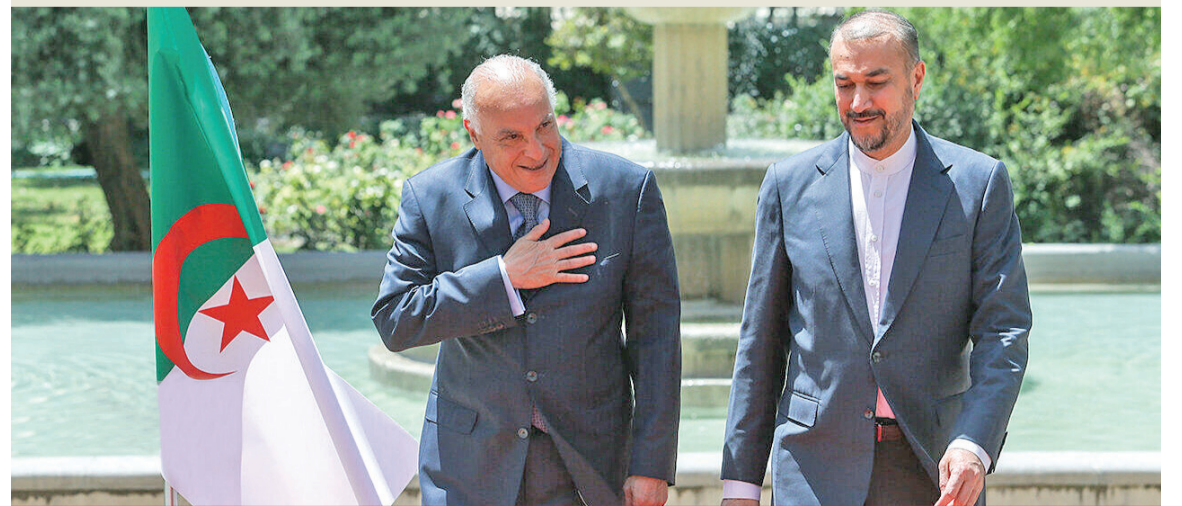
وزير الخارجية الإيراني ونظيره الجزائري خلال مؤتمر مشترك في طهران أمس الأول أعلن فيه إعادة العلاقات الدبلوماسية بين البلدين (إرنا)

● شمخاني يُغضب الأمن ويجمع قادة التيار في حفل زفاف ابنته دون تصريح ● السلطات تمنع خاتمي من إلقاء خطبة الزواج... وحسن الخميني لمنافسة رئيسي