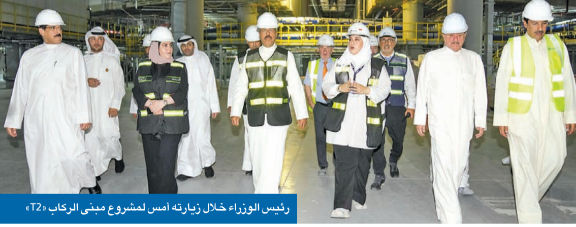
رئيس الوزراء خلال زيارته أمس لمشروع مبنى الركاب «T2»