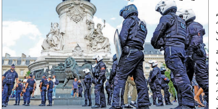
شرطة مكافحة الشغب بساحة الجمهورية وسط باريس أمس الأول

تعاون سعودي - فرنسي في الطاقة النووية وإنتاج الهيدروجين وتوليد الكهرباء