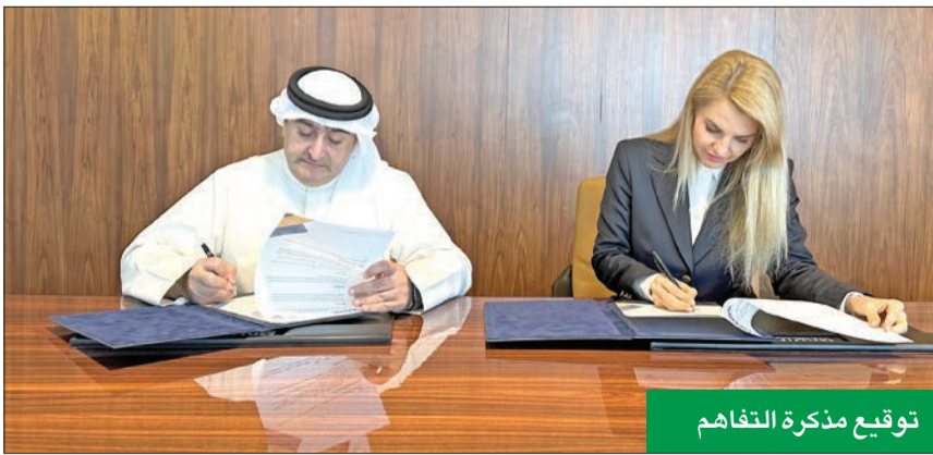
توقيع مذكرة التفاهم

في خلق مجموعة متنوعة من الفرص الاستثمارية التي قمنا بالتركيز عليها في تقاريرنا. أما أغربيتشان فإشارات إلى أن الخبرة العميقة والفهم الواضح للمشهد الاستثماري في الكويت على مر السنين من هيئة تشجيع الاستثمار المباشر في الكويت عززا جهود البحث والتحليل في مجموعة أكسفورد للأعمال، مما أتاح رؤية نافذة لما يمكن توقعه في المرحلة القادمة من التطور الاقتصادي والاجتماعي للبلاد.