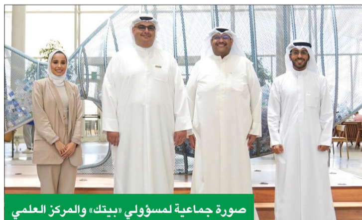
صورة جماعية لمسؤولي «بيتك» والمركز العلمي

في إطار شراكته الاستراتيجية مع المركز العلمي