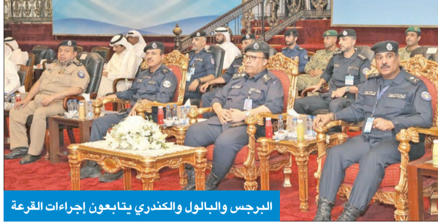
البرجس والبالول والكتري يتابعون إجراءات القرعة

برعاية النائب الأول لرئيس مجلس الوزراء وزير الداخلية الشيخ طلال الخالد، وحضور وكيل وزارة الداخلية الفريق أنور البرجس، والوكيل المساعد لقطاع التدريب والتعليم اللواء بدر البالول، وعدد من قيادات وضباط القطاع، أجريت مساء أمس الأول بميدان أكاديمية سعد العبدالله للعلوم الأمنية القرعة العلنية للمتقدمين للالتحاق بدورة الطلبة الضباط الدفعة 48 من حملة شهادة الثانوية العامة ممن اجتازوا الشروط والمعايير الأمنية، وأسفرت القرعة عن قبول 600 طالب من 5590