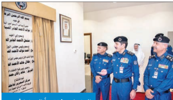
المكراد مفتتحاً المركز أمس

التقى وكيل وزارة الداخلية الفريق أنور البرجس صباح أمس مسؤولي وممثلي الحسينيات ودور العبادة بحضور وكيل وزارة الداخلية المساعد لشؤون الأمن العام اللواء عبدالله الرجيب وعدد من القيادات الأمنية المعنية. وفي بداية اللقاء رحب البرجس بالحضور ونقل تحيات النائب الأول لرئيس مجلس الوزراء وزير الداخلية الشيخ طلال الخالد، مؤكداً أن تعليمات وتوجيهات الوزير الخالد تقضي بتسهيل جميع الإجراءات المتعلقة بتأمين مجالس الحسينيات ودور العبادة. واستمع البرجس إلى ملاحظات واقتراحات الحضور وتم طرح العديد من الأسئلة والاستفسارات وتم الرد عليها بكل شفافية ووضوح، موجهاً القيادات الأمنية بأخذ ما يتوكل منها مع الخطة الأمنية وبما يساهم في تأمين جميع الحسينيات وروادها خلال إحياء ليالي عاشوراء في شهر المحرم. وأشاد البرجس بتعاون مسؤولي وممثلي الحسينيات وروادها خلال العام الماضي بما ساهم في نجاح عملية التأمين، متمنياً من الجميع المزيد من التعاون المستمر الذي يخدم المصلحة العامة. وفي ختام الاجتماع أشاد مسؤولو وممثلي الحسينيات بجهود وزارة الداخلية، معربين عن شكرهم وتقديرهم لرجال الأمن.