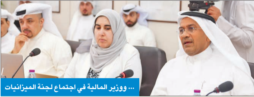
... ووزير المالية في اجتماع لجنة الميزانيات