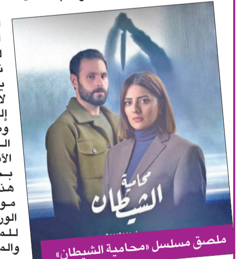
ملصق مسلسل «محامية الشيطان»

وأسس المسرح الأكاديمي، وأسس وعناصر المسرح المعاصر، وكتابة النص التلفزيوني. وركزت العامر أن آخر موعد للتسجيل نهاية العام الكويتي، وتنوّلها لافتة إلى أنها وصلتها العديد من الأسئلة بخصوص هذه الورشة، موضحة أن الورشة تصلح للمبتدئين والمتحسين،