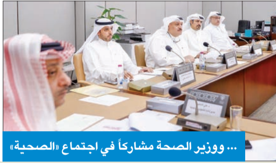
... ووزير الصحة مشاركا في اجتماع «الصحية»