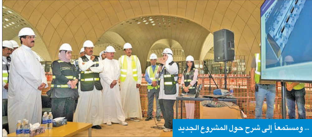
... ومستمعاً إلى شرح حول المشروع الجديد

● دور بارز ومشهود للكوادر الوطنية والطاقات الشبابية المشاركة في تنفيذه