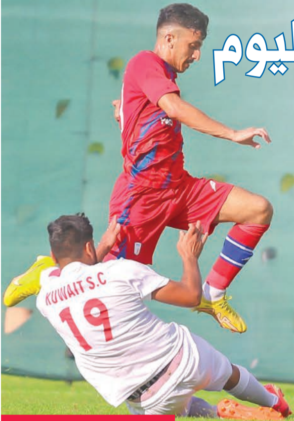
جانب من مباراة الكويت وأبها

حقيقياً للمستوى الفني والبدني الذي وصل له الأبيض في الوقت الحالي بمعسكره. ويأتي المعسكر ضمن الاستعدادات لخوض منافسات المجموعة الرابعة من بطولة كأس الملك سلمان للنادية الأبطال، والتي تستضيفها السعودية بشكل مجمع حتى انتهاء البطولة خلال الفترة من 27 الجاري حتى 12 أغسطس المقبل. وتضم المجموعة الرابعة أربعة أندية: الوحدة الإماراتي، والرجاء المغربي، وشباب بلوزداد، بالإضافة إلى نادي الكويت، على أن يتناهل متصدرو وصف المجموعة إلى دور الثمانية، الذي سيقام بنظام خروج المغلوب من مباراة واحدة.