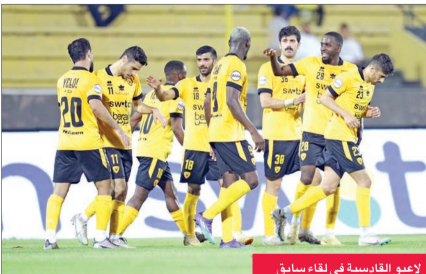
لاعبو القادسية في لقاء سابق