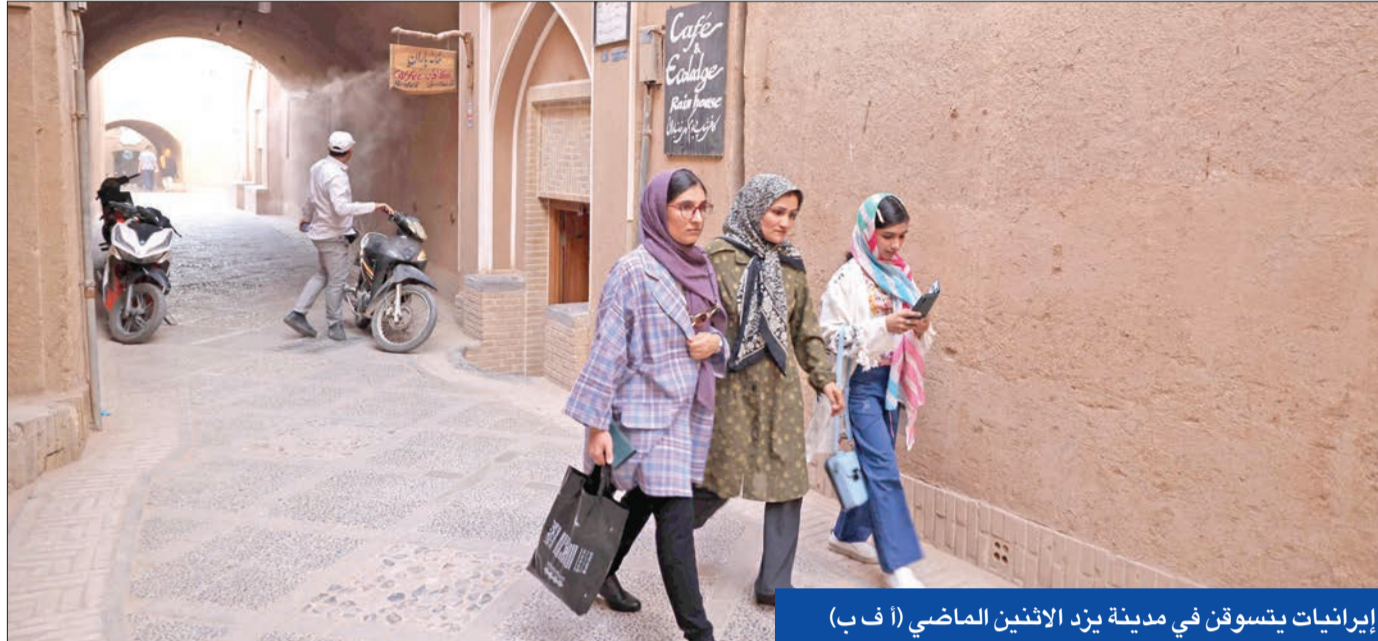
إيرانيات يتسوقن في مدينة يزد الاثنىن الماضي

فض اعتصام لأنصار التيار المتشدد للضغط على القضاء ورفض مطالبته بتغليظ عقوبة كشف الرأس إلى حد الإعدام