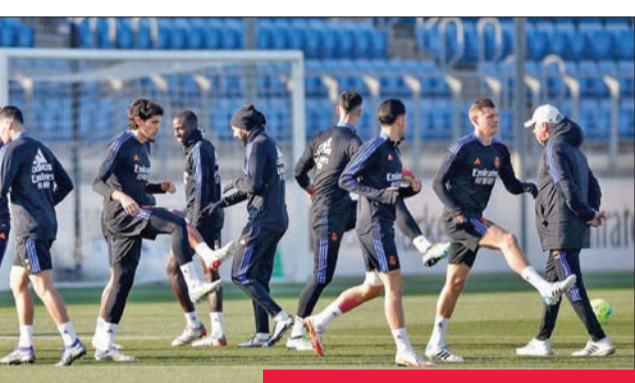
جانب من تدريب سابق لريال مدريد

الاوروبية التي أقيمت في يونيو الماضي بسبب إصابة في الركبة. ومن ضمن المستجدين أيضاً، انضمام إبراهيم دياز الذي عاد للفريق الملكي بعد انتهاء فترة إعارته لميلان. وتفي غياب الحارس البلجيكي تيبو كورتوا، وداني كاربخال، وإدير ميليتاو، ودافيد ألبا،