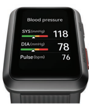
إضافة إلى ذلك، تدعم ساعة HUAWEI WATCH D أيضاً مراقبة تخطيط كهربية القلب (ECG) التي تذكر المستخدم بإجراء قياسات ECG بمجرد اكتشاف معدل ضربات القلب غير الطبيعي.

الساعة الجديدة تتميز بقياس دقيق لضغط الدم وتحليل تخطيط كهربية القلب (ECG) وميزات إدارة صحية شاملة بتصميم أنيق