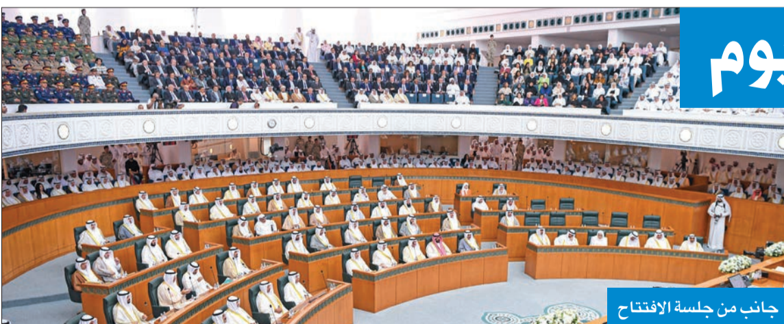
جانب من جلسة الافتتاح

وامتيازات وإنشاء بعثة الاتحاد الأوروبي في دولة الكويت إضافة إلى مشروع قانون بالموافقة على مذكرة تفاهم بين حكومي الكويت وكوريا في مجال التعاون والمساعدة المتبادلة في الشؤون الجمركية. وتضمن البند تقريراً عن مشروع قانون بالموافقة على مذكرة تفاهم بين حكومي الكويت وتركيا للتعاون في مجال الاستخبارات إضافة إلى مشروع قانون بالموافقة على انضمام الكويت إلى اتفاقية حول إنشاء المعهد العالمي للنمو الأخضر.