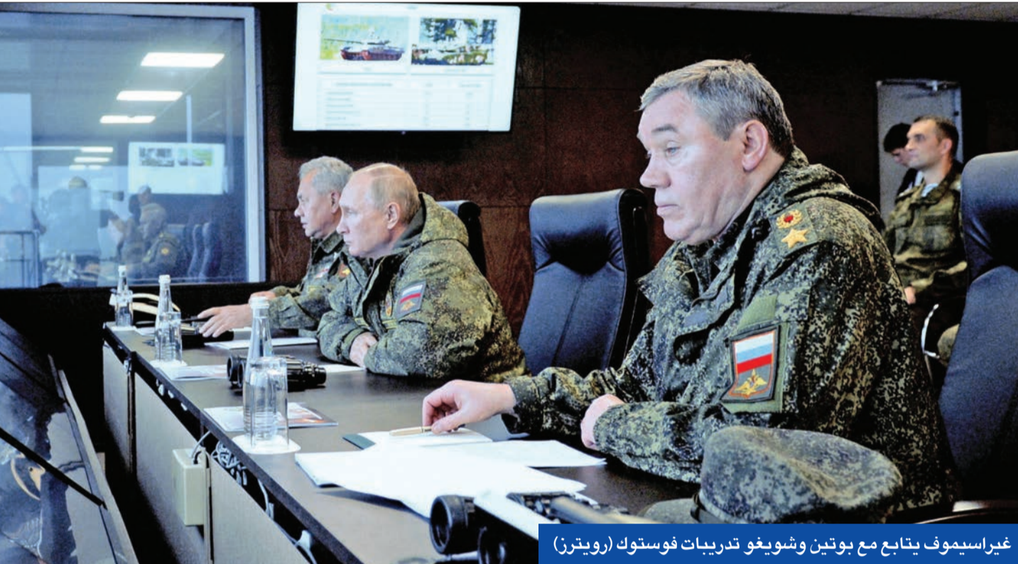
غيراسيموف يتابع مع بوتين وشويغو تدريبات فوستوك

الغدرالية الروسي، فالنتينا ماتفيينكو، قرب يمكن، أنه يتعين على روسيا والصين تعزيز التعاون في إطار الآليات المتعددة الأطراف وحماية مصالح الدول النامية. وأضاف شي: «يتعين على الأطراف تعزيز العلاقات والتعاون في إطار الآليات المتعددة الأطراف مثل «منظمة شنغهاي» للتعاون و«بريكس» وتحديد الاتجاه الصحيح لإصلاح الحوكمة العالمية، وحماية المصالح المشتركة لسلاسل الإنتاج والدول النامية. وأعلنت رئاسة مجلس الفيدرالية الروسي فالنتينا ماتفيينكو، خلال لقائهما مع الرئيس الصيني، أنها تنقل له رسالة من الرئيس الروسي فلاديمير بوتين.