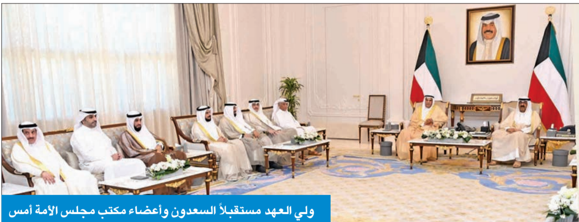
ولي العهد مستقبلاً السعدون وأعضاء مكتب مجلس الأمة أمس

استقبل سمو ولي العهد الشيخ مشعل الأحمد، بقصر بيان صباح أمس، ورئيس مجلس الأمة أحمد السعدون، وأعضاء مكتب المجلس لدور الانعقاد العادي الأول للفصل التشريعي السابع عشر؛ كلاً من نائب رئيس المجلس محمد المطير وأمين سر المجلس د. مبارك الطشة، ومراقب المجلس د. محمد الحويلة، ورئيس لجنة الشؤون التشريعية والقانونية مهدي السايير، ورئيس