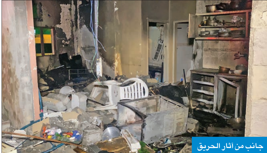
جانب من أثار الحريق

المطبخ والغرفة المجاورة له، وعلى الفور تم إخلاء العمارة والتعامل مع الحوادث، الذي