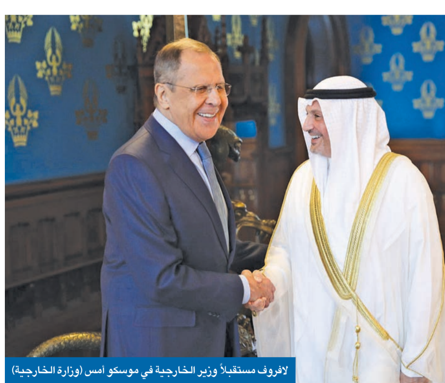
لافروف مستقبلاً وزير الخارجية في موسكو أمس

وقال وزير الخارجية الروسي سيرغي لافروف، في كلمة ترحيبية بنظرائه الخليجين وفي