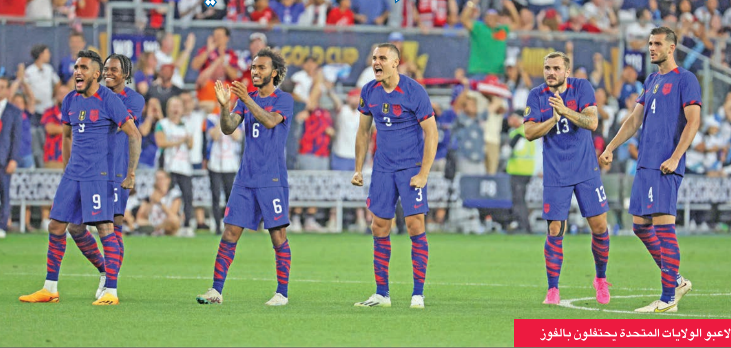
لاعبو الولايات المتحدة يحتفلون بالفوز

مع نادي أف سي سينسيناتي، وترجم براسه عرضية ديخوان جونز. لكن كندا ردت في الوقت البديل عن ضائع، بمساعدة حكم الفيديو المساعد (في إيه آر)، فحافظ ستيفن فينوريا على هدوئه وعادل بعد لمسة يد على المضيف (3+90).