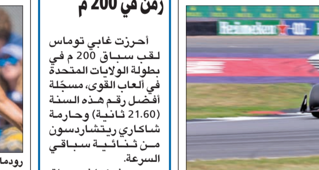
فيرستابن خلال السباق

كان الخامس عشر على خط الانطلاق. ورفع الهولندي بهذا الانتصار الثالث والأربعين في مسيرته، وصيده إلى نقطة في الصدارة بفارق 99 نقطة عن بيريس الثاني، وبات أيضاً على بعد انتصار آخر كي يصبح ثانياً على لائحة الانتصارات