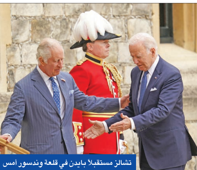
تشارلز مستقبلاً بايدن في قلعة وندسور أمس

ومن المتوقع أن ينشئ قادة الحلف منتدى جديداً رفيع المستوى تحت اسم مجلس الناتو وأوكرانيا للاستشارات ومحادثات الأزمات وسيحضر الرئيس فولوديمير