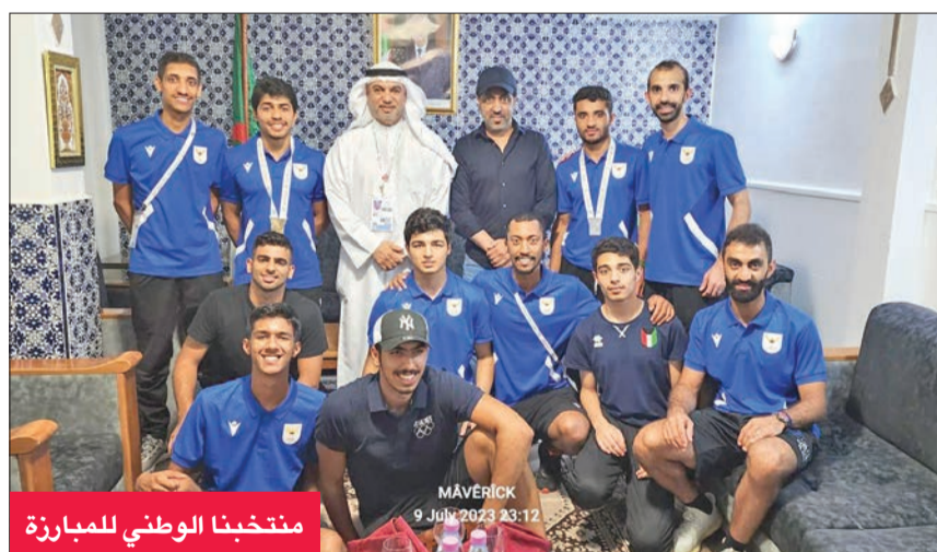
منتخبنا الوطني للمبارزة

عززت الكويت رصيداً من الميداليات في الألعاب العربية التي تستضيفها الجزائر حالياً، بإضافة ميداليتين جديدتين؛ إحداها فضية، والأخرى برونزية، في منافسة المبارزة، ليرتفع إجمالي عدد الميداليات الكويتية إلى ثلاث فضيات وثلاث برونزيات.