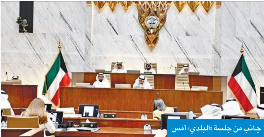
جانب من جلسة «البلدي» أمس

وأوصى كذلك بتوفير فرص وظيفية في كل إقليم لسكان الإقليم، كل على حدة، وتوفير 500 وظيفة لكل 1000 نسمة، مع ضرورة رؤية المخطط الهيكلي هي تحويل الكويت إلى مركز مالي وتجاري جذاب للاستثمار يقوم فيه القطاع الخاص بقيادة النشاط الاقتصادي، وتعزيز النشاط الاقتصادي للقطاع الخاص بحيث يكون 50% من القوى العاملة في القطاع غير الحكومي عام 2040. كما جاءت في التوصيات