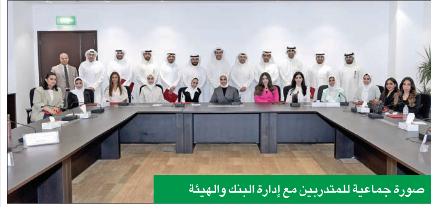
صورة جماعية للمتردين مع إدارة البنك والهيئة

وخلال الورشة تم تناول مجموعة من المحاور المتعلقة بالتسهيلات المشتركة والتعاون ما بين «بوبيان» وهيئة مشروعات الشراكة، بالإضافة إلى التطرق لموضوعات أخرى خاصة بهيئة تمويل المشاريع الكبيرة واشتراطات البنوك المتعارف عليها دولياً، والمعايير المطبقة في التمويل المشترك، وما يصاحبها من التزامات وتعهدات، والخطوات اللازمة للموافقة على تمويل