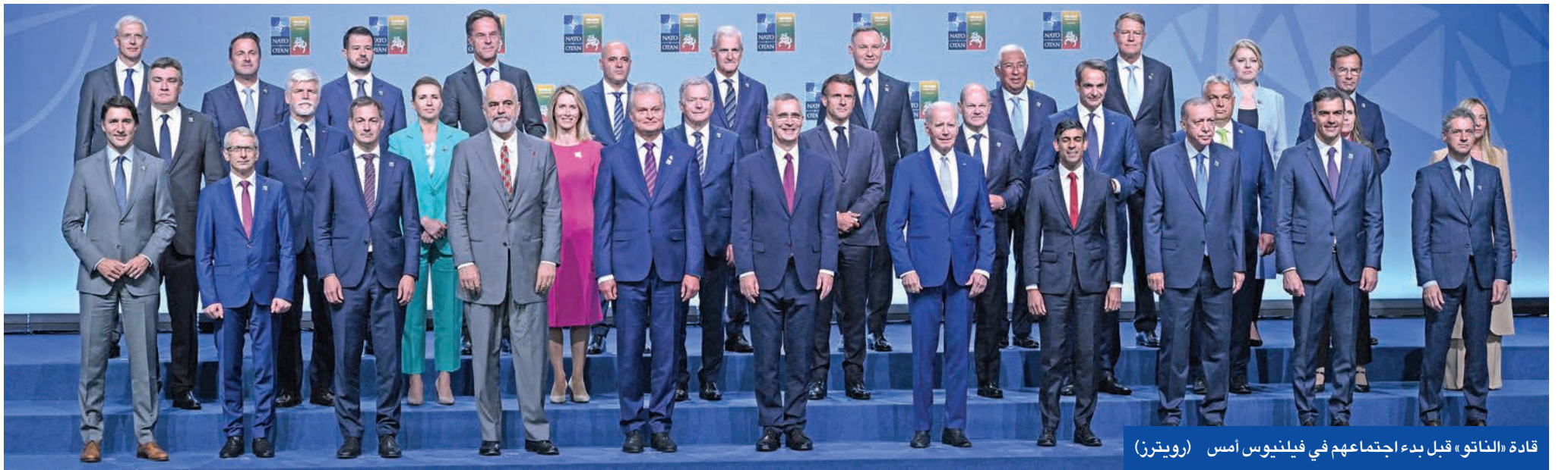
قادة «الناتو» قبل بدء اجتماعهم في فيلنوس امس

● قادة «الناتو» يعثون برسالة إيجابية لانضمام كييف... وزيلينسكي يستنكر التردد ويطالب بجدول زمني ● ضم السويد للحلف يعطي دفعة للعلاقات التركية - الأوروبية ويهدد بتداعيات سلبية على أمن روسيا