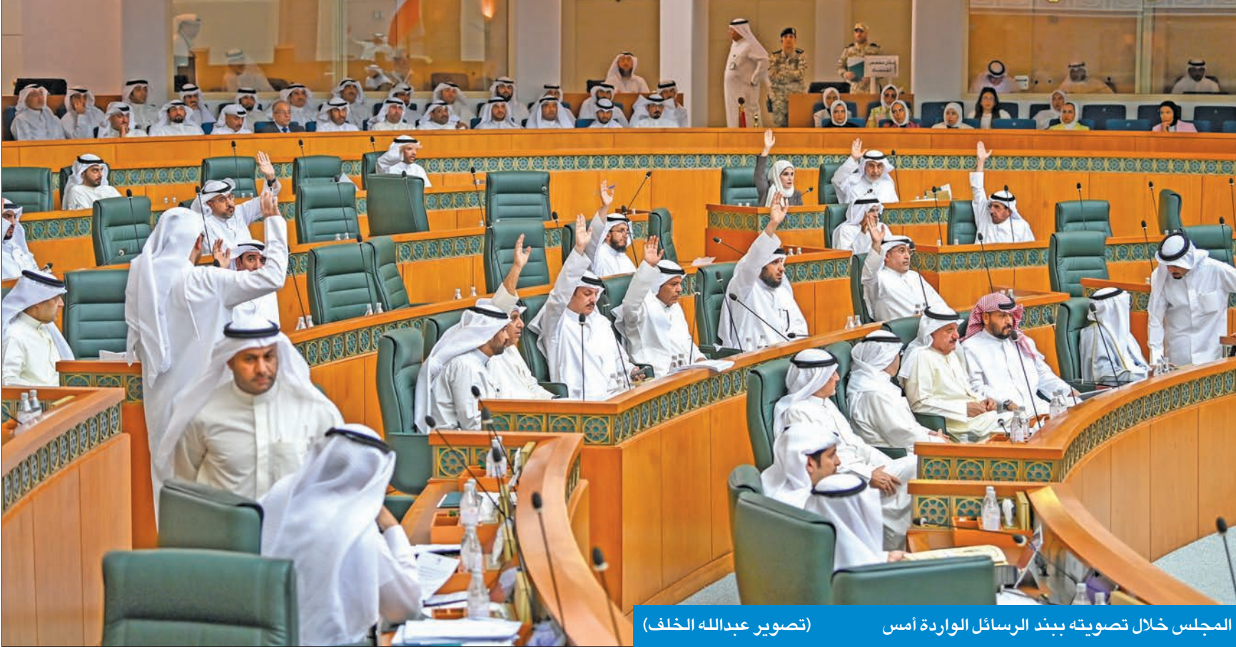
المجلس خلال تصويته ببند الرسائل الواردة أمس