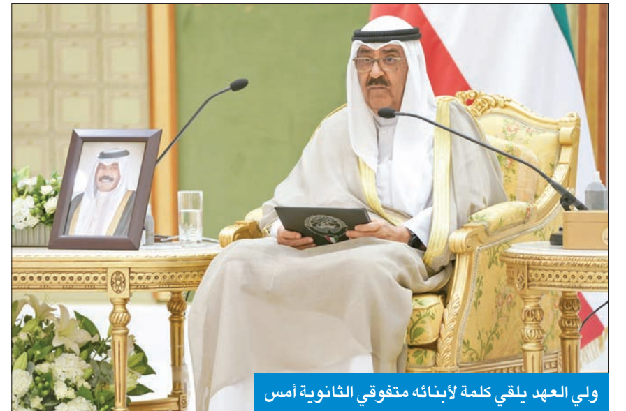
ولي العهد يلقى كلمة لابنائه متفوقا الثانوية امس

سديدة نسعى بكل عزيمة وإصرار من موقع شرف المسؤولية والثقة العالية التي كلفتمونا بها أن ننفيذ ونترجم توجيهات سموكم الحكيمة من خلال المضي قدما بتطوير التعليم عن طريق تنفيذ استراتيجيات حقيقية ومحددة الأهداف. واستطرد: بدانا العمل بها فعليا بمراحلها الأولية بطرق تتماشى تماما مع تحقيق رؤية الدولة منها تطبيق نظام رؤية القبول المركزي، من خلال توحيد نظام التقديم والانحاق الإلكتروني بمختلف مؤسسات التعليم العالي للحصول على المقاعد الدراسية. وأشار إلى افتتاح جامعة عبدالله السالم الحكومية ذات التخصصات المتسقة مع أهداف التنمية لتأخذ مسارها التعليمي الصحيح، وتكون باكورة مناهج تعليمي عال ومرموق مع الشفافية الكبرى جامعة الكويت، لكي تسهما في الارتقاء بمستوى الكويت في مؤشرات التعليم العالي العالمية، لافتا إلى فتح آفاق جديدة أمام أبنائنا الطلبة من خلال تطوير خطط الابتعاث الداخلي والخارجي في التخصصات التي يحتاجها سوق العمل.