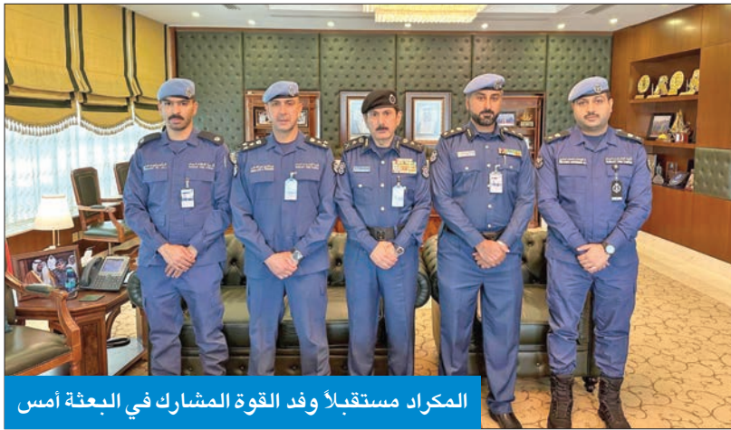
المكرد مستقبلاً وفد القوة المشارك في البعثة أمس

المكرومة والتأكد من استيفائها لاشتراطات السلامة والوقاية من الحريق حفاظاً على سلامة حجاج بيت الله الحرام. وشكر المكرد أعضاء الوفد، وأثنى على جهودهم، التي ساهمت بنجاح موسم الحج لتأمين سلامة ضيوف الرحمن، مثنياً في الوقت نفسه تعاون أصحاب حملات كيفية عمل الوفد وطريقة الجولات التفقدية التفقدية على مقار حملات الحج الكويتية في مكة