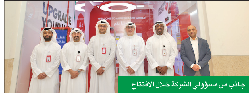
جانب من مسؤولي الشركة خلال الافتتاح

تقديم مجموعة واسعة من الخدمات والحلول المبتكرة، لتلبية مختلف شرائح العملاء، والحفاظ على رضا العملاء كاولوية قصوى. وتمتازت سبياً مع تركيز Ooredoo على التكنولوجيا المتقدمة، سيتم تجهيز الفرع الجديد بأحدث المرافق، بما في ذلك أكشاك الخدمة الذاتية التفاعلية، مما يتيح للعملاء الوصول إلى مجموعة من خدمات الاتصالات بشكل ملائم وفعال. تتضمن هذه الخدمات دفع الفواتير وتفعيل بطاقة SIM