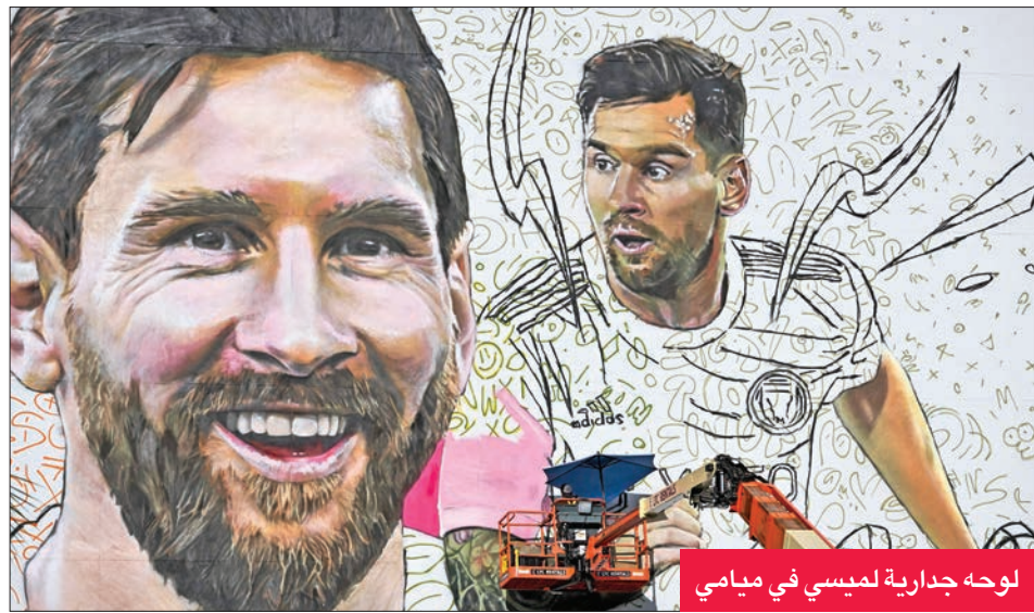
لوحة جدارية لميسي في ميامي

وأصبح قميص ليونيل ميسي الأرجنتيني ليونيل ميسي