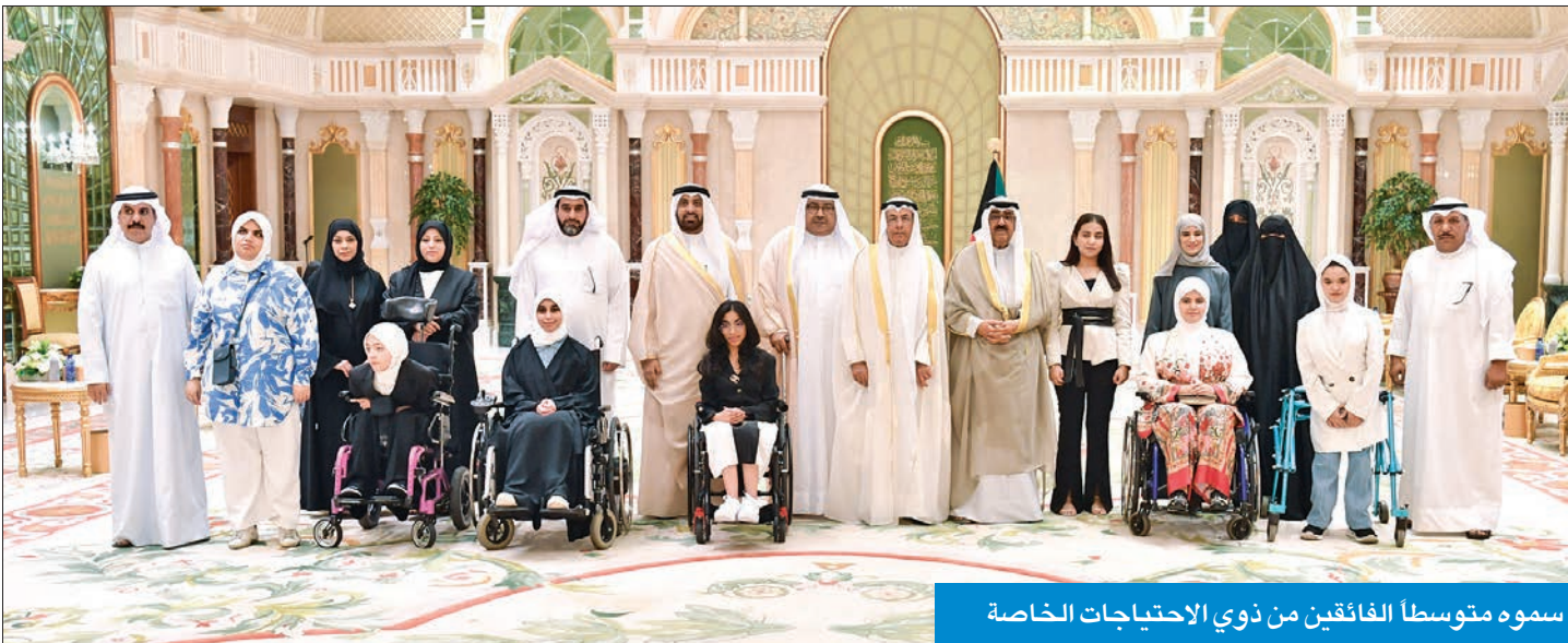
سموه متوسطا الفائقين من ذوي الاحتياجات الخاصة