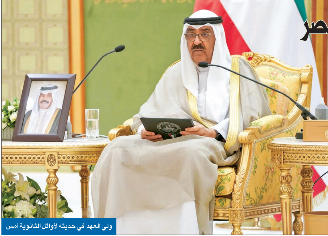
ولي العهد في حديثه لأوائل الثانوية أمس

العربي يبدشن تدريباته اليوم تحت قيادة برادريش