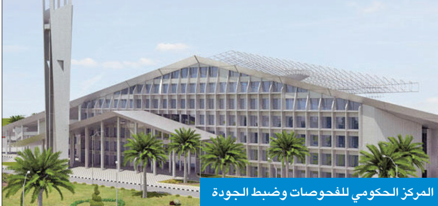
المركز الحكومي للجودات وضبط الجودة

من خلال العقد الإنشائي الأساسي للمبنى، ومن بين الإصلاحات التي تمت استبدال الأسقف المعلقة الزائفة والتالفة وإزالة الأجهزة التالفة من الممرات والتخزين غير الأمن في السرداب والعراقل بجانب مخرج الطوارئ.