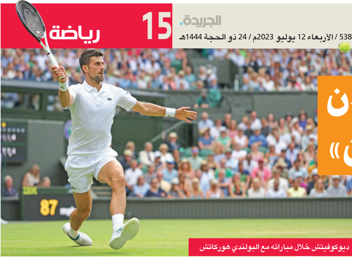
ديوكوفيتش خلال مباراته مع البولندي هوركاتش