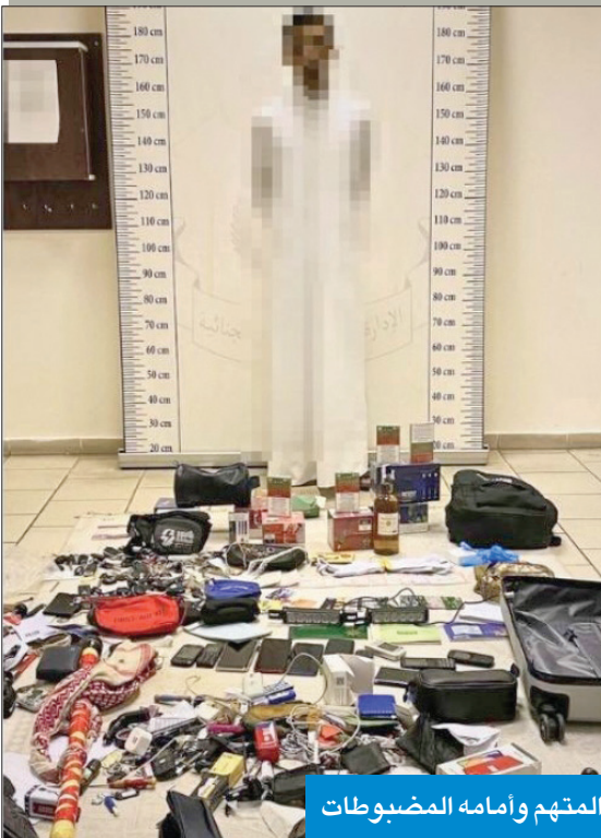
المنتهم وأمامه الضبوطات