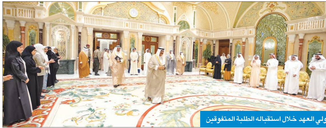
ولي العهد خلال استقباله الطلبة المتفوقين