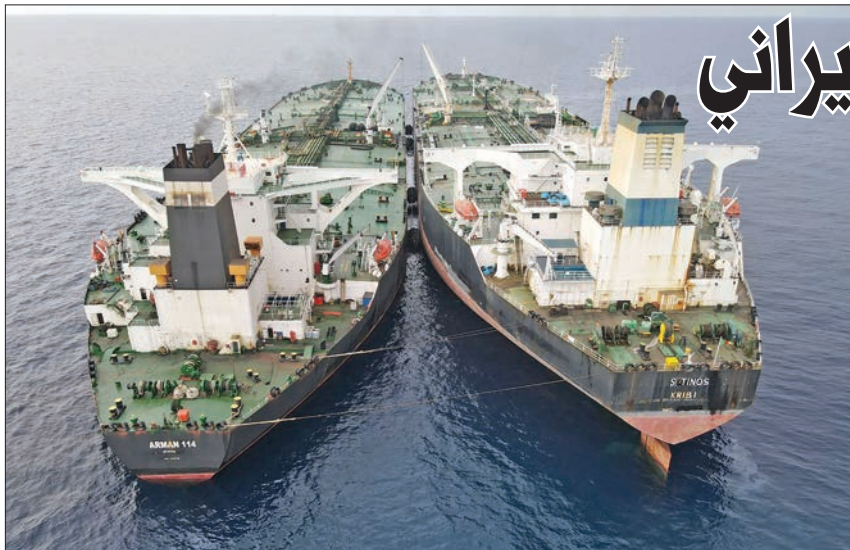
النقلتان الإيرانية والكاميرونية في المياه الإندونيسية يوم الجمعة الماضي (أ ف ب)

ويعيش موظفو السودان «أوضاعاً كارثية» مع توقف الرواتب منذ بدء الحرب واستمرار غلق المصارف أبوابها وتعدّر التواصل بين فروعها في الولايات ومقارها المركزية في الخرطوم، خصوصاً مع انقطاع خدمات الكهرباء والاتصالات وتواصل القصف والاشتباكات في المدينة. وخلال الأسابيع الماضية، أدلى شهود