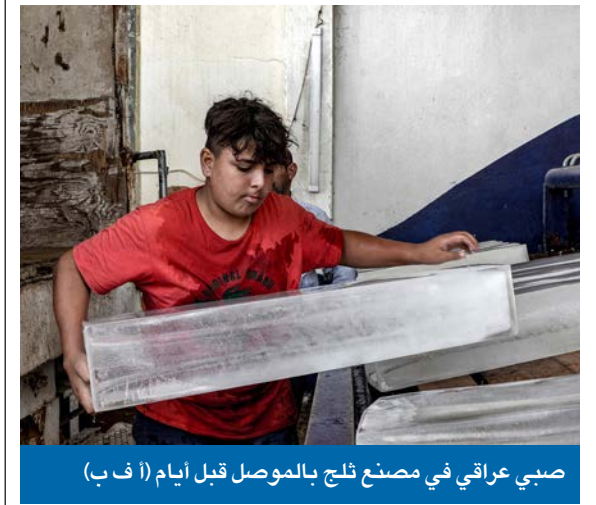
صبي عراقي في مصنع ثلج الموصل قبل أيام

«الإطار» يفعّل «عقوبة مؤجلة» لتأديب الزعيم السنّي ومسعود بارزاني لتحالفهما مع الصدر