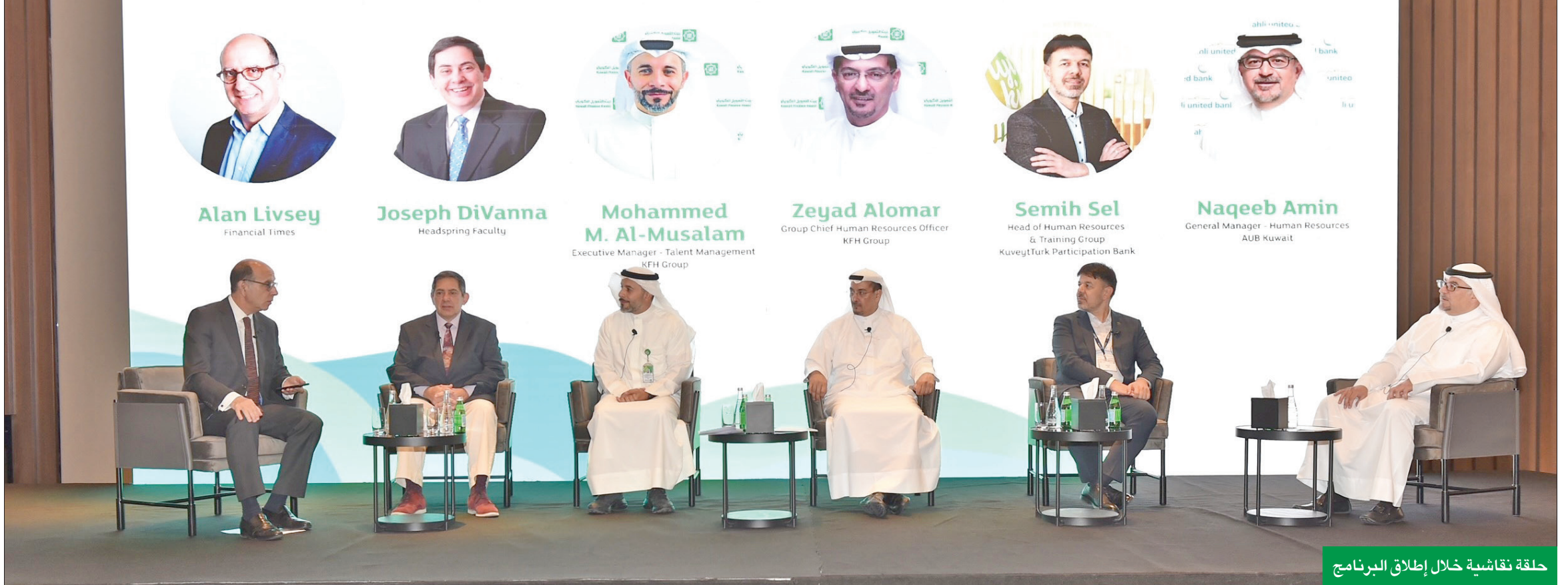
حلقة نقاشية خلال إطلاق البرنامج

العمر: إعداد قيادات ومواهب بقدرات تستطيع مواكبة نمو البنك