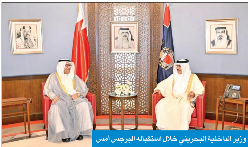
وزير الداخلية البحريني خلال استقباله البرجس أمس

أشاد وزير الداخلية البحريني الفريق أول الشيخ راشد بن عبدالله، أمس، بعمق العلاقات التاريخية الوثيقة التي تربط بلاده والكويت، معرباً عن اعتزازه بمسيرة التعاون الأمني والحرص المشترك على تبادل الخبرات. جاء ذلك خلال استقبال بن عبدالله وكيل وزارة الداخلية الكويتي الفريق أنور البرجس والوفد المرافق له بمناسبة انعقاد الاجتماع الأول للجنة الأمنية المشتركة بين وزارتي الداخلية في البلدين انطلاقاً من مذكرة التفاهم الموقعة بشأن التعاون والتنسيق الأمني. ورحب الوزير البحريني في مستهل اللقاء بزيارة الفريق البرجس والوفد المرافق إلى مملكة البحرين، مشيداً بعمق العلاقات الأخوية والمتينة التي