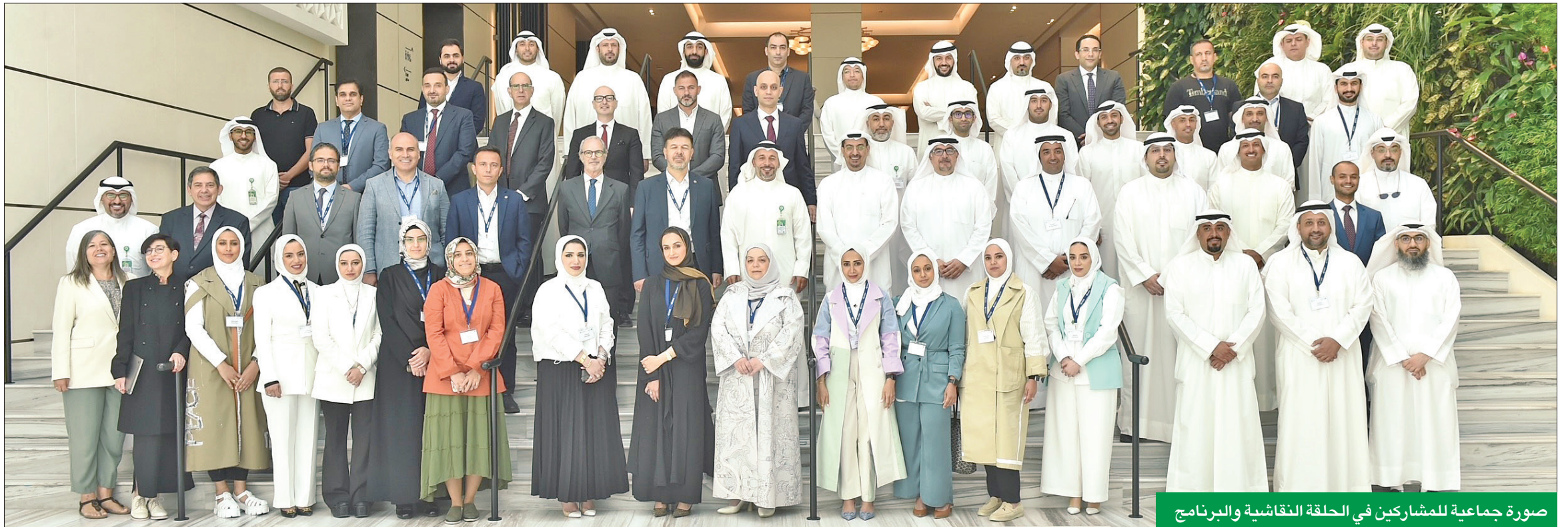
صورة جماعية للمشاركين في الحلقة النقاشية والبرنامج

الارتباط الوظيفي وتمكين المواهب أولوية لدى «بيتك» المسلم