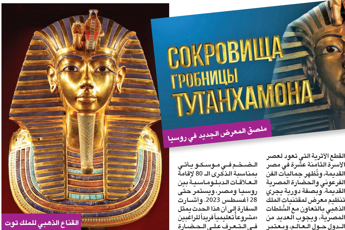
القناع الذهبي للملك توت