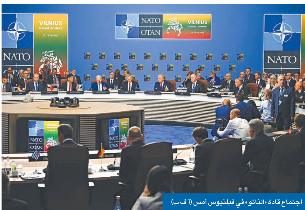
اجتماع قادة «الناتو» في فيلنيوس أمس

غير بعيد من جيب كالبينغفرد الروسي الواقع بين بولندا وليتوانيا، وعلى مسافة 35 كلم من بيلاروسيا، اجتمع قادة حلف شمال الأطلسي في فيلنيوس، لإقرار أول خطط دفاعية شاملة لهم منذ نهاية الحرب الباردة في مواجهة أي عدوان محتمل لروسيا، وإرسال رسالة دعم ووحدة مع أوكرانيا، مع بحث معضلة انضمامها إلى «الناتو»، الذي كان ضمن جملة أسباب طرحها الرئيس الروسي فلاديمير بوتين لتبرير هجومه العسكري عليها. وفي نهاية اليوم الأول من الاجتماع، أقر قادة الحلف تشكيل قوة قوامها 300 ألف جندي على أهدبة الاستعداد بما فيها قدرات جوية وبحرية، واتفقوا على أن هدفهم المتمثل بإنفاق 2 في المئة من إجمالي ناتج بلادهم الداخلي على نفقات الدفاع والتسلح سيصبح حداً أدنى. وأعلن الأمين العام للحلف، ينس ستولتنبرغ، أن القادة أكدوا مجدداً أن أوكرانيا ستصبح عضواً في الحلف، وربطوا دعوتها للانضمام إليه بمعايير «توافر الشروط المطلوبة»، مشيراً إلى أنهم أقرروا حزمة قهوة من المساعدات، لكنهم لم يحددوا جدولاً زمنياً لهذه العملية، التي كانت ضمن جملة أسباب طرحها بوتين لتبرير هجومه العسكري عليها. وإذ اعتبر القادة أن الصين ليست عدواً