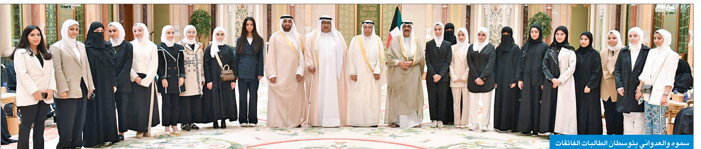
سموه والعدواني يتوسطان الطالبات الفائقات

وزاد سموه: كما نشكر أسر المتفوقين الذين ساندوهم ودعموهم من أجل تحقيق أهدافهم... ونكرر تهانينا لهم بتفوق بناتهم وأبنائهم.