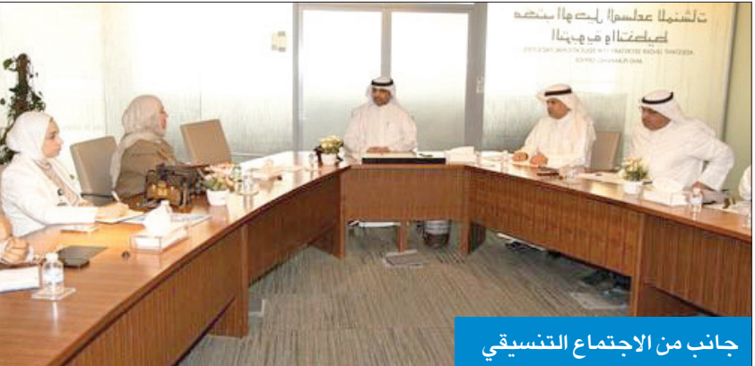
جانب من الاجتماع التنسيقي

لتلبية احتياج بعض من أحمال المدارس مستقبلاً، مشيراً إلى أن العمل على قدم وساق للوصول إلى ترشيد الاستهلاك الأمثل في منشآت «التربية» ممثلة في كل قطاعاتها، بما يساهم في دعم وترشيد استهلاك الكهرباء خلال فترة الصيف 2023، والطلب المتزايد على الطاقة.