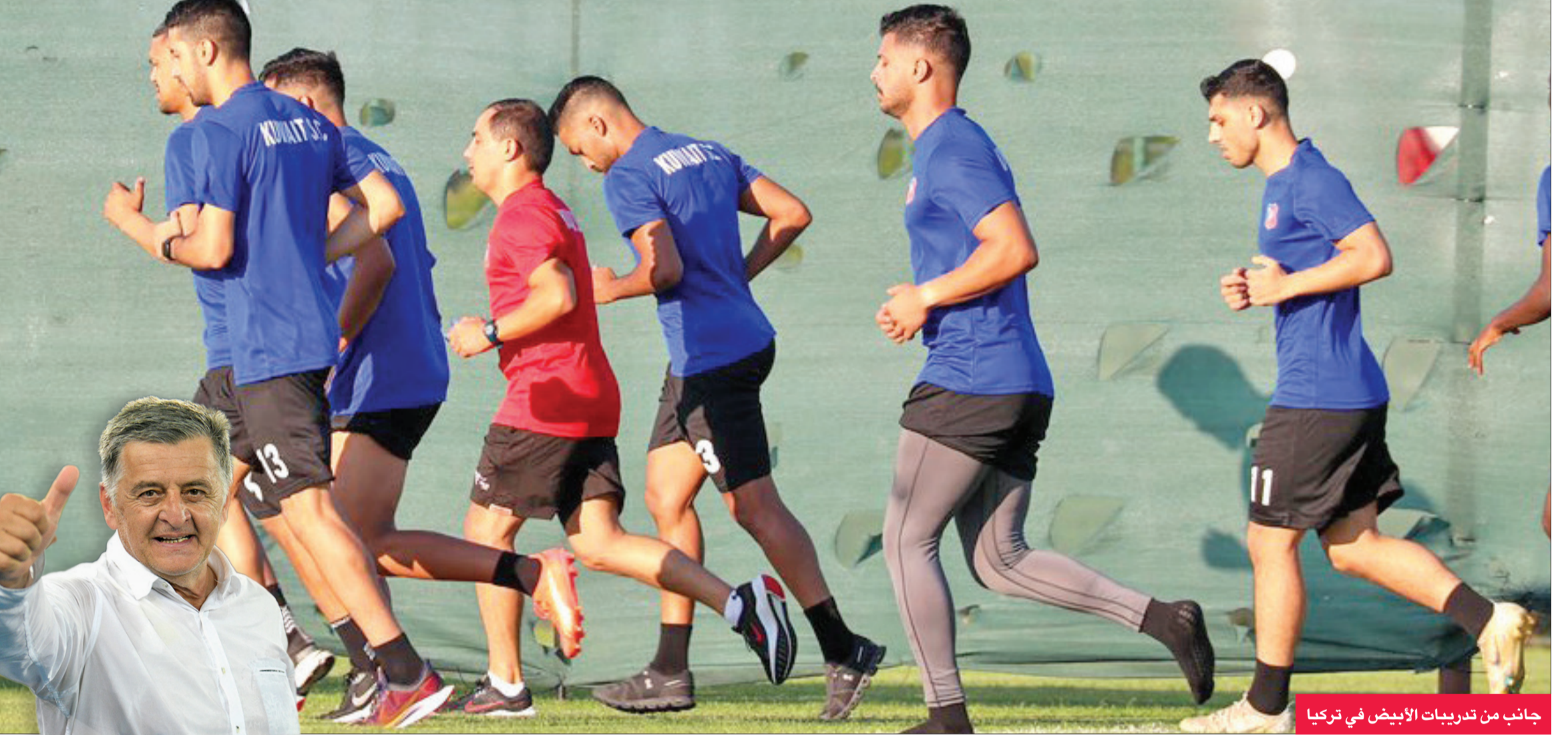
جانب من تدريبات الأبيض في تركيا

أكد أن معسكر تركيا أتى بثماره في تجهيز جميع اللاعبين