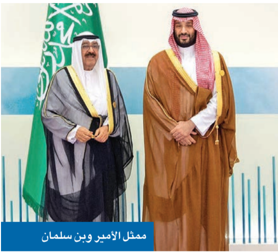
ممثل الأمير وبن سلمان

دول الخليج لديها إيمان ثابت وقناعة راسخة بأن الظروف الراهنة تتطلب العمل وتنسيق الجهود رغبة مشتركة لتطوير العلاقات وتعزيزها لتشمل تعاوناً أوسع في مختلف المجالات نتطلع إلى مزيد من التعاون السياسي والأمني والاقتصادي والثقافي والعلمي والتجاري مواقف آسيا الوسطى إزاء القضايا الإسلامية والعربية والإقليمية والدولية محل إشادة واثقون بحرص دول آسيا الوسطى على مواصلة جهودها لتعزيز أمن دول «التعاون» واستقرارها