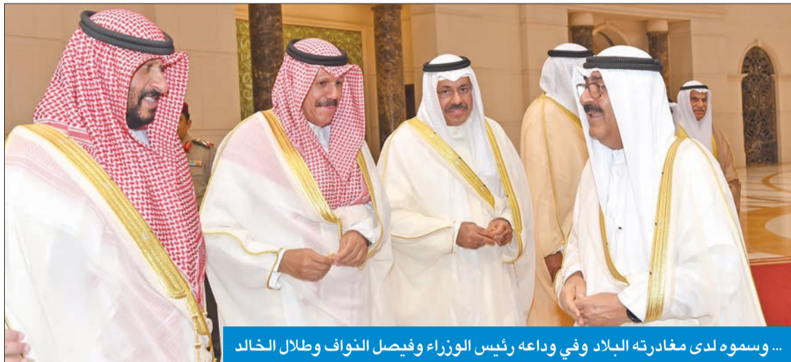
... وسموه لدى مغادرته البلاد وفي وداعه رئيس الوزراء فيصل النواف وطلال الخالد

سموه، صباح أمس، متوجهاً إلى المملكة العربية السعودية للمشاركة في مؤتمر القمة الخليجية مع دول مجلس التعاون لدول الخليج العربية والقمة الخليجية مع دول آسيا الوسطى 5C المقامتان في محافظة جدة.