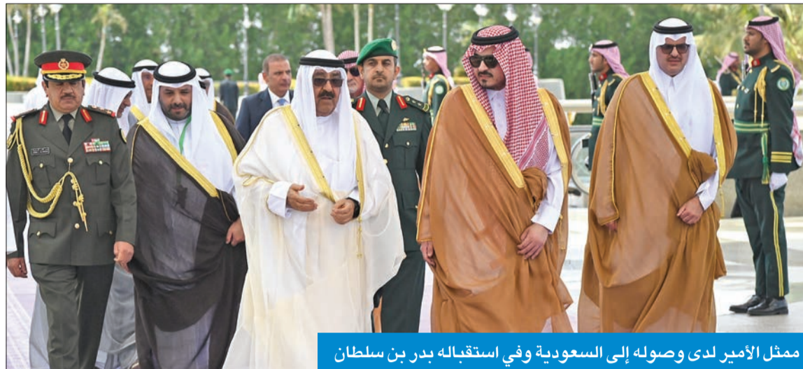
ممثل الأمير لدى وصوله إلى السعودية وفي استقباله بدر بن سلطان

وقد غادر البلاد ممثل سموه، والوفد الرسمي المرافق