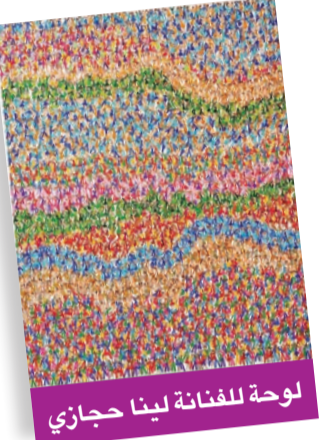
لوحة للفنانة لينا حجازي

أكدت الفنانة لينا حجازي أن الحركة التشكيلية بالكويت في تطور مستمر، مشيرة إلى أن المعارض الفنية تشهد إقبالاً كبيراً، ما يدل على الاهتمام بالفن والفنانين.