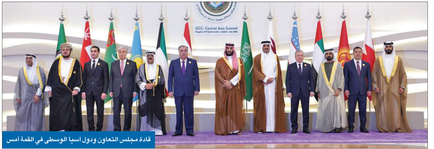
قادة مجلس التعاون ودول آسيا الوسطى في القمة أمس