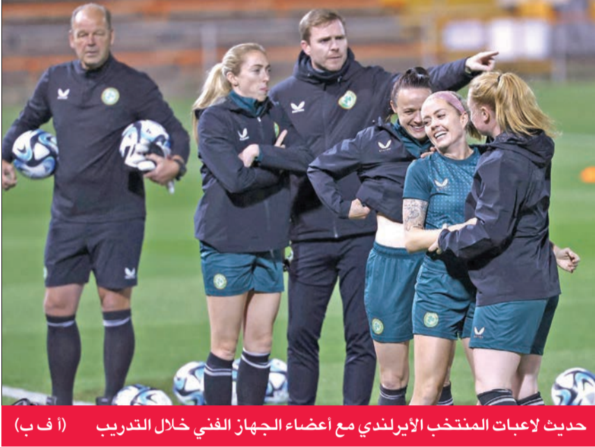
حديث لاعبات المنتخب الأيرلندي مع أعضاء الجهاز الفني خلال التدريب (أ ف ب)