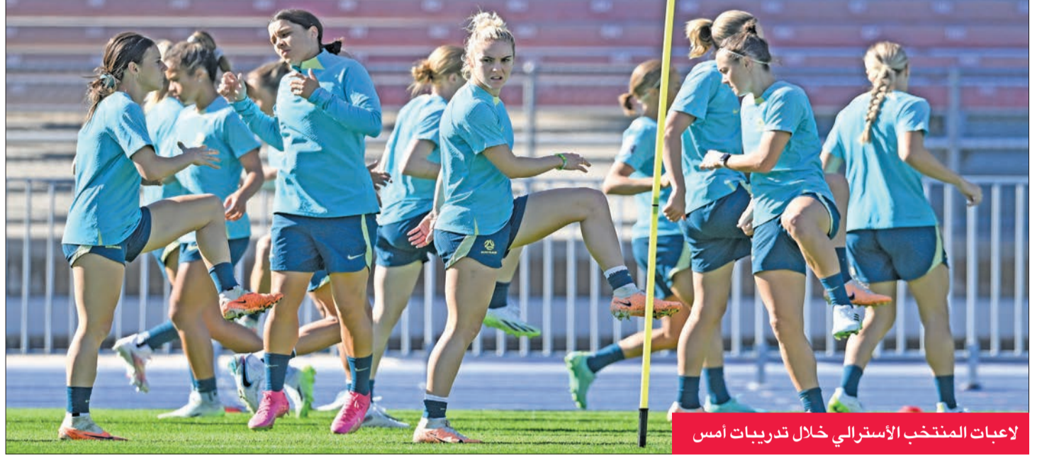
لاعبات المنتخب الأسترالي خلال تدريبات أمس

قائدة إنكلترا ليا ويليامسون وزميلتها المهاجمة النجمة بيت ميد، إضافة إلى الهدافة الهولندية فيفيان ميديما، والمهاجمتان الفرنسيتان دلفين كاسكارينو وماري-أنطوانيت كاتوتو والأميريكيات ساوربرون وسوانسون ومويس وكاتارينا ماكاريو.