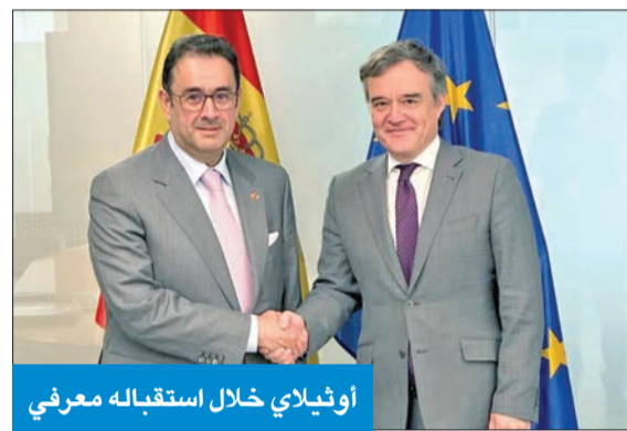
أوثيلاي خلال استقباله معرفي

معرفي وأوثيلاي بحثا علاقات التعاون الثنائية والقضايا الإقليمية والدولية