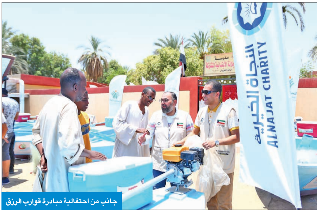
جانب من احتفالية مبادرة قوارب الرزق

المكتب الكويتي سلم لصغار الصيادين 48 قارباً بقيمة 19.6 ألف دينار