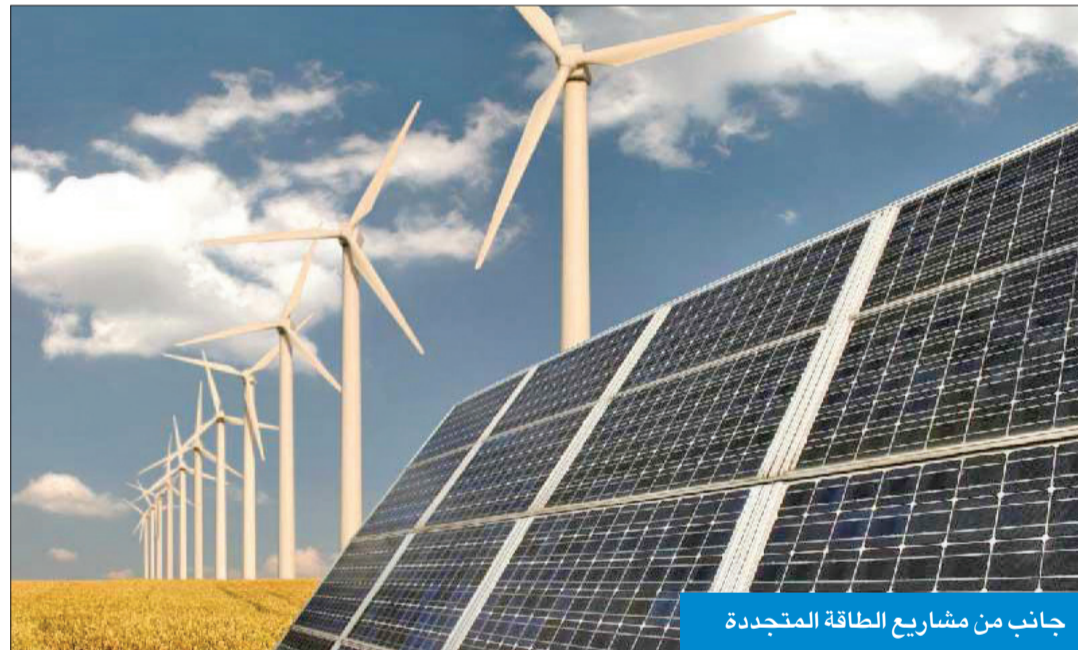
جانب من مشاريع الطاقة المتجددة

كشفت تقرير حكومي أن العجز في الطاقة الكهربائية في البلاد خلال السنوات الثلاث المقبلة سوف يتدرج في الارتفاع؛ ليصل إلى ذروته في سبتمبر عام 2026 بإجمالي 1.636 ميغاواط.