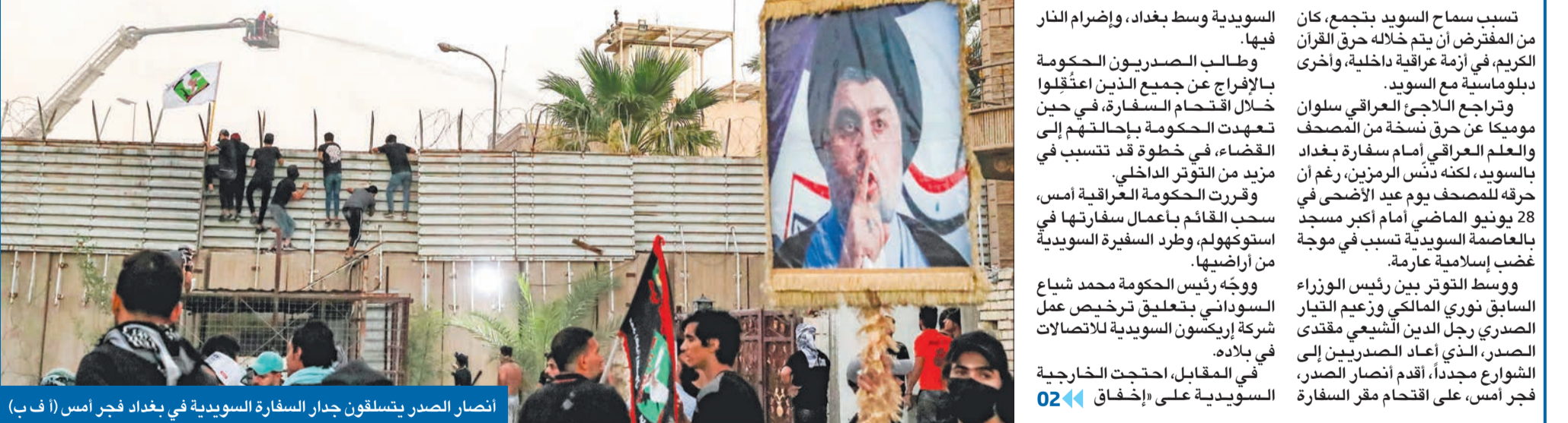
انصار الصدر يتسلقون جدار السفارة السويدية في بغداد فجر أمس

بغداد تطرد سفيرة السويد... والصدريون يحرقون السفارة توتر بعد توقيف المقتحمين وواشنطن تدين تقاعس الأمن