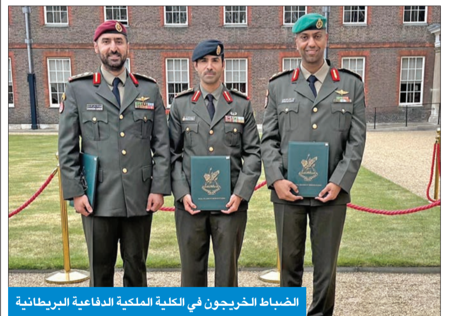
الضباط الخريجون في الكلية الملكية الدفاعية البريطانية

صباح الصباح يحصل على جائزة «القيادة الاستراتيجية» من «AFCEA»