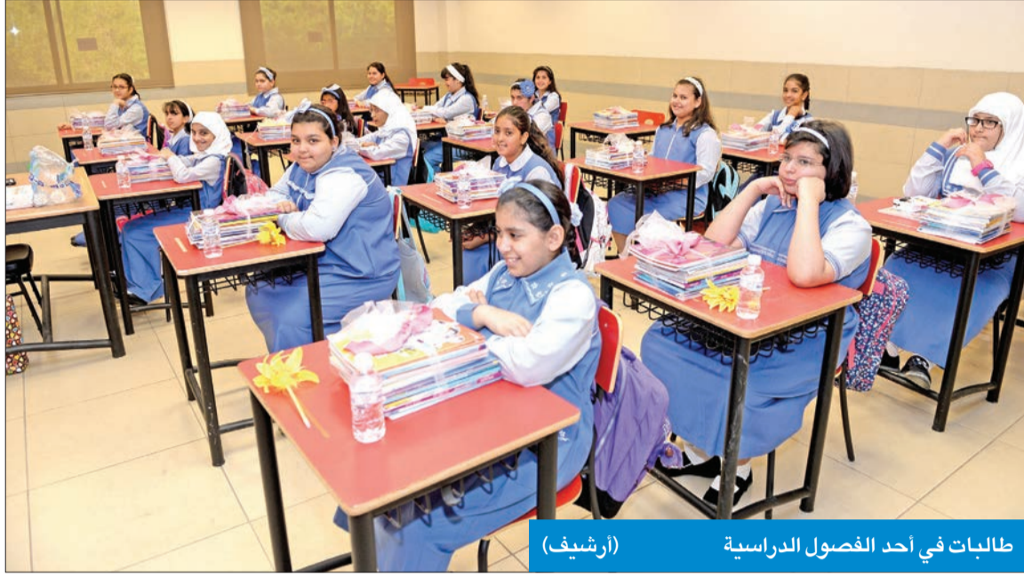
طالبات في أحد الفصول الدراسية

وذكر أن المشغل يجب أن يكون وطنيا فقط أو من شركات عالمية، وله بيان قانوني يقوم على إدارة المدرسة بالكامل، ويختص بتعيين مدير المدرسة بعد العرض على مجلس الأبناء وموافقتهم، ويشرف على الخطة المدرسية والإستراتيجية وتحقيق أهدافها ورسالتها، ويختص باعتماد تعيين أعضاء الكادر التعليمي والإداري، وتحمل المسؤولية أمام الجهات الرقابية المختصة. وبيّن أنه يتم استقطاع