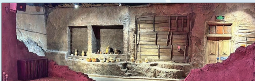
مدينة لا تانم