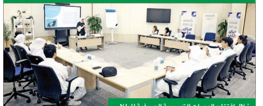
خلال افتتاح الدورات التدريبية الصيفية للطلاب

أطلق البنك الأهلي المتحد برنامجه التدريبي الصيفي للطلاب لعام 2023 بالتعاون مع مؤسسة «لويك»، وهيئة العامة للقوى العاملة، حيث يتضمن هذا البرنامج الذي يعقد سنويًا في المبنى الرئيسي للبنك مجموعة من الدورات التدريبية والتعليمية المتخصصة التي تساعد الطلبة على التعرف على طبيعة العمل المصرفي في الكويت، إضافة إلى مزايا وخصائص بيئة العمل في البنك، حيث تأتي هذه المبادرة في إطار سياسة البنك الرامية إلى تنمية مهارات الشباب وتدريبهم مما يحقق لهم قضاء إجازة صيفية ممتعة مليئة بالأنشطة الترفيهية المفيدة.