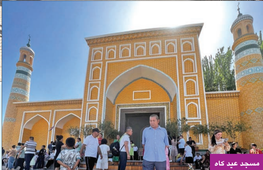
مسجد عيد كاه