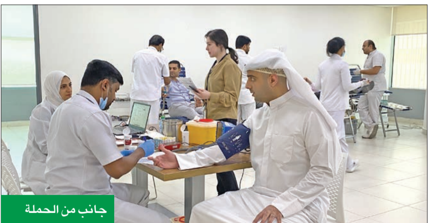
جانب من الحملة

الأنشطة التي تنظمها لتحفيز موظفيها على العطاء وتشجيعهم على الإقبال على الأنشطة التطوعية التي تخدم المجتمع، سواء الصحية أو الاجتماعية أو الإنسانية منها. وأكد نجاح الشركات الاستراتيجية التي تعقدتها الشركة مع مختلف الجهات المعنية بالقطاع الصحي في الدولة، ومنها بنك الكويت المركزي للدم، وأنها لن تدخر جهداً للمساهمة في نشر الثقافة الصحية في المجتمع بالبحث الوسائل والطرق، إلى جانب إشراك موظفيها في مثل هذه الحملات التطوعية. وأفساد أيام الفترة المقبلة ستشهد إقامة العديد من الفعاليات المجتمعية، ضمن حرص «الديار» على تعزيز حضورها في الكويت، ورد الجميل للمجتمع المحلي على جميع السنوات.