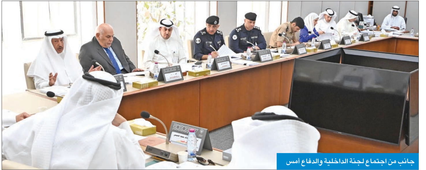
جانب من اجتماع لجنة الداخلية والدفاع أمس

منوطة بدراسة الجوانب الدستورية للمشروع وبوشهري تتحفظ عن بعض مواد