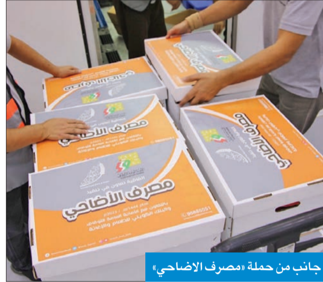
جانب من حملة «مصرف الأضحي»