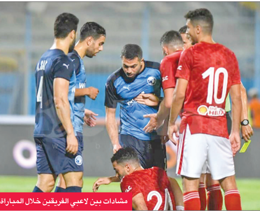
مشاركات بين لاعبي الفريقين خلال المباراة