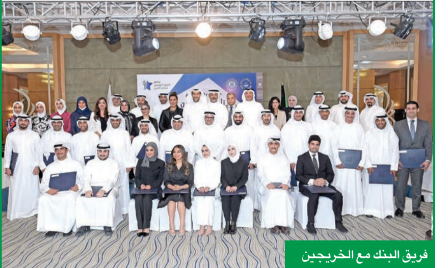
فريق البنك مع الخريجين

الحجاج: حريصون على توفير برامج تدريب لزيادة كفاءة موظفينا