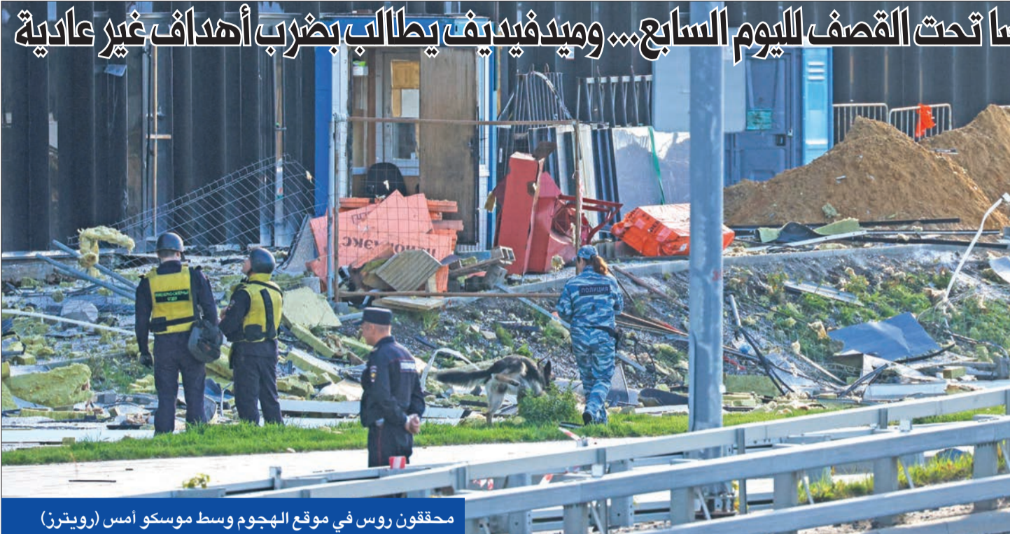
محققون روس في موقع الهجوم وسط موسكو أمس

غداً توعد الرئيس الأوكراني فولوديمير زيلينسكي برد انتقامي على الهجمات المستمرة منذ أسبوع على مرافق تصدير الحبوب، هاجمت عشرات الطائرات المسيّرة العاصمة موسكو وشبه جزيرة القرم، في حين قصفت روسيا مدينة أوديسا الساحلية.