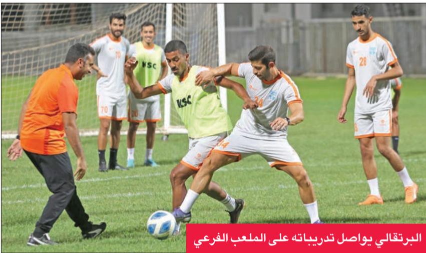
البرتغالي يواصل تدريباته على الملعب الفرعي

أمر وارد، خصوصاً أن العديد من اللاعبين العرب نجحوا مع كاظمة بشكل لافت للنظر، مشدداً على أنه، كما أكد سلفاً، لن يتم التعاقد إلا مع لاعبين أكفاء. في سياق متصل، لفت إلى أنه تم إغلاق ملف اللاعبين المحليين، سواء بالتعاقد مع لاعبين جدد، أو إعادة لاعبين لنادية أخرى، مبيّناً أن النادي لن يتوانى في إبرام عقود مع فريق الشباب في حال احتياج الفريق الأول لبعضهم.