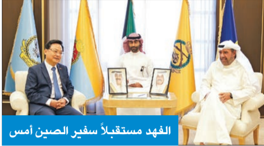
الفهد مستقبلاً سفير الصين أمس