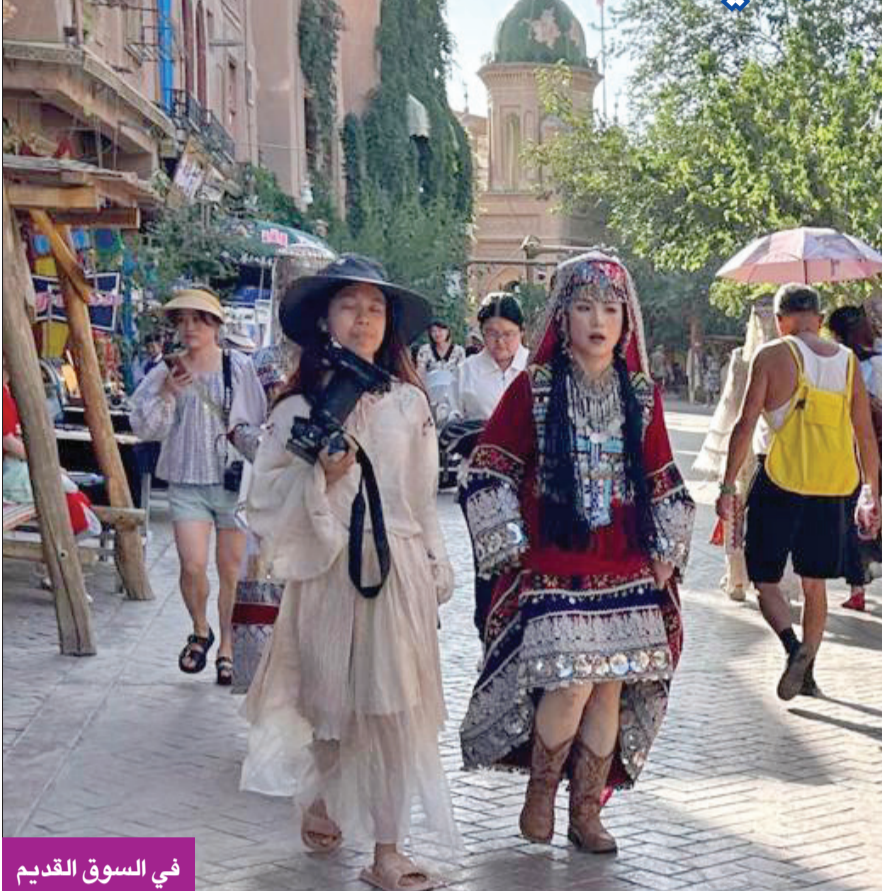
في السوق القديم