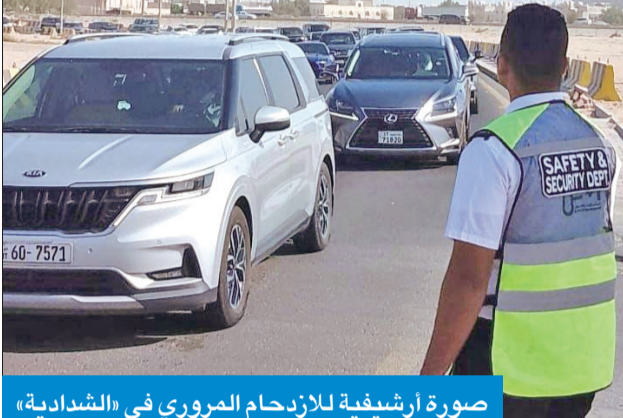
صورة أرشيفية للازدحام المروري في «الشادية»