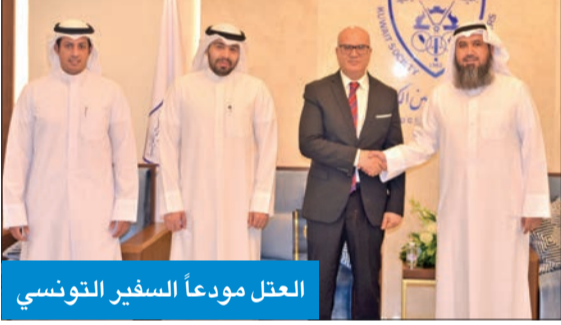
العقل مودعاً السفير التونسي

السفير عجيلي: نأمل تطوير العلاقات الهندسية