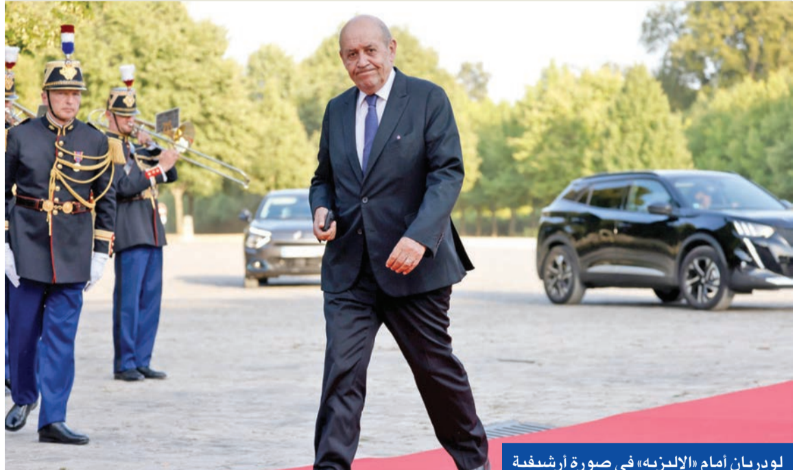
لودريان أمام «الإليزية» في صورة أرشيفية

ويبدأ لودريان جولته من عين التينة، حيث سيلقي رئيس مجلس النواب نبيه بري، ويبحث معه في فكرة الحوار التي رُفضت من قبل «خماسية الدوحة» ومن قبل أرفقاء لبنانيين، ومن المتوقع أن يبلغه الموقت الدولي، على أن يسمع ردة فعله وما سيفعله الثنائي الشيعي. وهنا تقول مصادر متابعة إن «الثنائي» سيبقى متمسكاً بخيار فرنجية، ولن يتخلى عنه، وفي حال استمر الوضع على حاله، فإن الحزب لن يكون متساهلاً ولن يقدم التنازلات، إذ لا بد من النسبة إليه عن فرنجية، وإي دليل لا بد أن يكون مرتبطاً بحوار مباشر معه يؤدي إلى منح ضمانات سياسية أساسية.