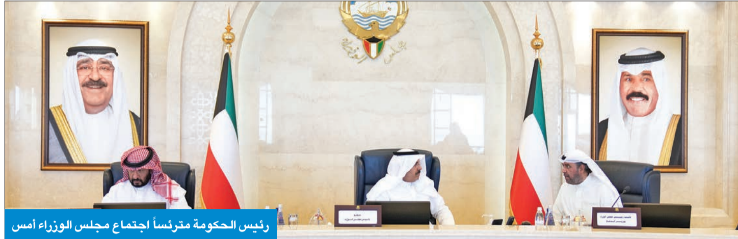
رئيس الحكومة مترئساً أجمع مجلس الوزراء أمس

أكد استمرار التعاون بين السلطتين لدراسة توصيات النواب على برنامج الحكومة