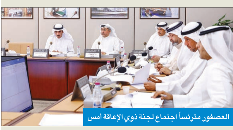
العصفور مترئساً اجتماع لجنة ذوي الإعاقه أمس

انتهى اجتماع لجنة شؤون ذوي الإعاقه أمس، إلى وجود توافق حكومي - نيابي على الكثير من التعديلات النيابية المقدمة على قانون 8 لسنة 2010، وتباين بشأن مواد أخرى.