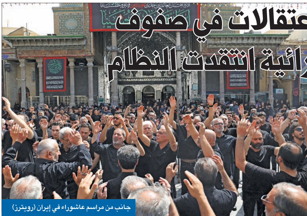
جانب من مراسم عاشوراء في إيران

دعا وزير الخارجية السوري فيصل المقداد، في مؤتمر صحفي مع نظيره الإيراني حسين أمير اللهيان، في طهران أمس، الجيش الأمريكي إلى الانسحاب من سورية قبل إجباره على ذلك، في حين كشفت موسكو عن احتكاك جوي جديد بين مقاتلاتها والطائرات الأميركية فوق الأجواء السورية. وقال المقداد إنه «من الأفضل للجيش الأمريكي أن ينسحب من الأراضي السورية قبل أن يجبر على ذلك، مضيفاً أن