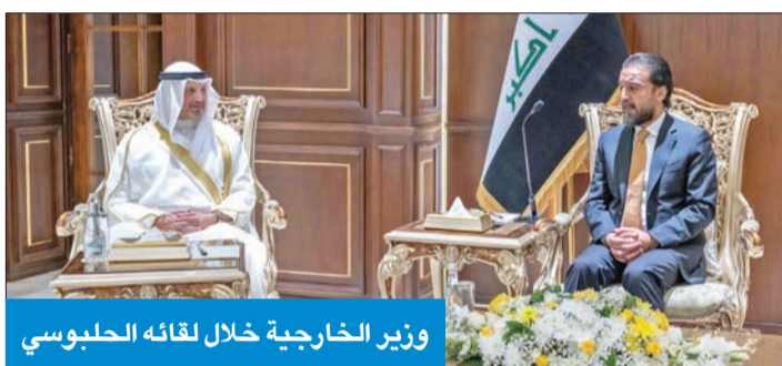
وزير الخارجية خلال لقائه الحبوسي

استكمالاً للقاءاته والوفد المرافق مع المسؤولين العراقيين