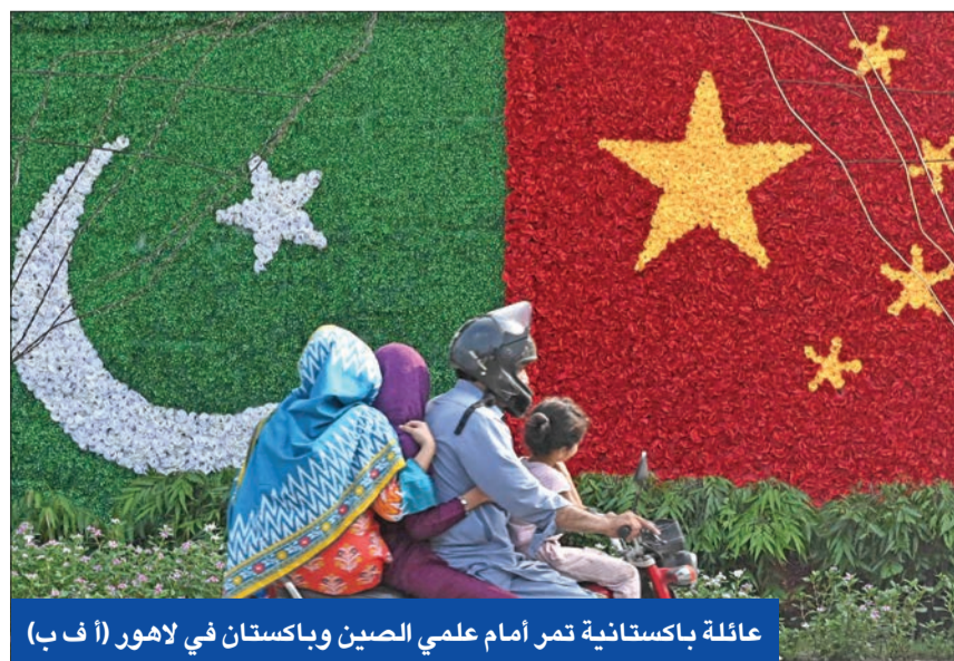
عائلة باكستانية تمر أمام علمي الصين وباكستان في لاهور

وباكستان مدينة بحوالي 30% من ديونها الخارجية إلى الصين، والأسبوع الماضي، قام بنك إسكيم الصيني بإعادة جدولة ديون باكستر من 2,4 مليار دولار، بعدما وافق صندوق النقد الدولي على تقديم حزمة إنقاذ لباكستان. وأصدرت مستوى إنذار من فيضانات وانزلاقات تربة. إلى ذلك وقعت باكستان والصين أمس 6 اتفاقيات ومذكرات تفاهم لتعزيز التعاون الثنائي بينهما، على هامش زيارة نائب رئيس مجلس