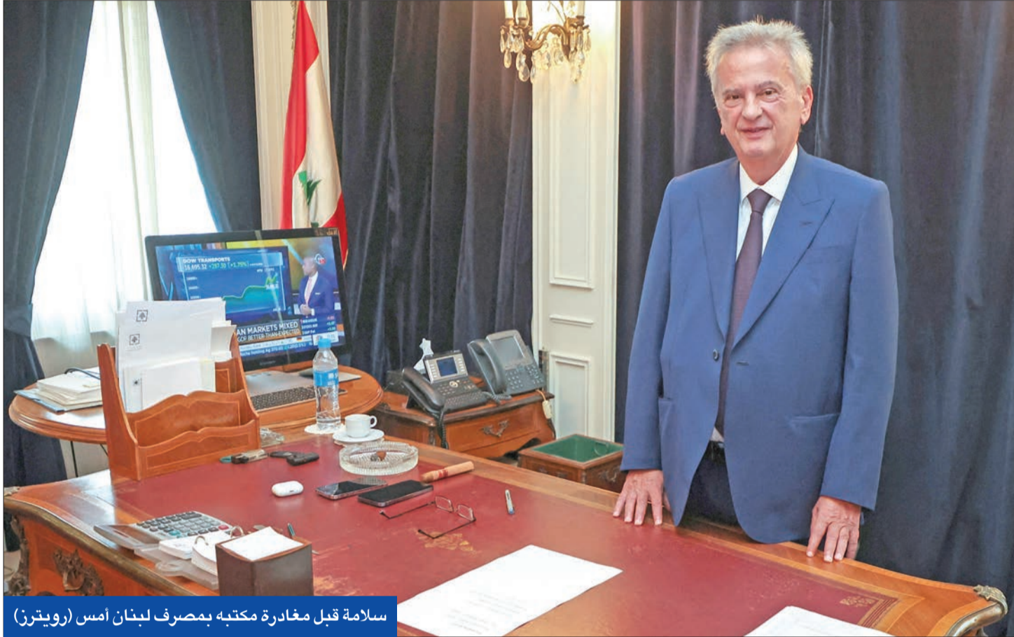
سلامة قبل مغادرة مكتبه بمصرف لبنان أمس

سلامة، وفق شريط فيديو نقلته وسائل إعلام محلية، «مصرف لبنان صمد (...) وأعطى النتائج التي يجب أن يعطيها قبل الأزمة، وحتى في الأزمة كان العمود الفقري الذي سمح للبنان أن يستمر». ويعتبر سلامة أنه تحول إلى «كبش محرقة» منذ بدء الإنهيار. ومنذ عامين، بشكل سلامة محور تحقيقات أوروبية ومصرفية بشكل غير قانوني، وإساءة استخدام أموال عامة على نطاق واسع خلال توليه حاكمية مصرف لبنان. وبناء على التحقيقات، أصدرت قاضية فرنسية في باريس والمدعية العامة في مونيخ مذكرتي توقيف في حق سلامة جرى تعميمهما عبر الإنترنت، وقررت القضاء اللبناني بناء عليها منعه من السفر وصار جواز سفره اللبناني والفرنسي. وبالنوازي مع التحقيقات الأوروبية، بقود القضاء اللبناني تحقيقاً محلياً حول ثروة سلامة، وقد فرض قبل أسبوعين جزراً احتياطياً على ممتلكاته.