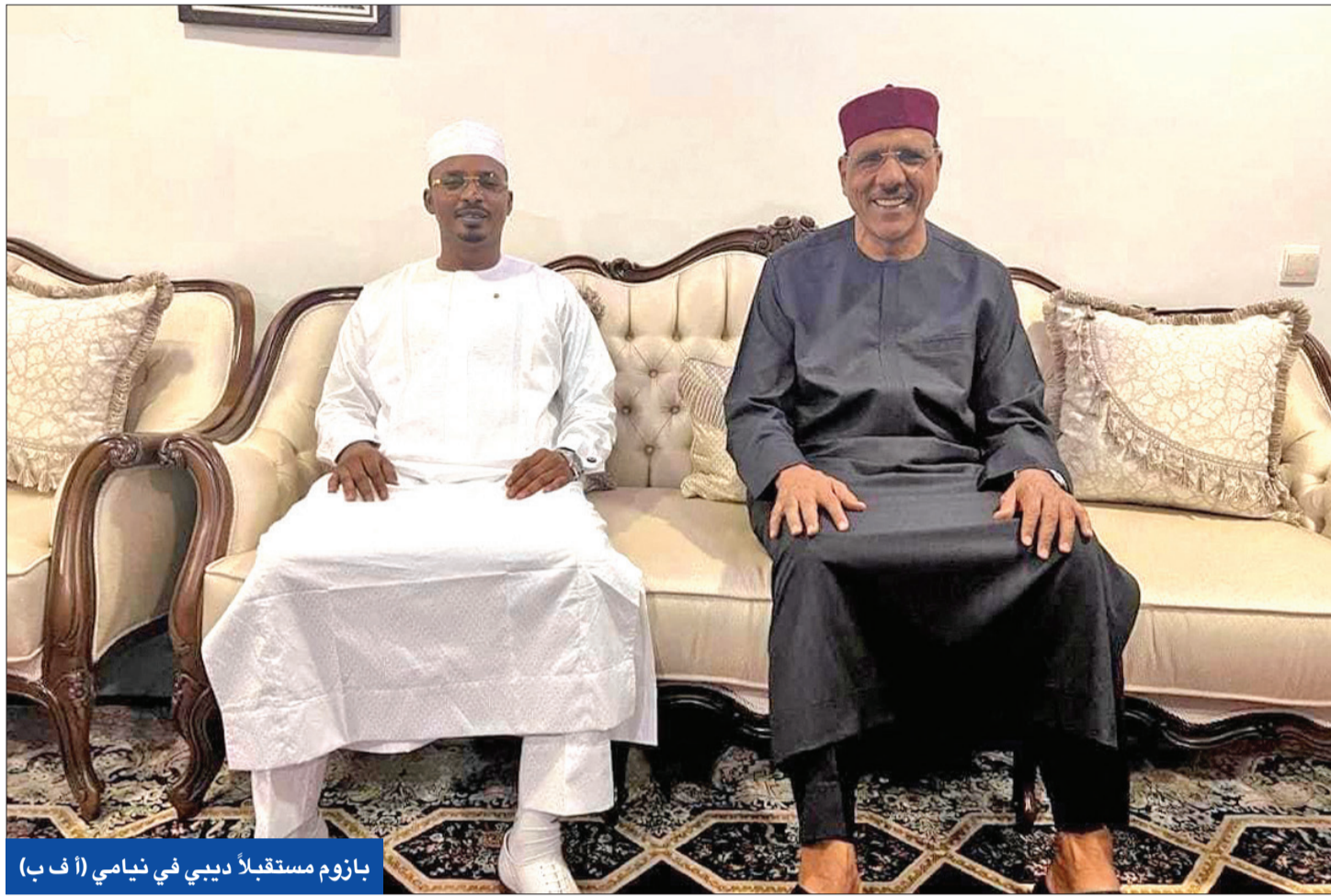
بازوم مستقبلاً ديبى في نيامي

تياني يوقف تصدير اليورانيوم والذهب إلى باريس... وإشادات غربية بحزم «إكواس»