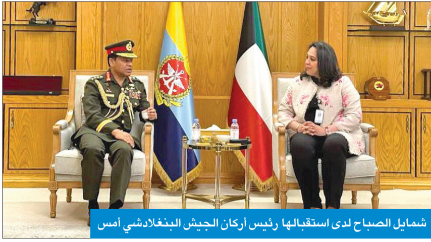
شمائل الصباح لدى استقبالها رئيس أركان الجيش البنغلادشي أمس