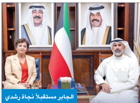
الجابر مستقبلاً نجاة رشدي

التقى نائب وزير الخارجية، السفير الشيخ جراح الجابر، مع نجاة رشدي، نائبة المبعوث الأممي الخاص لسورية، بمناسبة زيارتها الرسمية للبلاد. وأفادت وزارة الخارجية في تغريدة على حسابها الرسمي على «تويتر»، أنه «تم خلال اللقاء استعراض آخر المستجدات بشأن الأزمة السورية وأبعادها».