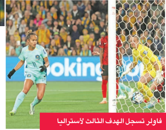
فاولر تسجل الهدف الثالث لأستراليا