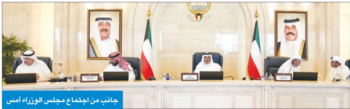
جانب من اجتماع مجلس الوزراء أمس

أكد مجلس الوزراء حرصه على مد يد التعاون الصادق البناء مع مجلس الأمة، معرباً عن أمله بأن تشهد المرحلة المقبلة المزيد من التعاون المثمر بين السلطتين لكل ما فيه خير ومصصلحة ورفع شأن الكويت.