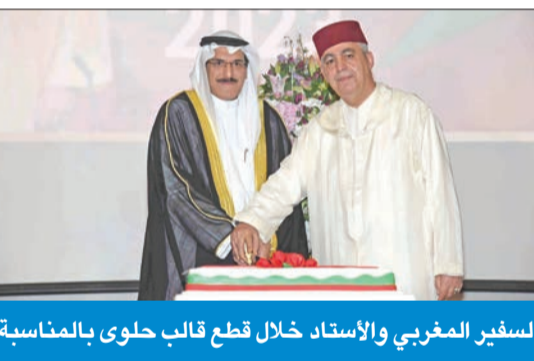
السفير المغربي والأستاذ قطع قالب حلوى بالمناسبة

السفير المغربي في «عيد العرش»: الكويت الثالثة عربياً من حيث الاستثمارات في بلادنا