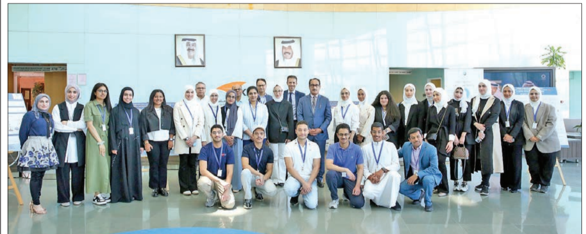
الدوري متوسطا الطلبة المشاركين في البرنامج

في ختام برنامج التدريب الصيفي لتنمية المهارات