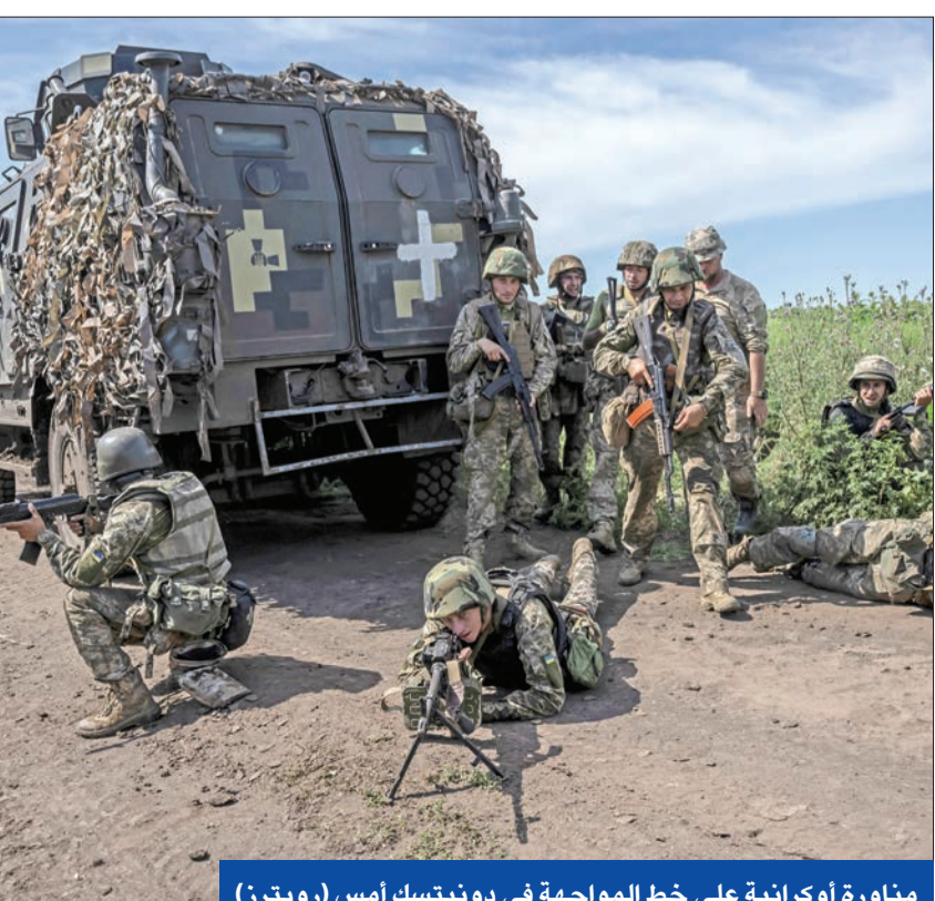
مناورة أوكرانية على خط المواجهة في دونيتسك (أس (رويترز)

في سياق متصل، حذر «الكرملين»، من أن المفاوضات الخاصة بالأمنيات الغربية المحتملة في المستقبل بالنسبة لأوكرانيا، قد تؤدي إلى تدهور الوضع الأمني في أوروبا. ومن المقرر أن تبدأ كيف محادثات مع واشنطن خلال الأيام المقبلة من أجل الحصول على ضمانات أمنية، ستكون سارية في الوقت الذي لا يزال انضمامها لحلف شمال الأطلسي (ناتو) معلقاً.