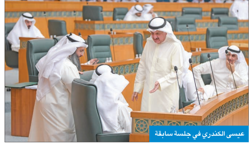
عيسى الكندري في جلسة سابقة

هذا الصدد على الصعيد الإداري تقوم على المتابعة المستمرة للتأكد من تطبيق قرارات وتعاميم مجلس الخدمة المدنية بشكل كامل، واتخاذ كل الإجراءات القانونية بشأن ما قد يقدم من تظلمات أو شكاوى إدارية من قبل المختصين بالوزارة، وتطبيق كل النصوص التي تكفل تحقيق العدالة، وتدبراً وقوع أي مخالفة مالية أو إدارية في أعمال الوزارة. وتابع: «أما فيما يتعلق بالشأن المالي في هذا الموضوع، فإنه وفقاً للمرسوم رقم 53 لسنة 1998، بشأن اختصاصات وزير الدولة لشؤون مجلس الأمة، فإن التبعة المالية للمكتب معقودة لمجلس الوزراء، ويتواجد في مقر الأمانة العامة لمجلس الوزراء ممثلو جهاز المراقبين الماليين لرقابة وتدقيق الصرف من بنود الميزانية».