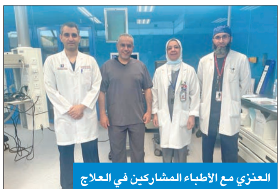
العنزي مع الأطباء المشاركين في العلاج

العنزي: من خلال استخدام الكي وبرنامج علاجي رائد