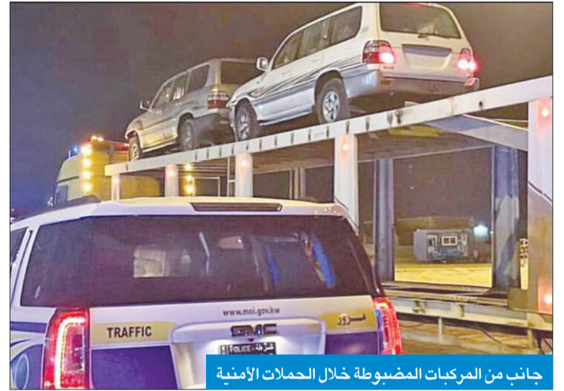
جانب من المركبات المضبوطة خلال الحملات الأمنية