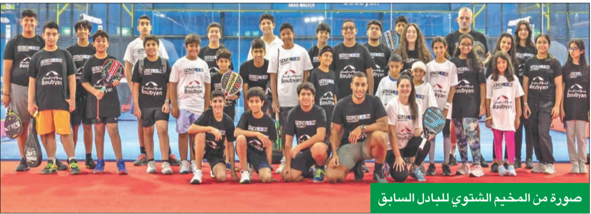
صورة من المخيم الشتوي للبادل السابق