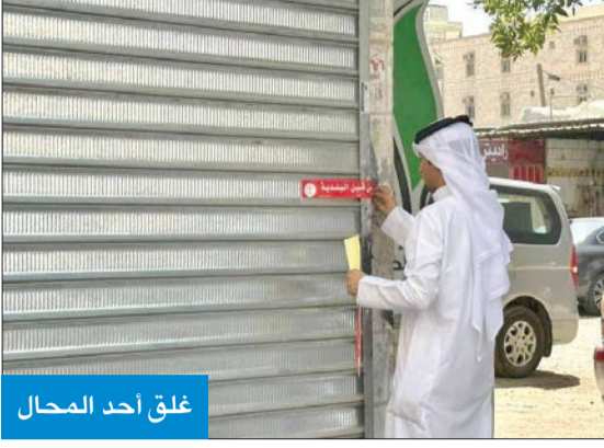
غلق أحد المحال

تنفيذ إدارة التدقيق ومتابعة خدمات البلدية بفرع بلدية محافظة الفروانية جولة تفتيش بمنطقة جليب الشيوخ، للتأكد من مدى التزام الأسواق والمحال بشروط البلدية وضوابطها. في السياق، أكد نائب المدير العام لقطاع الرقابة والتفتيش