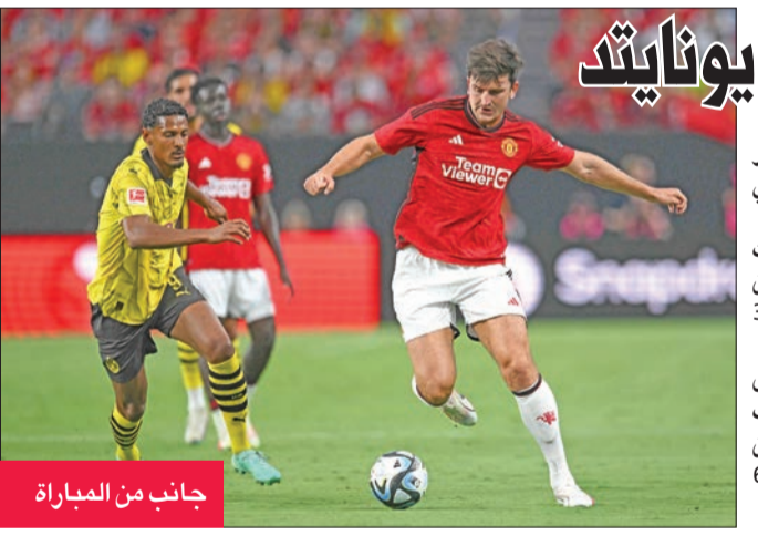
جانب من المباراة

التوالي في مبارياته الودية استعداداً للموسم، حيث خسر أمام ريكسهام 3 / 1 وريال مدريد الإسباني صفر / 2 في جولة أبطال كرة القدم الودية. بينما كان قد حقق الفوز في مبارياته الودية الثلاث السابقة، حيث تغلب على ليدز يونايتد 2 / صفر، وليون الفرنسي 1 / صفر، وارسنال 2 / صفر، ثم فاز عليه 3 / 5 في ضربات الجزاء. أما بوروسيا دورتموند، فقد حقق انتصاره الخامس في خامس مباراة ودية له خلال يوليو الجاري، حيث تغلب على فيستاليا راينيرن 7 / صفر وروت - فاي أوبرهاوزن 2 / 1، وروت فايس أرفيخت 1 / 2، وسان دييغو لوبال 6 / صفر.