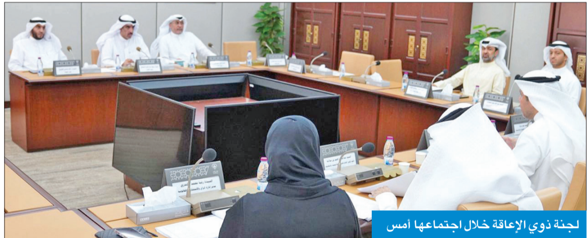
لجنة ذوي الإعاقة خلال اجتماعها أمس

والأعلى للمنحة السكنية، وعلى منح المعاق غير المتزوج سكناً بغرض الانتفاع، لافتاً إلى أن اللجنة ستقوم بدورها بالتوفيق بين المتطلبات والجدوى والتكلفة. وشدد على إصرار اللجنة على هذه التعديلات، وأنها ستحاول، في اجتماعها الأسبوع المقبل، مع ممثلي «المالية» لتذليل الصعوبات وتقليل الاختلافات، مؤكداً أن اللجنة منفتحة على البدائل المطروحة، وعملها بشكل واضح ومباشر لخدمة الأشخاص المستفيدين من هذا القانون. وأشار إلى أن اللجنة ستستكمل الأسبوع المقبل استطلاع رأي الجهات الرسمية، ومنظمات المجتمع المدني.