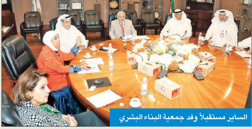
الساير مستقبلًا وفد جمعية البناء البشري

مبادرات المسؤولية الاجتماعية التي تتبناها. وقال عقب اللقاء إن الجمعية أدركت أن بناء مجتمع طموح ومتكامل يتم من خلال شراكات فاعلة مع المجتمع المدني، مشيرًا إلى جهود الجمعية مع وزارات الدولة ومؤسساتها بالكويت.