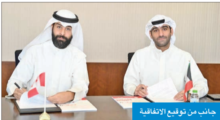
جانب من توقيع الاتفاقية

وقعت كلية الجونكويين الكندية في الكويت، اتفاقية مع شركة «إف آر إم تك لابز» لتفعيل وتوصيل منصة AKcess، وهي منصة هوية رقمية متكاملة تم تصميمها خصيصاً لطلاب الجامعة، ويعمل نظام AKcess على تقديم تجربة طلابية شاملة ومتكاملة تبدأ من مراحل القبول والتسجيل والالتحاق بالجامعة إلى الأعمال اليومية، مثل: الحضور، والانصراف، والتحكم في الدخول إلى المباني والقاعات، والعديد من المزايا الإضافية الأخرى. وسيتمكن الطلاب في الكلية الكندية من استخدام أجهزة المحمول الخاصة بهم، بدلاً من بطاقات الهوية الجامعية التقليدية لتنفيذ مهام، مثل: تسجيل الحضور، والاستمارات، وتقديم الطلبات، والمعاملات الجامعية.