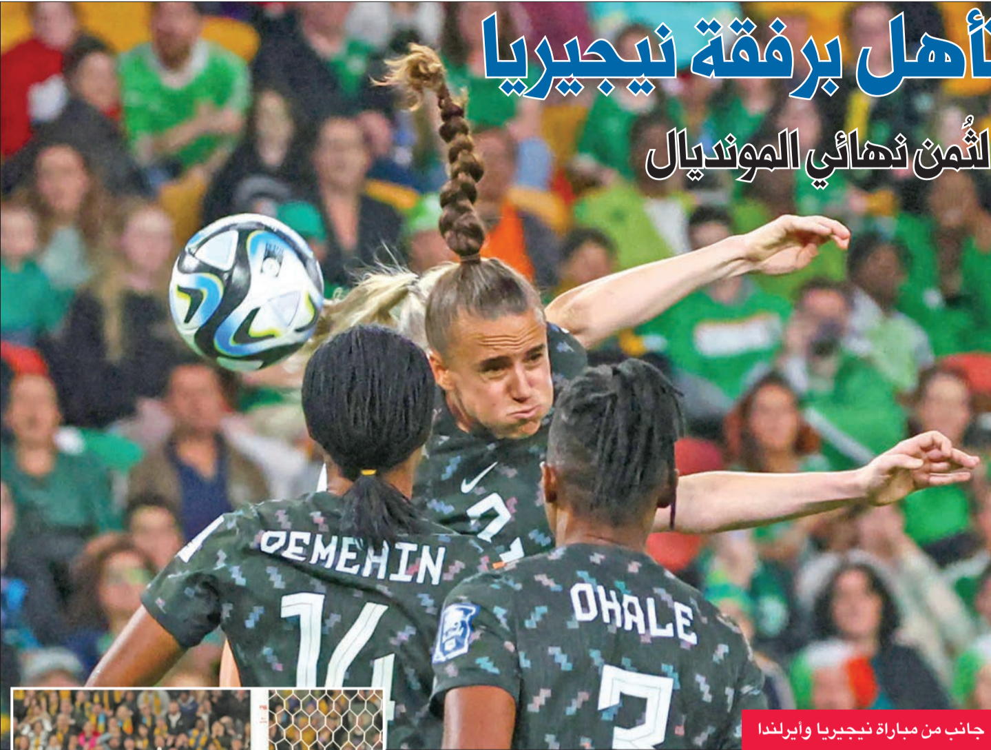
جانب من مباراة نيجيريا وإيرلندا