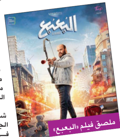
ملصق فيلم «البيع»