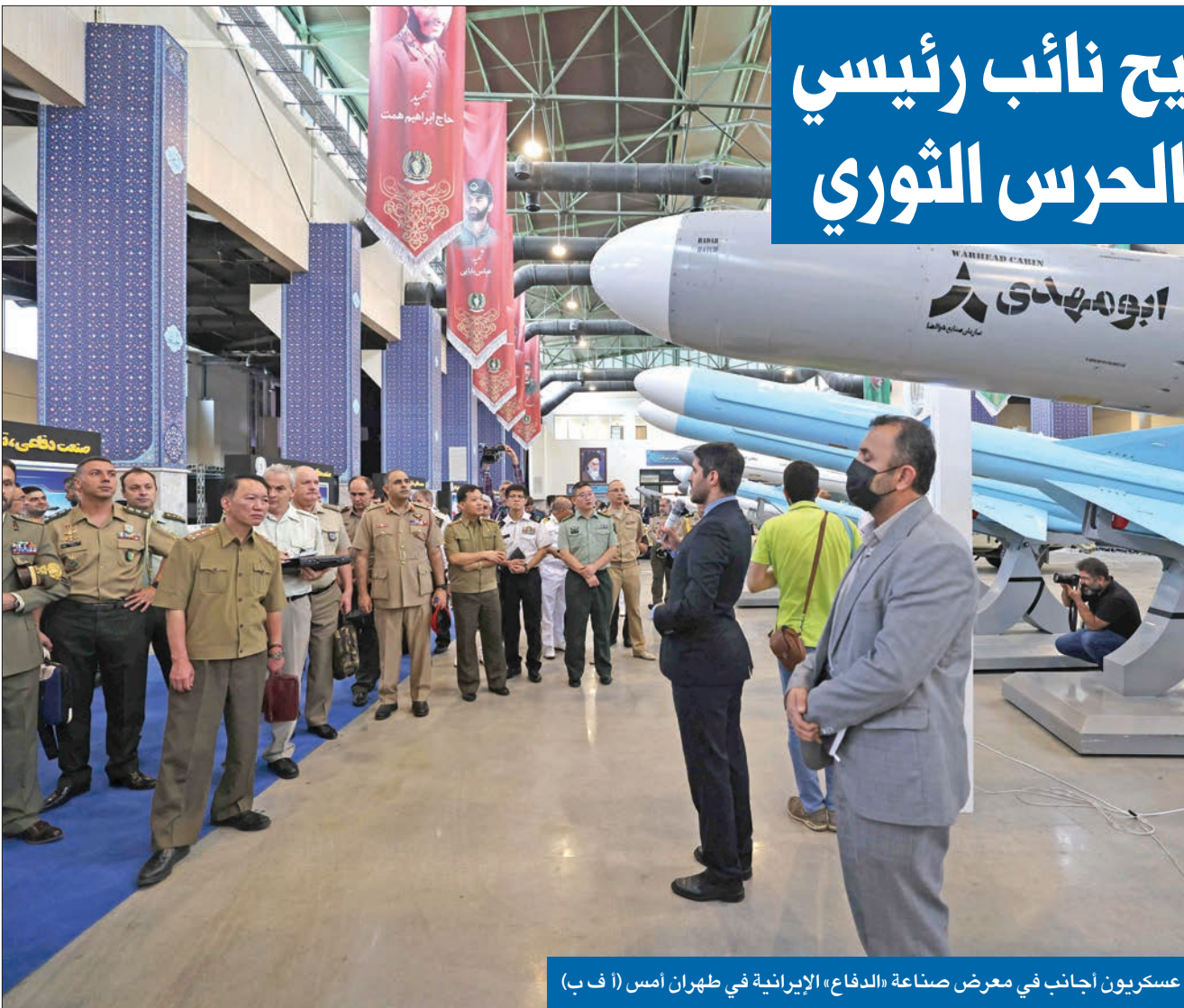
عسكريون اجانب في معرض صناعة «الدفاع» الإيرانية في طهران أمس