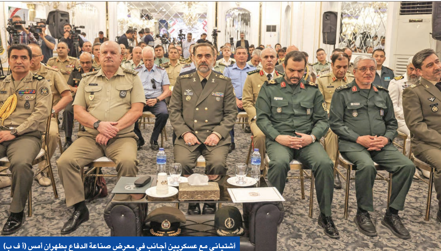
اشتياياني مع عسكريين أجنبية في معرض صناعة الدفاع بطهران أمس

من 7 نواب باللجنة الحقوقية من أصل 11 نائباً. طهران وبأكثر إلى ذلك، هاجم رئيس هيئة أركان القوات المسلحة الإيرانية، اللواء محمد باقري، الوجود العسكري الأجنبي بالمنطقة، محذراً من أنه يزيد من التوتر والصراعات. وقال باقري، في اتصال هاتفي مع نظيره الأذربيجاني الخزانة ناكر حسونوف، إن مستوى التعاون بين القوات المسلحة للبلدين يشهد نمواً في كل المجالات، خصوصاً قبيل انعقاد اجتماع اللجنة العسكرية المشتركة في باكو قريباً. من جانب آخر، أعلن وزير الدفاع الإيراني العميد محمد اشتياياني، أن طهران تخطط للقيام بعمليات أو 3 لإطلاق أقماع صناعية هذا العام، لافتاً إلى أن القوات المسلحة تنتج مختلف أنواع الصواريخ وفقاً لاحتياجاتها.