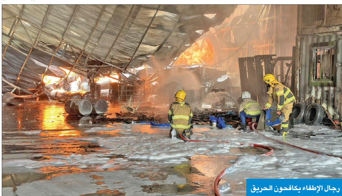
رجال الإطفاء يكافحون الحريق

أصيب 3 إطفائيين بحالات اختناق وإجهاد حراري جراء حريق كبير اندلع صباح أمس في مصنع أسمنت ومواد سريعة الاشتعال، وامتد إلى مصنع أسمنت وأصبغ مجاور له، وأسفر الحادث أيضاً عن خسائر مادية كبيرة لحقت بالمصنعين. وركزت إدارة العلاقات العامة والإعلام بقوة الإطفاء العام أن إدارة العمليات المركزية تلقت بلاغا ظهر أمس بوقوع حريق مصنع للأسمنت وتصنيع الأصبغ في منطقة الشعب الصناعية، فتم توجيه مراكز إطفاء أم الهيمان ومشرف والإسناد وميناء عبدالله والأحمدي والمنقف إلى موقع البلاغ، وتبين أن الحريق اندلع في مصنع خاص لتصنيع الأسمنت والأصبغ ويحتوي على مواد كيميائية قابلة للاشتعال، واكتشف رجال الإطفاء أيضاً أن الحريق امتد إلى أجزاء من مصنع مجاور، فضلا عن انهيار السقف العلوي لأحد المصانع.