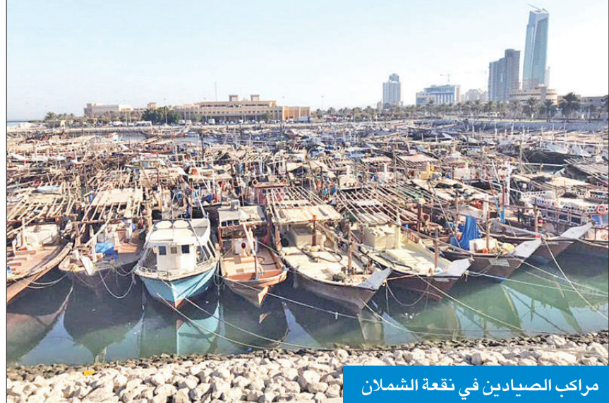
مراكب الصيادين في تقعة الشمال

وأردف: «إذا كان هذا القطاع المهمش لا يهتم أحد فاتخذوا قراراً بإبنائه، ولتعضوا أصحاب الرخص عن خسائرهم ولنجاتهم وقواربهم ومعداتهم، وكفانا وكفانا أبواباً موصدة أمام مطالبنا المستحقة».