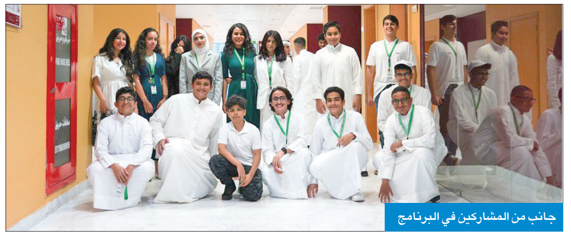
جانب من المشاركين في البرنامج