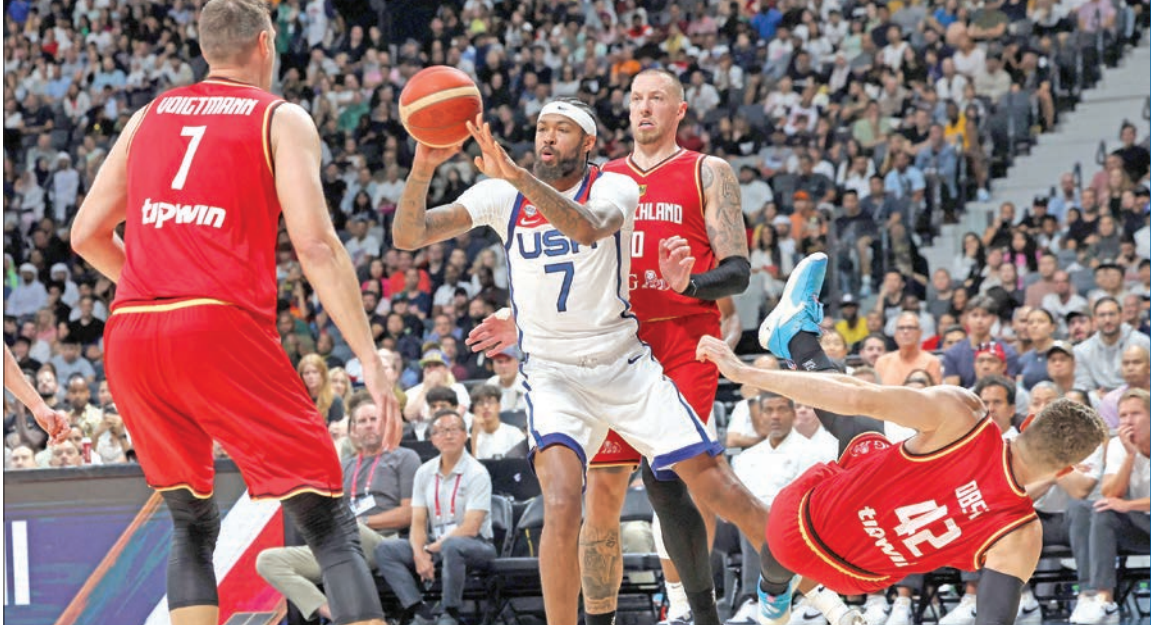
جانب من مباراة ودية سابقة بين المنتخبين الأميركي والألماني

وسط توقعات قوية للمنتخب الأميركي باستعادة عرشه العالمي وترشيحات كبيرة لعدد من المنافسين، تنطلق الجمعة فعاليات نسخة السلة التي تقام بالتنظيم المشترك، من 25 الجاري إلى 10 سبتمبر المقبل. وهذه هي النسخة الثانية على التوالي التي تقام بمشاركة 32 منتخباً، لكنها الأولى في التاريخ التي تقام بالتنظيم المشترك بين أكثر من دولة. وتستحوذ هذه البطولة على اهتمام كبير في كل أنحاء العالم، نظراً لترشيحات القوة التي يحظى بها المنتخب الأميركي لاستعادة العرش العالمي بعد إخفاقه في النسخة الماضية عام 2019، التي شهدت احتلاله المركز السابع، ليكون أدنى ترتيب له في تاريخ مشاركاته ببطولات العالم. وفي المقابل، يدخل أكثر من فريق من أوروبا وخارجها في دائرة المنافسة