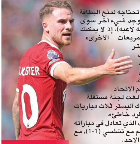
ألكسيس ماك أليستر

قائمة بالنقاط لما تحتاجه لمنح البطاقة الحمراء، فإنه لا يوجد شيء آخر سوى الاحتكاك (في لقطة لابعه)، إذ لا يمكنك وضع علامة في المبرعات الأخرى.