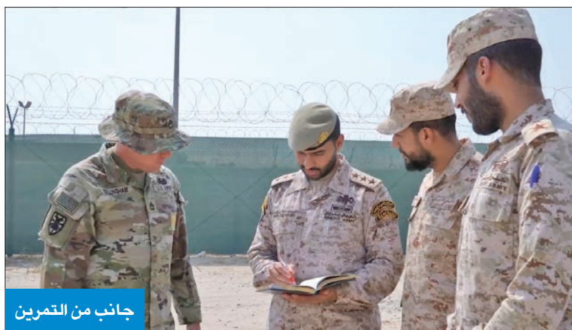
جانب من التمرين