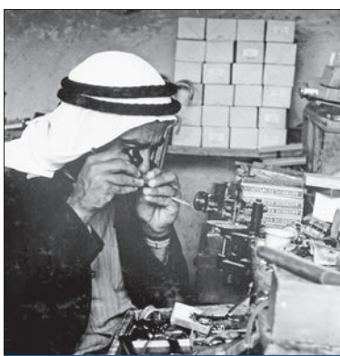
تاجر لؤلؤ يستخدم مكر عسات للتأكد من نقاوته

وبعدالة تامة وبانسيابية واضحة ولمدة قرون من الزمان. والسؤال الذي يفرض نفسه الآن هو: كيف ننسى دور هؤلاء جميعاً؟ كيف ننسى دور التاجر الذي صرف أمواله لتوفير السفينة (التي تعادل قيمتها مجعماً تجارياً فائراً اليوم) وتجهيزها والمخاطرة بها في أعماق البحار وسط الأمواج العاتية والعواصف المرعبة؟ كيف ننسى دور النوحدة الذي قاد السفينة الشراعية وطاقمها بسلام وأمان وعبر بها البحار وأشرف على عمل الغواصين والعتور على اللؤلؤ لكي يعود إلى الكويت وفي حوزته الكنوز التي عثر عليها رجاله ليعيش على ريعها التاجر والبحار ومعظم أهل الكويت وحتى حكومة البلاد؟ كيف ننسى دور النجار الذي لم يكن يأكل إلا وجبة واحدة في اليوم على ظهر السفينة قليلاً من القهوة والماء ليعمل بهمة ونشاط ليعثر على اللؤلؤ وهو لا يدري هل يعود إلى أسرته وأهله أو لا يعود؟ كيف ننسى دورهم لإعالة أسرهم وأهلهم في مهن صعبة وخطيرة مارسوها عقوداً طويلة دون ملل أو كلل؟ كيف ننسى دورهم في توفير لقمة العيش للحلال لعائلاتهم التي استمرت ذريتها إلى اليوم؟