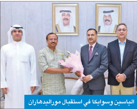
الياسين وسوايكا في استقبال مورالدهاران

وصل، أمس، وزير الدولة الهندي للشؤون الخارجية والشؤون البرلمانية فيلافي مورالدهاران إلى الكويت، وكان في استقباله الوزير المفوض في إدارة شؤون آسيا بوزارة الخارجية خالد الياسين، وسفير الهند لدى البلاد أدارش سوايكا.