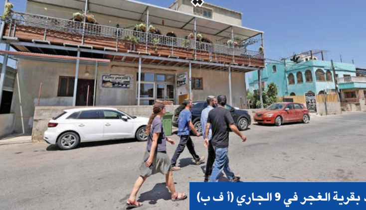
يهود بقريّة العجري في 9 الجاري

كل هذه الوقائع تطرح تساؤلات كثيرة حول إمكانية إعادة إرسال الحرب مقاتلين من لبنان باتجاه سورية. يجري ذلك، وسط نقاشات كثيرة داخل إسرائيل حول اتهامات موجهة لإيران بدعم المقاومة الفلسطينية وتنفيذ المزيد من العمليات ضد قوات الاحتلال وفي الضفة الغربية تحديداً، ويعتبر الإسرائيليون أن إيران وحلفاءها يوفرون الدعم، وسط التداول الإسرائيلي لمعلومات أن قادة حركة حماس لا سيما الموجهين في لبنان هم الذين يوجهون المقاومين بكيفية التحرك وتنفيذ العمليات، وهنا لا بد من التذكير باجتماعات كثيرة عقدت بين قادة حماس والجهد الإسلامي مع الأمين العام لحزب الله حسن نصرالله، للتداول في تطورات الوضع الفلسطيني الداخلي. وقد وصلت النقاشات الإسرائيلية إلى مرحلة البحث في إمكانية توجيه ضربات لقادة «حماس» الموجودين في لبنان، لا سيما أن هناك محاولات لتتبع نشاطهم على الساحة اللبنانية، ودراسة