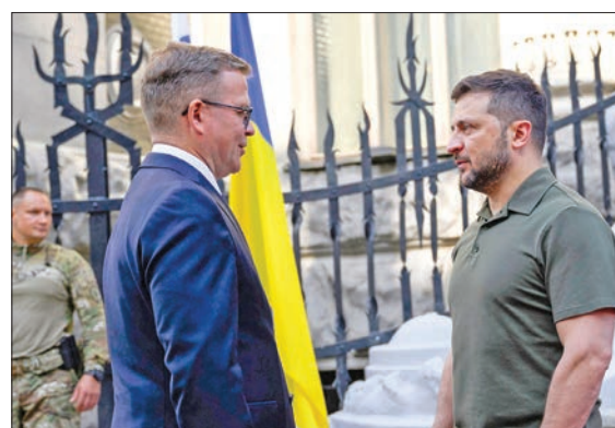
الرئيس الأوكراني فولوديمير زيلينسكي مستقبلاً رئيس الوزراء الفنلندي بيتري أوربو في كييف أمس الأول (ا ب ف)

أوكرانيا تضرب دفاعات القرم وتعطل مطارات موسكو... وواشنطن لا تشجعها