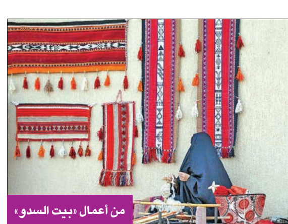
من أعمال «بيت السدو»