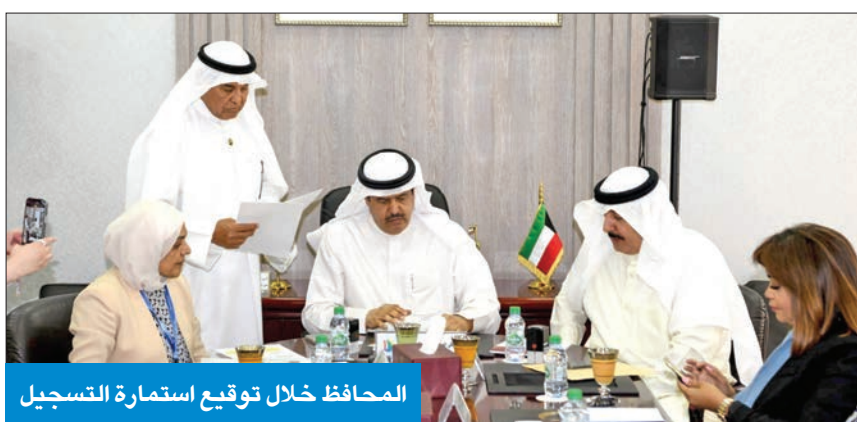
المحافظ خلال توقيع استمارة التسجيل

من جانبها، قالت رئيسة مكتب المدن الصحية بوزارة الصحة الدكتورة أمال الجبجي لـ «كونا» إنه بانضمام منطقة الشعب فإنها تكون المدينة الصحية رقم 17 المسجلة على الشبكة الإقليمية