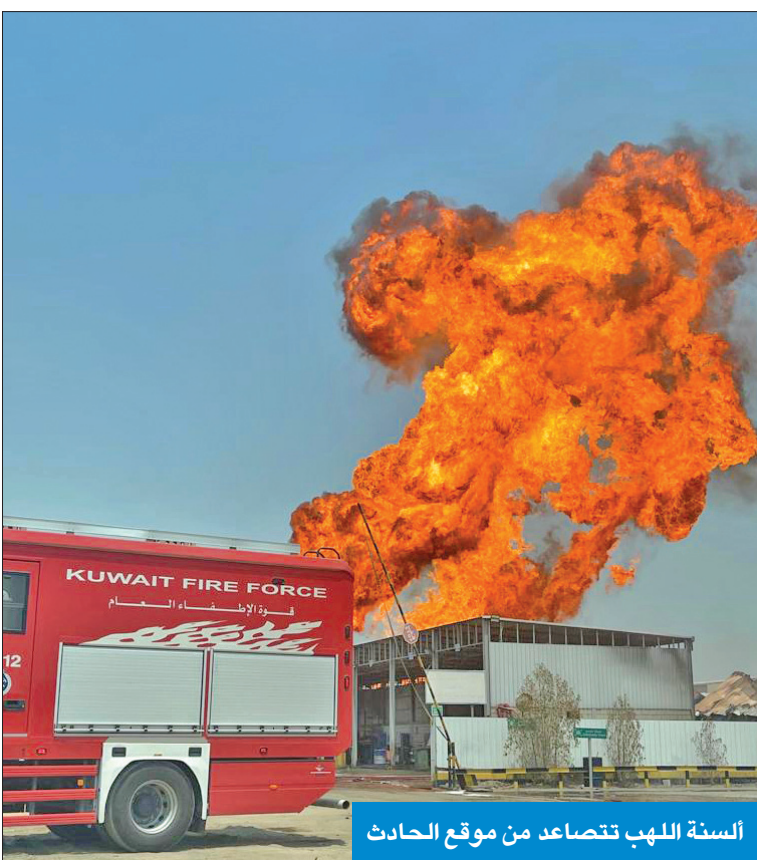
السنة اللهب تتصاعد من موقع الحادث