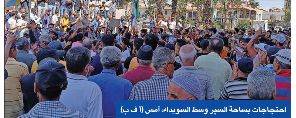
احتجاجات بساحة السير وسط السويداء، أمس

مع زيارة وفود من مشايخ الطائفة الدرزية لرعيهم الروحي الشيخ حكمت الهجري لإعلان تضامنتهم مع الحراك الشعبي، شهدت مدينة السويداء، أمس، أكبر تظاهرة من نوعها منذ أسبوع، نادت بإسقاط النظام وطرده إيران وروسيا من الأراضي السورية. ونشرت صفحة الرصد المحلية تسجيلات لمحتجين يرفعون شعارات ضد الرئيس بشار الأسد، مؤكدة أن «التجمع هو الأكبر من نوعه» في تاريخ احتجاجات السويداء ذات الغالبية الدرزية. وتحدثت شبكة السويداء 24 عن توافد المحتجين من أرياف السويداء للمشاركة في التظاهرة المركزية بساحة السير، وسط المدينة. وخلال استقباله لوفود الطائفة الدرزية، قال الشيخ الهجري: «على الشعب أن يقوم بإعادة البناء، لأن الهدم لم يكن سليماً» داعياً إلى الحكمة في التعامل مع الأحداث، بحسب تسجيل صور نشرته صفحة الرصد على «فيسبوك».