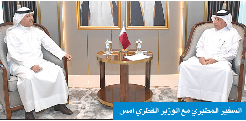
السفير المطيري مع الوزير القطري أمس

وأضاف: «اللقاء تطرق إلى سبل تعزيز التعاون بين الصندوق العالمي والكويت، ونقل خبراته في مجال تحسين حفظ الموارد الوراثية النباتية، وذلك في ضوء عدد من التحديات التي تواجهها الكويت، المتصلة بعوامل التغير المناخي، وندرة المياه، ومدى تحلل الحرارة والجفاف والملوحة، والمحافظة على التنوع البيولوجي للنباتات».