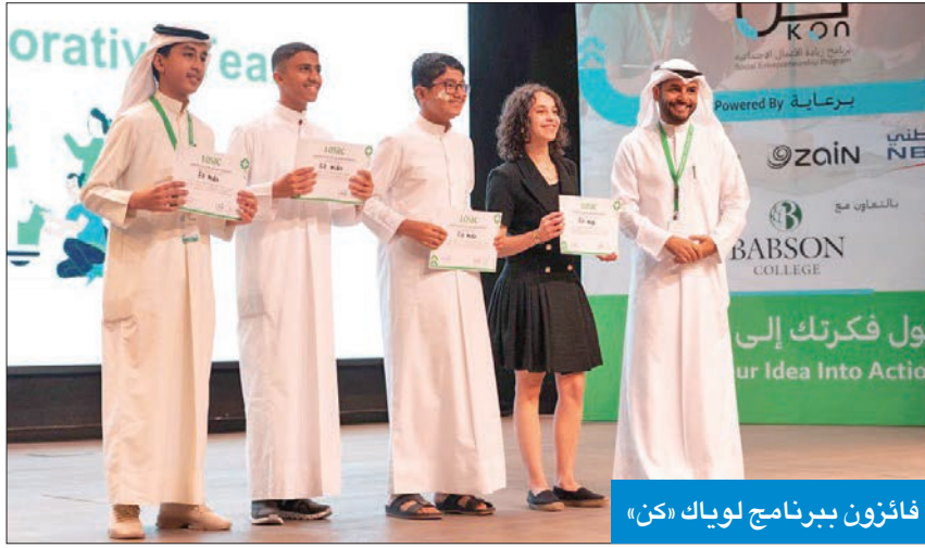
فائزون ببرنامج لويك «كن»

مع لويك تنبع من قناعتنا بضرورة وأهمية تمكين الشباب لإحداث تغيير إيجابي، ونذكر أيضاً الحاجة الملحة لمواجهة التحديات البيئية والاجتماعية، كما نؤمن إيماناً راسخاً بأن ريادة الأعمال تؤدي دوراً مهماً في إيجاد حلول مبتكرة.