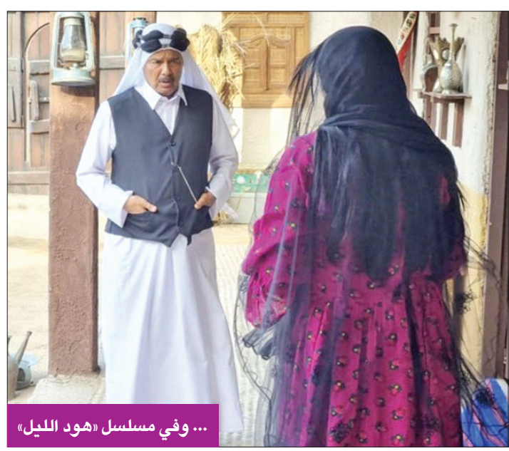
... وفي مسلسل «هود الليل»

مسلسل «في دروب السعي مظالم»، الذي حقق نجاحاً لافتاً وجسد من خلاله شخصية «المحامي عقيل»،