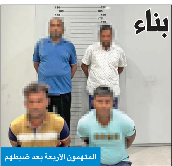
المتهمون الأربعة بعد ضبطهم

ذكرت إدارة العلاقات العامة والإعلام بقوة الإطفاء العام أن إدارة العمليات المركزية تلقت بلاغا، مساء أمس الأول، يفيد بغرق طراد 32 قدما بالقرب من جزيرة قاروه وعلى متنه 4 أشخاص.