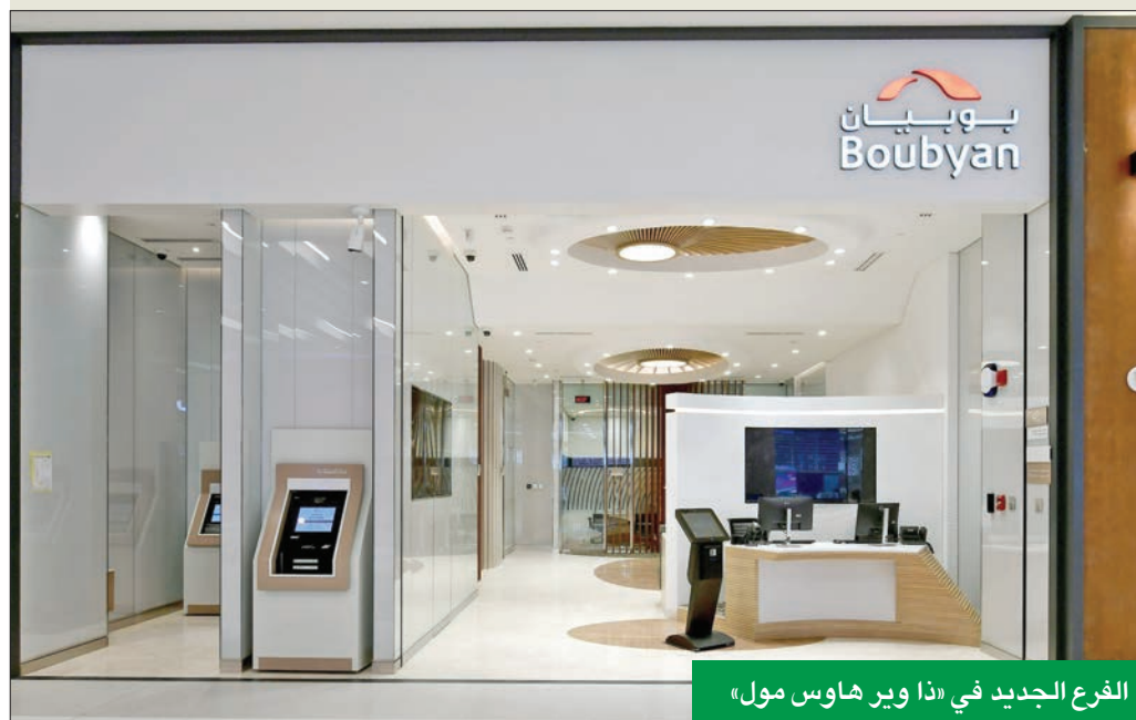
الفرع الجديد في «ذا وير هاوس مول»