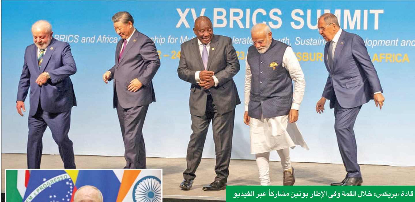
قادة «بريكس» خلال القمة وفي الإطار بوتين مشاركاً عبر الفيديو

ترسم مسار مستقبل كتل الدول النامية وسط انقسامات... والبيت الأبيض يستبعد تحولها إلى منافس جيوسياسي