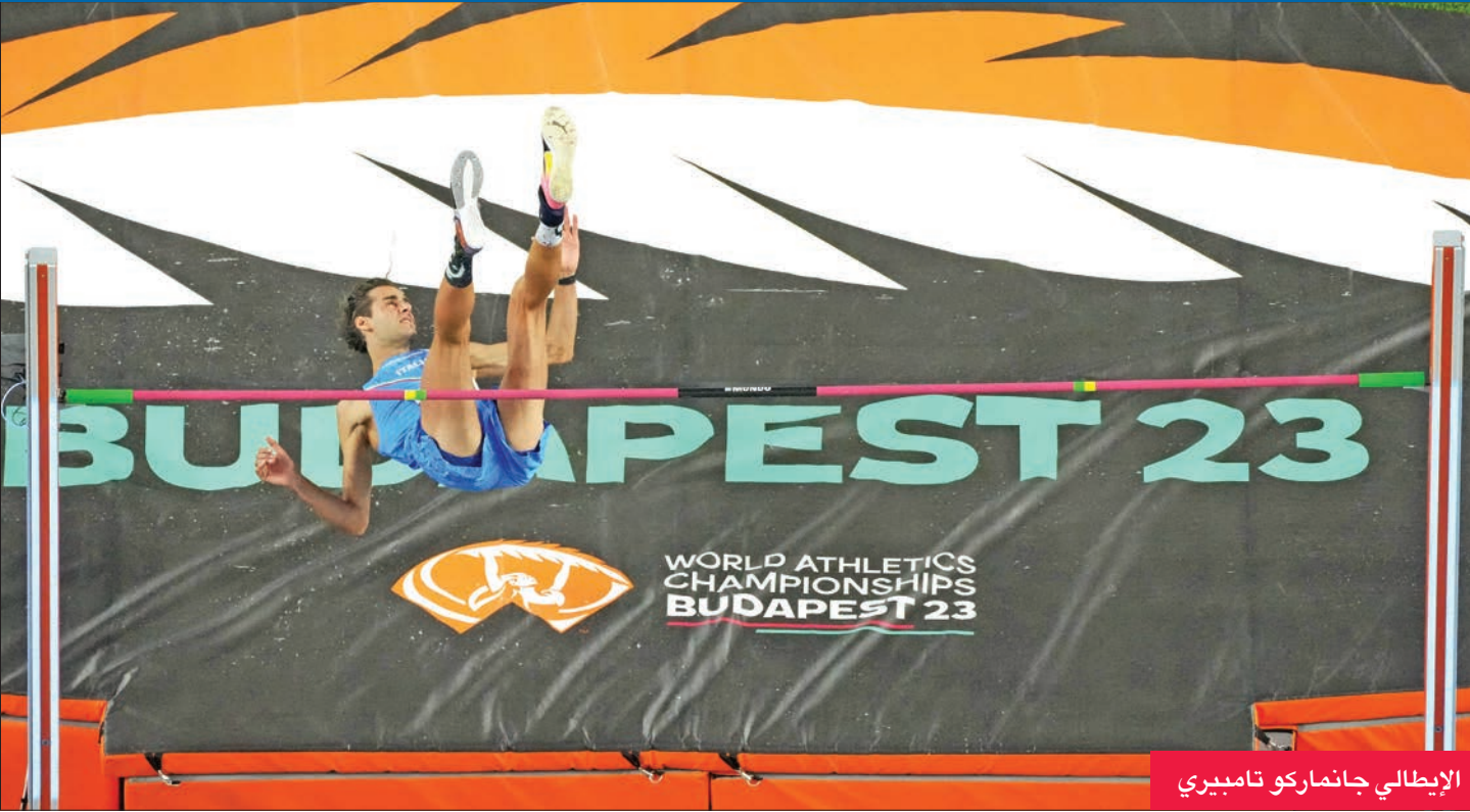
الإيطالي جانماركو تاميري