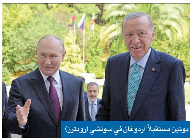
بوتين مستقبلاً أردوغان في سوتشي

في خضم الهجوم المضاد على القوات الروسية وحملته الموسعة على الفساد، عين الرئيس الأوكراني فولوديمير زيلينسكي القتاري المسلم رستم عميروف، البالغ من العمر 41 عاماً، وزيراً للدفاع خلفاً لأوليكسي ريزنيكوف، الذي تولى منصبه في نوفمبر 2021. وقال زيلينسكي، في خطابه اليومي أمس الأول: «أضفى ريزنيكوف أكثر من 550 يوماً في حال من الحرب الشاملة. أعتقد أن الوزارة تحتاج نهجاً جديداً وأشكلاً أخرى من التفاعل مع الجيش والمجتمع». ورشح الرئيس الأوكراني عميروف، وهو من تبار القرم ويترأس صندوق الدولة منذ العام الماضي، لخلافة ريزنيكوف، متوقعاً أن يدعمه البرلمان.