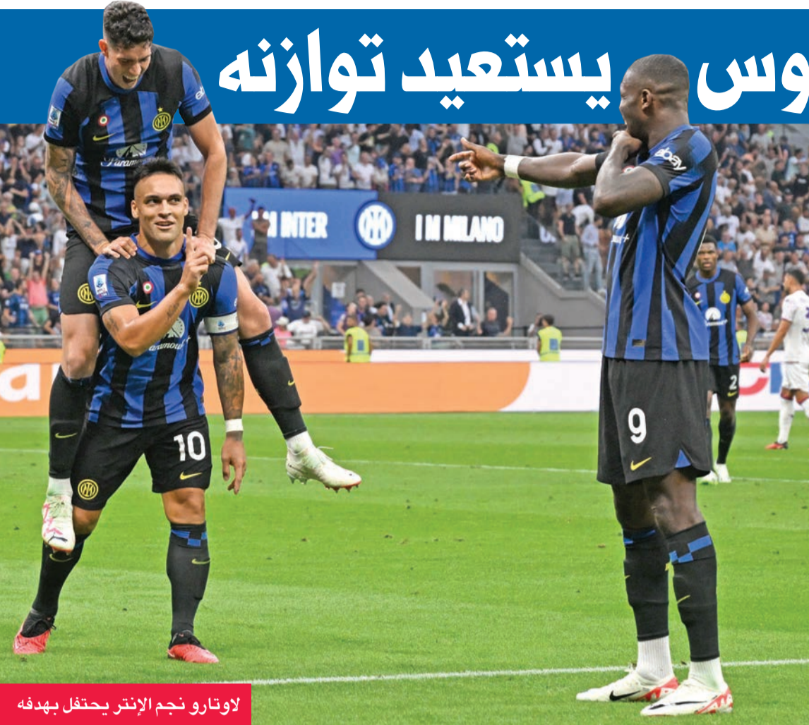
لاوتارو نجم الإنتر يحتفل بهدفه

وقال تورام بعد المباراة: «الفريق باكملة قَدَم مباراة جيدة. كانت أمسية رائعة. أنا سعيد جداً، لتسجيلي هدفاً، وقيامي بتمريرة حاسمة. كل ما كنت أريده هو مساعدة فريقتي على تحقيق الفوز». وتابع المدافع الفرنسي المنتقل قبل يومين إلى إنتر من بايرن ميونيخ الألماني مقابل صفقة بلغت 30 مليون يورو، المباراة من المدرجات.