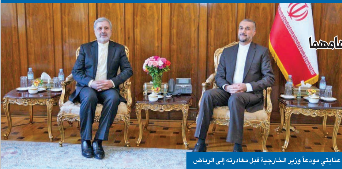
عنايتي مودعا وزير الخارجية قبل مغادرته إلى الرياض

وكشف مصدر في المجلس الأعلى للأمن القومي الإيراني لـ «الجريدة» أن مندوبين من إيران والولايات المتحدة أجروا لقاءات غير علنية خلال الأسابيع الأخيرة في دول عربية ودولة أوروبية، وتوصلا إلى تفاهات بشأن صيغة جديدة لتفعيل الاتفاق النووي «وياً» من دون التزامات مكتوبة.