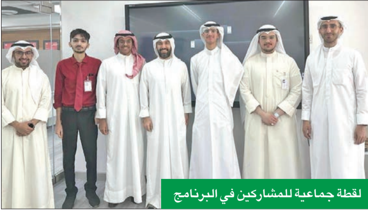
لقطة جماعية للمشاركين في البرنامج

وصولاً إلى المرحلة النهائية في مسابقة داتون الثانية