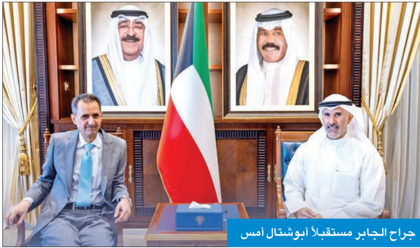
جراح الجابر مستقبلاً أبوشتال أمس

استقبل نائب وزير الخارجية السفير الشيخ جراح الجابر، في ديوان عام الوزارة أمس، سفير الأردن صقر أبوشتال بمناسبة انتهاء فترة عمله سفيراً لبلاده لدى دولة الكويت. وأشاد نائب الوزير خلال اللقاء بدور السفير وإسهاماته التي قدمها خلال فترة عمله في تعزيز العلاقات الكويتية - الأردنية، متمنياً له كل التوفيق والسداد.