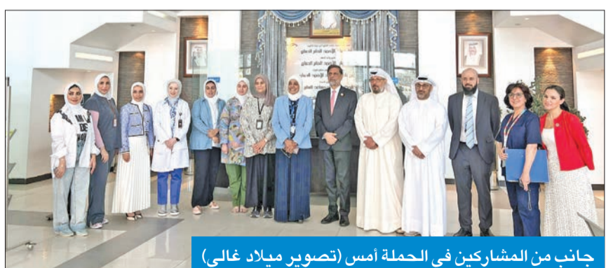
جانب من المشاركين في الحملة أمس

وأضافت الجيحي في تصريح للمصاحفين صباح أمس على هامش إطلاق حملة التخلص الآمن من الأدوية غير المستخدمة أو المنتهية الصلاحية في مركز عبدالله العبد الهادي بمنطقة اليرموك، أن هذه المبادرة العالمية التي تقودها منظمة الصحة العالمية بمساعدة مكتب المدن الصحية بوزارة الصحة، تهدف إلى معالجة الشواغل ذات الصلة بسلامة المرضى والشواغل البيئية بتيسير التخلص الآمن