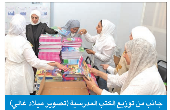
جانب من توزيع الكتب المدرسية

جاهدة إلى معالجة أي خلل قد يحدث قبل بدء دوام الطلبة في 17 الجاري.