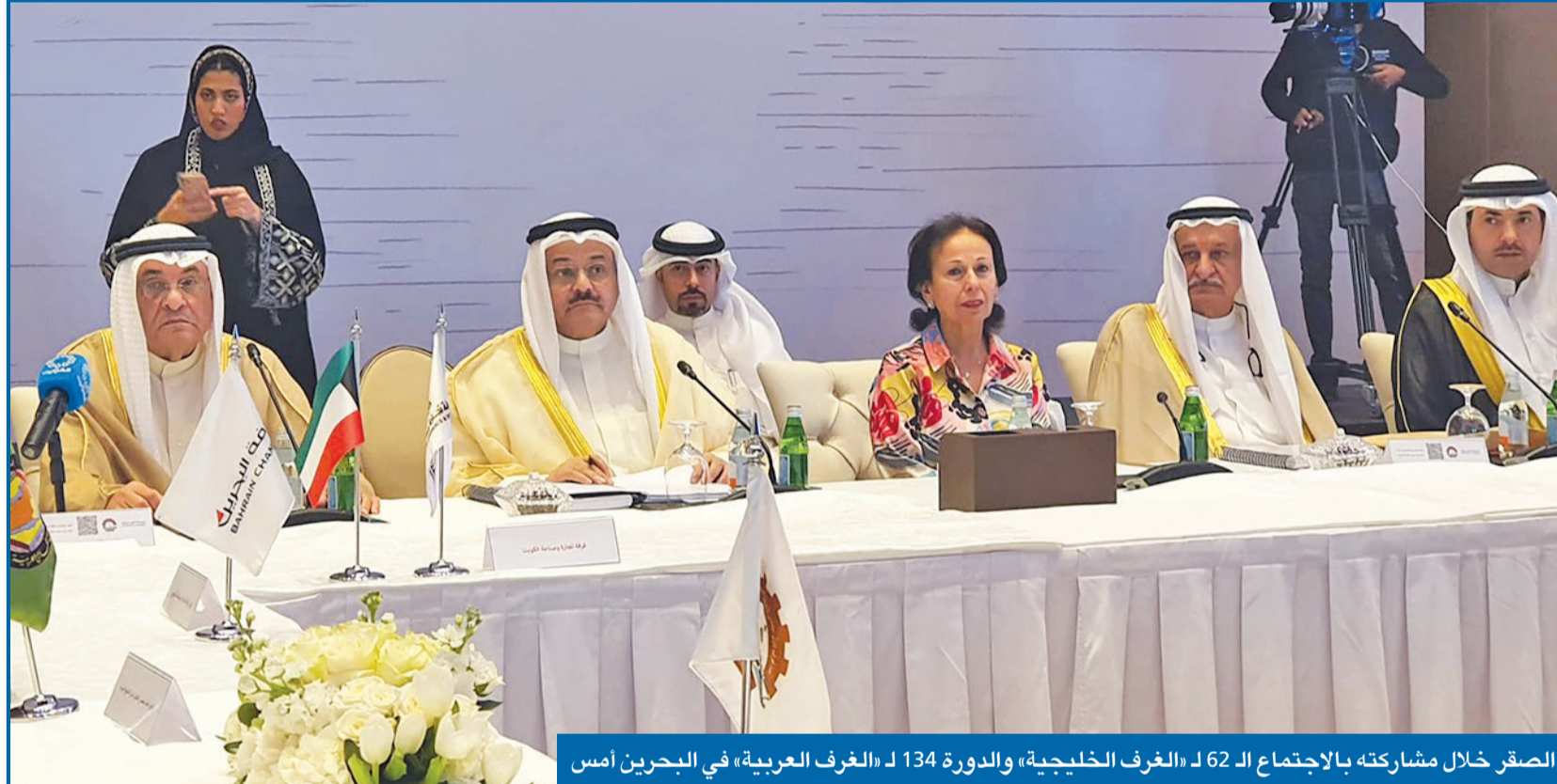
الصقر خلال مشاركته بالاجتماع الـ 62 لـ «الغرف الخليجية» والدورة 134 لـ «الغرف العربية» في البحرين أمس

«مصارف الكويت» يتبرع بـ 5 ملايين دولار للمملكة