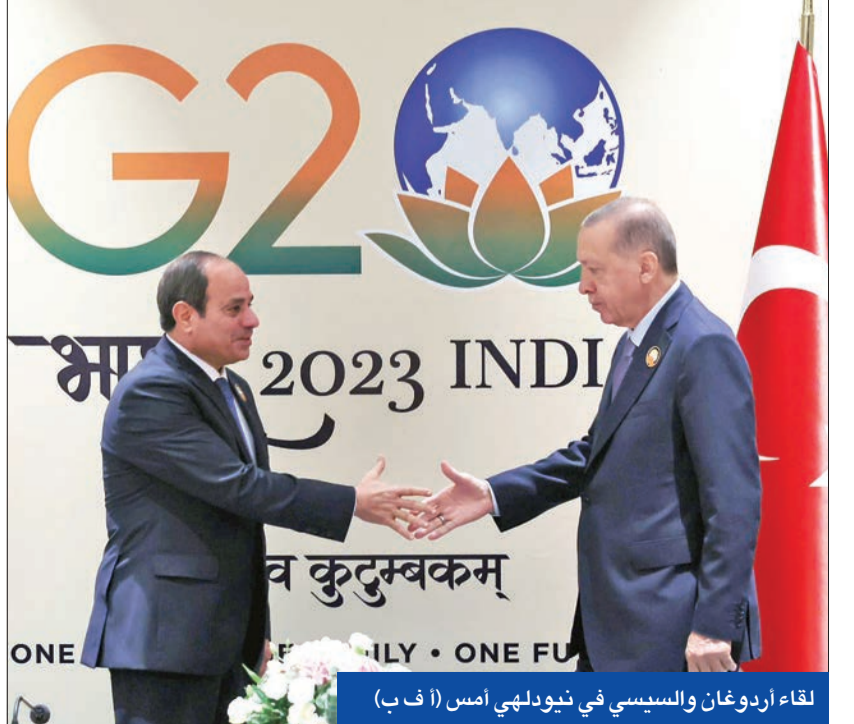
لقاء أردوغان والسيسي في نيودلهي أمس

النقى الرئيس المصري عبدالفتاح السيسي، أمس، نظيره التركي رجب طيب أردوغان على هامش قمة العشرين في الهند، وناقشا العلاقات الثنائية والتعاون في مجال الطاقة، فضلاً عن قضايا إقليمية وعالمية. وأبلغ أردوغان السياسي بأن تعيين السفيرين يمثل «حقبة جديدة»، معتبراً أن تركيا تولى أهمية إعادة إحياء التعاون مع مصر في مجالات الغاز الطبيعي المسال والطاقة النووية. وقال المتحدث الرئاسي المصري المستشار أحمد فهمي إن الرئيسين أكدا خلال اللقاء أهمية «استئناف مختلف آليات التعاون الثنائي» بين البلدين، كما جدد حرصهما على «تعزيز التعاون الإقليمي، بما يسهم في صون الأمن والاستقرار في منطقة شرق المتوسط». وفي كلمته بالجلسة الثالثة والخامسة لقمة مجموعة العشرين، حذر السيسي من أزمة ديون عالمية نتيجة ارتفاع أعباء خدمة الدين ليس فقط بالنسبة للدول منخفضة الدخل وإنما أيضاً في الدول متوسطة الدخل، وشدد على الحاجة الملحة لمعالجة هذه المشكلة التي باتت تتخذ «أبعاداً خطيرة».