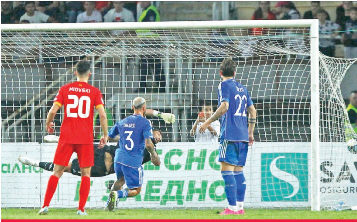
لاعب مقدونيا الشمالية أنيس باردري يسجل هدفه الأول في مرمى الإيطالي جيانلويجي دوناروما