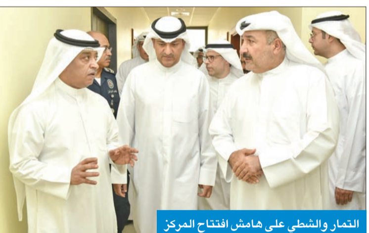
التمار والشطي على هامش افتتاح المركز

أعلنت وزارة الصحة افتتاح مركز إسعاف المدينة الجامعية بالشداية.