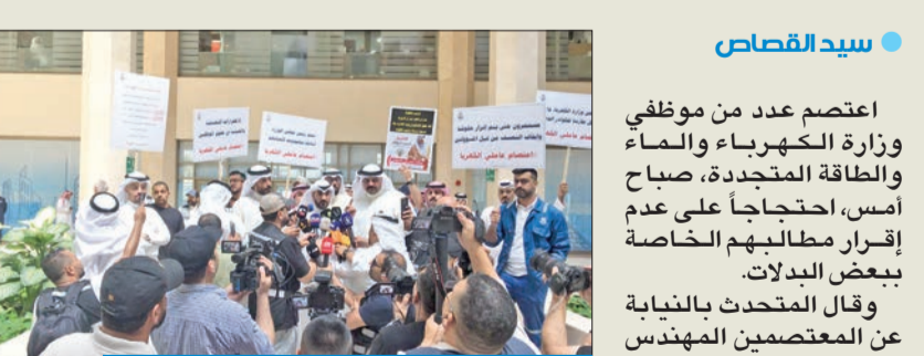
جانب من اعتصام موظفي «الكهرباء» أمس

وأشار إلى أن أبرز المطالب التي يطالب بها تتمثل في «تصنيف الموظفين ضمن الأعمال الشاقة، وإقرار بدل الخطر الذي يتعرض له الموظفون، وإقرار بدل التلوث، وإرجاع مكافأة الطابع الهندسي للموظفين «مكافأة العيار»، وصرف البدائل المستحقة للإدارية».