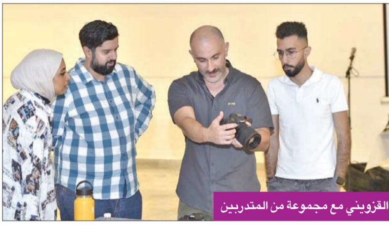
القزويني مع مجموعة من المتدربين

رکز خلال تقديمه ورشة «التصوير الفوتوغرافي» على أساسيات البورتريه