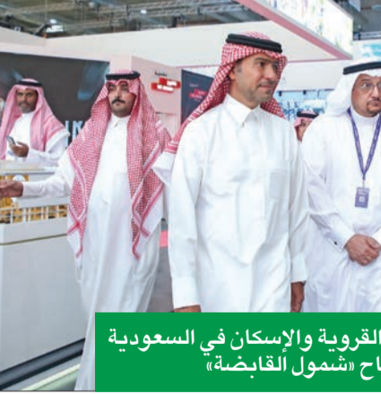
زيارة وزير الشؤون البلدية والقروية والإسكان في السعودية ماجد بن عبدالله الحقبيل لجناب «شمول القابضة»

وبالتحديد في مدينة الخبر في الركن الشمالي الغربي من تقاطع طريق الملك سعود مع مساحة واسعة قابلة للتأجير تبلغ 168.532 متراً مربعاً. كما سيضم الأفتيونز- الخبر 8 مناطق تسوق، ومساحات خاصة للترفيه و10 صالات سينما، بالإضافة إلى برجين، حيث سيضم البرج الأول فندق فور سيريز، والثاني فندق كانوبي إحدى علامات هيلتون، بالإضافة إلى مكاتب وقاعات مؤتمرات، ومواقف سيارات تتسع لنحو أكثر من 6 آلاف مركبة. وسيتميز الأفتيونز- الخبر بتصاميم حديثة وعناصر تعكس طبيعة المنطقة الشرقية بأفضل المعايير للحفاظ على البيئة والطاقة، وتشمل عناصر التصميم مستلهم من طراز معماري يجسد الأصالة والحداثة، بتصميم مستلهم ويحاكي الماضي بقوالب تطويرية متجددة ليعكس وجوده في قلب نجد بالرياض، كما سيتميز بتصاميم حديثة داخل المجمع وعناصر مستدامة وخضراء فاحرة، بينما سيضم البرج الرابع والخامس فندق كانوبي وكورنارد من علامات هيلتون، بالإضافة إلى عبادات طبية ومواقف سيارات تسع نحو أكثر من 15 ألف مركبة، مما سيجهله الوجهة المثلى للتسوق والعمل على تشييدها.