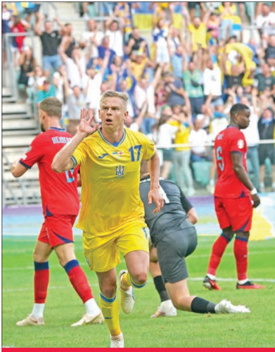
زينتشكو نجم أوكرانيا يحتفل بهدفه في مرمى إنكلترا

افتتح المنتخب الإيطالي عهد مديره الجديد لوتشانو سبالييتي بتسريح عقدة مقدونيا الشمالية، بتعادله معها (1-1)، السبت، في الجولة الخامسة من التصفيات المؤهلة إلى كأس أوروبا 2024، على غرار إنكلترا، التي تعثرت أمام أوكرانيا بالنتيجة نفسها. وخاضت إيطاليا أول مباراة رسمية لها في عهد مدربها الجديد سبالييتي، الذي حل في «الأتزوري» خلفاً لروبرتو مانشيني، المنتقل لتدريب المنتخب السعودي.