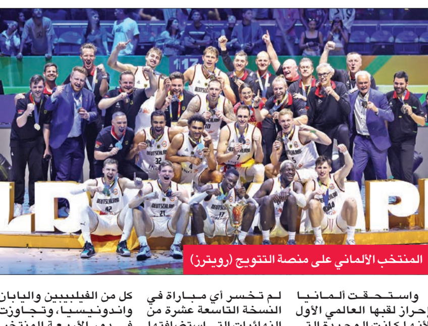
المنتخب الألماني على منصة التتويج

الأميركي المرشح الدائم لإحراز اللقب. وتدين بهذا الإنجاز إلى صانع ألعاب تورونتو رابرتوز دينيس شرودر الذي سجل 28 نقطة، بينما سلة في آخر 21 ثانية تم رميتين حرتين قبل 12 ثانية على النهاية، فيما ساهم فرانتس فاغنر بـ 19 نقطة مع 7 متابعات ويوهانيس فويغتمان بـ 12 مع 8 متابعات. أما من جهة صربيا، فكان اليكسا أفراموفيتش الأفضل بتسجيله 21 نقطة، وأضاف بوغدان بوغدانوفيتش 17، فيما اكتفى لاعب الارتكان نيكولا ميلوتينوف بتقطعتين فقط ما أثر سلباً على فريقه.