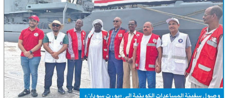
وصول سفينة المساعدات الكويتية إلى «بورت سودان»