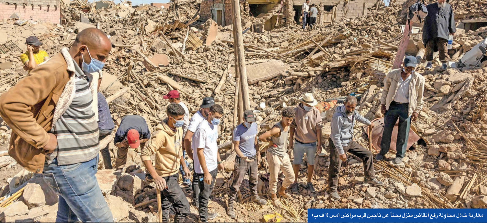
مغاربة خلال محاولة رفع أنقاض منزل بحثاً عن ناجين قرب مراكش أمس

فرق إنقاذ أوروبية تصل للرباط... وفرنسا والجزائر تنتظران الموافقة على المساعدة