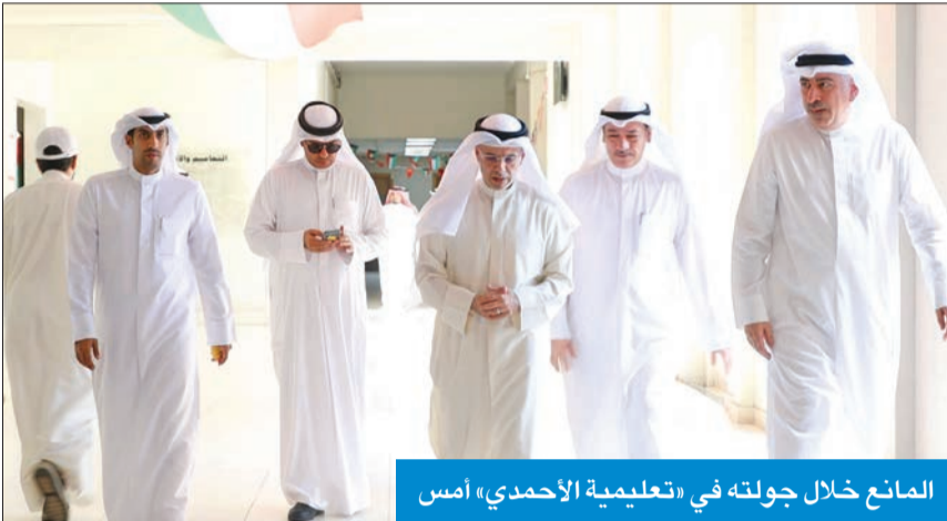
المانع خلال جولته في «تعليمية الأحمدى» أمس

● هنا المعلمين بدء العام الدراسي وتفقد المناطق التعليمية لبحث استعداداتها ● شدد على توفير البيئة الملائمة للهيئات التعليمية والطلبة والعاملين بالميدان التربوي